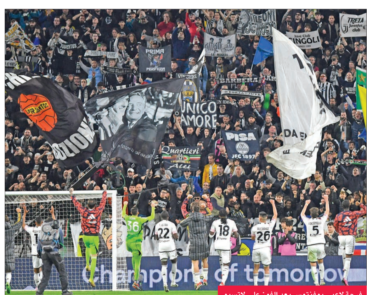
فرحة لاعبي يوفنتوس بعد الفوز على لاتسيو

ردّ يوفنتوس اعتباره من ضيفه لاتسيو ومدربه الجديد الكرواتي إيجور تودور، بفوزه على نادي العاصمة 0-2 الثلاثاء في ذهاب نصف نهائي مسابقة كأس إيطاليا لكرة القدم، ليقطع بذلك شوطاً مهماً نحو النهائي الثاني والعشرين في تاريخه. وبعدهما كان يقارع إنتر على صدارة الدوري، بات يوفنتوس مهدياً حتى بمرزكه الثالث نتيجة خسارته السبت أمام لاتسيو 1-0 في الوقت القاتل في العاصمة، ما جعله مصمماً على رد اعتباره. وكان تركيز يوفنتوس منصّباً بالكامل على معركة الدوري وحلم استعادة اللقب الذي احتكره طيلة تسعة مواسم متتالية قبل أن يحتفي بمشاهدة كل من إنتر وميلان ونابولي يحتفل بالترتويج في المواسم الثلاثة الماضية، لاسيما أنه لم يتأهل إلى أي مسابقة قارية هذا الموسم نتيجة معاقبته بحسب نقاط من رصيده بسبب قضية التلاعب ببيانات لاعبيه. لكن مع دخول الموسم الأمتار الأخيرة، وجد فريق المدرب ماسيميليانو اليغري نفسه يقاتل من أجل التمسك بالمركز الثالث بعدما وصل الفارق بينه وبين ميلان الثاني السبت إلى ست نقاط. وكانت مباراة السبت في العاصمة الأولى للاتسيو بقيادة تودور الذي نجح في إسقاط الفريق الذي دافع عن الوانه كلاعب من 1998 حتى 2007 ووصل معه إلى نهائي دوري الأبطال عام 2003 وتوّج معه بلقب الدوري مرتين وهبط معه إلى الدرجة الثانية أيضاً حين عوقب «بياتكونيري» عام 2006 بسبب فضيحة التلاعب بالنتائج. وعاد الكرواتي البالغ حالياً 45 عاماً إلى يوفنتوس في صيف 2020 وتولى مهمة مساعد المدرب أندريا بيرلو، قبل أن يقال والأخير من المنصب في نهاية ذلك الموسم. ويانتظر ما سيكون عليه الوضع حتى مباراة