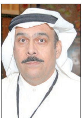
نصر سالم آل هيد

قضت محكمة الاستئناف برئاسة المستشار نصر سالم آل هيد بإلقاء حكم غيابي بحبس 30 سنة متهم بالاستيلاء على أموال وزارة الداخلية وغسل أموال وتزوير محركات رسمية في القضية المعروفة بضيافة الداخلية وقضت مجددا بحبس 15 سنة فيما قضت بتأييد حبس 3 متهمين آخرين من بينهم رجل أعمال كويتي 10 سنوات لكل منهم.