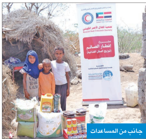
جانب من المساعدات

العلاج الطبية والصحية لهم. وبين السائر أن العيادة الطبية بإمكانها إجراء الفحوصات للمرضى وتطعيم الأطفال وإجراء وتأكيد التشخيصات المختبرية للأمراض وعلاج الحالات البسيطة كالتهابات الجلدية والجروح الطفيفة وحالات الجفاف. وأشار إلى أن العيادة المتنقلة مزودة بتجهيزات طبية عالية الجودة لتقديم الخدمات الصحية متعددة الاختصاصات لمناطق التجمعات في الضفة الغربية في فلسطين.