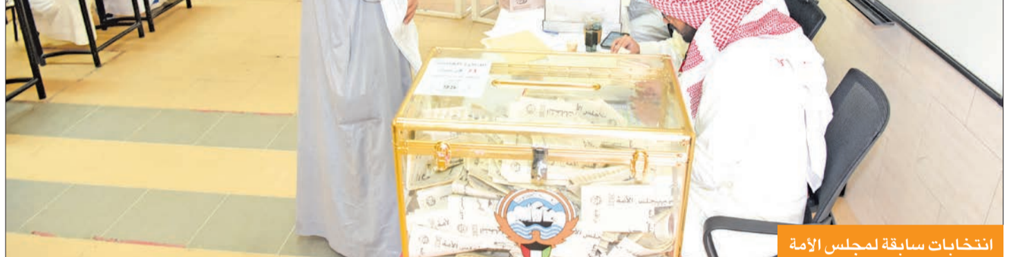
انتخابات سابقة لمجلس الأمة

834733 ناخباً يتوجهون إلى صناديق الاقتراع اليوم لاختيار «أمة 24»