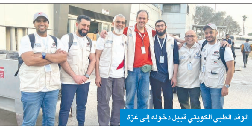
الوفد الطبي الكويتي قبيل دخوله إلى غزة

الوفد الطبي إلى غزة يشارك في تعزيز المنظومة الصحية بالقطاع