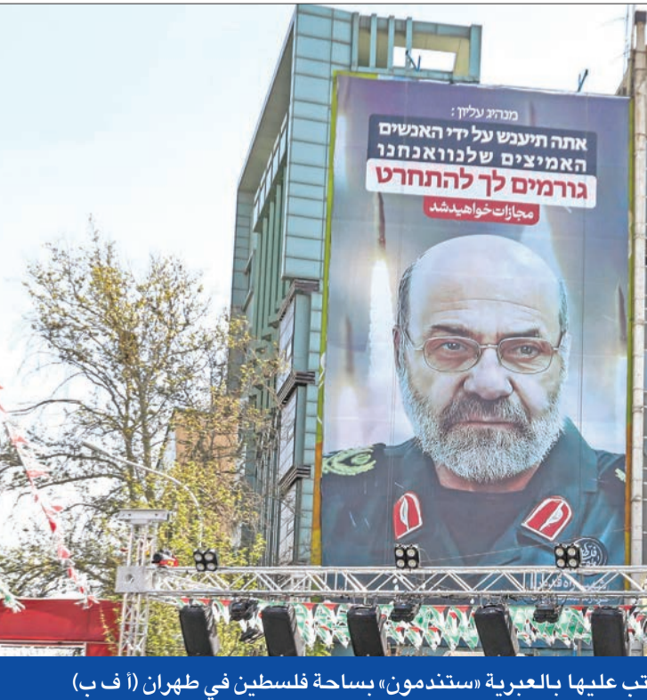
صورة لزاهدي كتب عليها بالعبرية «ستندومن» بساحة فلسطين في طهران

إنه يعتقد أيضاً أن إيران لا تريد حرباً شاملة مع إسرائيل لكنها قد تستهدف مصالح إسرائيلية. واستطرد أبرامز: «أعتقد أن إيران لا تريد حرباً كبيرة بين إسرائيل وحزب الله حالياً، وبالتالي أي رد لن يأتي في صورة تحرك كبير من جهة حزب الله».