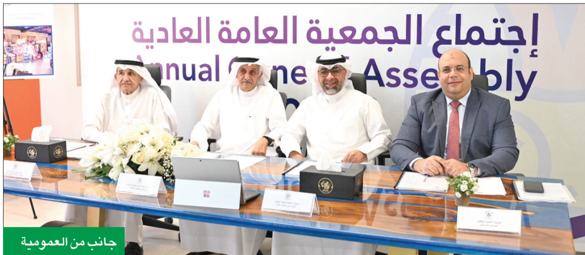
جانب من العمومية

مجال صناعة الترفيه العائلي الأمن في الصالات المغلقة، حيث استطاعت الشركة أن تحقق نتائج طيبة، والتي ظهرت جلياً خلال نتائج أعمال السنة المالية المنتهية في 31 ديسمبر 2023، التي عقدت أمس بنسبة حضور بلغت 55.574 في المئة، ووافقت على جميع البنود الواردة على جدول أعمالها ومنها توزيع 8 في المئة نقداً، أي 8 فلوس لكل سهم عن عام 2023. وأكد أن الإنجازات التي تحققت خلال عام 2023 تعكس مدى إصرار الشركة في المحافظة على ريادتها في