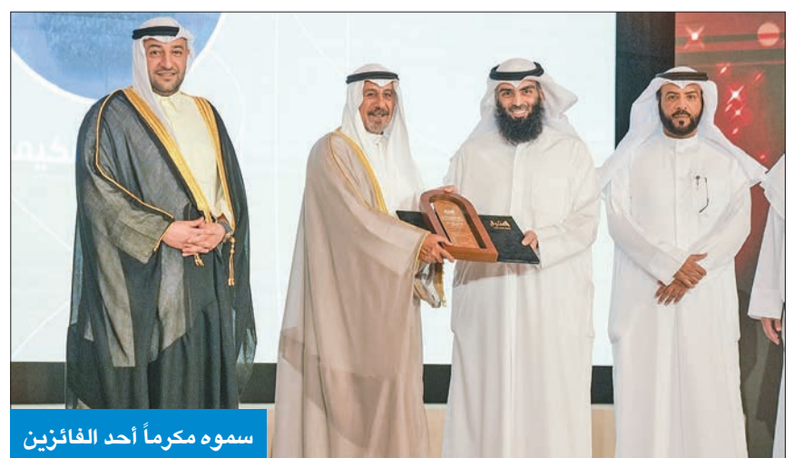
سموه مكرماً أحد الفائزين