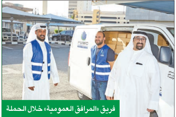
فريق «المرافق العمومية» خلال الحملة

في المساهمة بفاعلية في الأعمال الخيرية والاجتماعية، من خلال برامج ومبادرات متنوعة تخدم مختلف شرائح المجتمع.