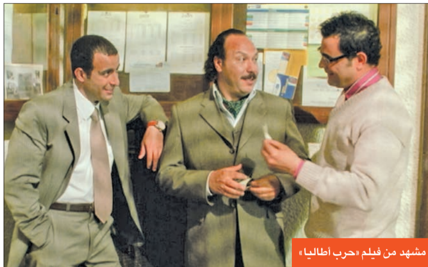
مشهد من فيلم «حرب إيطاليا»