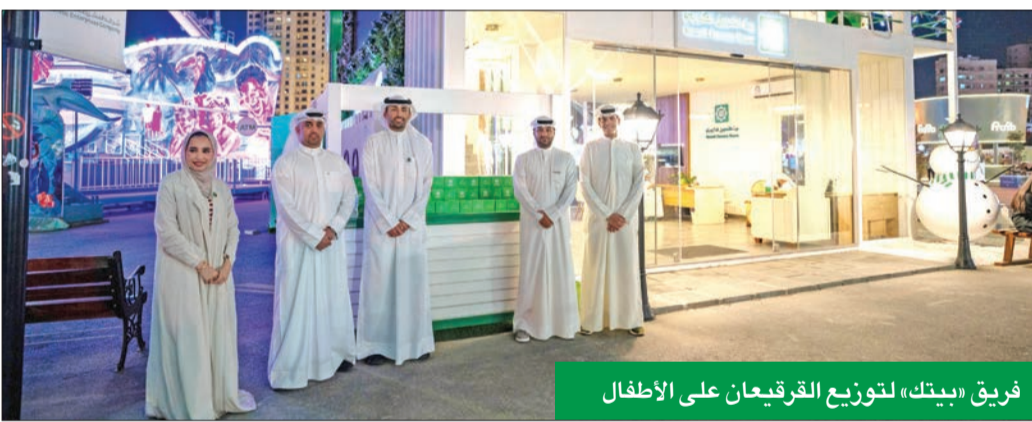
فريق «بيتك» لتوزيع القريعيان على الأطفال

وتنظم «بيتك» أيضاً برنامج «بيتك» الرمضاني على مدار الساعة عبر القنوات الإلكترونية والرقمية، وهي خدمة الفيديو المباشر عبر تطبيق البنك CBK mobile، والموقع الإلكتروني www.cbk.com، إضافة إلى مركز خدمة العملاء والتواصل عبر خدمة الواتساب على رقم 1-888225، الذي يستقبل الاتصالات للعملاء على مدار الساعة، ويقوم بالرد على استفساراتهم وتقديم الخدمات لهم في أسرع وقت من خلال فريق عمل مؤهل، وسوف يباشر أنشطة أعماله المعتادة الأحد 7 أبريل 2024.