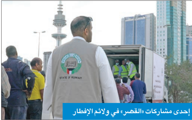
إحدى مشاركات «القصر» في ولائم الإفطار

تخصيص 6 مواقع لهيئة من أصل 27 موقعاً تابعاً لبيت الزكاة