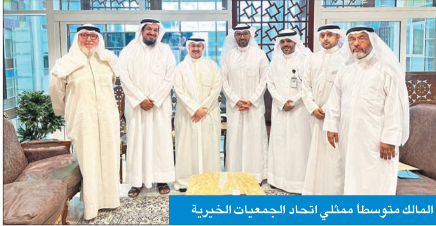
المالك متوسط ممثلي اتحاد الجمعيات الخيرية

تأكيداً لخبر «الجريدة» المنشور في عددها الصادر، أمس، بعنوان «الغارمين» بدون «فزعمة» الجمعيات الخيرية، والتي أشارت خلاله إلى اجتماع وزير الشؤون الاجتماعية وشؤون الأسرة والطفولة الشيخ فراس المالك، بممثلي الجمعيات الخيرية المشهورة في البلاد، لحثهم على المشاركة الفاعلة بالحملة الوطنية لجمع التبرعات لمصلحة سداد ديون الغارمين «فزعتم فرحة لهم بالتعاون مع وزارتي العدل والأوقاف والشؤون الإسلامية، واتحادى الجمعيات التعاونية الاستهلاكية والجمعيات الخيرية والمبرات، التقى الوزير المالك، أمس، ممثلي