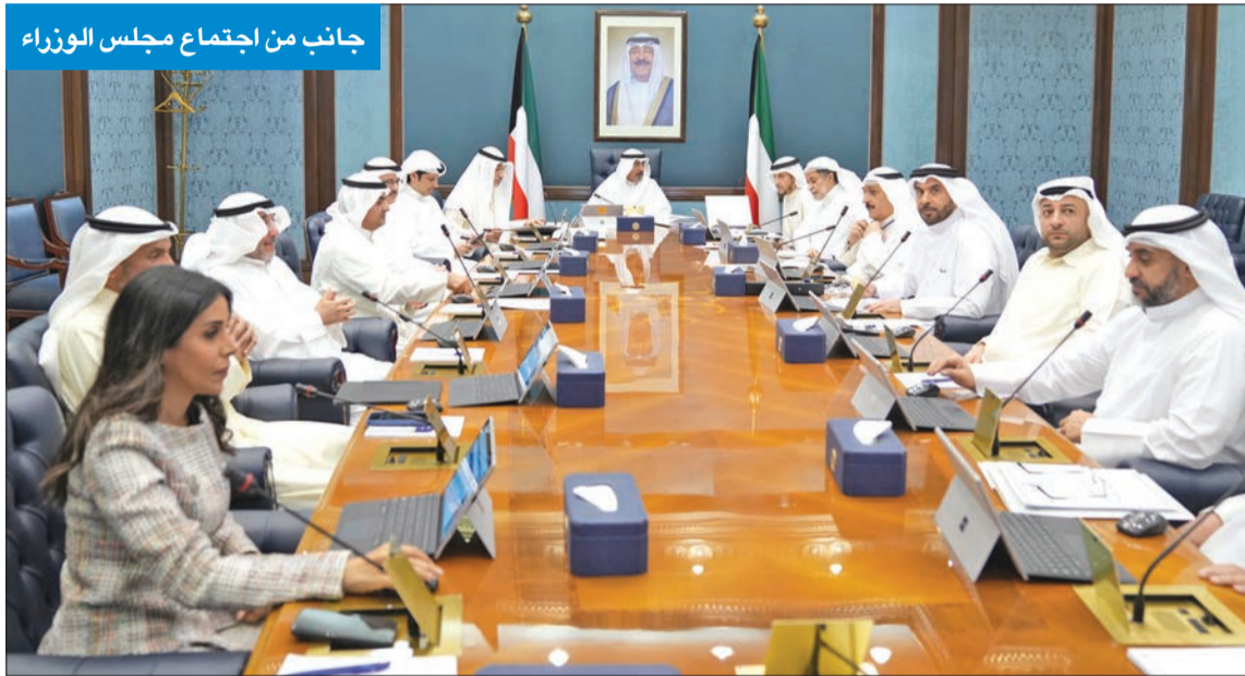
جانب من اجتماع مجلس الوزراء

استعرض جهود «الداخلية» و«التربية» لإجراء الانتخابات ودعا للمشاركة الإيجابية فيها