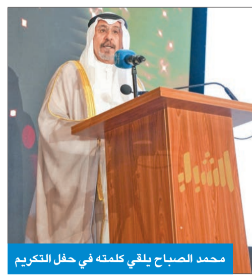
محمد الصباح يلقي كلمته في حفل التكريم

أشاد رئيس مجلس الوزراء سمو الشيخ د. محمد الصباح، بإيمان الشباب الكويتيين بأهمية المشاركة الحقيقية في صياغة وبناء «كويت المستقبل» من خلال الاستثمار المكثف في رأس المال البشري والإبداعي.