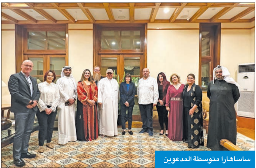
ساساهارا متوسطة المدعوين

السفيرة الأميركية: الكويتيون يظهرون لي الدفاء وكرم الضيافة