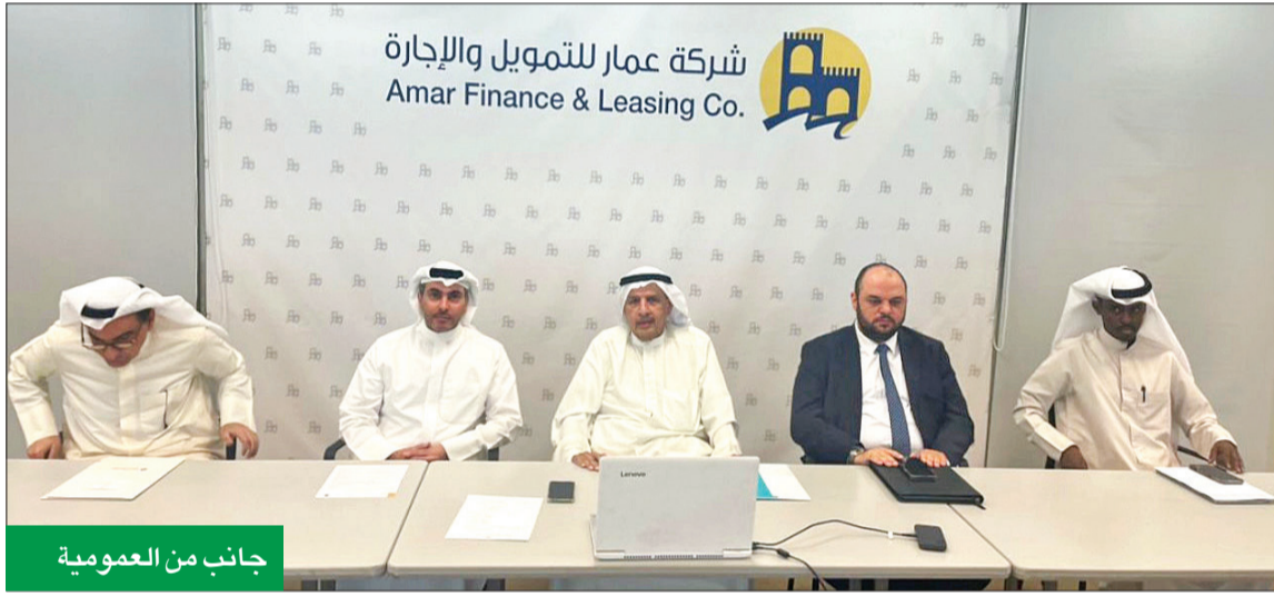
جانب من العمومية

وفيما يتعلق بالمحفظتين الاستثمارية والتمويلية، أوضح بوقماز أن «عمار» تمتلك محفظة استثمار لـ 1.213.000 مليون د.ك، وتسعى الإدارة إلى زيادة حجم المحفظة