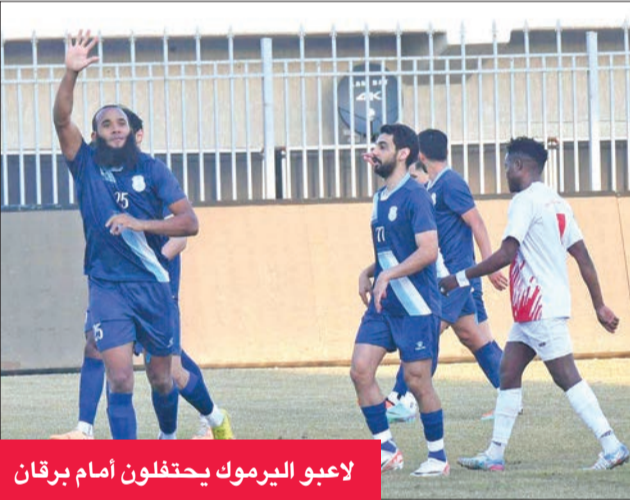
لاعبو اليرموك يحتفلون أمام برقان

بعد تحقيق فوز غال على الساحل بهدفين دون رد، وأحرز هدي التضمّن البرازيلي لويس، علماً أن الأول أحرزه من ركلة جزاء، بينما أهدر الساحل ركلة جزاء. بهذه النتيجة، رفع التضمّن رصيده إلى 22 نقطة محتلاً المركز الثاني، بينما تجدد صيد الساحل عند 18 نقطة في المركز الثالث، وبات مصيره في المنافسة على التأهل مرتبطاً بنتائج الآخرين، مع الوضع في الاعتبار صعوبة موقفه.