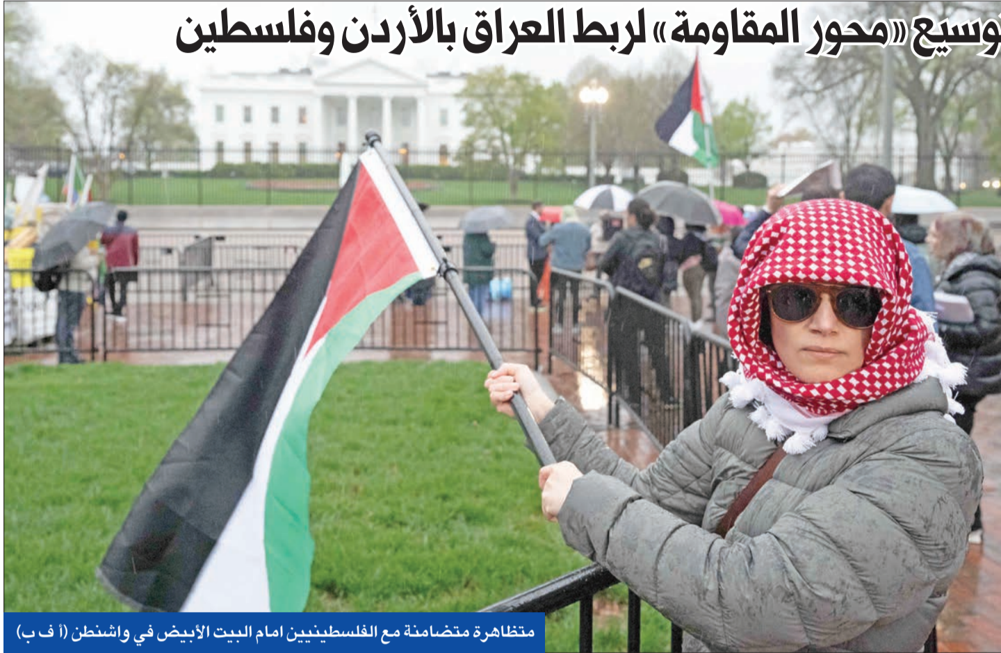
متظاهرة متضامنة مع الفلسطينيين امام البيت الأبيض في واشنطن (أ ف ب)

جداً لمحور المقاومة»، متهماً الحكم في عمان بأنه يعمل «لمصلحة الكيان الغاصب». ويتابع فضل الله أن «تفكير حزب الله العراقي يقوم على العمل على توسيع محور المقاومة، ليكون متصلاً من العراق باتجاه الأردن، وصولاً إلى فلسطين. بالنسبة إلينا، فإن وصول الأسلحة إلى الشعب الفلسطيني مهم لكي ينهض المحتجزين في غزة، واستقالة نتنياهو الذي اتهموه بال«خيانة» الثقة الشعبية، وحاولوا اقتحام الحواجز الأمنية إلى منزله.