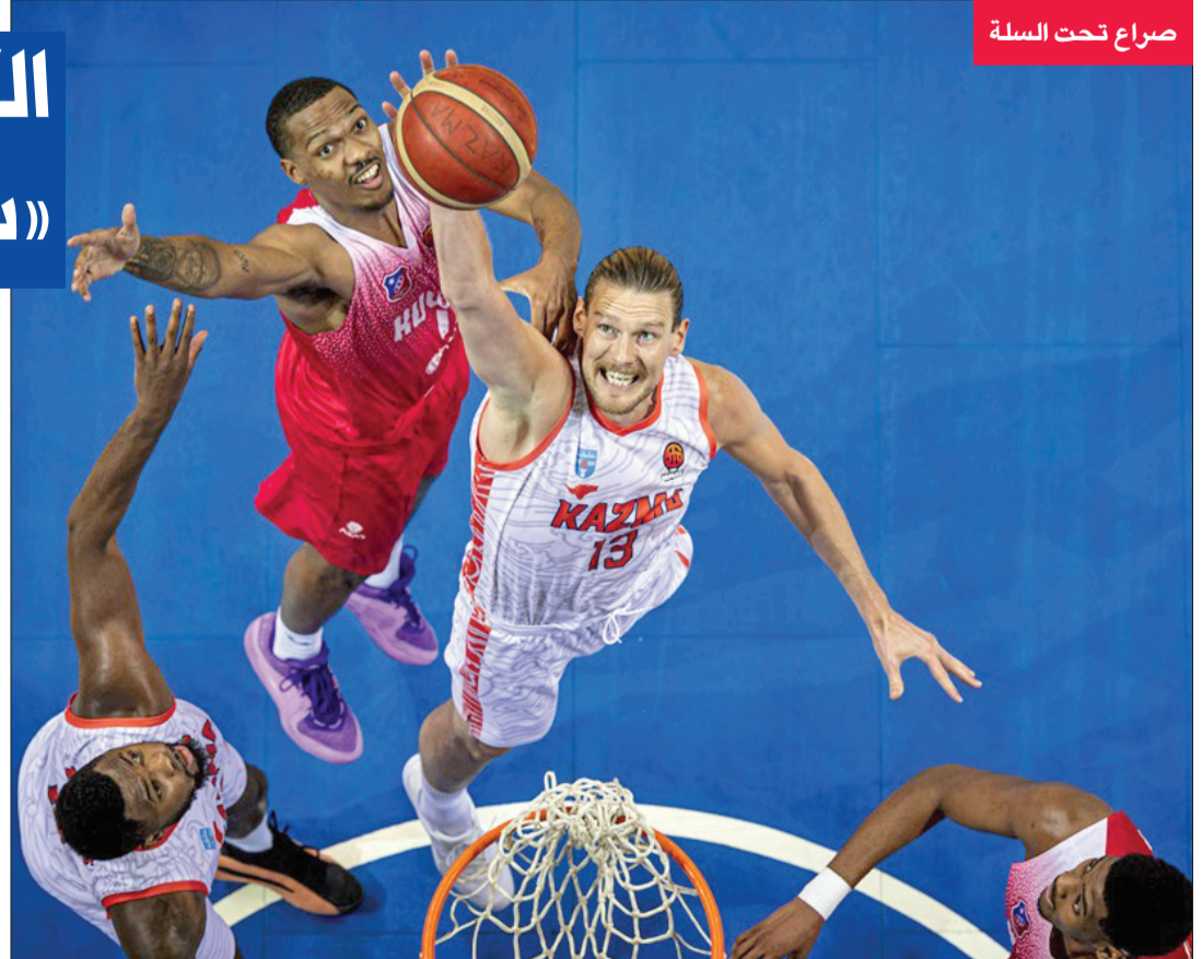
صراع تحت السلة

بلغ الفريق الأول لكرة السلة بنادي الكويت نهائي دوري غرب آسيا، لمنطقة الخليج، بعد فوزه الثاني على كاظمة بنتيجة 122-79 في اللقاء الدور نصف النهائي لمنافسات الذي أقيم أمس الأول على صالة الاتحاد بمجمع الشيخ سعد العبدالله الرياضي. وسيلتقي الكويت في النهائي مع المنامة البحريني الذي تجاوز مواطنه المحرق بانتصارين دون رد. وأقيم الدور نصف النهائي بنظام «بلاي أوف» من 3 مواجهات تاهل منها الفائز في مباراتين. وضمن الأبيض كاطمه إلى النهائي الوصول إلى النهائيات الآسيوية التي ستضم فرق منطقة الشام وإيران ووسط آسيا باعتبار أن طرفي النهائي يتأهلان مباشرة إلى الدور التالي، فيما سيلتقي كاظمة مع المحرق في مواجهة واحدة يتأهل الفائز منها إلى النهائيات القارية. وبدا الكويت المباراة بقوة وفرض سيطرته