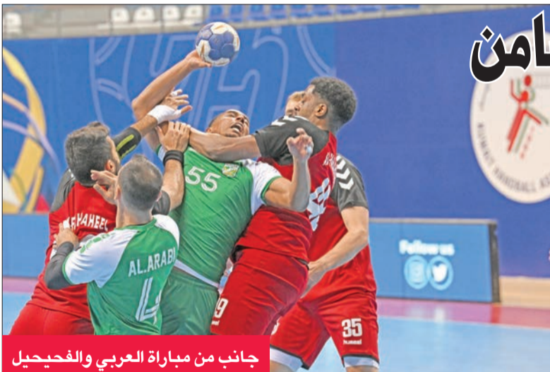
جانب من مباراة العربي والفحيحيل