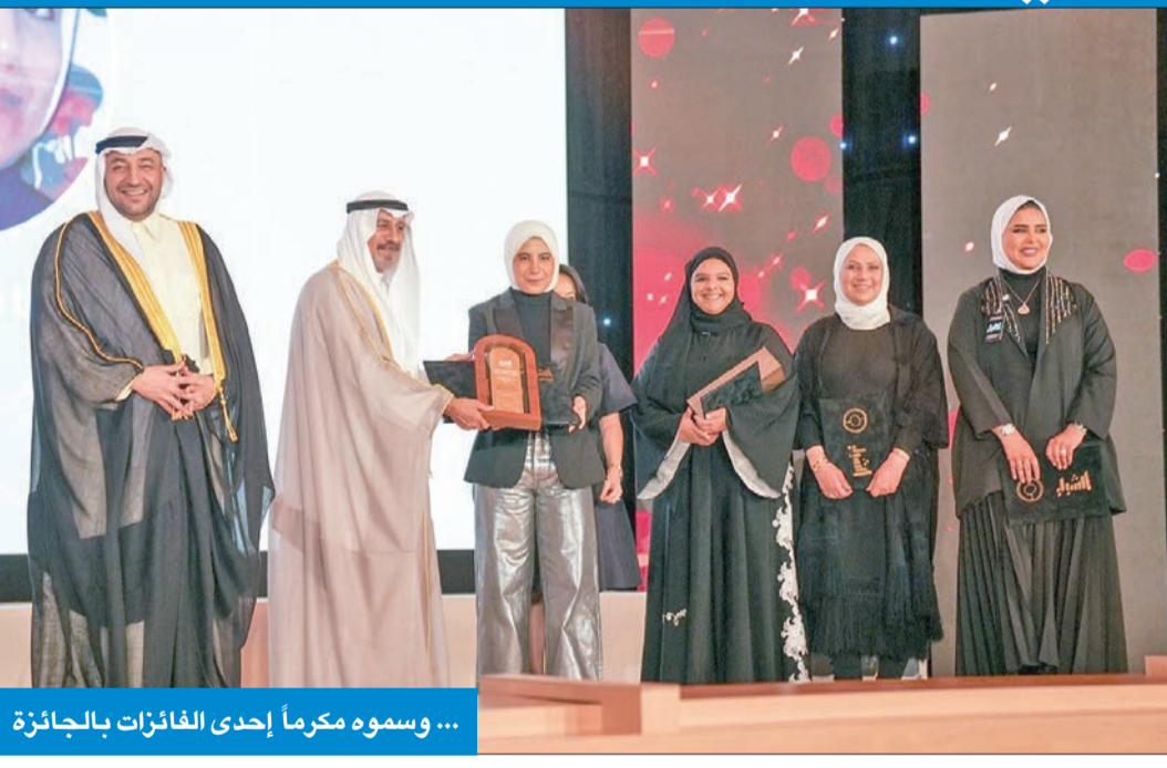
... وسموه مكرماً إحدى الفائزات بالجائزة

سموه كرم الفائزين بجائزة الكويت للتميز والإبداع الشبابي ال6