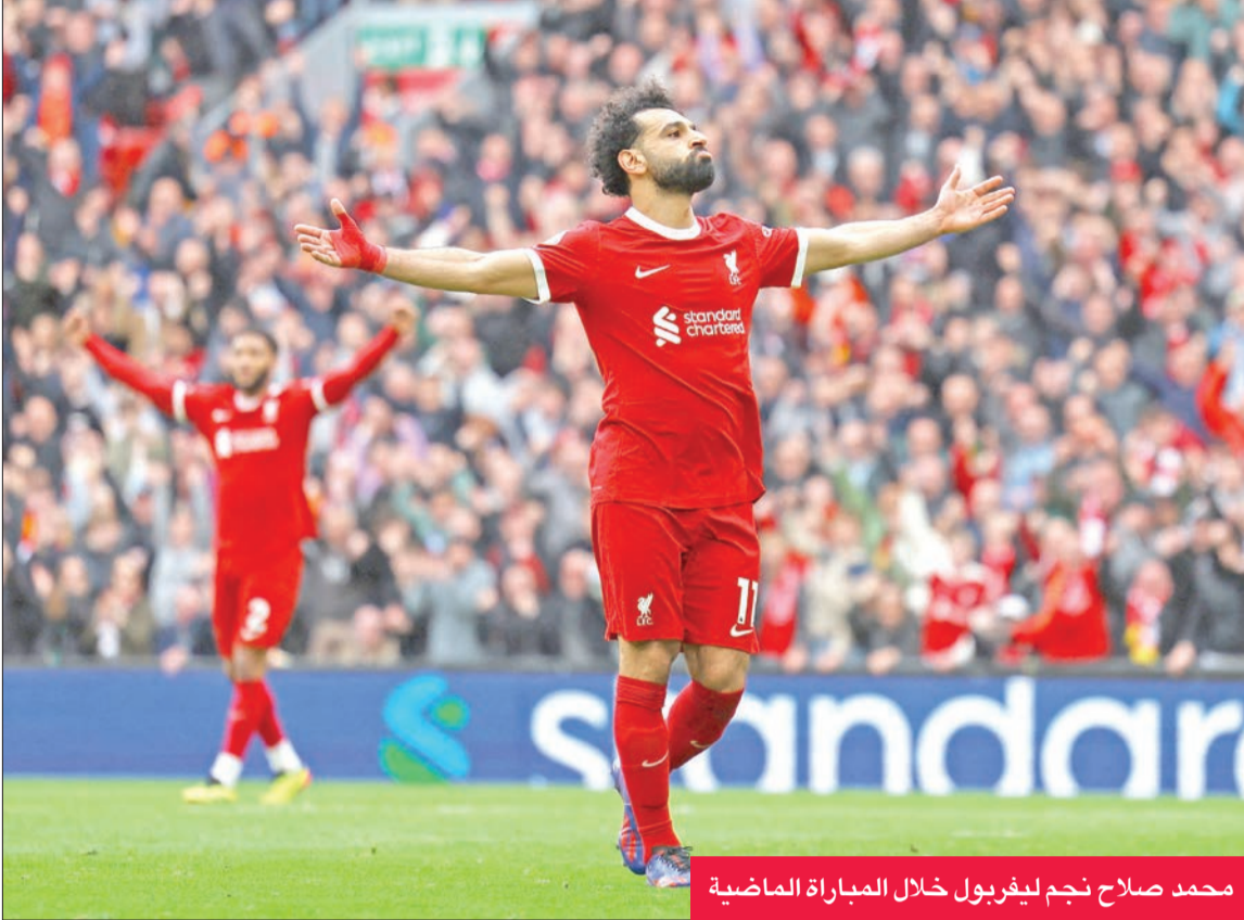
محمد صلاح نجم ليفربول خلال المباراة الماضية

بعدما استفاد على أكمل وجه من انتهاء المواجهة المنتظرة بين مانشستر سيتي (حامل اللقب) وأرسنال بالتعادل السلبي، يسعى ليفربول إلى التمسك بالصدارة حين يستضيف شيفيلد يونايتد الأخير اليوم، في المرحلة الحادية والثلاثين من الدوري الإنجليزي لكرة القدم. وخرج ليفربول من عطلة نهاية الأسبوع في الصدارة، بعد فوزه على برايتون 1-2 الأحد، متقدماً بفارق نقطتين عن أرسنال وثلاث عن سيتي، لكن هذه الأفضلية ليست حاسمة بالتأكيد حتى وإن كان «البحر» مرشحاً لإضافة 3 نقاط اليوم ضد فريق يسير نحو الهبوط، بما أنه متخلف بفارق 7 نقاط عن منطقة الأمان، لأنه بانتظار فرق الطليعة الثلاثة اختبارات شاقة من الآن حتى نهاية الموسم. ويصطدم ليفربول، الذي لم يخسر في مبارياته البينية الـ27 الأخيرة في الدوري، بغريمه مانشستر يونايتد على «أولد ترافورد»، وجاره إيفرتون على أرض الأخير وتوتنهام الخامس وأستون فيلا الرابع في ملعبه. ومن المؤكد أن هذا الموسم يحمل نكهة خاصة لليفربول، إذ يودع مديره الألماني يورغن كلوب الذي منحه لقبه الأول في الدوري منذ