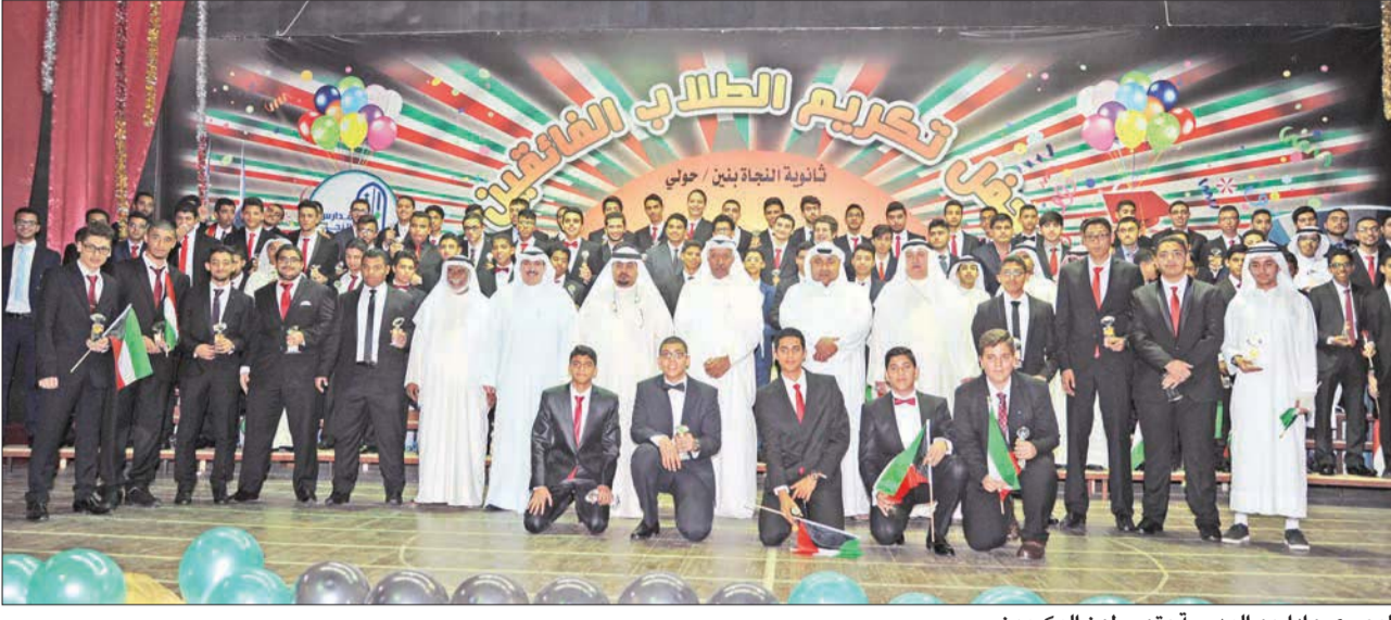
البصري وإداريو المدرسة يتوسطون المكرمين