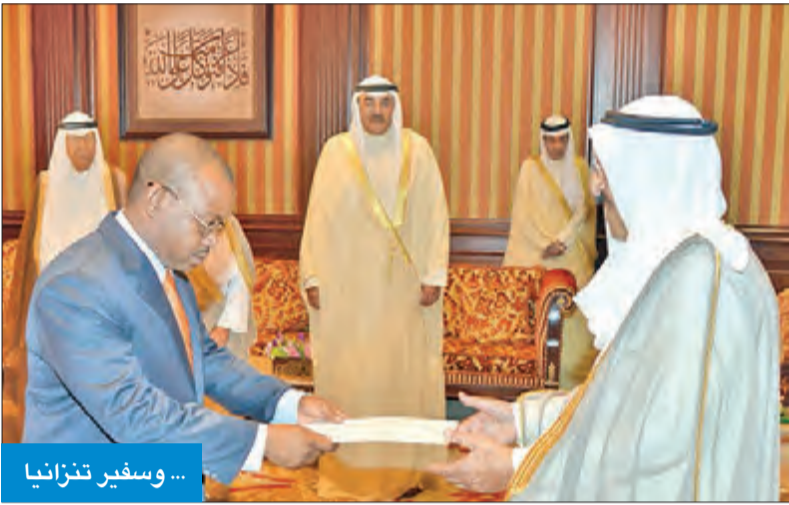
... وسفير تنزانيا

5 سفراء قدموا أوراق اعتمادهم لسموه في احتفال بقصر بيان