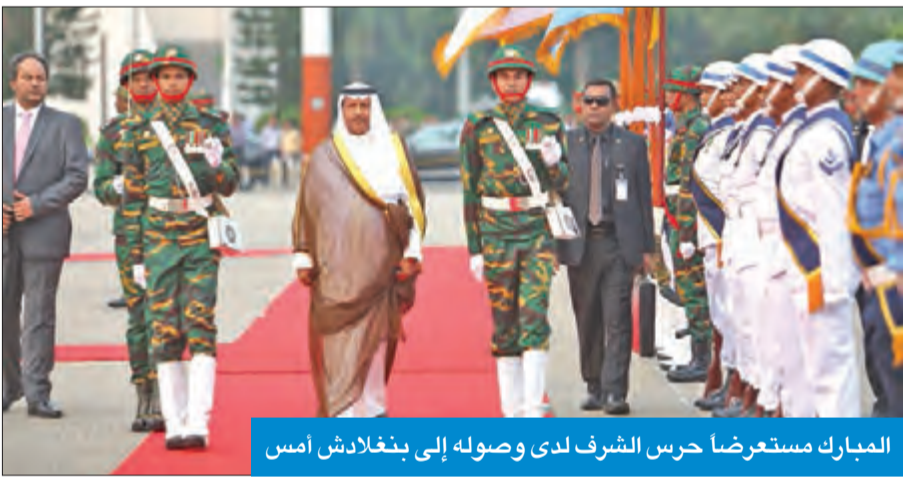
المبارك مستعرضاً حرس الشرف لدى وصوله إلى بنغلادش أمس

العربية ووزارات الخارجية والمالية والتربية والتعليم العالي، ومؤسسة البترول الكويتية وهيئة تشجيع الاستثمار المباشر وديوان سمو رئيس مجلس الوزراء.