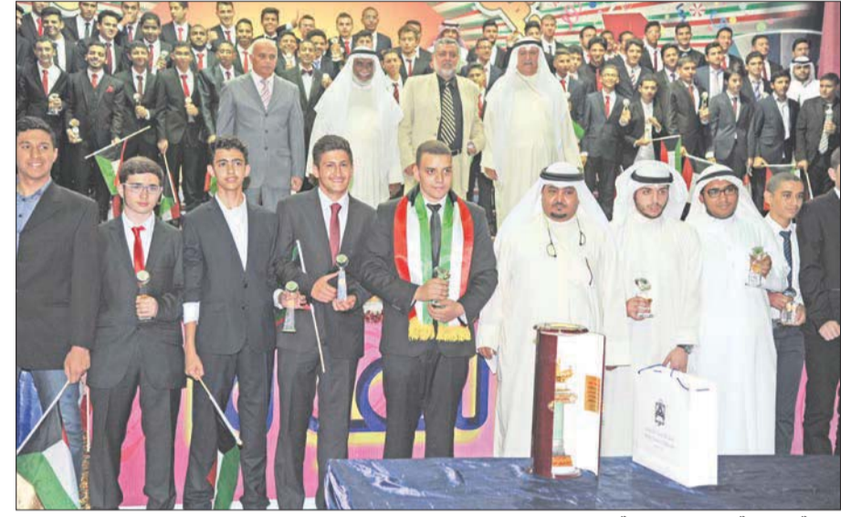
لقطة جماعية لفائقي المدرسة