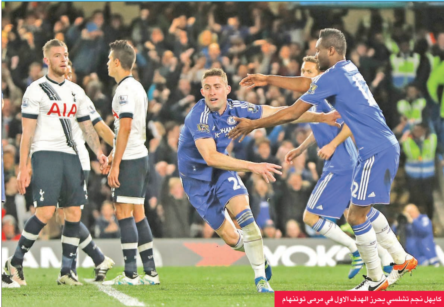
كايهل نجم تشلسي يحرز الهدف الأول في مرمرى توتنهام

توج ليستر سيتي بلقب الدوري الإنجليزي لكرة القدم للمرة الأولى في تاريخه، بتعادله منافسه المباشر توتنهام مع مضيفه تشلسي 2-2 أمس الأول، في ختام مباريات المرحلة السادسة والثلاثين من المسابقة، ما أدى إلى حسم اللقب لليستر. بغض النظر عن نتائج مباريات المرحلة الأخيرة.