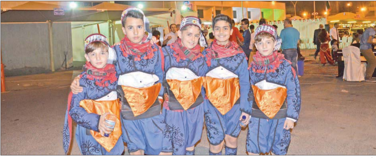
مشاركون من تركيا