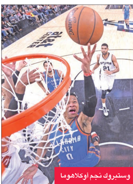
وستبروك نجم أوكلاهوما

قاد الثنائي راسل وستبروك وكيفن دورانت فريقهما أوكلاهوما سيتي ثاندر إلى انتزاع فوز ثمين من مضيفه سان أنطونيو سبيرز 98-97، أمس الأول، على ملعب "اي تي اند تي سنتر" أمام 18418 متفرجاً، في المواجهة الثانية بينهما في الدور الثاني من البلاي أوف، ضمن الدوري الأمريكي للمحترفين في كرة السلة. وبعد تعرض فريقهما إلى خسارة مذلة في المباراة الأولى على الملعب ذاته، بفارق 32 نقطة (92-124) السبت الماضي، تألق النجمان وستبروك ودورانت، وقدا مباراة كبيرة حقق خلالها الأول ثنائية مزدوجة "دابل دابل" بتسجيله 29 نقطة 10 تمريرات حاسمة، وكان قريباً من الثلاثة المزدوجة "تريبل دابل"، لأنه حقق 7 متابعات، وأضاف الثاني 28 نقطة مع 7 متابعات و4 تمريرات حاسمة.