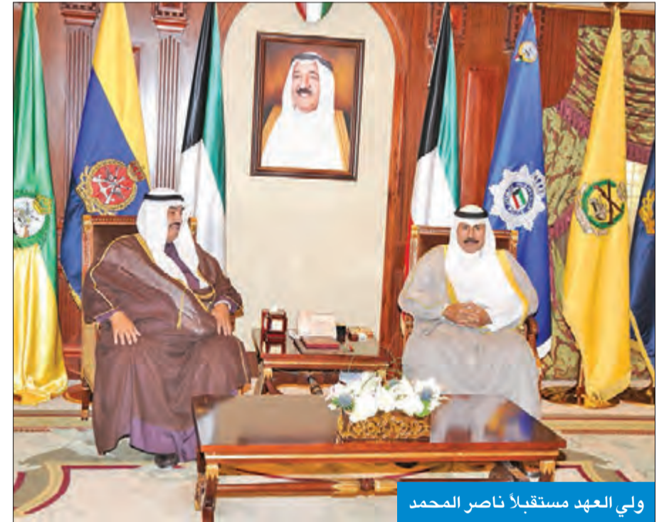
ولي العهد مستقبلاً ناصر المحمد

استقبل سمو ولي العهد الشيخ نواف الأحمد بقصر بيان صباح أمس سمو الشيخ ناصر المحمد.