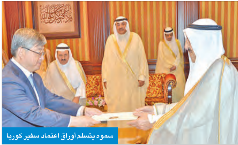
سموه يتسلم أوراق اعتماد سفير كوريا

من جهة أخرى، بعث صاحب السمو أمير البلاد ببرقية تهنئة إلى الرئيس أندريه دودا رئيس جمهورية بولندا، عزّر فيها سموه عن خالص تهادنيه، بمناسبة العيد الوطني لبلاده، متمنياً له موفور الصحة والعافية، ولبلده الصديق دوام التقدم والازدهار. وبعث سمو ولي العهد الشيخ نواف الأحمد، ورئيس مجلس الوزراء سمو الشيخ جابر المبارك، ببرقتي تهنئة مماثلتين.