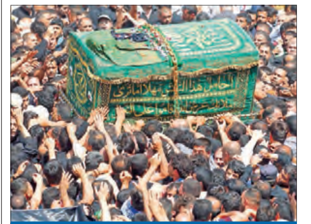
عراقيون يحملون نعشاً رمزياً خلال إحياء ذكرى مقتل الإمام الكاظم في منطقة الكاظمية ببغداد أمس