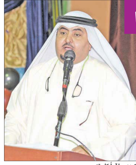
الكردي ملقياً كلمته