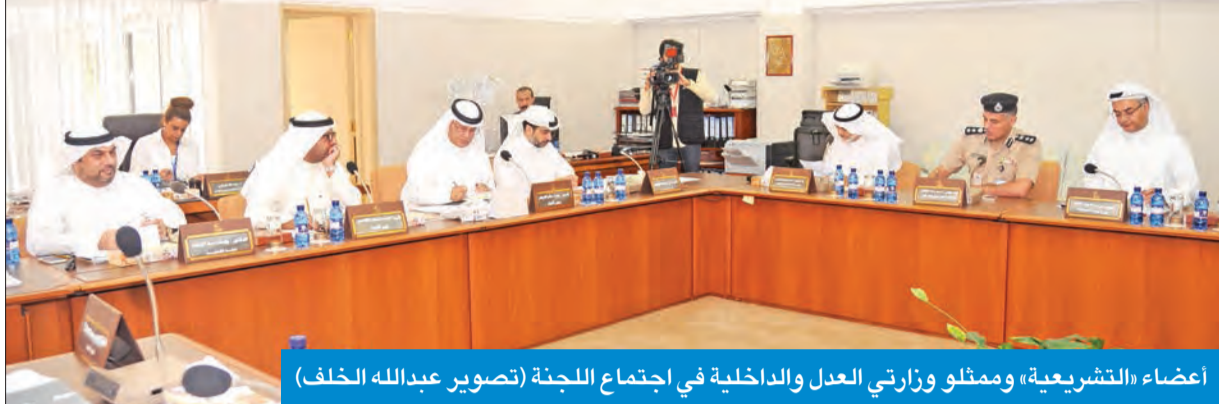
أعضاء «التشريعية» وممثلو وزارتي العدل والداخلية في اجتماع اللجنة

استطيع تزويد لجنة الميزانيات بها. وأضاف «نحن أكدنا على طلبنا بأن تزودنا وزارة المالية بهذه الأسماء لأن ما يزيد على 8 ملايين دينار لم تستوف ممن ينطبق عليهم القانون، وكنا مقتنعين بهذه النتيجة الصادرة عن اللجنة التشريعية ليزودونا بالأسماء». وأكد عبدالصمد، في تصريح صحافي أمس، أن «الكثير من القضايا التي نطلبها للأسف وغير دستوري ولم تزود ديوان المحاسبة بكل البيانات وامتنعت بحجة عدم الدستورية». واتهم الأجهزة الحكومية بمحاولة إجهاض رقابة مجلس