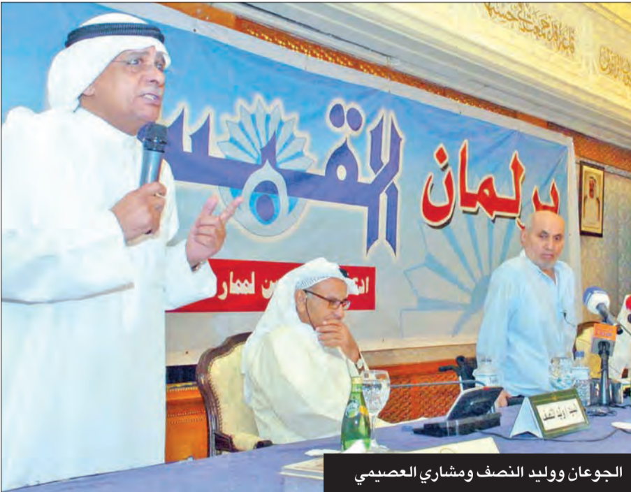
الجوعان ووليد النصف ومشاري العنجري

تعرض في 1991 لمحاولة اغتيال بمسدس كاتم للصوت أدت إلى إصابته بالشلل