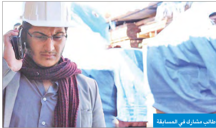
طالب مشارك في المسابقة

كل في مجاله، يحدهم الشغف والحماس والثقة بالنفس على تقديم الأفضل، والفوز بهذه المسابقة العالمية، وإن ما قدموه عكس إبداعاً علمياً مبهراً، وهو بالتأكيد ثمره لحسن التنسيق والمشاركة والإعداد. وأضافت أن هذا التفوق، وهذه القدرة المتميزة لطلبة AUM على تصميم واختراع حلول، وخلق أفكار مبدعة بهذا المستوى الراقي والمتميز، ليسا بجدديدين على AUM، فقد حظيت على مدار السنوات السابقة بتفوق ملحوظ، تمثل في تصدرها المراكز الأولى في مختلف التحديات والبطولات والمسابقات وفي مناسبات عدة.