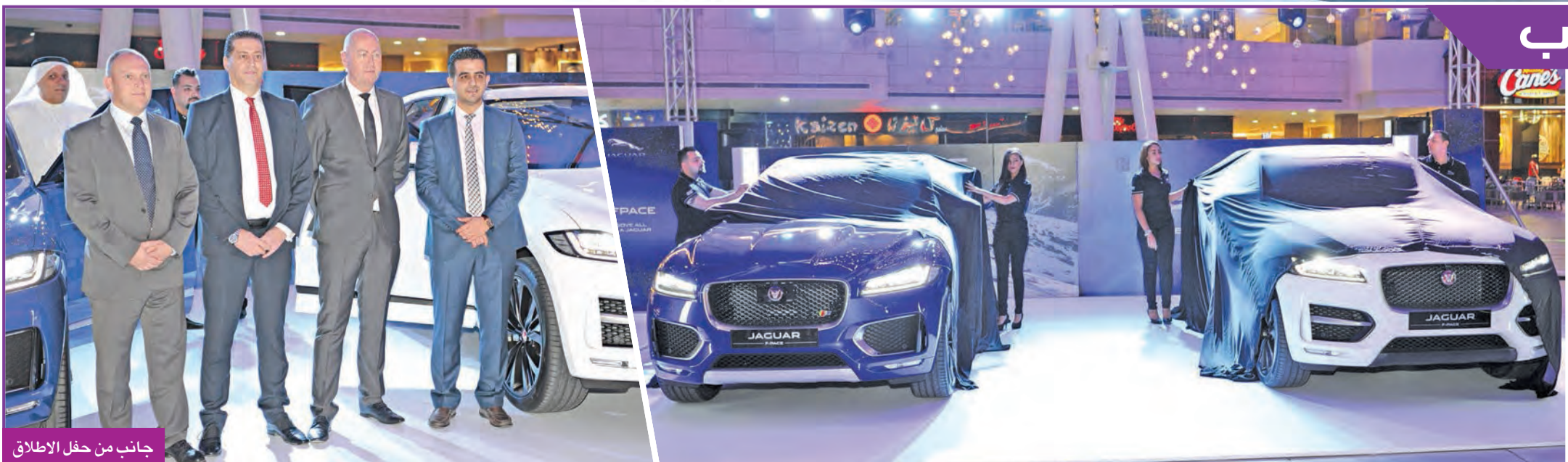
جانب من حفل الإطلاق

تم الكشف عن جاكوار F-PACE الجديدة كلياً بحضور عدد من كبار الشخصيات رفيعة المستوى وعملاء جاكوار المخلصين ووسائل الإعلام والجمهور خلال حفل مميز أقيم في مجمع الأفنيوز، وتم عرض سيارة جاكوار F-PACE في هذا الحدث، حيث أتيج للضيوف إلقاء نظرة عن قرب على أبعادها المذهلة، وأسطحها الأنيقة، وخطوطها المثالية التي تحدد ملامح جميع سيارات جاكوار.