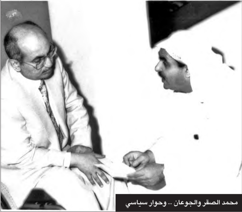
محمد الصقر والجوعان... وحوار سياسي

فقدت الكويت، أمس، النائب السابق حمد عبدالله الجوعان، أحد أبرز رموز العمل السياسي والوطني بعد رحلة طويلة مع المرض، عن عمر يناهز 69 عاماً، أفترن اسمه خلالها بمحطات بارزة من