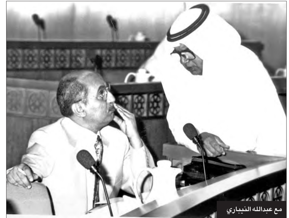
مع عبدالله النيباري

نعى رئيس مجلس الأمة مرزوق الغانم عضو مجلس الأمة السابق حمد الجوعان الذي وافته المنية بعد صراع طويل مع المرض. وقال الغانم، في تصريح صحفي، «نعزى أنفسنا والشعب الكويتي وأسرة الجوعان الكريمة برحيل البرلمان الغد والسياسي الحر العم الفاضل حمد الجوعان، متضرعين إلى الباري جلت قدرته أن يتغمده بواسع رحمته وأن يجعل الفردوس الأعلى ماواه الأخير. إنه سميع مجيب». وأضاف «منذ رصاصات الغدر التي حاولت النيل منه قبل 25 عاماً والعم حمد الجوعان صابر على ما ابتلاه الله، مؤمناً بأن الله بشر الصابرين على الابتلاء، فكان المرحوم مؤمناً صابراً ومحتسباً». وقال إن الكويت اليوم «فقدت أحد فرسانها الذين كانت لهم صوت وجولات في ميادين السياسة والعمل البرلماني والعام». وختم الغانم داعياً «رحم الله يا أبا عبدالله، فقد كنت لنا وللكثير من أبناء الكويت قدوة ورمزاً ومعلماً ومثالاً يحتذى في الشرف والعمل المخلص والوطنية الحق».