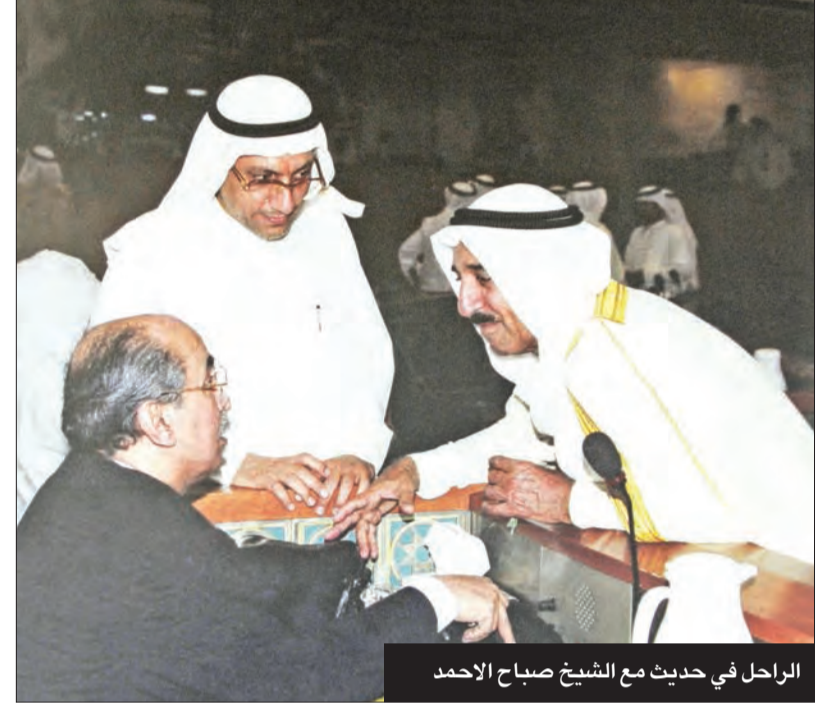
الراحل في حديث مع الشيخ صباح الاحمد