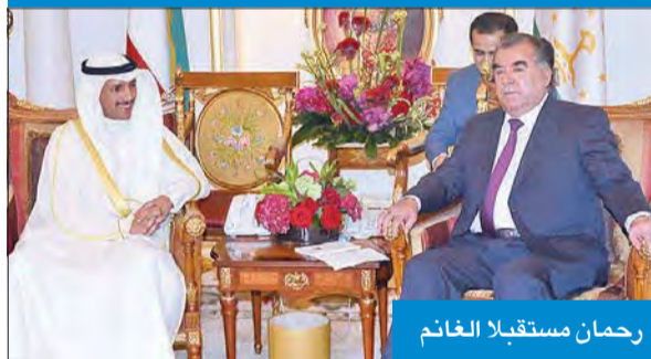
رحمان مستقبلاً الغانم

استقبل رئيس طاجيكستان إمام علي رحمان، ظهر أمس، رئيس مجلس الأمة مرزوق الغانم، كما استقبل سمو الشيخ ناصر محمد، وذلك بمقر إقامته في قصر بيان. واستقبل أيضاً رئيس مجلس الوزراء بالإنابة وزير الخارجية الشيخ صباح الخالد. واستقبل الرئيس رحمان أمس المستشار بالديوان الأميري د. عبدالله المعتوق ورؤساء الجمعيات الخيرية في الكويت. حضر المقابلات رئيس بعثة الشرف المرافقة المستشار بالديوان الأميري محمد ضيف الله شرار.