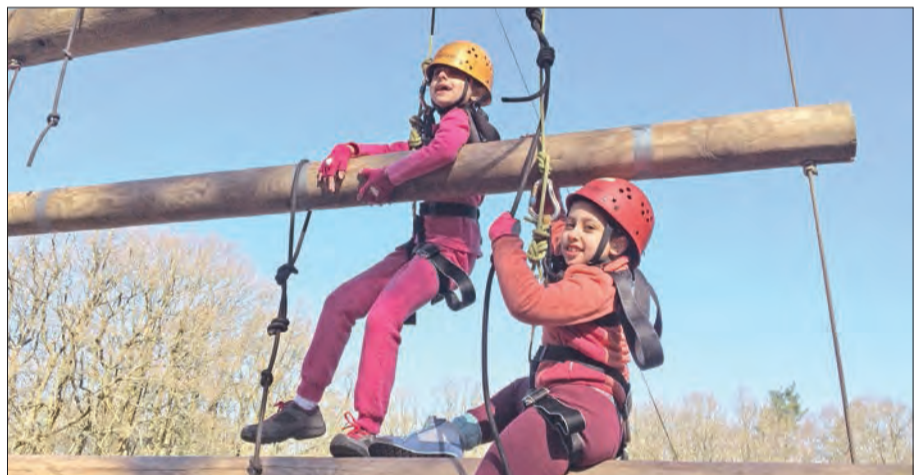
لعبة تسلق السلم