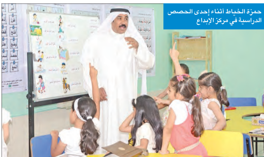
حزمة الخياط أثناء إحدى الحصص الدراسية في مركز الإبداع

● ماذا يحتاج الطفل الكويتي حتى يبدع في دراسته؟ يحتاج إلى بيئة خصبة تؤدي إلى تنشيط قدراته العقلية، وإلى مناهج مشوقة ومسلية وجاذبة ومثيرة تساعد على أن يقرأ ويتحدث ويتعلم ويفكر ويكتشف. الطفل الكويتي في الوقت الحالي لا تتناسب معه الطرق التقليدية في التعليم، فهو يرغب في التعليم الذكي ويُقبل عليه بشدة، ويحتاج إلى معلم مؤهل تأهيلاً عالياً من التميز والكفاءة التربوية والتعليمية، وإلى نظام