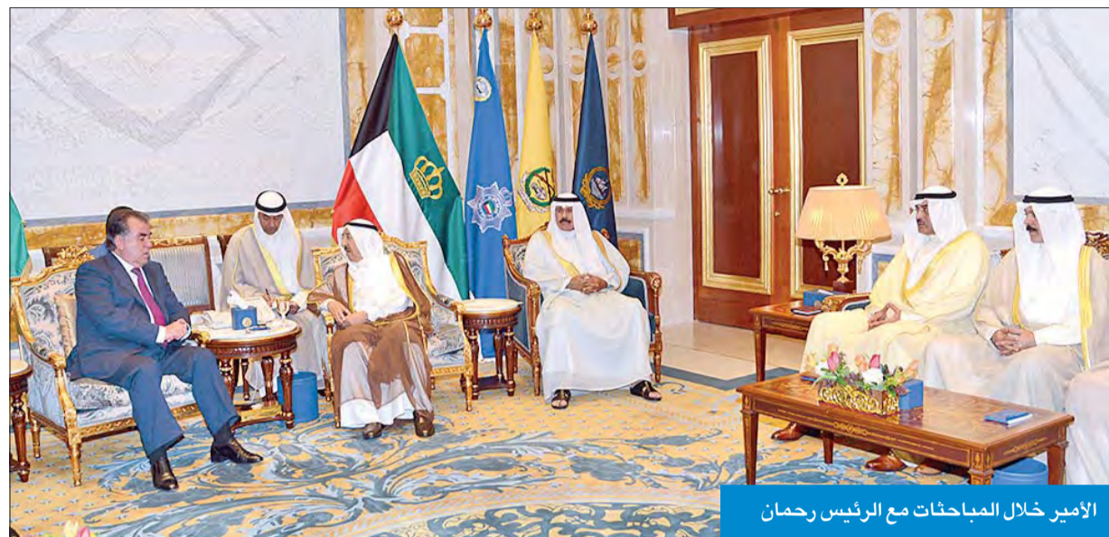
الأمير خلال المباحثات مع الرئيس رحمان