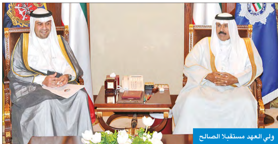
ولي العهد مستقبلاً الصالح

الوزراء وزير الدفاع الشيخ خالد الجراح، ونائب رئيس مجلس الوزراء وزير المالية وزير النفط بالوكالة أنس الصالح، فوزير الدولة لشؤون مجلس الوزراء الشيخ محمد عبدالله.