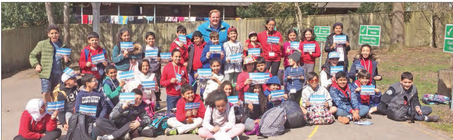
الطلبة خلال رحلتهم إلى ليام

1 828 111 Fax: 2252537 E-mail: ads@aljarida.com