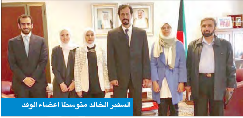
السفير خالد متوسطا أعضاء الوفد

رحب سفير الكويت لدى إيطاليا الشيخ علي الخالد بنتائج زيارة الوفد الإعلامي الثقافي الكويتي، معتبرا أنها تمهد للاستفادة من تجربة إيطاليا العريقة في قطاع المكتبات والأرشيف وتأهيل الكوادر الوطنية. وذكرت سفارة الكويت، في بيان أو رده «كونا» أمس، أن السفير استقبل الوفد الكويتي برئاسة الشيخة رشا الجابر في ختام زيارة عمل لروما ضمن الجهود المشتركة لتوسيع أطر التعاون الإعلامي والثقافي على المستوى التقني وتبادل الخبرات. واستعرض الخالد مع رئيسة الوفد نتائج جولتي الوفد اللتين نظمتها سفارة الكويت في كل من المكتبة الوطنية المركزية الإيطالية وأرشيف الدولة المركزي بهدف نقل التجربة الإيطالية المتقدمة، واستلهاهم نموذج مدرستها العريقة في حفظ التاريخ والتراث الوطني والذاكرة الرسمية للدولة والإبداع الفكري والمؤلفات، وصيانة وحماية وثائقها والمعلومات الثمينة، وتصنيفها، وإتاحة تداولها واسترجاعها بما يسبح للباحثين والمهتمين بالاطلاع عليها ومراجعتها بسهولة وأمان.