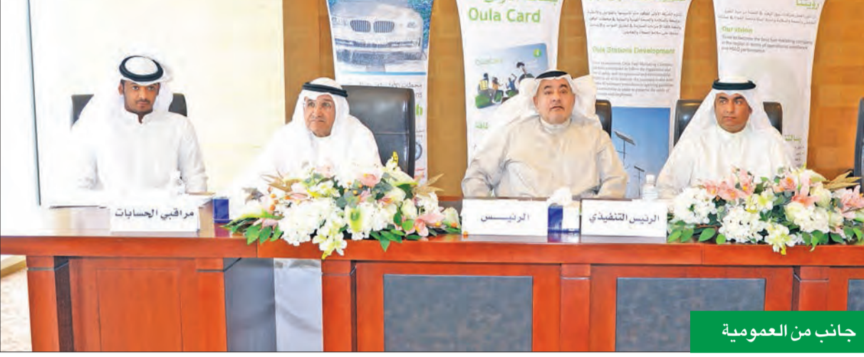
جانب من العمومية

وقال إن «الشركة أطلقت تطبيقاً على الهواتف الذكية يمتاز بسرعه وسهولة الاستخدام والامان، لضمان راحة المستخدمين وطمانتهم، ومن خلال هذا التعاون أصبح بإمكان عملاء الأولى شحن بطاقات الوقود في أي مكان