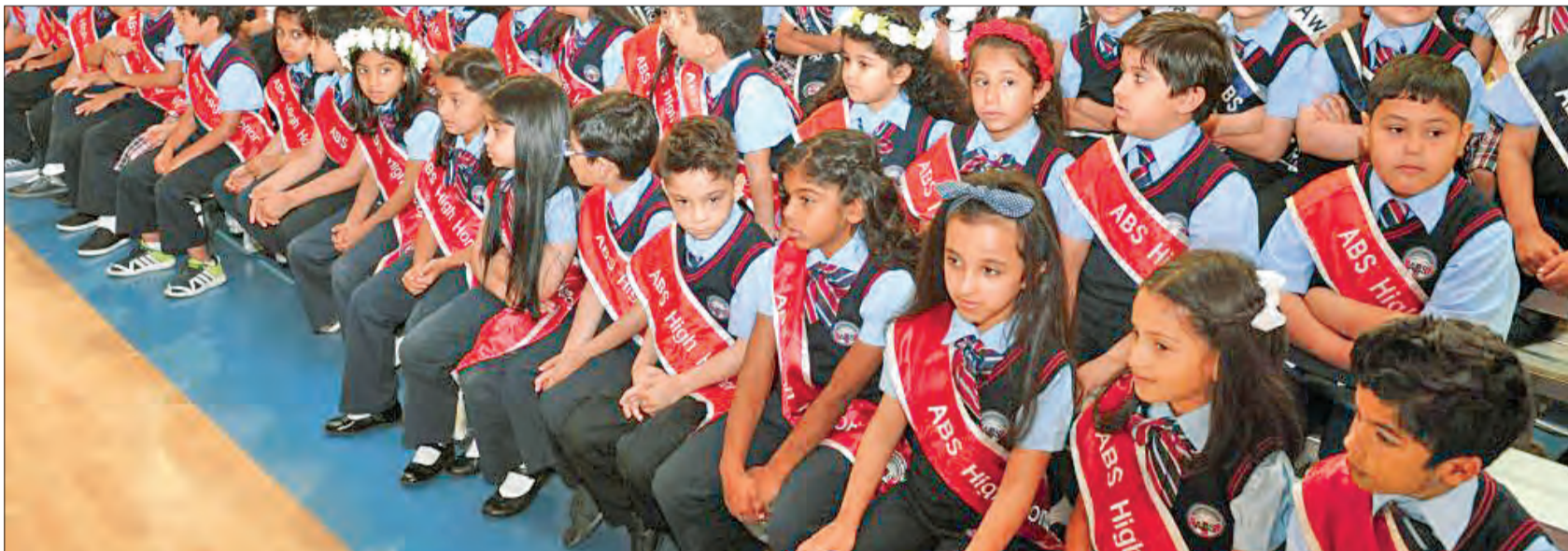
مجموعة من طلبة البكالوريا الأميركية، الفائتين