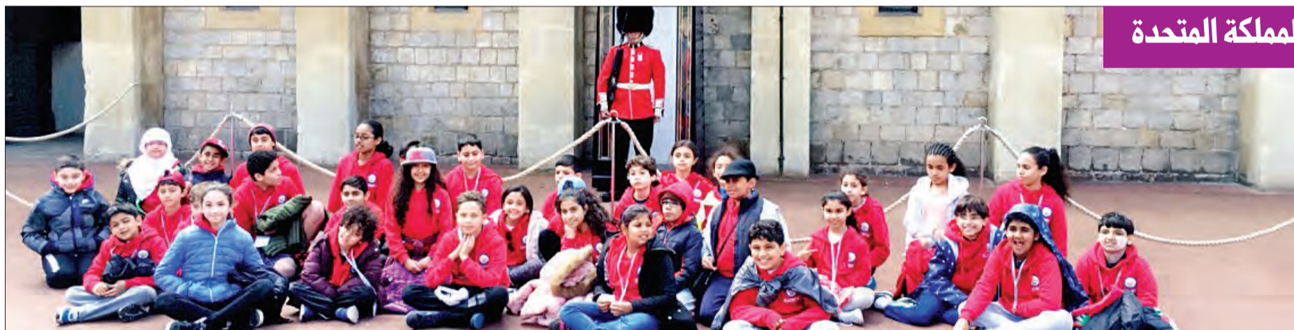
الطلبة المشاركون في الرحلة

تخلت المدرسة البريطانية بالكويت رحلة ثقافية وترفيهية لطلبة المرحلة المتوسطة إلى المملكة المتحدة ليتعرفوا إلى المعالم الرئيسية فيها. وحظي الطلاب بزيارة المقر الملكي في وندسور Windsor، واستمتعوا بمشاهدة عروض الحرس الملكي بمناسبة الذكرى 90 لعيد ميلاد الملكة إليزابيث. وقضى الطلاب يوماً ثقافياً وترفيهياً شاركوا خلاله في كثير من الأنشطة الرياضية والترفيهية المختلفة كتسلق الجبال والمبارزة والرماية. وفي المساء استمتعوا بتبادل المعلومات والمسابقات العلمية.