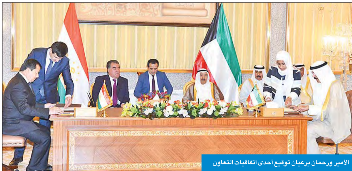
الأمير ورحمان يريان توقيع إحدى اتفاقيات التعاون

جو ودي ساد المحادثات وعكس رغبة الجانبين بتعزيز التعاون في كل المجالات