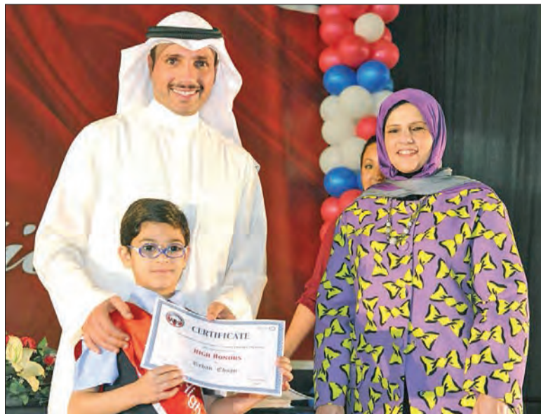
تكريم طالب فائق