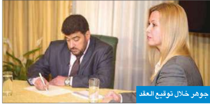
جوهري خلال توقيع العقد

الخاصة والدبلوماسية أسوة بالإمارات، نظراً لما تتمتع به الكويت من علاقات جيدة مع دول الاتحاد السوفياتي السابق عامة وأوكرانيا خاصة.