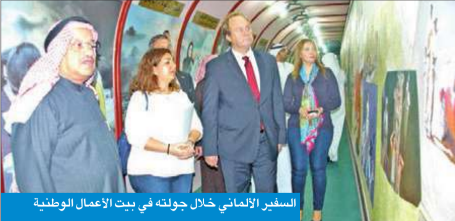
السفير الألماني خلال جولته في بيت الأعمال الوطنية

يقتصر فقط على المساعدات المالية كما هو شائع، وأوضح أن ألمانيا قررت يوم 10 أغسطس، أي بعد أسبوع من الغزو، إرسال وحدة من الكتيبة البحرية الألمانية، لإزالة الألغام إلى شرق البحر الأبيض المتوسط، لتمكين الوحدات العاملة هناك من التوجه إلى الخليج العربي، وفي أبريل 1991 تقرر إرسال هذه الكتيبة إلى شمال الخليج العربي لتنفيذ عمليات إزالة الألغام، حتى تتمكن السفن من الوصول إلى ساحل الكويت، بالتعاون مع الحلفاء، وبما يتوافق مع قرار الأمم المتحدة رقم 686.