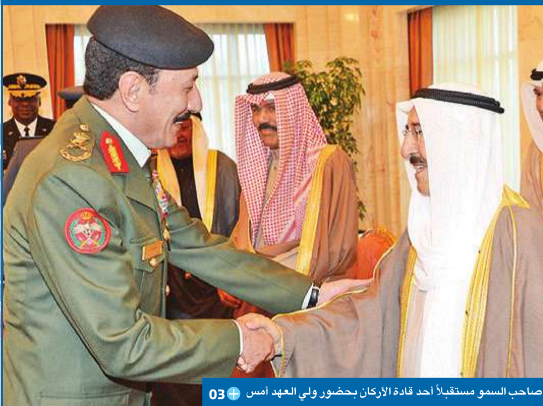
صاحب السمو مستقبلاً أحد قادة الأركان بحضور ولي العهد أمس 03+