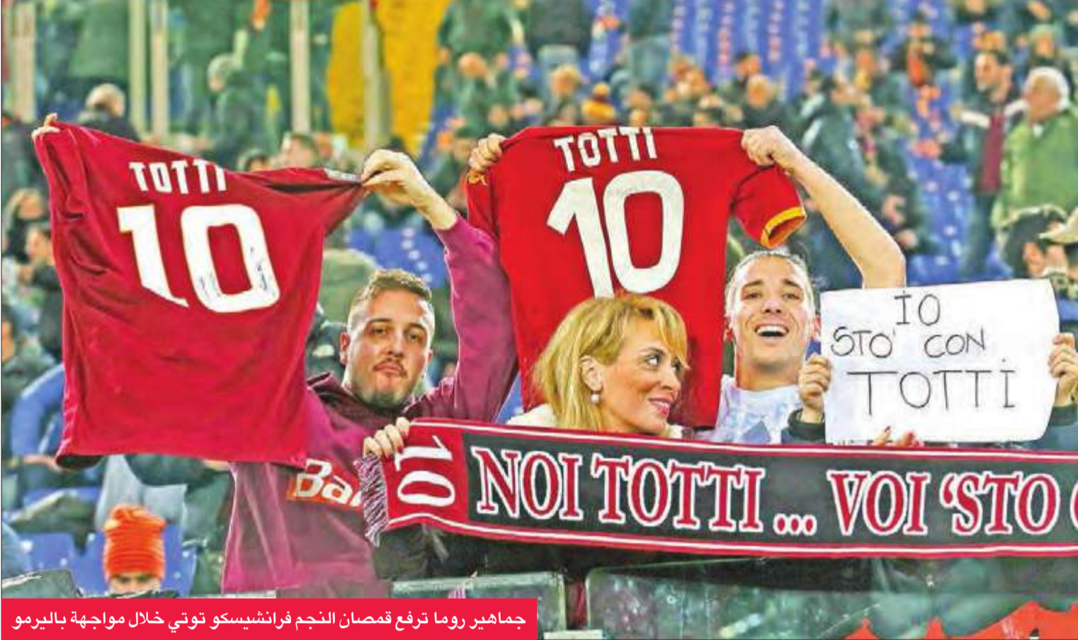
جماهير روما ترفع قمصان النجم فرانكيسكو توتي خلال مواجهة باليرمو