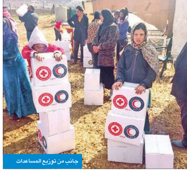
جانب من توزيع المساعدات

واصلت جمعية الهلال الأحمر الكويتي، امس، حملة مساعداتها الإنسانية للنازحين السوريين بتوزيع مساعدات إغاثية شملت مواد غذائية ومنظفات على 350 أسرة سورية في منطقة البقاع شرقي لبنان.