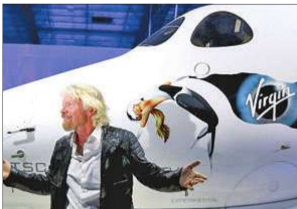
وال تصنيع والاختبار من جانب الشركة المنتجة.

وتوصلت التحقيقات إلى إلقاء المسؤولية عن الحادث على خطأ بشري لقائد المركبة، وعلى أخطاء فنية في التصميم