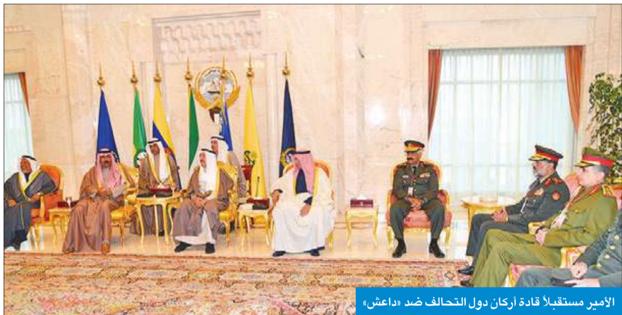
الأمير مستقبلاً قادة أركان دول التحالف ضد «داعش»