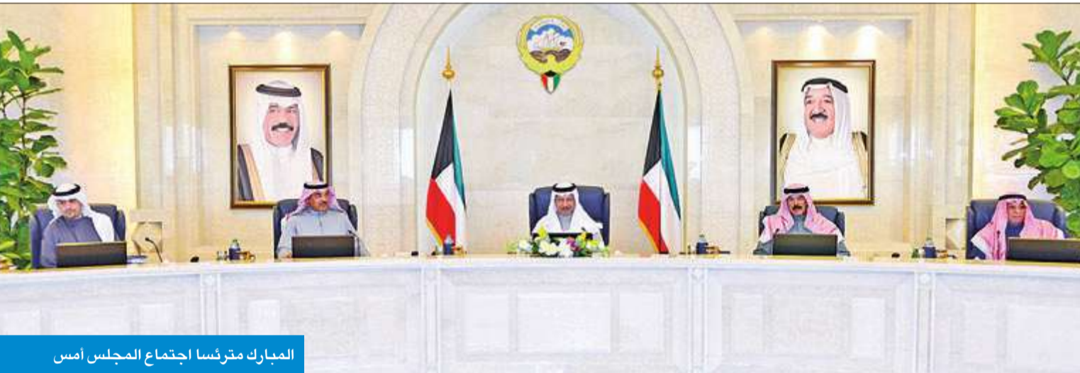
المبارك مترئسا اجتمع المجلس أمس

اعتبر مجلس الوزراء، أن تجاوز التحديات الاستثنائية الناجمة عن انخفاض أسعار النفط يستوجب إجراءات وتدابير مدروسة وجادة على المستويين العاجل والأجل، وفق برنامج زمني محدد، يستهدف الحد من النمو المتسارع للمصروفات الجارية للموازنة العامة، والتوسع في تنمية إيراداتها غير النفطية.