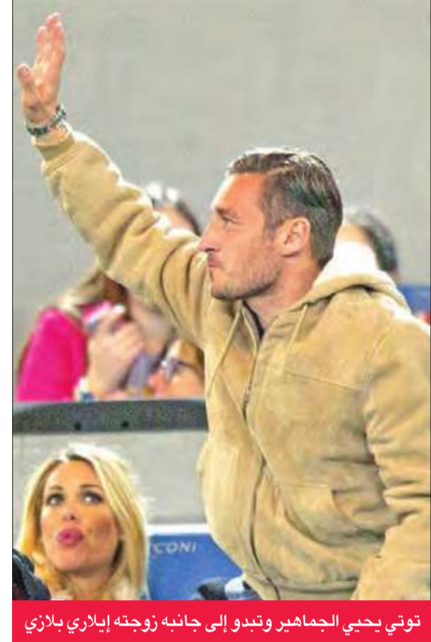
توتي يحيي الجماهير وتبدو إلى جانبه زوجته إيلاري بلاري

عبرت جماهير روما عن تضامنها مع القائد فرانكيسكو توتي، وذلك بعد واقعة استبعاده من معسكر الفريق قبل مواجهة باليرمو أمس الأول، التي انتهت بفوز روما بخمسة أهداف نظيفة.