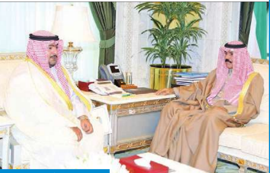
ولي العهد مستقبلاً ناصر العلي

رئاسة مجلس الوزراء والوزراء المعنوقين جميعاً، لذلك نحن غاية في السعادة وفي الشكر لسموه". من جانبه، قال نائب رئيس اللجنة د. محمد الكندري: "تشرفنا ببقاء الأمير لنشكره بعودة آخر معتقل في غوانتانامو". وأكد أن سموه بين مدى حرصه على عماله وأوصلنا لسموه رسالة آخر معتقل في غوانتانامو المعتقل فايز الكندري، وأنه يدعو لسموه بالصحة والعافية". وبيعت سمو الأمير ببرقية تهنئة إلى جاك عام سانت لوسيا، دامي بيرليت لويبي عبر فيها سموه عن خالص تهانته بمناسبة العيد الوطني لبلادها متمنياً لها موفور الصحة والعافية، وللبلد الصديق دوام التقدم والأزدهار. وبيعت سمو ولي العهد الشيخ نواف الأحمد ببرقية تهنئة إلى لويبي ضمنتها سموه خالص تهانته بمناسبة العيد الوطني لبلادها، متمنياً لها موفور الصحة والعافية. كما بعث سمو رئيس مجلس الوزراء الشيخ جابر المبارك ببرقية تهنئة مماثلة.