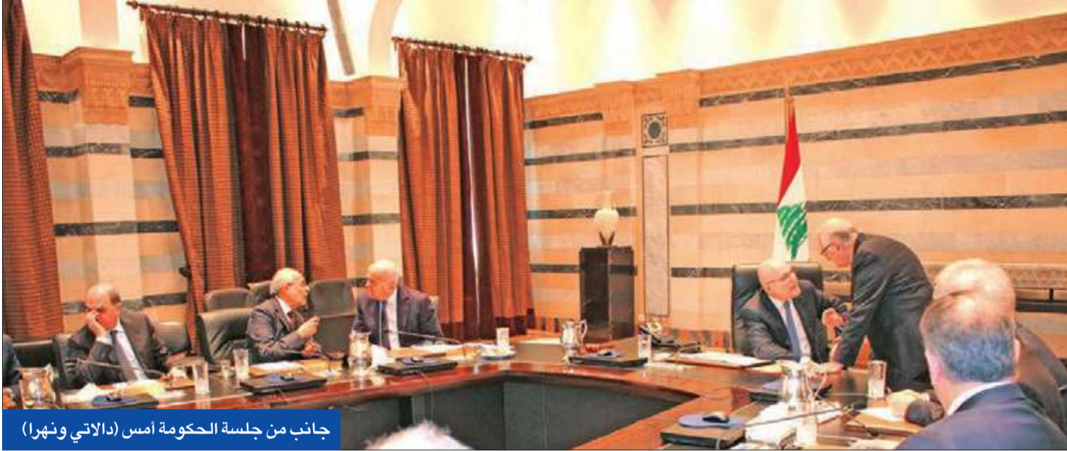
جانب من جلسة الحكومة أمس (اللاتي ونهرا)

السعودية: لن نتخلى عن لبنان... و«حزب الله» يمارس الإرهاب • الحريري يطلق «وثيقة الوفاء للإجماع العربي»