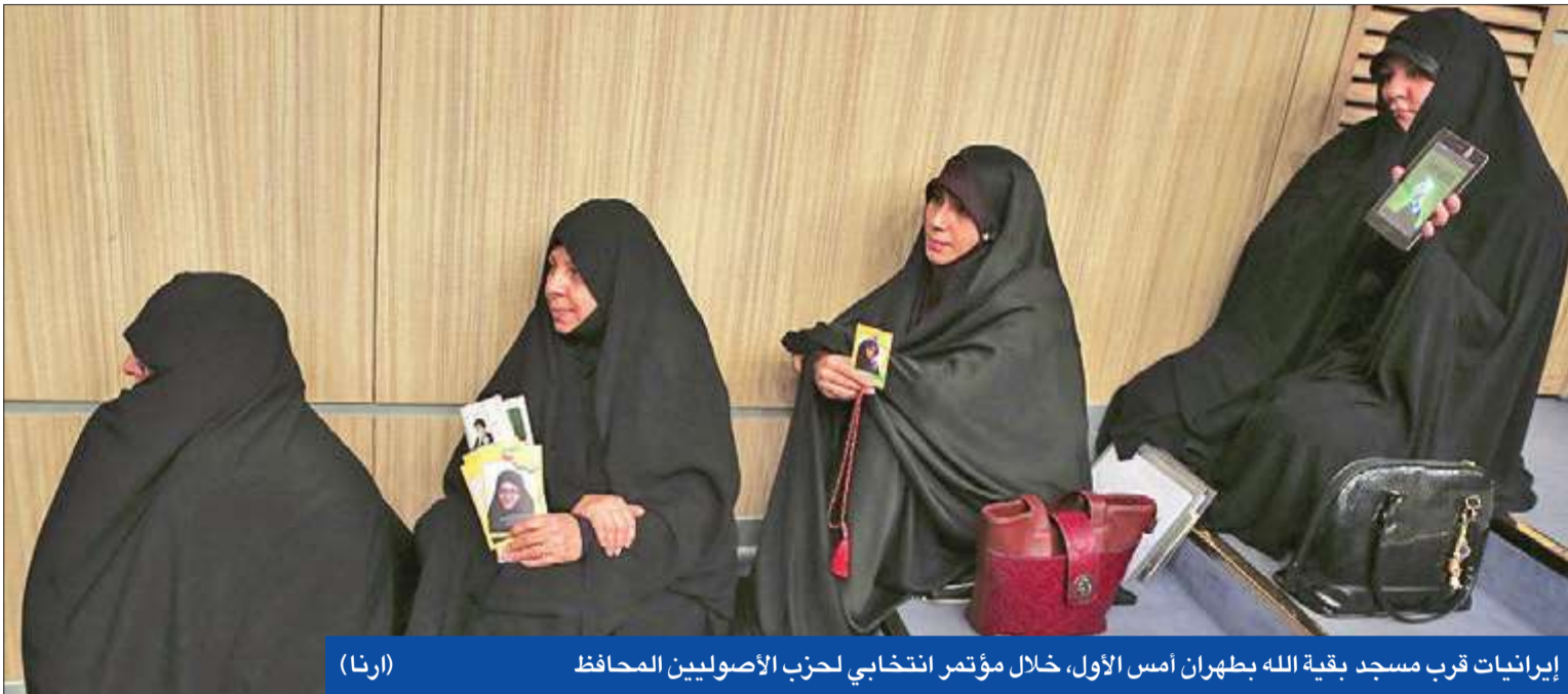
إيرانيات قرب مسجد بقية الله ب طهران أمس الأول، خلال مؤتمر انتخابي لحزب الأصوليين المحافظ

● خاتمي ورفسنجاني يدعوان إلى التصويت بكثافة ● حفيد الخميني يحث على المشاركة والاحتجاج لاحقاً