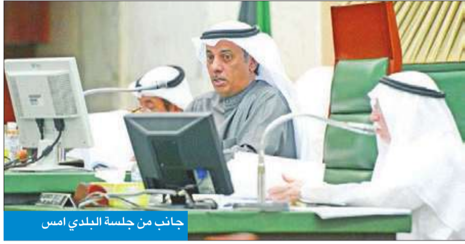
جانب من جلسة البلدي أمس

وافق على مشروع تطوير أسواق المباركية وتكليف مكتب استشاري إعداد الدراسة اللازمة