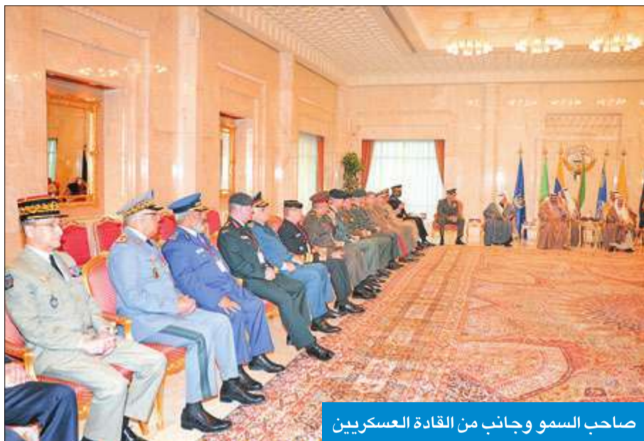
صاحب السمو وجانب من القادة العسكريين