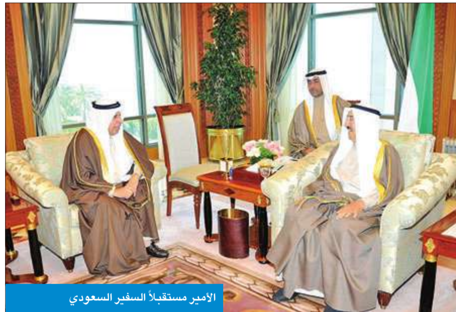
الأمير مستقبلاً السفير السعودي

تسلم سمو أمير البلاء الشيخ صباح الأحمد رسالة خطية من خادم الحرمين الشريفين الملك سلمان بن عبدالعزيز آل سعود ملك المملكة العربية السعودية الشقيقة تتعلق بالعلاقات الأخوية المتميزة، التي تربط بين البلدين والشعبين الشقيقين، وآخر المستجدات على الساحتين الإقليمية والدولية. وتلقى الرسالة لسمو الأمير، سفير السعودية في الكويت د. عبدالعزيز الفاييز لدى استقبال سموه له في قصر السيف صباح أمس. واستقبل سموه بقصر السيف، ظهر أمس، أهالي المعتقلين الكويتيين في غوانتانامو، حيث أعرب رئيس اللجنة الشعبية للدفاع عن المعتقلين الكويتيين السابقين في غوانتانامو خالد العودة عن فخره وسعادته ببقاء سمو أمير البلاء مؤكداً أنه بفضل احتضان سموه لقضية المعتقلين في غوانتانامو وتوجيهات سموه الدائمة "تمكنا من استعادة ابنائنا". وقال العودة: "تشرفنا ببقاء