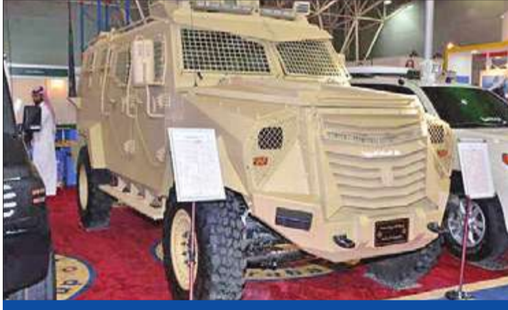
صورة نشرها موقع «سي إن إن» أمس تظهر المدرعة الجديدة التي كشف عنها النقاب في معرض للقوات المسلحة بالرياض

الرياض تكشف النقاب عن «مدرعة الحزم» وتستعد لإنتاج مروحيات «الشبح»