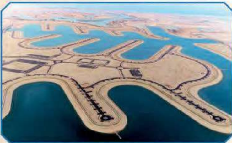
منظر عام للبنية التحتية - المرحلة الرابعة

وبتاريخ 2015/10/20 صدرت بحمد الله وتوفيقه رخصة البناء لقسائم المرحلة الرابعة (A4) من قبل السادة بلدية الكويت.