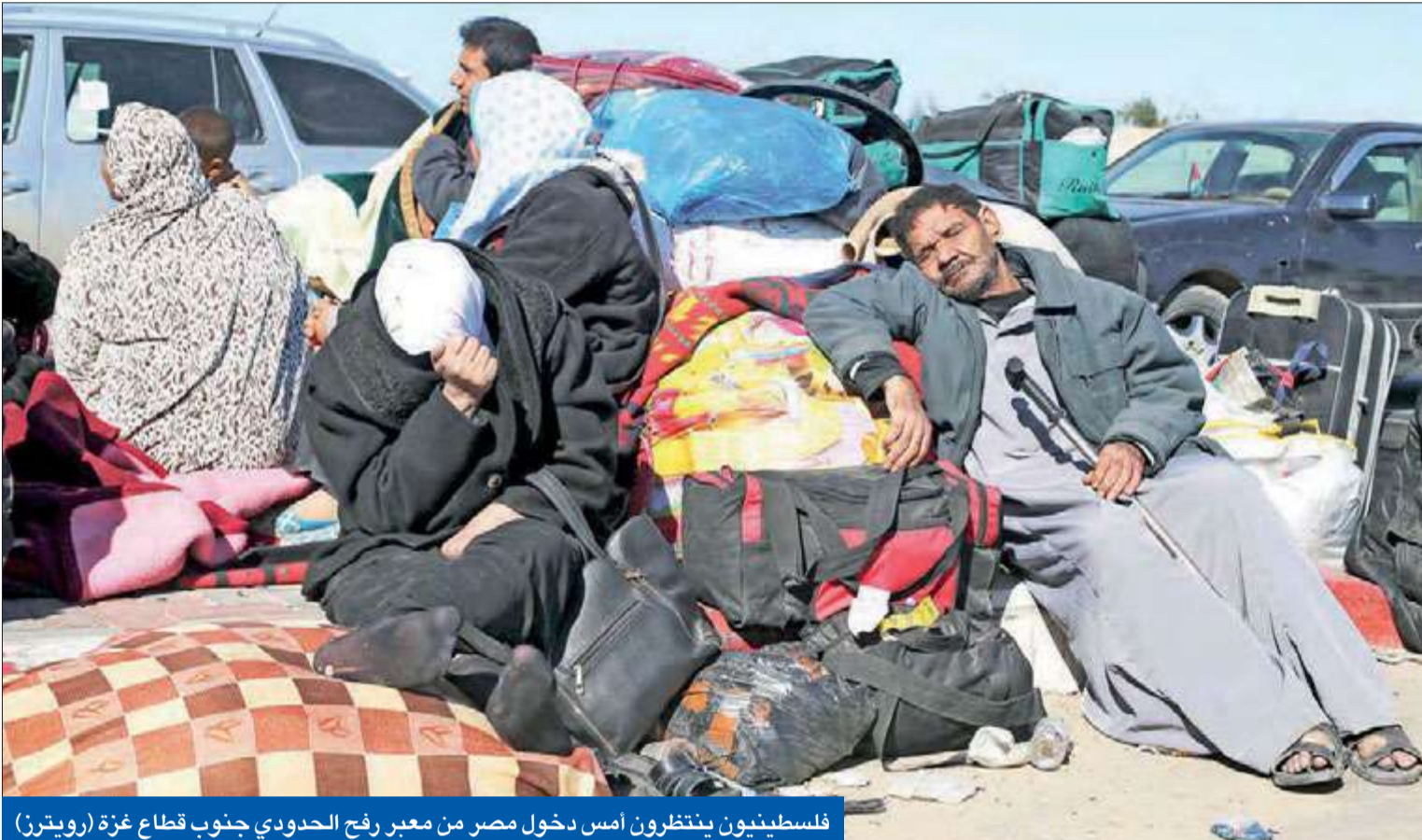
فلسطينيون ينتظرون أمس دخول مصر من معبر رفح الحدودي جنوب قطاع غزة (رويترز)

تأجيل اجتماعات سد النهضة • قمة ثلاثية في أثينا الثلاثاء • «التجارة» تستهدف السوق الروسي