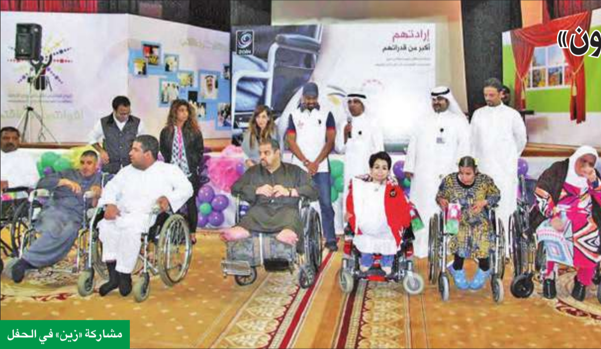
مشاركة «زين» في الحفل