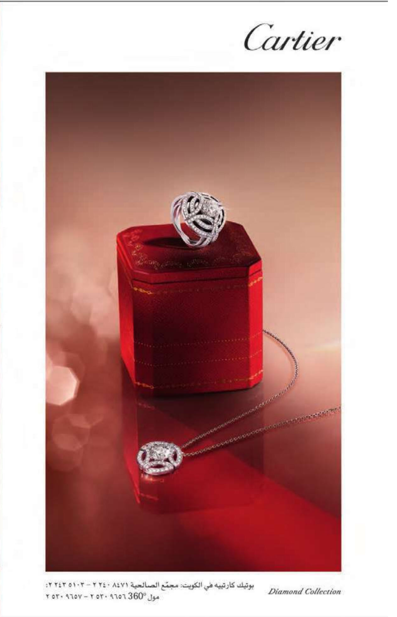
بوتيك كارتييه في الكويت: مجتمع الصالحيه ٨٤٧١ - ٢٢٤٠ - ٢٤٤٣ ٥١٠٢ : ٢٥٢٠ ٩٦٥٧ - ٢٥٢٠ ٩٦٥٦ 360 مول Diamond Collection