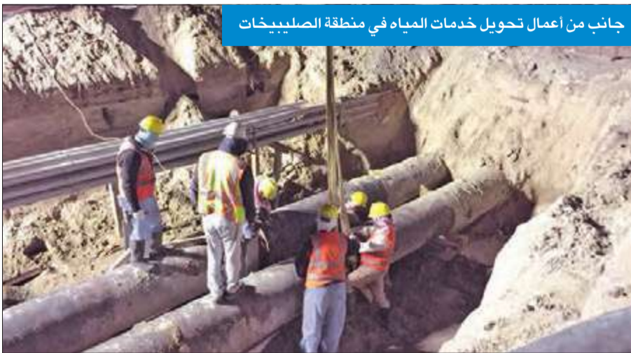
جانب من أعمال تحويل خدمات المياه في منطقة الصليبيخات

من أعمال تحويل خدمات المياه، بالتعاون والتنسيق مع وزارة الكهرباء والماء قبل المدة المحددة، ممثناً تعاون المواطنين من سكان المناطق المذكورة مع العاملين خلال فترة إجراء التعديلات على شبكة المياه للمصلحة العامة. وتقدم الحصان بالشكر والتقدير للعاملين في وزارة الكهرباء والماء والعاملين على العقدين المذكورين، للجهود المضنية التي بذلوها خلال عملية تحويل خدمات المياه، لإنهاء كافة الأعمال، وفقاً للمدة المحددة، من أجل عودة المياه إلى كافة المرافق والمنازل بالمناطق المذكورة، باعتبار خدمة المياه من الخدمات الحيوية التي يصعب الاستغناء عنها في الأغراض الحياتية للمواطن والمقيم، على حد سواء.