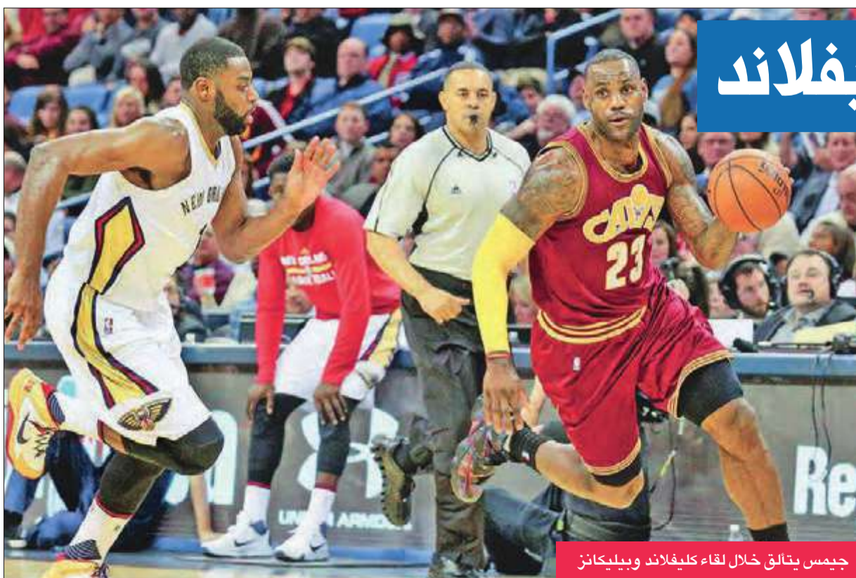
جيمس يتألق خلال لقاء كليفلاند وبيلبكانز

مع بداية موسم 2017 أو أن تطور رينو خلال العام حتى تتمكن من تمديد الاتفاق. وأضاف ماركو، أنه رغم التأخير عن التأكيد حول محرك فريق ريد بول للعام المقبل، إلا أن الفريق سيكون موجوداً في برشلونة للمشاركة في الاختبارات الأولية في 22 فبراير. وأكد فريق تورو روسو أنه سيستخدم محرك فيراري في 2015 في الموسم، لينتهي تعاونه مع رينو الذي استمر عامين.