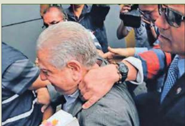
لحظة القبض على رئيس الاتحاد الإكوادوري لويس تشيريبوجا

"إيقاف نابوت وهاويت يأتي بناء على طلب غرفة التحقيق التابعة للجنة الأخلاق المستقلة بسبب اتهامهما من قبل القضاء