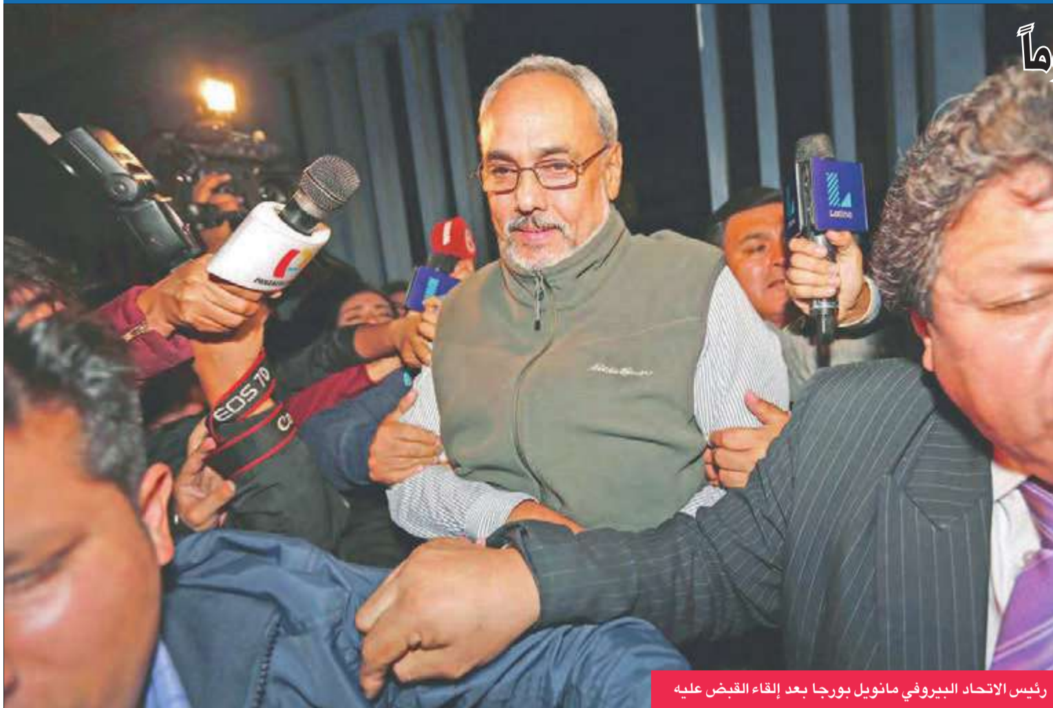
رئيس الاتحاد البيروفي مانويل بورجا بعد إلقاء القبض عليه

وجهت السلطات القضائية الأميركية التهم لعدد كبير من أصحاب المناصب الرياضية في أميركا الجنوبية، ضمن إطار فضيحة الفساد التي تهمز أركان الاتحاد الدولي لكرة القدم (فيفا). اعتقلت السلطات البيروفية الرئيس السابق للاتحاد البيروفي لكرة القدم مانويل بورجا؛ بعد صدور بحقه مذكرة اعتقال دولية إثر اتهامات وجهت إليه من قبل السلطات القضائية الأميركية ضمن إطار فضيحة الفساد التي تهمز أركان الاتحاد الدولي لكرة القدم (فيفا). والقي القبض على بورجا إثر خروجه من منزله، لكنه شدد على أنه سيوضح الاتهامات الموجهة إليه، وقال في تصريحات لمحطة (ان) المحلية وهو يجلس في الكرسي الخلفي للسيارة بعد اعتقاله: "أنا هادئ جداً... لم ألق أي رشاوى". وتابع "كنت على علم بإمكانية توقيفي وبقدم رجال الشرطة لاعتقالي". وكان بورجا رئيساً للاتحاد البيروفي لكرة القدم في الفترة من 2002 إلى 2014، لكنه لم يترشح لولاية جديدة. وكان اسم بورجا ورد بين 16 اسماً آخر وجهت إليهم تهم فساد من قبل وزيرة العدل الأميركية لورينا لينش الخميس الماضي.