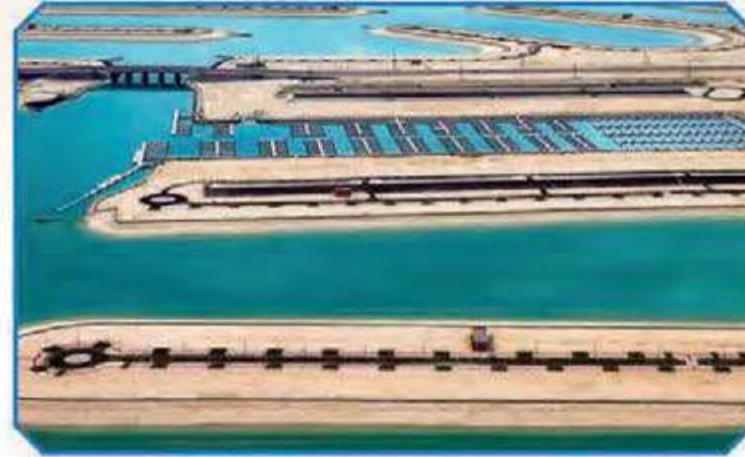
مارينا - المرحلة الرابعة