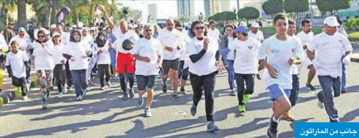
جانب من الماراثون

أطلقت الحملة الوطنية للتوعية بمرض السرطان «كان» تحت رعاية وزير الدولة لشؤون مجلس الوزراء الشيخ محمد العبدالله، وبمشاركة أكثر من 400 شخص، صباح أمس، الماراثون الثالث للتوعية بأمراض السرطان من أمام المركز العلمي حتى الجزيرة الخضراء، وتنقله الحملة بالتعاون مع البنك الأهلي الكويتي الراعي الرسمي، وبمشاركة عدة جهات أخرى منها شركة اتحاد المصارف الدولية وشركة «فيفا» للاتصالات.