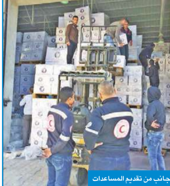
جانب من تقديم المساعدات

وصلت مساعدات إنسانية إلى قطاع غزة، مقدّمة من جمعية الهلال الأحمر إلى الشعب الفلسطيني، عبر معبر رفح البري الجنوبي القطاع، للمساهمة في التخفيف من معاناة الشعب الفلسطيني.