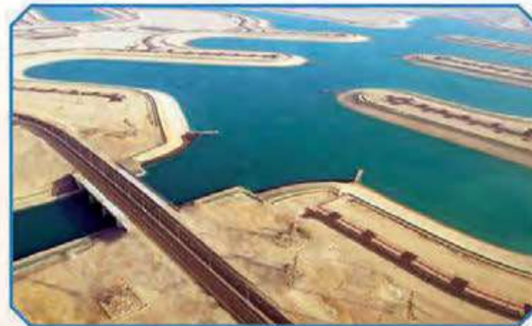
أحد جسري طريق 285