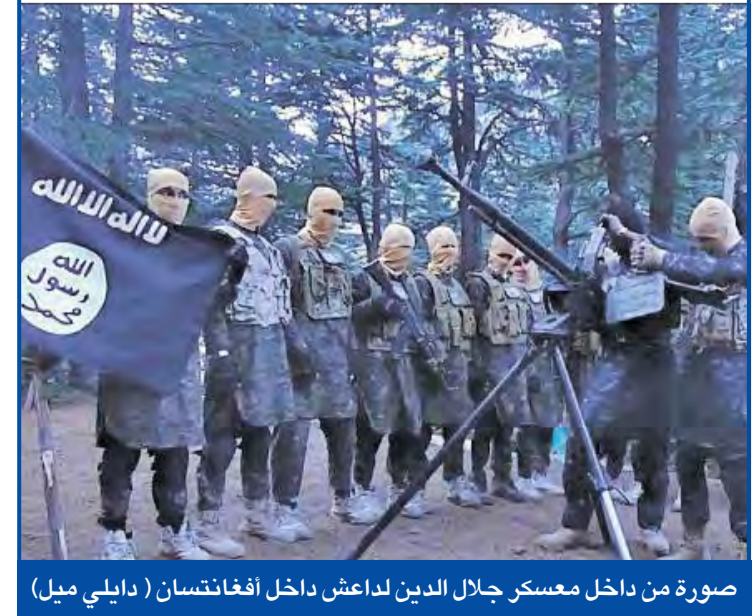
صورة من داخل معسكر جلال الدين لداعش داخل أفغانستان

في دليل على تصاعد نفوذ تنظيم «داعش» في أفغانستان، كشفت شبكة داخل حركة «طالبان» أعلنت سابقاً ولإعلاء لـ «داعش»، أنها مسؤولة عن إطلاق النار على قائد حركة «طالبان» ملا اختر منصور. وجاء ذلك في حين نشرت مواقع جهادية صوراً لقيام عناصر من «داعش» بتدريبات في معسكرات بأفغانستان. وأفادت التقارير، بأن التنظيم بات يضم 1600 مقاتل على الأقل مدربون على استخدام الأسلحة المتوسطة والثقيلة. وفي غضون ذلك، نشر «داعش» شريطاً مصوراً، أمس الأول، يظهر عمليات إعدام جماعية بحق 24 شخصاً، يزعم أنهم أسرى حوثيين،