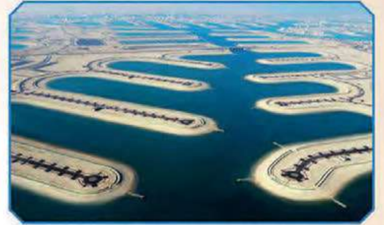
منظر عام للممرات المائية - المرحلة الرابعة

يهم شركة لآلي الكويت العقارية الشركة المطورة لمشروع مدينة صباح الأحمد البحرية بناء على العقد رقم (23395) الموقع من وزارة المالية بتاريخ 2002/8/21 أن تعلن لعموم الشعب الكويتي وللمهتمين كافة أنها وبفضل من الله وتوفيقه انتهت من كامل أعمال البنية التحتية للمرحلة الرابعة (A4) لمشروع مدينة صباح الأحمد البحرية "مدينة لؤلؤة الخيران السكنية سابقاً"، وأنها قد قامت بتاريخ 2015/6/21، بإخطار جميع وزارات الدولة ذات الصلة، والجهات الحكومية وهي: