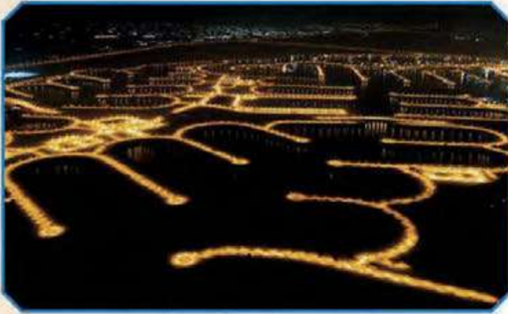
المرحلة الرابعة ليلاً

بتاريخ 2015/10/20 صدرت بحمد الله وتوفيقه رخصة البناء لقسائم المرحلة الرابعة (A4) من قبل السادة بلدية الكويت