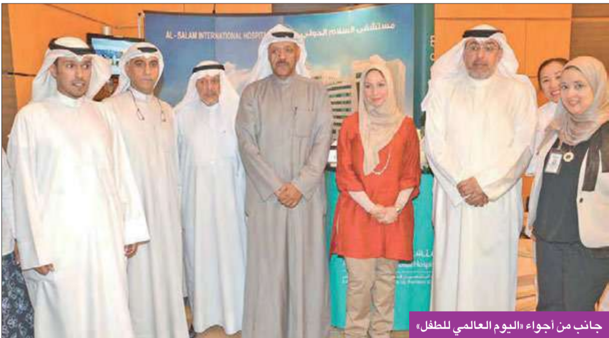
جانِب من أجواء «اليوم العالمي للطفل»

الوزارة المساعد للشؤون الفنية د. قيس الدويري في قاعة سلوى صباح الأحد ببنّقد المارينا. وتنووعت مشاركة المستشفى بين تقديم الخدمات الطبية وإثارة الوعي الصحي؛ إذ تم تقديم فحوصات طبية متنوعة شملت فحص السكري، وضغط