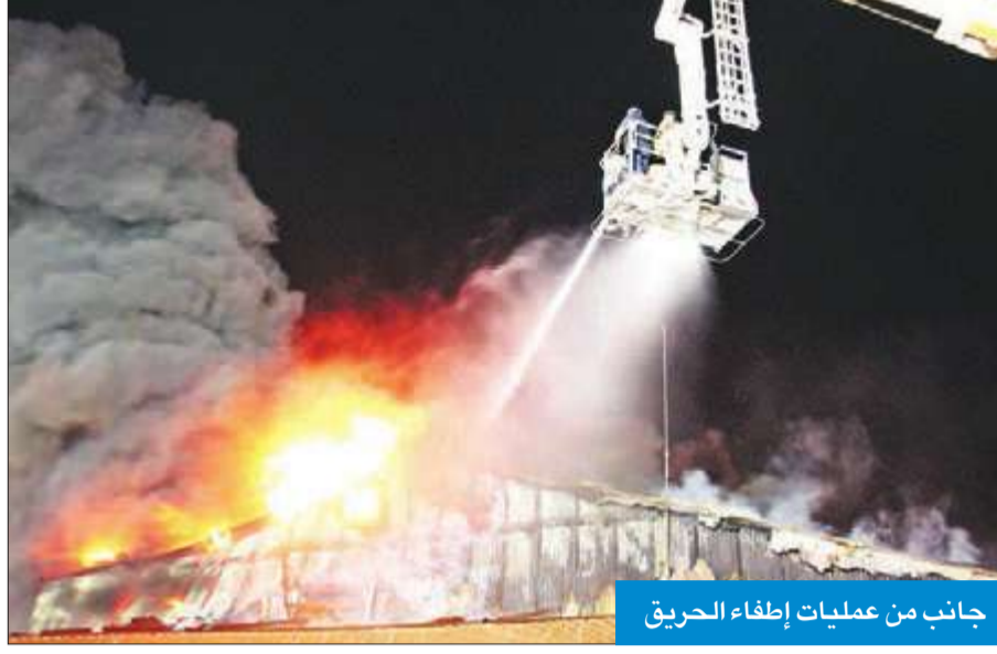
جانب من عمليات إطفاء الحريق

وأشار إلى أن النيران انتقلت إلى مخزنين مجاورين لتتسع رقعة الحريق بفعل سرعة الرياح لتزداد معها معاناة رجال الإطفاء الذين سيطروا على الحريق بعد حوالي 10 ساعات من العمل المتواصل. وأوضح أن المساحة الإجمالية للمخازن التي اندلعت بها النيران تبلغ 3 آلاف متر مربع، في حين قدرت المواد الغذائية المخزنة بالآلاف الأطنان والتي تبلغ قيمتها المادية ملايين الدنانير، مشيراً إلى أن ضباط وحدة تحقيق الحوادث انتقلوا إلى موقع البلاغ لمعرفة أسباب اندلاع الحريق، والذي كان متابعاً من وزير الدولة لشؤون مجلس الوزراء الشيخ محمد العبدالله، حيث كان على اتصال مع قيادات الموقع لمتابعة تطورات الحادث أولاً بأول. وذكر العقيد الأمير أن المدير العام للإدارة العامة للإطفاء اللواء خالد المكراد ونائب المدير العام لشؤون المكافحة العميد جمال البليهيس ومدير العمليات المركزية العميد طارق السبتي كانوا موجودين في موقع الحادث، وأشرفوا على عمليات المكافحة، لافتاً إلى أن عمليات التفتيش مستمرة بحثاً عن مصادر اللهب تحت الأنقاض.