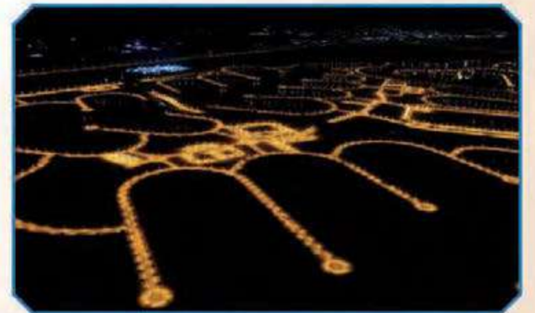
لقطة أخرى للمرحلة الرابعة ليلاً

لقد عاهدنا الله ثم صاحب السمو الأمير الشيخ / صباح الأحمد الجابر الصباح حفظه الله ورعاه