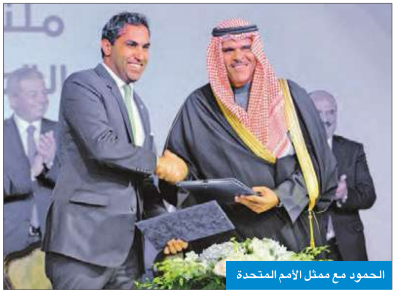
الحمود مع ممثل الأمم المتحدة

افتتح «ملتقى التطوع الشبابي لمواجهة التطرف»