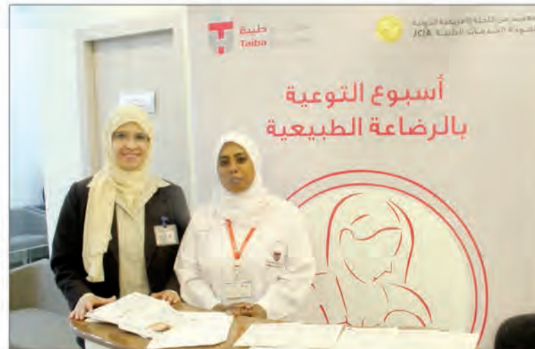
أسبوع التوعية بالرضاعة الطبيعية

شاركت مستشفى طيبة في أسبوع التوعية للرضاعة الطبيعية الكويتي في 22 نوفمبر لغاية 26 نوفمبر وذلك ضمن المبادرة العالمية للتشجيع على الرضاعة الطبيعية.