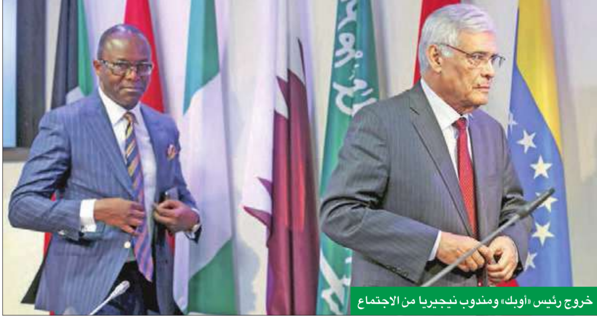
خروج رئيس «أوبك» ومندوب نيجيريا من الاجتماع

● السعودية : أسعار النفط ستتحسن في المستقبل