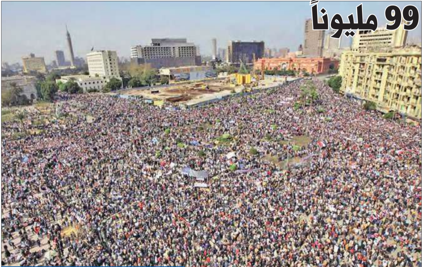
عشرات الآلاف المصريين خلال تظاهرة في «ميدان التحرير»

يذكر أن مصر تواجه أزمة الزيادة السكانية منذ عهد الرئيس الأسبق حسني مبارك الذي أطلق مشروع «تنظيم الأسرة» للحد من النمو السكاني. وكان الرئيس الحالي عبدالفتاح السيسي اعتبر أزمة الزيادة السكانية الأخطر على البلاد. وفي خطاب سابق له شدد على ضرورة خفض المصريين لمواليدهم.