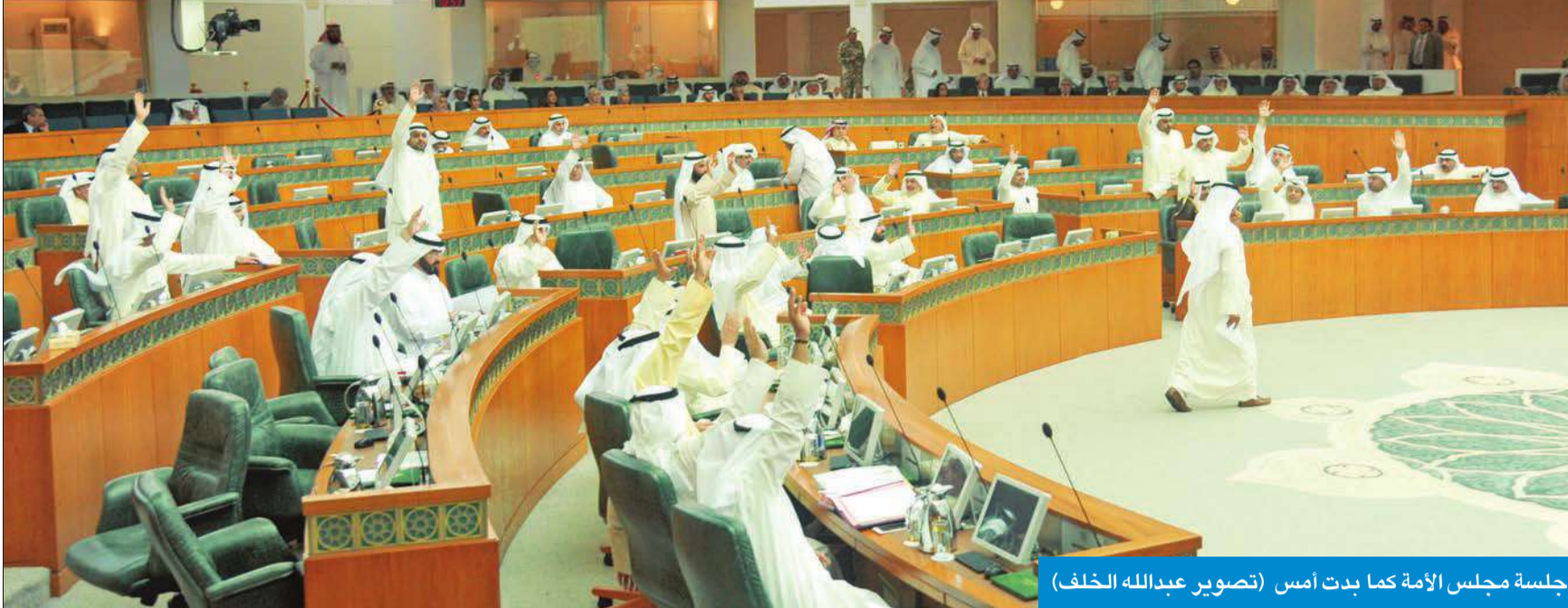
جلسة مجلس الأمة كما بدت أمس

● ساعتان اليوم لمناقشة الوضع الرياضي بعد الانتهاء من مناقشة «الخطاب»