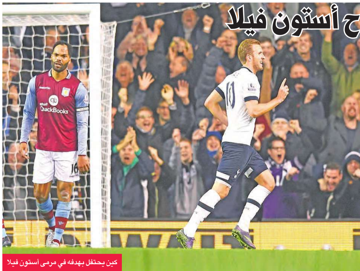
كين يحتفل بهدفه في رمي أستون فيلا

ورفع الفريق الذي حل سابعاً الموسم الماضي، وخرج من الدور التمهيدي