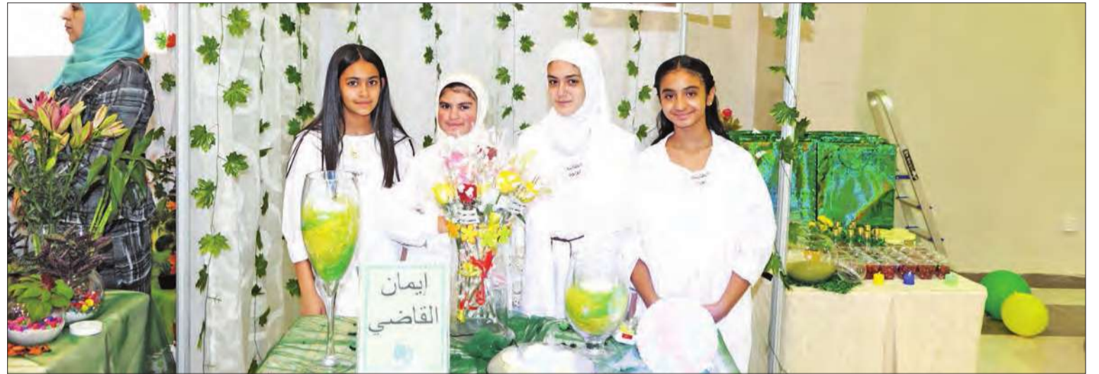
عدد من الطالبات المشاركات في المعرض العلمي