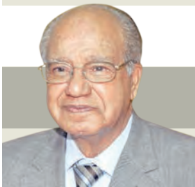
بِقلم عبدالله النباري