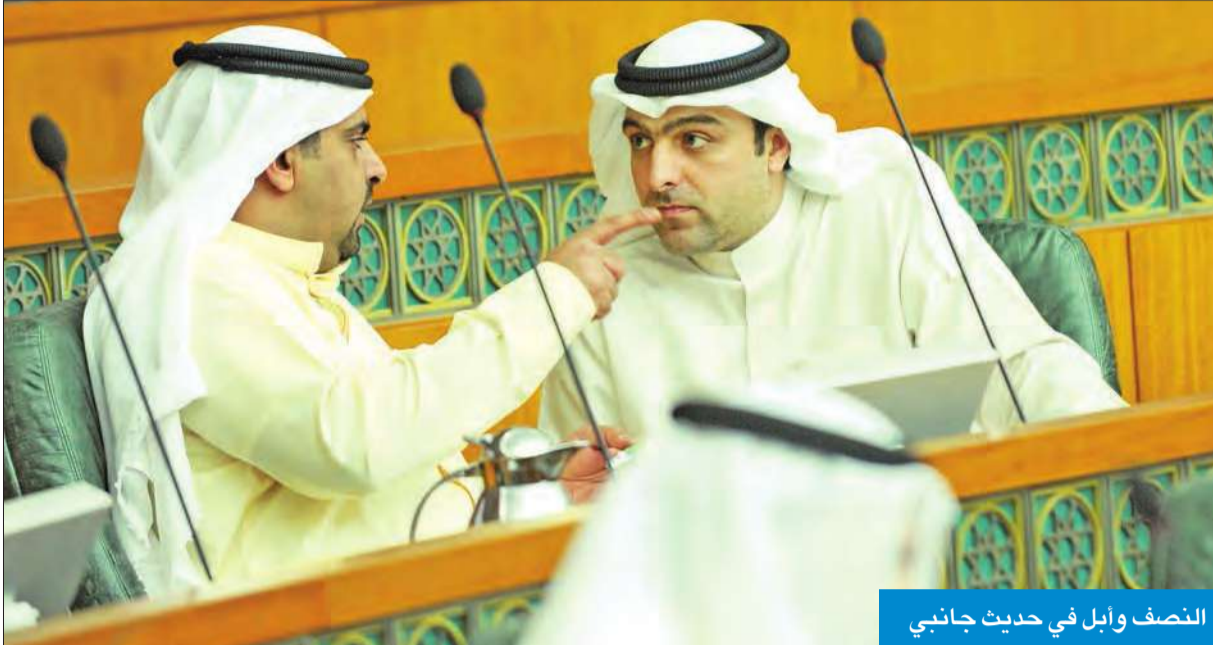
النصف وابل في حديث جانبي

ولنجعل ملف التحديات الداخلية همنا الأول ولننعم بالحرية والود والتراحم. وحذر دشني من مغبة زيادة النمط الاستهلاكي في الصرف، لذا قام سموه بدعوتنا لاتخاذ اجراءات عاجلة والتصدي للفساد الذي استشرى بالمجتمع، وسمو الأمير يريد تحملنا امانة المسؤولية وعدم المساس بالعيش الكريم وتوفير حياة كريمة بشتي السبل، مشددا على ضرورة طي صفحة البدون السوءاء التي بلومنا الجميع عليها. وأكد دشني ان الكويت رائعة تختلف عن العالم حيث يحكمنا الدستور بينما شغل «الجالا جلا» غير موجود بالكويت.