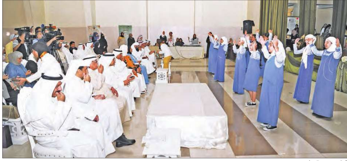
فقرة ترحيب بالحضور