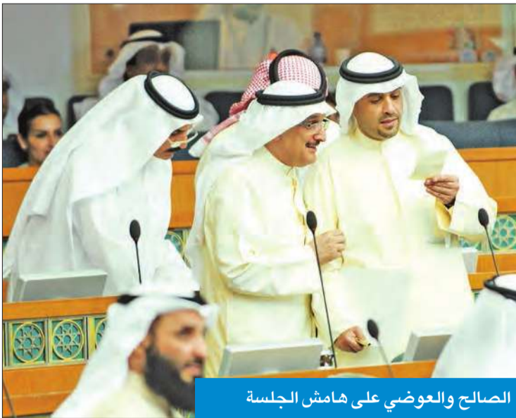
الصالح والعوزي على هامش الجلسة