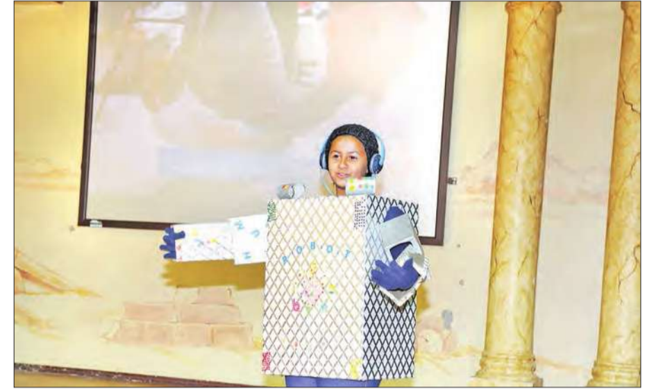
عرض توضيحي للمقتنيات الإلكترونية