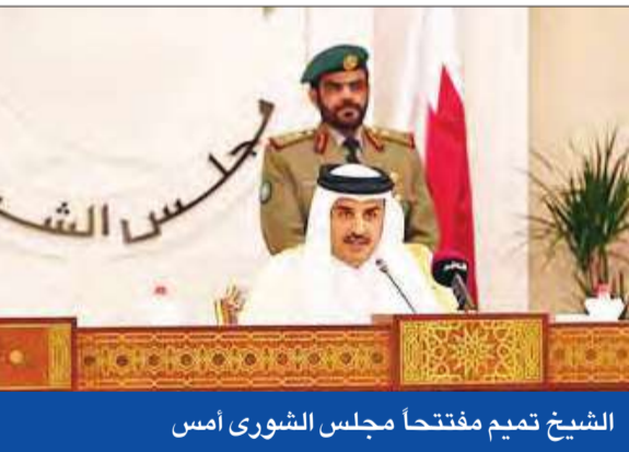
الشيخ تميم مفتتحاً مجلس الشورى أمس

قال أمير دولة قطر الشيخ تميم بن حمد آل ثاني، أمس، إن بلاده تواصل جهودها مع دول مجلس التعاون الخليجي لتعزيز التعاون بينها على جميع المستويات وتطوير البنيات عمل المجلس لمواجهة التحديات الإقليمية والعالمية، مؤكداً أن قطر قد تراجع وتقيم أفعالها لكي تصبح أخطاءها إذا وقعت، مؤكداً أنها لا تغير مبادئنا.