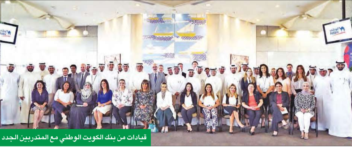
قيادات من بنك الكويت الوطني مع المدربين الجدد

وتميزت بمعياره الأكاديمية المرتفعة وتطبيقاته العملية التي تواكب آخر التغييرات في بيئة الأعمال، وأحدث تقنيات الإدارة الفعالة.