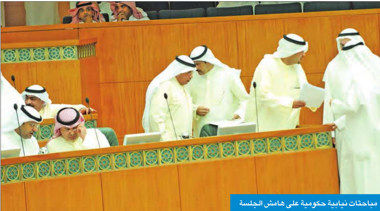
مباحثات نيابية حكومية على هامش الجلسة

● التمديد 3 أشهر للجنة التحقيق في «استثمارات لندن» ● تشكيل لجنة مؤقتة للأسرة والمرأة