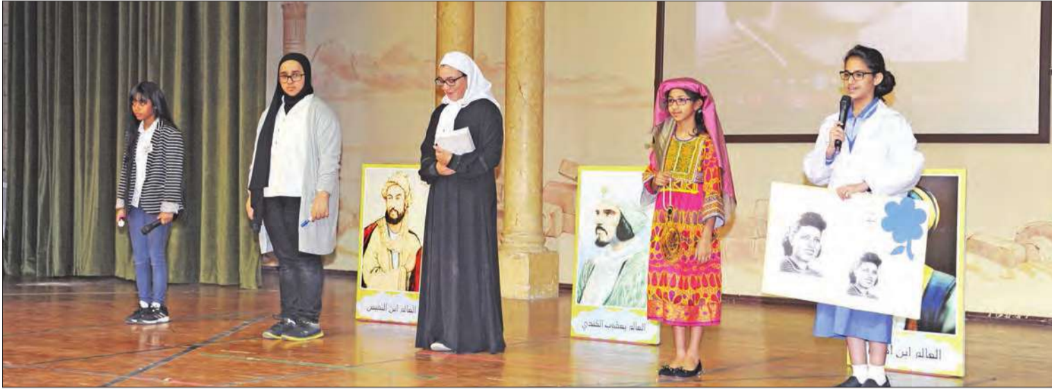
أداء مسرحي لطالبات مدرسة القادسية