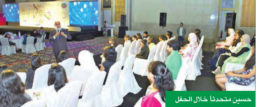
حسين متحدراً خلال الحفل

من الجوائز الوطنية والدولية المرموقة في مجالات الإمتياز الصناعي، وإنجازات التنمية المستدامة، والريادة المؤسسية، والتصميم في الصحة والسلامة والبيئة، والمسؤولية المجتمعية للمؤسسات، والشراكات ذات البعد العالمي، واستراتيجيات تطوير دورها الوطنية وغيرها من الجوائز.