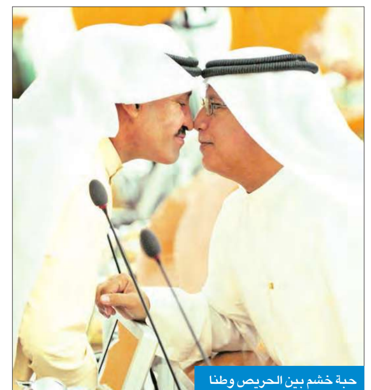
حبة خشم بين الحريص وطنا

المجلس يحتاج إلى تشريعات جديدة لمنع تكرار قضية الإيداعات