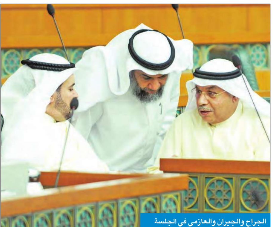
الجراح والجبران والعازمي في الجلسة