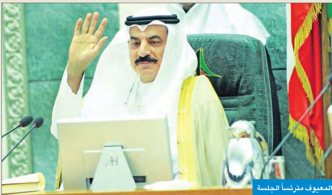
المعيوف مترشفاً للجلسة

وأكد المعيوف صواب الخطوة التي اتخذتها الحكومة في تحويل وزارة الخارجية لتمام الإجراءات في فسخ العقد المبرم بين الحكومة الكويتية والمجلس الأولمبي الآسيوي.