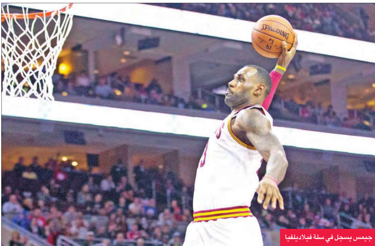
جيمس يسجل في سلة فيلادلفيا

وسجل دانكن الذي يخوض موسمه التاسع عشر، 16 نقطة مع 10 متابعات و6 تمريرات حاسمة ليساهم بشكل فعال بفوزه الـ 954 مع سيرز مقابل 381 هزيمة، متفوقاً بذلك على صانع الألعاب الأسطوري جون ستاكوتون الذي حقق 953 فوزاً مع يوتا جاز مقابل 381 هزيمة.