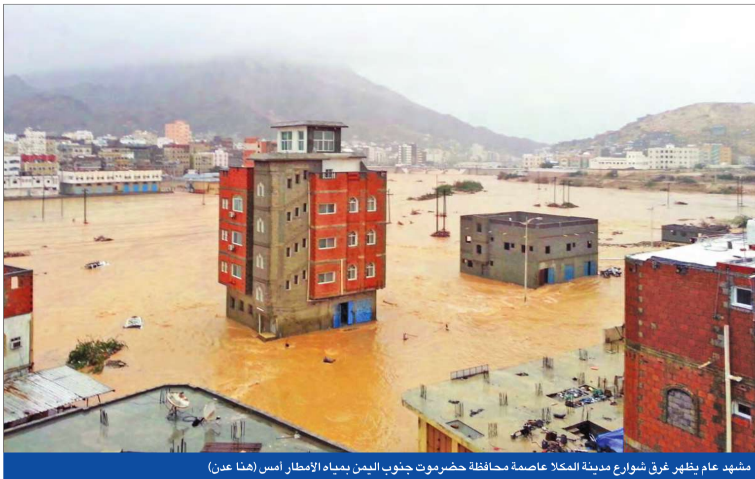
مشهد عام يظهر غرق شوارع مدينة المكلا عاصمة محافظة حضرموت جنوب اليمن بياه الأمطار أمس (هنا عدن)

● فقدان الاتصال بـ7 سفن صيد و30 قارباً ● ولد الشيخ يبحث آخر المستجدات مع العطية بالدوحة