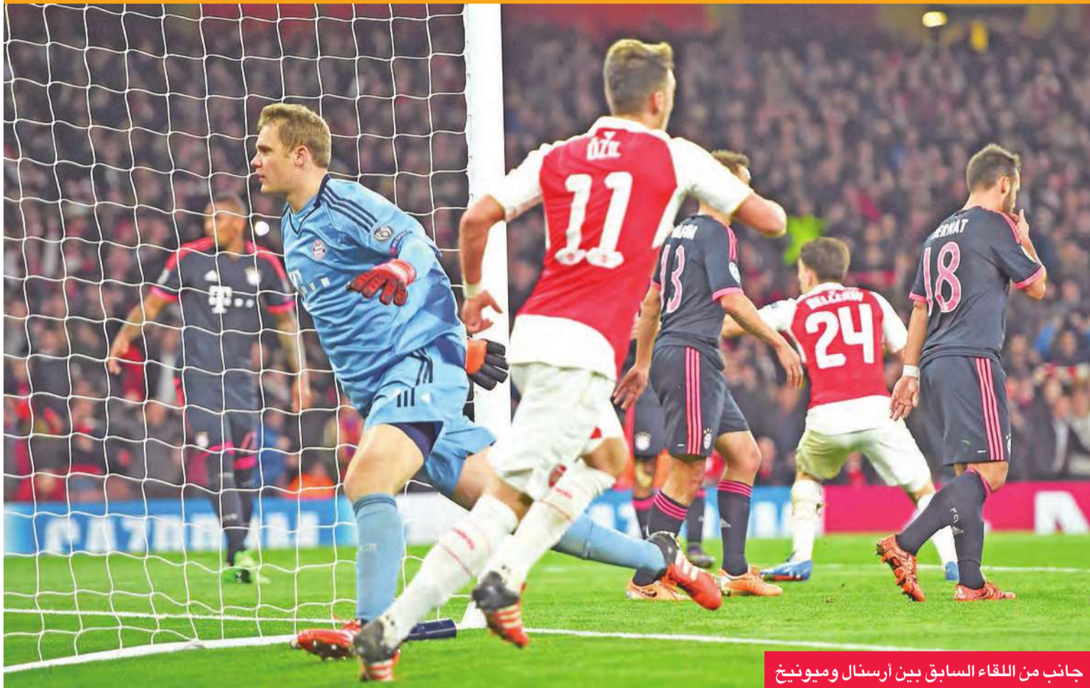
جانب من اللقاء السابق بين أرسنال وميونخ

من الدور الرابع على يد ستوك سيتي، كما اكتفى النادي اللندني بفوز واحد في دوري أبطال أوروبا مقابل هزيمة وتعادل في ثلاث مباريات، ما يؤكد ان مورينيو وصل الى مرحلة فقدان القدرة على تحفيز لاعبيه ويهدد الى امكنة الرحيل عن النادي الذي عاد اليه عام 2013 بعدما أشرف عليه للمرة الاولى بين 2004 و 2007.