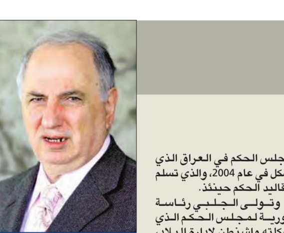
الجلبى في صورة تعود لعام 2005

وفي السياق، أكدت النائبة في البرلمان عن ائتلاف دولة القانون الذي يتزعمه رئيس الوزراء السابق نوري المالكي، عواطف نعمة أمس، أن المالكي لو حصل على التفويض الذي منح لرئيس الوزراء الحالي حيدر العبادي، لكان العراق أفضل حالا بكثير مما هو عليه الآن. وبيّنت نعمة، أن تفويض المرجعية والشعب والمواطنين للرئيس السابق علي صالح من جهة أخرى، في حين تدور معارك في جبهة يتنازع آخر اهم المناطقات التي ينتشر فيها الحوثيون غربي محافظة مارب. وتساعدت الموجات في العراق في