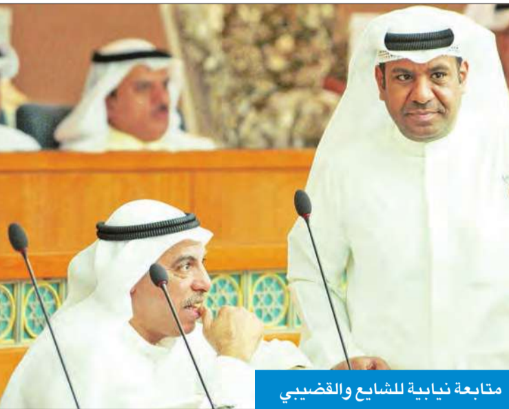
متابعة نيابية للشايح والقضيي