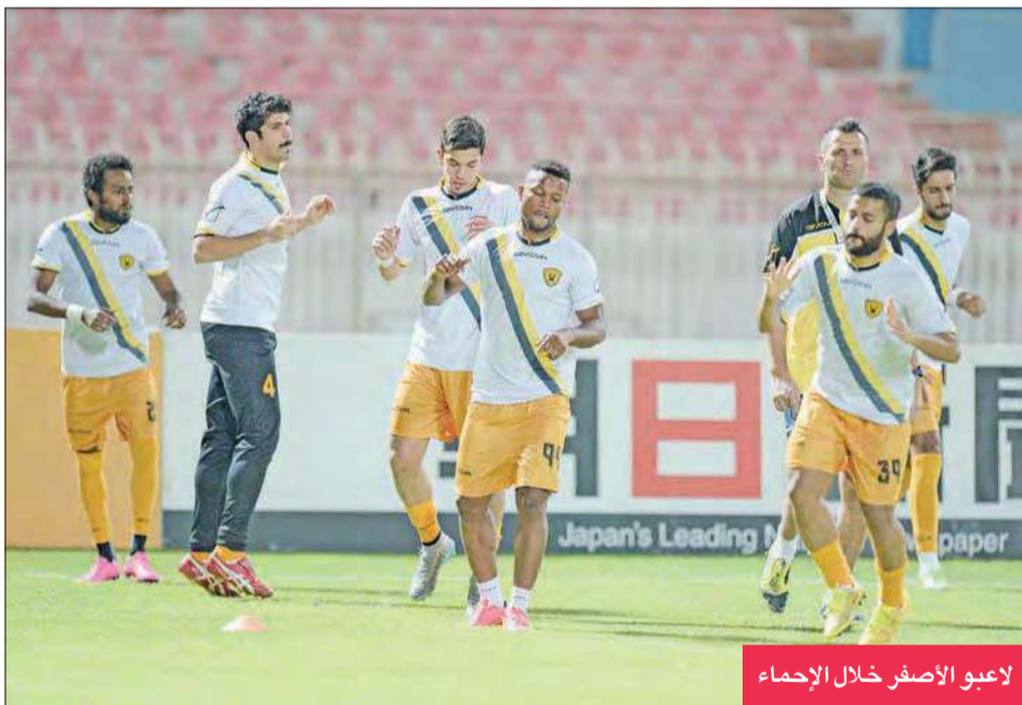
لاعبو الأصفر خلال الإجماع

يعاني الفريق الأول لكرة القدم بنادي القادسية نقصاً شديداً في الصفوف بسبب استعانة ثلاثة منتخبات بلاغني النادي، حيث بلغ عدد حضور تدريبات الأصفر 13 لاعباً فقط، في ظل استدعاء المنتخب الأول 9 لاعبين، ومثلهم في المنتخب الأولمبي، وأيضاً منتخب الشباب.