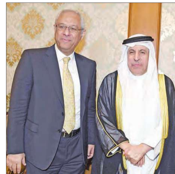
السفير المصري مستقبلا نظيره السعودي عبدالعزيز الفايز