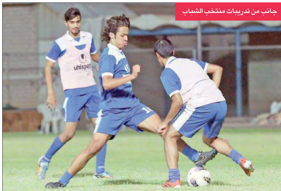
جانب من تدريبات منتخب الشباب