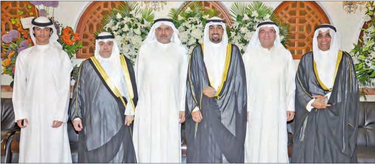
د. عادل الصبيح وزير النفط السابق وعبد المجيد الشطي مهنتين