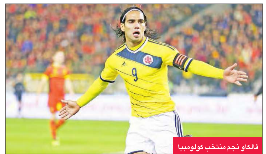
فالكاو نجم منتخب كولومبيا

تصدر النجمان الكبيران جيمس رودريغيز وراداميل فالكاو غارسيا قائمة المنتخب الكولومبي لكرة القدم التي أعلنها الأرجنتيني خوسيه بيكرمان المدير الفني للفريق استعدادا للمبارتين أمام منتخب بيرو وأوروغواي في بداية التصفيات المؤهلة لبطولة كأس العالم 2018. وحامت بعض الشكوك حول إمكانية انضمام اللاعبين لقائمة الفريق بسبب الإصابة التي تعرض لها جيمس رودريغيز والتي جرمته من خوض المباريات الأخيرة مع فريقه ريال مدريد