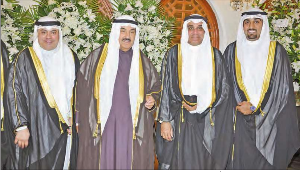
... وسمو الشيخ ناصر المحمد مهنتنا