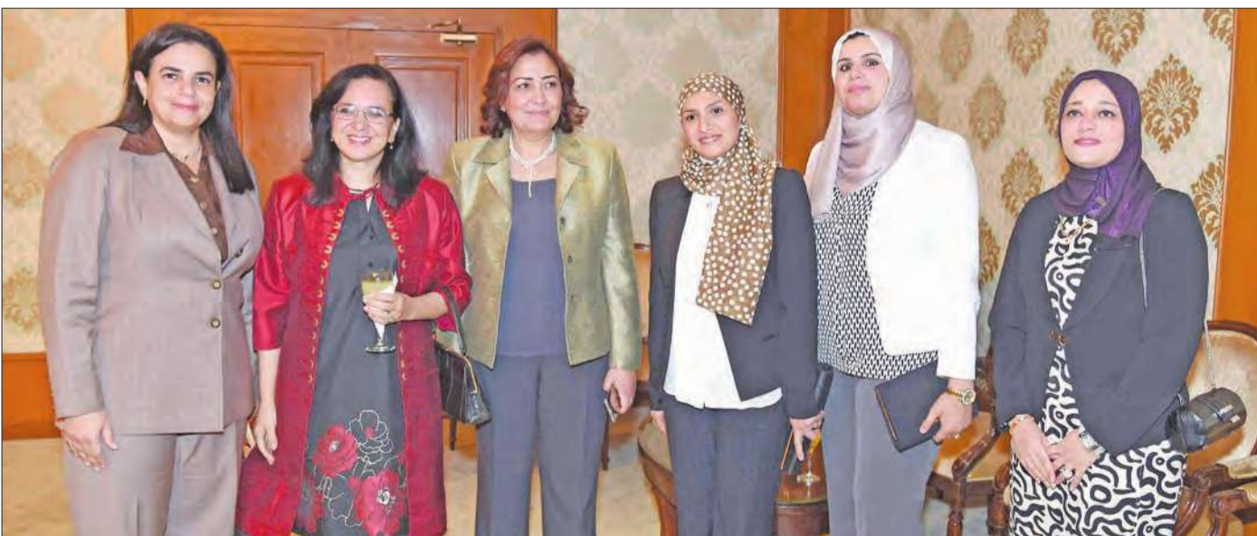
جانب من المهنتات