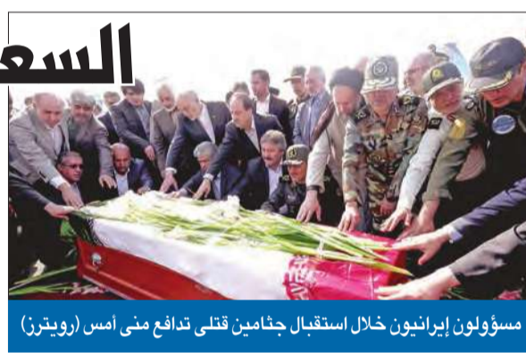
مسؤولون إيرانيون خلال استقبال جنامين قتلى تدافع منى امس

تمكنت السلطات الأمنية السعودية من ضبط مصنع بالعاصمة الرياض يستخدم لصناعة المتفجرات والأحزمة الناسفة، وأوقفت سوريا وفلبينية كانا يعملان فيه. وقال المتحدث باسم وزارة الداخلية، إن السوري