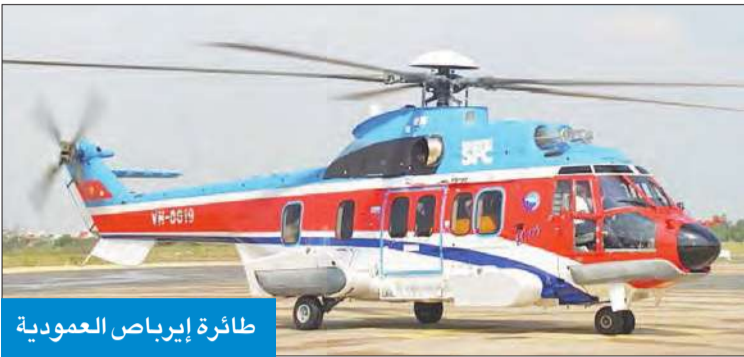
طائرة إيرباص العمودية

الفهد: نقلة نوعية في تطوير الدوريات الجوية وزيادة مهامها الأمنية