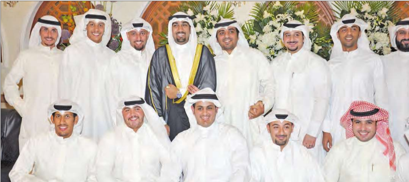
العريس يتوسط أصدقاءه