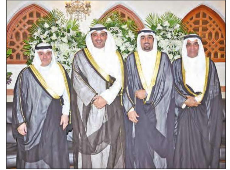
الشيخ محمد عبدالله مهنتنا