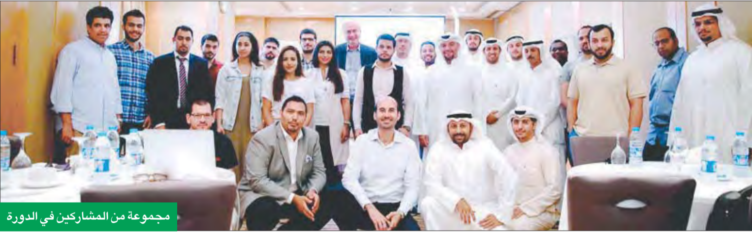
مجموعة من المشاركين في الدورة

الفائزون يشاركون في نهائيات تحدي تطبيقات النقال بدبي