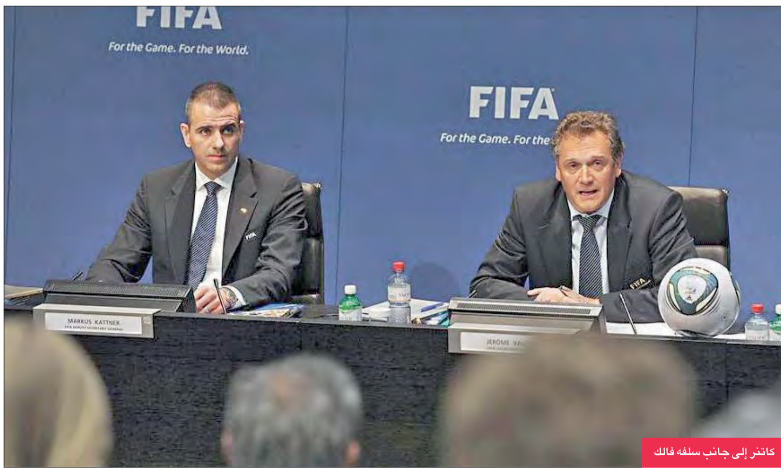
كانتر إلى جانب سلفه فالك

كانتر على خطى «فالك» يطالب بتعديل القوانين!