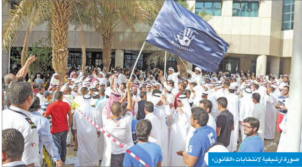
صورة أرشيفية لانتخابات «القانون»

تتنافس اليوم قائمتا «المستقلة» و«المتحدون» على مقاعد الهيئة الإدارية في جمعية القانون بكلية الحقوق. في ظل بلوغ عدد من يحق لهم التصويت 2808 مقيدون بكشوف الاقتراع.