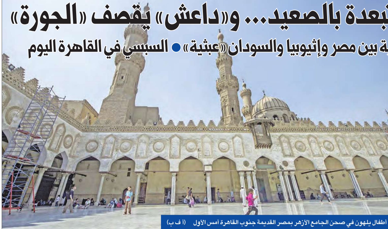
اطفال يلهون في صحن الجامع الأزهر بمصر القديمة جنوب القاهرة أمس الأول

الاستمرار في الأعمال الإنسانية لسد «النهضة الإثيوبية» المائي، الذي تقول القاهرة إنه سيخضع من حصتها في مياه النيل، حيث وجهت مصر رسمياً للدعوة لكل من السودان وإثيوبيا للاجتماع في القاهرة على مستوى الخبراء، اليوم، وعلى مدار يومين وبحضور الشركتين الاستشاريتين الفرنسية والهولندية، لمناقشة النقاط الخلافية، تمهيدا لإجراء الدراسات لتحديد تأثيرات إنشاء السد على مصر والسودان.