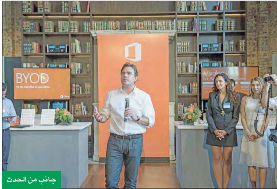
جانب من الحدث

تقدم النسخة الأحدث من Office مع Windows 10 أفضل الحلول المتكاملة لأداء العمل، حيث تعمل تطبيقات Office 2016 بشكل رائع مع نظام التشغيل Windows 10. بما في ذلك تطبيق Sway الجديد الخاص بـ Windows 10، لابتكار قصص تفاعلية يمكن مشاركتها وتبديها وتبديها على أي شاشة.