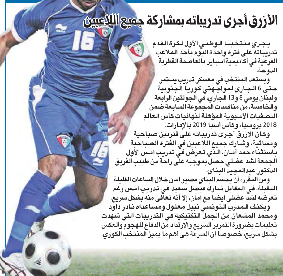
الأزرق أجرى تدريباته بمشاركة جميع اللاعبين

يجري منتخبنا الوطني الأول لكرة القدم تدريباته على فترة واحدة اليوم بأحد الملاعب الفرعية في أكاديمية أسباير بالعاصمة القطرية الدوحة.