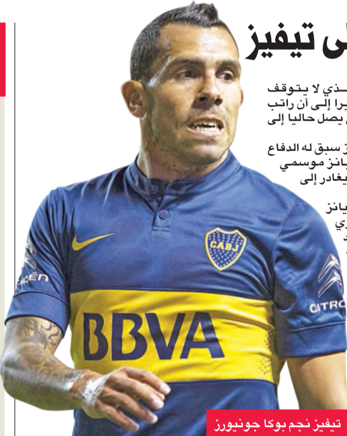
تيفيز نجم بوكا جونيورز