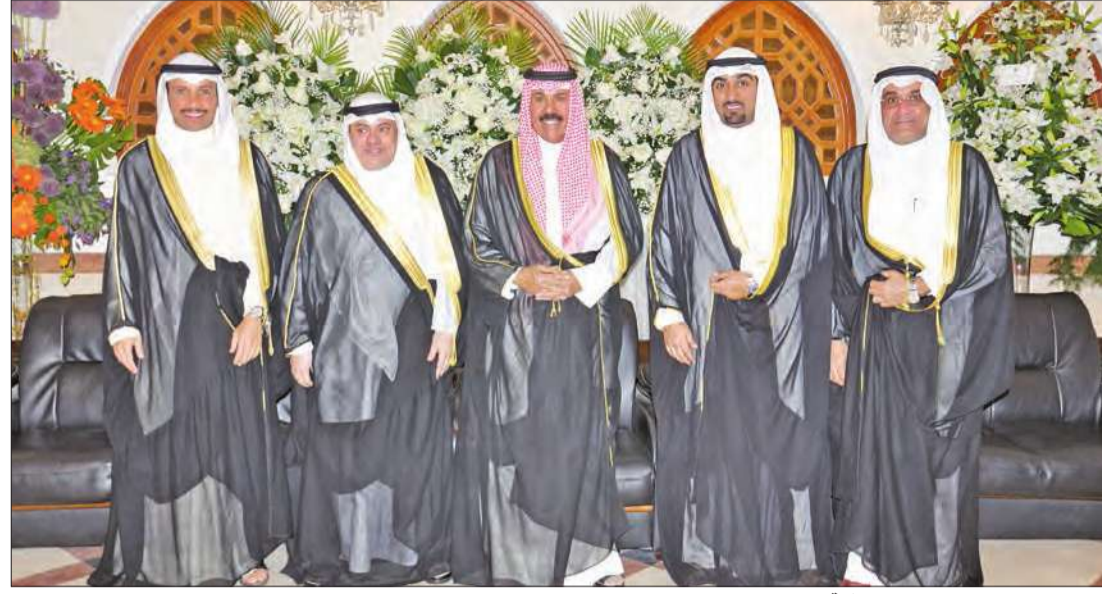
سمو ولي العهد ورئيس مجلس الأمة يهنئان