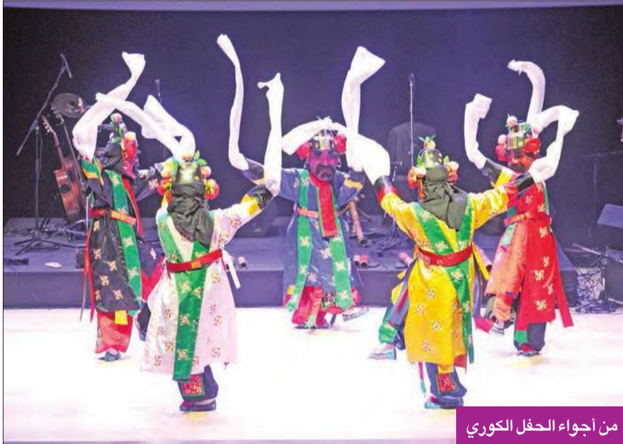
من أجواء الحفل الكوري

من موسيقى الثقافة الكورية التقليدية والحديثة، والاحتفال بالصدقة بين بلدينا. وأضاف يونام: «أنا على ثقة أن فعالية اليوم ستساعد على تقوية أواصر الصداقة والعلاقات الثنائية بين كوريا وكويت، عبر تعزيز التفاهم المشترك من خلال الثقافة والفن». وفي الختام عبر عن جزيل شكره وامتنانه للمجلس الوطني للثقافة والفنون والآداب، لدعمه وتعاونه المخلص مع سفارة جمهورية كوريا في إعداد الفعالية.