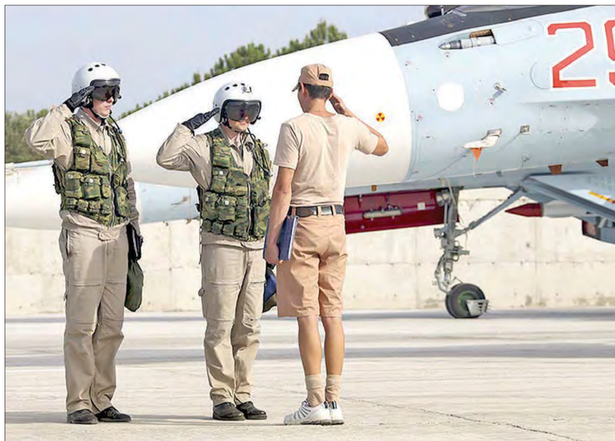
طاقم طائرة سوخوي الروسية يأخذ الإذن للقيام بمهمة قتالية انطلاقاً من قاعدة حميميم الجوية قرب اللاذقية أمس الأول