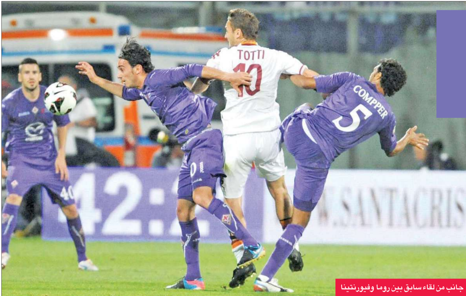
جانب من لقاء سابق بين روما و فيورنتينا