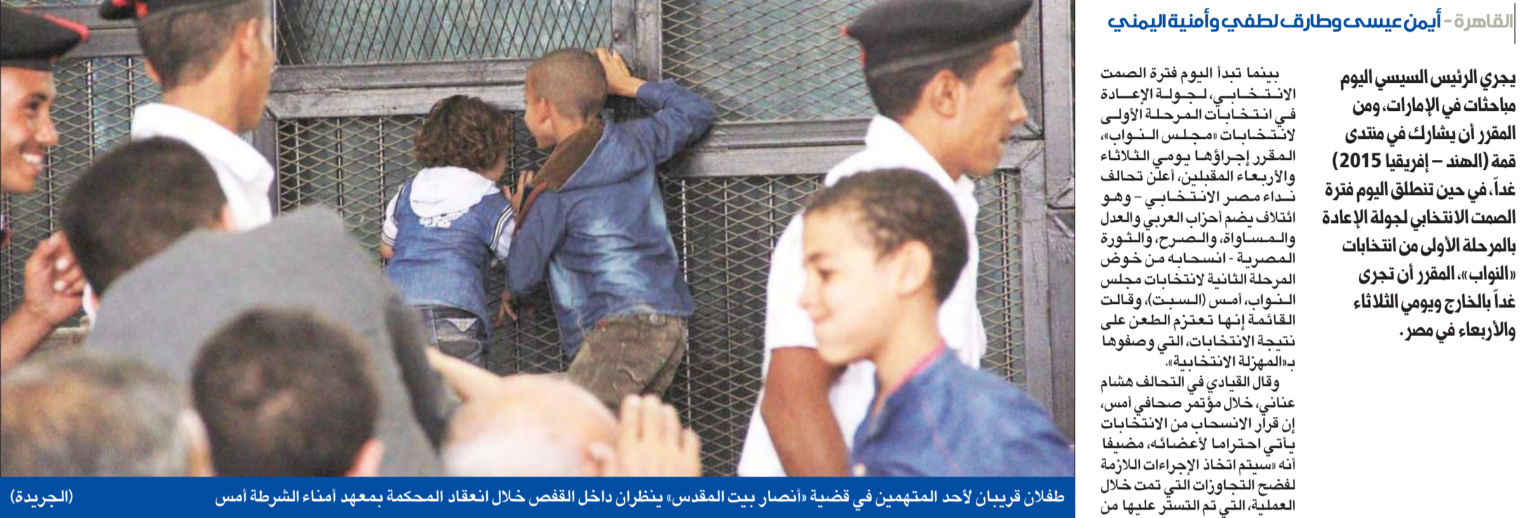
طفلان قريبان لأحد المتهمين في قضية «انصار بيت المقدس» ينظران داخل القفص خلال انعقاد المحكمة بمعهد امماء الشرطة أمس

ساعة من إعلان الجيش انفجار ناسفة في بسيينا، أمس الأول، قال مصدر أمني رفيع في وزارة الداخلية، إن شرطياً برتبة ملازم أول ومجندين اثنين، قتلوا في انفجار عبوة ناسفة استهدفت مدرعة شرطة، على الطريق الدائري في مدينة العريش، موضحاً أن الناسفة تسببت في إصابة 8 مجندين. في السياق، لقيت سيدة مصريها وأصيب مواطنان بعد سقوط قذيفة مجهولة المصدر، على المنزل الذي يقيمون فيه في غرب مدينة رفح بشمال سيينا. وقال مساعد وزير الداخلية الأسبق، محمد زكي، إن انفجار ناسفة بسيينا لا يعني وجود موجبات مباشرة على الأرض مع الجماعات الإرهابية، موضحاً لـ «الجريدة» أن عملية «حق الشهيد» عززت وجود القوات على الطرق الرئيسية والفرعية، وأفقدت التخفيمات الإرهابية قدرتها على التحرك.