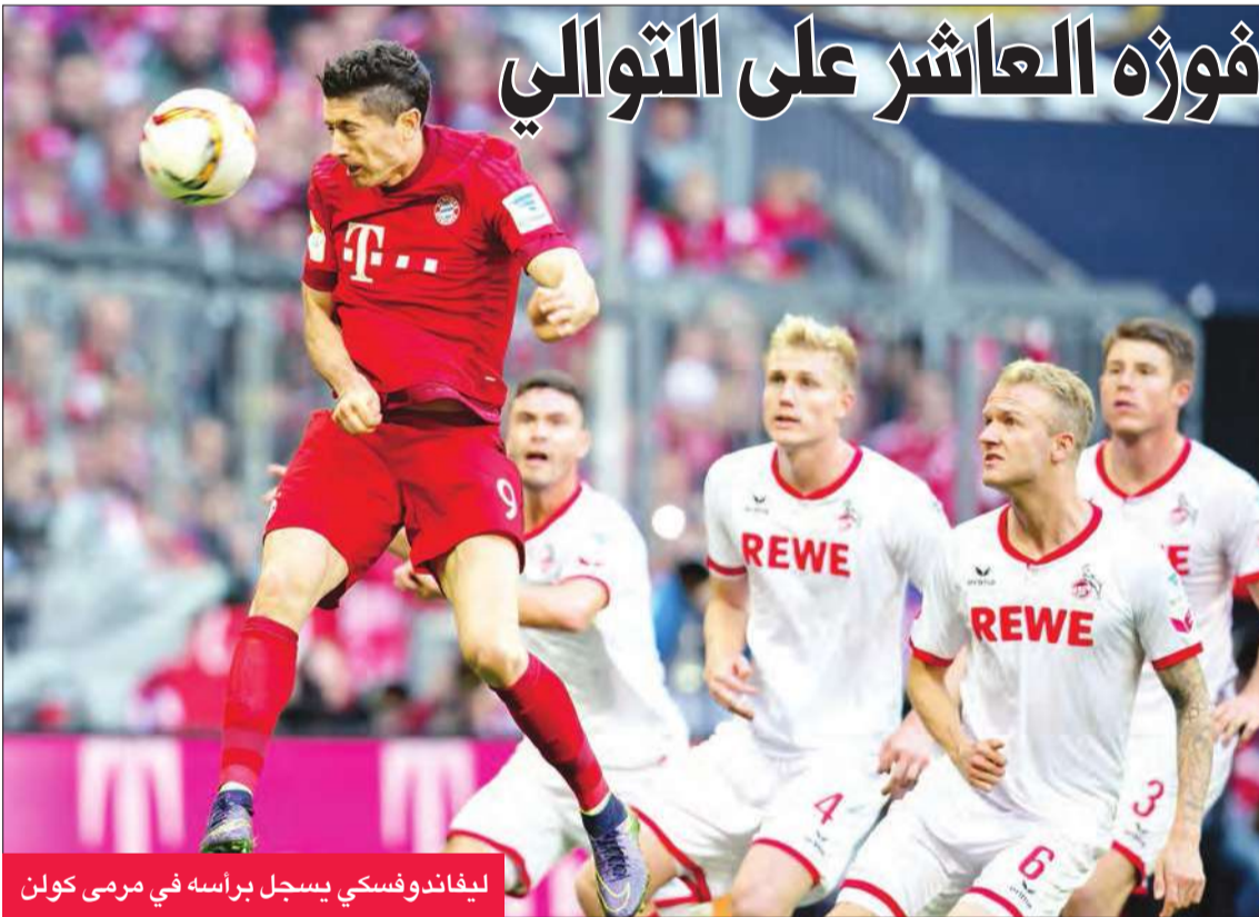
ليفاندوفسكي يسجل برأسه في مرمى كولن