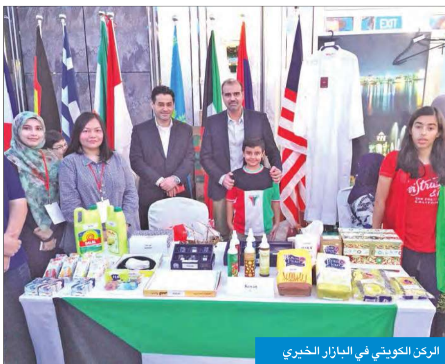
الركن الكويتي في البازار الخيري

شاركت سفارة الكويت في جمهورية سنغافورة، أمس، إلى جانب 44 دولة في البازار الخيري الدبلوماسي برعاية وزير الخارجية السنغافوري فيفان فلاكر بشنان. وقال السفير الكويتي لدى سنغافورة يعقوب يوسف السند في تصريح إن الكويت حريصة على هذه المشاركات القيمة ذات الطابع الإنساني والخيري. وأضاف السند أن هذا البازار يعد فرصة لإظهار الخيرات والثقافة الكويتيين للشعب السنغافوري معرباً عن الشكر للشركات الكويتية التي ساهمت في هذا البازار. ويقام البازار الخيري الدبلوماسي الذي نظمه السلك الدبلوماسي والقنصلي المعتمد في سنغافورة يوماً واحداً ويهدف إلى إبراز الطابع الثقافي والمجتمعي للدول المشاركة.