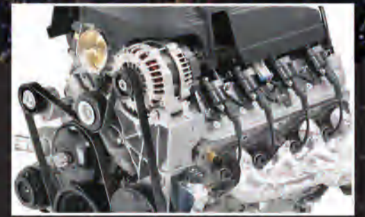
محرك سعة 5.3 لتر