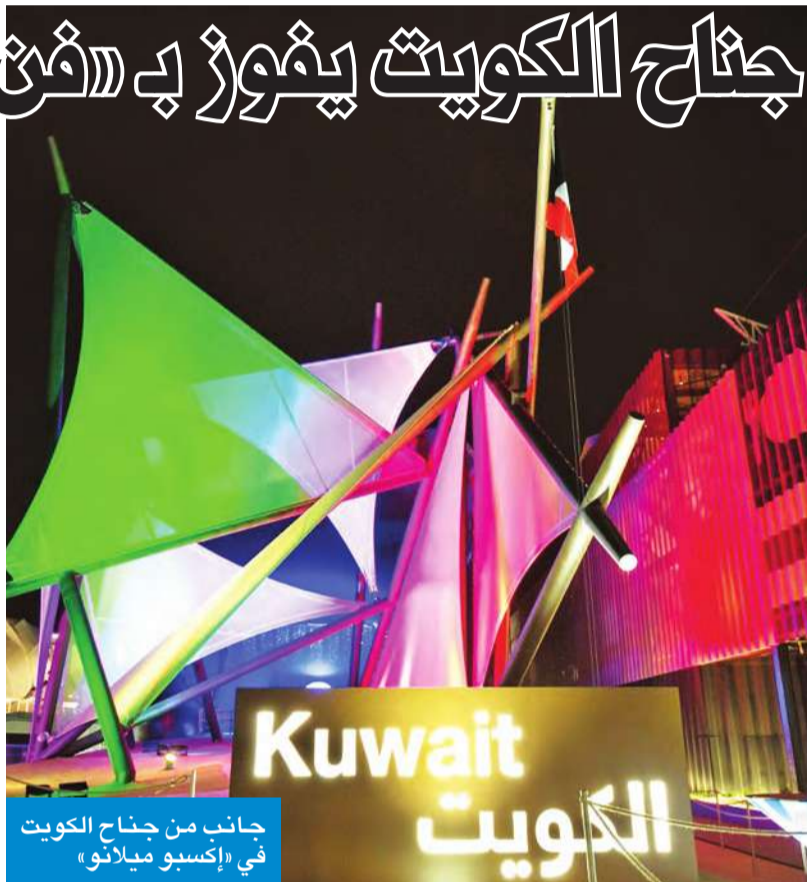
جانب من جناح الكويت في «إكسبو ميلانو»