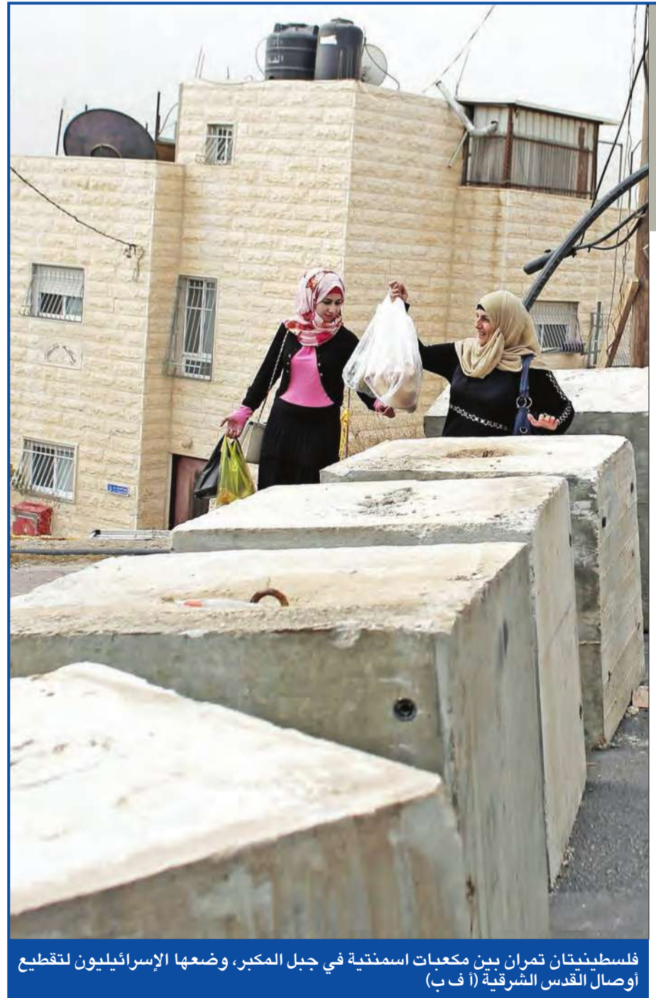
فلسطينيان تمران بين مكعبات اسمنتية في جبل المكبر، وضعها الإسرائيليون لتقطع أوصال القدس الشرقية

اعتقلت السلطات في جزر المالديف أمس نائب الرئيس أحمد أديب، على خلفية التخطيط لاغتيال الرئيس عبدالله يمين، الذي نجا بعد استهداف قاربه بقنبلة في 28 سبتمبر. وكتب وزير الداخلية عمر نصير، في تغريدة على «تويتر»، «اعتقال أديب وإيداعه في سجن دونيدو. والتهمة هي الخيانة العظمى»، وكان يمين عين أديب (33 عاماً) نائباً له قبل ثلاثة أشهر، بعد إقالة نائبه السابق محمد جميل، بتهمة الخيانة أيضاً. (ماليه - أ ف ب)