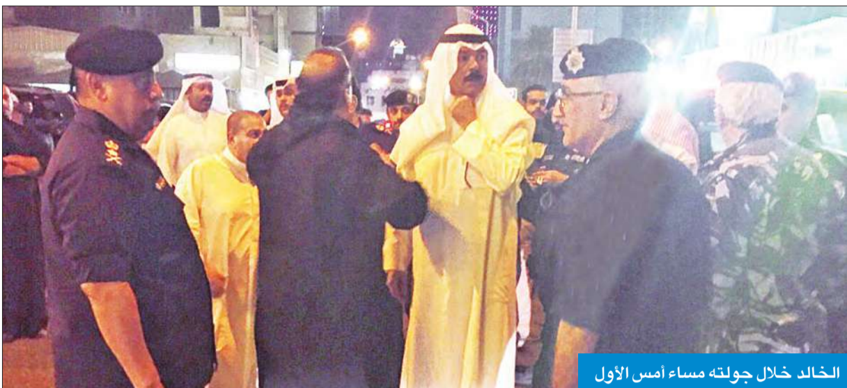
الخالد خلال جولته مساء أمس الأول

والحسينيات والمصلين لآداء الشعائر بأمن وسلامة، معاهدين سمو أمير البلاد "أن نظل على العهد أوفياء مخلصين لله وللوطن والأمير". وأشار البيان إلى أن الخالد أكد أن رجال الأمن دائماً وأبداً محل ثقة واعتزاز سموه، وهم العين الساهرة التي تحمي وتضمن أمن البلد الغالي ومواطنيه الكرام، في ظل الرعاية السامية لسمو الأمير وسمو ولي العهد الأمين وسمو رئيس مجلس الوزراء.