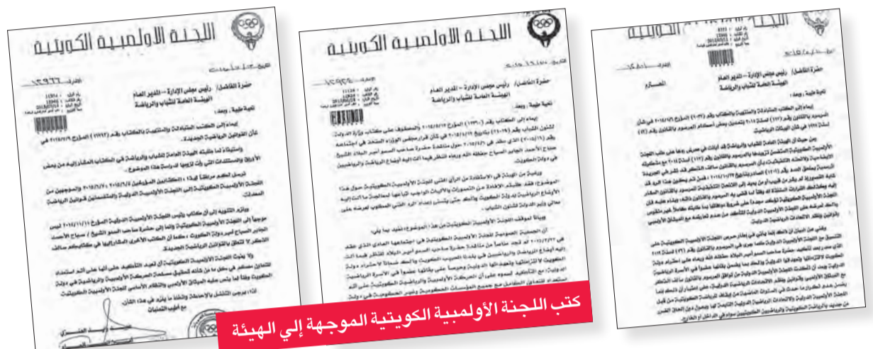
كتب اللجنة الأولمبية الكويتية الموجهة إلى الهيئة العامة للشباب والرياضة

الكويت وتعهداتها وحرصاً على استمرارها عضواً في الأسرة الرياضية الدولية، ثم تؤكد في الكتاب نفسه أنها «عمدت» على القانون الجديد على اللجنة الأولمبية الدولية. ولا يختلف الكتاب الذي أرسلته «الأولمبية الكويتية» إلى الهيئة العامة للشباب والرياضة، والذي تشير فيه إلى إرسال مرفق القانون الجديد إلى «الأولمبية الدولية» بتاريخ 5 يونيو 2015 و7 يونيو من العام نفسه والمتضمنين قوانين الرياضة بعد تعديدها.