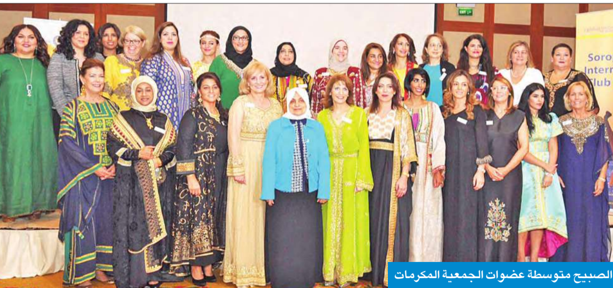
الصبيح متوسطة عضوات الجمعية المكرمات

أكدت وزيرة الشؤون الاجتماعية والعمل وزيرة الدولة لشؤون التخطيط والتنمية هذ الصباح اهتمام الوزارة بدعم العمل التطوعي والإنساني، لما له من إيجابيات عديدة في خدمة الوطن والمواطن، من خلال تعزيز التعاون لحل الكثير من القضايا العالقة، وتسييل الضوء على أي ظواهر سلبية في المجتمع.