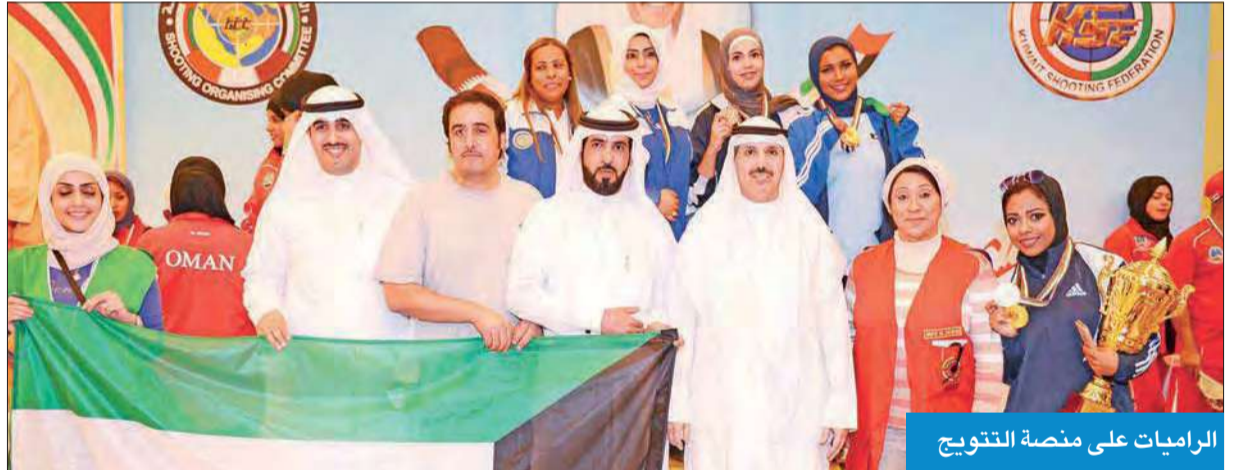
الرمايات على منصة التتويج

فرضت راميات الكويت تميزهن في اليوم الثاني لمنافسات كأس سمو ولي العهد والبطولة الخليجية الـ33 للرماية، اللتين تقامان على مجمع ميادين الشيخ صباح الأحمد الأولمبي للرماية، بإضافة 10 ميداليات متنوعة، منها أربع ذهبيتان وثلاث فضيات ومثلها برونزيتان.