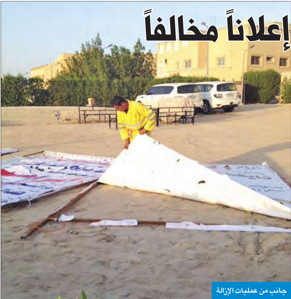
جانب من عمليات الإزالة

وأشارت بلدية الفروانية إلى أن الاعلانات التي توضع في الاتفاقات والطرق والميادين تؤذي المارة، وتسبب في وقوع كثير من الحوادث، لحجبها إلى جانب الاعلانات والملصقات على أعمدة الإنارة والمحولات الكهربائية والمرافق العامة المخالفة لقوانين