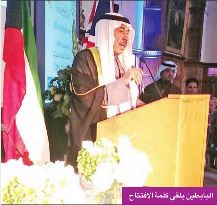
البابطين يلقي كلمة الافتتاح

انطلاق فعاليات الدورة الـ 15 «عالمنا واحد... والتحديات أمامنا مشتركة»