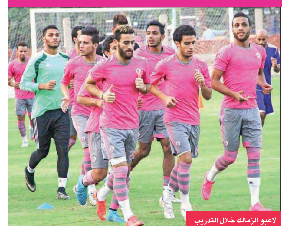
لاعبو الزمالك خلال التدريب