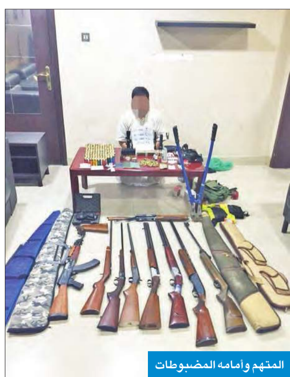
المتهم وأمامه المضبوطات

وذكر المصدر أن التحريات جارية لحصر مزيد من القضايا، حيث كان المتهم بحال غير طبيعية وقت ضبطه.