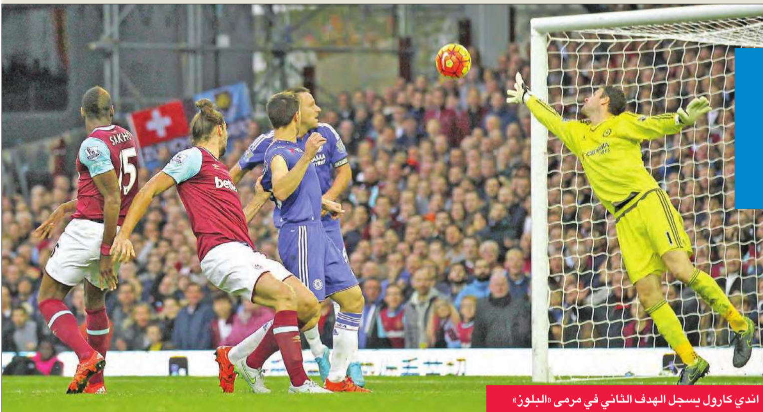
اندي كارول يسجل الهدف الثاني في مرمى «البلوز»