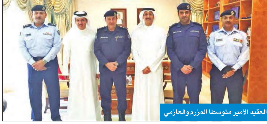
العقيد الأمير متوسطة المزرم والعاظمي

وأبدى استعداده للتعاون من أجل الوصول إلى الأهداف المرجوة وهي حماية الأرواح والممتلكات.