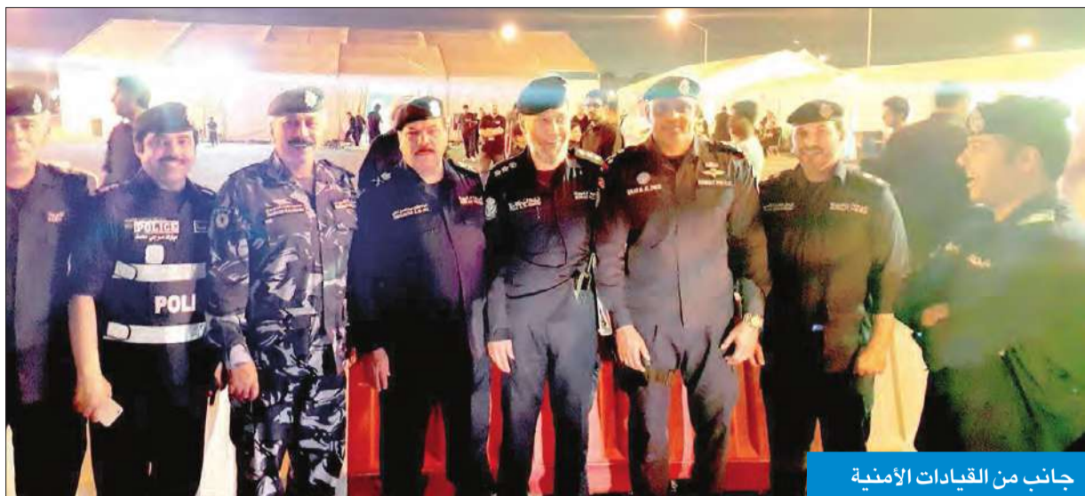
جانب من القيادات الأمنية

نقل تحيات الأمير وثناءه للفريق الميداني والمتطوعين