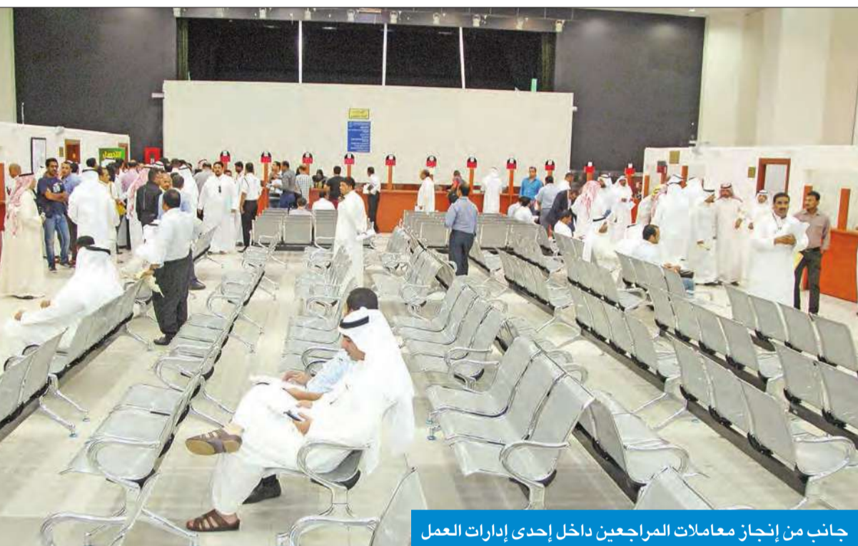
جانب من إنجاز معاملات المراجعين داخل إحدى إدارات العمل

وحول دور الهيئة في التصدي لتفشي ظاهرة الرشوة داخل الإدارات، ومحاربة التلاعبات أو تزوير الوثائق، يقول الموسى «عقب إنشاء الهيئة والبدء في ممارسة اختصاصاتها كانت حرصية كل الحرص على إحداث نقلة نوعية داخل إدارات العمل، من خلال تفعيل عملية الربط