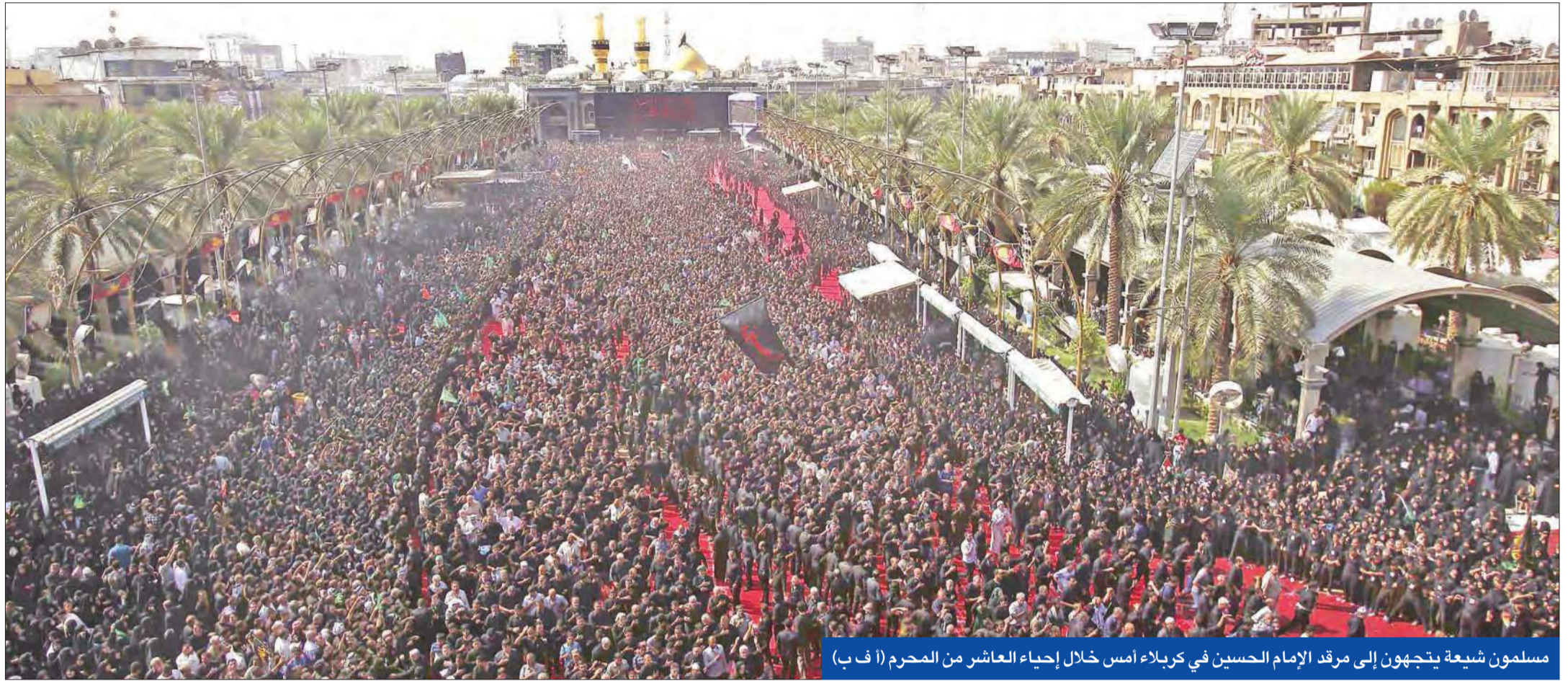
مسلمون شيعة يتجهون إلى مرقد الإمام الحسين في كربلاء أمس خلال إحياء العاشر من المحرم (أ ف ب)

«الدفاع» العراقية لم تبلغ بالعملية... وأربيل تشيد بها ومليشيات تعتبرها انتهاكاً للسيادة