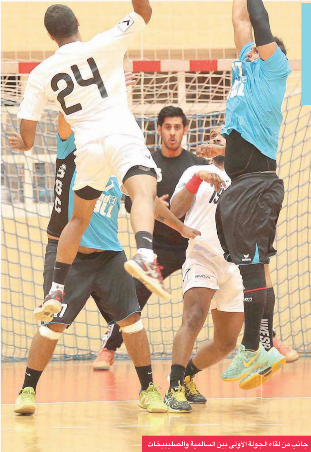
جانب من لقاء الجولة الأولى بين السالمية والصليبخات