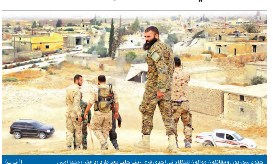
جنود سوريون ومقاتلون موالون للنظام في إحدى قرى ريف حلب بعد طرد «داعش» منها أمس

غداة فشل روسيا والولايات المتحدة والسعودية وتركيا في التوصل إلى أرضية مشتركة لإنهاء الصراع السوري، فاجأ وزير الخارجية الروسي سيرغي لافروف السوريين بدعوتهم إلى الاستعداد لانتخابات رئاسية وتشريعية في أقرب وقت، معرباً عن أمه بالنجاح في جمع كل أطراف النزاع «على طاولة المفاوضات» في المستقبل القريب. كما فاجأ لافروف الجميع بإعلانه استعداد سلاح الجو الروسي لتوفير غطاء جوي لـ«الجيش السوري الحر»، الذي ظل استهدافه محور عمليات أطلقها الرئيس فلاديمير بوتين منذ 30 سبتمبر الماضي لدعم نظيره السوري بشار الأسد. ورفضت فصائل المعارضة السورية عرض لافروف لتقديم غطاء جوي لـ«الحر»، كما اعتبرت دعوة إلى تنظيم انتخابات رئاسية وتشريعية غير واقعية. وأجرى لافروف، أمس، سلسلة اتصالات هاتفية ركزت على إيجاد حل سياسي لازمة السورية. وقالت وزارة الخارجية الروسية في بيان، إن لافروف أجرى اتصالاً هاتفياً بنظيره الأميركي جون كيري تطرق إلى الاستفادة من إمكانات الدول الأخرى في المنطقة لدفع العملية السياسية.