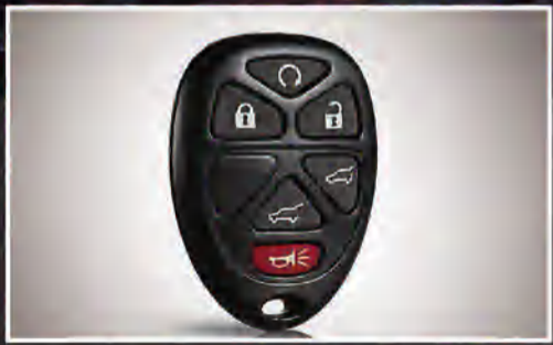
فتح وغلق الأبواب عن بُعد