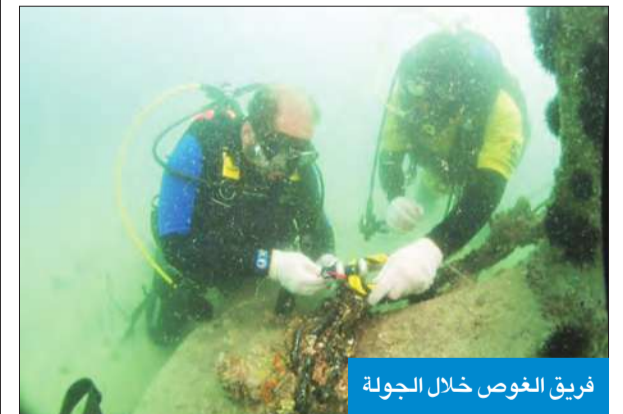
فريق الغوص خلال الجولة

أعلن فريق الغوص الكويتي في المبرة التطوعية البيئية تعافي وتنامي موقع «محار قحة بن جماده»، مقابل ساحل الخيران، بعد إصابته قبل سنتين بظاهرة نفوق كبرى، طالعت مئات الآلاف من المحار. وجاء هذا الإعلان خلال جولة بيئية قام بها الفريق على الموقع أمس، بمشاركة المدير العام للهيئة العامة للبيئة الشيخ عبدالله الحمود.