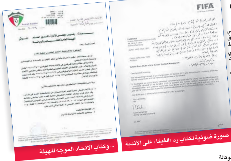
صورة ضوئية لكتاب رد «الفيفا» على الأندية... وكتاب الاتحاد الموجه للهيئة

تلقى اتحاد كرة القدم كتاباً من قبل الاتحاد الدولي لكرة القدم «الفيفا» يفيد بعدم تراجعه عن قراره السابق الذي اتخذته في 16 الجاري، والقاضي بتعليق النشاط الكروي على المستوى الخارجي، بحجة عدم تماشي القوانين الوطنية مع الأنظمة الأساسية للهيئات الرياضية الدولية. وكان نادياً قد أرسلت كتاباً أخيراً إلى الفيغا، طالبته خلاله برفع تعليق النشاط، لاسيما في ظل تمسكها بالقوانين الوطنية التي لا تتعارض مع الأنظمة الأساسية، بالإضافة إلى تأكيدها على استقلاليتها التامة، وعدم التدخل الحكومي في شؤونها باستثناء المراقبة المالية فقط، وهو حق أصيل للحكومة الكويتية التي تدعم الأندية بشكل تام، كما أرسل نادي القادسية كتاباً يحمل المضمون نفسه. واشترط «الفيغا» في كتابه ضرورة تعديل القوانين من أجل رفع تعليق نشاط الكرة على المستوى الخارجي.