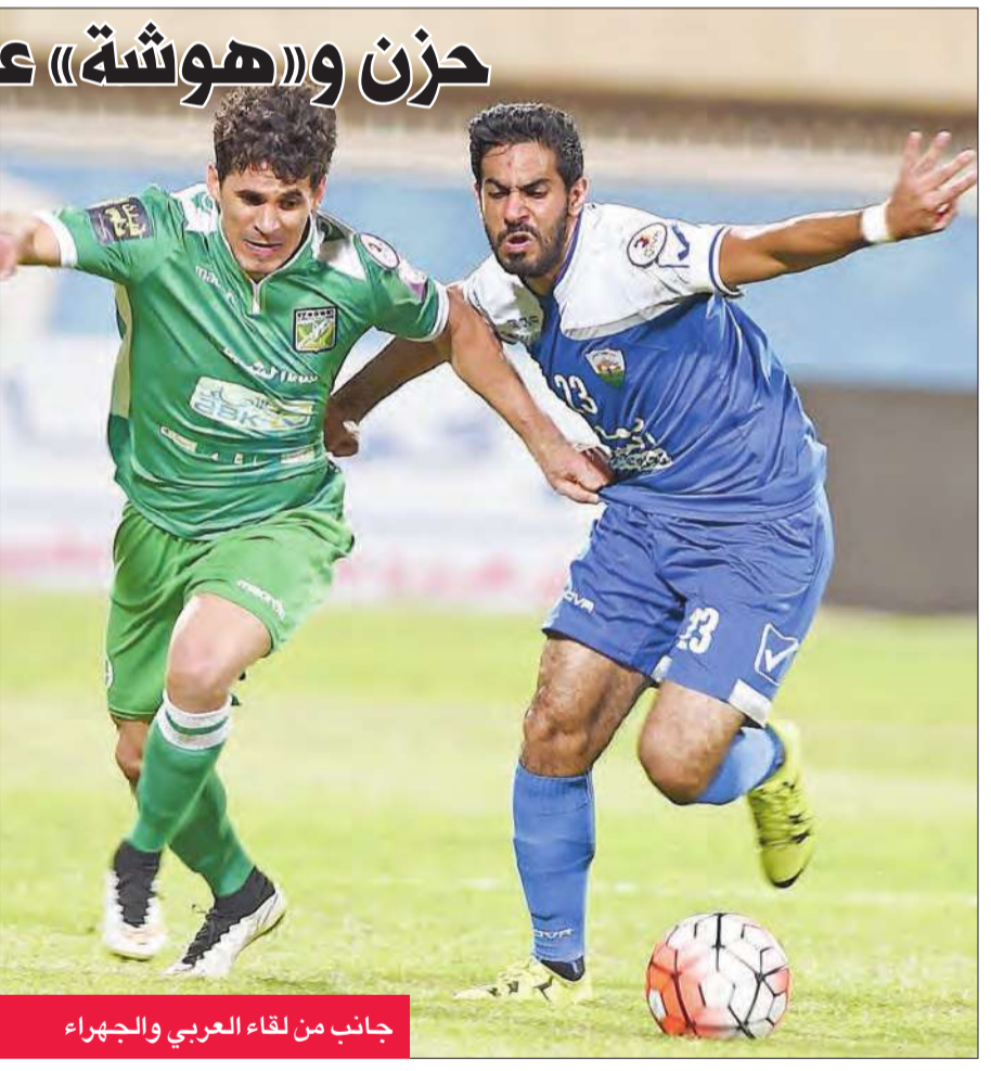
جانب من لقاء العربي والجهراء