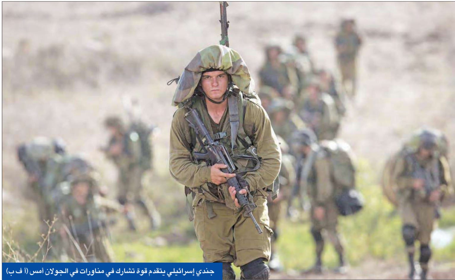
جندي إسرائيلي يتقدم قوة تشارك في مناورات في الجولان أمس

العزة التابع للجيش الحر، الرائد جميل الصالح. وفي دمشق، اتهم المرصد ووكالة سورية مباشر، أمس قوات النظام باستخدام الغازات السامة خلال قصفها حي جوبر شرقي العاصمة، مما أدى إلى وقوع حالات اختناق على جبهة معمل كراش.