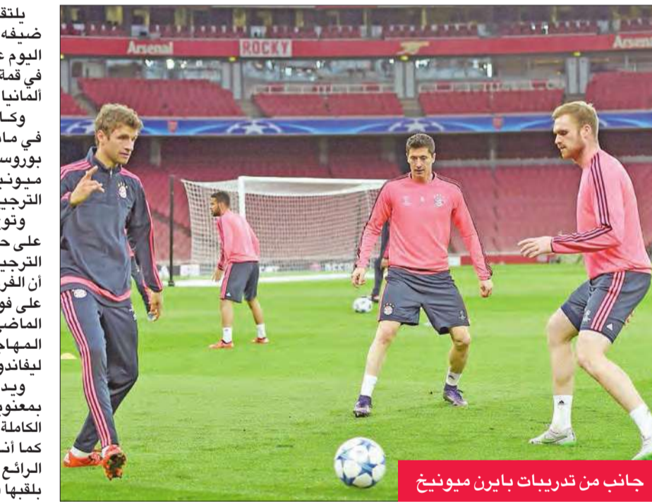
جانب من تدريبات بايرن ميونخ

وكان فولفسبورغ توج باللقب في مايو الماضي بالفوز 3-1 على بوروسيا دورتموند الذي أطيح بايرن ميونخ من دور الأربعة بركلات الترجيح. وتوج فولفسبورغ بالقبض على حساب بايرن ميونخ بركلات الترجيح 4-5، بعد تعادلهما 1-1، بيد أن الفريق البافاري ثار بفوز ساحق على فولفسبورغ 5-1 في 22 سبتمبر الماضي في الدوري المحلي، سجلها المهاجم الدولي البولندي روبرت ليفاندوفسكي في 9 دقائق. ويدخل بايرن ميونخ المباراة بمعنويات عالية، بعدما حقق العلامة الكاملة في البوندسليغا من 10 مراحل، كما أنه يطمح إلى مواصلة مشواره الرابع في المسابقة على أمل الظفر بلقها في سعيه ومدربه الإسباني بيب