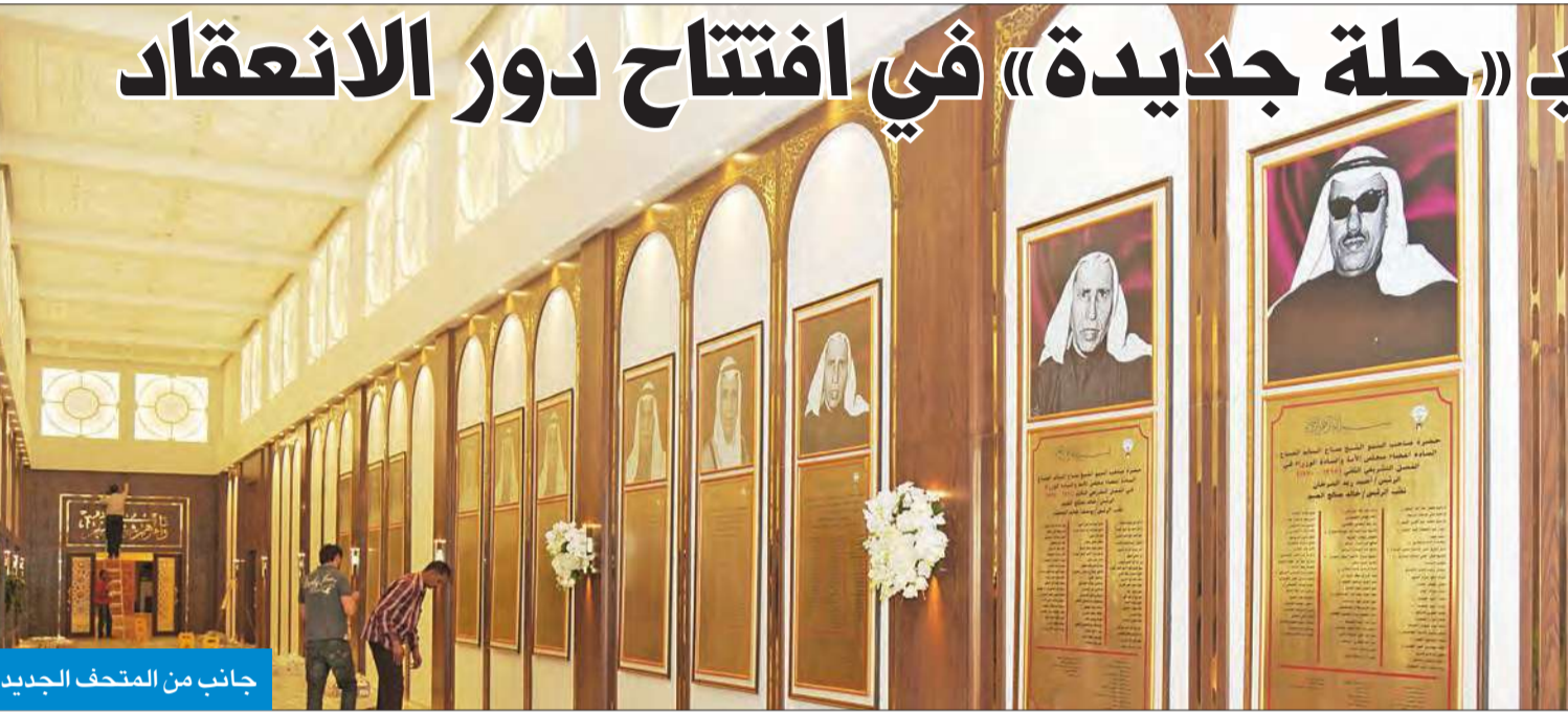
جانب من المتحف الجديد