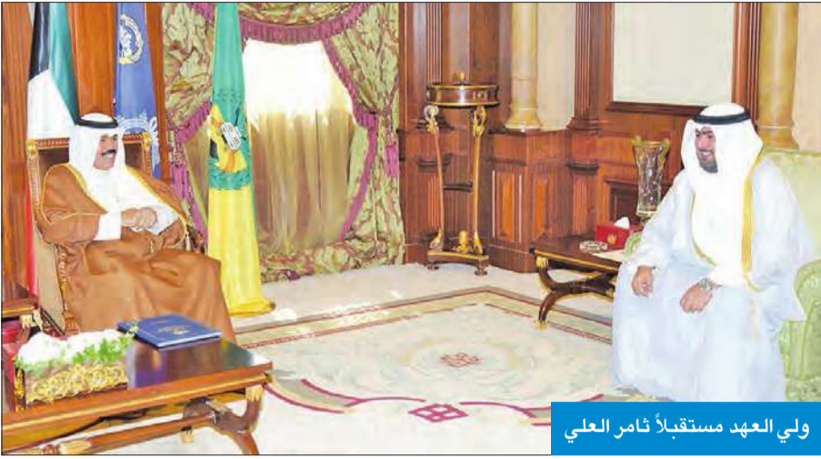
ولي العهد مستقبلاً ناصر العلي

استقبل سمو ولي العهد الشيخ نواف الأحمد بخصر بيان، صباح أمس، نائب رئيس الحرس الوطني الشيخ مشعل الأحمد. واستقبل سموه رئيس الجهاز المركزي لمعالجة أوضاع المقيمين بصورة غير قانونية صالح الفضالة، حيث رفع لسموه تقريراً حول معالجة أوضاع المقيمين بصورة غير قانونية.