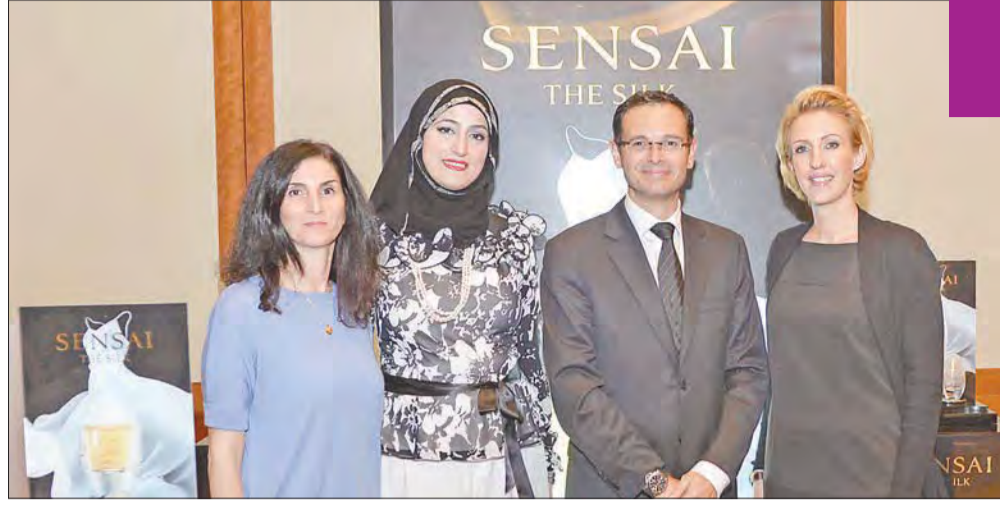
خلال إطلاق عطر sensai