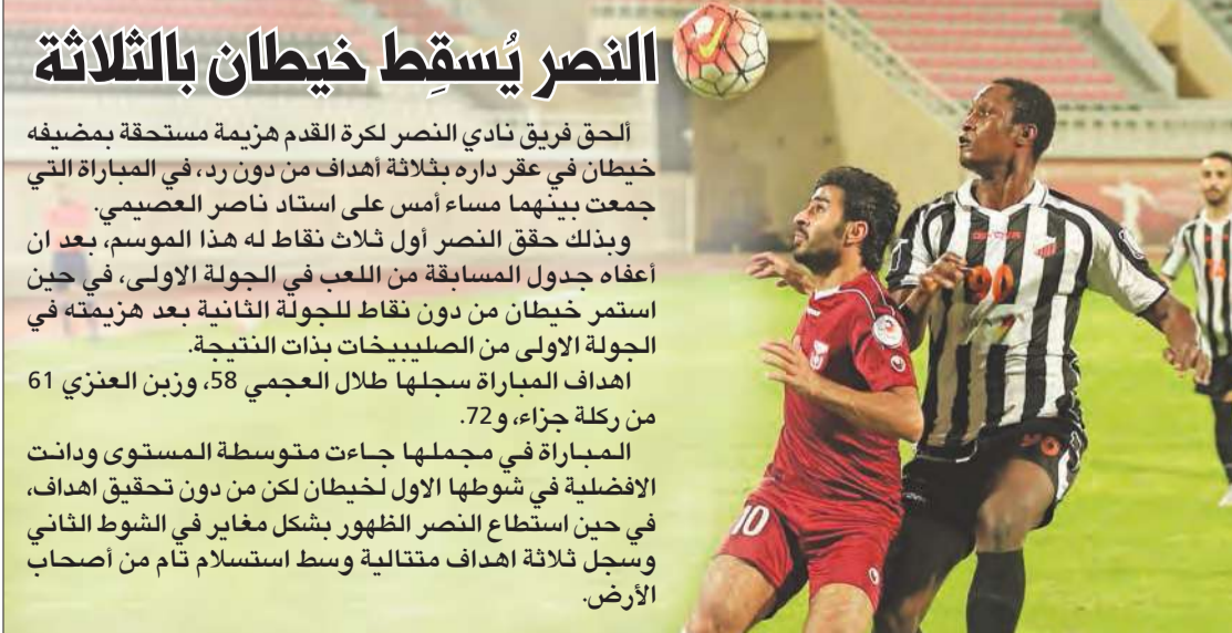
النصر يُسقط خيطان بالثلاثة

أخطأ دفاعية قاتلة، رغم تدريبي المدافعين على التمرکز الجيد، وكشف أبرز سلبيات وإيجابيات السامية، لذا فإن الأخطاء التي منبت بها شبكتنا كانت مفاجأة بالنسبة لي». وأضاف: «مازلنا في بداية الدوري، وانتظر من اللاعبين الكثير في الفترة المقبلة، التي ستشهد تحسناً ملموساً في النتائج، وابتداء