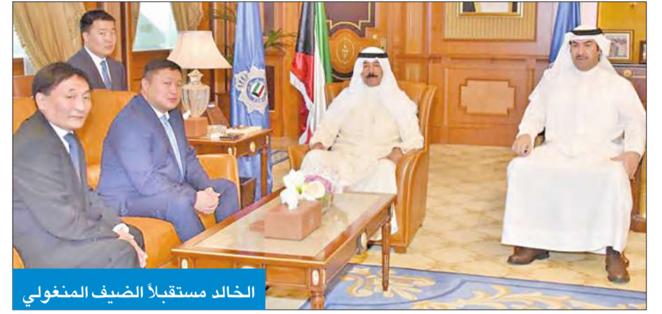
الخالد مستقبلاً الضيف المنغولي

الأمني بالنظر إلى المستجدات على الساحتين الإقليمية والدولية. ومن جانبه، توجه رئيس الجهاز المنغولي بالشكر والتقدير لدولة الكويت على روح التعاون التي لمسها في المحادثات الثنائية، والنتائج المحققة التي تعزز مسيرة التعاون بين الجانبين. وفي ختام اللقاء تم تبادل الدروع التذكارية.