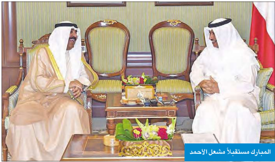
المبارك مستقبلاً مشعل الأحمد

استقبل رئيس مجلس الوزراء سمو الشيخ جابر المبارك، في قصر بيان أمس، نائب رئيس الحرس الوطني الشيخ مشعل الأحمد. واستقبل سموه رئيس ديوان المحاسبة بالإنابة عادل الصرعاوي، حيث سلم سموه نسخة من تقارير الديوان عن نتائج الفحص والمراجعة على تنفيذ الميزانيات والحسابات الختامية للدولة عن السنة المالية 2014 / 2015.