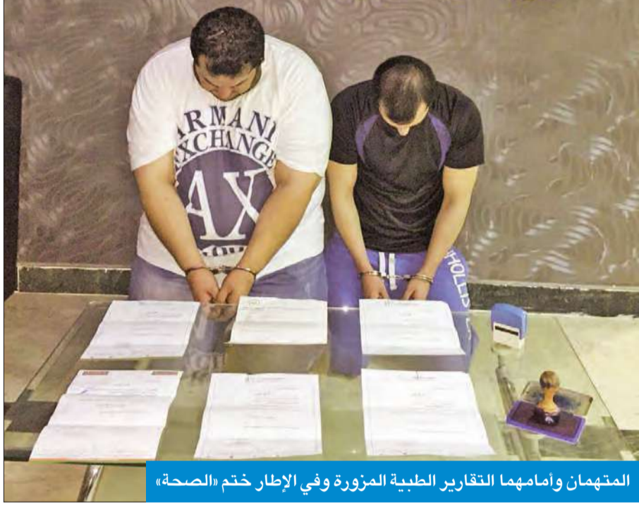
المتهمان وأمامهما التقارير الطبية المزورة وفي الإطار ختم «الصحة»

استقبل نائب رئيس مجلس الوزراء وزير الداخلية الشيخ محمد الخالد، أمس، رئيس جهاز الأمن المنغولي خورتس بات، والوفد المرافق له، بحضور الوكيل المساعد لجهاز أمن الدولة الخارجي الشيخ مبارك سالم العلي. ورحب الخالد بضيفه، مؤكداً عمق علاقات التعاون والصداقة بين الكويت ومنغوليا، منوهاً بضرورة تعزيز هذه الروابط في المجال