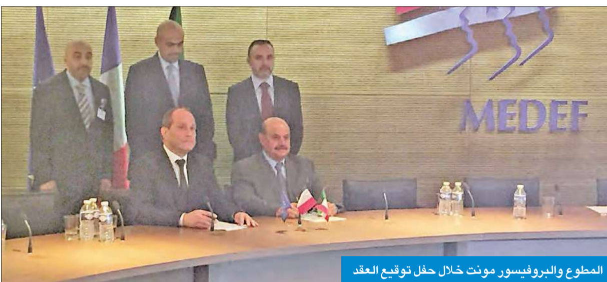
المطوع والبروفيسور مونت خلال حفل توقيع العقد

سيكون المستشفى التخصصي الخاص الأول في الكويت لعلاج الأورام السرطانية