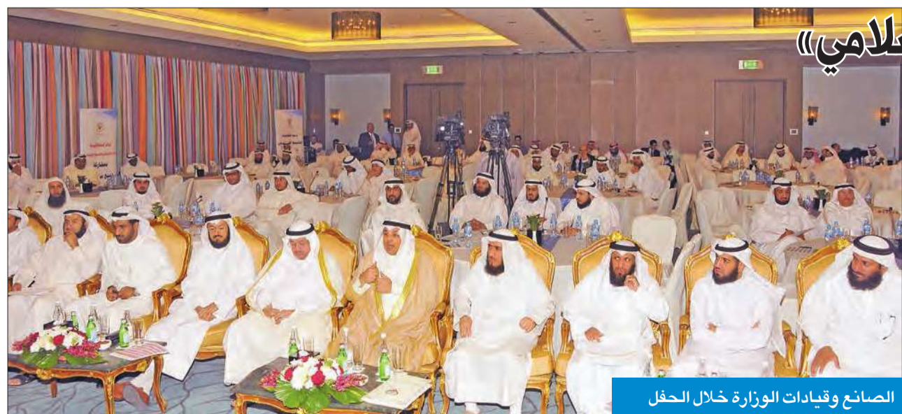
الصانع وقيادات الوزارة خلال الحفل

قال الوزير الصانع إن «الأوقاف» تقوم بدور ريادي في خدمة الشأن الإسلامي على المستويين العربي والعالمي»، مبيّناً أنه «تمت ترجمة هذا الاهتمام من خلال خطة استراتيجية تشغيلية لتحقيق أهدافها وفق أسس علمية».