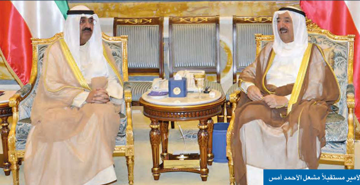
الأمير مستقبلاً مشعل الأحمد أمس