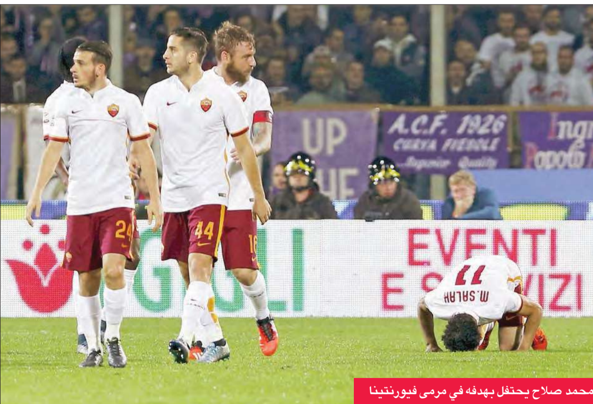
محمد صلاح يحتفل بهدفه في رمي فيورنتينا

غونزالو هيغواين في الدقيقة 60، رافعا برصيده إلى 7 أهداف هذا الموسم، ليحتصد لائحة الهدافين مع مهاجم سدبوريا ايدر. وصعد نابولي إلى المركز الثاني برصيد 18 نقطة بفارق الأهداف امام فيورنتينا وانتر ميلان ولاتسيو.