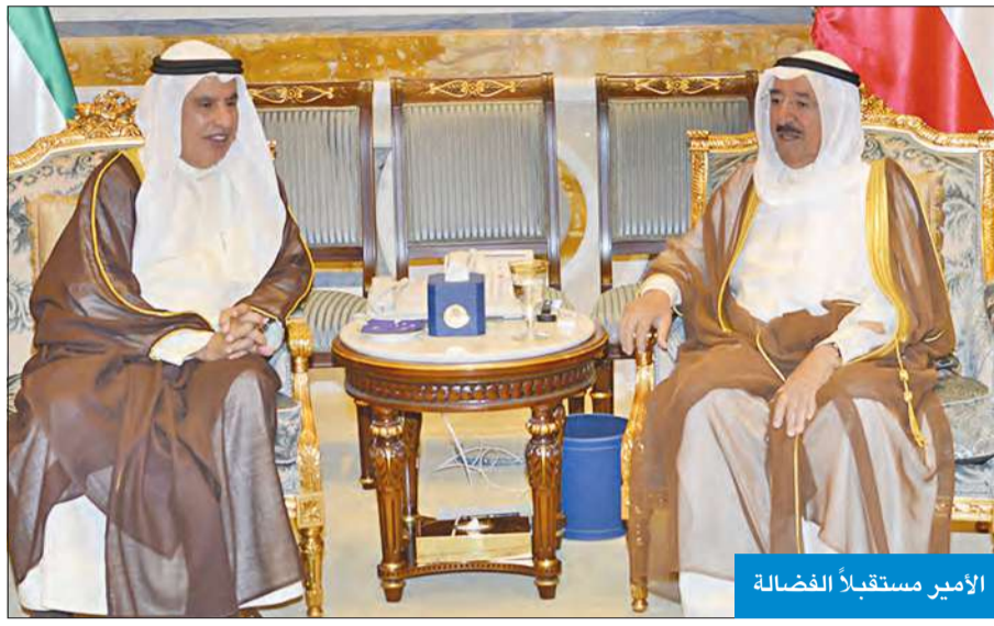
الأمير مستقبلاً الفضالة

انتهاء فترة عمله سفيرا لبلاد. حضر المقابلة نائب وزير شؤون الديوان الأميري الشيخ علي الجراح. من جهة أخرى، بعث سمو الأمير برفيقة تهنية إلى الرئيس الدكتور هاينز فيشر رئيس جمهورية النمسا الصديقة، عبر فيها سموه عن خالص تهنائه بمناسبة العيد الوطني لبلاد، متمنياً لفخامته موفور الصحة والعافية، وللبلد الصديق دوام التقدم والازدهار. وبعث سمو الأمير برفيقة تهنية إلى الرئيس الكسندر لوكاشينكو رئيس جمهورية بيلاروسيا الصديقة، عبر فيها سموه عن خالص تهنائه بمناسبة إعادة انتخابه رئيساً لجمهورية بيلاروسيا لفترة رئاسية جديدة، متمنياً سموه لفخامته كل التوفيق والسداد، وموفور الصحة والعافية،