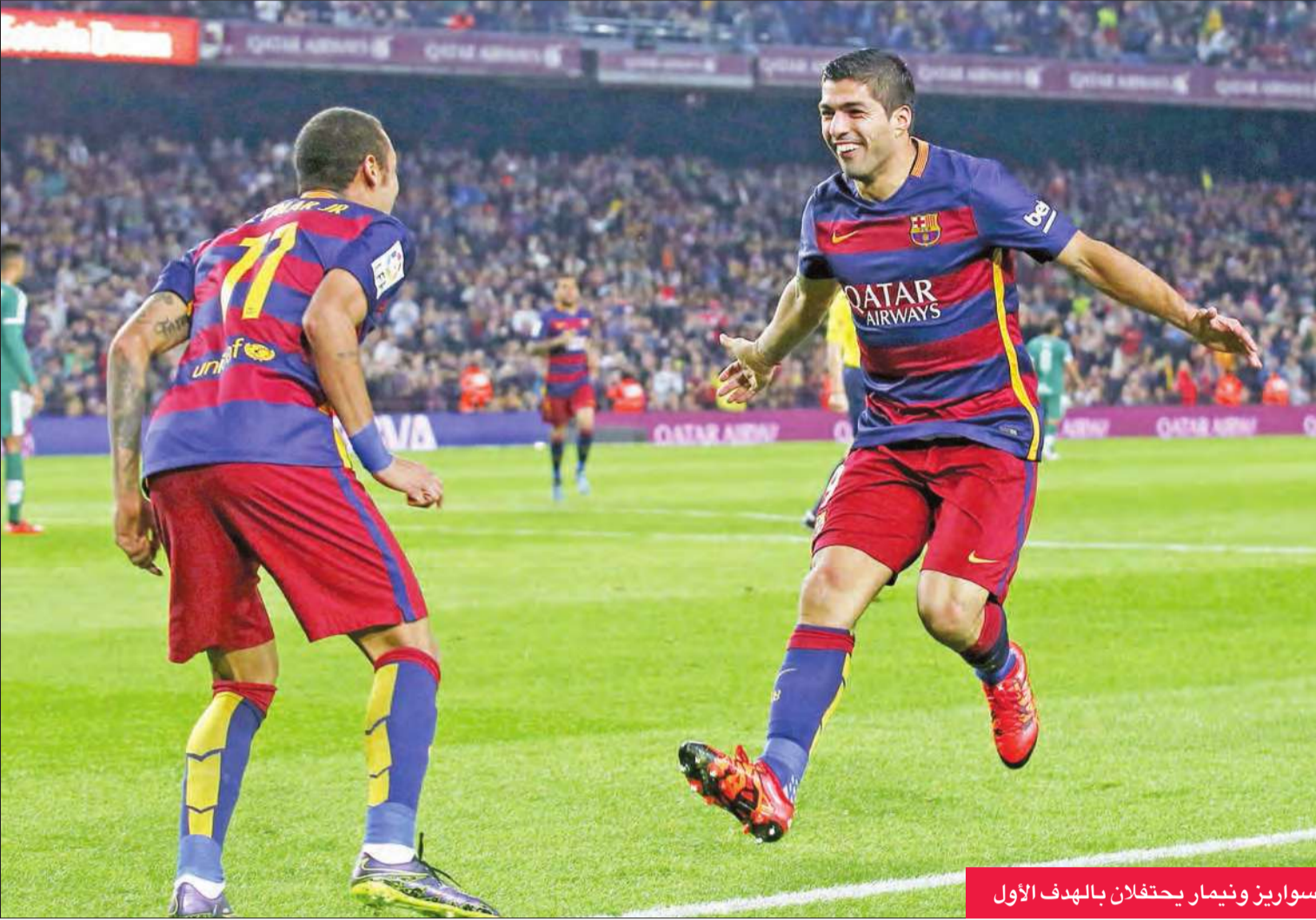
سواريز ونيمار يحتفلان بالهدف الأول