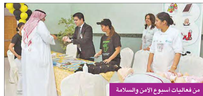
من فعاليات أسبوع الأمن والسلامة

وتضمنت فعاليات أسبوع الأمن والسلامة إقامة محاضرات تدريب وتنقيف بمشاركة العاملين بالمستشفى حول مهارات التواصل وحل المشكلات، ومهارات الإدارة والقيادة، والطرق الآمنة لاستعمال الأدوية.