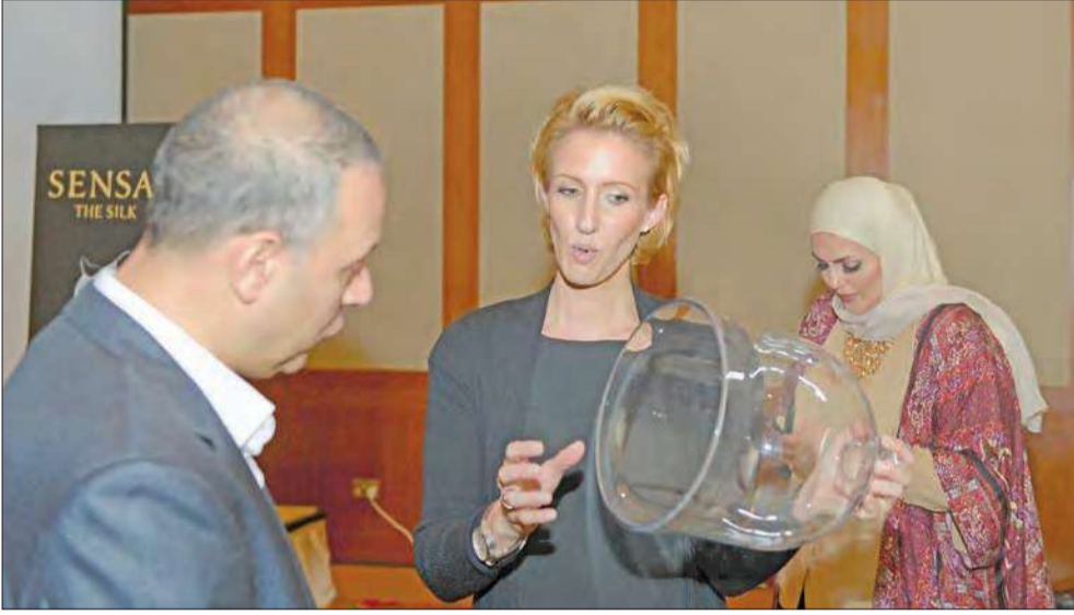
شرح عن تركيبة sensai

وتتكون تركيبة العطر من رائحة البنفسج مزيج من توليفة رائحة العنبر. وقال مصمم العطر، الفرنسي المقيم في طوكيو، غويناييل نيكولاس، إن التصميم المتعلق بالعطر فريد من نوعه، والفكرة الأصلية له كانت عبارة عن شخص يحمل شرنقة حرير بين يديه، والشرنقة شيء ثابت لكنها تنبض بالحياة من الداخل لذلك حاولنا تصنيع منتج يملك وجوداً داخلياً مثل الضوء المشع من الداخل، كما أن الخطوط الرفيعة على العلبة تعطي انطباعاً بالنعومة والرقّة وتتناشى شيئاً قشياً وتنصهر لتصبح جزءاً من الحياة اليومية للمرأة.