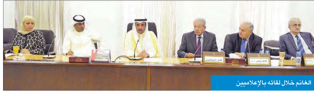
الغانم خلال لقائه بالإعلاميين

استقبل رئيس مجلس الأمة مرزوق الغانم، في قاعة اجتماعات مكتب المجلس، عدداً من الصحفيين والإعلاميين والكتاب، الممثلين لكبرى الصحف والوكالات العربية. وتم خلال اللقاء مع الوفد الإعلامي العربي، الذي يزور الكويت لحضور افتتاح أعمال دور الانعقاد الرابع للفصل التشريعي الـ14، مناقشة عدد من الموضوعات والملفات المحلية والخارجية.