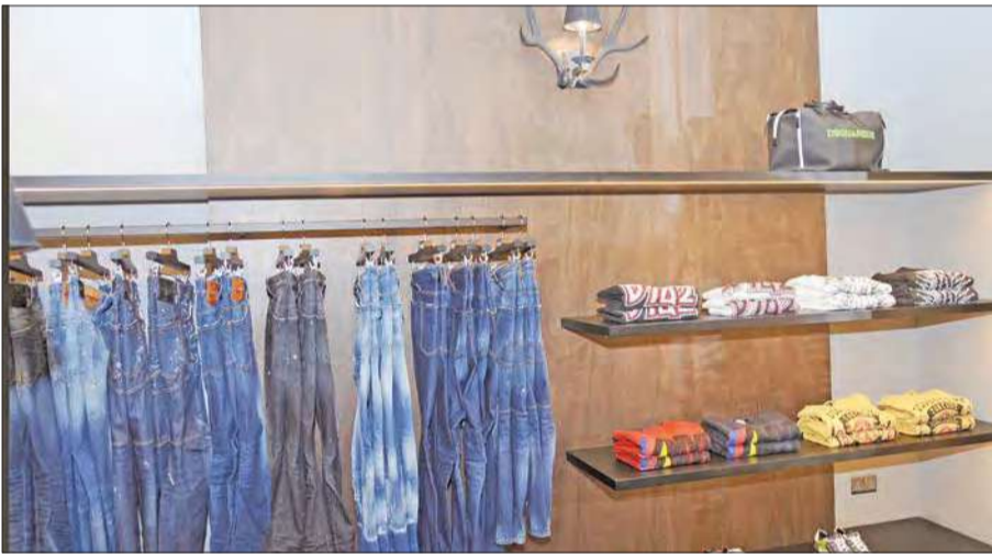
مجموعة من ملابس العلامة التجارية