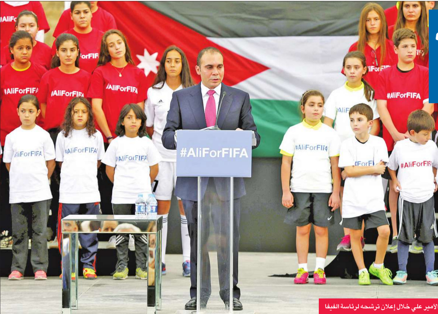
الأمير علي خلال إعلان ترشحه لرئاسة الفيفا

أعلن الأمير الأردني علي بن الحسين ترشحه مجدداً لرئاسة الاتحاد الدولي لكرة القدم (فيفا)، في حفل أقيم مساء أمس الأول الأربعاء في المدرج الروماني وسط العاصمة الأردنية عمان. وقال الأمير علي إنه المرشح الوحيد الذي يمتلك "الجرأة" لمواجهة الفساد في المنظمة الدولية، وتقام الانتخابات في 26 فبراير المقبل في زيوريخ بسويسرا. وقال نائب رئيس الاتحاد الدولي السابق أمام العشرات من أنصاره الذين رفعوا لافتات كتب عليها "الأردن فخور بك"، و"كرة القدم تستحق الأمير علي"، و"أمير القلوب وأمير الشباب"، "أنا هنا في هذا الموقع القديم، القلب الأبدى لعمان، لإطلاق ترشحي مجدداً لرئاسة فيفا". وأضاف "هذه المرة كما في السابق، وبعد الإكتال على الله عقدنا العزم وقررنا خوض المعركة الانتخابية مرة أخرى لرئاسة الاتحاد الدولي لكرة القدم فيفا، بدي بيدكم وخلال دعمكم وصوتكم ومن أجلي وأجل الملايين من عشاق كرة القدم في أردنا