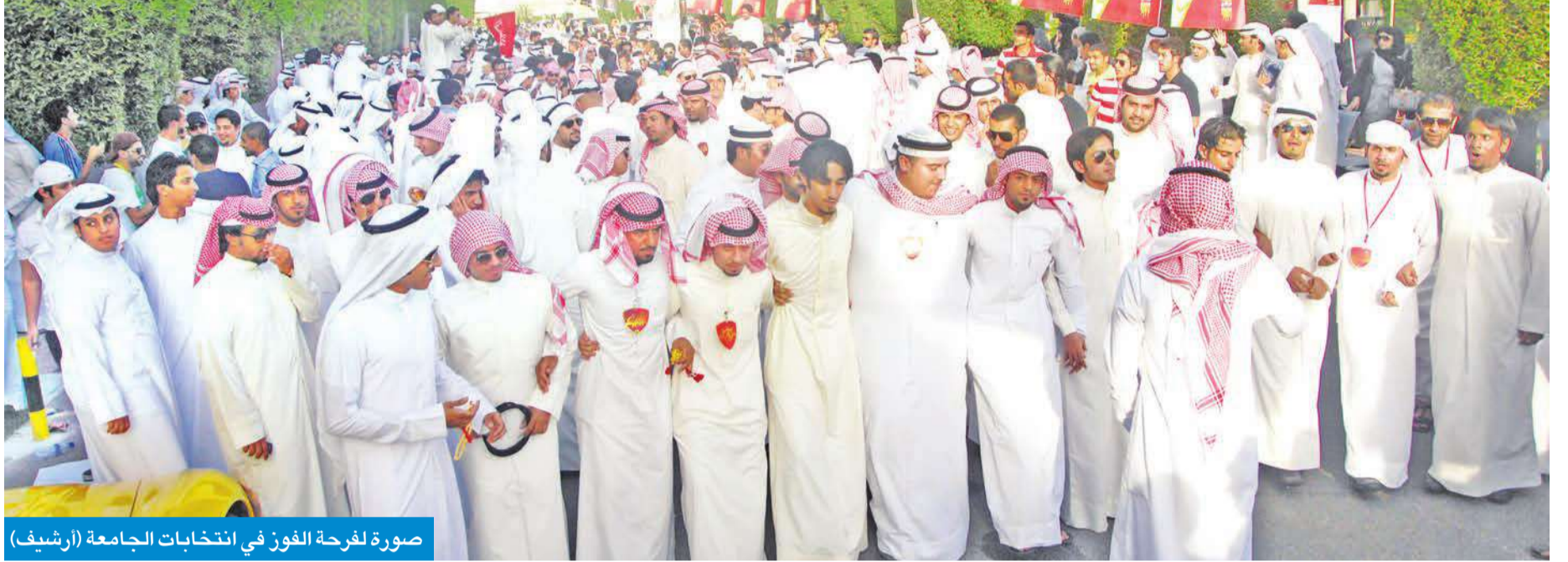
صورة لفرحة الفوز في انتخابات الجامعة (أرشيف)