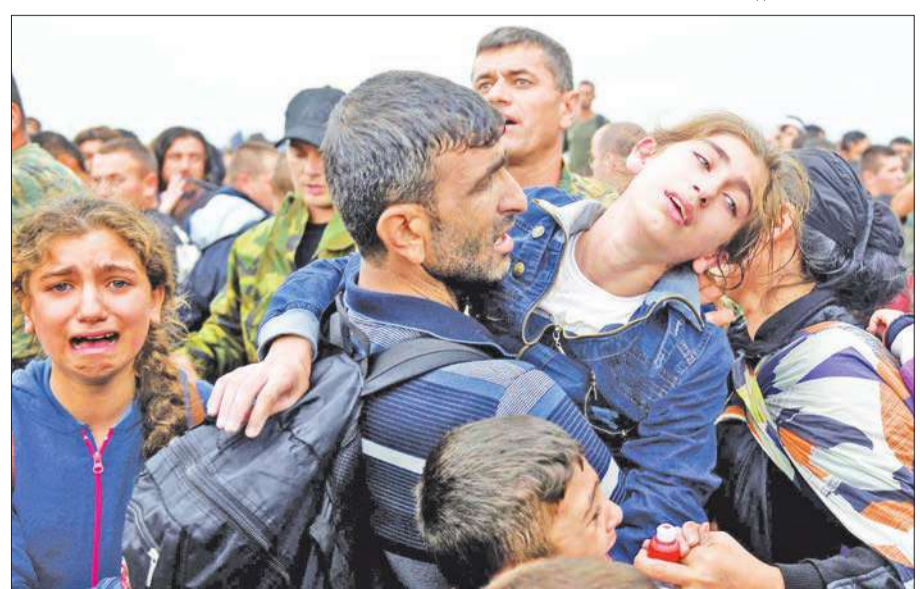
لاجئون سوريون يندفعون لركوب حافلة في مقدونيا أمس

فجر القيادي في «وحدات» حماية الشعب الكردي، الذراع العسكرية لحزب «الاتحاد الديمقراطي» الكردي السوري جوان إبراهيم، أمس، مفاجأة من العيار الثقيل بإعلانه احتجاج «الوحدات»، نحو 30 مقاتلاً بينهم عناصر من القوات الموالية للرئيس السوري، ومقاتلون إيرانيون، لمبادلتهم بأسرى أكراد لدى النظام.