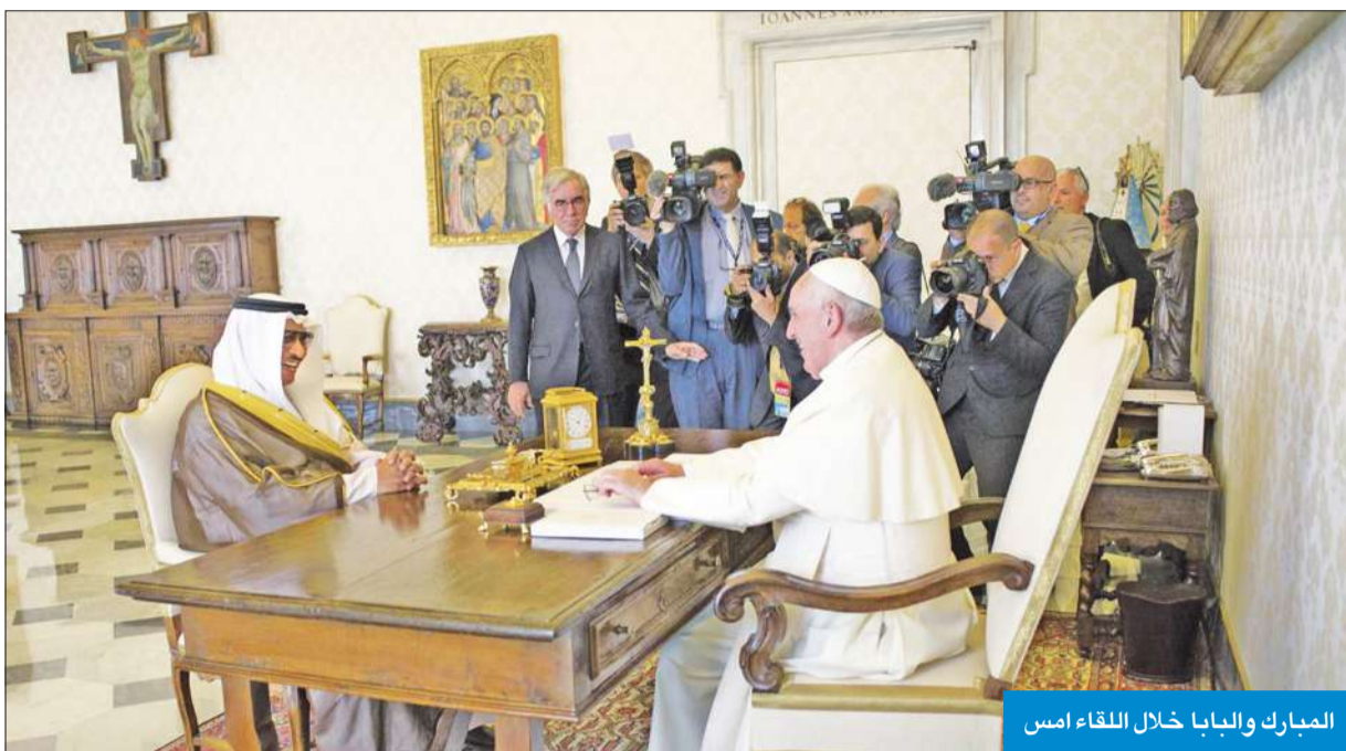
المبارك والبابا خلال اللقاء امس

تولى اهتماما كبيرا بنشر الثقافة الإسلامية والعربية في العالم منذ سنوات طويلة. وتوجه سموه بان المعرض يعتبر رسالة كويتية إلى العالم تجسد سعي الكويت إلى نشر المحبة وتحقيق الأمن والسلام والاستقرار والحياة الكريمة لكل الشعوب.