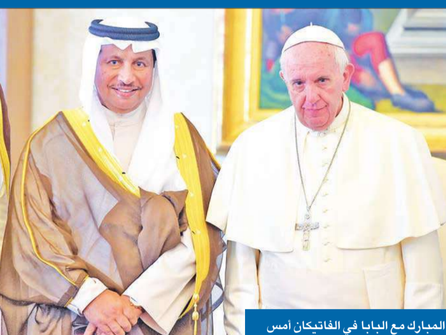
المبارك مع البابا في الفاتيكان أمس