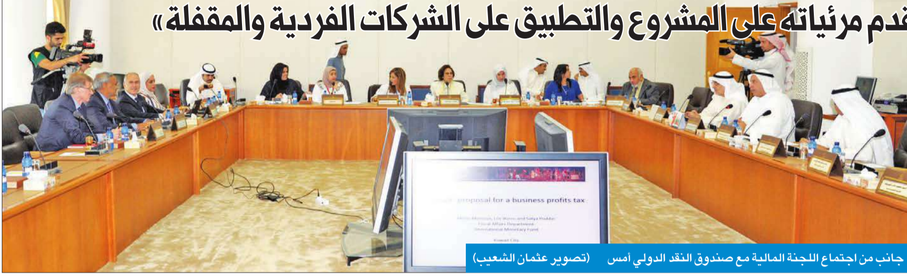
جانب من اجتماع اللجنة المالية مع صندوق النقد الدولي أمس

«النقد الدولي قدم مرئياته على المشروع والتطبيق على الشركات الفردية والمقفلة»