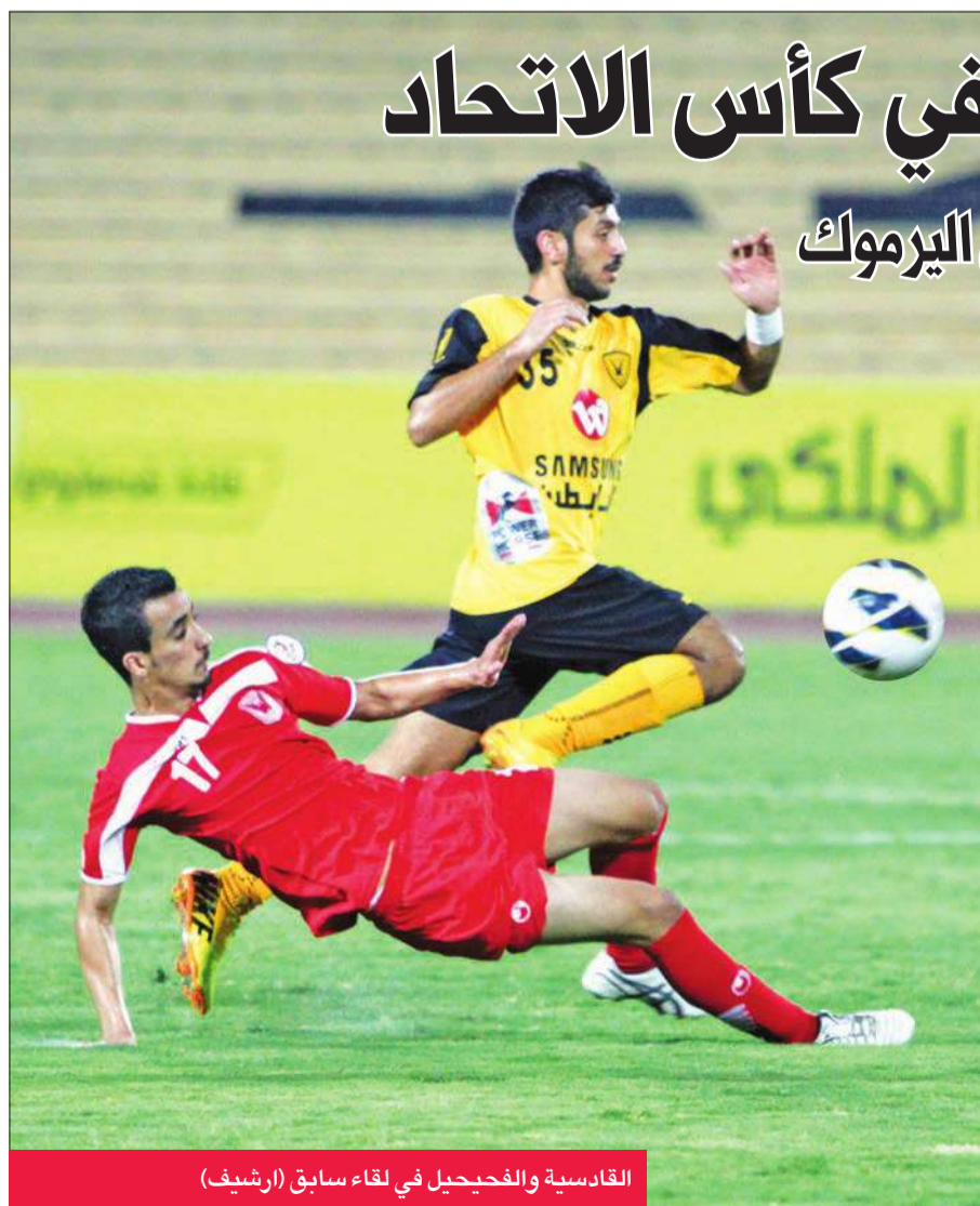
القادسية والفحيحيل في لقاء سابق (أرشيف)