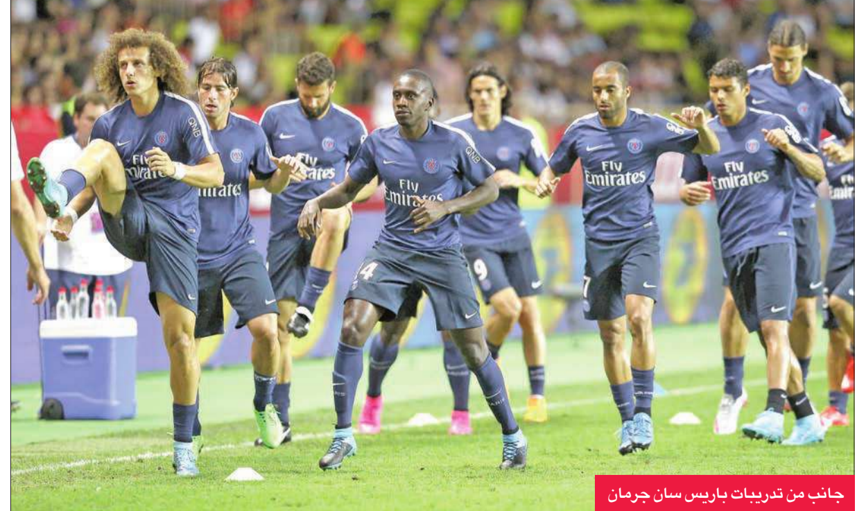
جانب من تدريبات باريس سان جرمان

الوحيد في مرمى مونبلييه بعد أسبوع. ولم يقتصر تالق ماتويدي على ناديه، بل سجل هدفي منتخب بلاده في مرمى صربيا (2-1) في مباراة ودية أقيمت الاثنين الماضي. وأشاد به زميله في المنتخب يونانيد الإنكليزي مورغان شنايدرلين بقوله "إنه لاعب ممتاز. قد لا يكون من الأسماء الرنانة في صفوف باريس سان جرمان، لكنه اللاعب الأهم في هذا الفريق". وأضاف "بات الآن يسجل الأهداف أيضاً ليصبح لاعباً كاملاً". ومن المتوقع أن يخوض جناح سان جرمان الأرجنتيني إنخل دي ماريا أول مباراة له أساسياً في صفوف فريق العاصمة منذ انتقاله إليه منتصف أغسطس الماضي قادماً من مانشستر يونايتد،