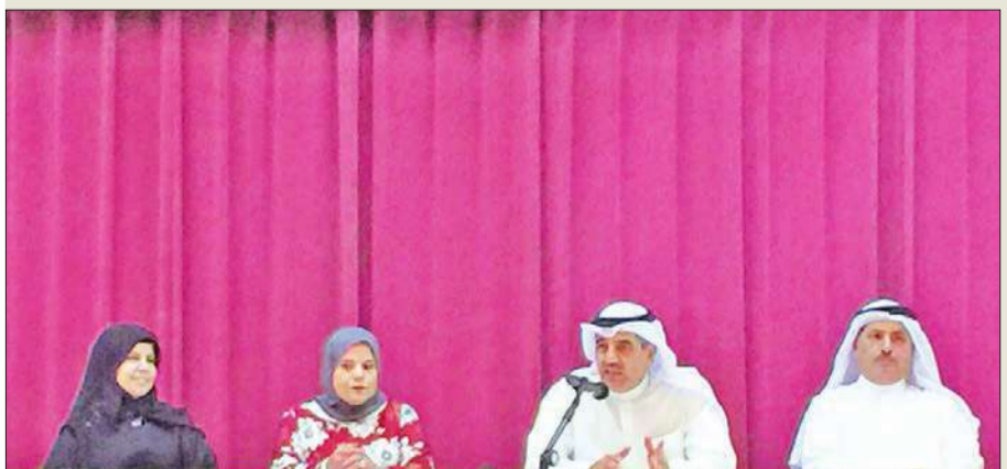
جانب من اللقاء التنويري

طبيعة الأنشطة الطلابية المختلفة التي تقدمها الكلية لتختم قدرات الطالبات بصفاء شخصياتهن في بداية حياتهن الدراسية من خلال ما تقدمه الكلية من مسابقات ثقافية وفنية وتربوية.