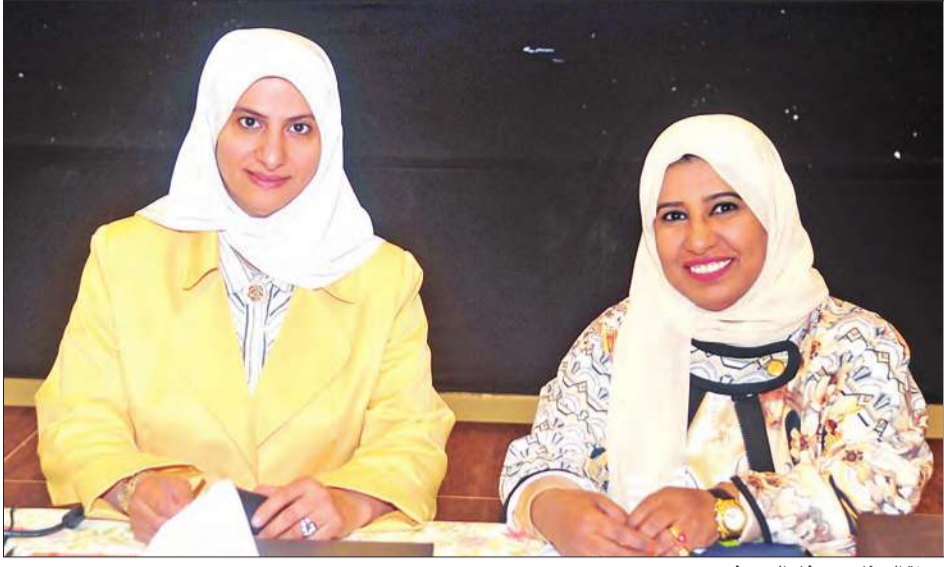
موزة الجناح وهيفاء اليوسف