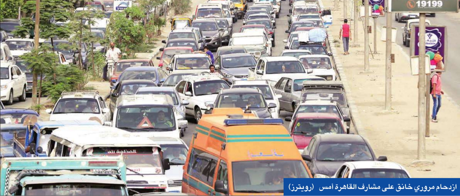
ازدحام مروري خانق على مشارف القاهرة أمس (رويترز)

● منزل السفير مقراً لسفارة إسرائيل بالقاهرة ● عزيتقدم مجدداً لخوض الانتخابات النيابية