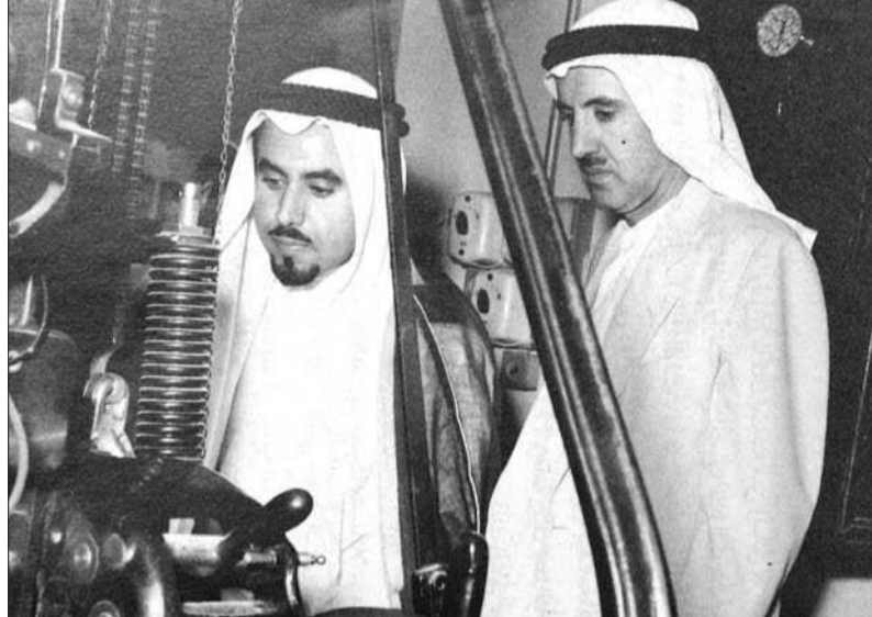
القناعي والأمير الراحل الشيخ جابر الأحمد خلال زيارة مطبعة الإعلام عام 1958