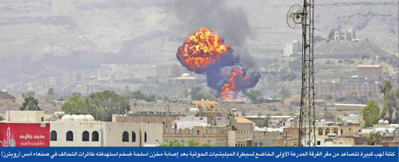
كتلة لهب كبيرة تتصاعد من مقر الفرقة المدرعة الأولى الخاضع لسيطرة الميليشيات الحوثية بعد إصابة مخزن أسلحة ضخم استهدفته طائرات التحالف في صنعاء أمس