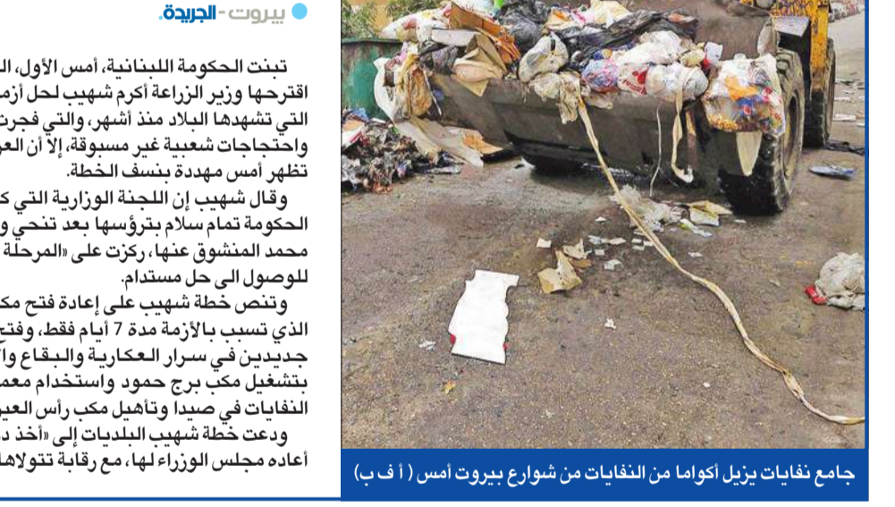
جامع نفايات يزيد أكواما من النفايات من شوارع بيروت أمس