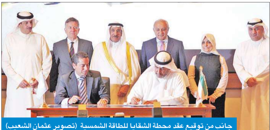
جانب من توقيع عقد محطة الشقاي للطاقة الشمسية

بقيمة 116 مليون دينار وسعة 50 ميغاوات... والتشغيل عام 2017