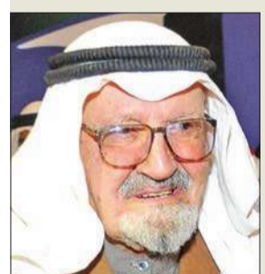
بدر خالد البدر القناعي

شيعت الكويت أمس أحد رجالاتها وروادها الأوائل، وأول طيار كويتي يحصل على رخصة طيران خاصة، وصاحب الفضل في إنشاء وإصدار جريدة «الكويت اليوم»، العم بدر خالد البدر القناعي، الذي وافقه المنية عن عمر يناهز 103 أعوام.