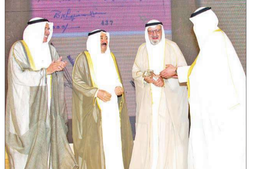
سمو الأمير والقناعي في ذكرى مرور 60 عاماً على تأسيس البنك الوطني