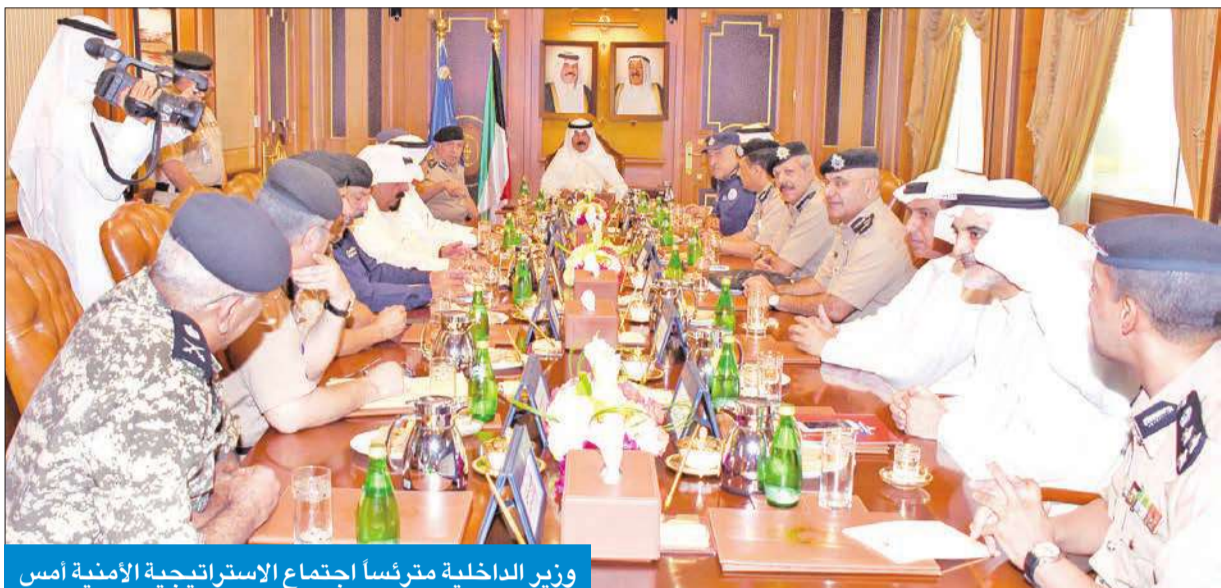
وزير الداخلية مترأساً اجتماع الاستراتيجية الأمنية أمس

ترأس اجتماعاً لقيادة الوزارة ناقش الاستراتيجية الأمنية وأكد أهمية المحادثات في واشنطن