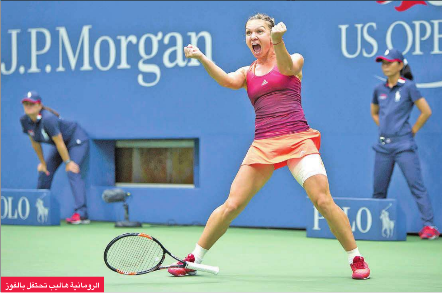
الرومانية هاليب تحفل بالفوز

أندرسون السويسري روجيه فيدرر المصنف ثانياً خطوة إضافية نحو الفوز بلقب بطولة فلاشينغ ميدوز الأميركية، آخر البطولات الأربع الكبرى لكرة المضرب، للمرة الأولى منذ 2008 والسادسة في مسيرته، بتأهله لنصف النهائي على حساب الفرنسي ريشار غاسكيه الثاني عشر 3-6 و6-3 و6-1.