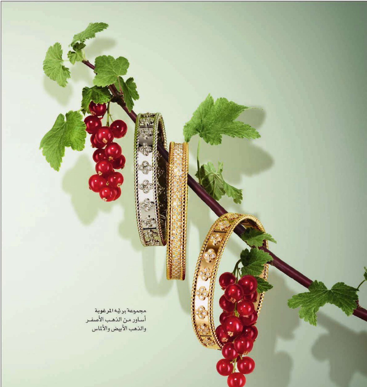
مجموعة بربيه المرغوبة أساور من الذهب الأصفر والذهب الأبيض والألماس

بدوره، قال مدير إدارة نظم المعلومات في بنك الائتمان طارق العيصي أن «البنك حريص على تنفيذ توصيات مجلس الوزراء من خلال المادة 18 التي تنص على عدم اغفال الأثر القانوني للتوقيع الإلكتروني من حيث صحته وإمكانية العمل به