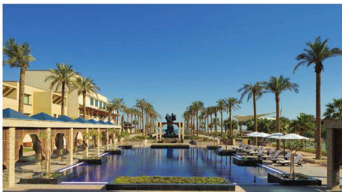
المنتجع الأكثر فخامة في الكويت

من الخدمة خلال إقامتهم معنا". أما فيما يتعلق بتجربة تناول الأطعمة والمشروبات؛ فسوف يحتر الضيوف في الاختيار من بين ما يوفره الفندق من خيارات عديدة، سواء مطعم "بيبر" الذي يقدم أطيب أنواع الأستك في الكويت، و"سولت" الذي يقدم أشهى المأكولات البحرية والأطباق العالمية، أما في مطعم "أوليو" فيتمتع الضيوف بنكهات إيطالية أصلية، وفي حال رغب الضيوف في مذاق أطباق الشرق الأوسط فإن وجهتهم هي مطعم "أرابيسك".