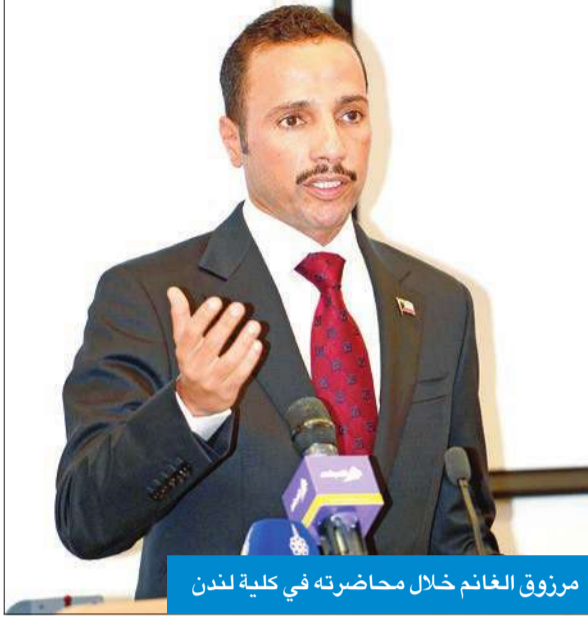
مرزوق الغانم خلال محاضره في كلية لندن

الكويت المعتمد لدى المملكة المتحدة خالد الدويسان كلية لندن وأكد الغانم في محاضرة له ضمن «برنامج الكويت» في كلية لندن للاقتصاد ان السبب الرئيسي وراء بقاء المسيرة الديمقراطية مترسخة برغم حالات النكوص والتراجع الديمقراطي في الشرق الاوسط والإحباط المجتمعي في المنطقة هو تفرد النموذج الديمقراطي الكويتي وخصوصيته. وقال الغانم ان السر في بقاء النموذج الكويتي مختلفا واستثنائيا وظهور المجتمع الكويتي موحدًا ابان الازمات الداخلية والخارجية وفي منطقة تعج بالصراعات الطائفية هو تفرد نموذجها الديمقراطي ونظامها السياسي المتجذر عميقا في التاريخ الكويتي. وأضاف: «ربما يتساءل البعض كيف تصف تجربة الكويت بالديمقراطية والرئيس لا يتم انتخابه ورئيس مجلس