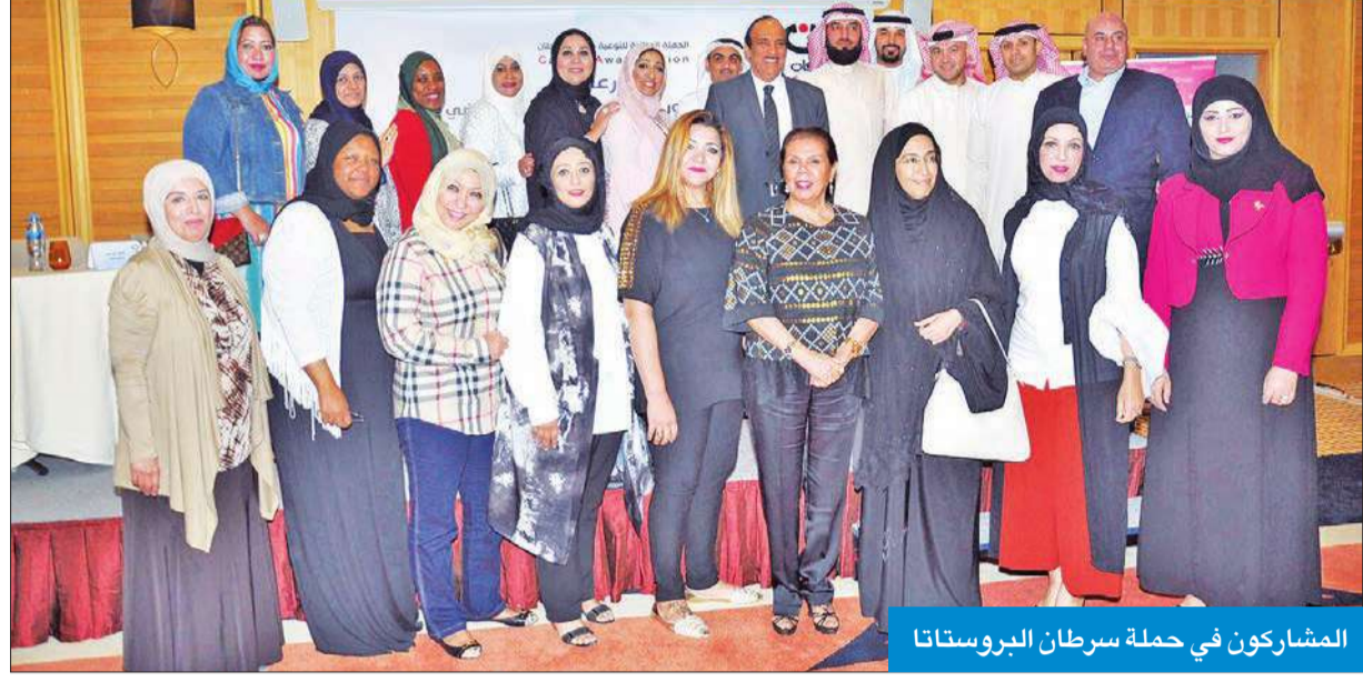
المشاركون في حملة سرطان البروستاتا

أطلقت الحملة الوطنية للتوعية بسرطان (كان) حملة التوعية بمرض سرطان البروستاتا، مؤكدة أن التوعية والاكتشاف المبكر هما سر النجاح بالقضاء على السرطان وزيادة معدلات الشفاء منه.