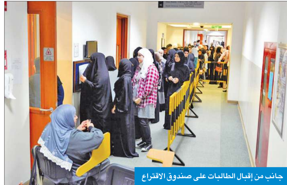
جانب من إقبال الطالبات على صندوق الاقتراع

بشكل عام في الكويت، وبشكل خاص للهيئة. من جانبه، أوضح نائب المدير العام للتعليم التطبيقي والبحوث، د. عيسى المشيبي، أن اللقاء يأتي استكمالاً لزيارة الأثري السابقة للكليات للاطلاع والوقوف على الاستعدادات المختلفة لاستقبال العام الدراسي الجديد، والاستماع إلى اقتراحات أعضاء هيئة التدريس، والتطرق إلى العديد من الجوانب التي تساهم في تطوير وتنمية كليات الهيئة المختلفة. وفي نهاية اللقاء، تم فتح باب النقاش بين أعضاء هيئة التدريس لتقديم اقتراحات وأفكار مختلفة لتطوير وتنمية العنصر البشري والتعليمي بالهيئة.