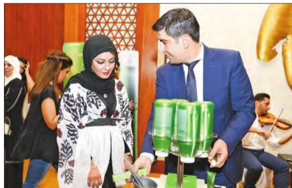
مدير أكاديمية المزين يشرح المنتج للحضور