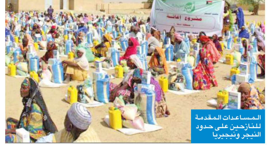
المساعدات المقدمة للنازحين على حدود النيجر ونيجيريا

نفذ مكتب جمعية العون المباشر الميداني في النيجر أخيراً إغاثة عاجلة عبارة عن سلة غذائية تكفي لمدة شهر لعدد 920 شخصاً من اللاجئين جراء النزاع المسلح مع جماعة "بوكو حرام" على الحدود بين نيجيريا والنيجر، والذي دفع الكثيرون إلى ترك أراضيهم وديارهم بحثاً عن الأمان المفقود وهرباً من شبح الموت والدمار.