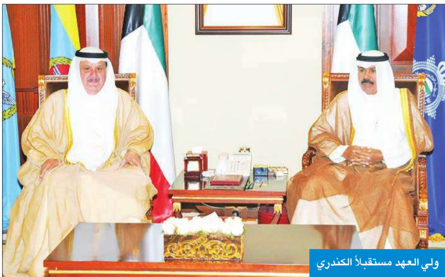
ولي العهد مستقبلاً الكندري

استقبل سمو ولي العهد الشيخ نواف الأحمد بخص بيان، صباح أمس، رئيس مجلس الوزراء سمو الشيخ جابر المبارك. واستقبل سموه النائب الأول لرئيس مجلس الوزراء وزير الخارجية الشيخ صباح الخالد، ثم نائب رئيس مجلس الوزراء وزير الداخلية الشيخ محمد الخالد، فوزير التجارة والصناعة د. يوسف العلي. كما استقبل سمو ولي العهد وزير المواصلات وزير الدولة لشؤون البلدية عيسى الكندري.