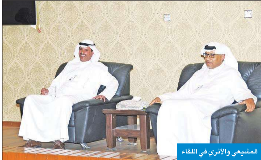
المشيبي والأثري في اللقاء

خلال لقائه عمداء ورؤساء أقسام كليات «الهيئة»