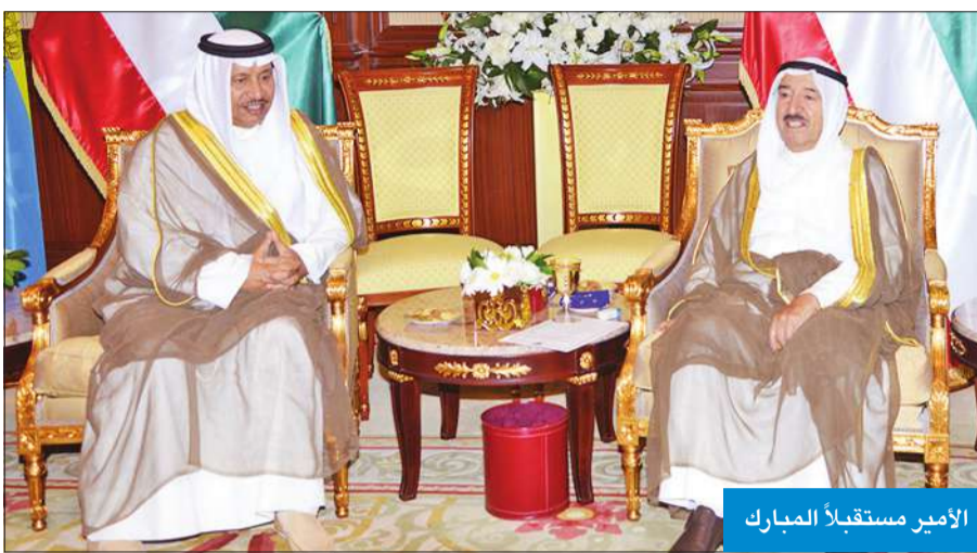
الأمير مستقبلاً المبارك

لهما موفور الصحة والعافية ولبلبلدين الصديقين دوام التقدم والازدهار.