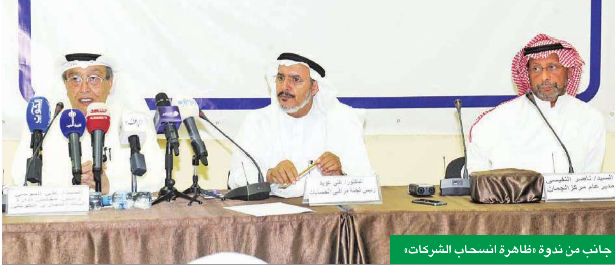
جانج من ندوة «ظاهرة انسحاب الشركات»