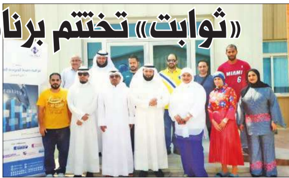
صورة جماعية خلال البرنامج