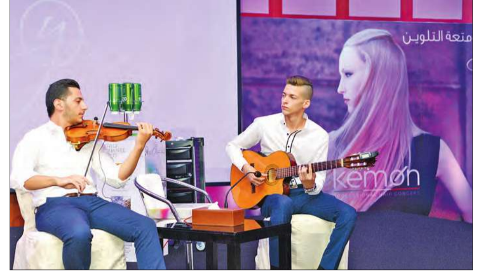
فرقة موسيقية أحييت الحفل