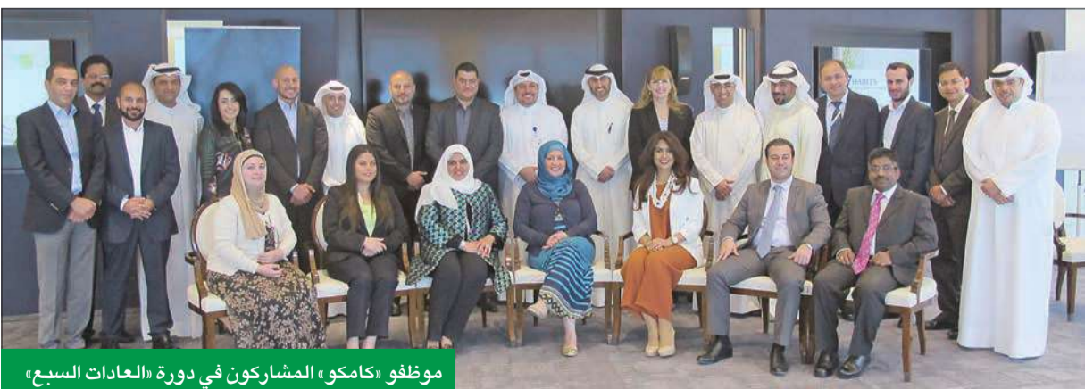
موظفو «كامكو» المشاركون في دورة «العادات السبع»

الحبيل: تنمية قدرات الكوادر البشرية اللبنة الأساسية لتطوير الأعمال