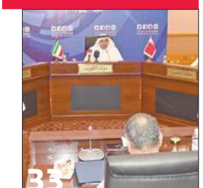
تقديم موعد «خليجي 23» إلى 23 ديسمبر