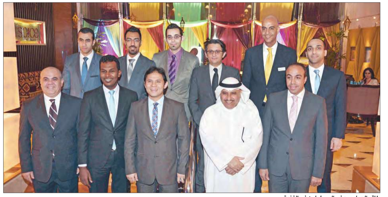
طاقم العمل وبعض المسؤولين في الفندق

أقام فندق كورت يارد ماريوت الراية غبة رمضانية لوسائل الإعلام بحضور عدد من المسؤولين والعاملين، واستمتع الحضور بالأجواء الأسرية الرمضانية مع ما تذوقوه من أطباق شرقية شهية أعدتها فريق من أمهر الطهاة.