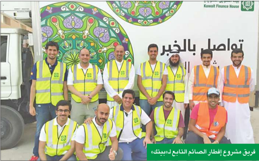
فريق مشروع إفطار الصائم التابع لبيتك

توزيع وجبات الإفطار لمرتبتي قصر نايف الذي يشهد تجمعات كبيرة قبيل موعد إذان المغرب بغية استهداف عدد كبير من الصائمين.