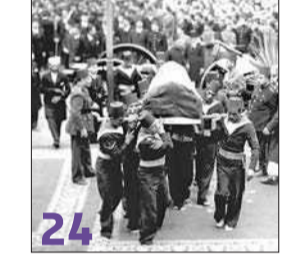
دماء الباشا بين أصابع البنا