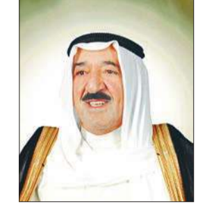
الأمير يعزي السبيسي في ضحايا اعتداءات سيناء