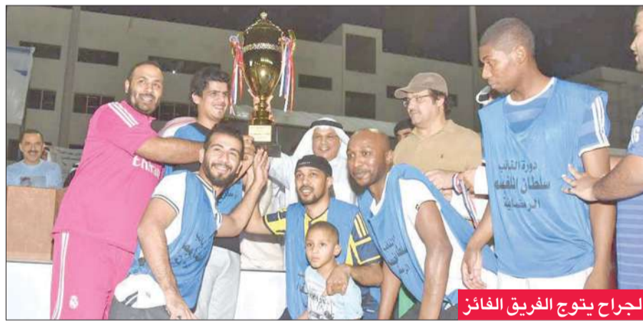
الجراح يتوج الفريق الفائز