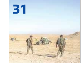
الحكومة البريطانية تتجه لضرب «داعش» في سورية