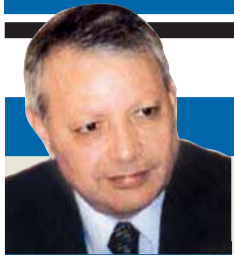
صالح القلاب كاتب وسياسي أردني