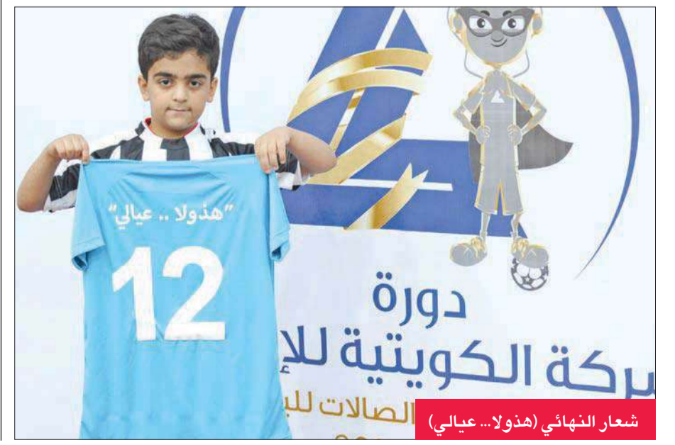
شعار النهائي (هدولا... عيالي)

كما حقق النادي خلال الموسم المنتهى الذي مثل بداية الفترة الرئاسية الثانية ببطولة كأس العهد، ووصيف دوري عبد اللطيف جميل