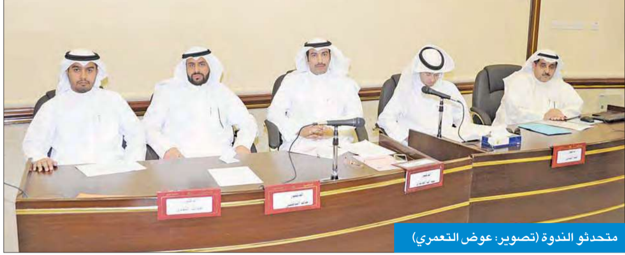
متحدثو الندوة

قالت الحجي إن جامعة الكويت بدأت في إنشاء مركز للوحدة الوطنية بها، مؤكدة أن وحدة أبناء الوطن ضرورية للحد من تفاقم الطائفية والقبلية داخل المجتمع.