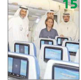
«الخطوط الكويتية» تتسلم الطائرة التاسعة «الفلناس»