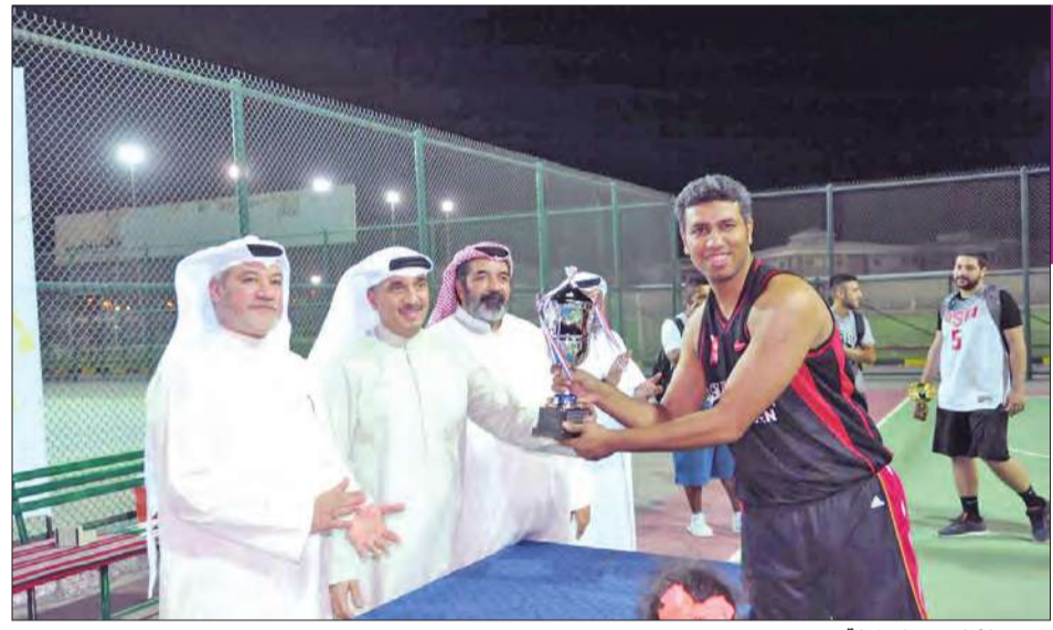
تكريم الفائزين بالبطولة