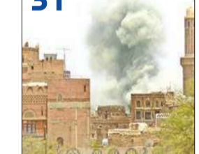
اليمن: هجوم واسع للمقاومة في عدن والأمم المتحدة ترفع «الطوارئ»