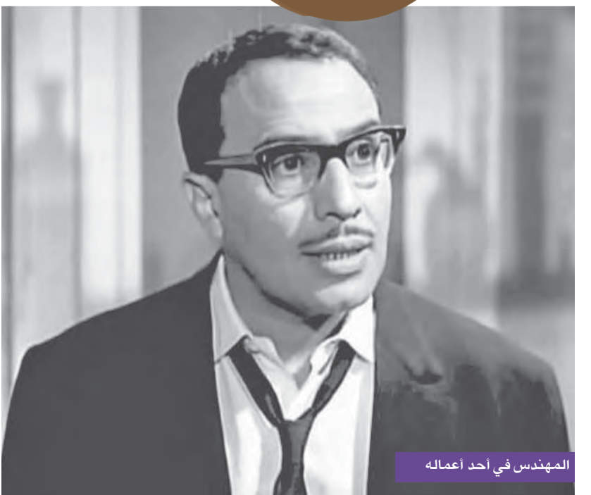
المهندس في أحد أعماله