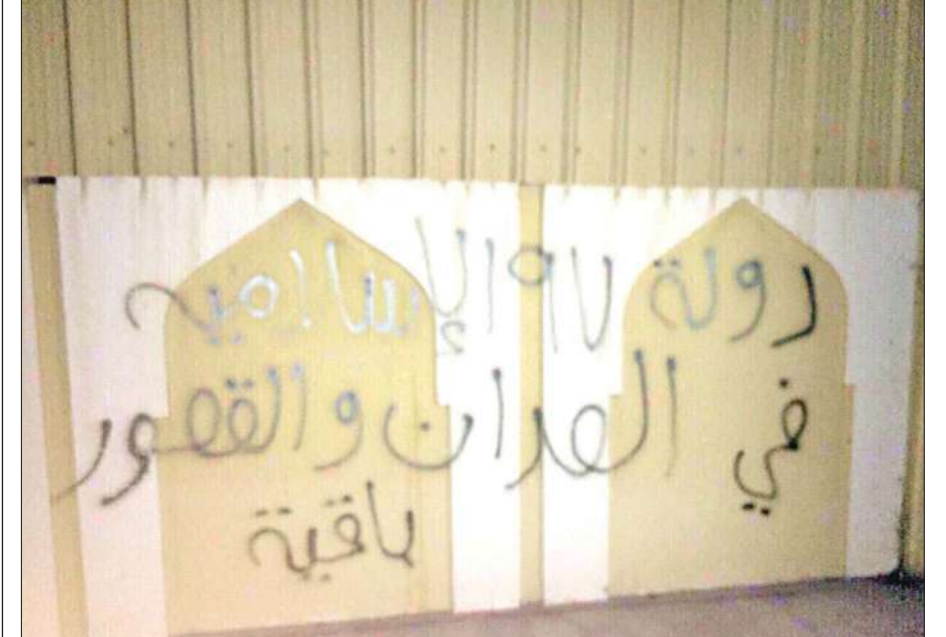
رسالة التهديد على سور المدرسة

أبلغ مواطن غرفة عمليات وزارة الداخلية مساء أمس الأول عن وجود رسالة تهديد مكتوبة على الكرسي الحامل للمصحف بأحد المساجد في منطقة العبدان بمحافظة مبارك الكبير، إضافة إلى رسالة تهديد أخرى مكتوبة على سور المدرسة المقابل للمسجد وتحمل شعار تنظيم "داعش" الإرهابي. وقال مصدر أمني لـ "الجريدة"، أنه فور تلقي البلاغ انتقل رجال الأمن