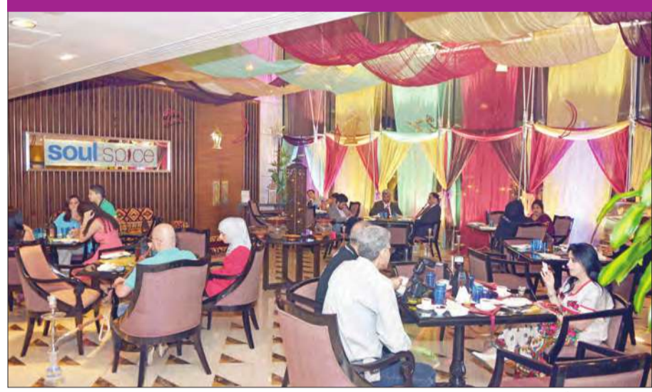
جانب من الغبة

أقام فندق كورت يارد ماريوت الراية غبة رمضانية لوسائل الإعلام بحضور عدد من المسؤولين والعاملين، واستمتع الحضور بالأجواء الأسرية الرمضانية مع ما تذوقوه من أطباق شرقية شهية أعدتها فريق من أمهر الطهاة.