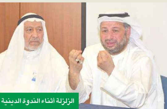
الندوة أثناء الندوة الدينية

الحضور استثمار هذا الشهر الكريم بالصورة التي تليق به كأفضل شهور السنة، وذلك