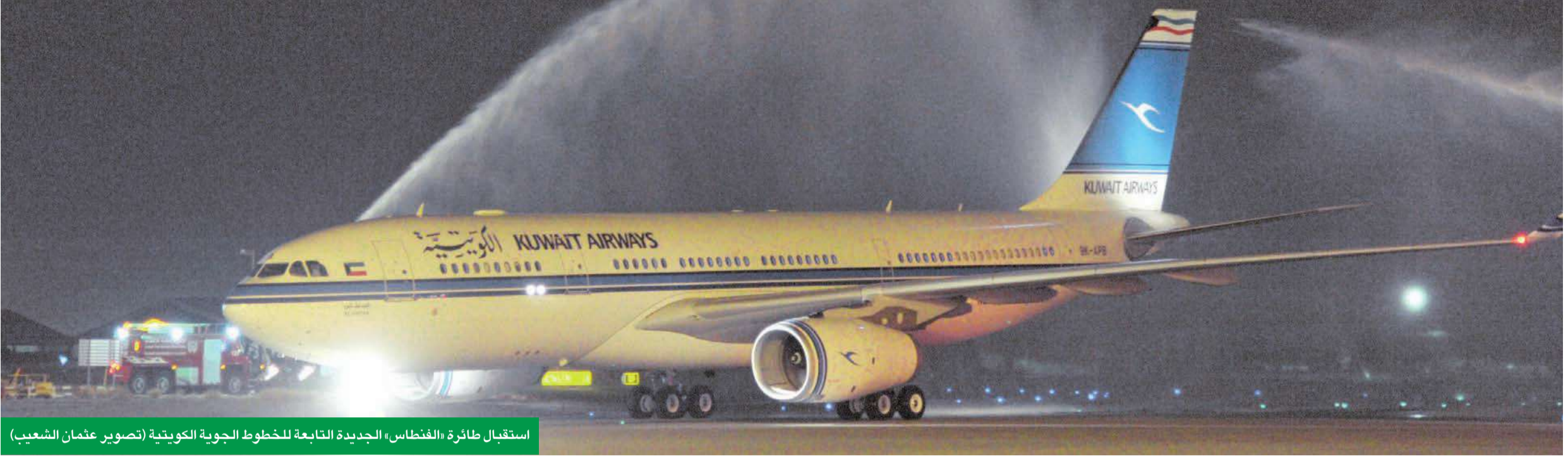
استقبال طائرة «الفنطاس» الجديدة التابعة للخطوط الجوية الكويتية

● الرومي: ندرس إنشاء مشروع متكامل لصيانة الطائرات ● الشرهان: التعاقد مع شركة تسويق لتقييم القديمة