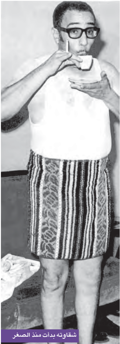
شقاوته بدأت منذ الصغر

وعلماً، ووسط ذهول الجميع، نزل فؤاد منصاعاً لأوامر والدته، فهو لم يجرؤ يوماً على عصيانها، ليعيش بعدها أسوأ ليلة ظلت تفاصيلها محفورة في ذاكرته ووجدانه.