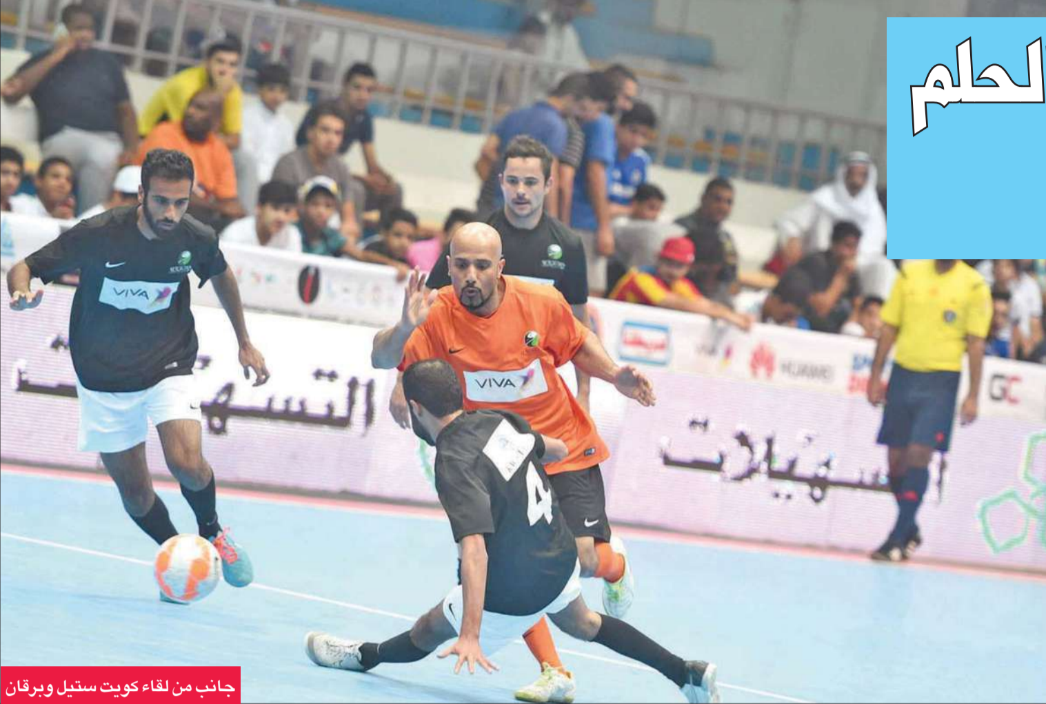
جانب من لقاء كويت ستيل وبرقان