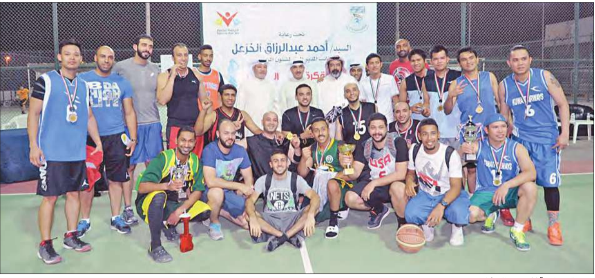
صورة جماعية للاعبين المشاركين