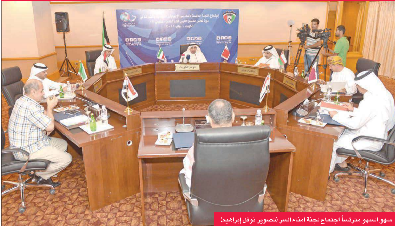
سهو السهو مترئساً اجتماع لجنة أمناء السه

عن استاذ جابر إذا رأت اللجنة صعوبة الانتهاء من تجهيزه في الوقت المحدد. وكانت اللجنة التي تفقدت الملعب طالبت بتعهده من الهيئة العامة للشباب والرياضة بتجهيز الملعب، وتلافي الملاحظات التي تم تحديدها في شهر مارس الماضي.