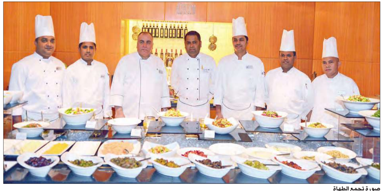
صورة تجميع الطهاة