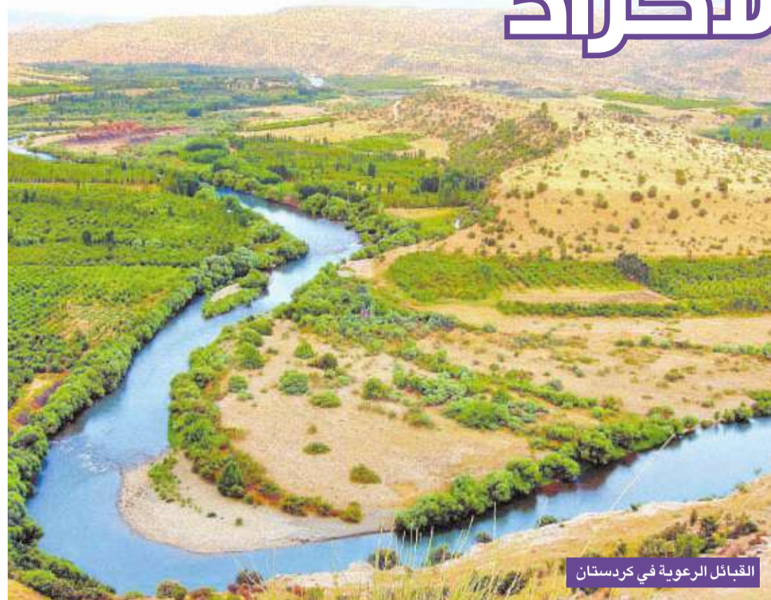
القبائل الرعوية في كردستان

في ذكارة الأيام حكايات للشعوب تناقلتها أجيالها، فيها من البساطة والأصالة والخصوصية ما يستحق أن يروى، وفيها لنا عبر ودروس ومواعظ تخرجنا من عصر السرعة والمادة والتعلق بأستار الرغبات وحطام الدنيا إلى مساحات واسعة من الخيال وفضاءات رحبة من التقرب إلى الله بنوايا صادقة. فللشعوب الإسلامية علاقة روحية بـرمضان، وعشق أزلي يتجدد باستمرار، تنتظره كل عام بشوق وفرح، ارتبطت به روحا وعائقة وجداناً، وكلها باختلاف ديارها وأصولها اتفقت عبادة واختلفت طابعا وعادات وسلوكاً. للجغرافيا والمجتمع والتاريخ آثارها في صياغة العقل الكلي وتكوين الإرث عبر السنين، ونحن في بحثنا هذا نحاول أن نعود بالزمن إلى الوراء، ونعيد الرحلة في اتجاه المناخ لأن ما تعيشه شعوب اليوم أتى من بعيد، فهناك ولدت الأسرار، نسافر من منطقة إلى أخرى نبحث عن أخبار رمضان في ذكارة الزمن الجميل وذاكرة الناس البسطاء، لننقل أخبارا بسيطة مثل اهلهما لكنها تخبرنا عن الجذور وعن التاريخ حين بدون برغبة صادقة للوصول إلى الحقيقة التي تنشر جميعها إلى نقاء العبادة والنفوس المملنة.