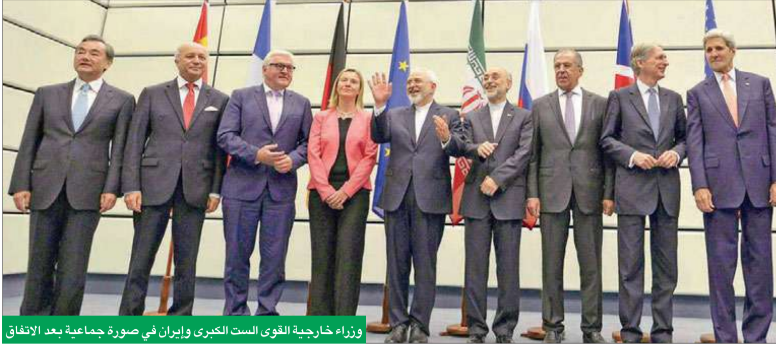
وزراء خارجية القوى الست الكبرى وإيران في صورة جماعية بعد الاتفاق

• فك تجميد مليارات الدولارات من أصول طهران بمقتضى الاتفاق وتخفيف العقوبات المفروضة • فابيووس: الشركات الفرنسية ستحصل على نصيب عادل في السوق الإيراني رغم موقفنا في المحادثات