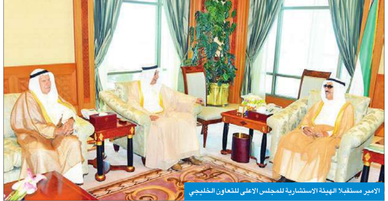
الأمير مستقبلاً الهيئة الاستشارية للمجلس الأعلى للتعاون الخليجي

ببرقية تهنئة إلى الرئيس فرانسوا هولاند رئيس الجمهورية الفرنسية الصديقة، عبر فيها سموه عن خالص تهنائه بمناسبة العيد الوطني لبلاده، متمنياً له موفور الصحة والعافية وللبلد الصديق دوام التقدم والازدهار.