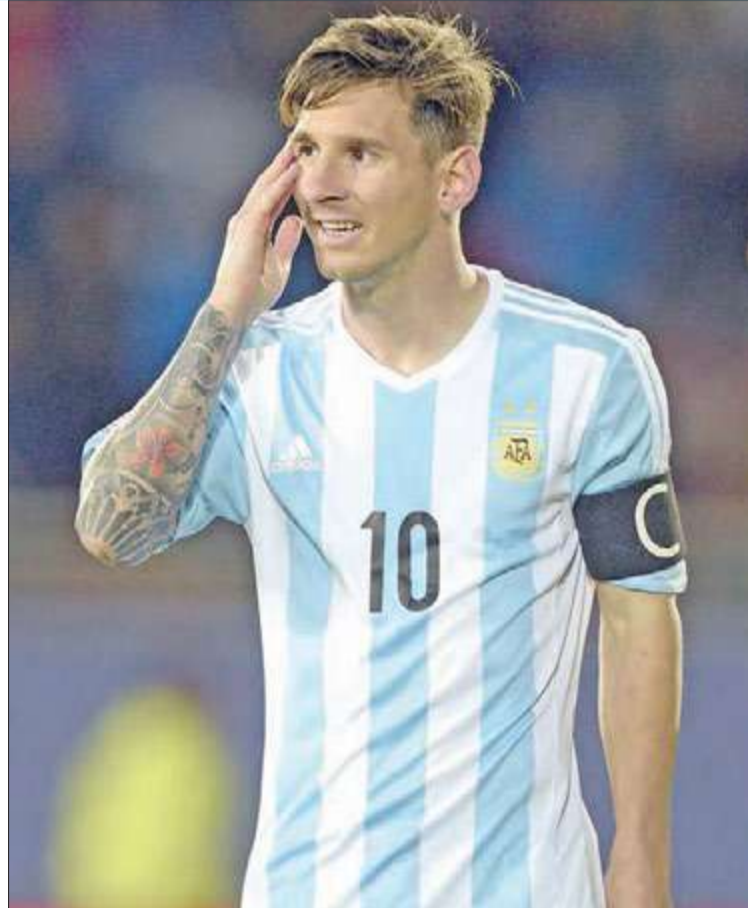
وتابع مارادونا الذي قاد المنتخب الأرجنتيني إلى دور الثمانية في مونديال جنوب أفريقيا 2010 قبل أن يخرج أمام المنتخب الألماني، قائلاً: