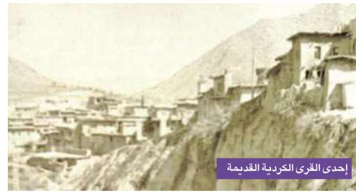
إحدى القرى الكردية القديمة

بالضائع، ومخازنها كانت مبنية من الطابوق والحجر الجبلي المنحوت بطريقة فنية جميلة. وقد أشارت السالنامات أو التراخيص التجارية العثمانية إلى أن المحلات والدكاكين في أسواق أربيل كانت تزيد على 640 محلاً وهو رقم كبير في ذلك الوقت ويشير إلى الأهمية الاقتصادية التجارية للمدينة، ويعتبر سوق القلعة أهم أسواق أربيل وكردستان قاطبة في الزمن الماضي حيث كانت محلاته تتقابل في صفين وتنفو على 400 محل ودكان، ويعتبر سوق القلعة أقدم أسواق كردستان جميعاً إذ بناه الملك مظفر الدين كوكبري في النصف الثاني من القرن الثاني عشر الميلادي، وهو سوق كبير جداً بمواصفات القرن التاسع عشر، والممر الضيق بين المحلات مسقوف بالوواح الخشب واليوارى، وكان أول السوق من جهة القلعة مخصصاً للملابس والأواني والأسلحة وسواد البناء، بينما كانت المحال الوسطى مخصصة للمتور والأرز والقمح والشاي والسكر والعسل والبهارات والدهون والقهوة والعلف والخمير من المواد الغذائية الأخرى