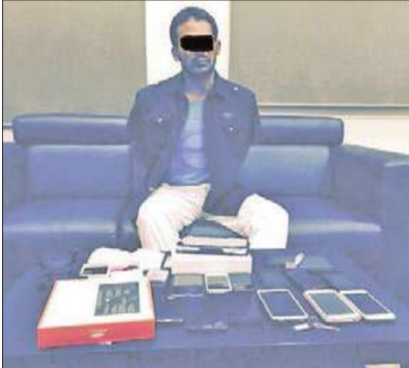
المتهم وأمامه المضبوطات

والذي تبين أنه مصري الجنسية دخل البلاد بسمة زيارة تجارية في تاريخ 24 يونيو الماضي، لافتاً إلى أن السارق اعترف أمام رجال الأمن بأنه منذ دخوله البلاد وهو يعمل على السرقة،