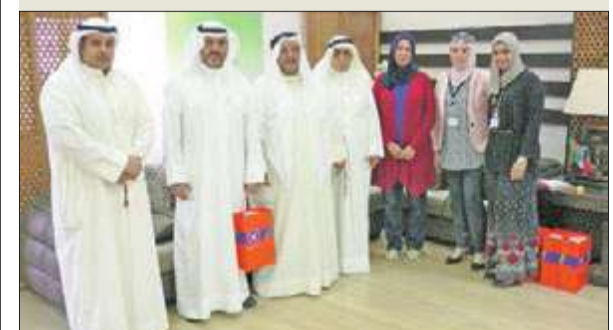
وفد المطاحن خلال زيارة المسنين

قام فريق العلاقات العامة لدى شركة مطاحن الدقيق والمخابز الكويتية بزيارة نزلاء دور رعاية المسنين، التابعة لوزارة الشؤون الاجتماعية والعمل، بهدف رسم البسمة على شفاههم، وإدخال السرور على قلوبهم، ومشاركتهم الاحتفال بالشهر الفضيل. وقدم فريق العلاقات العامة هدايا للنزلاء، ما يعكس روح الأسرة الواحدة وقيم المحبة والأخوة، مع تقديم أحر التمنيات بموفور الصحة والعافية لهم، واستمع إلى شرح وافٍ من قبل المشرفات والمشرفين في أدار عن الخدمات المتكاملة التي تقدمها.