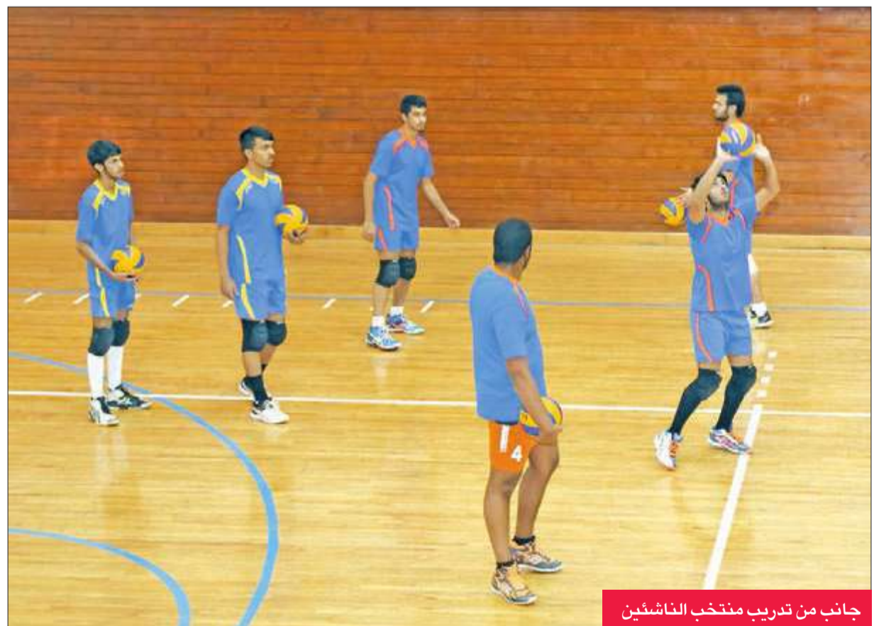
جانب من تدريب منتخب الناشئين

«الهيئة» تقلص مدة معسكره السلوفيني من 21 يوماً إلى 15