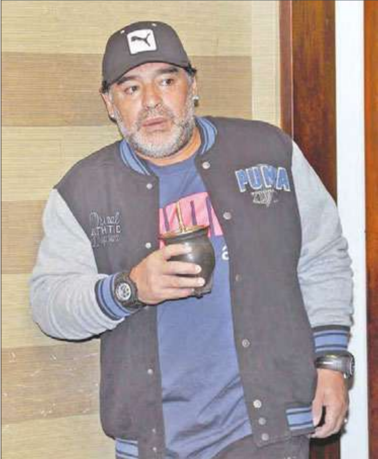
كيفية أو طريقة المشي وكيف تنطلق مسرعاً من السيارات لتساعد احد الزملاء. أنا لم أرى ميسي يتسكع كما يقول البعض.