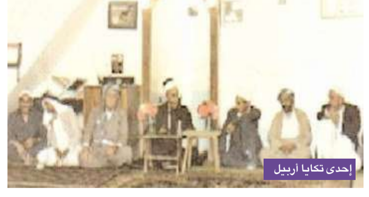
إحدى تكايا أربيل

ما إن تغرب شمس اليوم الأخير من شهر شعبان حتى يبدأ الكرد باستراق السمع لدوي مدفع رمضان المنصوب فوق قلعة أربيل أو المنصوب في مرتفعات دهبوك، وقد اعتاد الأكراد على سماع سبع طلقات مغزاهما أن المستهليل قد قرأوا الهلال وأن القاضي الشافعي أطمأن إلى شهادتهم، وقد اعتاد المستهلولون الأكراد في أواخر القرن التاسع عشر وأوائل القرن العشرين الخروج إلى المرتفعات والهضاب المجاورة يرافقهم بعض الوجوه ورجال الدين، وقد عرفت الأراضي الكردستانية بصفاء جوها وإمكانية الرؤية في موسمي الصيف والخريف، وأما في فصل الشتاء على وجه الخصوص فكانت الأجواء في الغالب غائمة مطيرة وإمكانية الرؤية شبه منعدمة، لذا تراهم في الغالب قد غم عليهم رؤية الهلال فيكمولوا عدة شعبان، أما إذا زاوه فإن تباشير الفرح تزع أرجاء أربيل وكردستان وقد تهبها الناس للشهر وتجهزوا.