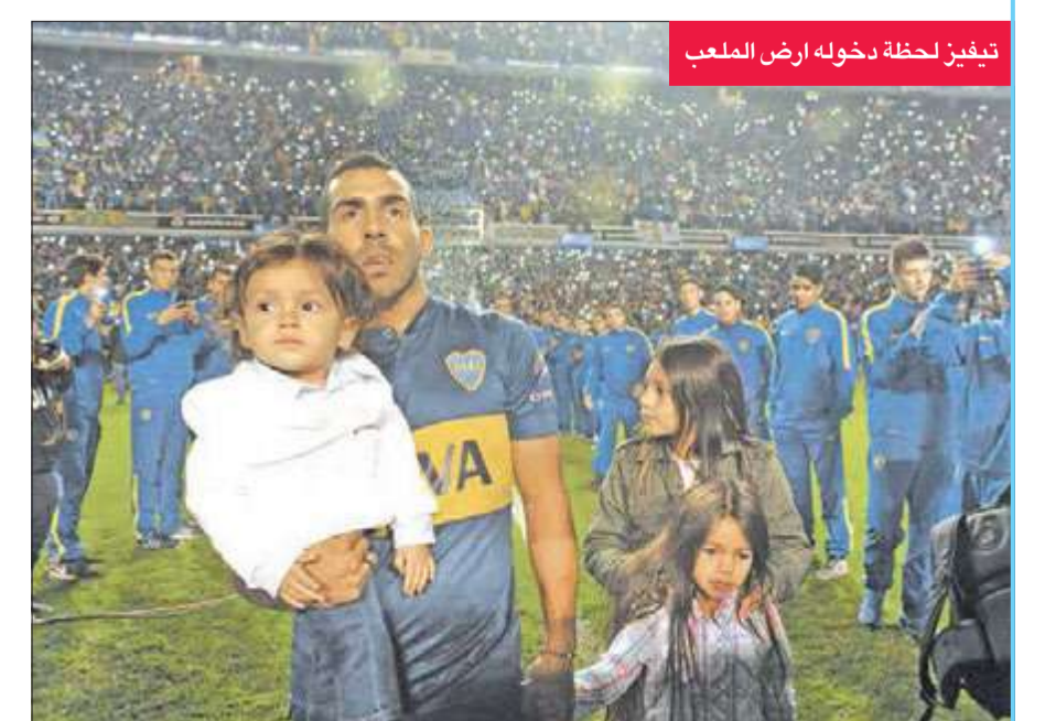
تيفيز لحظة دخوله أرض الملعب

قدم نادي بوكا جونيورز الأرجنتيني لكرة القدم لاعبه الجديد (القديم)، المهاجم كارلوس تيفيز بحضور الأسطورة ديفغو ارماندو مارادونا و50 ألف متابع.