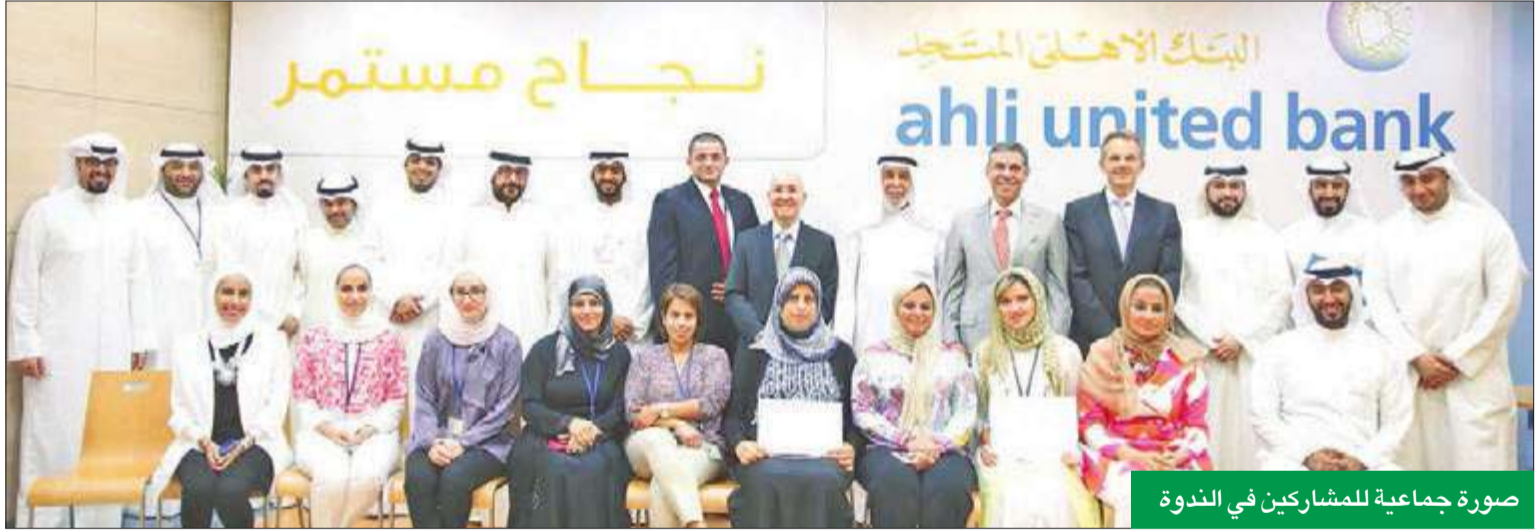
صورة جماعية للمشاركين في الندوة

مع هذه الأيام من شهر رمضان الفضيل. ويهذه المناسبة قال البنك الأهلي المتحد في بيان صحفي: «يسعدنا نجاح هذه الندوة القيمة التي تعتبر ختام البرنامج الحافل