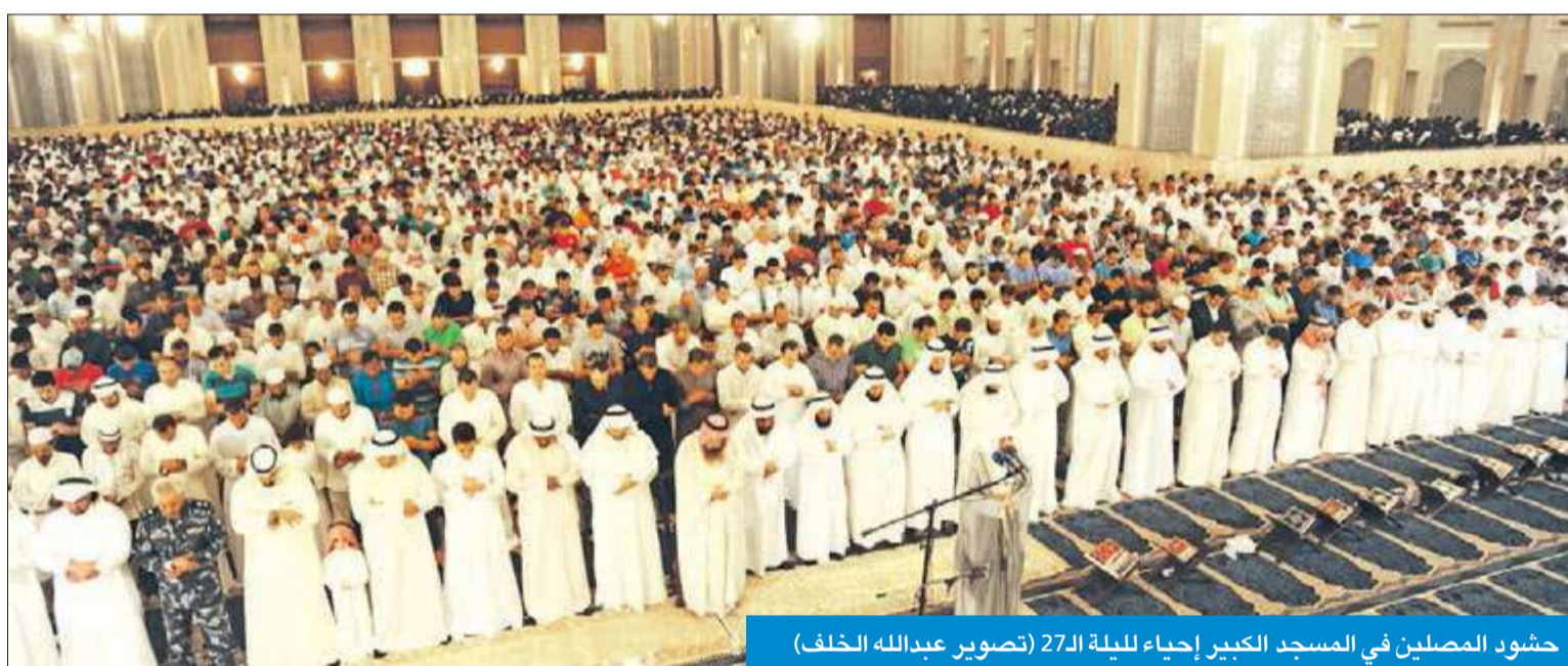
حشود المصلين في المسجد الكبير إحياء ليلة القدر

الفلاح: استراتيجية «الأوقاف» تحول دون استغلال الإرهابيين الحاجات الدينية للناس