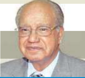
بقلم عبدالله النجار