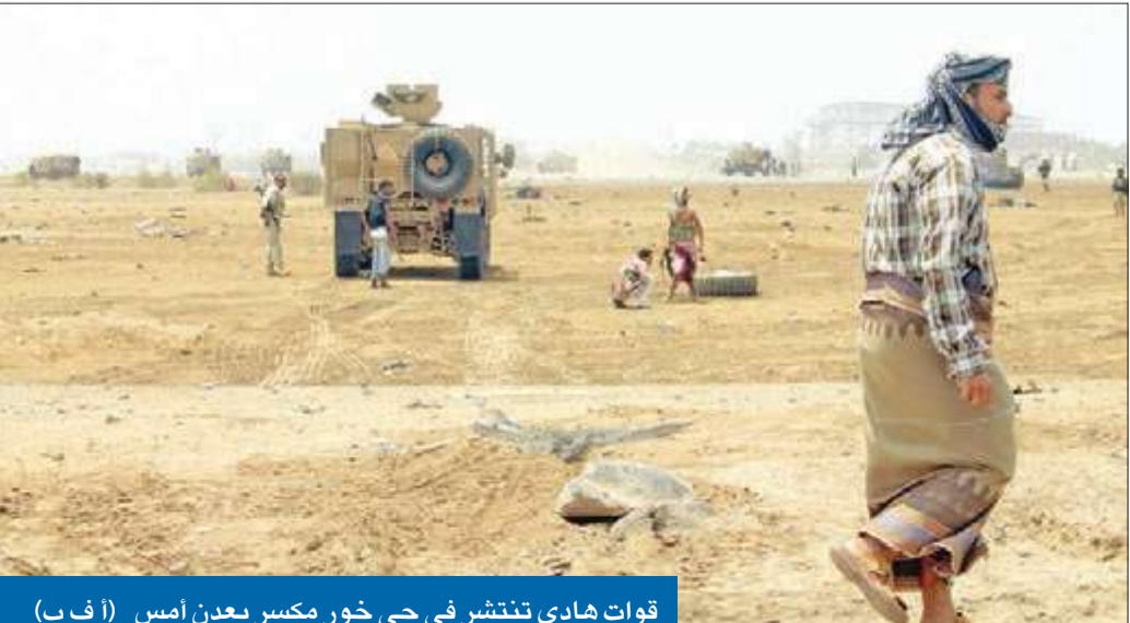
قوات هادي تنتشر في حي خور مكسر بعدن أمس

حققت المقاومة الشعبية، التي تضم الفصائل الموالية للرئيس اليمني المعترف به دولياً عبدربه منصور هادي، أكبر إنجاز على الأرض منذ استيلاء جماعة الحوثي على صنعاء، بتمكنها أمس من السيطرة على مطار عدن وأجزاء أخرى، في إطار عملية عسكرية يدعمها التحالف العربي لطرد الميليشيات المتمردة من المدينة الجنوبية. ووفق مصادر يمنية سياسية وعسكرية من معسكر هادي، فإن قوات مدنية في السعودية شاركت في القتال الدائر على الأرض ضمن عملية برية وجوية وبحرية تشارك فيها مقاتلات وبارجات التحالف باسم «السهم الذهبي». وفور انطلاقها، استعادت المقاومة الشعبية مطار عدن بالكامل وأجزاء واسعة من حي خور مكسر، بعد مواجهات عنيفة مع الحوثيين وقوات صالح خلفت عشرات القتلى والجرحى، كما تمكنت من إخراج الحوثيين وقوات صالح من مناطق جزيرة العمال وساحة العروض ومعسكر بدر وحى القنصليات ومبنى كلية التربية، وهي مواقع داخل حي خور مكسر الرئيسي في وسط عدن. صنعاء، عدن - أ ف ب، رويترز 34+