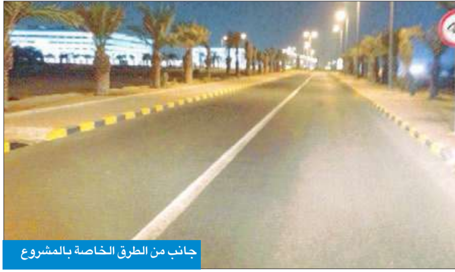
جانب من الطرق الخاصة بالمشروع