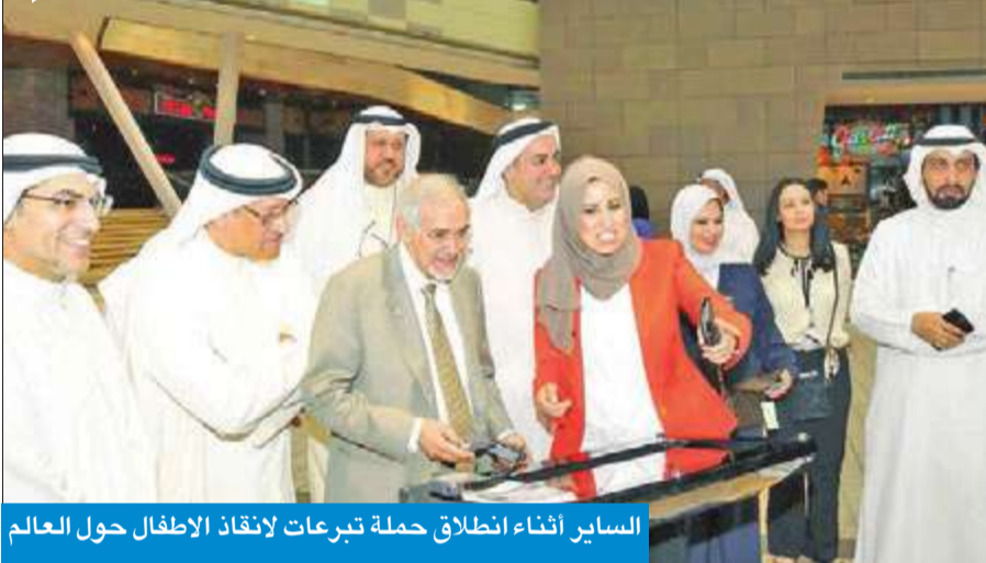
الساير أثناء انطلاق حملة تبرعات لإنقاذ الأطفال حول العالم

أطلقت جمعية الهلال الأحمر الكويتي، أمس في مجمع الأبنون، حملة تبرعات لإنقاذ الأطفال المتضررين من الكوارث الطبيعية والحروب والنزاعات المسلحة حول العالم.