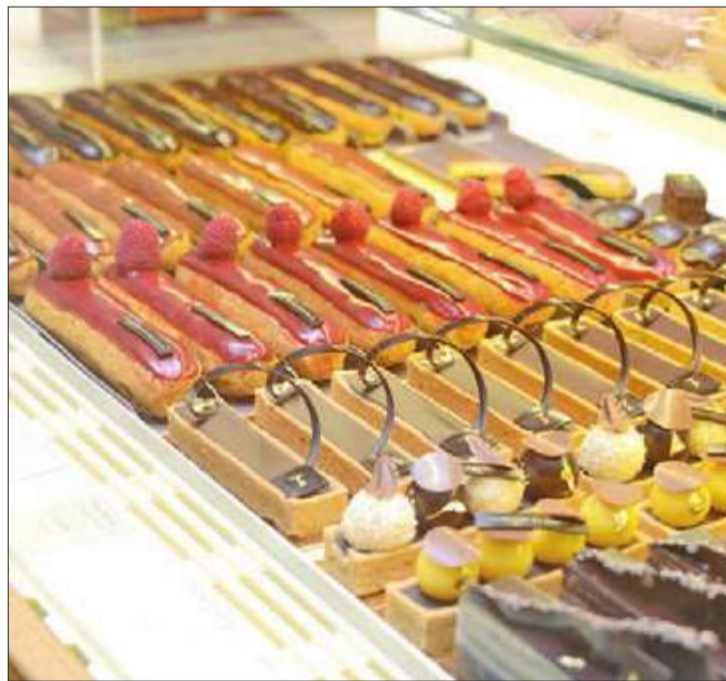
حلوليات مميزة من «لاميزون دو شوكولا»