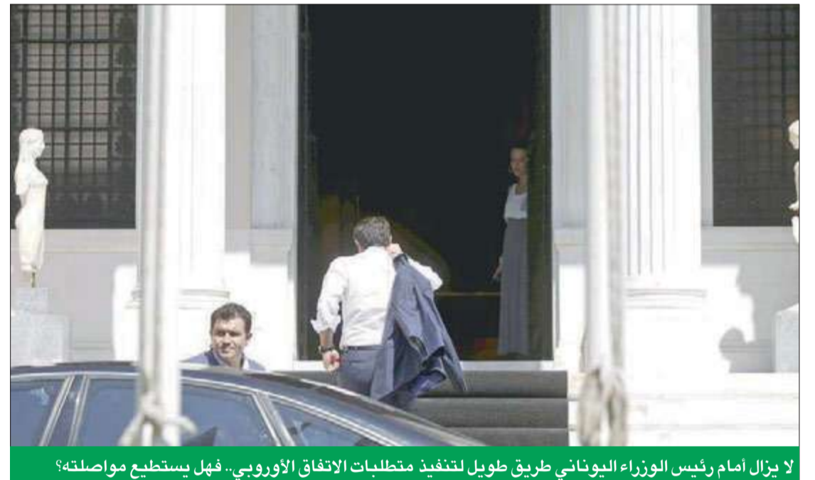
لا يزال أمام رئيس الوزراء اليوناني طريق طويل لتنفيذ متطلبات الاتفاق الأوروبي.. فهل يستطيع مواصلته؟

وستقرر رسميا بدء المحادثات بشأن اتفاق الإنقاذ الجديد الذي ستدور قيمته بين 82 و86 مليار دولار مطلع الأسبوع المقبل، بشرط أن يقر برلمان اليونان سلسلة قوانين بحلول مساء الأربعاء لإدلاء استعداده للقيام بإصلاحات، لكن محادثات الإنقاذ التالية ستستغرق نحو أربعة أسابيع، وهو ما يستلزم تمويلًا مؤقتًا لتغطية حاجات آتية في تلك الأثناء. وقال رئيس مجلس وزراء مالية اليورو، يروين ديسبلوم، في مؤتمر صحفي: "نظرا في مسألة التمويل المؤقت، لأن هناك حاجات ملحة وعملية وضع للمسات الأخيرة على الاتفاق ستستغرق وقتا". وأضاف: "إنها عملية بالغة التعقيد، فقد نظرتنا في عدد من الاحتمالات، لكن هناك