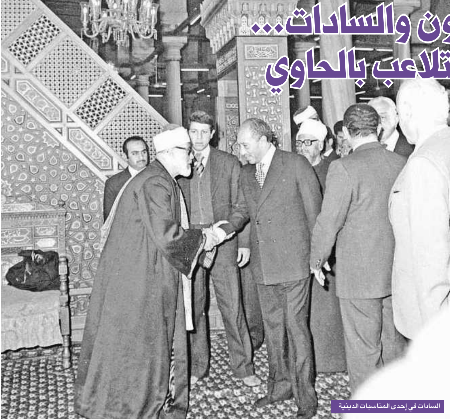
السادات في إحدى المناسبات الدينية

تعد قضية اغتيال الرئيس المصري الأسبق محمد أنور السادات في أكتوبر 1981، قمة المأساة، وذروة فصول رواية العنف والدم والإرهاب في مصر، فكل ما جرته أفكار التكفير والجهاد ضد الدولة المصرية، تحت شعارات جاهلية المجتمع المعاصر، كانت خطوط الأزمة تتجمع، ساعد السادات في الوصول إلى لحظة الانفجار سريعاً، مرة بالتحالف مع الإسلاميين ومرة أخرى بالمضي قدماً في سلام منفرد مع إسرائيل. تقدم الرئيس السادات المصفوف، يحتفي بذكرى انتصاره على إسرائيل في 6 أكتوبر 1973، لم يكن يشغل باله