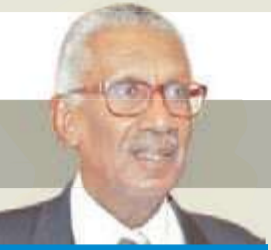
بقلم د. أحمد الخطيب

وفي هذا الصدد، أي المروحة عند 60 دولاراً، أقل أو أكثر، يعود ذلك لاستقرار إنتاج النفط الصخري، الذي أصبح في تقدير الخبراء النفط المرجح، أي يزيد إنتاجه عند حوالي سعر 60 دولاراً، وينخفض إذا انخفض السعر عن ذلك، وهذا التحرك يحفظ توازن السوق، ولكن عند مستوى أسعار منخفضة لا تتجاوز 60 إلى 65 دولاراً، الرؤية والقدرة والإرادة.