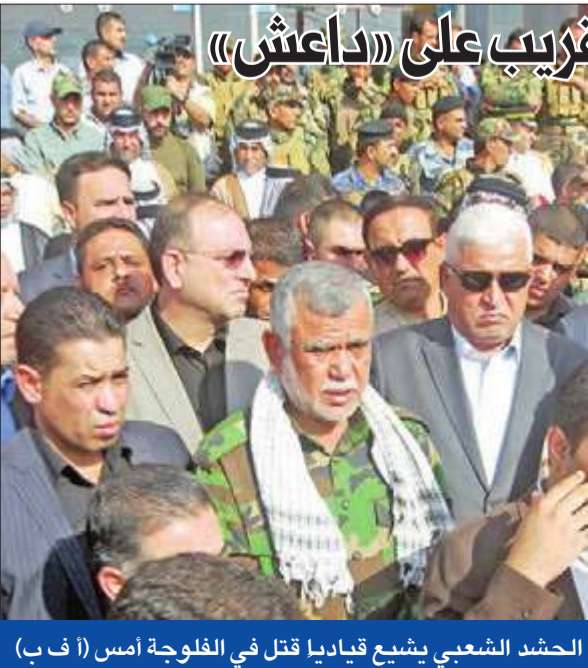
الحشد الشعبي يشيع قيادياً قتل في الفلوجة أمس

مقاتلة وطائرات بدون طيار. وأضاف أن معظم الضعف كان قرب الرمادي، واستهدف مواقع «داعش»، وجرافات وحاملة أفراد مدرة ومركبة أخرى، كما شن التحالف غارات جوية أخرى في العراق قرب الحويجة والحباتية وهيته ومخمور وسنجار وتلعفر.