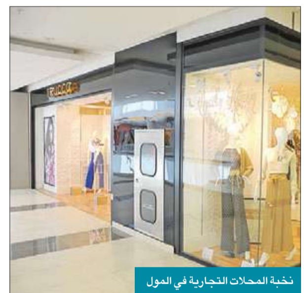
تخبة المحلات التجارية في المول