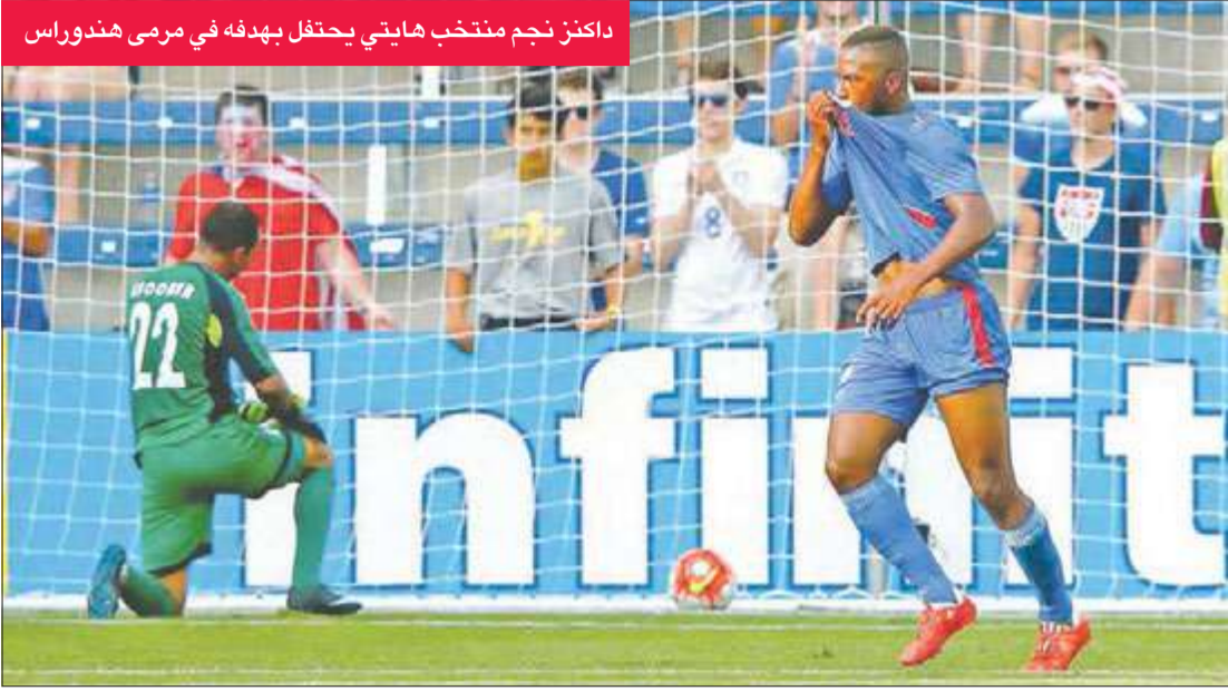
داكنز نجم منتخب هايتي يحتفل بهدفه في مرمى هندوراس

فقط)، والثالثة ترينيداد وتوباغو وغواتيمالا والمكسيك وكوبا. ويتأهل لربع النهائي الأول والثاني في كل مجموعة مع أفضل منتخبين في المركز الثالث. وسيقابل المنتخب الأميركي في ربع النهائي أحد المنتخبين اللذين يحتلان المركز الثالث عن المجموعتين الثانية أو الثالثة، بينما تلعب هايتي مع ثاني المجموعة الثانية. وضمن منتخب ترينيداد وتوباغو عن المجموعة الثالثة تأهله لربع النهائي أيضا. واحتكرت المكسيك والولايات المتحدة القاب البطولة بفوزهما في 11 لقبا من أصل 12، واللقب الوحيد الذي أفلت منهما كان لمصلحة كندا في نسخة 2000.