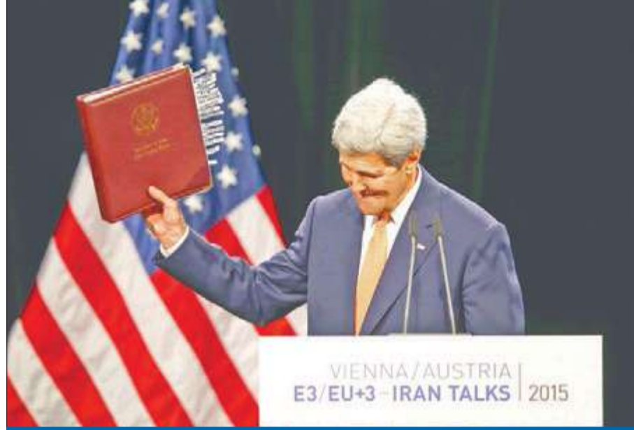
وزير الخارجية الأمريكي جون كيري يرفع وثيقة الاتفاق في نهاية مؤتمر الصحافي في فيينا أمس

إيران تخلت عن «الخطوط الحمر» لخامنئي وقبلة رقابة نووية صارمة على مدار الساعة • أوباما: اتفاق فيينا قائم على التحقق لا الثقة • روحاني: الاتفاق نصر للطرفين • عقوبات الحرس الثوري مستمرة... ورفع الحظر عن السلاح من أول الإجراءات