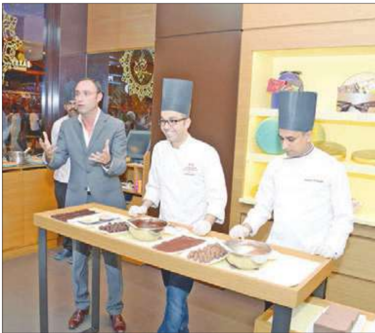
«شيفات» لاميزون دو شوكولا أثناء تحضيرهم الشوكولاتة

احتفل «لاميزون دو شوكولا» بعامه الأول في غراند أفنيو، برعاية وحضور سفير فرنسا لدى الكويت كريستيان نخلة، ونخبة من كبار الزوار والإعلاميين. ويقدم «لاميزون دو شوكولا»، 30 وصفة من «بنون» الشوكولاتة بمجموعة متنوعة من «الجاناش» العادي و«الجاناش» بالفاكهة والتوابل و«البرلين» باللوز في شوكولاتة داكنة أو بالحليب.