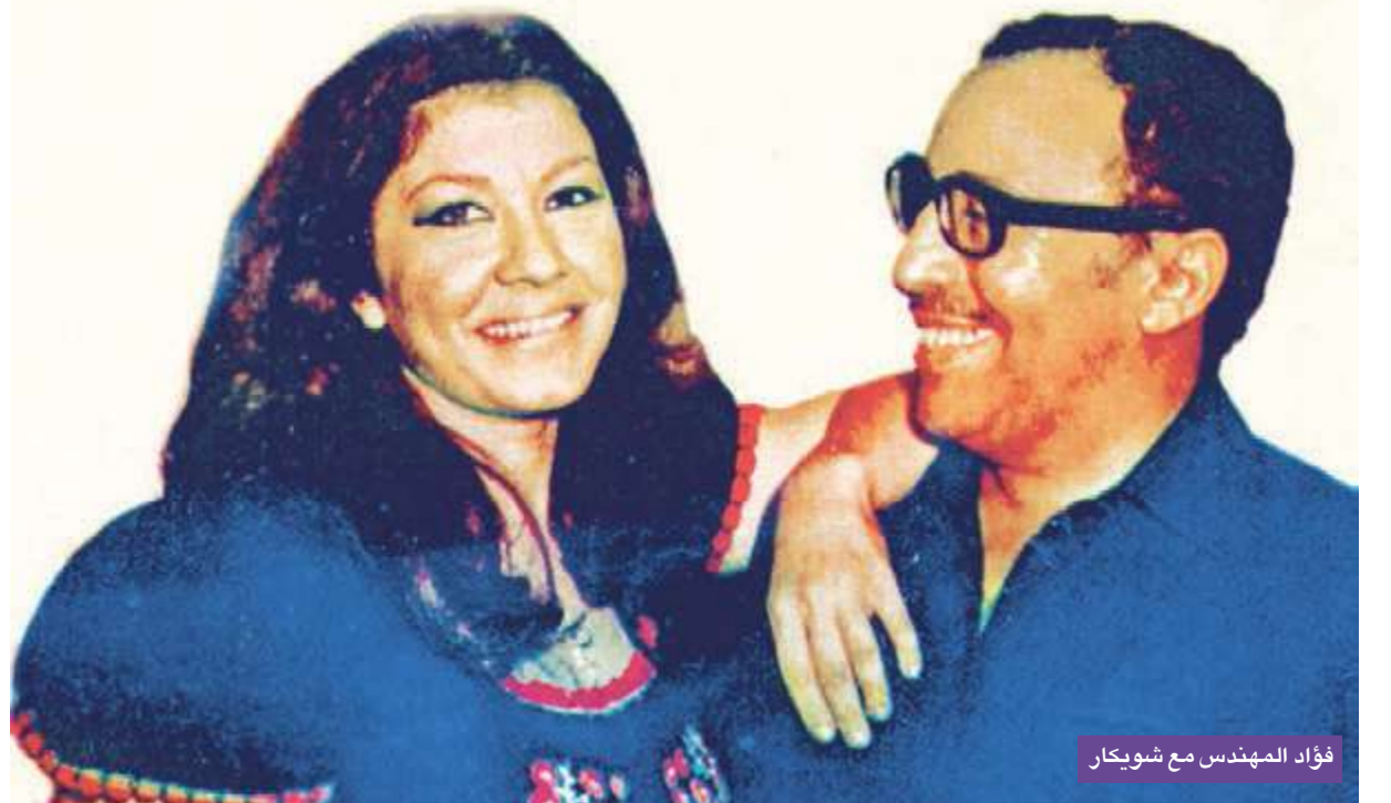
فؤاد المهندس مع شويكار

باتهم بسموونه وأن ما بقوله لا يصح بحق إبطال العمل. لكنه زاد من تعليقاته السخيفة، ما جعل الجمهور ينتبه له، فقصص فريق العمل بتعبيه مجدداً لكنه لم يصمت مما دفع فؤاد إلى الصمت والإشارة إلى أمينة وشويكار بالصمت احتجاجاً على تعليقاته. تحرك فؤاد باتجاه الجمهور وتبعته شويكار وأمينة وقاموا بتكيس رؤسهم على المسرح، فما كان من المشاهدين إلا أن توجهوا إليه وأجبروه على مغادرة القاعة بهدوء بعدها تابع فؤاد العرض بشكل طبيعي ومن الموقف من دون مشاكل. وعلم المهندس بعد العرض أن المشاهد لم يكن مصرياً ولم يكن في حالته الطبيعية بسبب تناوله الخمر.