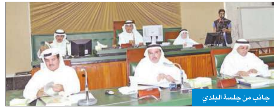
جانب من جلسة البلدي

وافق المجلس البلدي في جلسته الختامية لدور الانعقاد الحالي على الاشتراطات والمواصفات الخاصة بأبنية المشاريع المتكاملة والمتميزة للمجاورة السكنية الاستثمارية المقامة في مناطق السكن الاستثماري، شريطة ألا تقل صافي مساحة القسائم التنظيمية للمشروع بعد تنظيمها عن 50 ألف