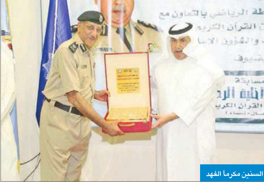
السنين مكرماً الفهد

برعاية وحضور الفريق الفهد والوكيل الفلاح