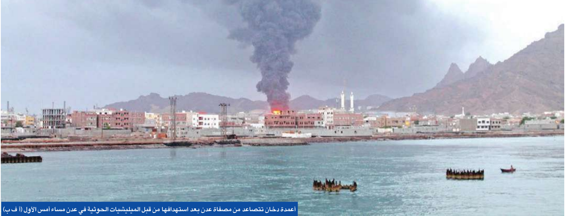
أعمدة دخان تتصاعد من مصفاة عدن بعد استهدافها من قبل الميليشيات الحوثية في عدن مساء أمس الأول

انطلقت عملية عسكرية واسعة تحت اسم «السهم الذهبي» بإشراف الرئاسة اليمنية ودعم التحالف العربي بقيادة السعودية لتحرير مدينة عدن من الحوثيين والقوات الموالية للرئيس المخلوخ علي صالح.