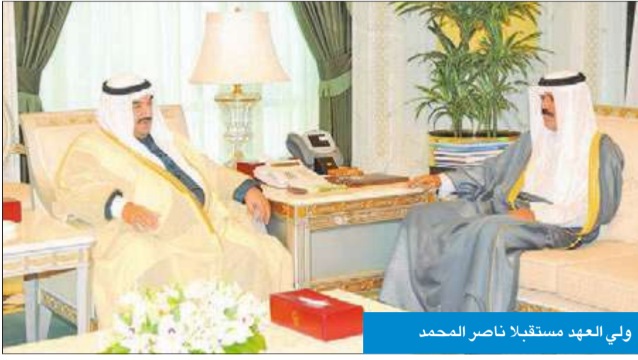
ولي العهد مستقبلاً ناصر المحمد

استقبل سمو ولي العهد الشيخ نواف الأحمد في قصر السيف صباح أمس الشيخ ناصر المحمد. واستقبل سموه الشيخ د. إبراهيم الدعيج، ثم عميد كلية الشريعة والدراسات الإسلامية السابق د. محمد الطبطبائي.