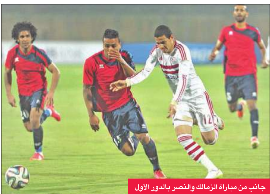
جانب من مباراة الزمالك والنصر بالدور الأول