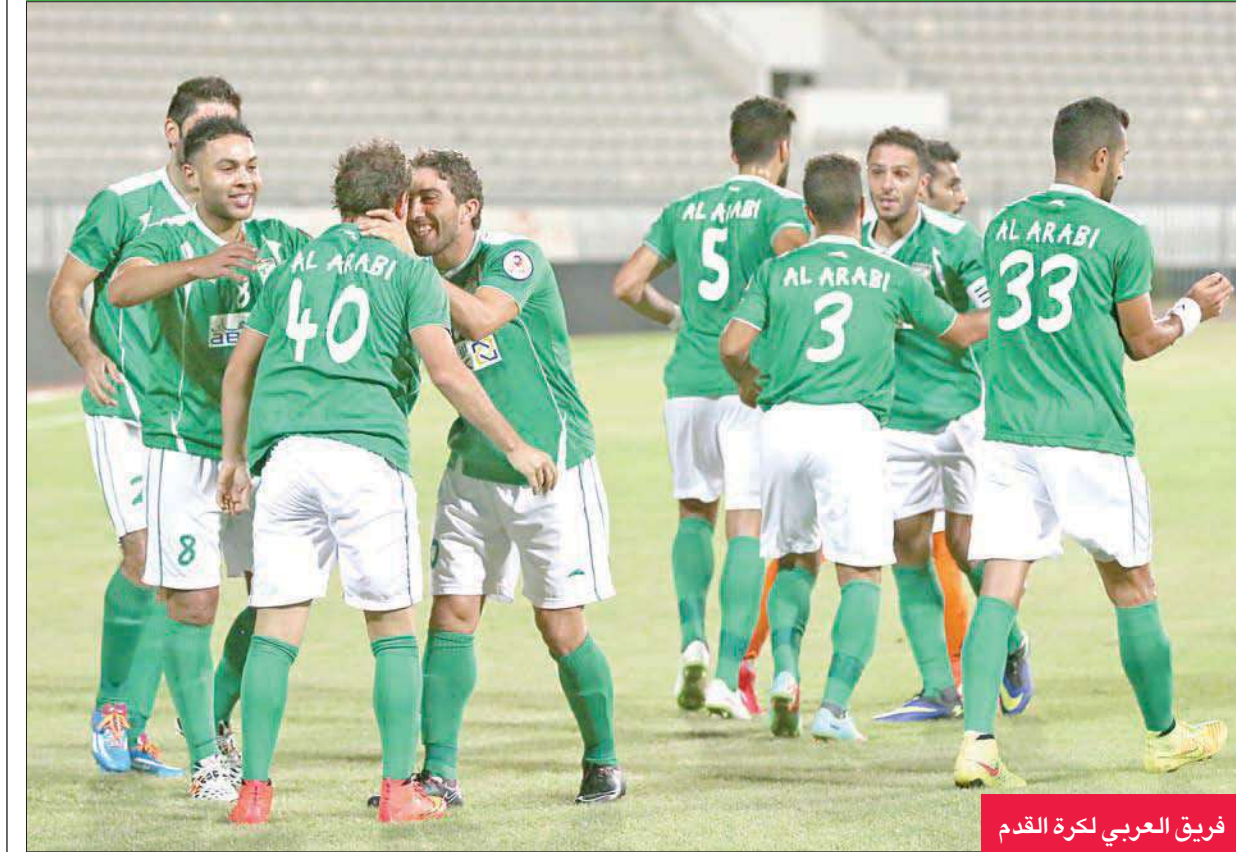
فريق العربي لكرة القدم