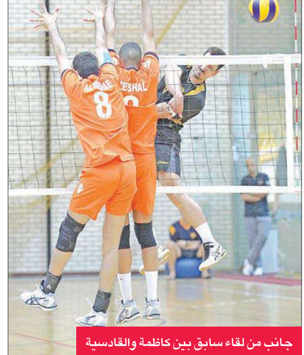
جانب من لقاء سابق بين كازمة والقادسية