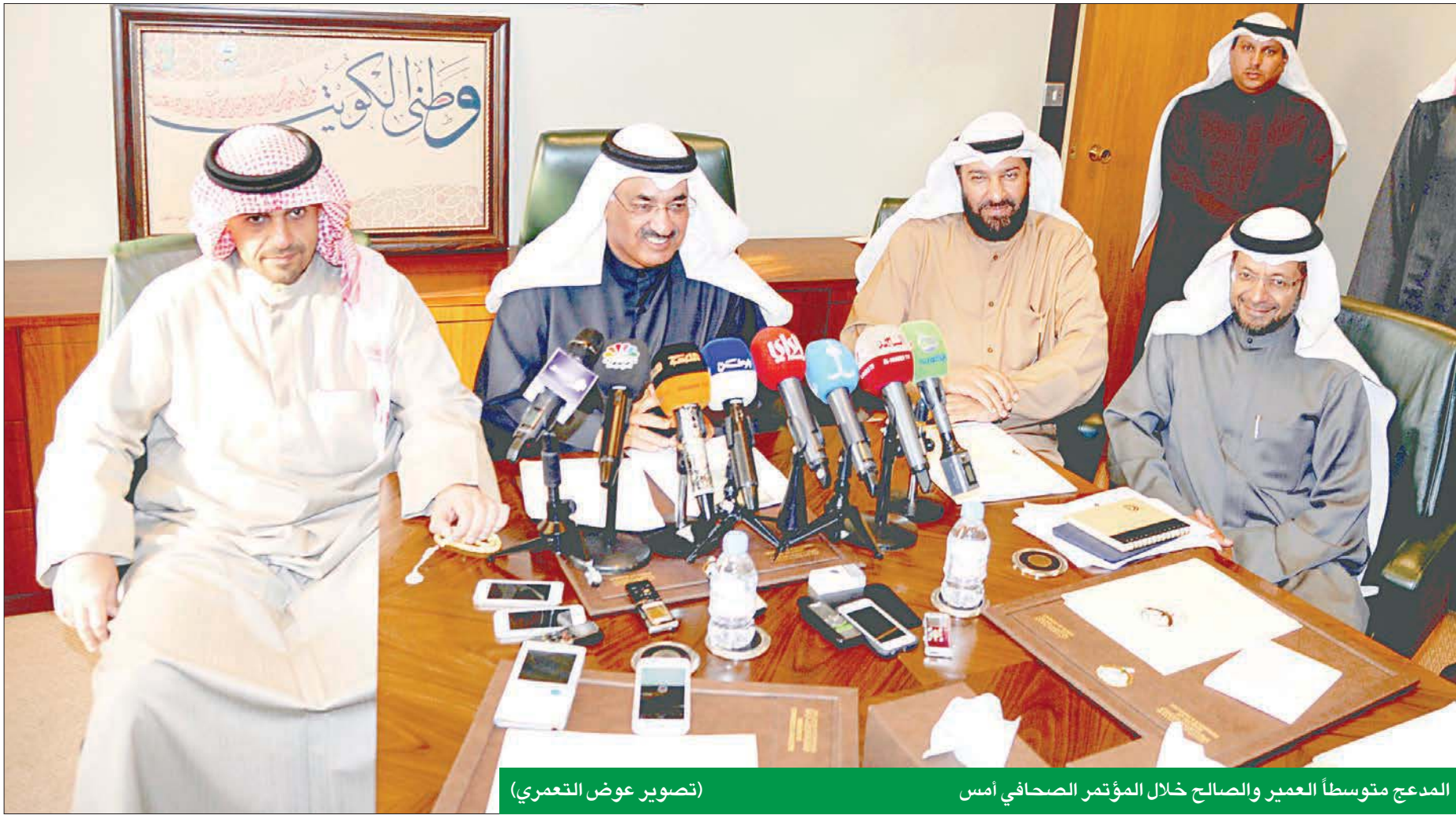
المدعج متوسلاً للعمير والصالح خلال المؤتمر الصحافي أمس

ذكر الوزير الصالح أن الحكومة تداركت ارتفاع الأسعار، وجرار دراسة تداعياتها حتى لا يقع أي ضرر على المستهلك الكويتي، مشيراً إلى أن الهدف من القرار توجيه الدعم لمستحقيه، وتجنب الهدر في مواد الطاقة. أكد نائب رئيس مجلس الوزراء وزير التجارة والصناعة د. عبدالمحسن المدعج أن وزارة التجارة المعنية بضبط الأسعار وقمع الزيادات غير المبررة، حيث إنها مارست دورها وضبطت الأسعار خلال الأيام الماضية، المصانغ الذين رفعوا الأسعار خلال الأيام الماضية، وتعمل على إحالتهم إلى النيابة للتحقيق معهم، وقد يصل الأمر إلى سحب رخصة المنشأة، مؤكداً أن الوزارة ستطبق القانون على الجميع. جاء ذلك خلال المؤتمر الصحافي الذي عقد أمس بحضور وزير المالية انس الصالح ووزير النفط علي العمير، لمناقشة تداعيات رفع الدعم جزئياً عن بعض المحروقات، وأثره على السوق المحلي. وأوضح المدعج أن ما حدث خلال الأيام الثلاثة الماضية أمر طبيعي ومتوقع، لإسبما مع بدء قرار رفع الدعم عن الديزل الذي بدأ تنفيذه في بداية العام الجاري، مشيراً إلى أن «التجارة» تراقب الأسواق المحلية، والكثير من الدول المحيطة بنا تحسناً على رخص الأسعار في بعض المنتجات.