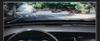
شاشة عرض المعلومات عن الزجاج الأمامي