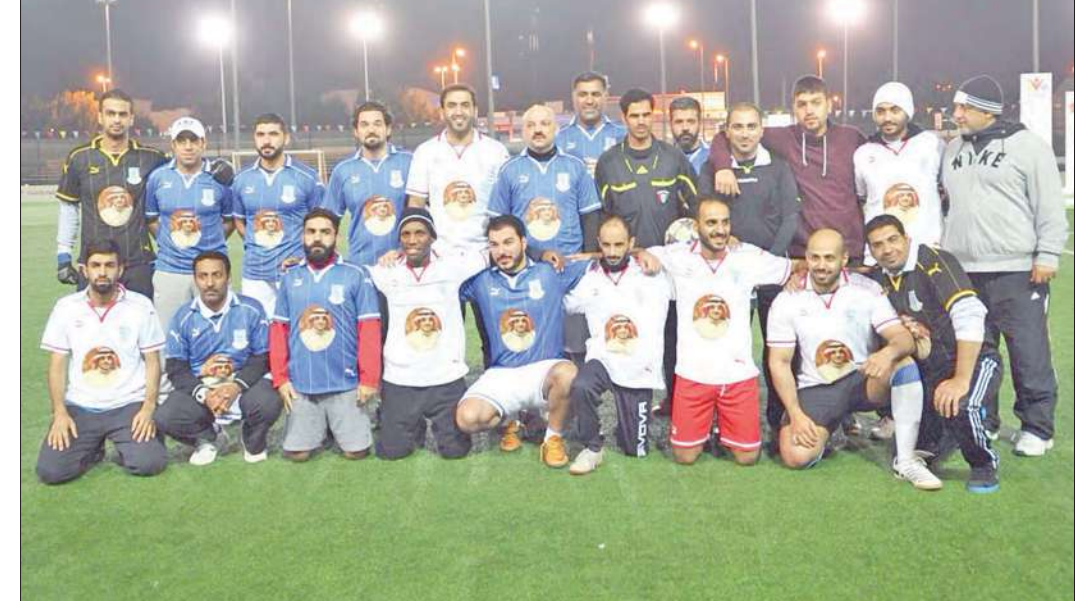
صورة جماعية للاعبين

ووفق فريق الشؤون الإدارية المركز الثاني، بينما حصد فريق إدارة الرياضة للجمع المركز الثالث.