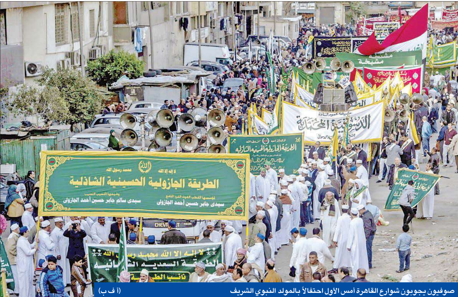
صوفيون يجوبون شوارع القاهرة أمس الأول احتفالاً بالمولد النبوي الشريف

• «أنصار الشريعة» تريد جهاديين • التحفظ على أموال 3 يساريين • الانتخابات تنتظر «المحافظين»