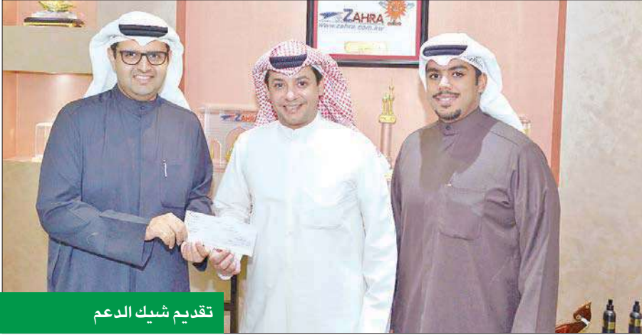
تقديم شيك الدعم

النفع العام، ويستفيد منها قطاع كبير من المواطنين. يذكر أن «بوبيان» يعتبر من أكثر البنوك المحلية دعماً لأنشطة وفعاليات الجمعيات التعاونية، إيماناً منه بالدور الذي تقوم به في المجتمع الكويتي.