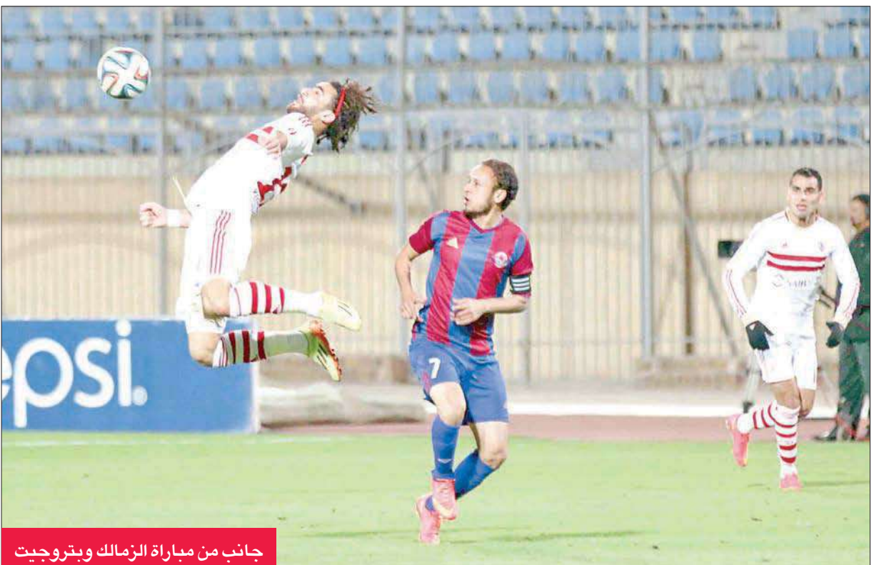
جانب من مباراة الزمالك وبتروجيت