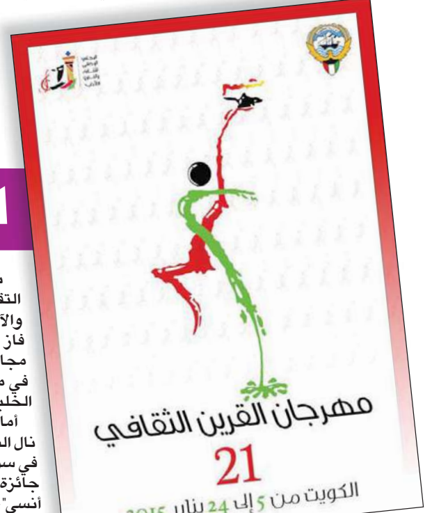
مهرجان القرين الثقافي 21 الكويت من 5 إلى 24 يناير 2015