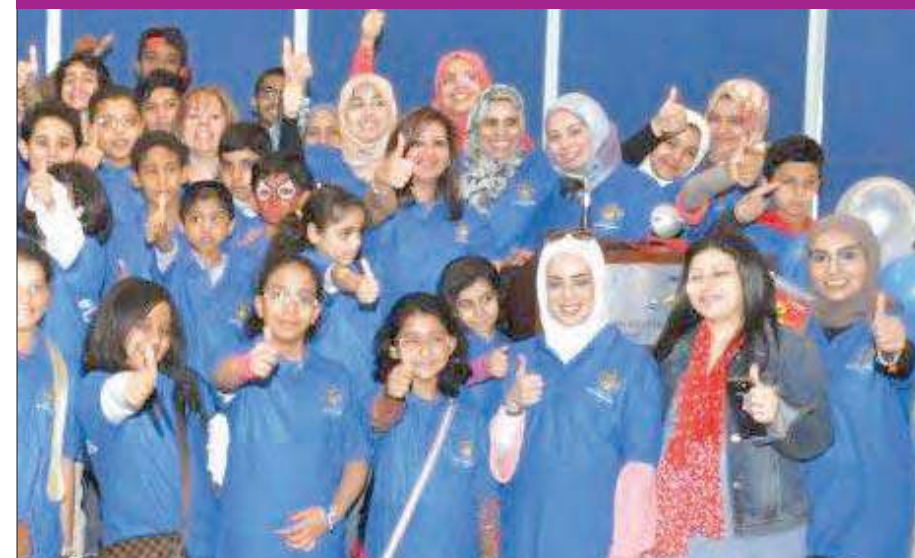
المشاركون في الفعالية

أقام معهد دسمان للمسكري مناسبة صحية خاصة لأطفال وشباب السكري المستخدمين لمضخة الأنسولين، بالتعاون مع الشركة الرائدة في مجال مضخة الأنسولين ميدترونيك، وبمشاركة 40 شابا وشابة من مختلف الأعمار، و20 من الأمهات.