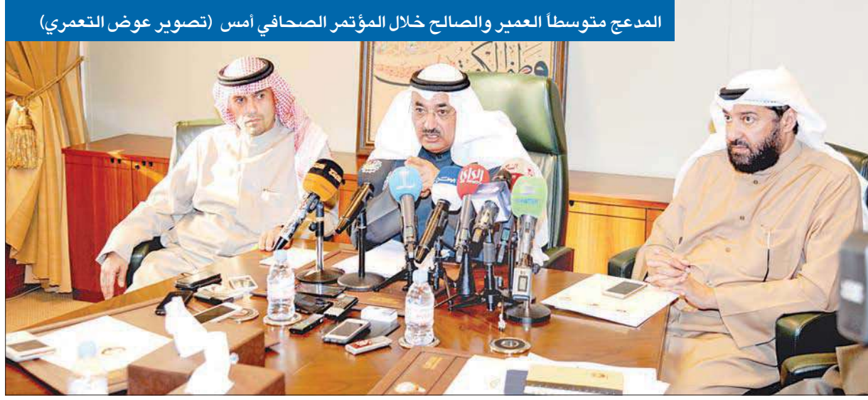
المدعج متوسطا العمير والصالح خلال المؤتمر الصحفي أمس

أكد نائب رئيس مجلس الوزراء وزير التجارة والصناعة د. عبدالمحسن المدعج أن الوزارة المعنية بضبط الأسعار وقمع الزيادات غير المبررة، مبيّناً أنها مارست دورها وضبطت المخالفين وأصحاب المصانع الذين رفعوا الأسعار بدون مبرر خلال الأيام الماضية، وستحيل المخالفين إلى النيابة للتحقيق معهم، وقد تصل العقوبة إلى سحب رخصة المنشأة.