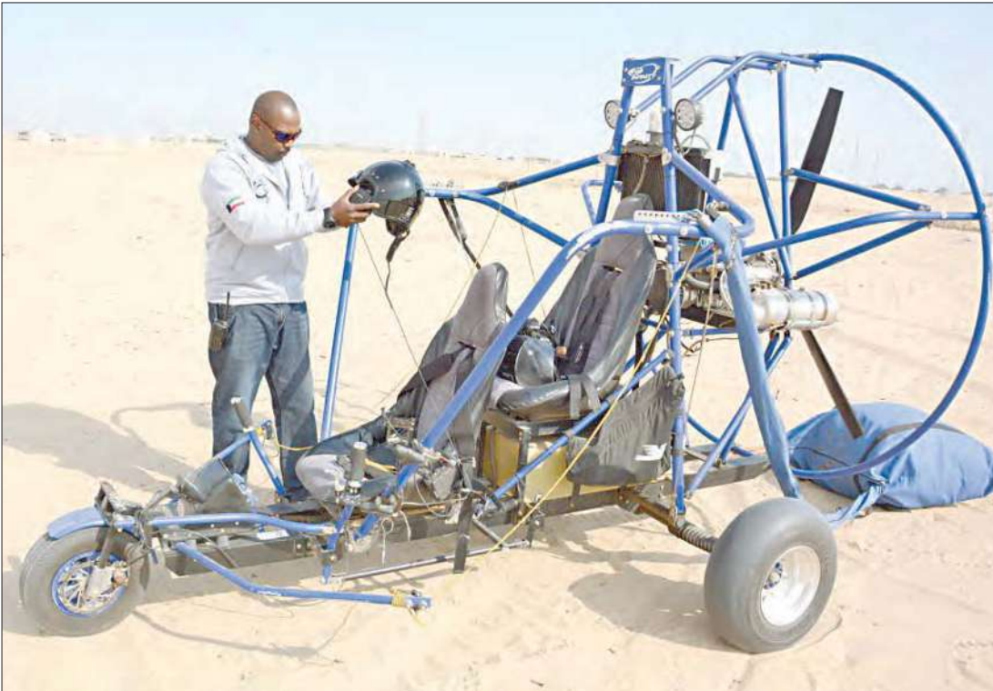
متسابق يستعد لإطلاق إحدى الطائرات الشراعية