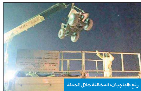
رفع «الباجيات»، المخالفة خلال الحملة