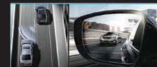
نظام اكتشاف زاوية الرؤية الميتة (BSD) وميلت السرعات الذكي (SCC)