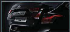
نظام صندوق السيارة الذكي