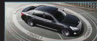
نظام الرؤية الشاملة الخلفية والمحيطية (AVM)