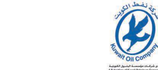
يسر شركات مؤسسة الخليج الكويتية Subsidiary of Kuwait Petroleum Corporation