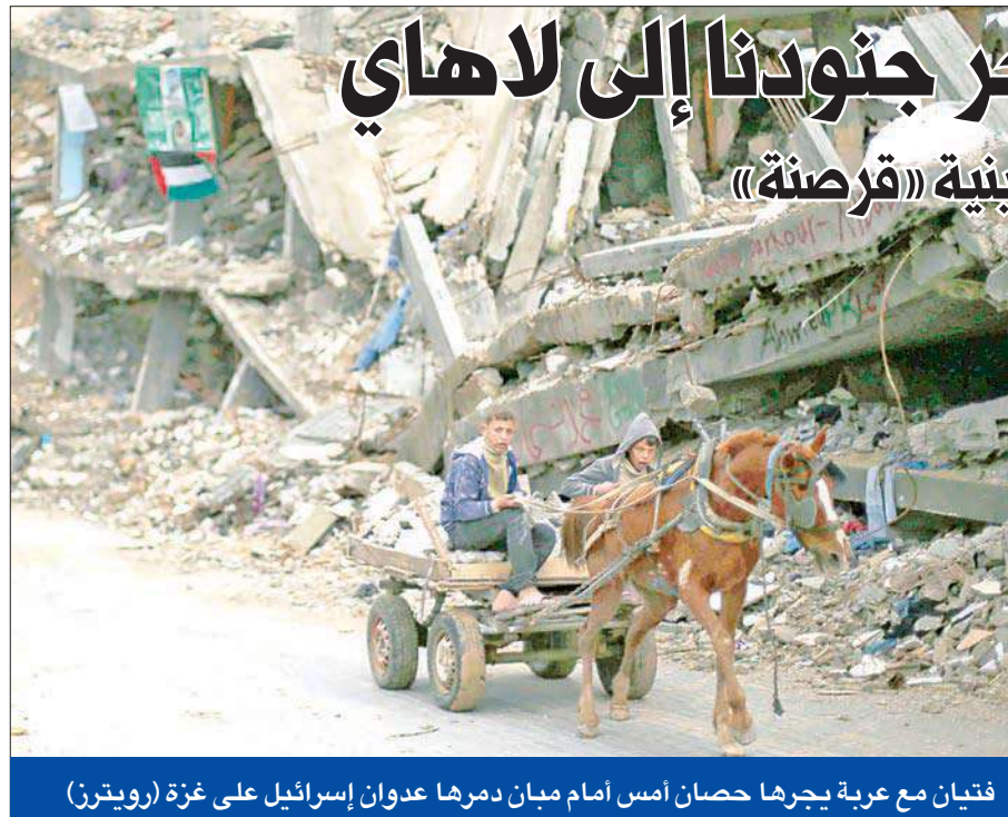
فتيان مع عربة يجرها حصان أمام مبان دمرها عدوان إسرائيل على غزة

وأكد أن إسرائيل لن تجلس مكتوفة الأيدي وأن جنود الجيش سيواصلون الدفاع عن إسرائيل بإصرار وقوة، وكما يدافعون عنها سندافع عنهم». وكانت إسرائيل قامت أمس الأول، بتجميد تحويل 106 ملايين يورو لحساب السلطة الفلسطينية من أموال الضرائب التي جمعها للسلطة. وهذا الإجراء الإسرائيلي الأول