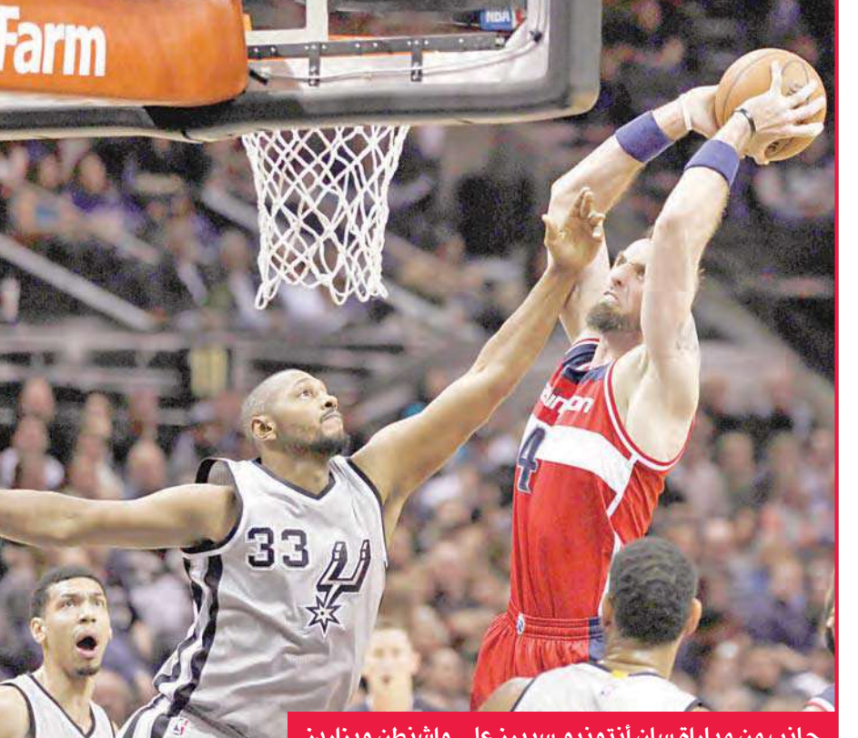
جانب من مباراة سان أنتونيو سبيرز على واشنطن ويزاردز

وحدا شيكاغو بولز حدو سبيرز وحقق فوزه الثاني على التوالي، عندما تغلب على ضيفه بوسطن سلتيكس 104-109 بعد التمديد على ملعب «يوناييتد سنتر» وأمام 21820 متفرج. وانتهى الوقت الأصلي بالتعادل 99-99، وقال أصحاب الأرض كلمتهم في الشوط الإضافي بعدما كسبوه بفارق 5 نقاط 5-10. وهو الفوز الثاني