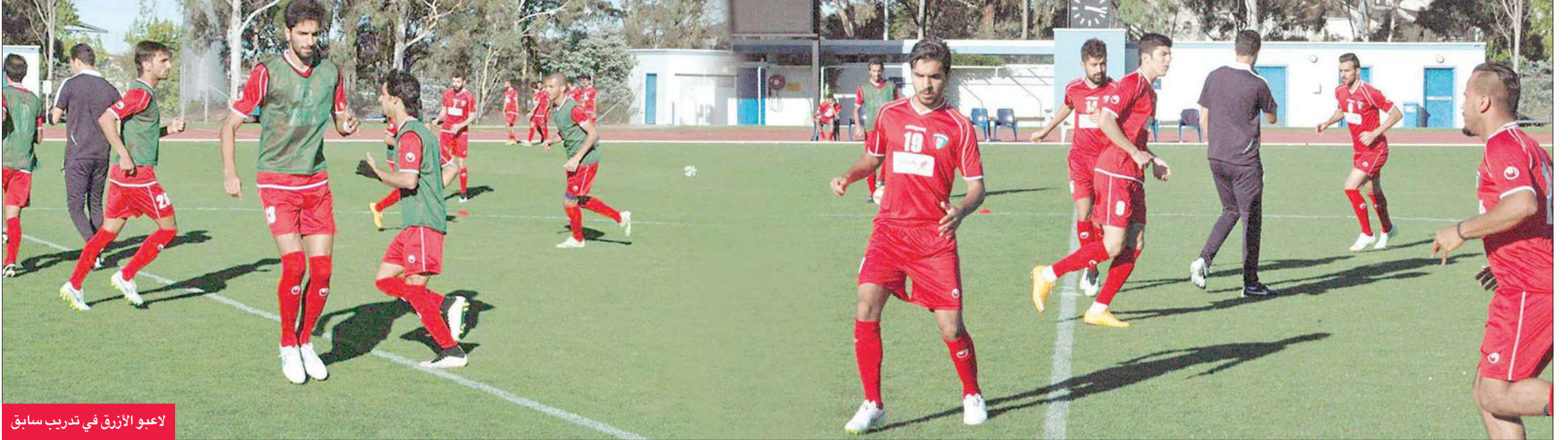
لاعب الأزرق في تدريب سابق