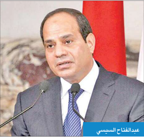
عبد الفتح السبيسي

وترتبط الكويت ومصر بعلاقة فريدة من نوعها على شتى المستويات السياسية والاقتصادية والاجتماعية والثقافية والفنية، ولاسيما السياحية باتت نموذجاً يحتذى للعلاقات بين الدول.