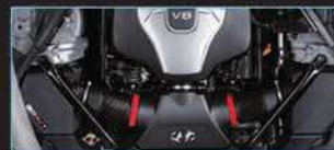
محرك GDI V6 سعة 3.3 لتر 282 حصان (متوفر أيضاً محرك V8 سعة 5.0 لتر بقوة 413 حصاناً)