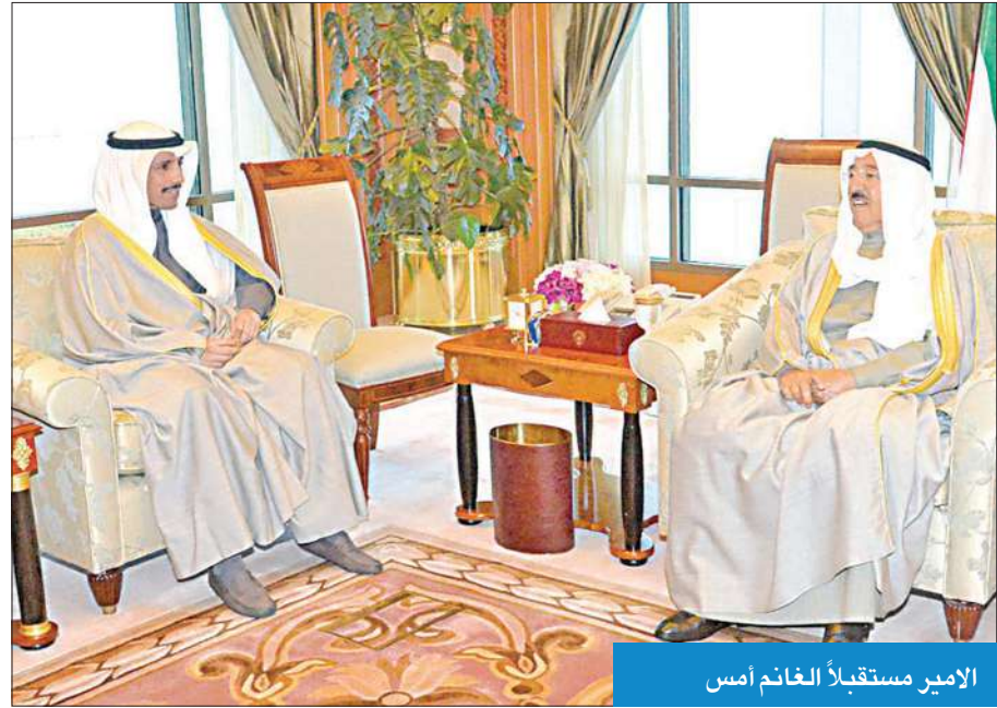
الأمير مستقبلاً الغانم أمس

استقبل صاحب السمو أمير البلاد الشيخ صباح الأحمد بقصر السيف صباح أمس سمو ولي العهد الشيخ نواف الأحمد كما استقبل رئيس مجلس الأمة مرزوق الغانم. واستقبل سموه كذلك سمو رئيس مجلس الوزراء الشيخ جابر المبارك، ثم النائب الأول لرئيس مجلس الوزراء وزير الخارجية الشيخ صباح الخالد. وفي مجال آخر، بعث صاحب السمو ببرقية تهنئة إلى رئيس جمهورية ميانمار الاتحادية تهنئته بمناسبة العيد الوطني لبلاده، متمنيا له موفق الصحة والعافية وللبلد الصديق دوام التقدم والازدهار. وبعث سمو ولي العهد وسمو رئيس مجلس الوزراء ببرقتي تهنئة مماثلتين.