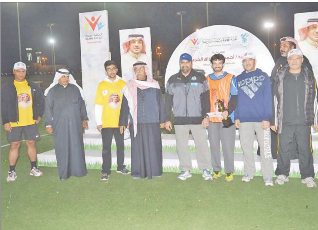
تكريم الفائزين في البطولة