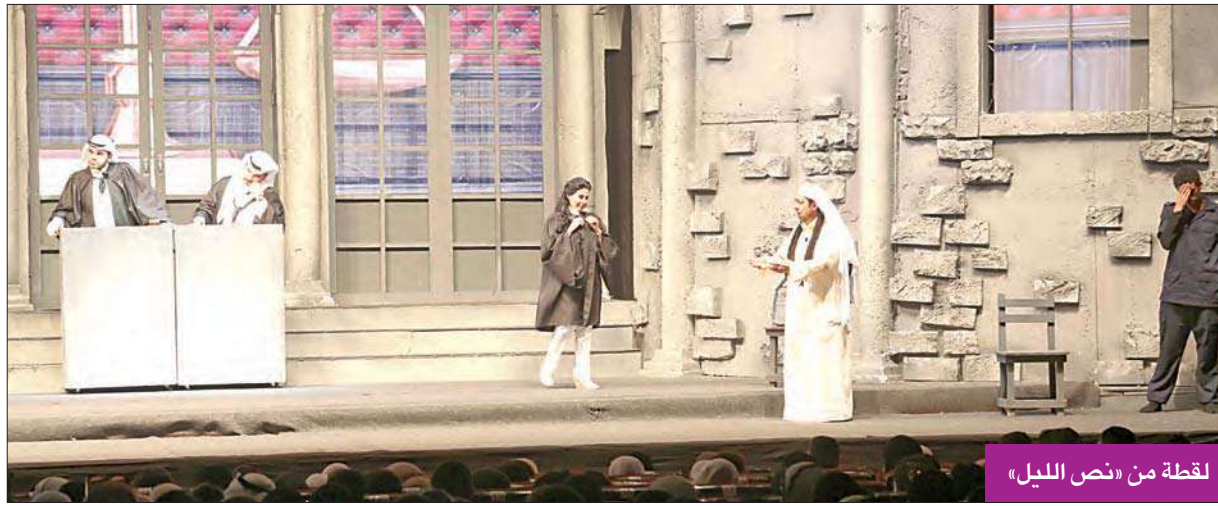
لقطة من «نص الليل»

ونساء: هل من علاج ما من وجهة نظر الطب النفسي في هذه الحالات، وما وجهة نظر الذين يعالجون المس الشيطاني، وما بين الصراع بين القوتين تطرح هذه القضية، حيث إن الضحية ماتت في الحقيقة، وأثارت جدلاً هل قتلها الجن أم المعالجة أم إهمال الطب؟ هذا المثلث ظامرة موجودة