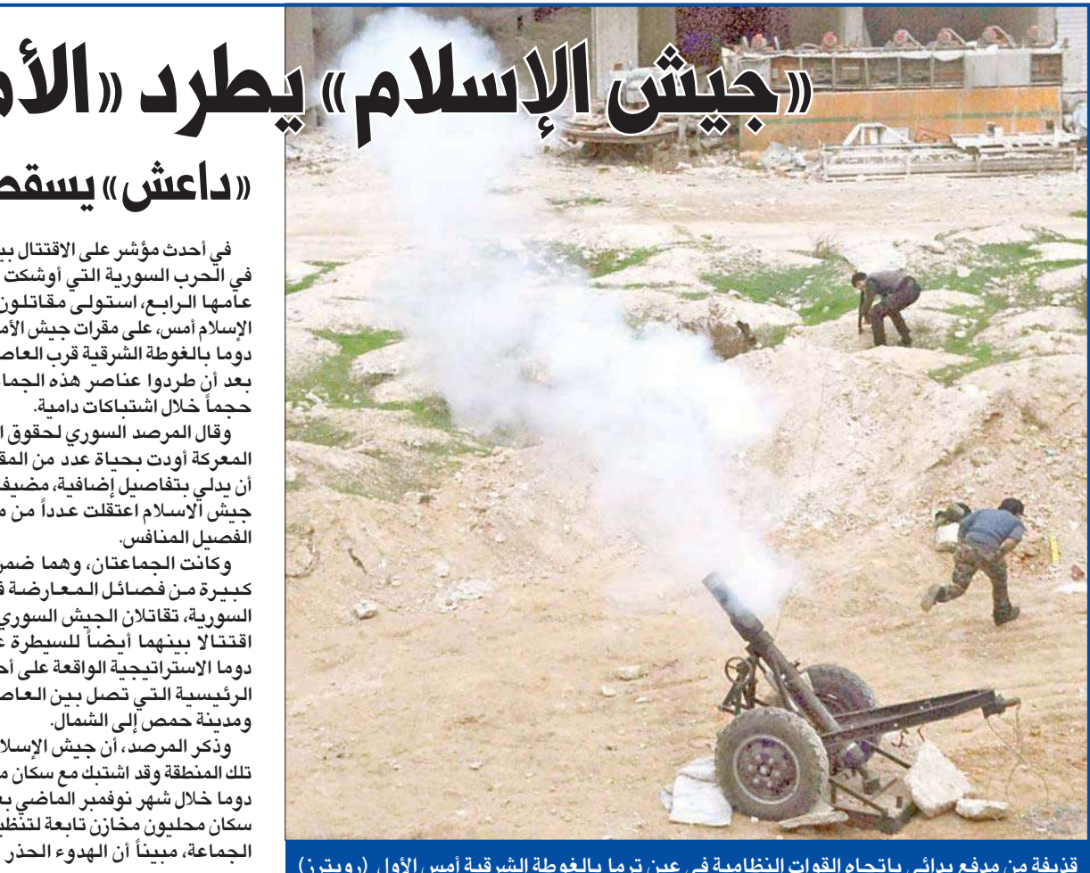
قذيفة من مدفع يدائي باتجاه القوات النظامية في عين ترما بالغوطة الشرقية أمس الأول

وذكر المرصد أن جيش الإسلام أقوى في تلك المنطقة وقد اشتبك مع سكان مسلحين في دوما خلال شهر نوفمبر الماضي بعد أن هاجم سكان محليون مخازن تابعة لتنظيم قريب من الجماعة، مبيئاً أن الهدوء الحذر يسود هذه