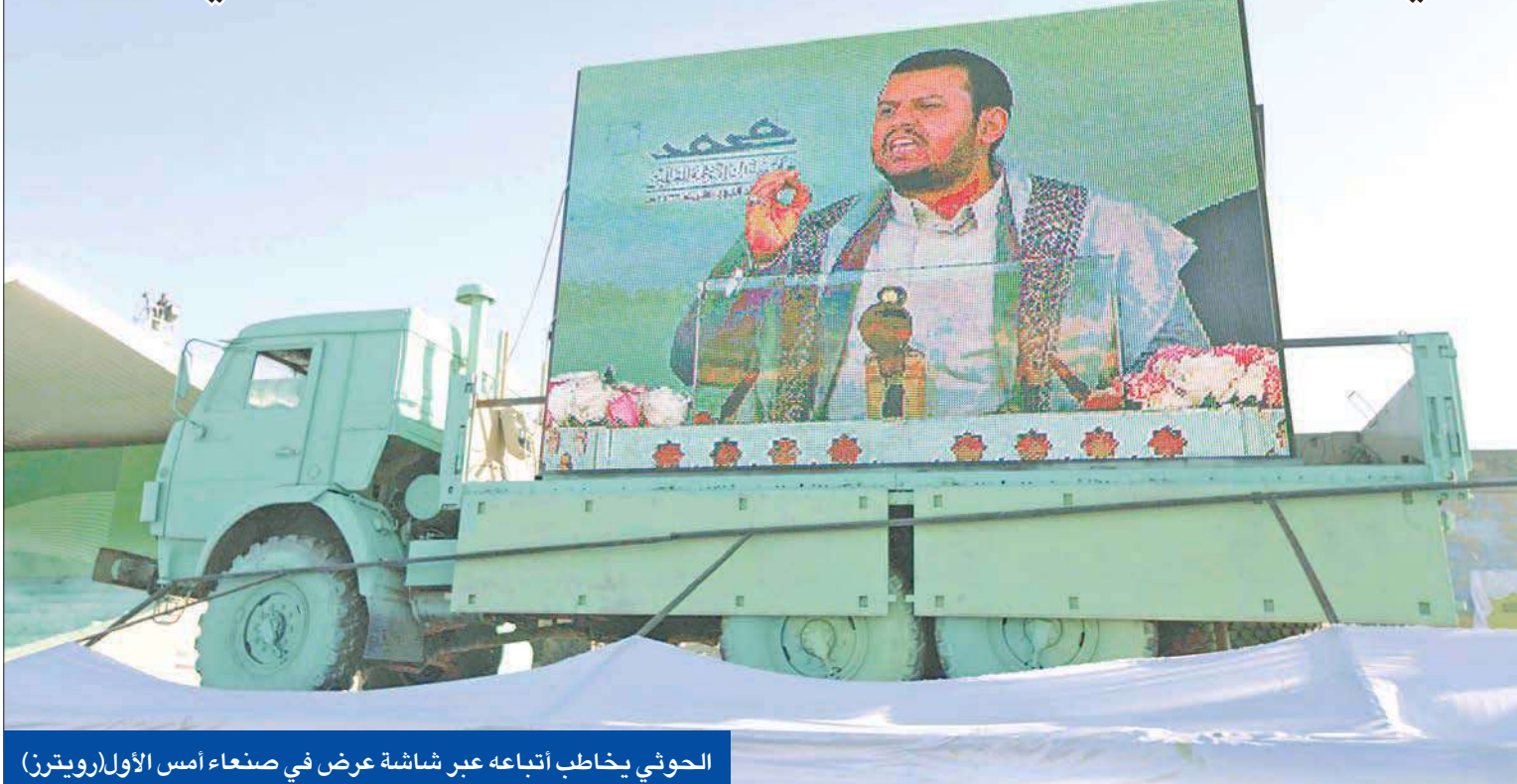
الحوثي يخاطب أتباعه عبر شاشة عرض في صنعاء أمس الأول

مع وصول مفاوضات قبائل مأرب والقوات الحكومية حول تسليم أسلحة كتيبة الاحتياط إلى طريق مسدود، دخل زعيم الحوثيين على خط المواجهة، متوعداً باجتياح المحافظة الغنية بالنفط وقطع الطريق أمام محاولات تسليمها للقاعدة.