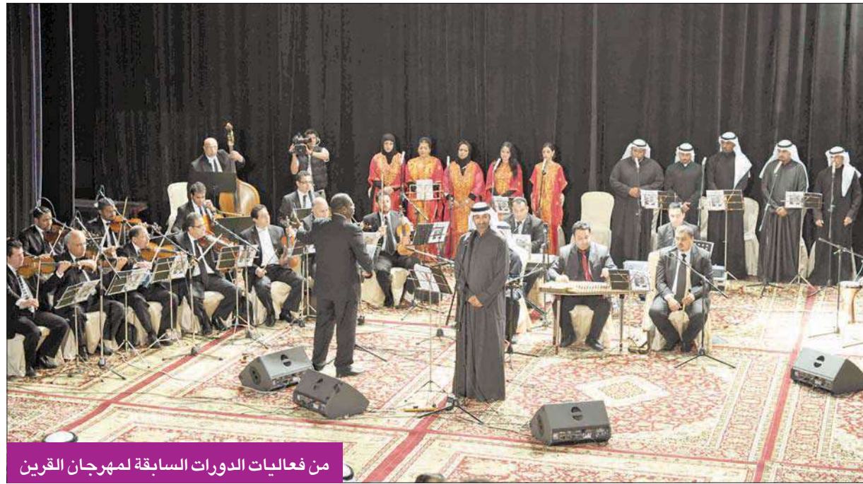
من فعاليات الدورات السابقة لمهرجان القرين

تستمر أنشطة مهرجان القرين الثقافي عشرين يوماً، وتشمل فعاليات فكرية وثقافية وموسيقية ومسرحية وشعرية، إضافة إلى أخرى تشكيلية عربية وعالمية.