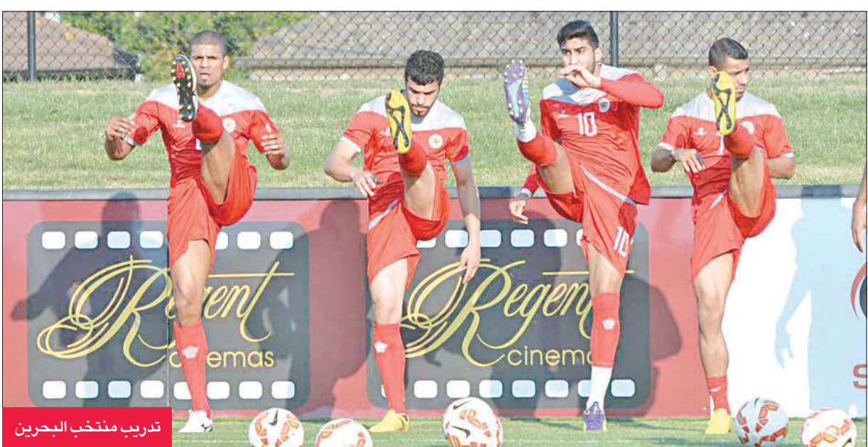
تدريب منتخب البحرين