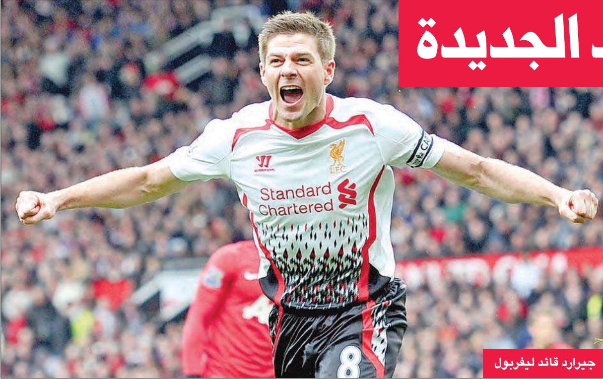
جيرارد قائد ليفربول

أن يكون جيرارد برفقتي في خط وسط الفريق.» وتابع زيدان «أعلم أن ريال مدريد حاول ضم جيرارد مرتين ولكنه لم يترك ليفربول. لا يوجد الكثير من اللاعبين يرفضون اللعب في صفوف الريال، ولكنني أعتقد أن هذا يؤكد ما يمكنه هذا الرجل من ولاء كبير تجاه ليفربول.»