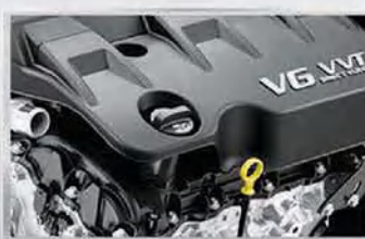
محرك 6 سلندر بقوة 292 حصان