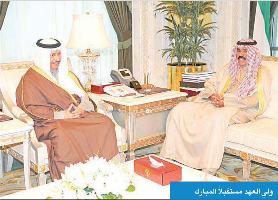
ولي العهد مستقبلاً المبارك

استقبل سمو ولي العهد الشيخ نواف الأحمد بقصر السيف صباح أمس رئيس مجلس الأمة مرزوق الغانم. واستقبل سموه أيضاً سمو رئيس مجلس الوزراء الشيخ جابر المبارك ثم النائب الأول لرئيس مجلس الوزراء وزير الخارجية الشيخ صباح الخالد. كما استقبل سموه نائب رئيس مجلس الوزراء وزير الداخلية الشيخ محمد الخالد، ثم وزير الإعلام وزير الدولة لشؤون الشباب الشيخ سلمان الحمود، ووزير الدولة لشؤون مجلس الوزراء الشيخ محمد العبدالله. واستقبل ولي العهد كذلك وزير الصحة الدكتور علي العبيدي، ووزير الدولة لشؤون الإسكان ياسر أبل.