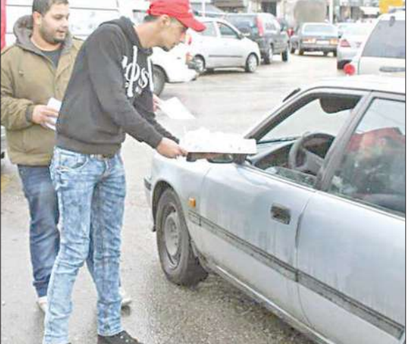
لمتاني يقدم حلوى المولد النبوي لسائق في بيروت أمس في إطار احتفالات التنظيم الناصري بالمناسبة

قاووق لتعزيز الوحدة الوطنية في مواجهة خطر إسرائيل والتكفيريين