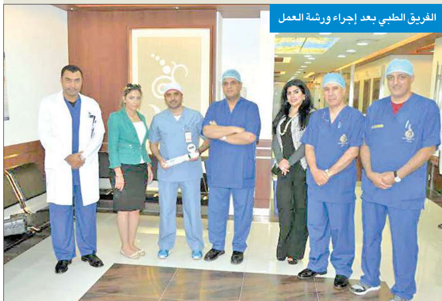
الفريق الطبي بعد إجراء ورشة العمل

قال د. عبدالله المليفي إن معدل المصابين بداء السمنة بالكويت بلغ مستويات خطيرة، وتحثل النساء المركز الأول بين المصابين بنسبة 42%، في حين يشكل الرجال والأطفال نسبة 37 في المئة، مبيناً أن هذه النسبة من أعلى معدلات الإصابة عالمياً.