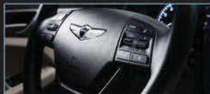
جهاز التحكم عن بعد وميلت السرعة الذكي بالإنعارة (مع مقاييس نقل السرعة عامه المقود)