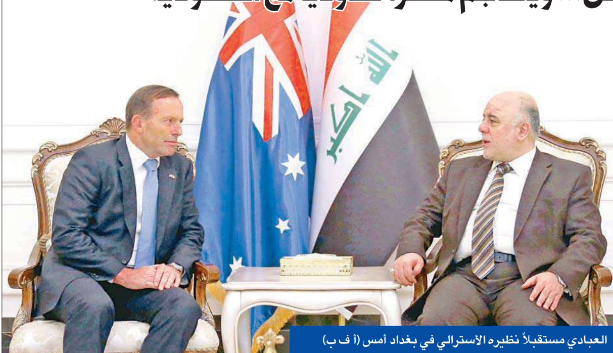
العبادي مستقبلاً نظيره الأسترالي في بغداد أمس

«داعش» ينقل سجناءه من كركوك إلى الموصل... ويهاجم مخفراً حدودياً مع السعودية