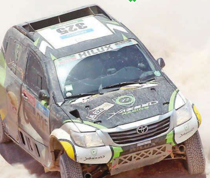
السائق السعودي يزيد الراجحي خلال المرحلة الثامنة من رالي دكار

كسر السائق السعودي يزيد الراجحي على متن سيارته تويوتا احتكار فريق ميني باحراره المركز الاول في المرحلة الثامنة من رالي دكار أمس الاول الأحد. وقطع الراجحي الذي يشارك للمرة الأولى في رالي دكار، مسافة 510 كلم الخاصة بالسرعة (من اصل 806 كلم) والممتدة بين بويوني واينكي في تشيلي بزمن 3 ساعات و26 دقيقة و49 ثانية. وحل الراجحي امام الأرجنتيني اورلاندو تيرانوفا بطل المرحلة السابعة بفارق 1.12 دقيقة، وجاء القطري ناصر العطية بطل 2011 ثالثاً بفارق 2.36 دقيقة أمام الجنوب افريقي جينيل دي فيليز (تويوتا). وعز الراجحي موقعه في المركز الثالث على لائحة الترتيب العام خلف العطية المتصدر ودي فيليز الثاني وارتاح المشاركون في فئة السيارات