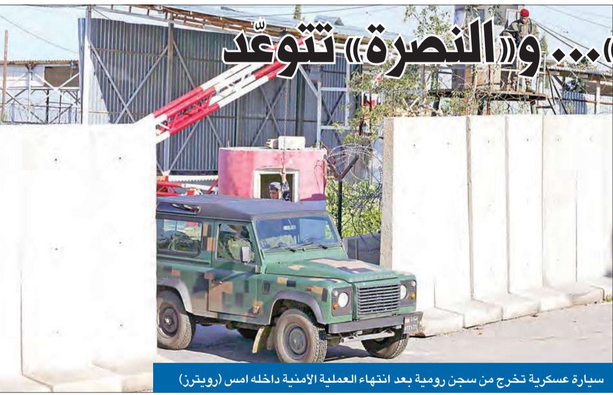
سيارة عسكرية تخرج من سجن رومية بعد انتهاء العملية الأمنية داخله أمس

استغلّت القوى الأمنية اللبنانية التفجيرين الانتحاريين في جبل محسن، وما نتج عنهما من تضامن وطني من مختلف الأفرقاء الذين رفضوا هذه الأعمال الإرهابية، لتنفذ صباح أمس عملية نوعية في مبنى السجناء الإسلاميين بسجن رومية، الذي يديرون منه غرفة عمليات تتواصل مباشرة مع قياديين في جبهة النصرة، وتخطيم الدولة الإسلامية «داعش». وأنت العملية إثر معلومات تم تداولها في اليومين الماضيين، وأكدها وزير الداخلية نهاد المشنوق أمس، ومفادها أن لبعض السجناء علاقة بالعمليات الانتحاريين في حي جبل محسن العلوي في مدينة طرابلس. وذكرت مصادر أمنية أن «قراراً أُخذ في الاجتماع الأمني مساء أمس، برئاسة رئيس مجلس الوزراء