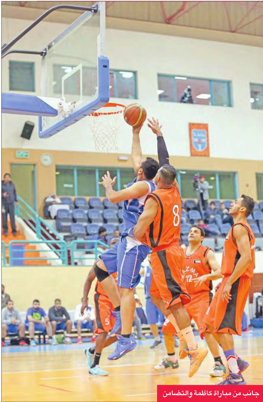
جانب من مباراة كاظمة والتضامن