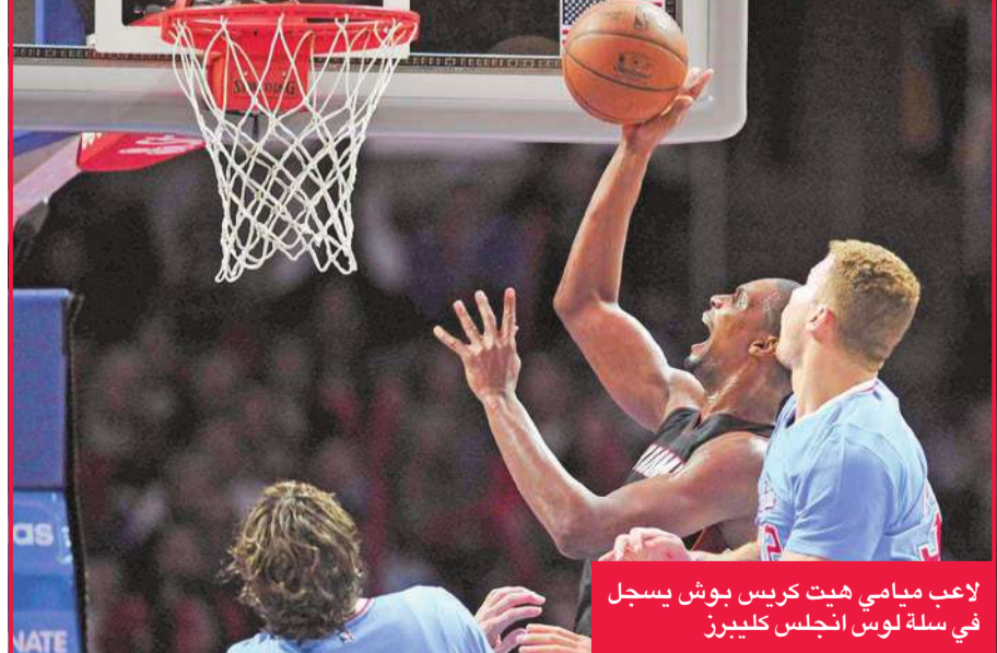
لاعب ميامي هيت كريس بوش يسجل في سلة لوس انجلس كليبرز

وحقق الفريق الفوز الثاني والعشرين له في آخر 24 مباراة خاضها بالمسابقة هذا الموسم. وسجل جون وول 15 نقطة وثمان تمريرات حاسمة للفريق واشنطن ويزاردز، الذي منى بالهزيمة الثانية عشرة له مقابل 25 انتصاراً في الموسم الحالي.