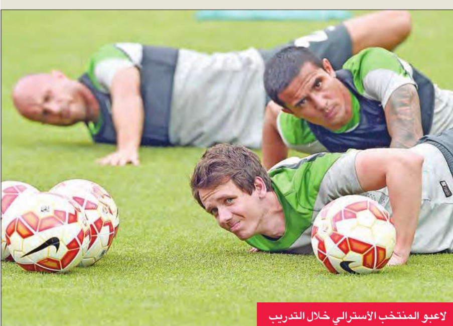
لاعبو المنتخب الأسترالي خلال التدريب

وفازت أستراليا في ثلاث وثمانين مرة واحدة مقابل 3 تعادلات، وتسعى أستراليا إلى فوز رابع ببدو في متناولها تماماً إذا قدمت عرضاً مماثلاً لمباراتها الأولى مع الكويت حين حوت خلفها بهدف منذ الدقيقة 8 إلى فوز كبير 4-1. وجاء الفوز بعد أن ردت بهدفين في الشوط الأول من تيم كايهل وماسيمو لونغو وآخرين في الثاني غير قادتها ميلي جيدنيك وجيمس ترويزي، لتصبح أول بلد صيف يفوز بالمباراة الافتتاحية منذ 31 عاماً، وتحديداً منذ أن تغلبت سنغافورة على الهند 2-0 صفر في نسخة 1984. وتعرض لاعب وسط كريستال بالاس ميلي جيدنيك لالتواء في كاحله أمام الكويت (4-1)، ولن يتمكن بالتالي من خوض لقاء اليوم، ويفتح غياب جيدنيك الباب أمام مارك ميليجان أو مارك بريشيانو لسد الفراغ.