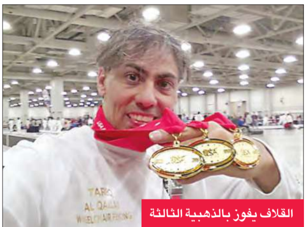
القلاف يفوز بالذهبية الثالثة

واصل بطل المبارزة الكويتي، طارق القلاف، رفع علم الكويت بفوزه بالذهبية الثالثة في لعبة «السابر» على الكراسي المتحركة ببطولة (كأس أميركا الشمالية للمبارزة) المقامة في مدينة «سالت ليك سيتي» بولاية يوتا الأميركية.