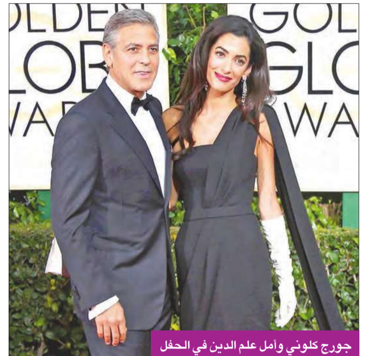
جورج كلوني وأمل علم الدين في الحفل