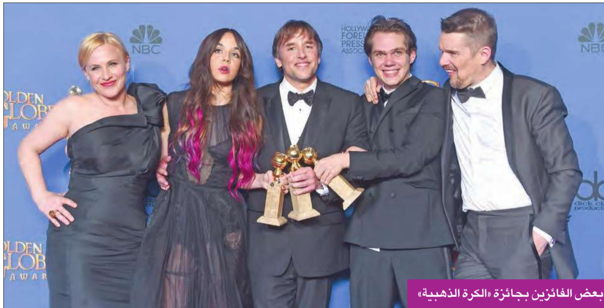
بعض الفائزين بجائزة «الكرة الذهبية»

الحفل شهد تكريماً خاصاً لأضحايا هجمات باريس