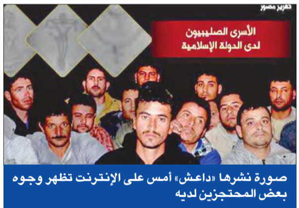
صورة نشرها «داعش» أمس على الإنترنت تظهر وجوه بعض المحتجزين لديه