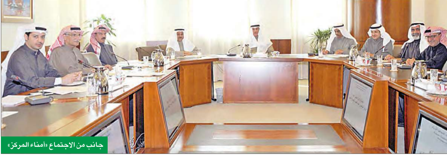
جانب من الاجتماع «أمراء المركز» موازنة المركز لعام 2015 وقراراتها. وتناول ما تم إنجازه من برامج خلال عام 2014،

يهتم مركز عبدالعزيز حمد الصقر للتنمية والتطوير بتقديم البرامج النوعية المعنية بتأهيل وتطوير الكوادر العاملة في القطاعين الخاص والعام، والتي تأتي تأكيداً لدور الغرفة في المساهمة في دفع عجلة الاقتصاد الوطني. يذكر أن مركز عبدالعزيز حمد الصقر للتنمية والتطوير غير ربحي، ويعنى بتقديم برامج التدريب والتأهيل النوعية وذات القيمة المضافة العالية والاستشارات واعداد الدراسات ذات العلاقة. مساهمة مباشرة وتتطلع الغرفة الى ان يكون هذا البرنامج مساهمة مباشرة في تعزيز المهارات الاكاديمية والمهنية للعاملين بالدولة، سواء القطاع الخاص او الحكومي، من خلال اكتسابهم المعرفة المتقدمة في برامج الدراسات العليا. ووضعت الغرفة لهذا الغرض عددا من الشروط للتقدم لنيل هذه المنحة، ومعايير