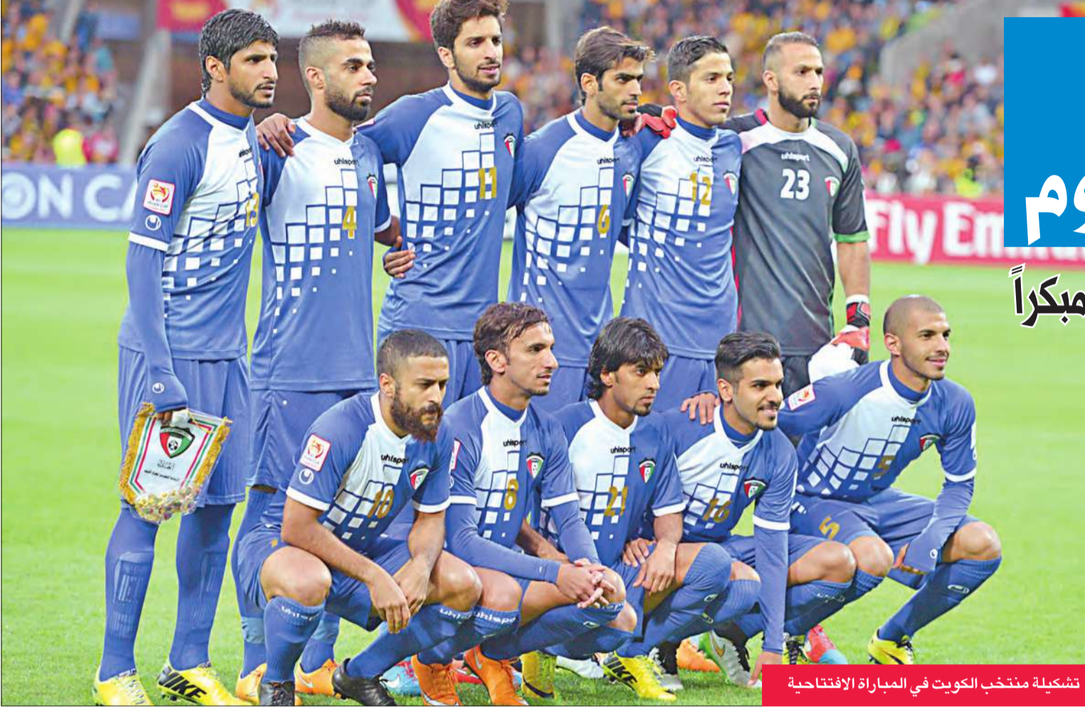
تشكيلة منتخب الكويت في المباراة الافتتاحية