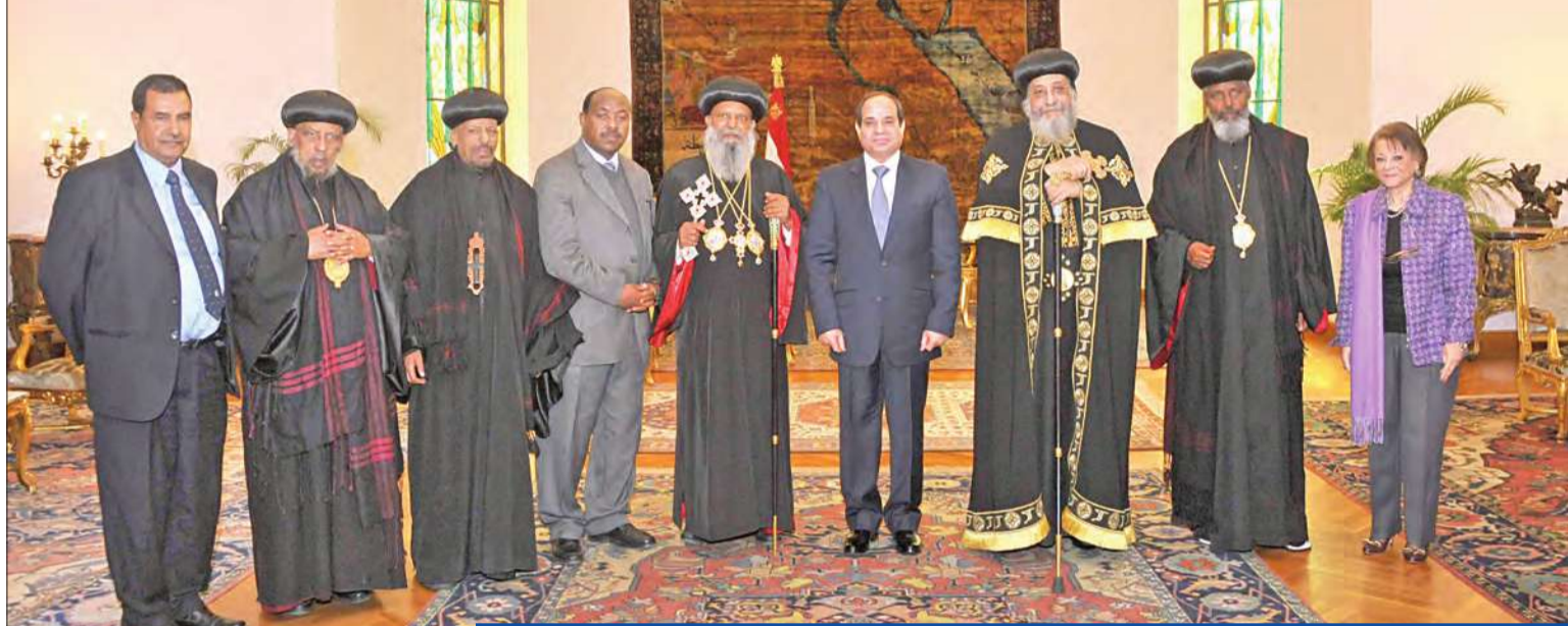
السياسي مستقبلاً بطيرك متياس الأول ووفد الكنيسة الإنجيلية في المقر الرئاسي شرق القاهرة أمس (الجريدة)

القاهرة - أيمن عيسى ومحمد يحيى وشيما جلال