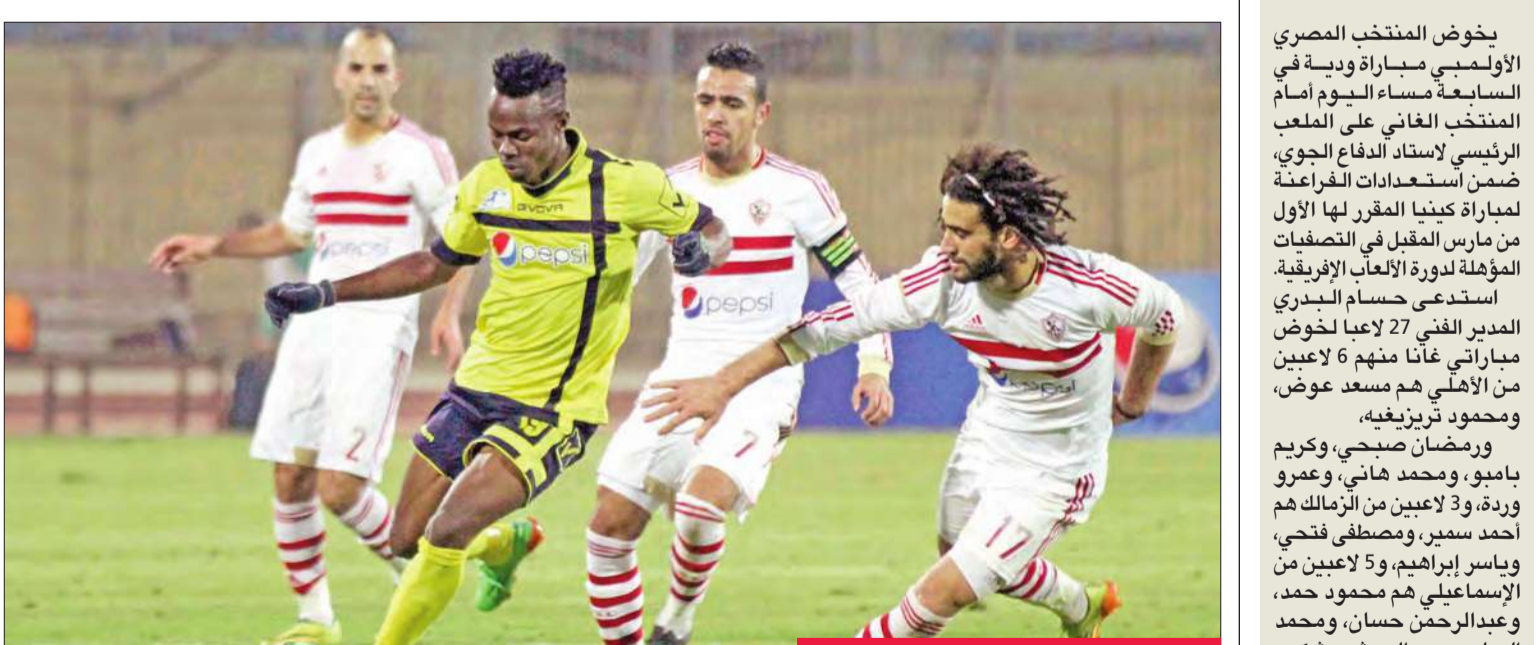
جانب من مباراة الزمالك ونجوم المستقبل