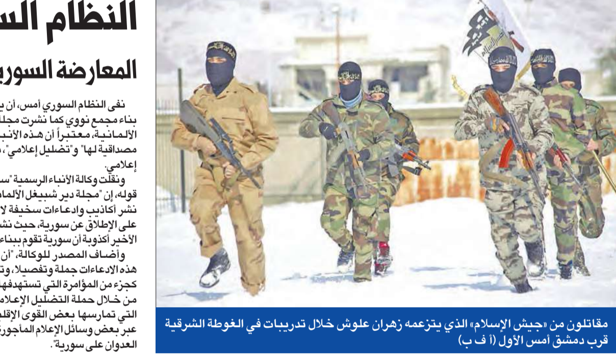
مقاتلون من جيش الإسلام الذي يزعّمه زهران علوش خلال تدريبات في الغوطة الشرقية قرب دمشق الأول

نفي النظام السوري أمس، أن يكون في صدق بناء مجمع نووي كما نشرت مجلة «دير شبيغل» الألمانية، معتبراً أن هذه الأنباء «أكاذيب لا مصداقية لها» وتضليل إعلامي، بحسب مصدر إعلامي. ونقلت وكالة الأنباء الرسمية «سانا»، عن مصدر قولها: إن مجلة دير شبيغل الألمانية، دأبت على نشر أكاذيب وادعاءات سخيفة لا مصداقية لها على الإطلاق عن سورية، حيث نشرت في عددها الأخير أكاذيب أن سورية تقوم ببناء محطة نووية. وأضاف المصدر للوكالة، «أن سورية تنفي هذه الادعاءات حملة وتقصيلاً، وتؤكد أنها تاتي كجزء من المؤامرة التي تستهدفها شعباً وارضاً من خلال حملة التضليل الإعلامي والضغط التي تمارسها بعض القوى الإقليمية والدولية عبر بعض وسائل الإعلام المأجورة والشريكة في العدوان على سورية».