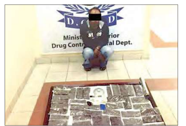
المتهم وأمامه المضبوطات

وفي التفاصيل إن معلومات وردت بأن المتهم بحوز كمية من مادة الماريغوانا بقصد الاتجار، وعلى الفور تم تكثيف التحريات، وبعد التأكد من صحة المعلومات تم اتخاذ الإجراء القانوني اللازم، حيث تم ضبطه، وبمواجهته عثر على 9 لفافات صغيرة بداخلها مادة الماريغوانا المخدرة، وبعينه بمنازلها، وبعينه عثر على ما يقارب 3 كيلوغرامات من الماريغوانا، وتمت إحالته والمضبوطات إلى جهة الاختصاص.