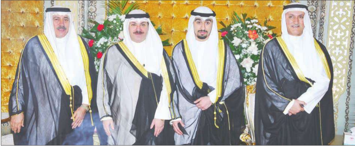
الشيخ خالد عبدالله بهني