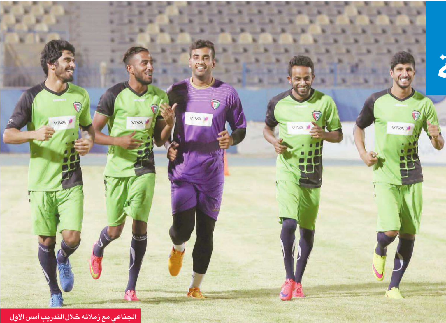
الجناعي مع زملائه خلال التدريب أمس الأول