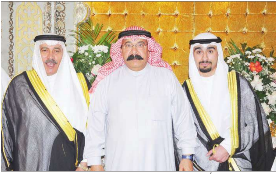
اللواء محمود الطباخ مهنتا

احتفل محمود بورسلي بزفاف نجله فهد على كريمة وكيل وزارة الداخلية المساعد لشؤون الأمن العام، اللواء محمود الدوسري، بحضور سمو ولي العهد، والشيخ ناصر المحمد، وعدد كبير من الشيوخ والنواب وكبار الشخصيات والسفراء والأصدقاء.