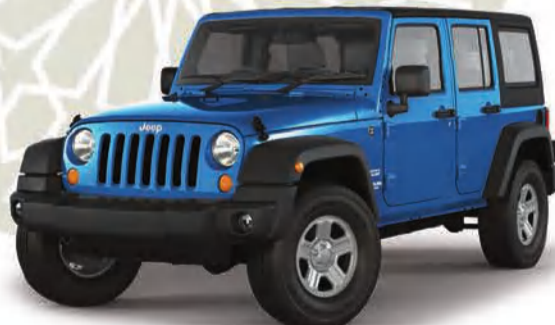
جيب® رانجلر أنليميتد 4D