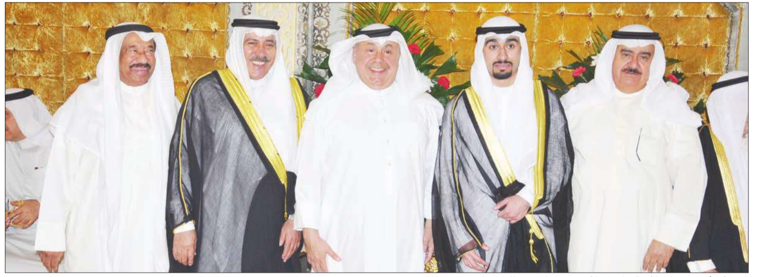
المحافظ ثابت المهنا والفريق سليمان الفهد وجابر الزيد يهنئون