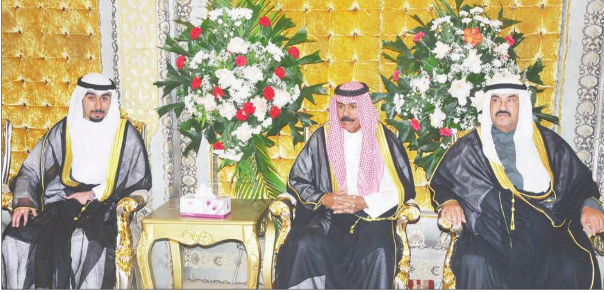
ولي العهد والشيخ ناصر المحمد بقدمان التهامي