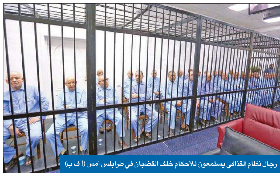
رجال نظام القذافي يستمعون للأحكام خلف القضبان في طرابلس أمس

الأحكام شملت 32 من أصل 37 متهما... و«الأمم المتحدة» تدين