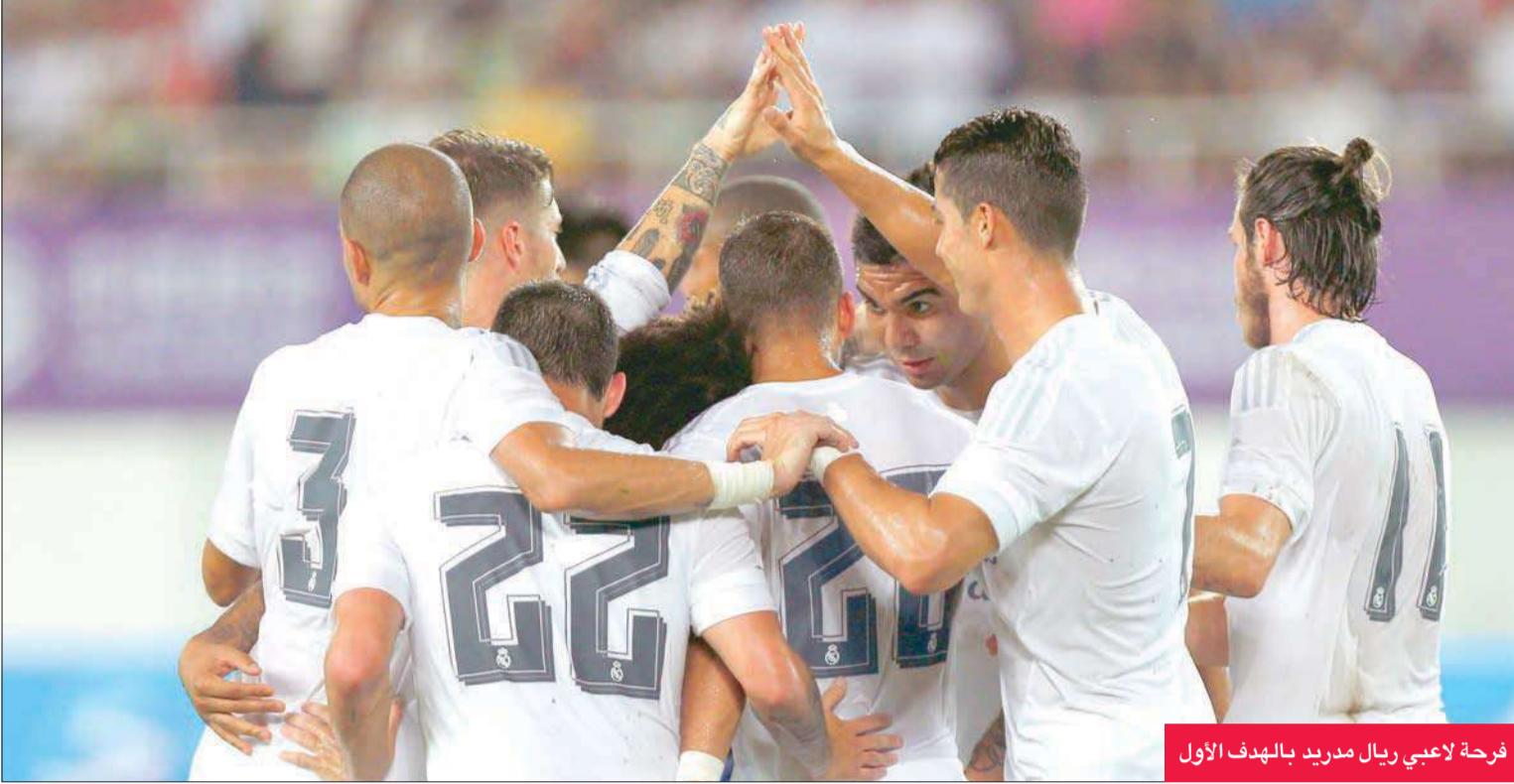
فرحة لاعبي ريال مدريد بالهدف الأول

واصل ريال مدريد الإسباني استعداداته الواعدة مع مديره الجديد رافايل بينيتيز من خلال اكتساحه إنتر ميلان الإيطالي 3-صفر أمس الأول ضمن كأس الإبطال الدولية الودية التي حلت في الصين، بعد أن بدأها الفريقان في أستراليا.