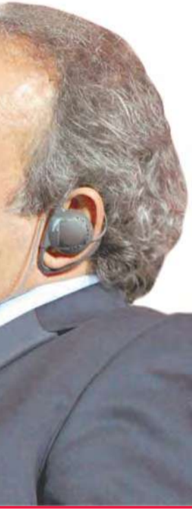
الرجل في الصورة

وأكد أن بلاتيني تلقى اتصالات كثيرة لمعرفة ما إذا كان يريد خوض الانتخابات بقوله: «استمع إلى عدد كبير من الأشخاص، وقيم كل ما قاله حول مستقبل اليفا. لقد تأثر كثيراً بالتعليقات الحارة، والدعم الذي حظي به». وبلاتيني هو نائب رئيس اليفا، وكان مستشاراً لبلاتر عام 1998 قبل أن يغفصل عنه.