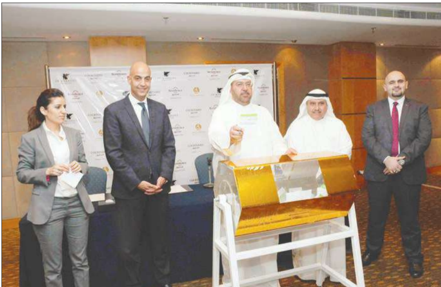
جانب من السحوبات