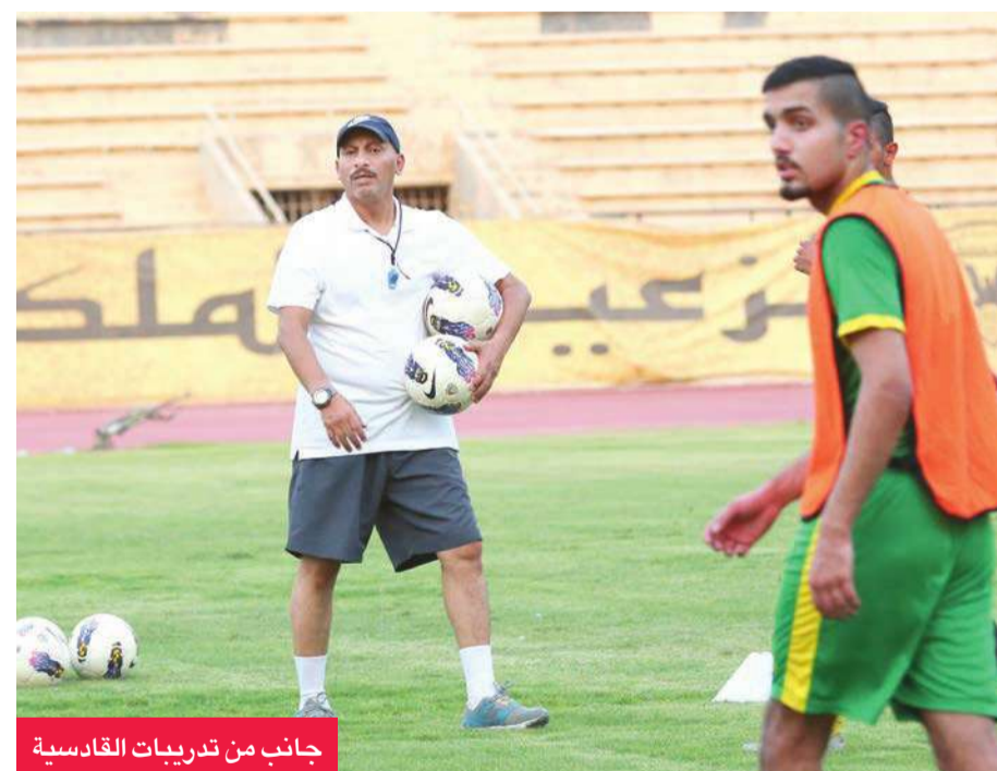
جانب من تدريبات القادسية

ينطلع الجهاز الفني لفريق القادسية إلى زيادة المدة المقررة لمعسكر الأصفر المقرر في دبي اعتباراً من الخامس من الشهر المقبل، وطلبت إدارة النادي من الهيئة العامة للشباب والرياضة تمديد فترة المعسكر لمدة أسبوعين بدلاً من 8 أيام.