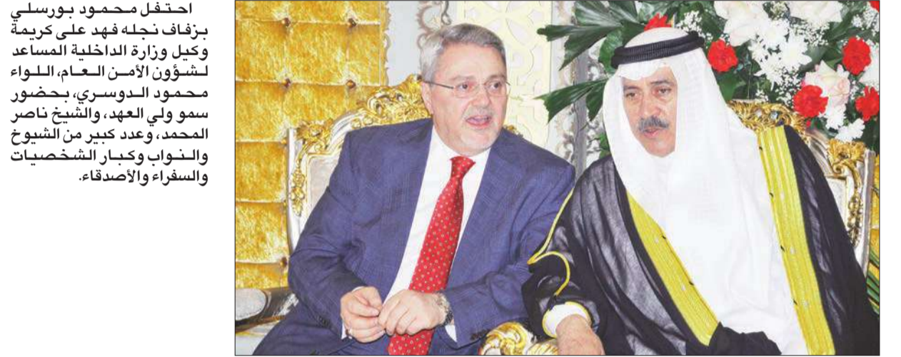
السكرتير العراقي بحر العلوم مع اللواء محمود الدوسري

احتفل محمود بورسلي بزفاف نجله فهد على كريمة وكيل وزارة الداخلية المساعد لشؤون الأمن العام، اللواء محمود الدوسري، بحضور سمو ولي العهد، والشيخ ناصر المحمد، وعدد كبير من الشيوخ والنواب وكبار الشخصيات والسفراء والأصدقاء.