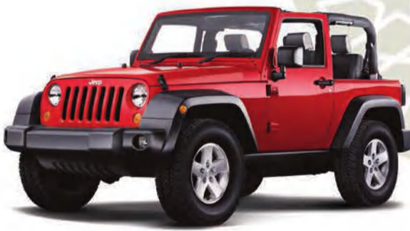
جيب® رانجلر سبورت 2D