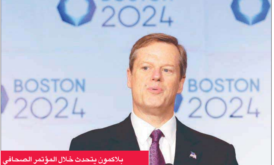
بلامكون يتحدث خلال المؤتمر الصحفي

أقل من المتوقع بسبب ضعف الحضور الجماهيري. لكن هناك معارضة لهذا التامين، لأن البعض يرى أنه لن تكون هناك حماية لدافعي الضرائب إذا كانت الميزانية المخصصة للمنشآت أقل من التكلفة الحقيقية، أو إذا تغير نطاق المشاريع المخصصة لهذا الحدث مع تقدم الوقت.