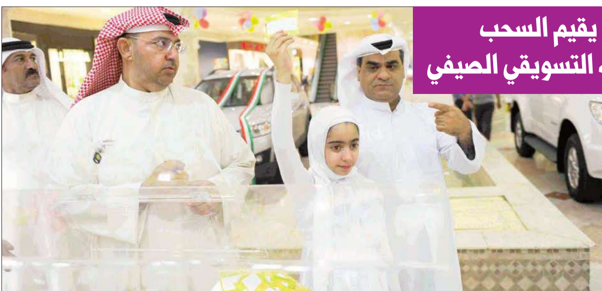
جانب من السحوبات