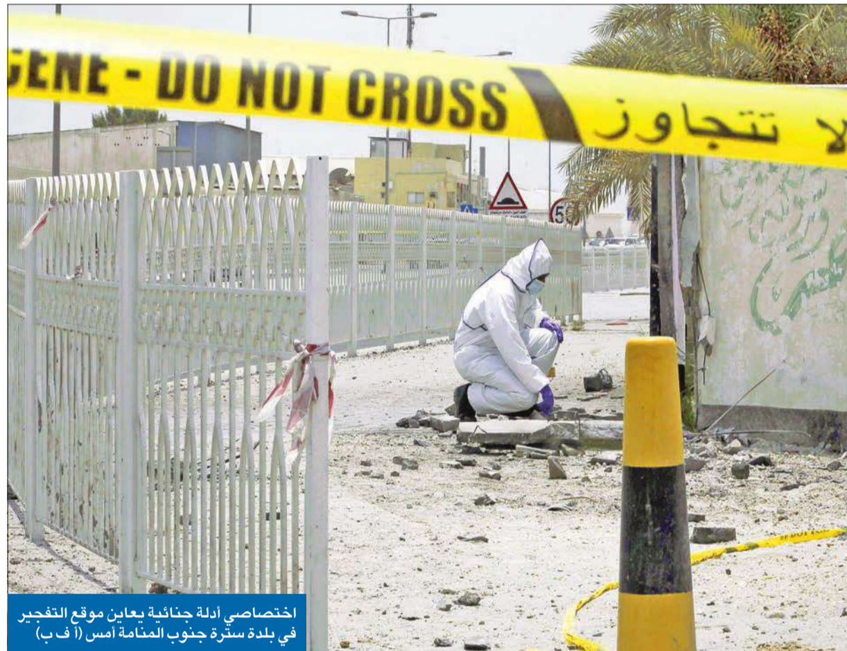
اختصاصي أدلة جنائية يعبان موقع التفجير في بلدة سترة جنوب المنامة أمس

تضامن خليجي وعربي مع المنامة في تصديها للإرهاب