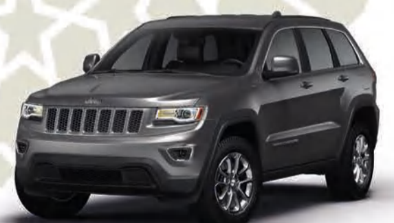
جيب® جراند شيروكي