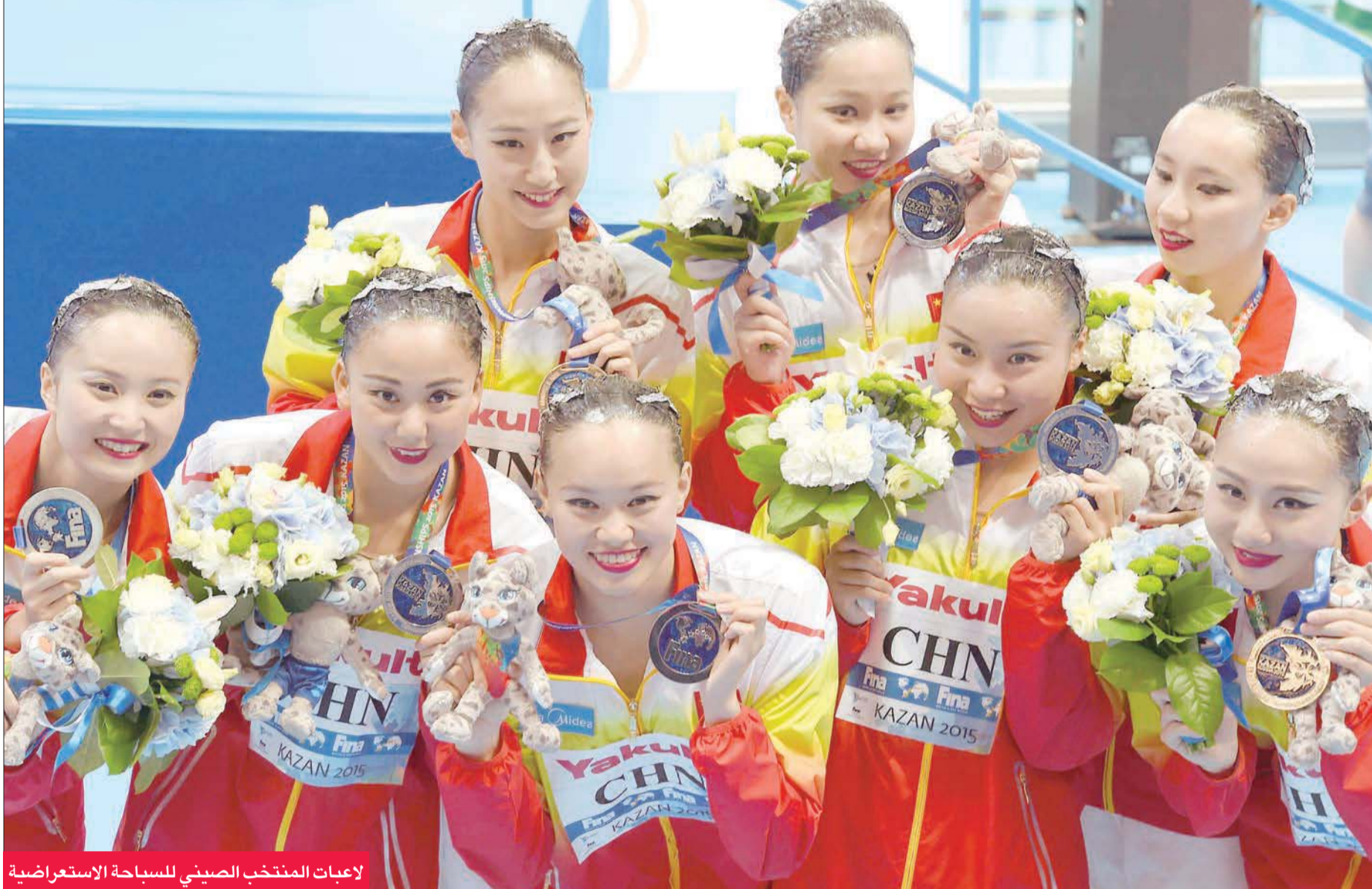
لاعبات المنتخب الصيني للسباحة الاستعراضية

في بطولة العالم للسباحة المقامة حالياً في قازان الروسية حتى 9 أغسطس المقبل، أكدت الصين هيمنتها على مسابقات الغطس، وذلك بعدما حصلت ميداليتها الذهبية الخامسة.