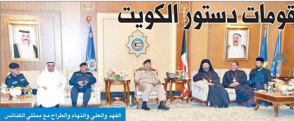
الفهد والعلي والنهاس والطراح مع ممثلي الكنائس

أكدت لممثلي الكنائس أن أمن دور العبادة مسؤولية الجميع