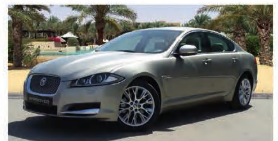
6,900 دينار كويتي 2.0 LUXURY | XF جاكوار 2012