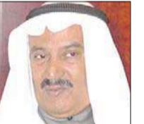
السفير يوسف عبدالله الصيرزي

أنا عبد المحسن لا نقول وداعاً فأنت معنا بشموخ وكبرياءك، بأعمالك الخيرية وتواضعك، بمواقفك الشجاعة، فمن ذا الذي يستطيع أن ينسى موقفك الشجاع في تلك الفترة الحرجة التي مرت على البلاد بعد الفراغ السياسي عقب وفاة سمو الأمير الراحل الشيخ جابر الأحمد الجابر الصباح، والعارض الصحي الذي ألمّ بسمو الأمير الوالد الشيخ سعد العبدالله السالم الصباح رحمهما الله وطيب ثراهما وجعل الجنة مناهما؟ فاطلت الفتنة برأسها لكن كان لموقفك الثابت والشجاع أثره في واد الفتنة في مهدها، وإطفاء نارها التي لا أحد يعلم لي أين سيصل أوارها، فتم اختيار سمو الأمير الشيخ صباح الأحمد الجابر الصباح، حفظه الله ورعاه، وبإجماع ممثلي الشعب بلوحة ديمقراطية رائعة، وتم انتقال السلطة بطريقة سليمة وراقية كانت مثار إعجاب العدو قبل الصديق، وقد كان لي شرف الاستماع منه عن تفاصيل تلك الفترة أثناء تناول العشاء في أحد المطاعم الصغيرة في مدينة العقبة الأردنية، وكان يتخيم بصديق الحديث والتواضع الجّد وحب الكويت الذي ملك عليه قلبه.