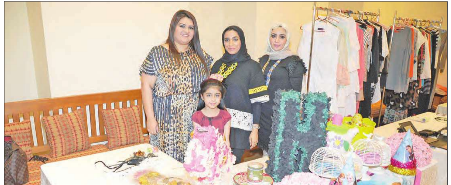
منتجات ومشغولات يدوية