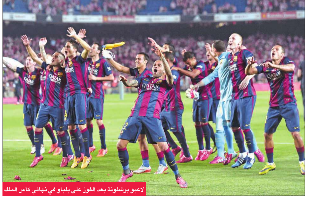
لاعبو برشلونة بعد الفوز على بلباو في نهائي كأس الملك

ضعف كبير أمام تحركات نجوم البرشا. تكتيكي، التزام وتدريب مكثف، نجوم كبار وجماهير عاشقة ومتلهفة للألقاب، كل هذا ساهم في بلوغ عملاق إيطاليا وإسبانيا إلى برلين، ولكن من المعروف أن لكل مباراة ظروفها وحساباتها، لكن برشلونة تعتبر الأوفر حظاً من الترشيدات للظفر باللقب العالي، بالنظر إلى إمكانات نجومه وهيمنة الساحر ميسي على عرش كرة القدم العالمية، فهل سيتمكن كيليني وليشتاينر والكبير يوفون من الوقوف أمام الثلاثي المرعب وإسعاد جماهيرهم بنيل اللقب الغائب عن خزائهم منذ 20 عاماً؟