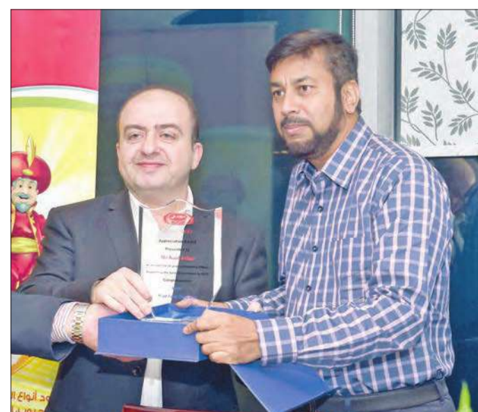
جانب من التكريم