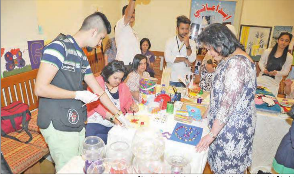
الشيخة نواف سالم العلي خلال اطلعها على مشغولات ذوي الإعاقة