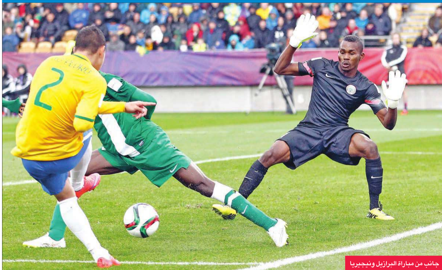
جانب من مباراة البرازيل ونيجيريا

كأس العالم تحت 20 عاما، وقد توجت الأرجنتين باللقب الأول تحت هذا المسمى عام 2007، رافعة رصيدها الى 6 القاب (رقم قياسي).