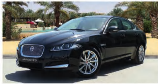
9,500 دينار كويتي 2.0 LUXURY | XF جاكوار 2014

تفضّل زيارة صالة عرض الزباني الأقرب إليك أو اتصل على الرقم 1808010.