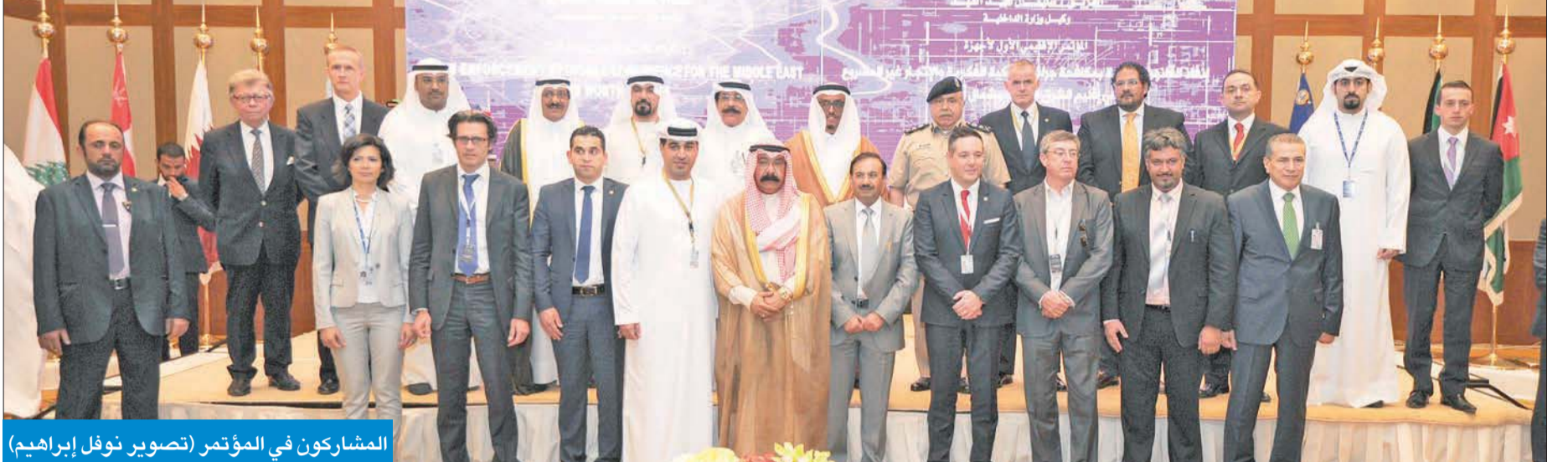
المشاركون في المؤتمر

على استخدام المساعدات الفنية والمشاركة القانونية وأهميتها في التشريع لتسهيل القبض على الهاربين وتبادل المعلومات بين البلدان.