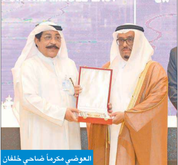
العوضي مكرماً ضاحي خلفان

رعى انطلاق فعاليات مؤتمرها الإقليمي الدولي الأول في الشرق الأوسط وشمال إفريقيا