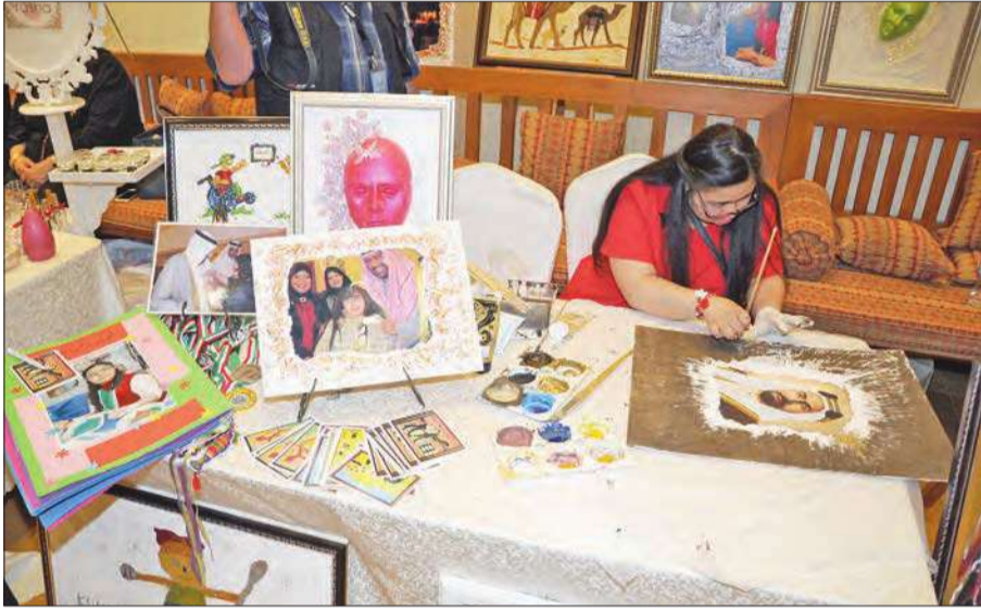
مشاركة من ذوي الاحتياجات الخاصة خلال ورشة الرسم

ضم المعرض تشكيلة واسعة من الأشغال اليدوية التي صممها موظفو البنك، وأعربت الشبيخة نواف عن سعادتها بما قدموه من أفكار وتجارب فنية ويدوية.