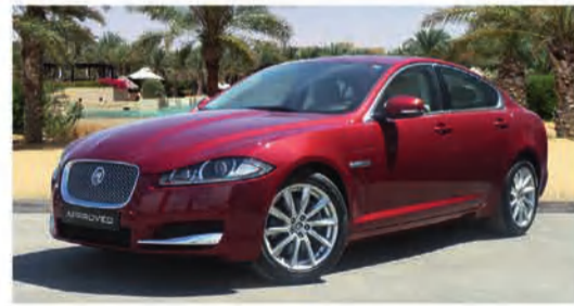
9,500 دينار كويتي 2.0 LUXURY | XF جاكوار 2014