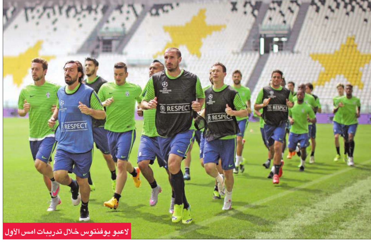
لاعبو يوفنتوس خلال تدريبات امس الاول