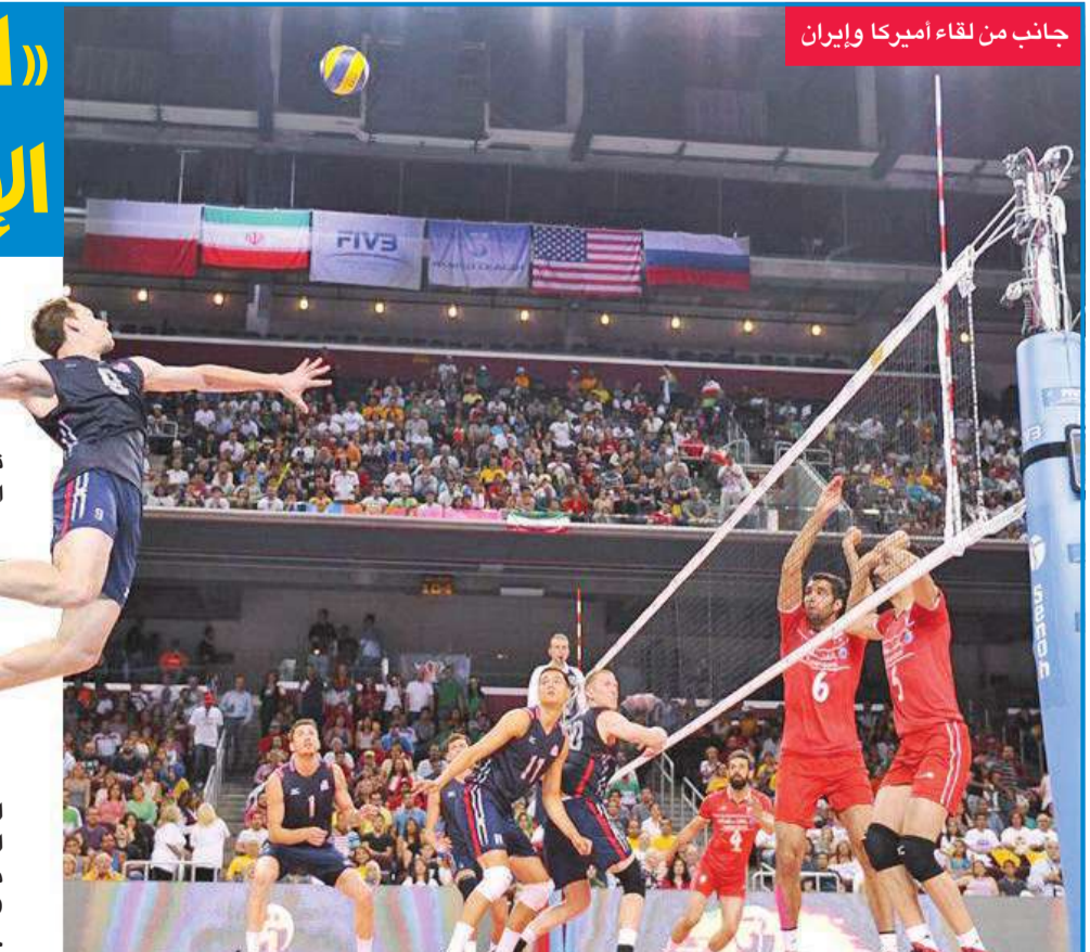
جانب من لقاء أميركا وإيران

محمد عبدالعزيز حقق المنتخب الأميركي لكرة الطائرة (حامل اللقب) فوزه الثاني على نظيره الإيراني بنتيجة ثلاثة أشواط مقابل شوط واحد في المباراة التي جمعتهم أمس في ختام الجولة الثانية من المجموعة الثانية بالمرحلة القارية للدوري العالمي للعبة، وجاءت نتائج الأشواط كالتالي (25-20، 25-20، 25-20، 16-25، 25-20، 20-16، 25-20، 25-20). بذلك رفع الفائز رصيده إلى 6 نقاط، وتصدر مجموعته بالبطولة، بينما بقي الخاسر (إيران) بدون رصيد في المركز الأخير. وفي مباريات أخرى جرت أمس الأول ضمن المجموعة الأولى، نجح منتخب البرازيل حامل الرقم القياسي في الفوز باللقب بـ9 مرات والغالب عن منصات التتويج منذ عام 2010 في تحقيق فوزه الثاني على التوالي على حساب نظيره الصربي بنتيجة 3-1، وجاءت