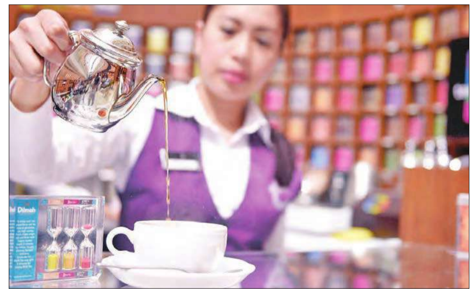
حسن الضيافة والاستقبال