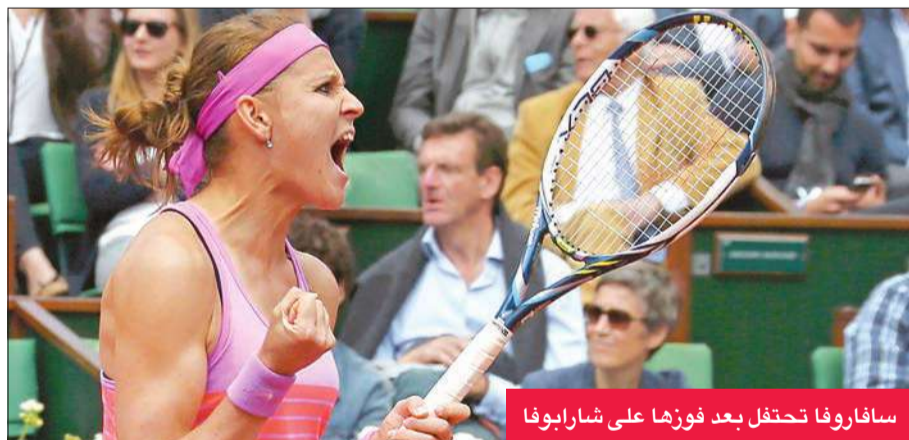
سافاروفا تحتفل بعد فوزها على شارابوفا

الدور المقبل مع الفرنسي جو فافرينكا الثامن بفوزه السهل على الفرنسي جيل سيمون الثاني عشر 4-6 و6-2 (أ ف ب)