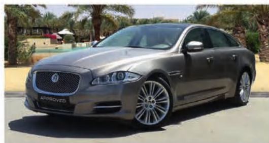
12,900 دينار كويتي 3.0 SWB | XJ جاكوار 2012