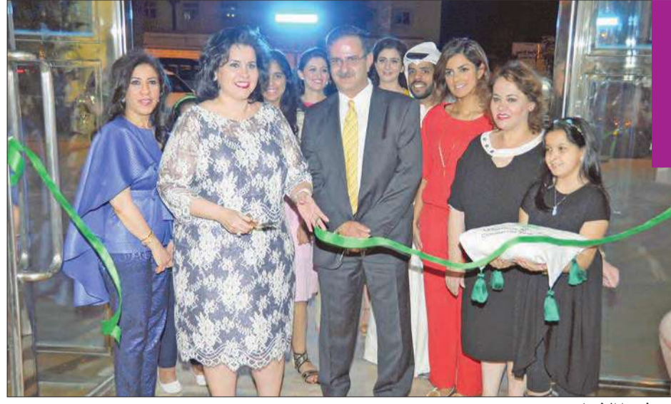
قص شريط الافتتاح