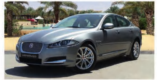
7,500 دينار كويتي 2.0 LUXURY | XF جاكوار 2013