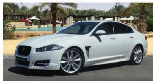
10,500 دينار كويتي 3.0 سوبر تشارج | XF جاكوار 2013 بكامل المواصفات