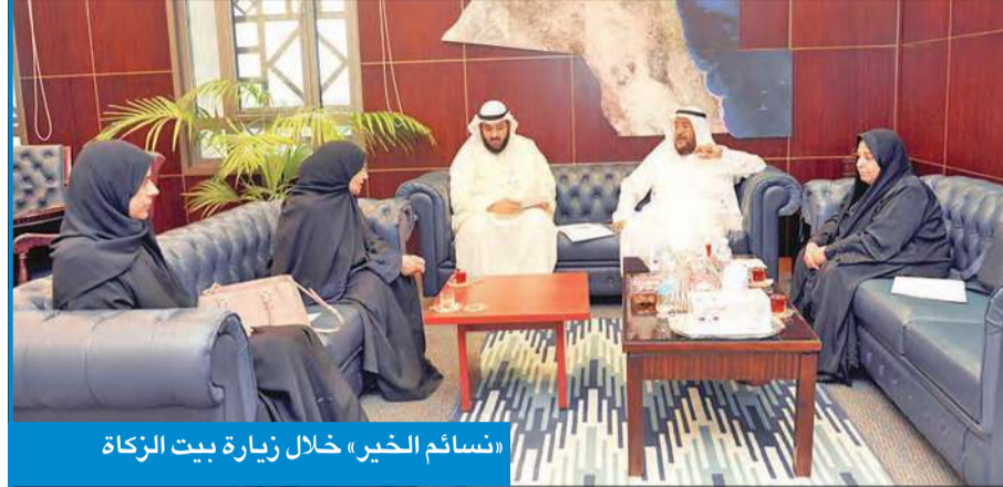
«نسائم الخير» خلال زيارة بيت الزكاة

اطلع على تجربة البيت في العمل الخيري والإنساني