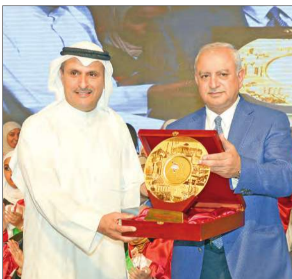
هدية تذكارية مقدمة إلى البنك الوطني

أقام بنك الكويت الوطني، في فندق شيراتون الكويت، حفل تكريم الطلبة الفائقين في امتحانات الثانوية العامة، برعاية وحضور وزير التعليم العالي د. بدر العيسى. وقال العيسى، خلال الحفل، «لحظنا وقوفي أمام الطلبة المتفوقين وتكريمهم تعتبر أسعد اللحظات بالنسبة لي، وأشكر البنك الوطني على دعمه لهذا الحفل، وأتمنى من المحتفي بهم الحرص على ما هو قادم لمواصلة مسيرة النجاح، وأنا على يقين من أنكم لن تدرخوا جهدا في تحقيق