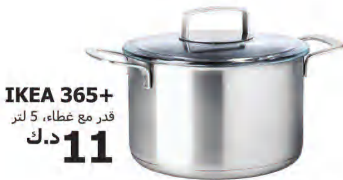
IKEA 365+ قدر مع غطاء، 5 لتر د.ك. 11