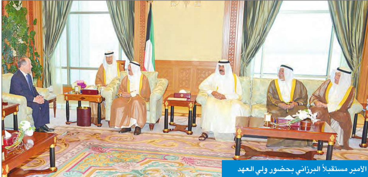
الأمير مستقبلاً البرزاني بحضور ولي العهد

في وداعه رئيس بعثة الشرف المرافقة المستشار بالديوان الأميري محمد أبو الحسن.