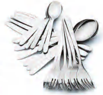
FORNUFT طقم أدوات تناول الطعام ذو 24 قطعة د.ك. 2.900