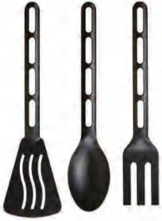
AKUT طقم أدوات المطبخ، 3 قطع د.ك. 0.150