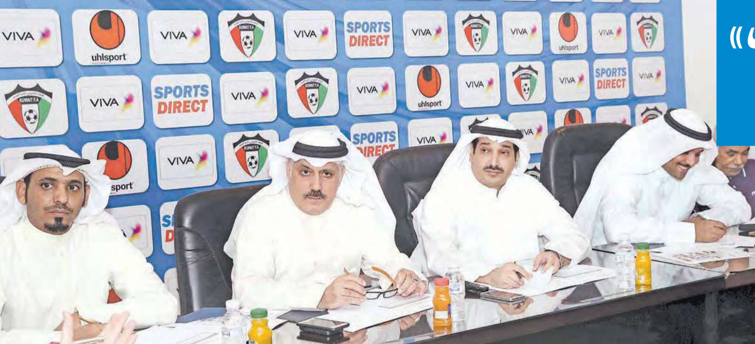
لجنة المسابقات خلال اجتماعها الأخير مع الأندية

وناقشت اللجنة الإبقاء على النظام الحالي المعمول