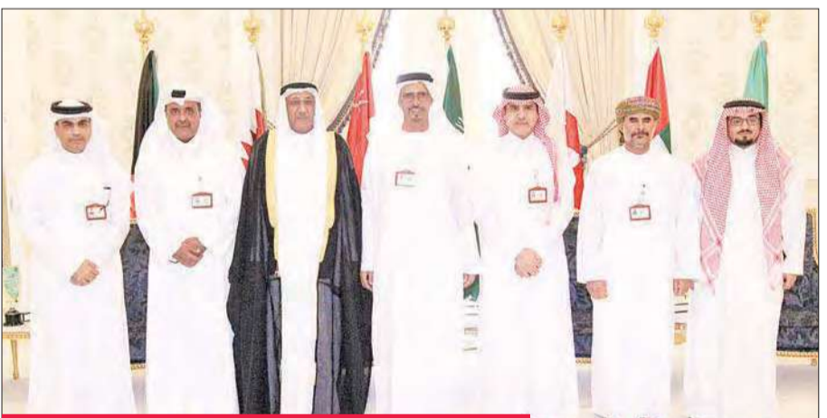
السنين متوسطاً رؤساء وفود اتحادات الشرطة الخليجية

لرجال الأمن من قبل رئيس وفد الإمارات، ومقترح الوفد السعودي بشأن تبادل النشرات التدريبية في مجال أمن الملاعب.