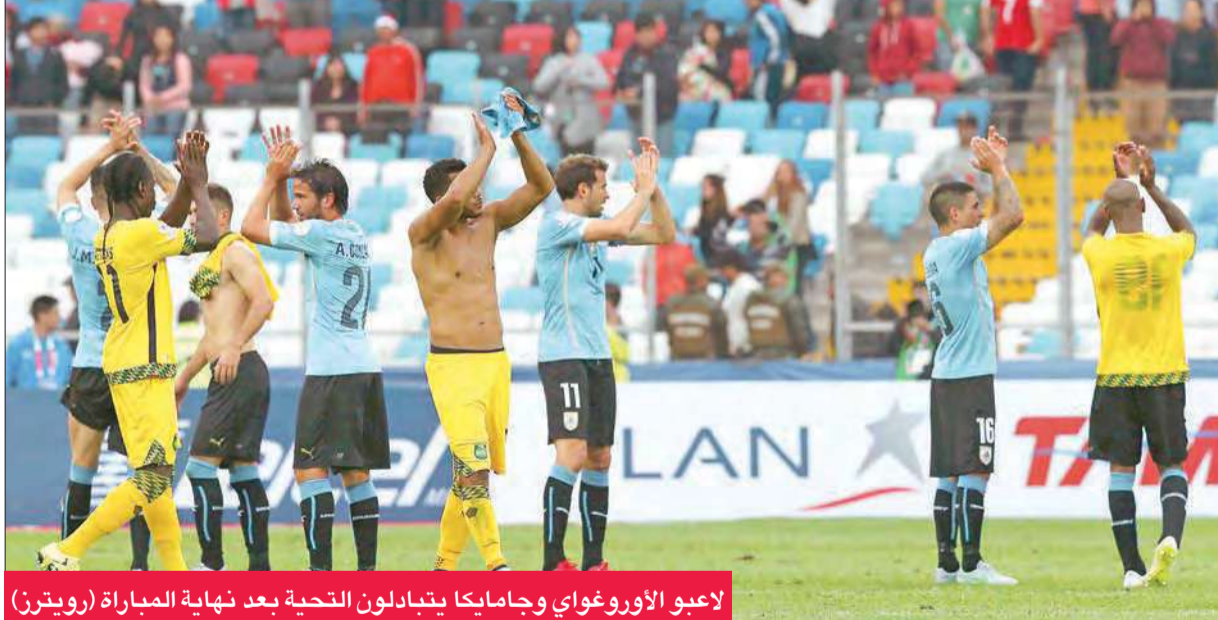
لاعبو الأوروغواي وجامايكا يتبادلون التحية بعد نهاية المباراة

حقق منتخب الأوروغواي أول انتصار له في حملة دفاعه عن لقبه في كأس كوبا أميركا بصعوبة على نظيره الجامايكي الصيف الجديد 1- صفر أمس الأول في الجولة الأولى من منافسات المجموعة الثانية لبطولة كوبا أميركا في كرة القدم التي تستضيفها تشيلي.