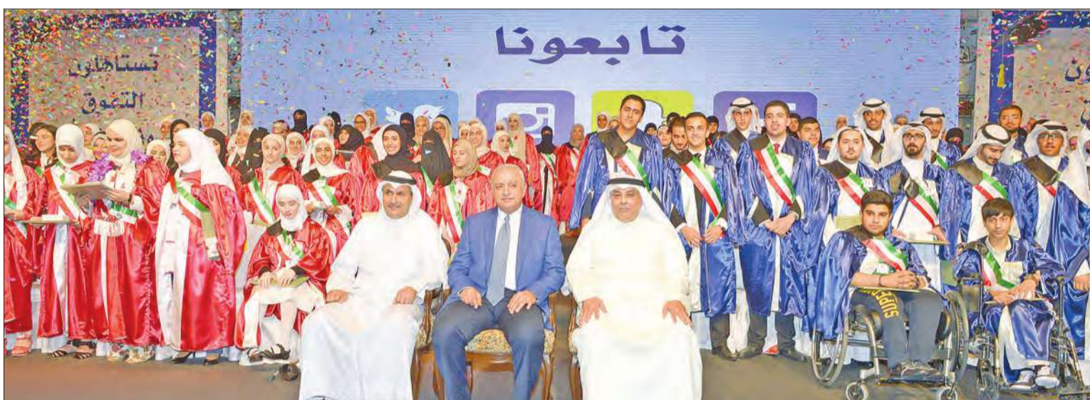
صورة جماعية مع المكرمين