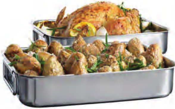
KONCIS علبة تحميص مع حامل للشواء د.ك. 4.900