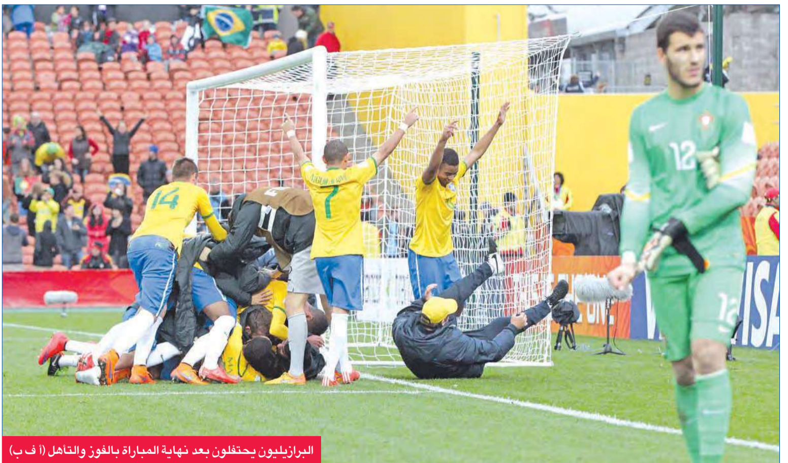
البرازيليون يحتفلون بعد نهاية المباراة بالفوز والتأهل

الأول تحت هذا المسمى عام 2007، رافعة رصيدها إلى 6 القاب (رقم قياسي). وتقام النهائيات في سبع مدن هي أوكلاند، وكريستشورش، ودونيدين، وهاميلتون، ونو بليموث، وآنجاري، والعاصمة ويلينغتون، وهي المرة الثالثة التي تقام فيها النهائيات في أوقيانيا بعد أستراليا 1981 و1993، فيما نظمت نيوزيلندا سابقاً كأس العالم تحت سنّة في 1999 وكأس العالم تحت سنّة للسيدات في 2008.