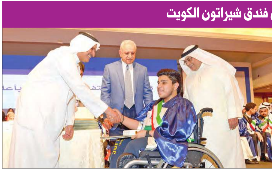
الصرر يهنئ أحد المتفوقين بحضور العيسى

أقام بنك الكويت الوطني، في فندق شيراتون الكويت، حفل تكريم الطلبة الفائقين في امتحانات الثانوية العامة، برعاية وحضور وزير التعليم العالي د. بدر العيسى. وقال العيسى، خلال الحفل، «لحظنا وقوفي أمام الطلبة المتفوقين وتكريمهم تعتبر أسعد اللحظات بالنسبة لي، وأشكر البنك الوطني على دعمه لهذا الحفل، وأتمنى من المحتفي بهم الحرص على ما هو قادم لمواصلة مسيرة النجاح، وأنا على يقين من أنكم لن تدرخوا جهدا في تحقيق