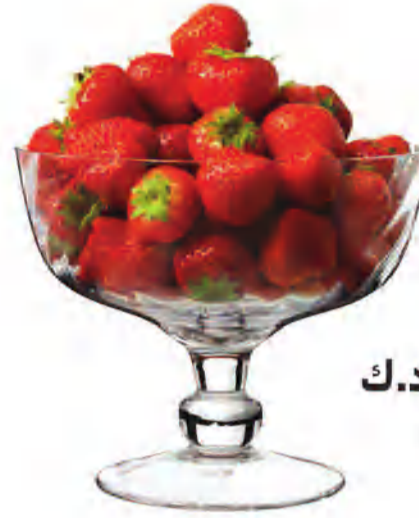
GOTTIS سلطانية تقديم د.ك. 2.750