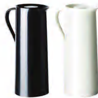
BEHÖVD ثرموس د.ك. 2.500 / للقطعة