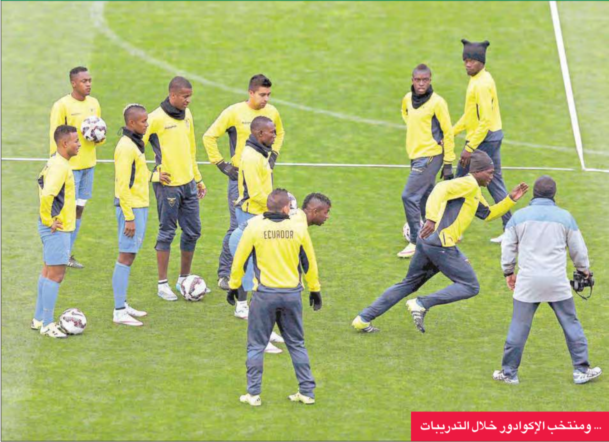
... ومنتخب الإكوادور خلال التدريبات