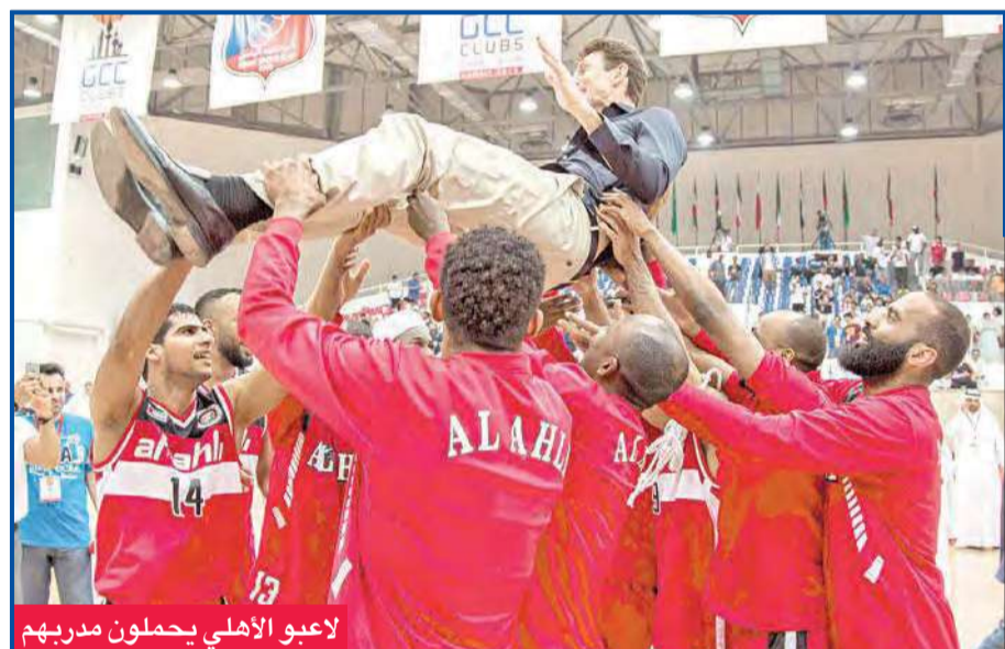
لاعبو الأهلي يحملون مدربهم

قال رئيس الاتحاد الإماراتي المكلف برئاسة الاتحاد العربي لإسماعيل القرقاوي، إن "البطولة العربية للأندية ستقام في نوفمبر المقبل، بمشاركة 16 نادياً عربياً، مشيراً إلى أن "الاتحاد وقع للتو عقداً مع شركة راعية لتنظيم البطولة التي ستستضيفها مدينة دبي في نادي الوصل الإماراتي". وقال القرقاوي إنه يعمل بكل جهد لتنظيم البطولات العربية على مستوى الأندية أو المنتخبات الغائبة عن الساحة في العامين الماضيين، لعدم رغبة الأندية العربية والاتحاد في التنظيم لغياب التسويق"، موضحاً أنه سيسعى بكل