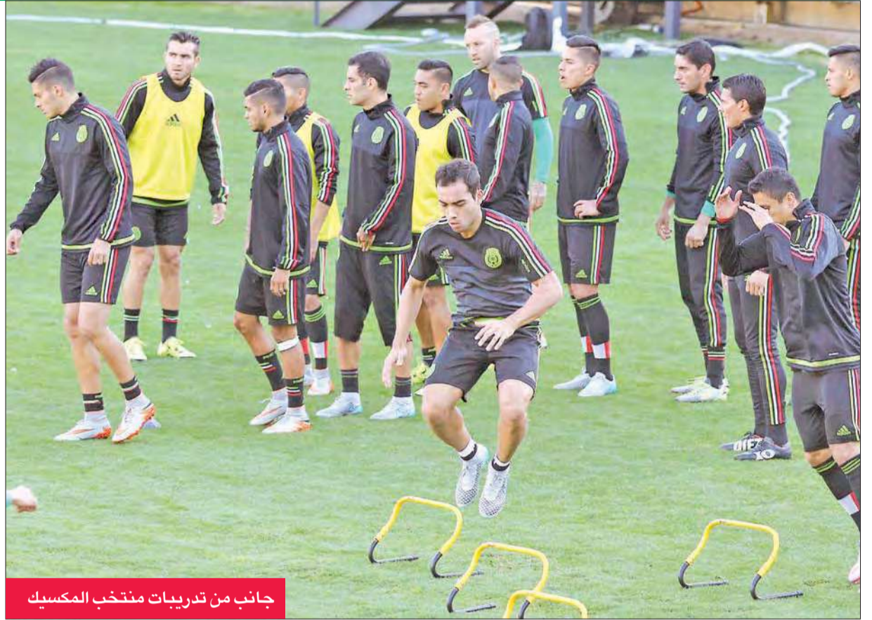
جانب من تدريبات منتخب المكسيك

في «كوبا أميركا» منذ عام 1997، وهو ما يتطلع إلى تغييره هذه المرة بقيادة المدرب موريسيو سورينا. ولكن مهمة الفريق تبدو في غاية الصعوبة أمام المنتخب الإكوادوري العنيد الذي قدم أداءً رائعاً في معظم فترات المباراة الافتتاحية وكان بإمكانه هز شباك أصحاب الأرض في أكثر من مناسبة. ولم يحقق المنتخب البوليفي سوى فوز واحد في آخر 18 مباراة خاضها، ولكن الفريق كان قاص قوسين أو أدنى من الفوز على المنتخب المكسيكي، حيث كانت فرص الفريق هي الأفضل والأخطر في ما كان الاستحواذ والسيطرة على اللعب لمصلحة المنتخب المكسيكي.