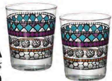
MURKLA كأس د.ك. 0.300 / للقطعة