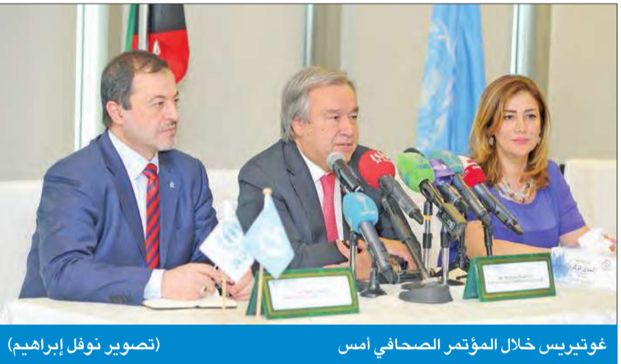
غوتيريس خلال المؤتمر الصحفي أمس