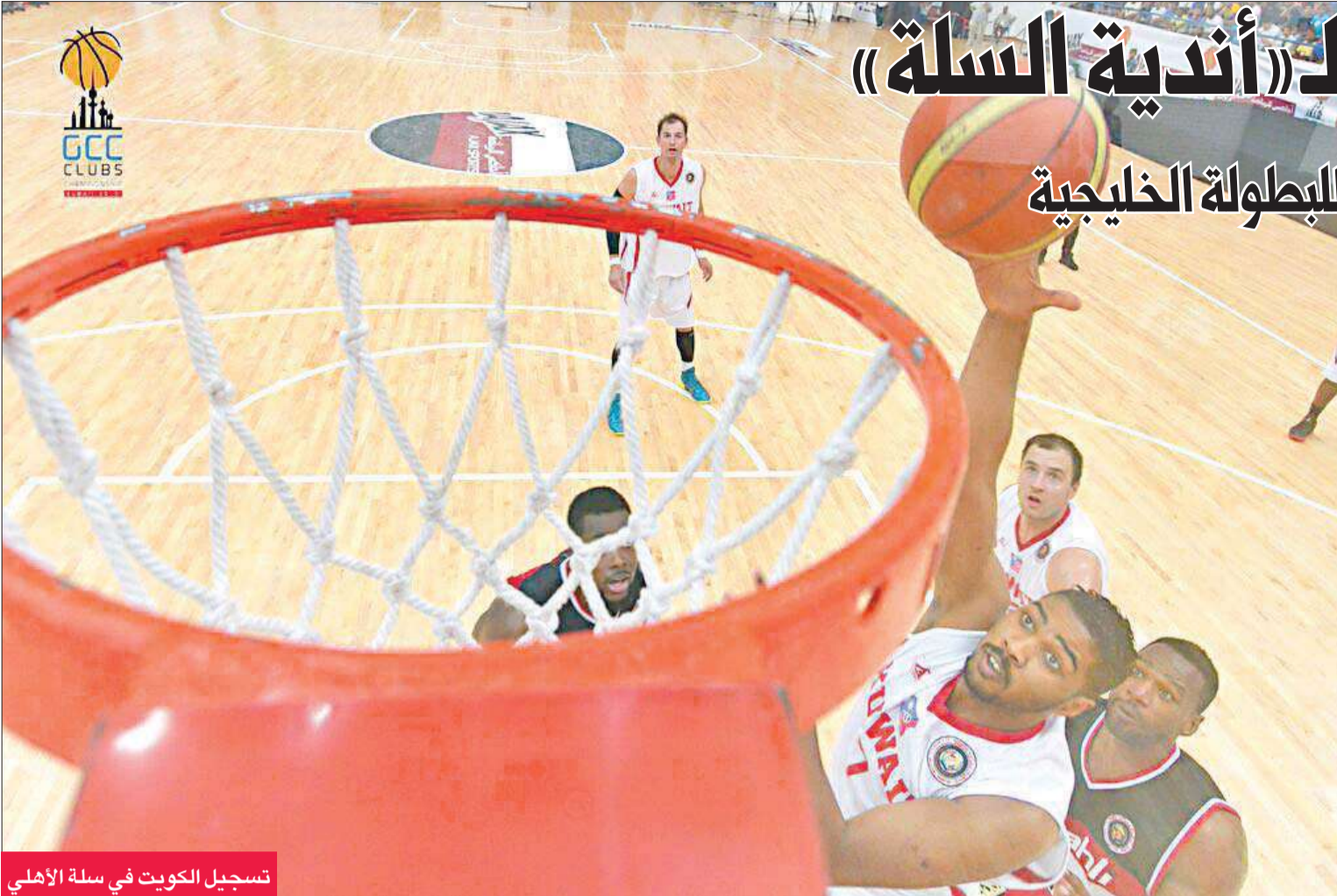
تسجيل الكويت في سلة الأهلي

لقب البطولة بعد أن قدم مستوى لافتاً في المباراة النهائية. هذه هي كرة السلة تعتمد بشكل كبير على التوفيق الذي غاب عن الكويت في المباراة.