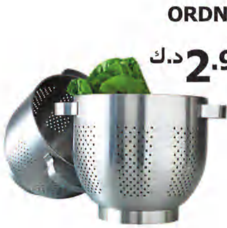
ORDNING مصفاة د.ك. 2.900