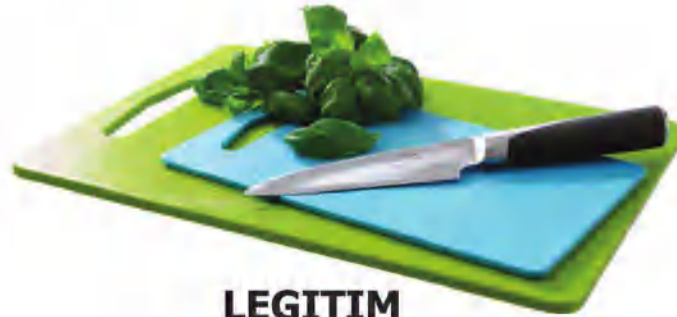
LEGITIM لوح تقطيع، طقم من 2 د.ك. 0.950