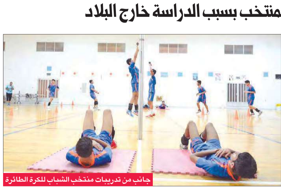
جانب من تدريبات منتخب الشباب لكرة الطائرة

تدريبات المنتخب بحيث يصل العدد إلى 14 لاعباً ليستقر عليهم المنتخب لتمثيل الكويت في البطولتين المقبلتين، مؤكداً أن الفريق يضم لاعبين على مستوى جيد وخامات طيبة سيكون لها شأن كبير في المستقبل.