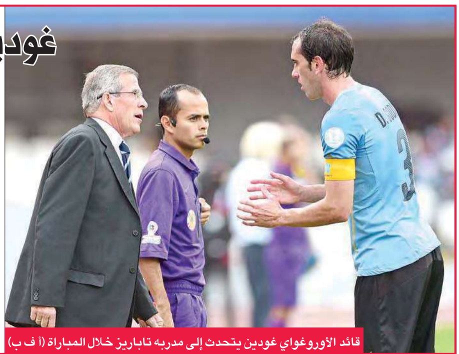
قائد الأوروغواي غودين يتحدث إلى مدربه تابارين خلال المباراة

قال المدير الفني لمنتخب الأوروغواي أوسكار تابارين إن فريقه بحاجة إلى التحسن في أسرع وقت،