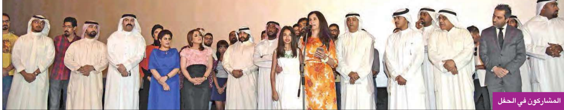
المشاركون في الحفل