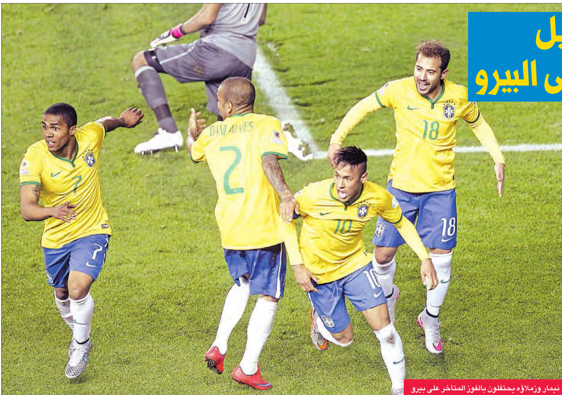
نيمار وزملائه يحتفلون بالفوز المتأخر على بيرو

انتزع منتخب البرازيل فوزاً صعباً من منافسه البيرو 2-1، في المباراة التي أقيمت أمس ضمن الجولة الأولى من مسابقة كوبا أميركا 2015 في تشيلي.