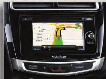
نظام ميتسوبيشي متعدد الإتصالات مع نظام ملاحى GPS