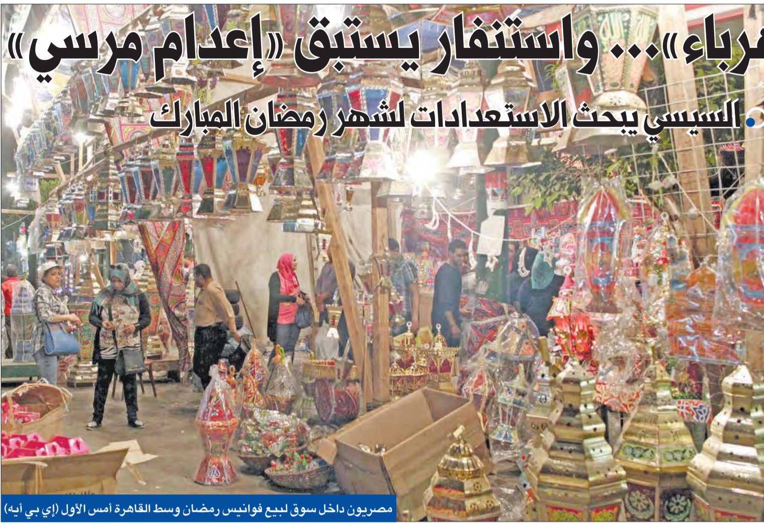
مصريون داخل سوق لبيع فوائيس رمضان وسط القاهرة أمس الأول

القاهرة - شيمة جلال وخالد عبده ومحمد يحيى