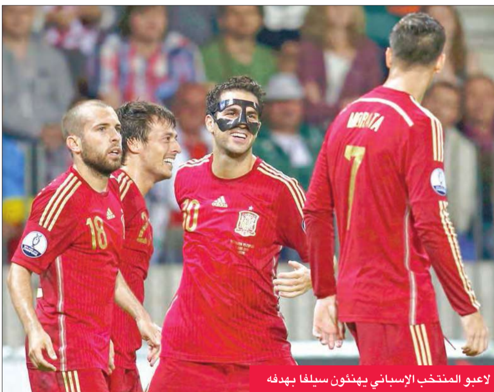
لاعبو المنتخب الإسباني يهنئون سيلفا بهدفه

ويغيفن كونوبليانكا (86). ورفعت أوكرانيا رصيدها إلى 12 نقطة، بينما وقف عداد لوكسمبورغ على نقطة واحدة.