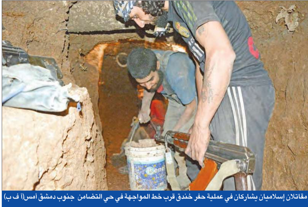
مقاتلان إسلاميان يشاركان في عملية حفر خندق قرب خط المواجهة في حي التضامن جنوب دمشق أمس

«الفتح» يواصل تقدمه في مثلث سهل الغاب والأسد يحشد • ديمستورا يجس النبض بدمشق على وقع هزائم النظام