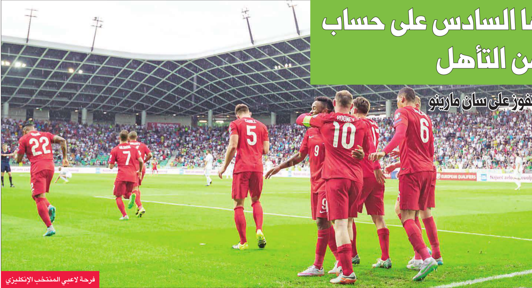
فرحة لاعبي المنتخب الإنكليزي

وفي تالين، وضمن المجموعة ذاتها، فازت أستونيا على سان مارينو -2 صفر، سجلها سيرغي زينيوف (35 و 63)، ليرتفع رصيدها إلى 7 نقاط، مقابل نقطة واحدة للخاسرة.