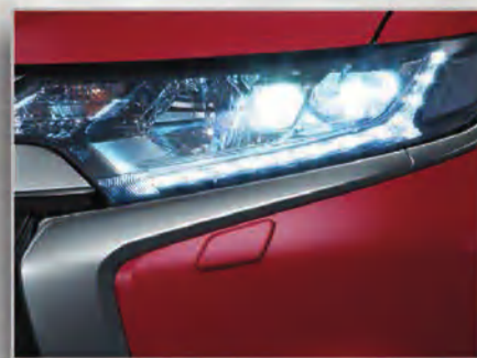
مصابيح أمامية رئيسية مع مصابيح نهائية LED