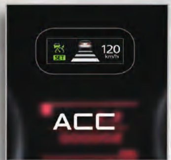
نظام التحكم بثبات سرعة السيارة التكيفي ACC