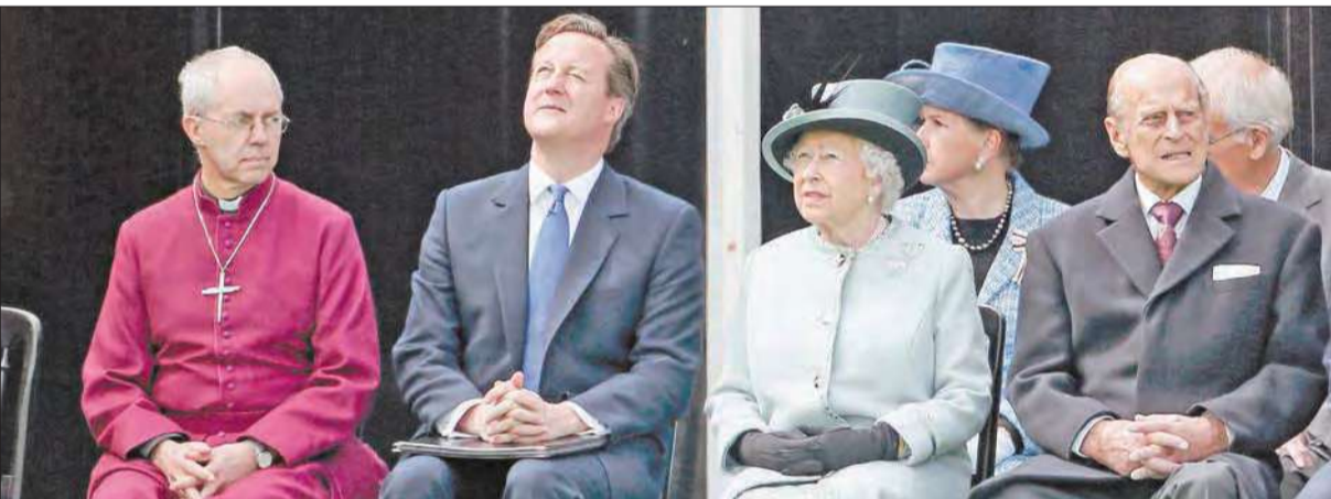
الملكة وكاميرون يتوسطان الأمير فيليب وكبير أساقفة كنيسة كاثوليك جاستين ويلبي خلال الاحتفال أمس (رويترز)

أكثر من 150 حفلة شاي في المناسبة • كاميرون: الوثيقة غيرت العالم