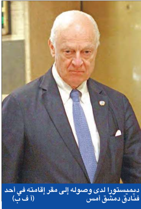
ديمستورا لدى وصوله إلى مقر إقامته في أحد فنادق دمشق أمس