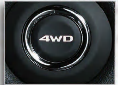
نظام سوپر سيلكت للدفع الرباعي AWC