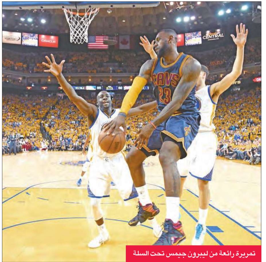
تمريرة رائعة من ليبرون جيمس تحت السلة

التعامل على أنها مباراة واحدة، وتتطلع إلى الفرصة التي لديها الثلاثاء لغرض مباراة سابعة». وأضاف: «سنعود إلى اللعب على أرضنا في المباراة السادسة، ولدينا ما يكفي للفوز بها، وأشعر بالثقة بذلك.»