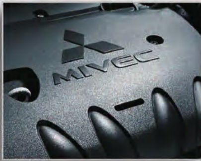
متوفر بمحركين 2.0 و 3.0 ليتر MIVEC