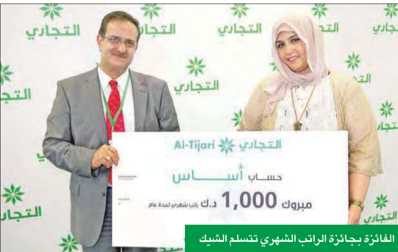
الفائزة بجائزة الراتب الشهري تتسلم الشيك

على بطاقة ماستركارد تيتانيوم الائتمانية الجديدة، والاستفادة من خدمة المساعد الشخصي في الكويت، ودخول مجموعة من قاعات رجال الأعمال في فروع الأوساط، وكذلك الحصول على بطاقة فيزا مسبقة الدفع مجاناً والاستمتاع بالعديد من الخصومات في العديد من المطاعم والمتاجر ومحلات التجزئة.