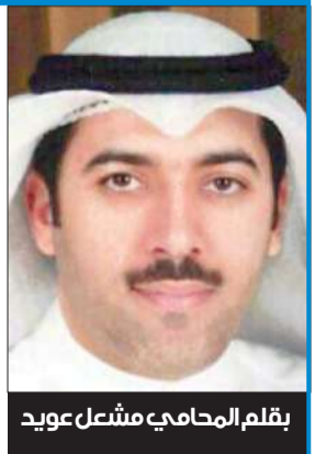
بقلم المحامي مشعل عوييد

وأستناداً للنص الدستوري سالف الذكر، أصدر المشرع العادي قانون المحكمة الدستورية رقم (14/1973) الذي ينظم تشكيل المحكمة الدستورية واختصاصاتها، ومنها الفصل في المنازعات المتعلقة بدستورية القوانين والمراسيم بقوانين واللوائح. ذلك أن الفترة بين صدور الدستور عام 1962 حتى صدور قانون المحكمة الدستورية عام 1973 لم يكن هناك وجود للرقابة على دستورية القوانين من أي جهة قضائية. ما سبب ماساسا بالمراكز القانونية في الحقوق والحريات الفردية والعامة الدستورية، فجاءت الحاجة ملحة في إصدار قانون