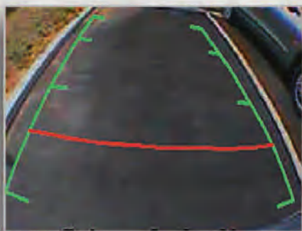
كاميرا الرؤية الخلفية