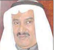
السفير يوسف عبدالعزیز

تكملة للرحلة إلى غوايانا الفرنسية، فبعد أن قضينا يومين في سورينام، وفي اليوم المحدد لنا للمغادرة حملنا أمتعتنا وذهبنا إلى المطار، حيث فوجئنا ببإعلانها المقررة إلى مدينة "كاينا" عاصمة غوايانا الفرنسية، بسبب الإضرابات والمظاهرات، وهنا وصل الكرم السورينامي حده، حيث قامت شركة الخطوط السورينامية بوضع طائرة صغيرة تحت تصرفنا بإمكانها الهبوط بأحد المطارات الصغيرة خارج العاصمة كايينا، كانت الطائرة من الصغر بحيث إنها بالكاد تتسع لشخصين إضافة للطيار ومساعدته.