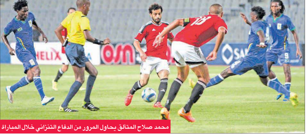
محمد صلاح المتألق يحاول المرور من الدفاع التنزاني خلال المباراة

حساب محمد صلاح، وأهدر باسم مرسى فرصة لزيادة النتيجة قبل نهاية المباراة ليحتفي الفراعنة بثلاثية.