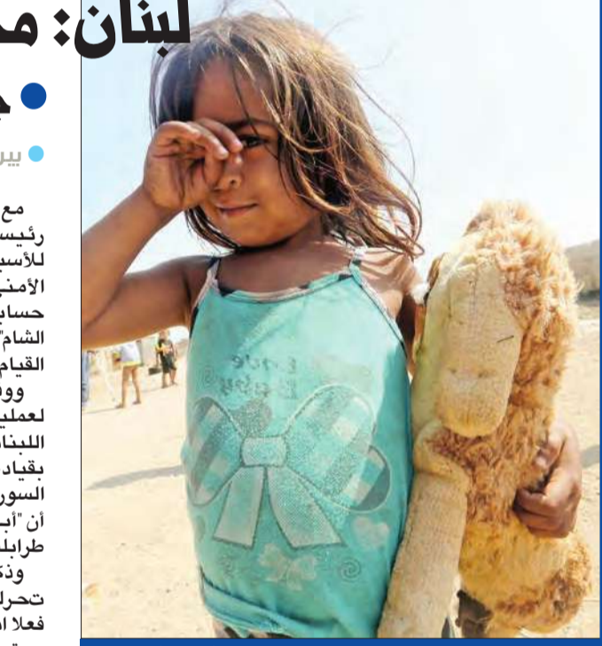
طفلة سورية في احد المخيمات شمال لبنان أمس

وتذكرت مصادر أمنية أن «الأجهزة استغفرت لرصد أي تحرك للخلايا الإرهابية، وللتحقق ما إذا كان تسلل فعلا أبو قتادة إلى طرابلس»، لافتة إلى أن «الأجهزة الأمنية مستمرة في السهر على الوضع الأمني، ولن تسمح لأي فريق