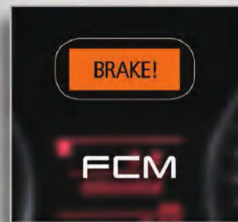
نظام تخفيف حدة الصدمة الأمامية FCM