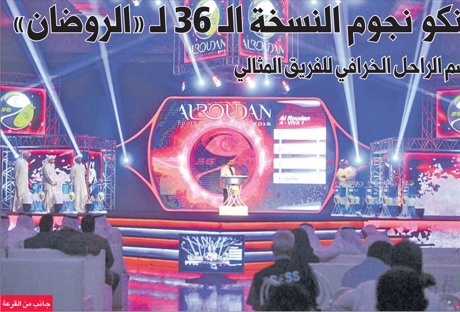
جانب من القرعة