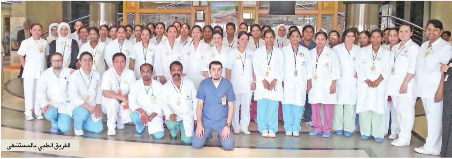
الفريق الطبي بالمستشفى