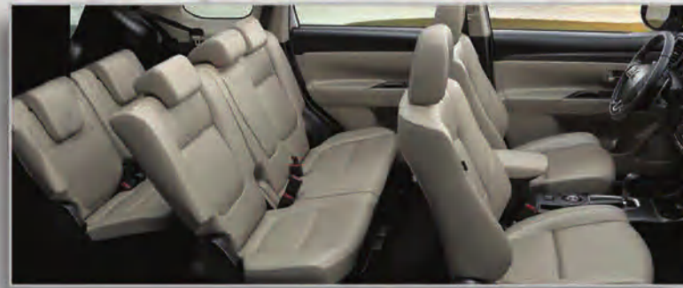
مساحة وراحة تمنحك الحرية - مقاعد الصفين الثاني والثالث عملية وقابلة للطي