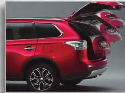
الباب الخلفي الكهربائي