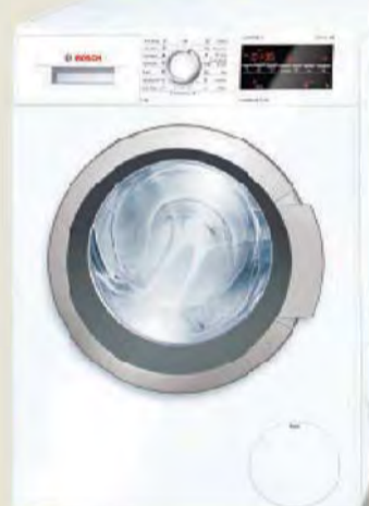
وأضاف: «نحن سعداء اليوم لتقديم هذه الغسالة