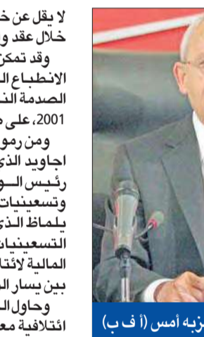
كليشدار خلال اجتماع حزبه أمس

وقال معلقون موالون للحكومة، إن ائتلافاً ضعيف الأداء يمكن أن يغري الناخبين بالعودة إلى خيار حكم العدالة والتنمية. وكتب نايجيهان الجي من صحيفة «الصباح»: «ستكون تجربة مؤلمة، لكنها جيدة، لأنها ستعبد إلى ذاكرتنا كيف كانت تركيا من دون حزب العدالة والتنمية».