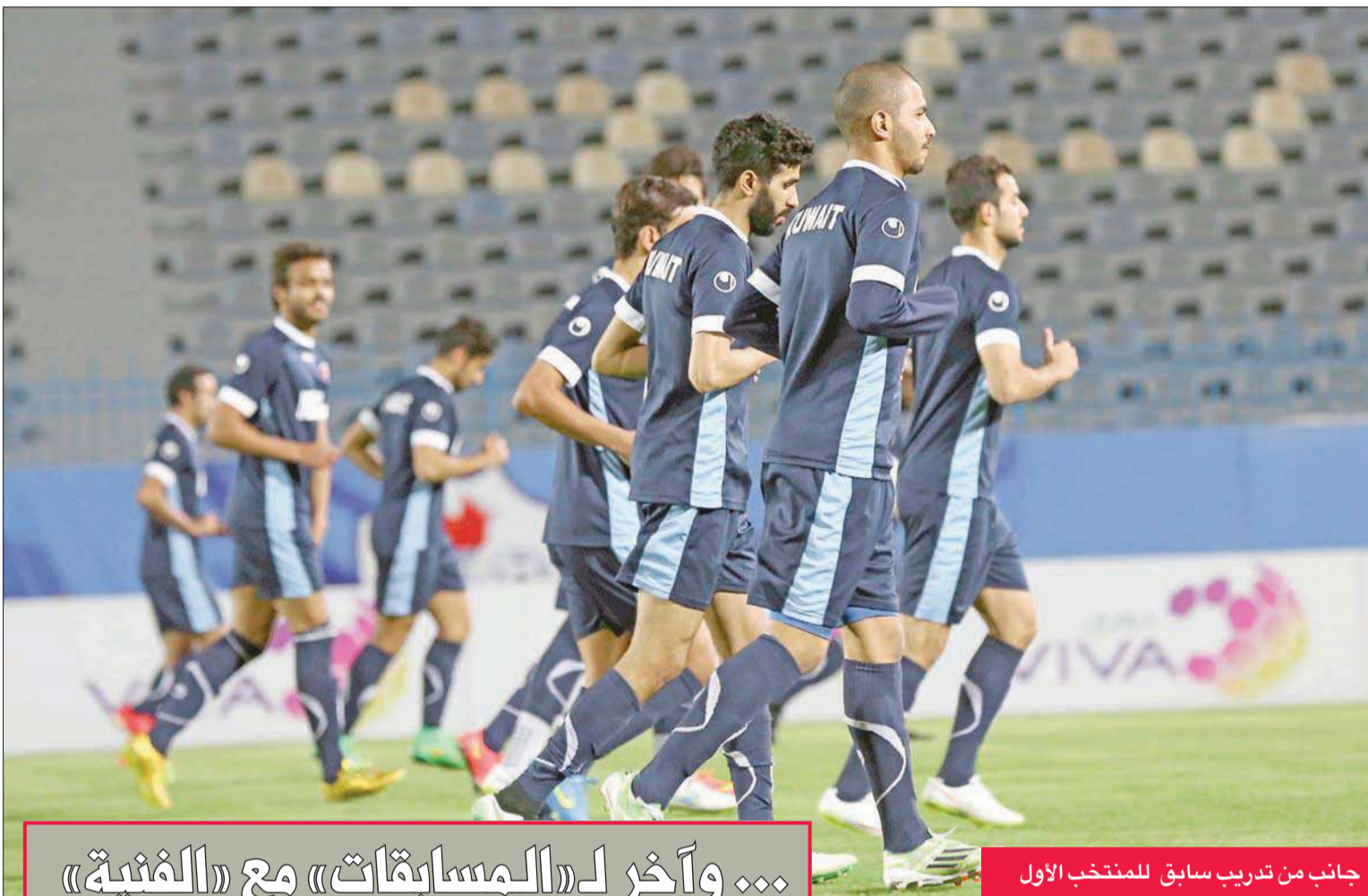
جانب من تدريب سابق للمنتخب الأول