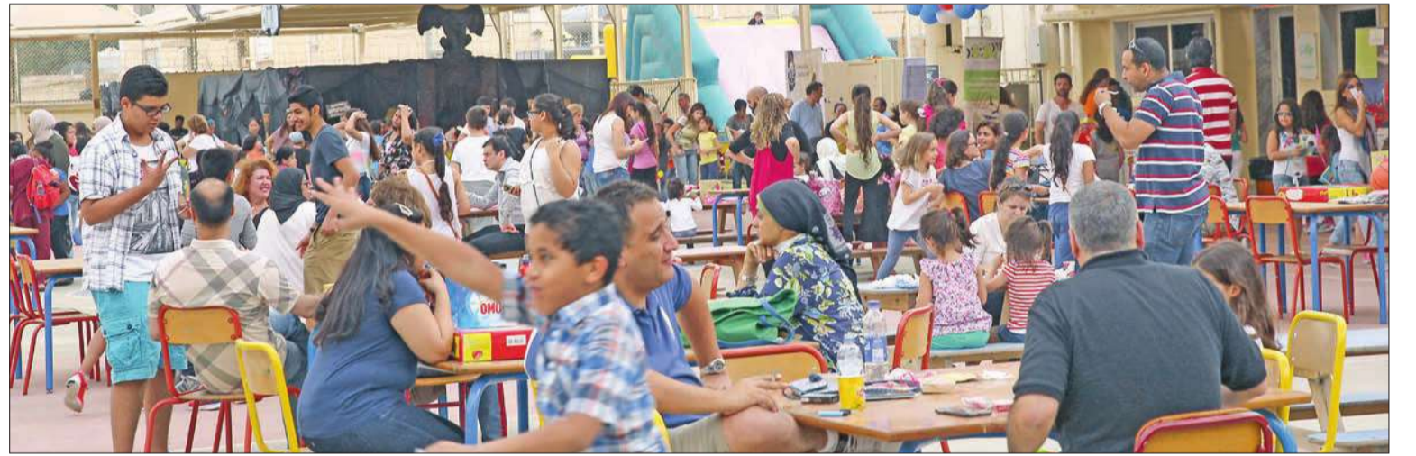
جانبا من الحضور