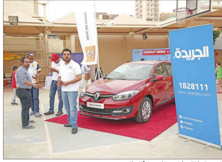
«الجريدة» خلال مشاركتها في رعاية الحفل