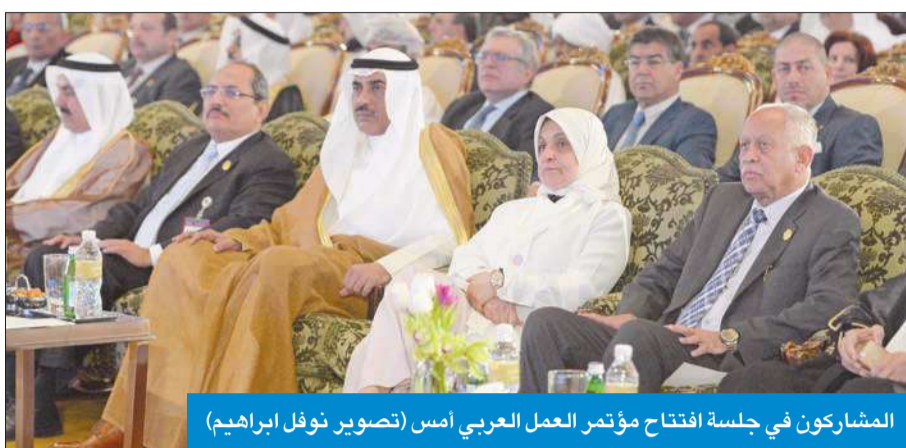
المشاركون في جلسة افتتاح مؤتمر العمل العربي أمس

● الصيغ: نسعى إلى العمل المشترك تحقيقاً لخير الإنسان ● لقمان: البطالة تنخر الجسم العربي ومعدلها 17%