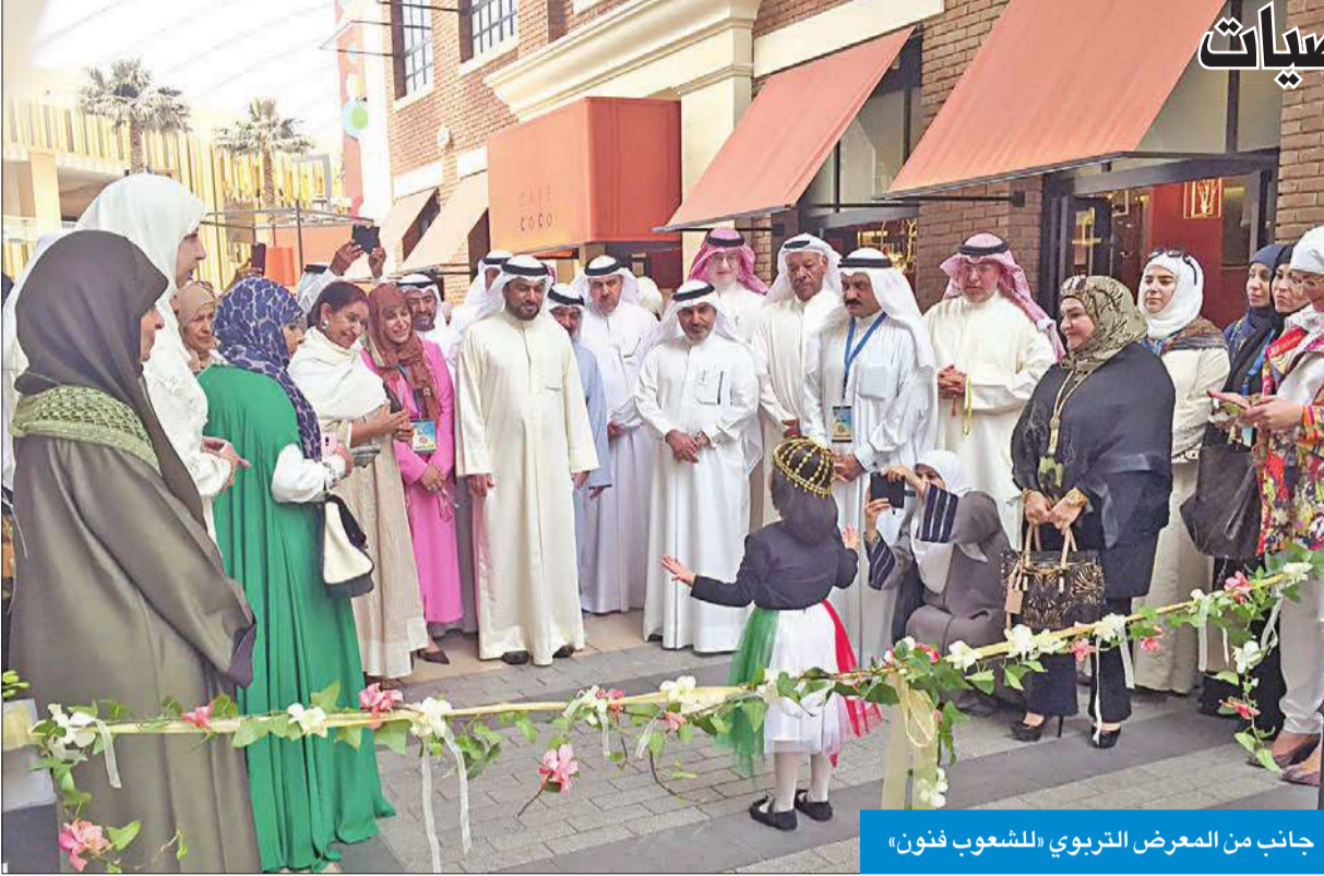
جانب من المعرض التربوي للشعوب فنون»