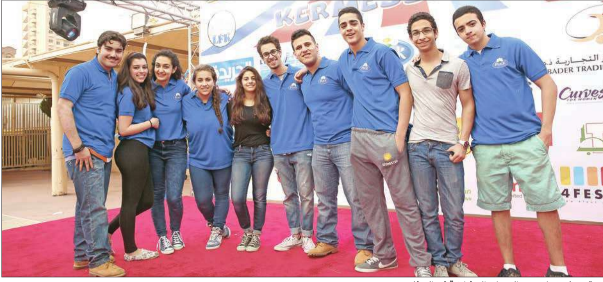
فريق 'بوك'، تعاون مع الجهات المشاركة في الحفل