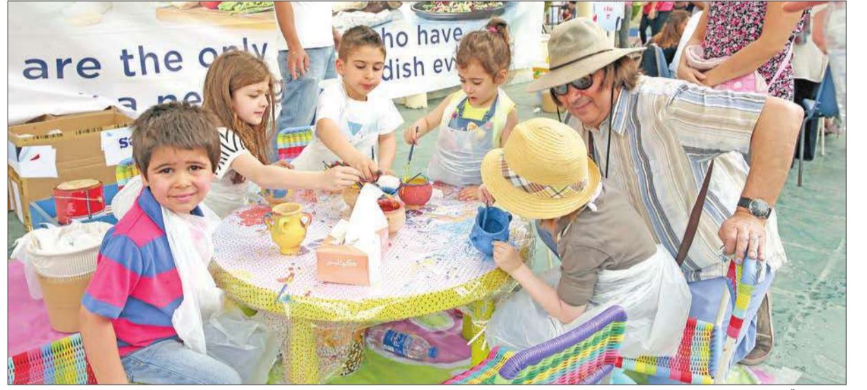
ورشة فنية للأطفال