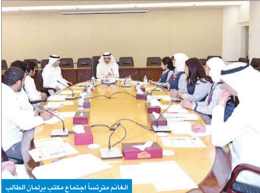
الغائم مترأساً اجتماع مكتب برلمان الطالب

لاول مرة بحث وإقرار جدول أعمال برلمان الطالب الذي يعقد جلسته السنوية اليوم في قاعة عبدالله السالم.