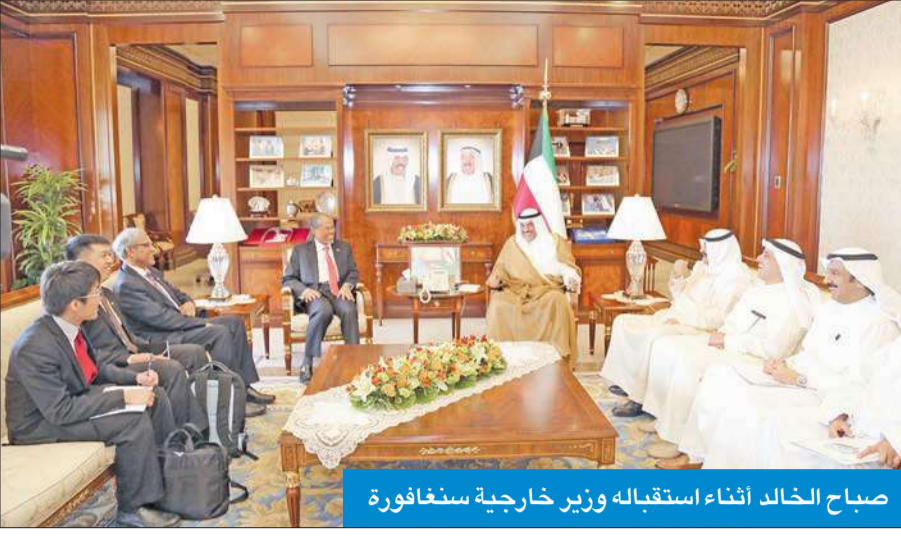
صباح الخالد أثناء استقباله وزير خارجية سنغافورة

جدد رئيس مجلس الوزراء بالإنيابة وزير الخارجية الشيخ صباح الخالد موقف دولة الكويت الداعم للشرعية في اليمن، برئاسة الرئيس عبدربه منصور هادي. وأكد الشيخ صباح الخالد، خلال لقائه وزير الخارجية اليمني المكلف الدكتور رياض ياسين بمناسبة زيارته للبلاد، موقف الكويت الداعم كذلك لإعادة الأمن والاستقرار إلى اليمن وشعبه الشقيق، بما يصون سيادته ووحدته اراضيه من خلال تنفيذ قرارات مجلس