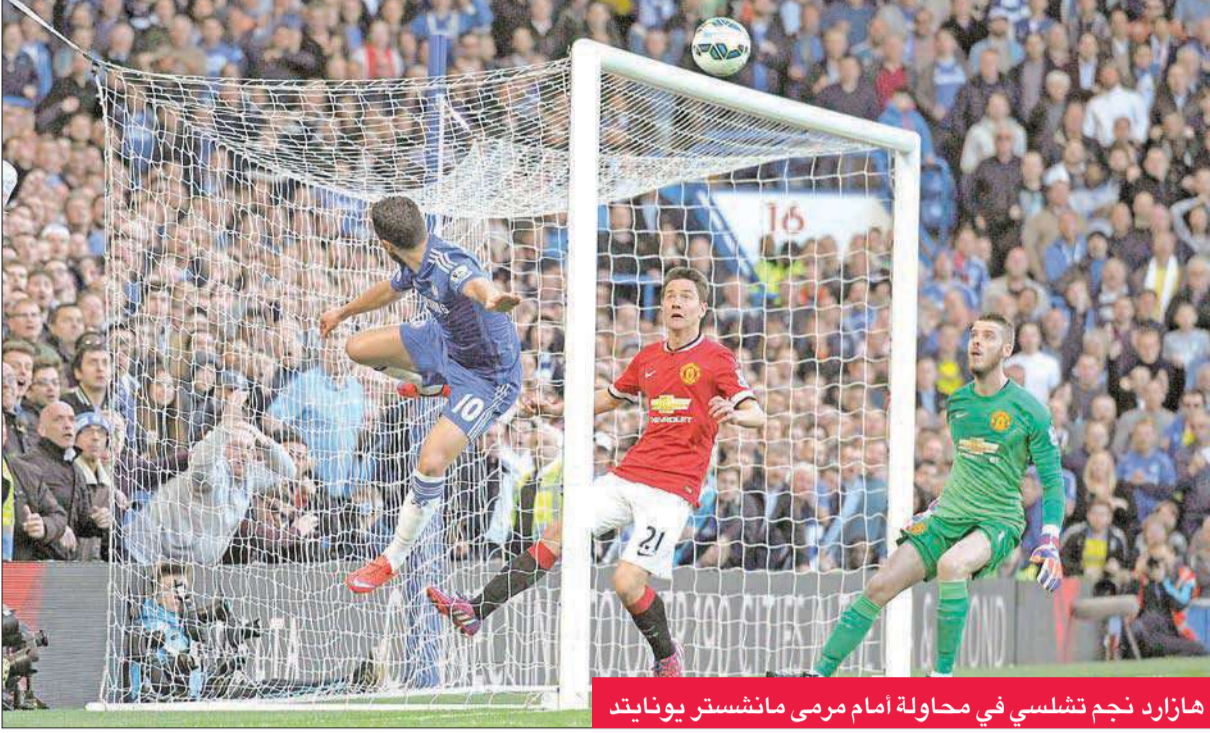
هازارد نجم تشلسي في محاولة أمام مرمرى مانشستر يونايتد

في رحلة الهروب من الهبوط، محققاً انتصاراً ثالثاً على التوالي على حساب سوانزي سيتي التاسع -2 صفر.