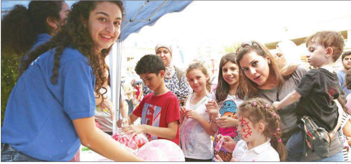
مشاركة الأهل وأبنائهم في المسابقات

حقق «الكرمس» السنوي لمدرسة الكويت الفرنسية الخاصة نجاحاً كبيراً، حيث أمضى الحاضرون من الطلبة وأهاليهم والهيئة التعليمية والإدارية أوقاتاً رائعة ومميزة، تخللتها ألعاب متنوعة وعروض شائقة. وقدمت إدارة المدرسة شكرها إلى الرعاية الرسميين الرئيسيين الذين يمثلون في مجموعة الباطلين وشركات «اليسباس» و«أومو» و«بوك» وجريدة الجريدة، وشركة البدر التجارية وشركة الكويت للتأمين وفندق السفير، وشكرت أيضاً أولياء الأمور لتفانيهم بالمدرسة.