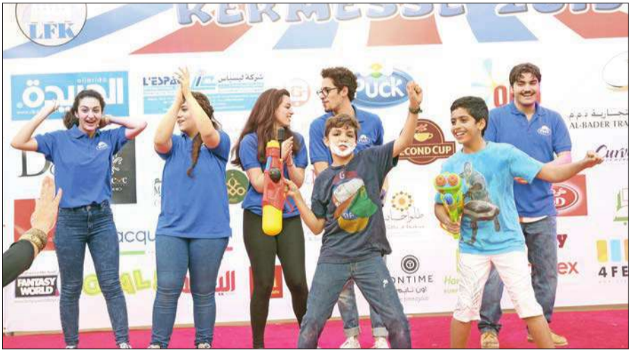
طلاب وطالبات مشاركون