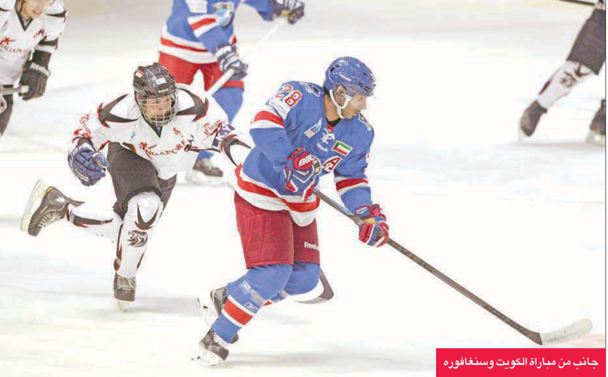
جانب من مباراة الكويت وسنغافوره