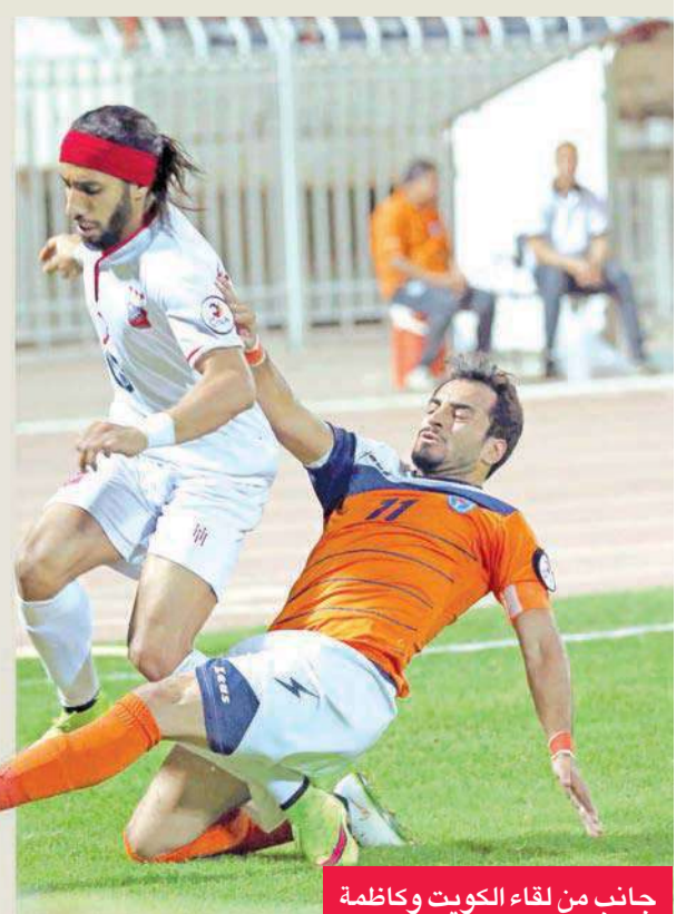
جانب من لقاء الكويت وكاظمة