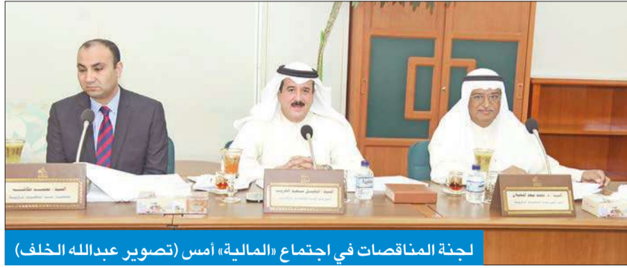
لجنة المناقصات في اجتماع «المالية» أمس

الشايح: نحرص على قانون يحقق الشفافية ويحافظ على المال العام