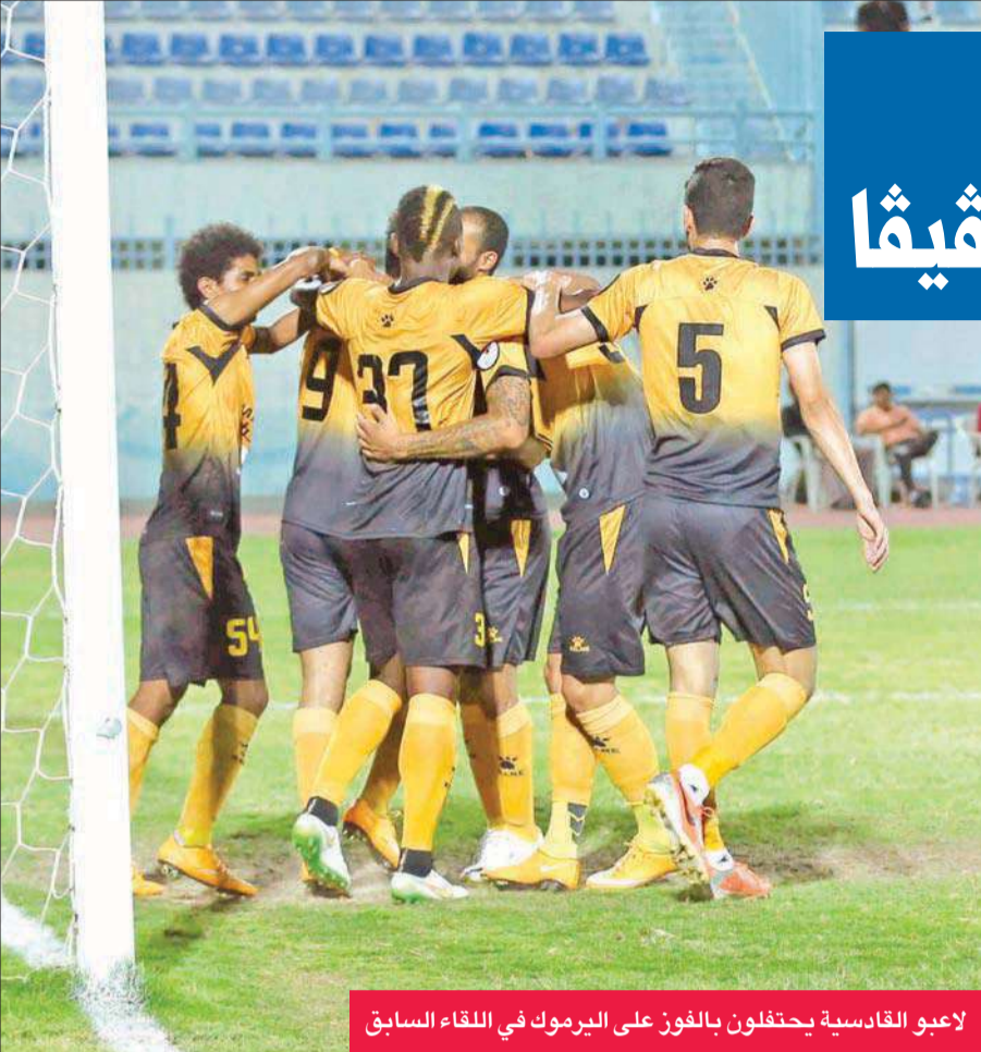
لاعبو القادسية يحتفلون بالفوز على اليرموك في اللقاء السابق