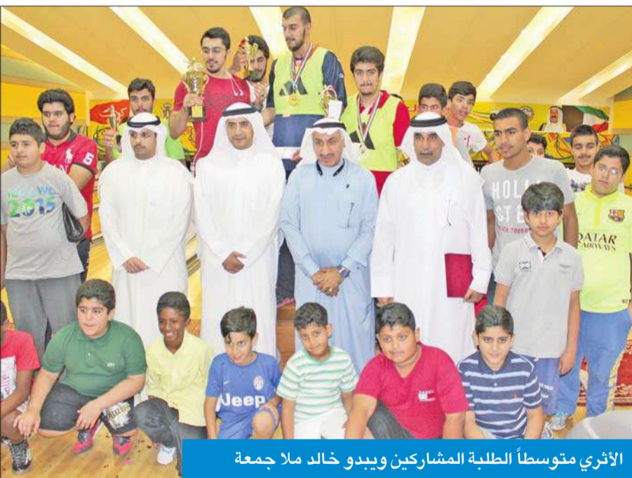
الأثري متوسطاً الطلبة المشاركين وبدو خالد ملا جمعة

اختتمت وزارة التربية بطولة البولينغ الثانية للمواهب الطلابية، التي نظمتها مركز العاصمة للبولينغ «بنين» برعاية وحضور وكيل وزارة التربية د. هيثم الأثري وحضور عبدالله سالم العدواني ممثلاً وزارة الدولة لشؤون الشباب.