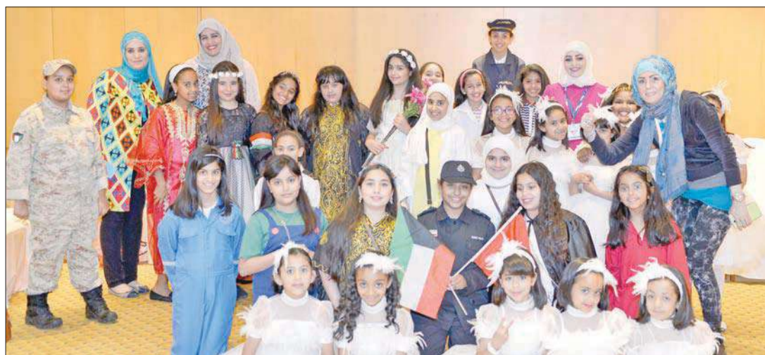
صورة تذكارية مع الفرق المشاركة في الحفل