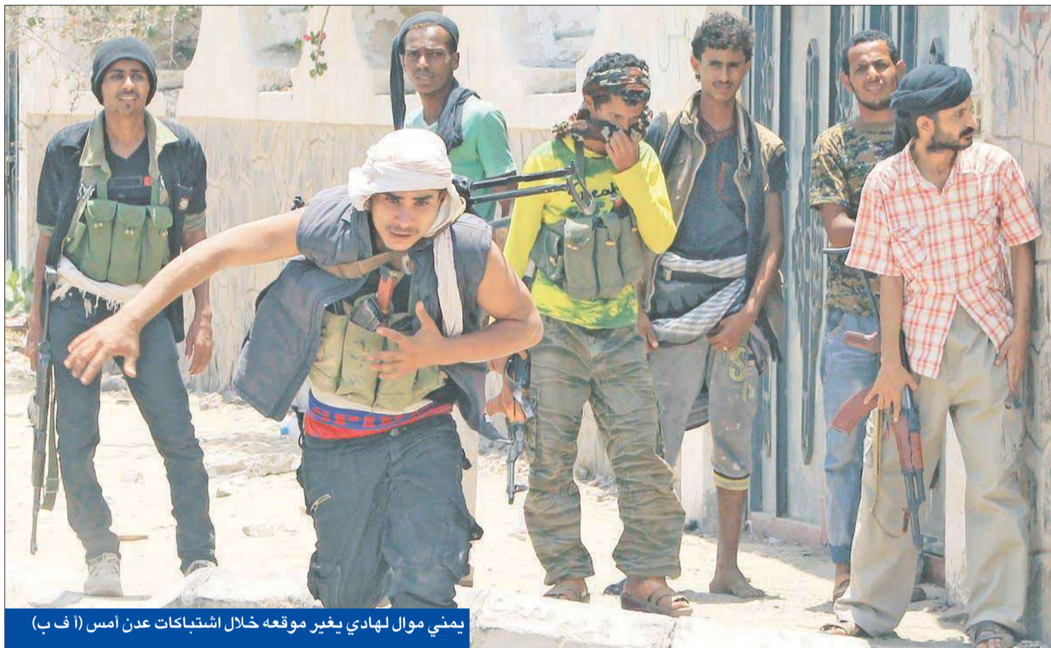
يميني موال لهادي يغير موقعه خلال اشتباكات عدن أمس

مقاتلات «إعادة الأمل» تقصف عدة مناطق • طهران تتراجع وتغير مسار سفنها بعيداً عن اليمن