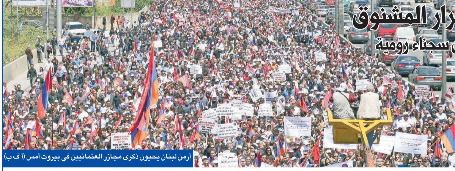
أرمن لبنان يحيون ذكرى مجازر العثمانيين في بيروت أمس

ووضح الحريري خلال استقباله منسقي تيار المستقبلة، في واشنطن وبوسطن ونيويورك وميشيغان ونورثون وكونيتيكت ولندن وويديسور في مقر إقامته في العاصمة الأميركية واشنطن، إن "تيار المستقبل هو تيار أمل، من أجل لبنان، وهو مستمر في خط الرئيس الشهيد رفيق الحريري وفي مواجهة قوى التطرف أياً كانت داخل لبنان أو خارجه." وأضاف: "نحن نحارب قوى التطرف على اختلافها سواء كان اسمها حزب الله أو القاعدة،