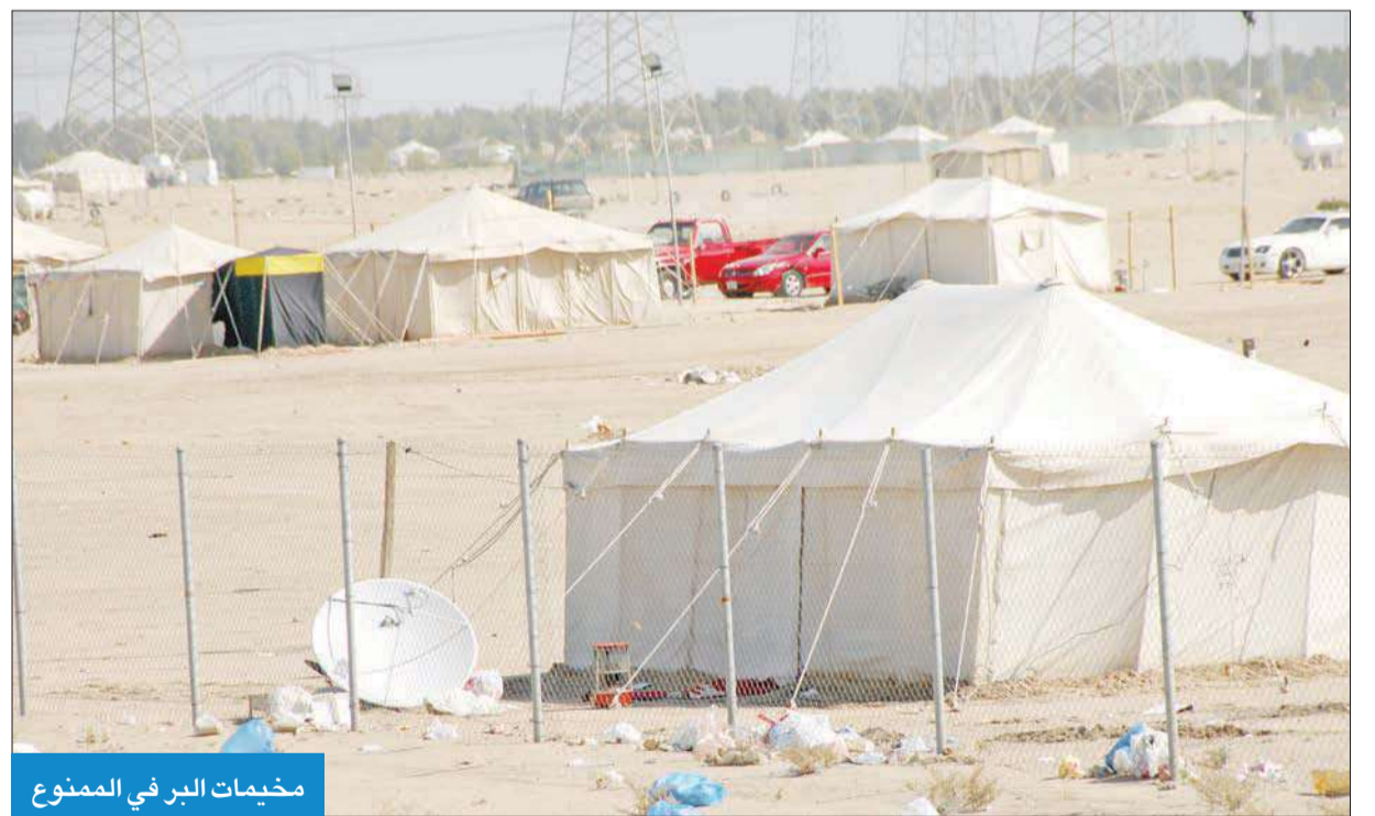
مخيمات البر في الممنوع