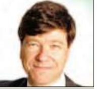
جيفري د. ساكس*