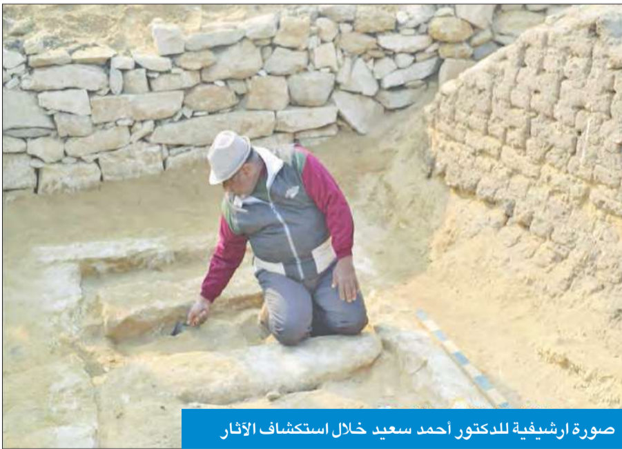
صورة ارشيفية للدكتور احمد سعيد خلال استكشاف الآثار

«سعيد تطرق إلى المقابر والآثار التي تعود إلى ما قبل الميلاد»