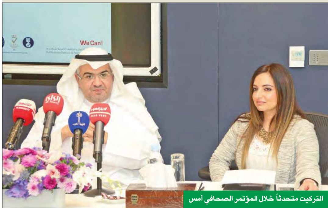
التركيت متحدتاً خلال المؤتمر الصحافي أمس

في الموارد البشرية، لافتاً إلى نجاح الشركة في تنظيم ملتقى التوظيف الخليجي في خمس دورات، كما حققت الشركة نجاحات كبيرة خلال مسيرتها منذ تاسسها عام 2000، كان أهمها إدارة مشروع التعهد العام للسان والمباني والمنشآت بالكويت لعام 2011 لصالح الإدارة المركزية للإحصاء، وضمت أول موقع للتعداد الإلكتروني في الكويت، كما نجحت في إدارة وتشغيل أول مركز اتصال حكومي لصالح الإدارة المركزية للإحصاء. وبين التركيت أن الشركة تعمل أيضاً على تقديم خدماتها في التوظيف والموارد البشرية لسوق العمل في الكويت، مبيناً أن كاني اليوم تضم 7 شركات تابعه متخصصة في خدمات الأعمال المساندة وهي: مركز الآراء الخليجية لاستطلاعات الرأي العام والإحصاء، وشركة كتالست للخدمات والاستشارات البيئية، والشركة الخليجية لإدارة مراكز الاتصال، وشركة كمبيو كور لتقنية المعلومات، ومعهد كاني للتدريب والتأهيل الوظيفي، وكاني أيفنتس لتنظيم المؤتمرات، وكاني للرعاية الطبية وكفاءة لخدمات الأعمال بدولة قطر.