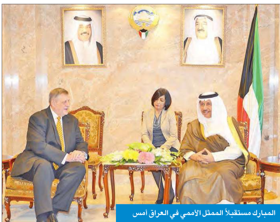
المبارك مستقبلاً الممثل الأممي في العراق أمس

استقبل رئيس مجلس الوزراء سمو الشيخ جابر المبارك، بحضور النائب الأول لرئيس مجلس الوزراء وزير الخارجية الشيخ صباح الخالد في قصر السيف أمس، الممثل الخاص للأمين العام للأمم المتحدة في العراق بيان كويش، وذلك بمناسبة زيارته للبلاد.