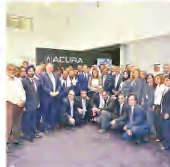
فريق عمل أكورا