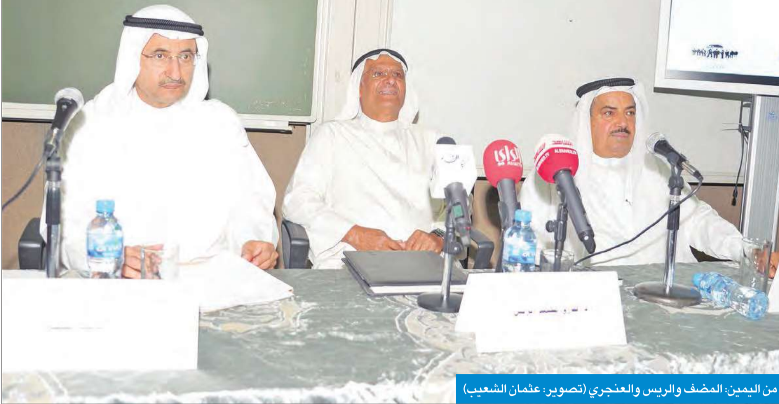
من اليمين: المصنف والريس والعنبري

أكد نائب رئيس مجلس الأمة وزير العدل والشؤون القانونية السابق مشاري العنبري، أن الوضع الإداري سيئ، حيث تفشت فيه الرشوة، وزادت المشاكل، ووصلنا بمدركات الفساد إلى أرقام متقدمة، وتراجعنا على جميع الصعد.