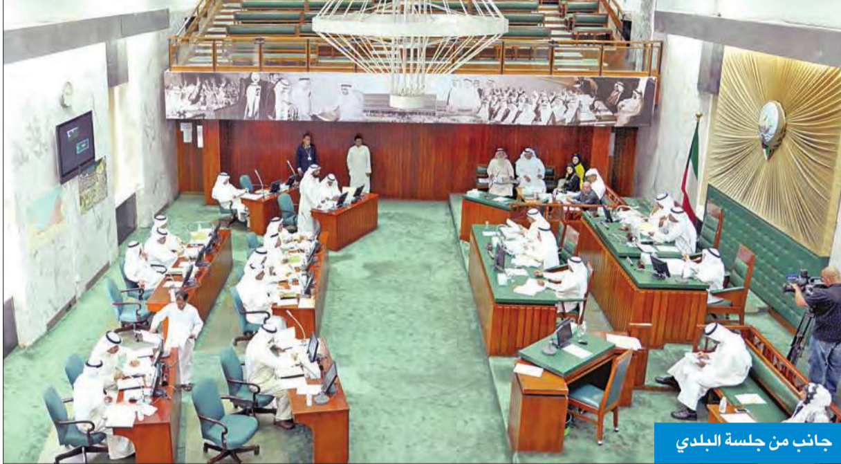
جانب من جلسة البلدي