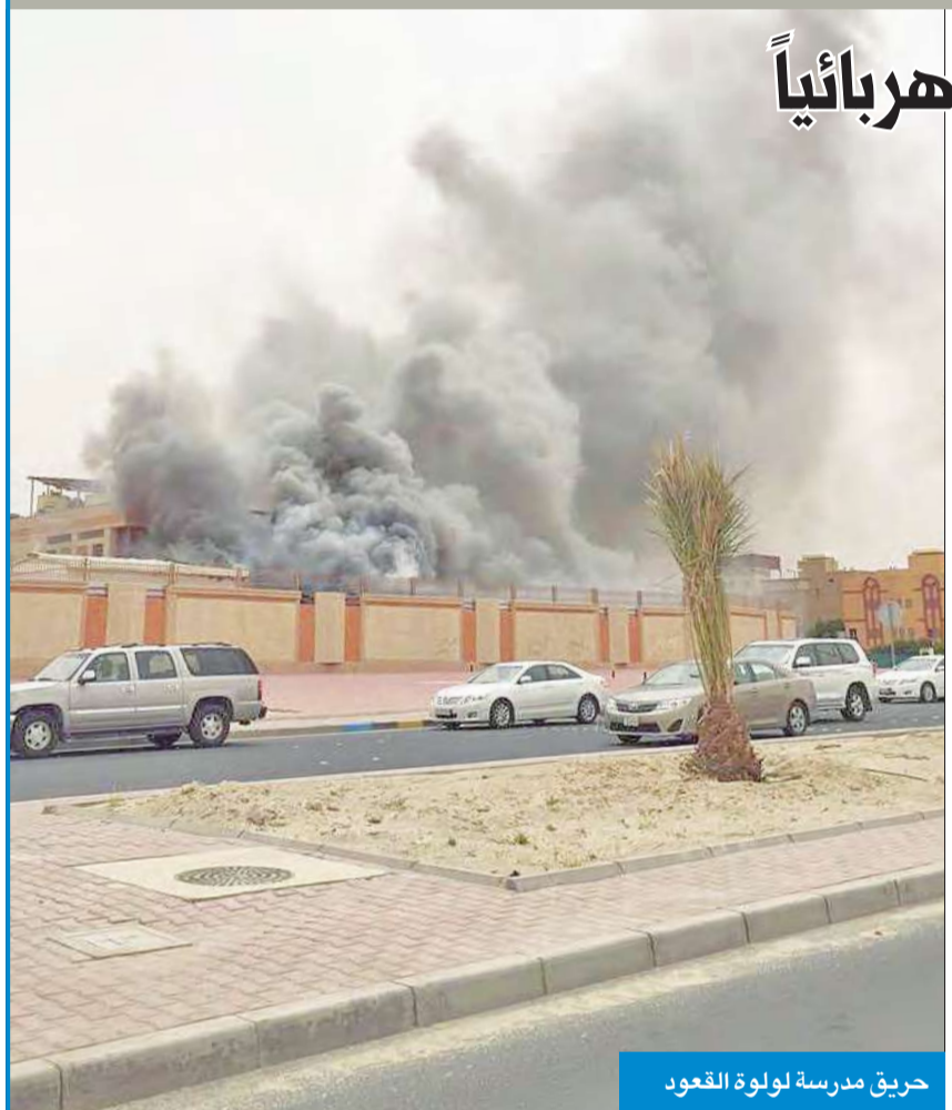
حريق مدرسة لولوة القعود

«الإطفاء»: أتى على فصلي «كيريبي»... والتحقيق الأولي يكشف تماساً كهربائياً