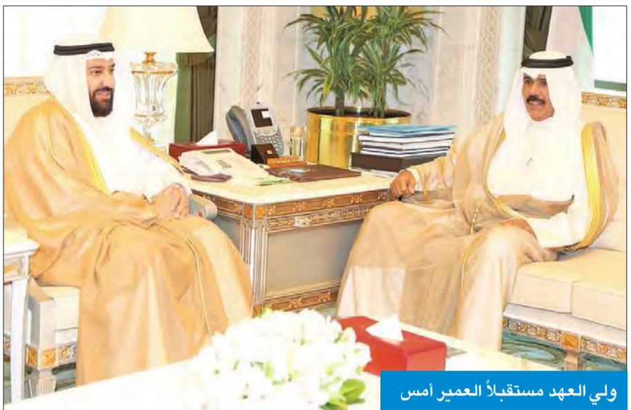
ولي العهد مستقبلاً العمير أمس

بين البلدين الصديقين والاستفادة من الخبرات الرياضية والشبابية في الكويت.