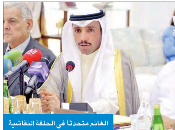
الغانم متحدثا في الحلقة النقاشية

أكد رئيس مجلس الأمة مرووق والغانم أن نهج عقد الحلقات النقاشية والتشاور الذي يتبعه المجلس ولجانته المختلفة قبل إقرار أي قانون يعد نهجا جديدا في المجلس يستهدف الاستفادة من أشراف كل شرائح المجتمع والمختصين في أي قانون.