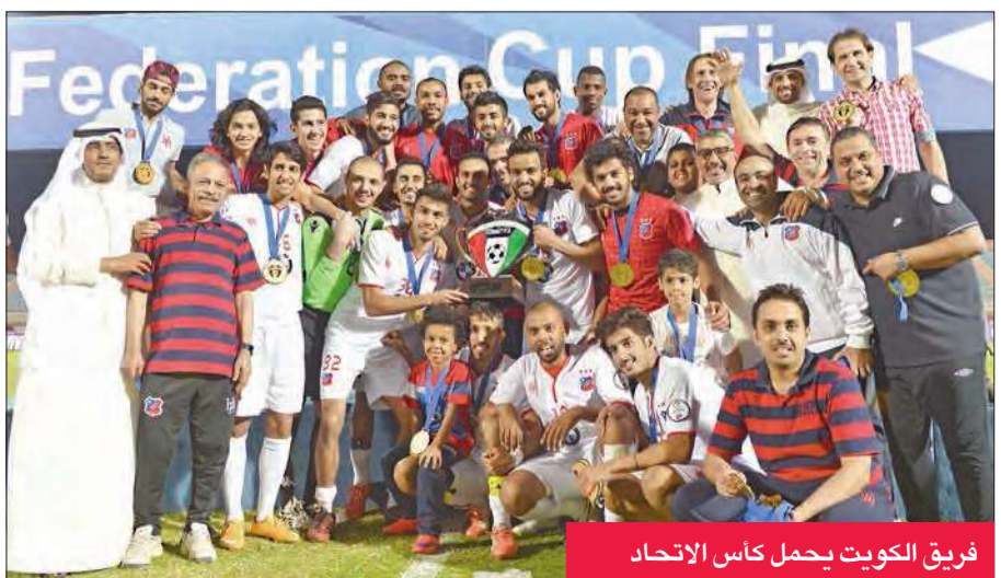
فريق الكويت يحمل كأس الاتحاد