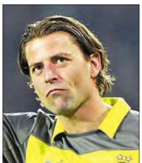
(د ب أ)

أعلن نادي بوروسيا دورتموند الألماني لكرة القدم أنه سيفقد جهود حارس مرماه رومان فايدنفييل في مواجهة المقررة أمام بايرن ميونخ مساء اليوم في الدور قبل النهائي من بطولة كأس ألمانيا، بسبب إصابة في الحوض. وذكر النادي في تغريدة بموقع شبكة التواصل الاجتماعي "تويتر": "رومان فايدنفييل يجب أن يحصل على راحة نحو أسبوعين بسبب إصابته بكدمة في الحوض". ولم يشارك فايدنفييل في المباراة التي فاز فيها الفريق على إينتراخت فرانكفورت 2- صفر مساء السبت الماضي بسبب الإصابة، وستتولى الأسترالي الدولي ميتش لانجبريك حراسة مرمى الفريق في المباراة أمام بايرن ميونخ.