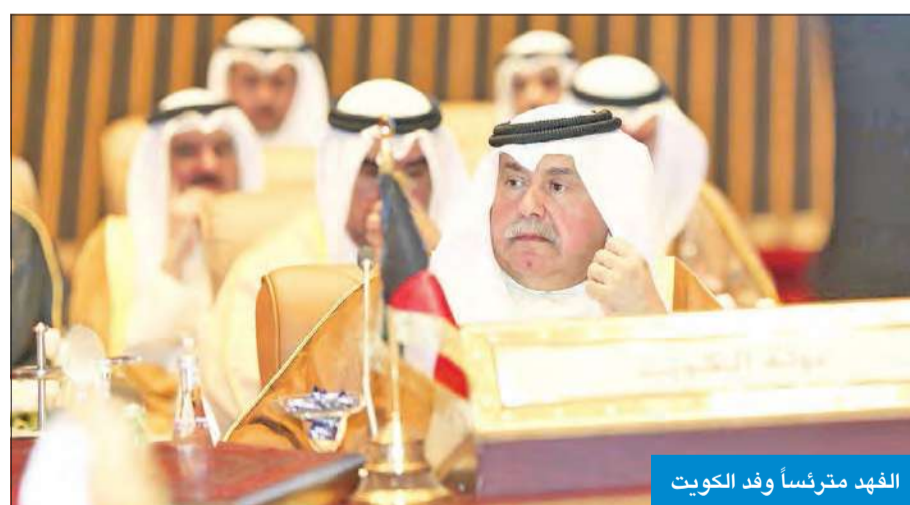
الفهد مترئساً وفد الكويت

وكان رئيس مجلس الوزراء وزير الداخلية بقطر الشفيقة الشيخ عبدالله بن خليفة آل ثاني التقى وكلاء داخلية دول مجلس التعاون، وتبادل معهم العديد من المواضيع والقضايا ذات الصلة بأمن دول ومواطني المجلس.