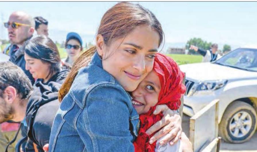
الممثلة اللبنانية الأصل سلمى حايك تحتضن طفلة سورية في مخيم للاجئين في البقاع أمس الأول

الراعي والحريري يبحثان «الرئاسة» في باريس وواشنطن