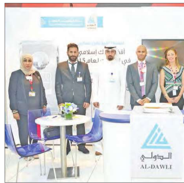
جناح البنك في المعرض

وقال غنم: «لقد أتاحت لنا مشاركتنا في المعرض الوقوف على طموحات وتطلعات الشباب، إضافة إلى دعم وتشجيع الشباب الواعد للعمل في القطاع