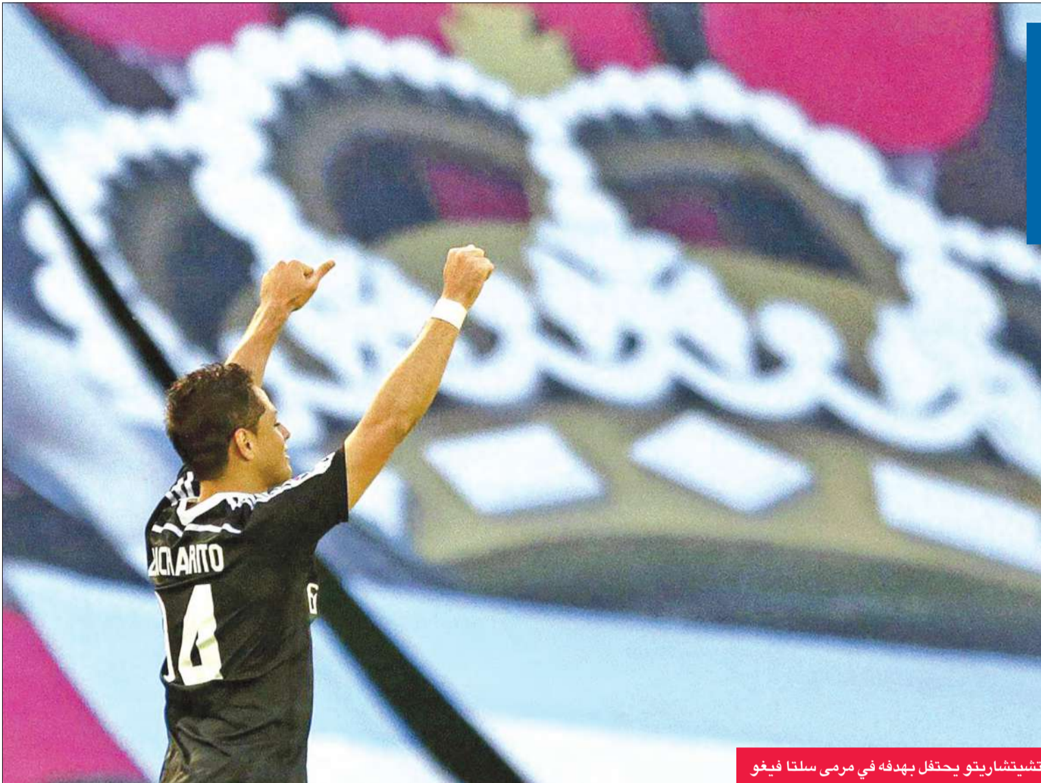
تشيتشاريتو يحتفل بهدفه في مرمى سلتا فيغو

وبدو أن الهدف الحاسم الذي سجله المكسيكي خافيير هرنانديز "تشيتشاريتو" الأربعاء الماضي في دوري أبطال أوروبا منحته الثقة التي حولته قيادة فريقه ريال مدريد إلى فوز مثير على مضيفه سلتا فيغو 2-4 أمس الأول في المرحلة الثالثة والثلاثين من الدوري الإسباني لكرة القدم. وكان "تشيتشاريتو" بطل الريال يوم الأربعاء بعد أن سجل هدف الفوز على الجار اللدود اتلتيكو مدريد (1- صفر) وحمل فريقه إلى مواصلة حملة الدفاع عن لقبه بطلا لدوري أبطال أوروبا بنأمله لنصف النهائي (تعادلا ذهابا صفر- صفر)، ثم تمكن أمس الأول من تسجيل ثنائية قاد بها فريقه للاقترب مجددا بفارق نقطتين عن غريمه الأزلي برشلونة المتصدر الذي تغلب السبت الماضي على جاره اسبانيول 2- صفر. وجاء الشوط الأول من اللقاء مثيرا للغاية وانتهى بتقدم ريال 2-3 بعد أن افتتح صاحب الأرض التسجيل منذ الدقيقة 9 عبر نوليتو التي وصلت إليه الكرة داخل المنطقة بتمريرة من فابيان اوريانا فتألق بدانيال كارفاخال قبل أن يسدد في شبك ايرك كاسياس.