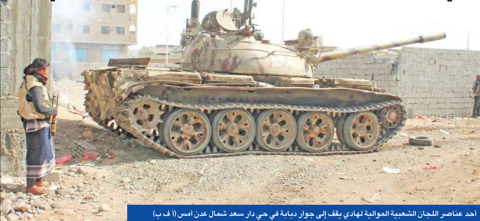
أحد عناصر اللجان الشعبية الموالية لهادي يقف إلى جوار دبابة في حي دار سعد شمال عدن أمس

اشترط وزير الخارجية اليمني رياض ياسين أن يتغير سلوك الميليشيات الحوثية، وتتحول إلى العمل السياسي، وتلقي السلاح من أجل إجراء مفاوضات سلام معها، مستبعداً أي دور للرئيس السابق علي عبدالله صالح ونجله أحمد وزعيم التمرد الحوثيي عبدالملك الحوثي في أي مفاوضات، بينما رحبت دول الخليج بتعيين المبعوث الأممي الجديد لليمن.