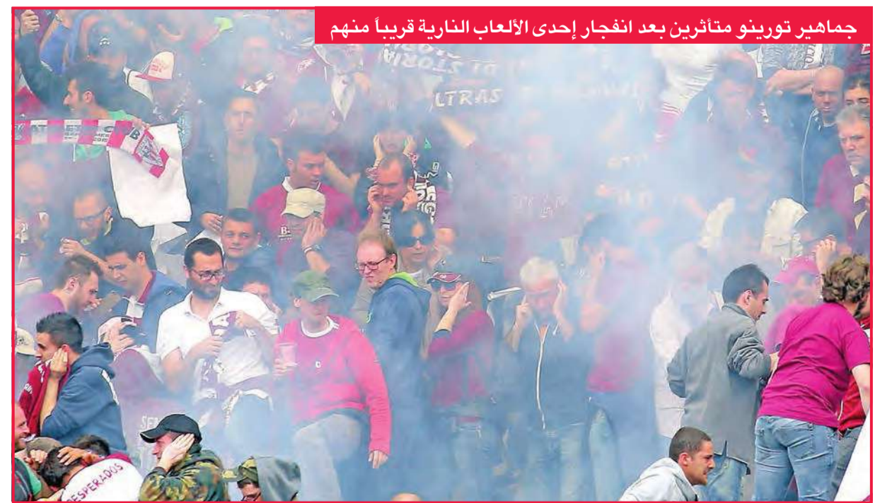
جماهير تورينو متأثرين بعد انفجار إحدى الألعاب النارية قريباً منهم

المحت صحيفة سيورث الكتلونية إلى أن فلورنتينو بيريز رئيس نادي ريال مدريد الإسباني قد تدخل في نتيجة قرعة دور نصف النهائي من مسابقة دوري أبطال أوروبا لكرة القدم، ونشرت الصحيفة الإسبانية الشهيرة رسماً ساخراً، أوضحت خلاله أن القرعة لم تجر بشفاافية وأن بيريز تدخل ليضع فريقه أمام يوفنتوس الإيطالي (أضعف الفرق الأربعة المتأهلة) حسب رأي الصحيفة ويظهر في الرسم الكرات الصغيرة التي استخدمت في القرعة ويظهر كل من برشلونة وبايرن ميونيخ معاً وفوقهما ريال مدريد ويجواره يد خفية تضع كرة عليها شعار اليوفي بشكل مختلف عن كرات القرعة وإلى جوار الكرات يظهر فلورنتينو بيريز وهو يضحك حتى نزول دموع الفرح من عينيه وهو يقول: لا تعليق.