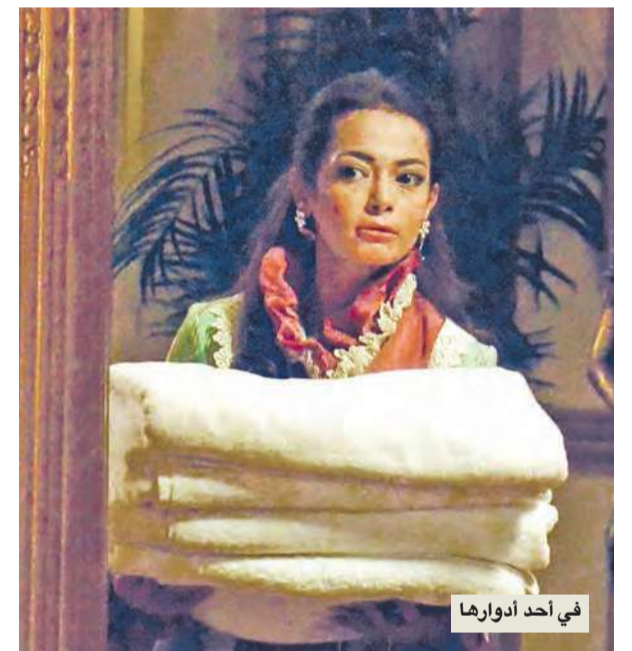
في أحد أدوارها