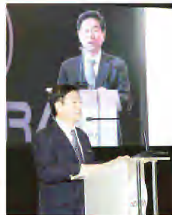
السفير الياباني توشييهيري سوجيهارا

أحدث تكنولوجيا الصناعة وخبرتها أكورا في تصميها لمركز الخدمة عن المؤلف، لتبكر