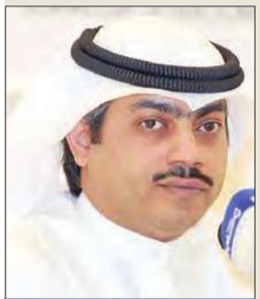
الأمين العام للتحالف الوطني بشار الصايغ

انتقد التحالف الوطني الديمقراطي بشدة تعسف وزارة الداخلية باستخدام صلاحياتها، والقفز على القوانين، في حالات استدعاء الناشطين السياسيين، والقبض عليهم مباشرة دون توجيه كتب استدعاء لهم، وأكد «التحالف» في بيان له أمس، ان «الداخلية» تحرف بتطبيق القانون ولاهداف سياسية في التعاطي مع المهتمين بالشأن السياسي من المواطنين، فإن كانوا من المعارضين للحكومة فلا تضع الوزارة أي اعتبار للقانون والإجراءات السلمية في ملاحقتهم، أما إن كانوا من المؤيدين للحكومة فيتم اتباع كل السبل القانونية في التعامل معهم، وبشكل سليم ومطلوب.