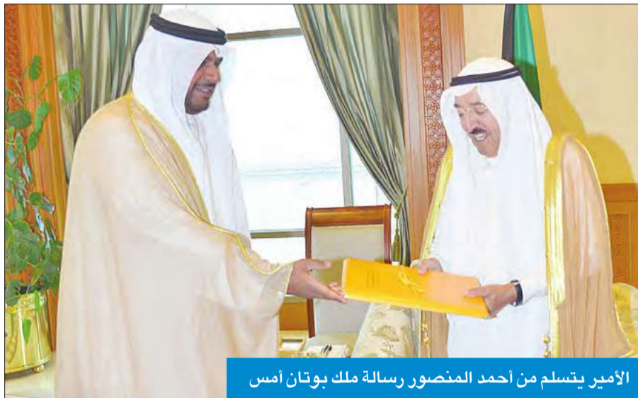
الأمير يتسلم من أحمد المنصور رسالة ملك بوتان أمس

استقبل سمو أمير البلاد الشيخ صباح الأحمد، بقصر السيف صباح أمس، سفير المملكة الأردنية الهاشمية لدى الكويت محمد الكايد، حيث سلم سموه رسالة خطية من ملك الأردن عبدالله الثاني، تضمنت دعوة سموه إلى حضور أعمال اجتماع المنتدى الاقتصادي العالمي حول الشرق الأوسط وشمال إفريقيا المقرر عقده في مايو المقبل.