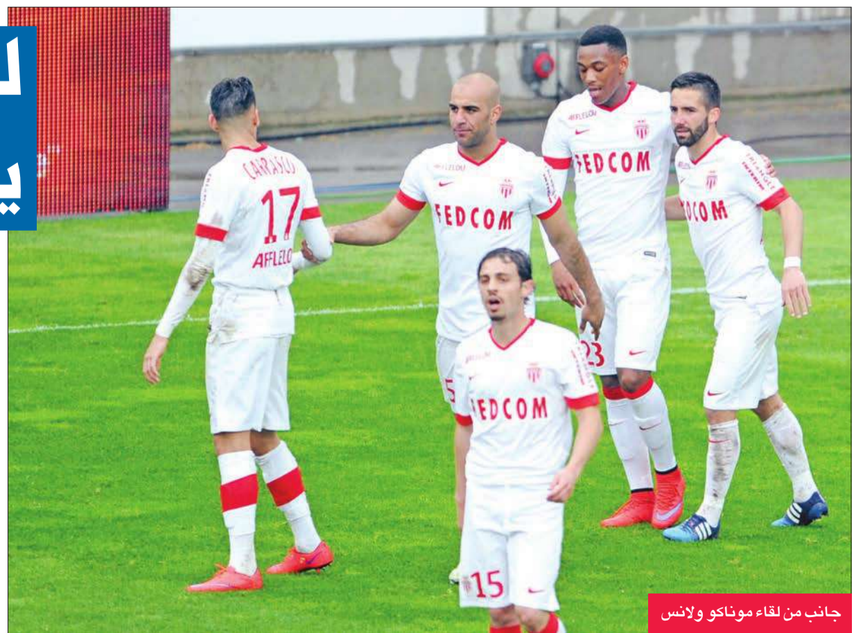
جانب من لقاء موناكو ولانس

استعاد ليون الصدارة، وفارق الأهداف، عن باريس سان جيرمان حامل اللقب، بعد فوزه على ضيفه المتواضع رينس 2-4، بينما عاد موناكو إلى سكة الانتصارات واحتفظ بالمركز الثالث المؤهل إلى دوري أبطال أوروبا الموسم المقبل، بفوزه الكبير على ضيفه لانس متذيل الترتيب 3-صفر، أمس الأول في المرحلة الرابعة والثلاثين من الدوري الفرنسي لكرة القدم. في المباراة الأولى، عاد ليون إلى سكة الفوز بعد تعثره في المرحلة السابقة أمام ضيفه سانت اتيان (2-2)، وتربع على الصدارة مجددا بفارق الأهداف أمام سان جيرمان، الذي اكتسح ليل 6-1 أمس السبت، علما بأن