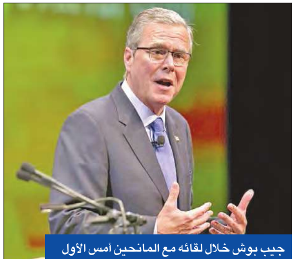
جيب بوش خلال لقائه مع المانحين أمس الأول

ويفوز أحد المرشحين إذا حصل على 50 في المئة زائد صوت واحد في الجولة الأولى. وواجه البشير، المطلوب لدى المحكمة الجنائية الدولية بتهمة ارتكاب جرائم حرب 13 منافساً في الانتخابات التي قاطعتها المعارضة، التي تعتبر أن الشروط غير متوافرة للانتخابات حرة وعادلة. ولم يحصل أقرب منافسي البشير الذي حل في