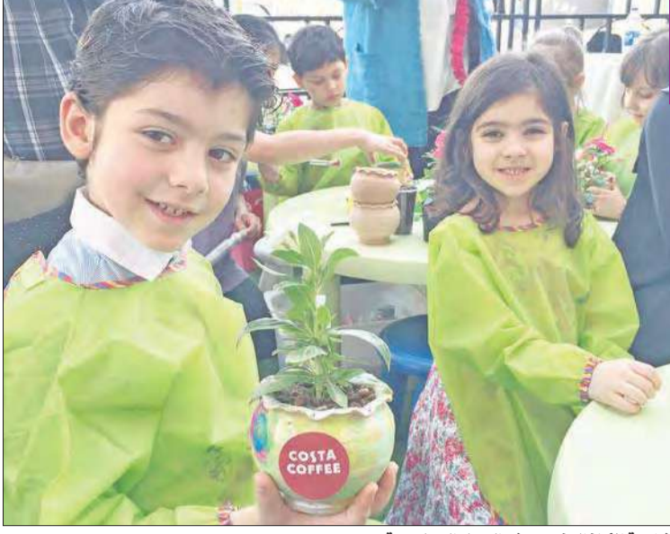
مشاركة الأطفال في ورش العمل التعليمية

احتفل «كوستا كوفي» في فرعه الجديد بالسلام مول بيوم الأرض، تماشيا مع الاحتفال العالمي الذي يوافق 22 أبريل من كل عام، لدعم وحماية البيئة. واستضاف فرع السلام مول نشاطا إرشاديا تحت شعار «كوستا كوفي للأعمال الخضراء» شارك فيه أكثر من 300 من الأطفال والكبار. وتماشيا مع التزام «كوستا كوفي» بالحفاظ على البيئة، كان التركيز في هذا الحدث على رفع الوعي البيئي بين الحضور، عن طريق عدة ورش عمل تعليمية استمرت 4 ساعات.