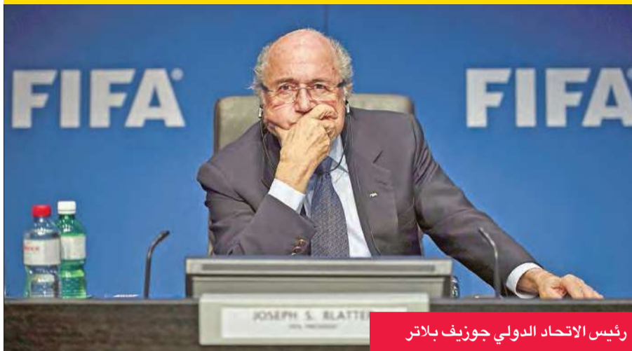
رئيس الاتحاد الدولي جوزيف بلاتر

اعلنت سابقا انها ستدعمه، ولذلك فان الاهتمام سيكون منصباً على معرفة اتجاه التصويت الآسيوي. وتكرر المشهد في الشهرين الأخيرين بين بلاتر ومنافسيه، الذين حضروا الجمعيات العمومية للاتحادات القارية الأخرى، بدءاً من أوروبا مروراً بأميركا الجنوبية ثم أوقيانيا وأفريقيا وأخيراً الكونكاكاف.