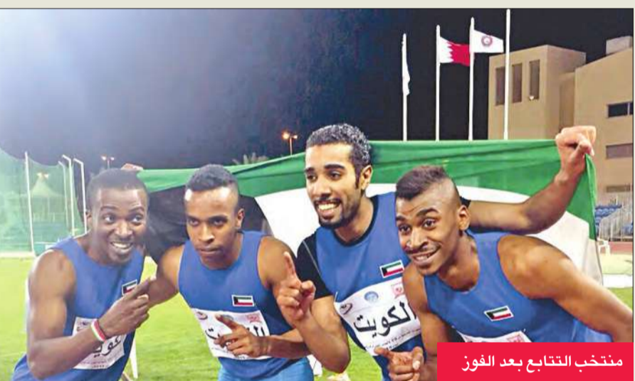
منتخب تتابع بعد الفوز

أضاف منتخب الكويت ميداليتين جديدتين إلى رصيده في ثالث أيام البطولة العربية الـ19 لألعاب القوى للرجال والسيدات التي تستضيفها مملكة البحرين.