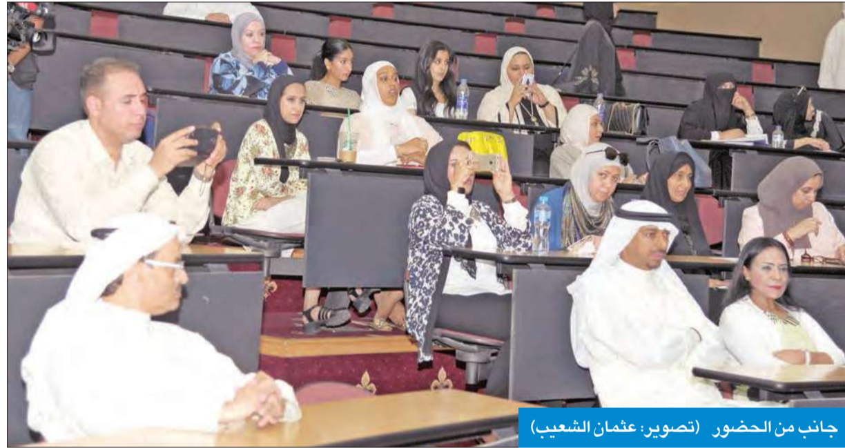
جانبا من الحضور

وبين العنبري أن التمييز بين الوظائف والزائدات غير المبررة والمبالغ فيها، والتي تصل أحياناً إلى «دبل الدبل» في القطاع النفطي عن القطاعات الأخرى يكبد الدولة أعباء مالية.