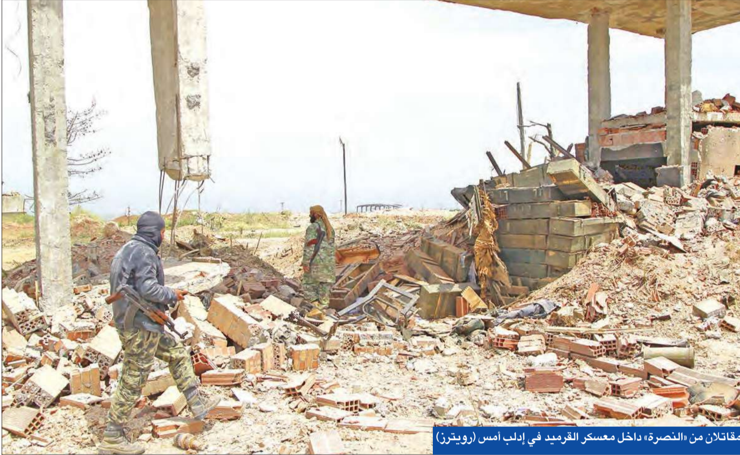
مقاتلان من «النصرة» داخل معسكر القرميد في إدلب أمس

● «الفتح» يحاصر معسكر المسطومة ● فصائل حلب تتوحد ● الشكوك تحيط بخطة أوباما لتدريب المعارضة