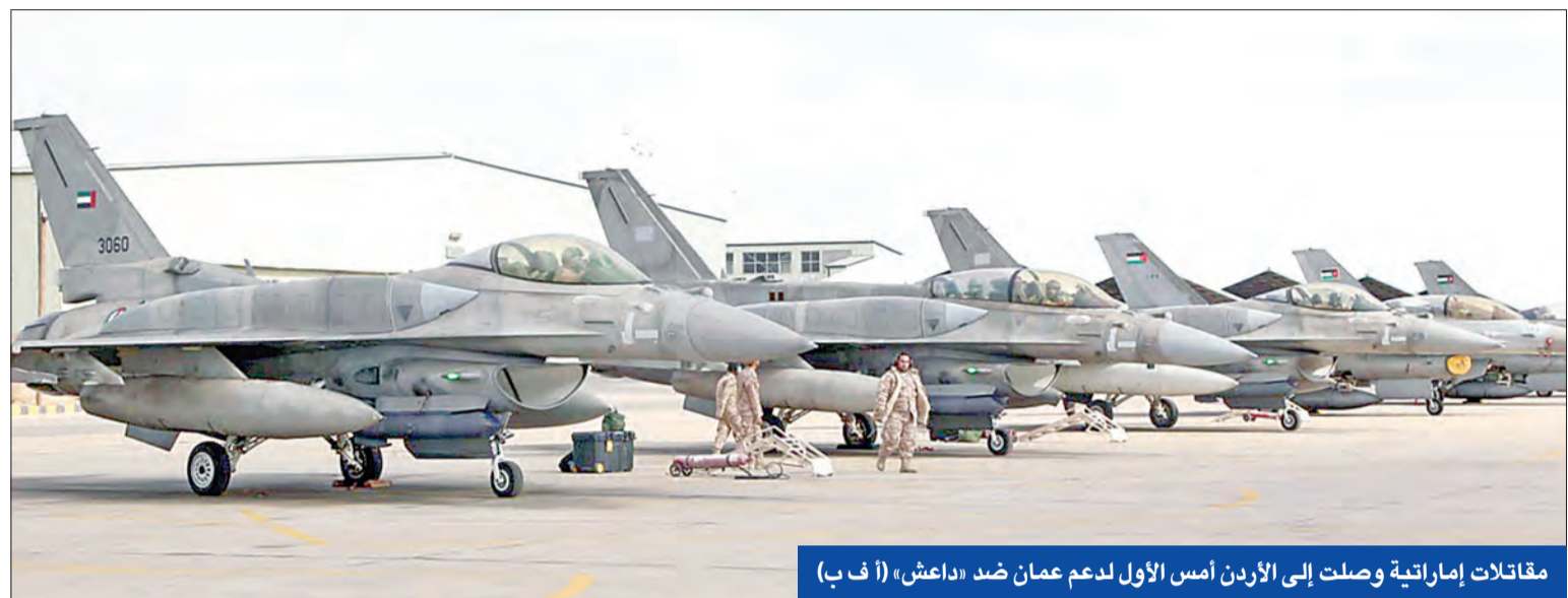
مقاتلات إماراتية وصلت إلى الأردن أمس الأول لدعم عمان ضد «داعش»

مقربون من المالكي ينتقدون طائفية العبيدي وزير الدفاع يهدد بمقاضاتهم