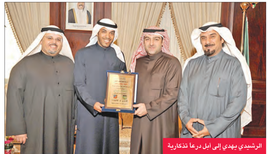
الرشيد يهدي إلى أبل درعاً تذكارية

من جهته، وجه الرشيد شكره إلى أبل على حفاوة الاستقبال ودعمه في مباراة اعتزاله، مشيراً إلى أن ذلك أمر ليس بغريب على عائلة مشهود لها بدعم الشباب الرياضي في جميع المجالات.