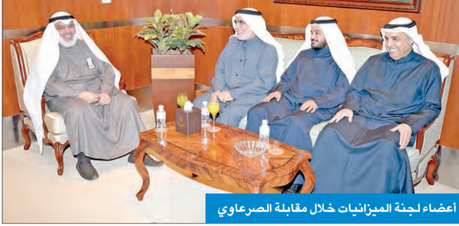
أعضاء لجنة الميزانيات خلال مقابلة الصرعاوي

أعضاء اللجنة زاروا الديوان لحضور عرض مرئي حول «آلية تفعيل تقارير المحاسبة»