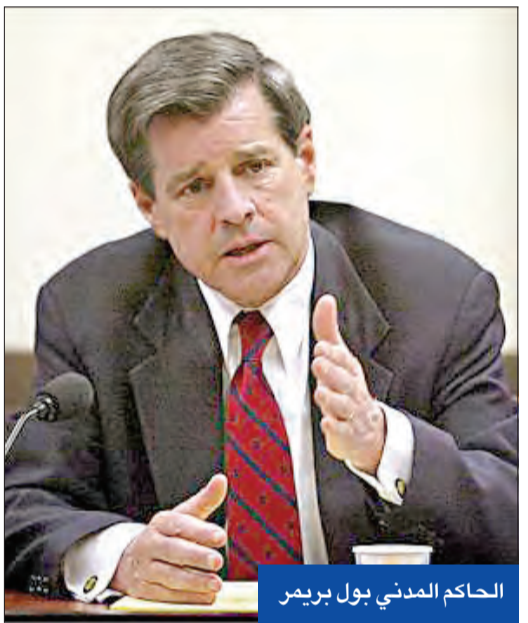
الحاكم المدني بول بريمر

بالنقد مضمونه علمياً، وسيفي مصدر خلافات يمكن تجاهلها عندما يتمتع المسؤول التنفيذي بصلاحيات التفويض الشعبي، فالشعب هو مصدر السلطات. ● المحاصصة السياسية التوافقية تبدو معقولة لمرحلة انتقالية محددة، إلا أنها ليست ضمن نصوص الدستور الذي لم يشر إلى الترتيبات الطائفية في أن يكون رئيس البرلمان عربياً سنياً ورئيس الجمهورية كردياً ورئيس الوزراء شيعياً. وتجسدت المتغلب على هذه المحاصصة قرارات قوية لا يزال وقت اتخاذها مبكراً، فرغم أن الشعب مشحون بما يكفي لرفض السياقات الحالية، فإن الرأي العام لا يزال بحاجة إلى تكوين موقف بصر السياسيون إلى الخوض فيه. وأخر الثمانينات من القرن الماضي دخل الجهاز الحزبي بإذنٍ مشدد، واستدعي أصحاب الدرجات الحزبية من مستوى متوسط إلى المستويات الأعلى إلى مقرات الشعب الحزبية ليلاً، ولا أحد يعلم السبب، وبعد ليل طويل قضاه هؤلاء وزعت عليهم كراسي بيضاء اسمها (الدستور العراقي المؤقت)، وبعد ربع قرن لا بد من القول، لا ذاك الظلم ولا هذا التشردم!