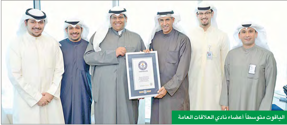
الياقوت متوسطاً أعضاء نادي العلاقات العامة

موظفي البنك، حيث تم جمع أكثر من 3 أطنان من الملابس التي تم التبرع بها باسم موظفي بنك بويان، إلى جانب ما قام به البنك من خلال وسائل التواصل الاجتماعي الخاصة به بالترويج لهذه الحملة ودعم القائمين عليها من الشباب الكويتي، وتحفيز عملاء البنك وغيرهم للتوجه إلى مقر الحملة والتبرع بما تجود به نفوسهم. وتقدم بالشكر العميق إلى شباب نادي العلاقات العامة في جامعة GUST على الجهود التي بذلها في سبيل تخليص الحملة، ورفع اسم الكويت عالياً في المحافل الدولية، مؤكداً أنهم يمثلون نموذجاً رائعاً للشباب الكويتي المحب لبلده.