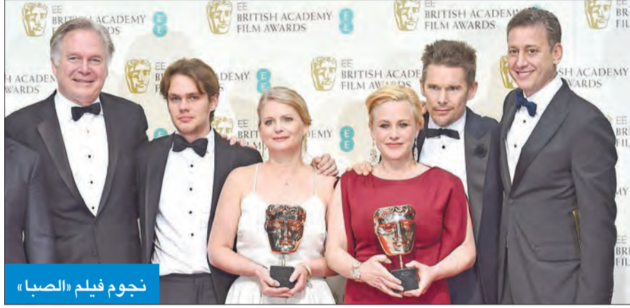
نجوم فيلم «الصبا»

حصل فيلم «الصبا» على ثلاث من جوائز الجمعية البريطانية لفنون السينما والتلفزيون (بافتا) أمس الأول، من بينها أفضل فيلم وأفضل مخرج، في حين حصل فيلم «ذا غراند بودابست هوتل» على خمس جوائز لم تكن من بينها أي من الجوائز الكبرى. وحصد فيلم «ذا ثيوري أوف إيفريثينج» ثلاث جوائز، من بينها أفضل ممثل. وفاز ريتشارد لينكلينر بجائزة أفضل مخرج عن فيلم «الصبا» الذي صورته على مدى 12 عاماً مستعيناً بنفس طاقم العمل. وقالت باتريشيا أركيت التي فازت بجائزة أفضل ممثلة مساعدة عن دورها في الفيلم كأم عزباء إن لينكلينر "حول قصة عادية إلى غير عادية". ونال إيدي ريدمان جائزة أفضل ممثل عن دوره في «ذا ثيوري أوف إيفريثينج». وفاز الفيلم أيضاً (رويترز)