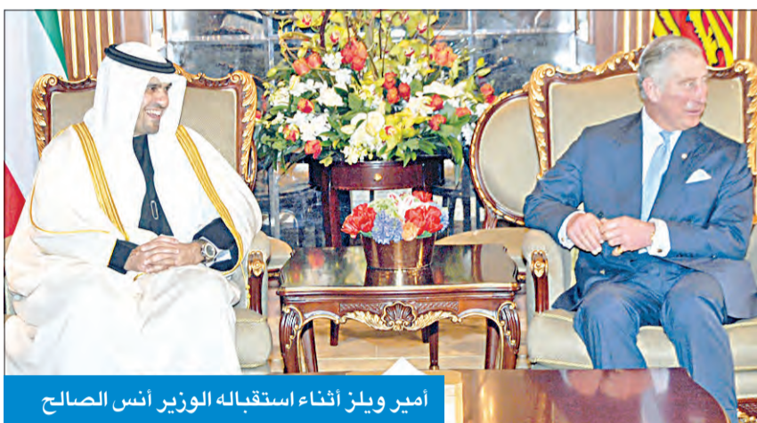
أمير ويلز أثناء استقباله الوزير أنس الصالح

وتشكلت بعثة شرف لمرافقة الضيف الكريم وصل الأمير تشارلز ولي عهد المملكة المتحدة وأمير ويلز إلى البلاد ظهر أمس، في زيارة رسمية للبلاد تستغرق يومين. وكان في مقدمة مستقبليه على أرض المطار سمو ولي العهد الشيخ نواف الأحمد، ورئيس مجلس الأمة مرزوق الغانم، وسمو رئيس مجلس الوزراء الشيخ جابر المبارك، والنائب الأول لرئيس مجلس الوزراء وزير الخارجية الشيخ صباح الخالد، ونائب رئيس مجلس الوزراء وزير الدفاع الشيخ خالد الجراح، ونائب رئيس مجلس الوزراء وزير التجارة والصناعة د. عبد المحسن المدعج، والمستشار بديوان سمو رئيس مجلس الوزراء رئيس بعثة الشرف الشيخ د. سالم الجابر، ووكيل وزارة الخارجية خالد الجارالله.