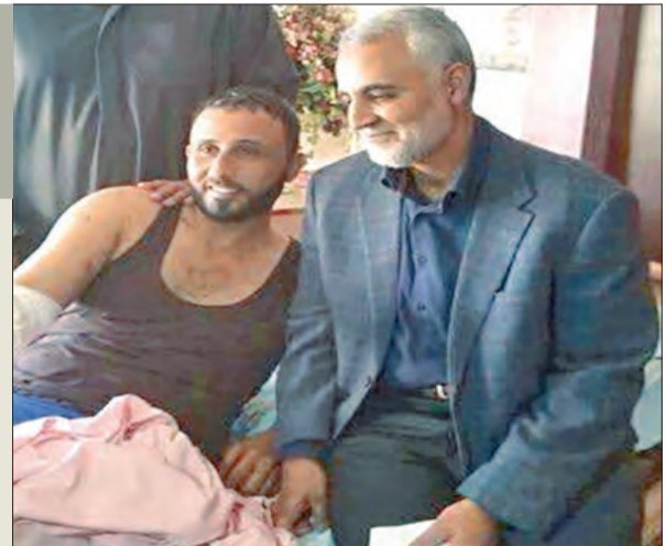
زار قائد «فيلق القدس» في الحرس الثوري الإيراني اللواء قاسم سليماني، جرحى الميليشيات الشيعية التي تقاوت إلى جانب الحكومة العراقية خلال وجودهم للعلاج بمستشفيات طهران.

وكان نواب مقربون من رئيس الحكومة السابق نوري المالكي اتهموا العبيدي بأنه طائفي وبأنه يفرغ وزارة الدفاع من الشيعية علماً أن العبيدي منهم من قبل بعض السنة بأنهم متعاون إلى أقصى الحدود مع الميليشيات الشيعية.