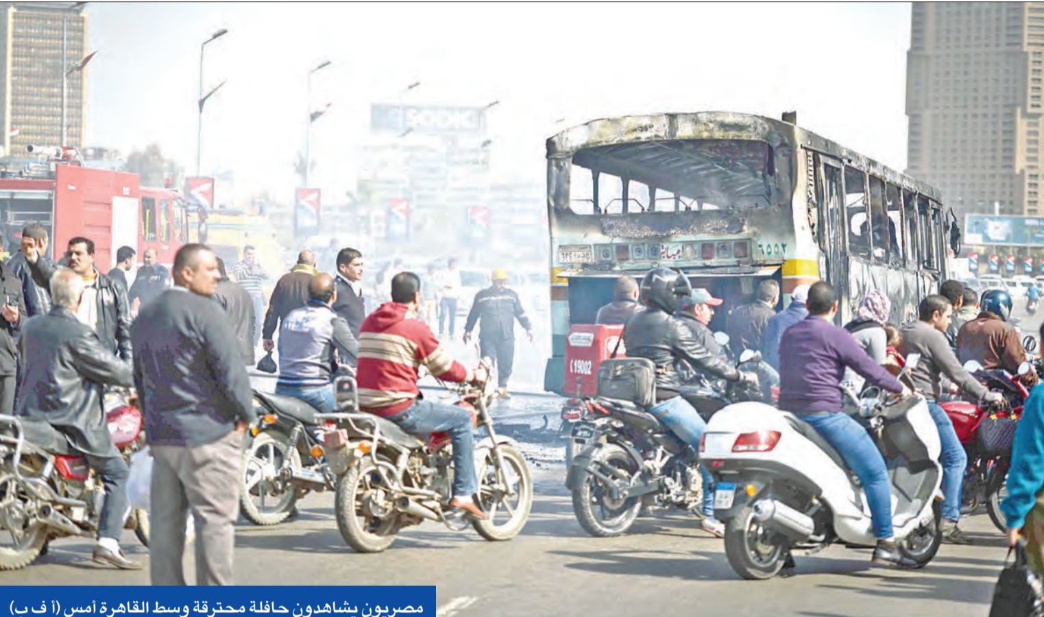
مصريون يشاهدون حافلة محترقة وسط القاهرة أمس