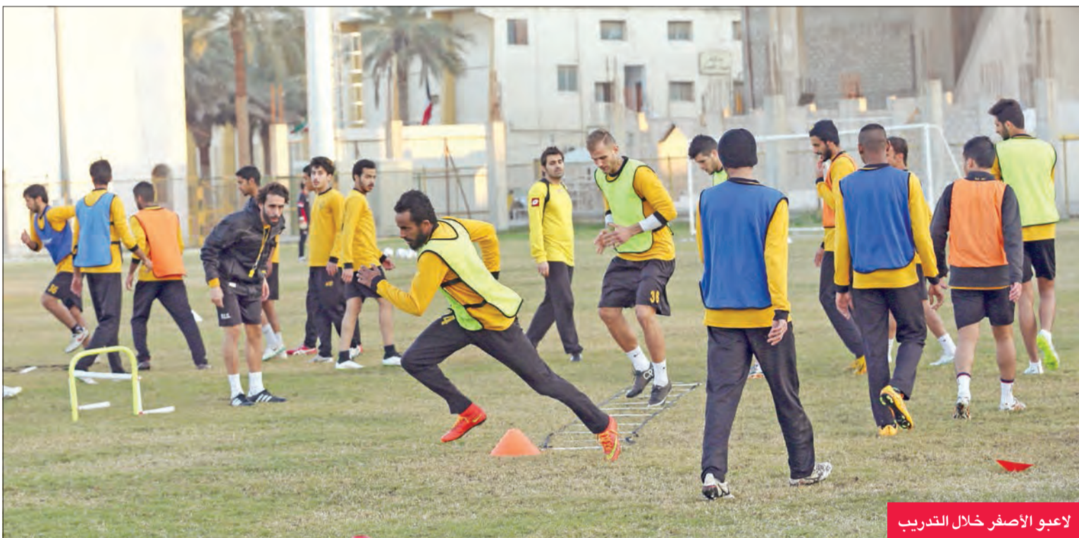
لاعب الأصفى خلال التدريب