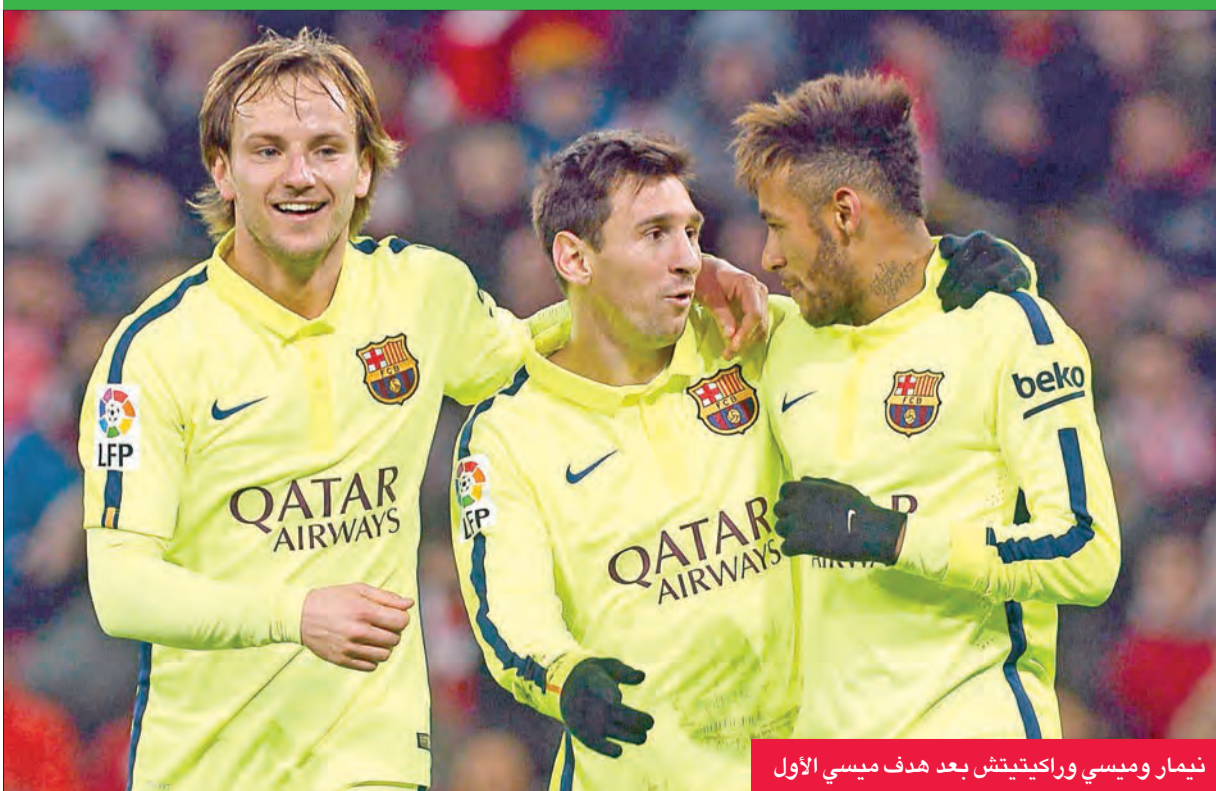
نيمار وميسي وراكيتيتش بعد هدف ميسي الأول

المركز الثاني خلف مهاجم ريال مدريد البرتغالي كريستيانو رونالدو (28 هدفا). ولم يتأخر الهدف الرابع، بعد ان عكس الكرواتي ايفان ركنيتش إلى ميسي ومنه إلى نيمار اليعبد عن الرقابة في الجهة اليسرى تابعها ارضية زاحفة في اسفل الزاوية اليسرى (64).