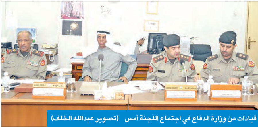
قيادات من وزارة الدفاع في اجتماع اللجنة أمس

بالمبعوثين في مهمة خاصة، وكيفية استدعائهم للاحتياط، حيث تم التوصل إلى صيغة توافقية لضمان حضورهم لإداء الخدمة الاحتياطية. وأضاف «لم يتغير أي شيء في مضمون القانون، بل هو ما تحدثنا عنه في بداية الأمر، وهو أن يبدأ تطبيق القانون على من بلغ الثامنة عشر عاماً، وبإمكان المكلف بالتجنيد وتاجله إلى سن الـ 35 عاماً، وأن إجمالي مدة التجنيد عشر سنوات، واحدة للخدمة وتسع للاحتياط».