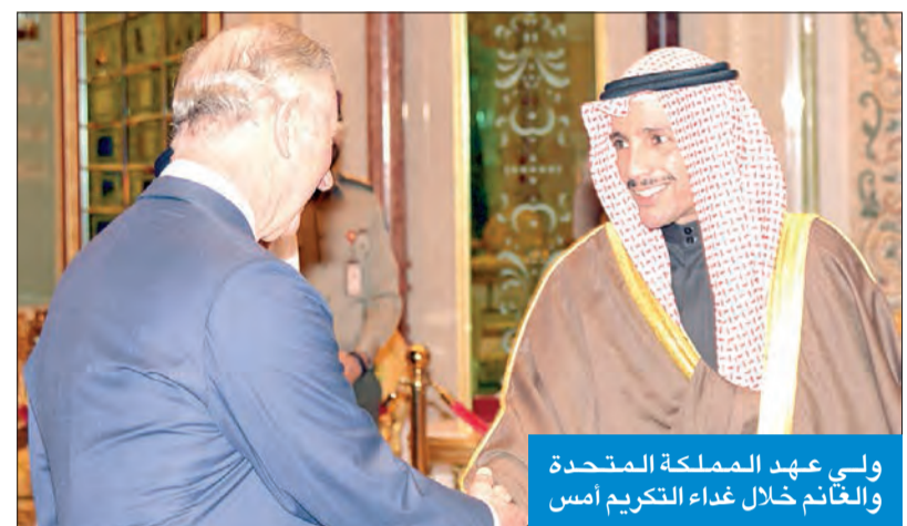
ولي عهد المملكة المتحدة والغانم خلال غداء التكريم أمس