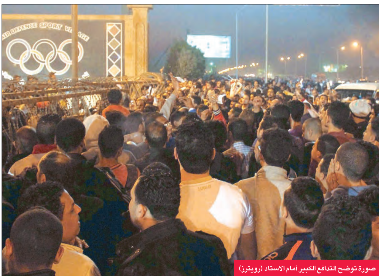
صورة توضح التذاعف الكبير أمام الاستاد

قررت الحكومة المصرية تعليق دوري كرة القدم لأجل غير مسمى بعد مقتل 19 من المشجعين الشباب لنادي الزمالك، في تدافع بدأ اثر اطلاق الشرطة الغاز المسيل للدموع لتفريق مشجعين خارج استاد الدفاع الجوي في القاهرة، في اول حادثة بهذا الحجم منذ مأساة استاد بورسعيد.