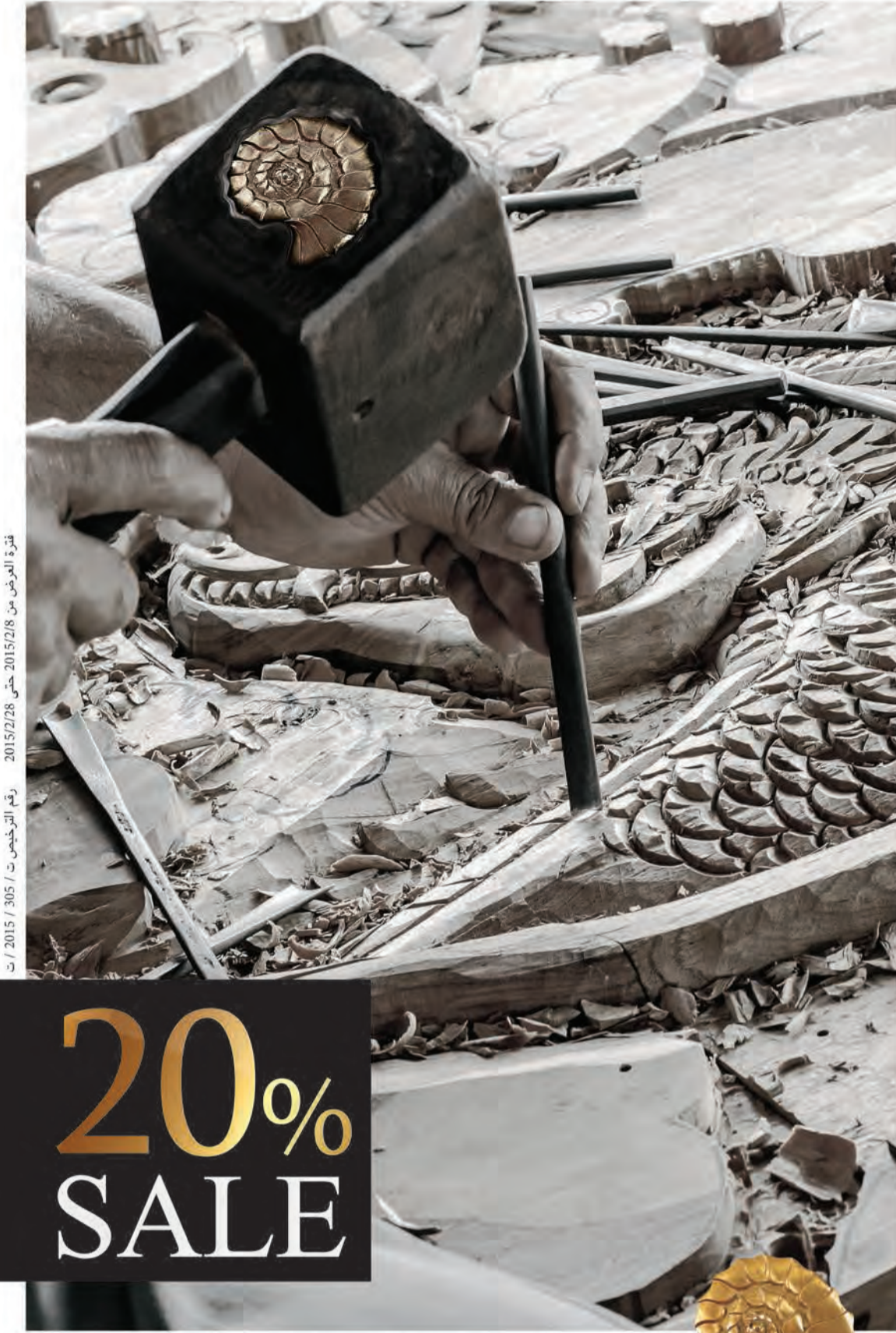
فترة العرض من 2015/2/28 حتى 2015/3/5 رقم الترخيص ت / 305 / 2015 د

مخلة بالتنافسية أو بالاضرار بالمستهلك، وبهذا تكون تعديلات اللجنة المالية قد أدت إلى مخالفة دولة الكويت لقانون منظمة التجارة الدولية WTO. واستنكر «التجمع» إعادة طرح بعض النواب قانون المديونيات الصعبة 1993/41 الذي صدر بعد تحرير الكويت بتعديلات جديدة تتيح للمدين إعلان إفلاسهم شروطاً مبسطة جديدة للدفع، وتجعلهم في وضع أفضل ممن سدد والتزم بالقانون عند صدوره، بل ستمنح تلك التعديلات المفلسين من استرجاع الأصول التي أصبحت الآن ملكاً للدولة، وهذا أكبر استغلال للتشريع لخدمة مصالح اشخاص معينين ونهب المال العام.