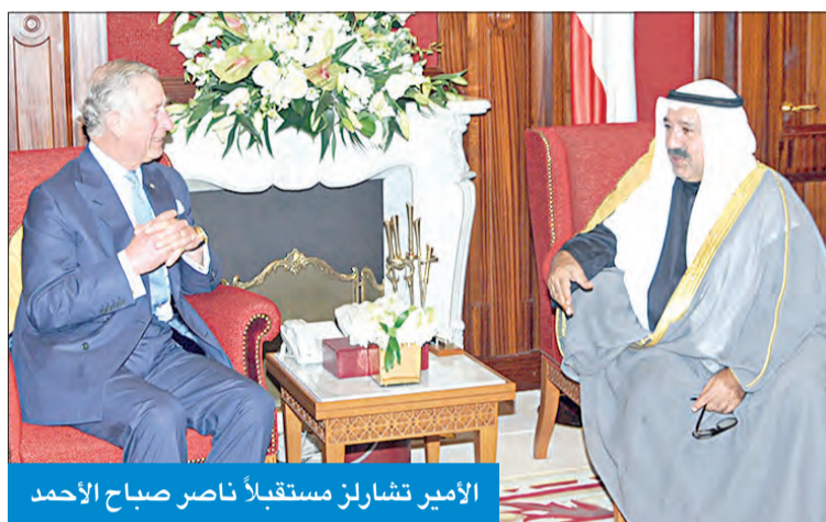
الأمير تشارلز مستقبلاً ناصر صباح الأحمد