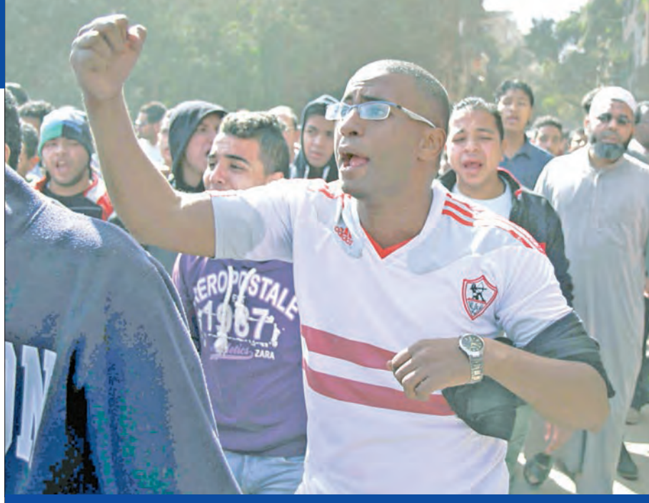
أقرب واصدقاء أحد ضحايا المجزرة أثناء تشييع جثمانه أمس في القاهرة

القاهرة - خالد عبده بنظرات زائغة، وقلوب حزينة، شيعت جماهير نادي الزمالك جثامين 22 من زملائهم، أمس، بعدما قتلوا في أحداث عنف قبيل مباراة لكرة القدم، أمس الأول. «الجريدة» شهدت لحظة اندلاع المواجهات بين قوات الأمن المصرية وعناصر روابط القراس «ايت نايتس»، أمام استاد «الدفاع الجوي» شرق القاهرة، وتبعته الضحايا إلى «مشرفة زينهم»، حتى تم تشييع الجثامين إلى مثواها الأخير. كانت حشود من الشباب تتراوح أعمارهم بين 15 و18 عاماً، تقف منذ الثالثة عصر يوم المذبحة، قرب الاستاد، لمتابعة مباراة فريقهم المفضل في مواجهة يفترض أنها كانت ستعتم صدارة مسابقة الدوري الممتاز لكرة القدم، وحين وصلت الجماهير اصطدمت بترتيبات أمنية عكزت المشهد الرياضي قرب الاستاد.