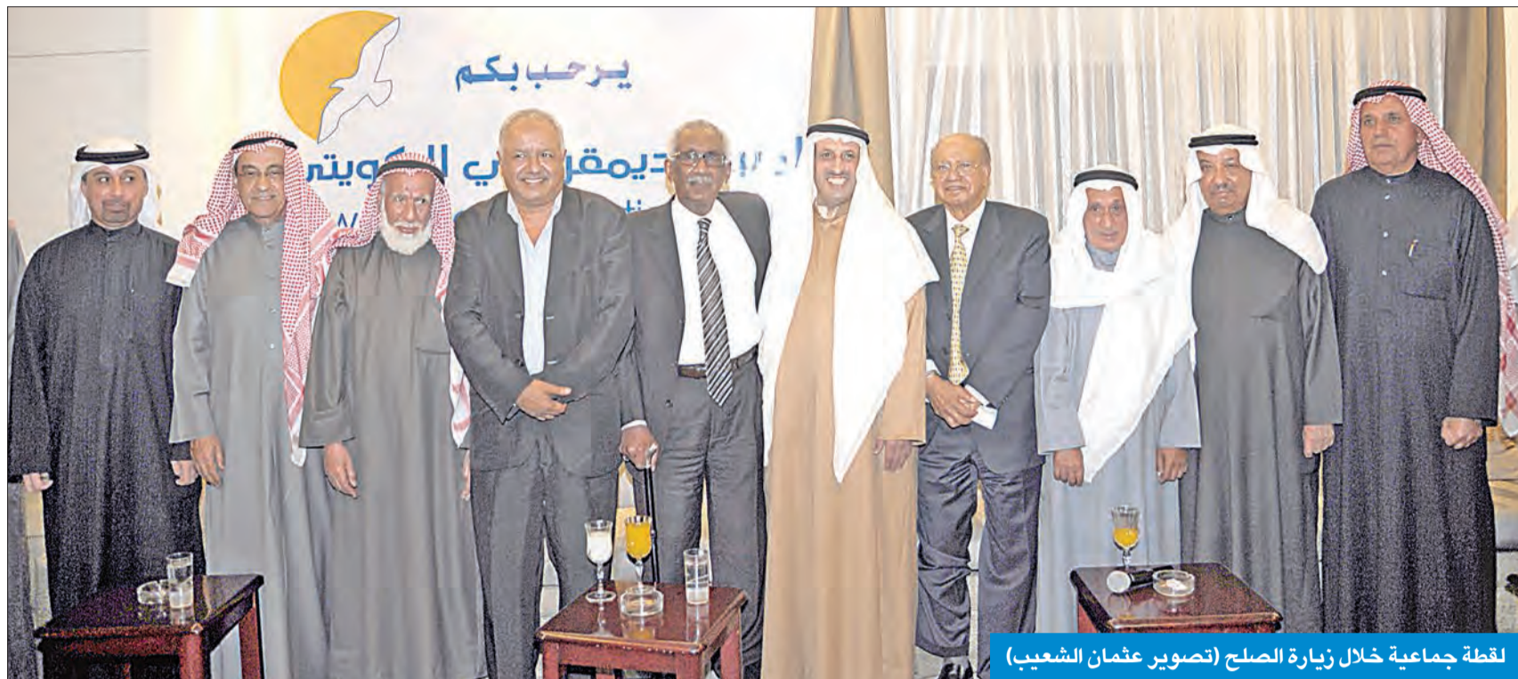
لقطة جماعية خلال زيارة الصلح