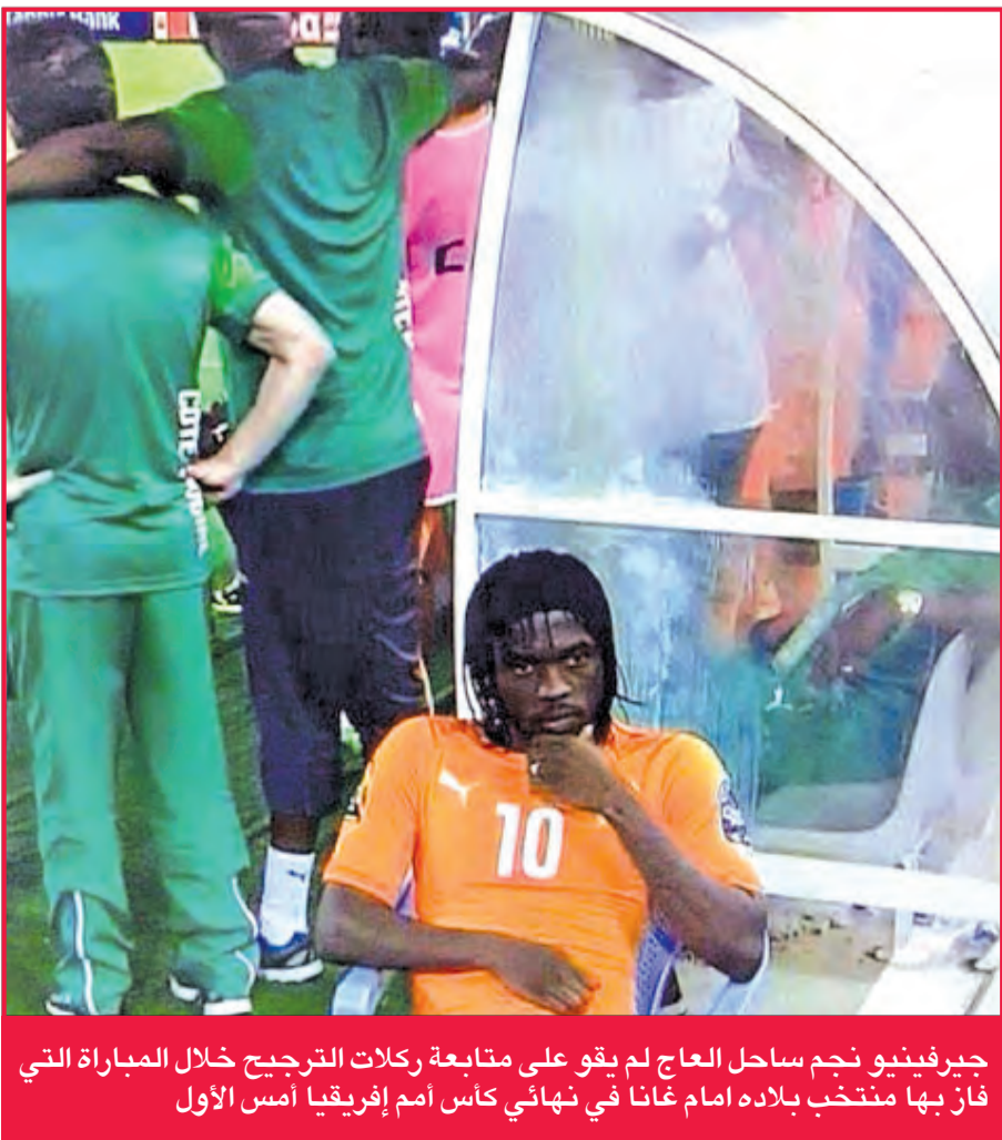
جيرفينيو نجم ساحل العاج لم يقو على متابعة ركلات الترجيح خلال المباراة التي فاز بها منتخب بلاده أمام غانا في نهائي كأس أمم إفريقيا أمس الأول