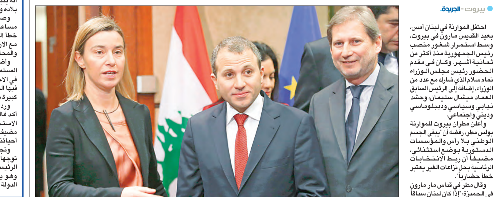
وزير الخارجية والمغتربين جبران باسيل مع ممثلة السياسة الخارجية والأمن في الاتحاد الأوروبي فريدريكا موغريني ومفوض التوسع وسياسة الجوار يوهانس هان أمس في بروكسل

احتفل الموارنة في لبنان أمس، بعيد القديس مارون في بيروت، وسط استمرار شغور منصب رئيس الجمهورية منذ أكثر من ثمانية أشهر. وكان في مقدم الحضور رئيس مجلس الوزراء تمام سلام الذي شارك مع عدد من الوزراء، إضافة إلى الرئيس السابق العماد ميشال سليمان، وحشد نيابي وسياسي وديبلوماسي وديني واجتماعي. وأعلن مطران بيروت للموارنة بولس مطر، رفضه أن يبقى الجسم الوطني بلا رأس والمؤسسات الدستورية بوضع استثنائي، مضيفا أن ربط الانتخابات الرئاسية بحل نزاعات خطأ حضارياً. وقال مطر في قداس مار مارون في الجبيرة: "إذا كان لبنان سباقاً لصنع حضارة بين الوحدة والتنوع، كيف يمكن أن يربط مصيره بمصير غيره في الشرق الأوسط لأي سبب وسبب؟ كيف يوضع في خلاجة المصالح إلى أن تهدأ العواصف في الدول الأخرى؟ اليس الأحرى أن يشجع لبنان على إقامة المجتمعات الديمقراطية المتصالحه فيه، لذلك فإن ربط الانتخابات الرئاسية بحل نزاعات الغير إنما هو خطأ حضاري، وقال ومقاطعة، فليس في نفع للمنطقة والعالم يربط مصير لبنان بغيره بل العكس هو الصحيح، نحن نخشى أخطار الحروب، لأنه ينجم عنها تقويض الحضارة العالمية".