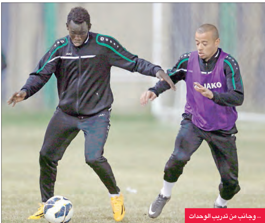
... وجانب من تدريب الوحدات