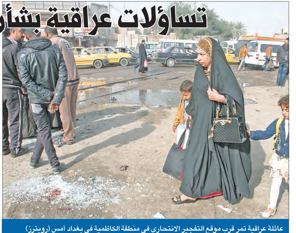
عائلة عراقية تمر قرب موقع التفجير الانتحاري في منطقة الكاظمية في بغداد أمس