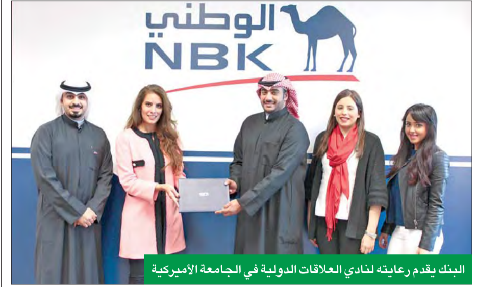
البنك يقدم رعايته لنادي العلاقات الدولية في الجامعة الأميركية

مع توجهه الراسخ للنهوض بمسؤولياته الاجتماعية ودعم مختلف النشاطات التعليمية، إيماناً منه بضرورة المساهمة في تفعيل وتطوير أداء مختلف المؤسسات التعليمية والأكاديمية في الكويت بموازاة الاهتمام بالطاقات الشابة وتحفيزها على تطوير مهاراتها وكفاءتها. وتأتي رعاية البنك الوطني لنادي العلاقات الدولية في الجامعة الأميركية انسجاماً