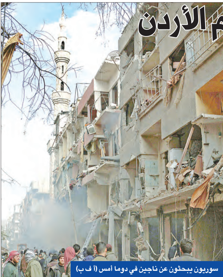
سوريون يبحثون عن ناجين في دوما أمس