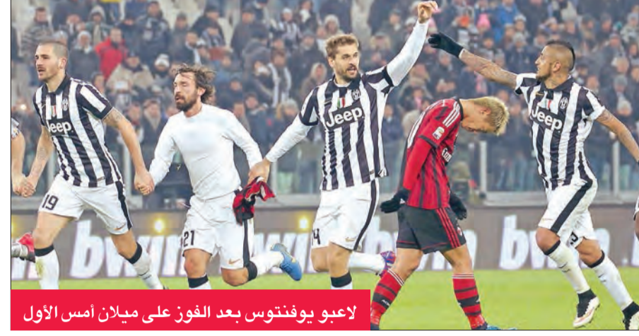
لاعبو يوفنتوس بعد الفوز على ميلان أمس الأول

بغير الحقيقة، مطالبا بأن تكون القنوات التي لها حق بث مباريات الدوري مستقلة وغير مملوكة لأي نا، وطالب بسن قوانين جديدة من الموسم الرياضي القادم لضمان ذلك. ثم أصدر النادي بيانا، في موقعه الرسمي على الإنترنت لتوضيح موقفه، جاء فيه: "ميلان لا يقصد إثارة الجدل، ولكن يسعى إلى تفسير الأحداث وتبيان موقفه". ونشر ميلان، على حسابه الرسمي في موقع "تويتر" صورة تظهر اللاعب تيفيزي في وضع تسلل واضح، معتبرا هذه الصورة دليلا على صق موقفه. ومن جانبها، ردت شبكة قنوات سكاي على ادعاء ميلان بتلاعبها بزاوية الكاميرا، مذكرة النادي بالقواعد التي تنظم وتحكم إنتاج