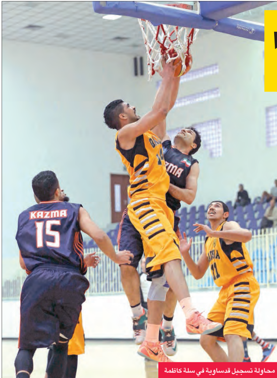
محاولة تسجيل قديساوية في سلة كاظمة