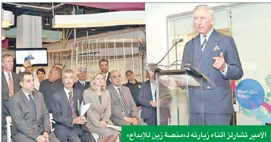
الأمير تشارلز أثناء زيارته لمنصة زين للإبداع

الأمير تشارلز يزور «منصة زين للإبداع» لدعم الشباب في الأردن. في بيان صحفي أمس، أعلن استراتيجيتها التي تنتهجها للمسؤولية الاجتماعية والاستدامة هي الدافع الأول لشراكتها الاجتماعية مع «سوق قوت»، ما يصب في رصيده الشركة الزاخر بالمساهمات الاجتماعية تجاه الشباب والمشاريع الصغيرة، من خلال تشجيع الطاقات والموهب المحلية الشبابية التي تظهر طموحات جادة في المشاركة بفاعلية في تنمية الاقتصاد الوطني، من خلال المشاريع والأفكار التي يترجمها الشباب إلى أرض الواقع.