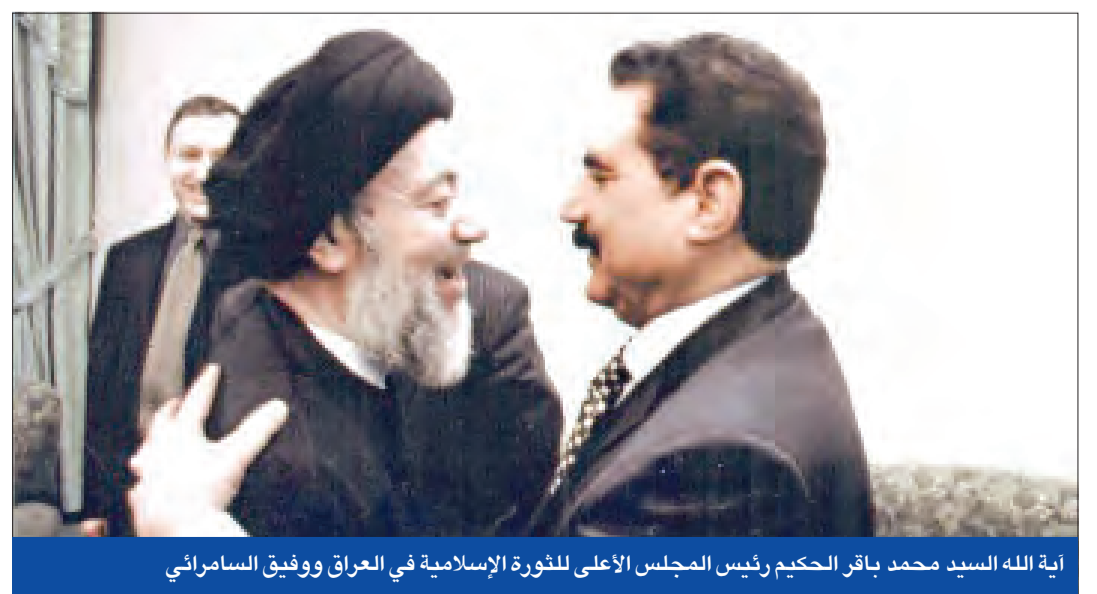
آية الله السيد محمد باقر الحكيم رئيس المجلس الأعلى للثورة الإسلامية في العراق وفوق السامرائي