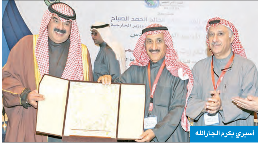
أسيري يكرم الجارالله

هناك تحالف دولي، وهو تحالف فاعل جداً استطاع أن يحقق الكثير من النتائج». وقال الجارالله: «إننا على ثقة بأن هذا التحالف واستمرار دوره سيحقق من خلاله الأمن والاستقرار للمنطقة والعالم بأسره». وقال الجارالله في كلمته، إن «جمعكم الكريم يلتئم اليوم، وفي بادرة تعكس ادراكاً ناضجاً لأهمية مناقشة الأمن الإقليمي، الذي بات مهدداً من ناحية تحديات وظروف بالغة الدقة»، مضيفاً أن خلق نظام أمن يتطلب إدراكاً متطابقاً لرؤية المخاطر والتحديات بين الدول والمرونة السياسية للتعامل مع المتغيرات، وتعزيز العلاقات بين الدول في الإقليم، والسعي