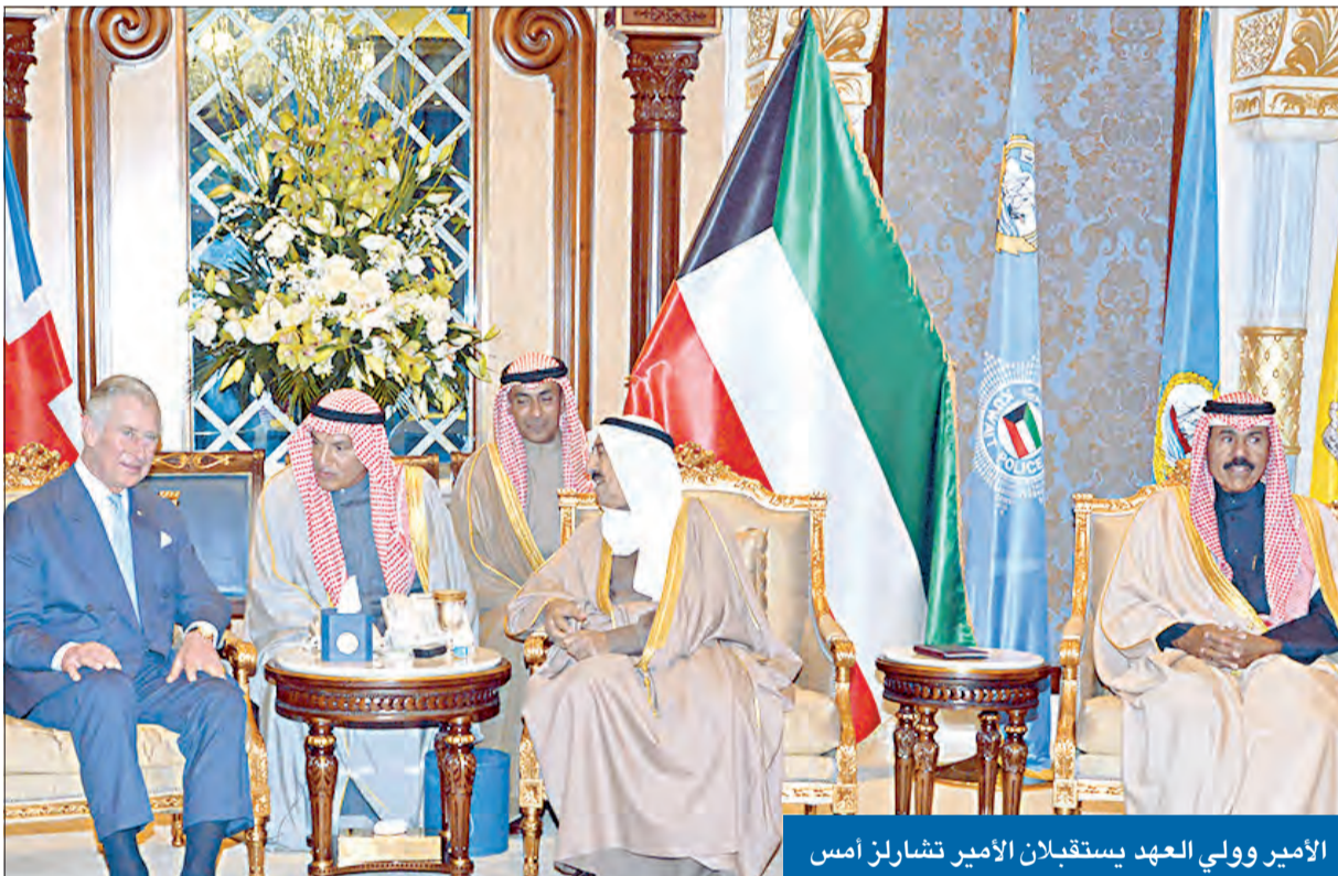
الأمير وولي العهد يستقبلان الأمير تشارلز أمس

● سموه تلقى اتصالاً من السيسي وبحث مع تشارلز تعزيز التعاون بين الكويت والمملكة المتحدة ● الرئيس المصري: لصاحب السمو العافية وللكويت وشعبها كل الرقي والازدهار