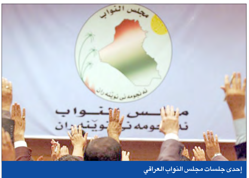
إحدى جلسات مجلس النواب العراقي