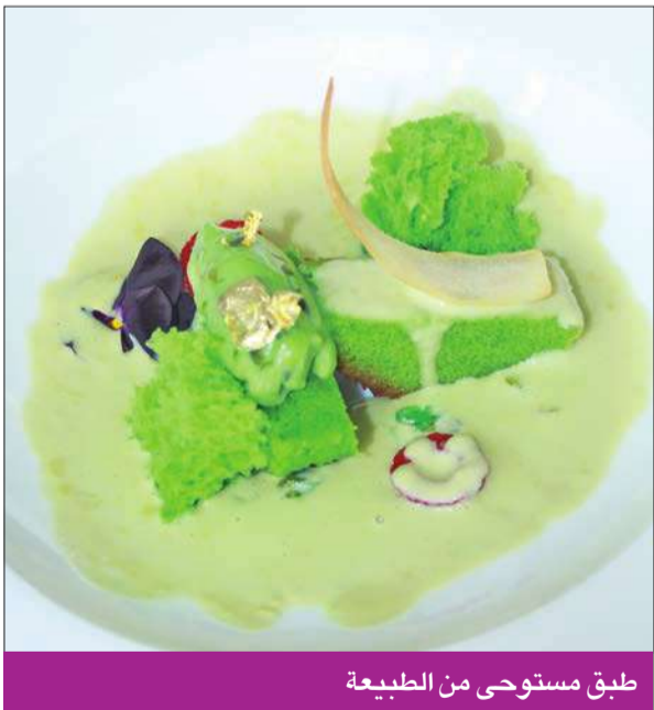
طبق مستوحى من الطبيعة