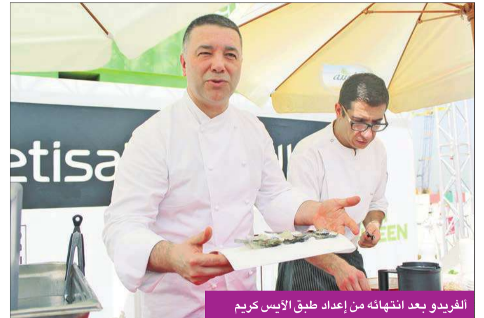
الفريديو بعد انتهائه من إعداد طبق الأيس كريم