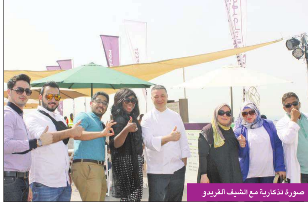
صورة تذكارية مع الشيف الفريديو