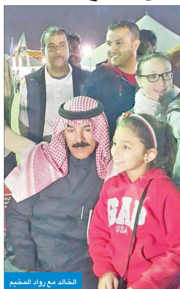
الخالد مع رواد المخيم

زار مخيم الوزارة الريعي وشارك روادها فرحة الأعياد