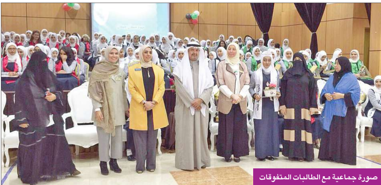
صورة جماعية مع الطالبات المتفوقات