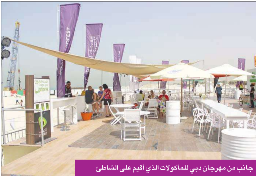
جانب من مهرجان دبي للمأكولات الذي أقيم على الشاطئ