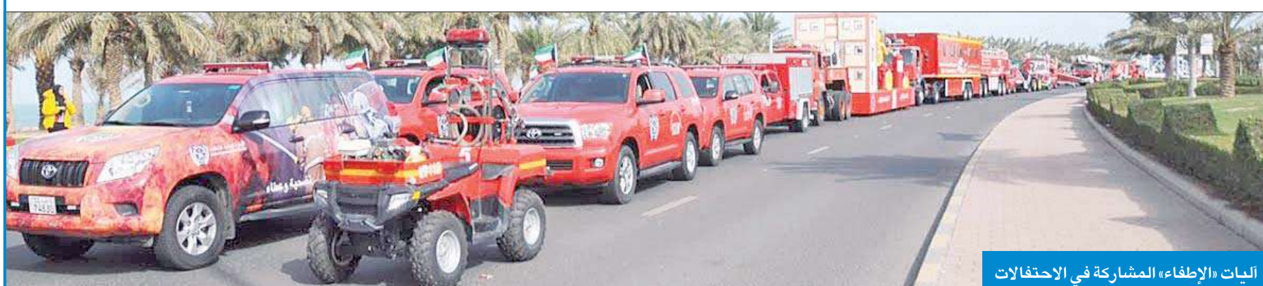
اليات «الإطفاء» المشاركة في الاحتفالات