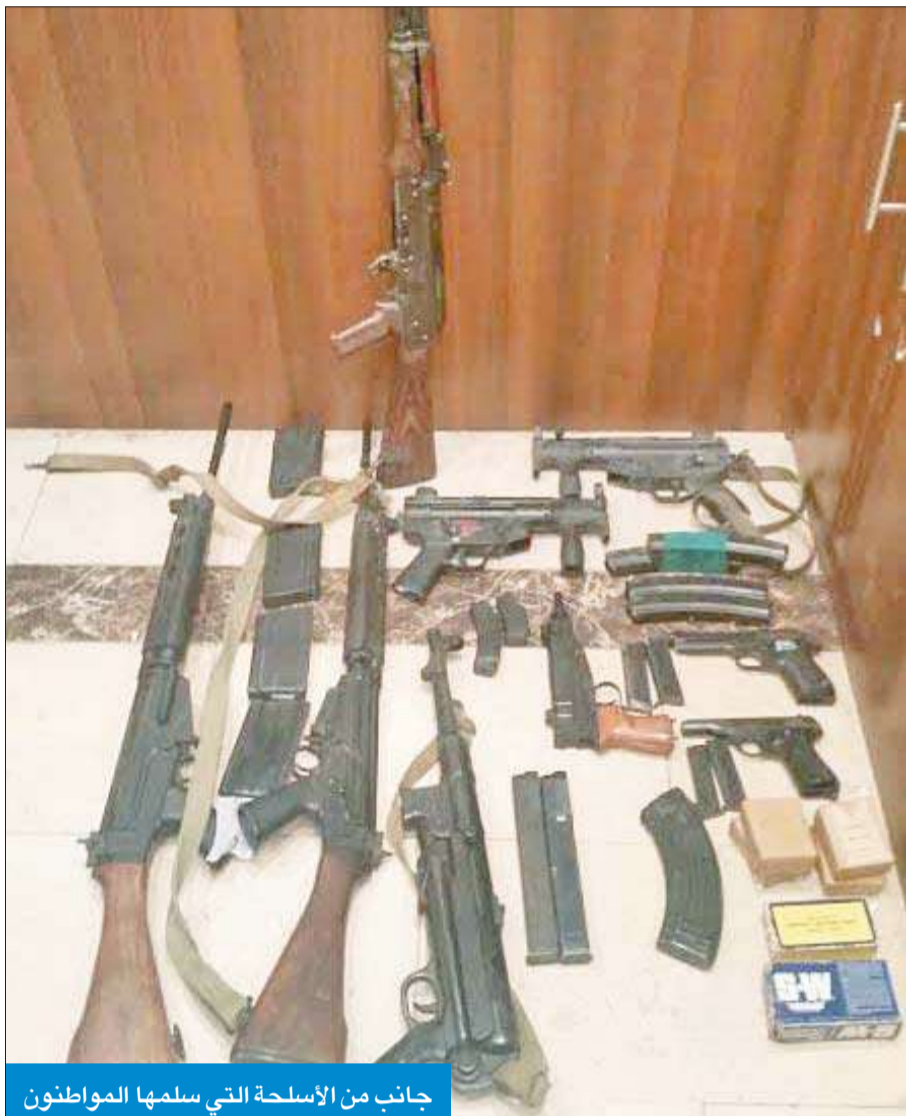
جانب من الأسلحة التي سلمها المواطنون

وتواصل إدارة الإعلام الأمني في وزارة الداخلية جهودها المكثفة في تطبيق خطة التوعية الإعلامية الخاصة بالحملة الوطنية لجمع الأسلحة والذخائر والمفرقات غير المرخصة.