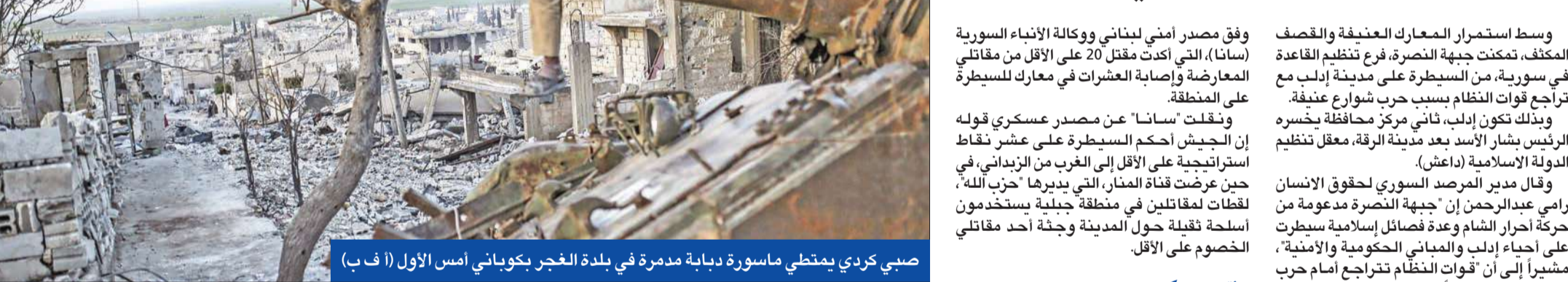
صبي كردي يمتطي ماسورة دبابة مدمرة في بلدة العجر بكوباني أمس الأول

● الأسد يحاصر الزبداني وينعى «شبيح اللاذقية» ● معارضة الداخل تشارك في «موسكو 2»