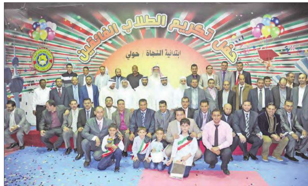
لقطة جماعية لمعلمي المدرسة مع الإدارة