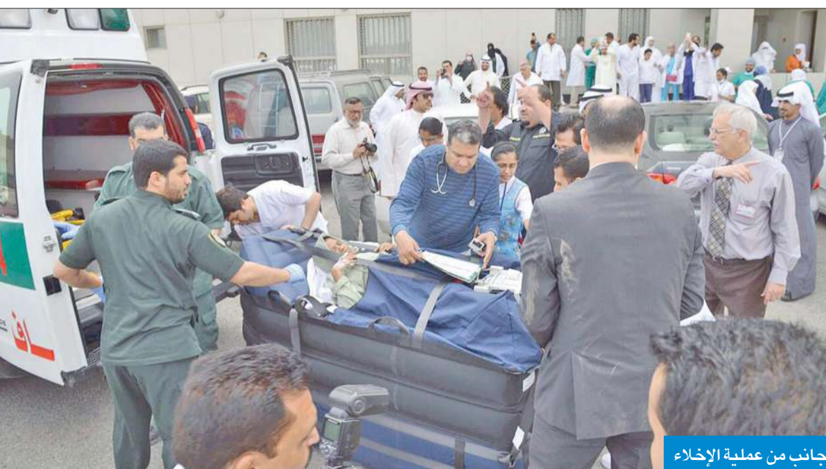
جانب من عملية الإخلاء

وقال الغانم، في تصريح صحفي على هامش الإخلاء الوهمي الذي نفذته إدارة الطوارئ الطبية في مبنى التوسعة الاميرية بمستشفى الجهراء صباح أمس، إن الإخلاء بدأ العاشرة صباحاً، حيث تم إخلاء 12 مريضاً من الجناح الثامن