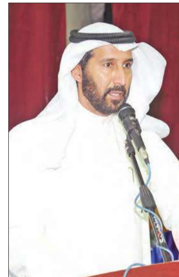
مدير المدرسة أثناء إلقاء كلمته