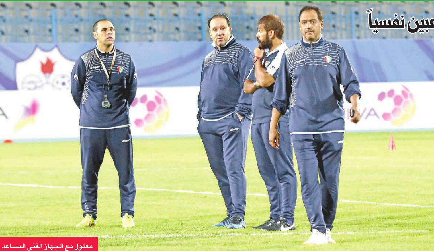
معلول مع الجهاز الفني المساعد