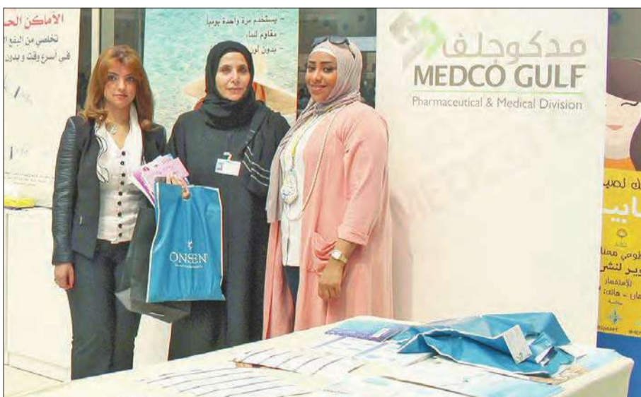
تعريف الحضور بأهمية توازن الصحة والجمال