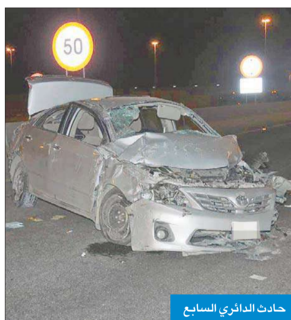
حادث الدائري السابع

الشرعي، لافتاً إلى أن رجال المرور عملوا على تنظيم حركة السير التي تعطلت جراء الحادث.