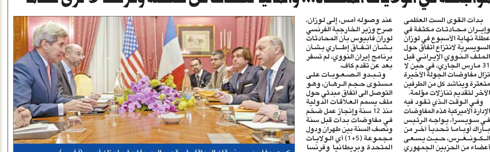
كيري وفابيو بيسنقان المواقف في قصر البورجاف في لوزان أمس (أ ب)