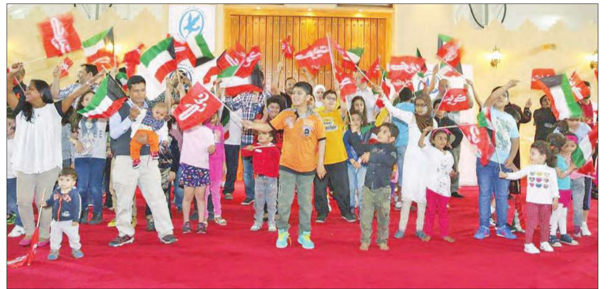
فقرات ترفيهية للأطفال