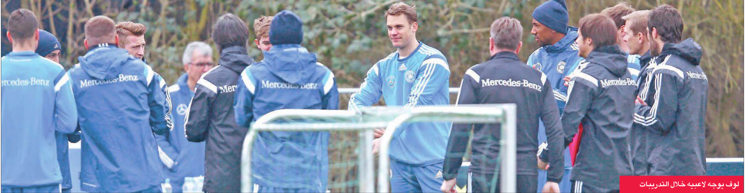
لوف يوجه لاعبيه خلال التدريبات

بعد البداية المتهززة له في التصفيات المؤهلة لبطولة كأس الأمم الأوروبية المقبلة (يورو 2016)، لن يكون أمام المنتخب الألماني لكرة القدم أي خيار سوى الفوز وحصد النقاط الثلاث، عندما يلتقي نظيره الجورجي اليوم في مقر دار الأخير بالعاصمة تبليس، إذا أراد استعادة أترانه في هذه التصفيات.