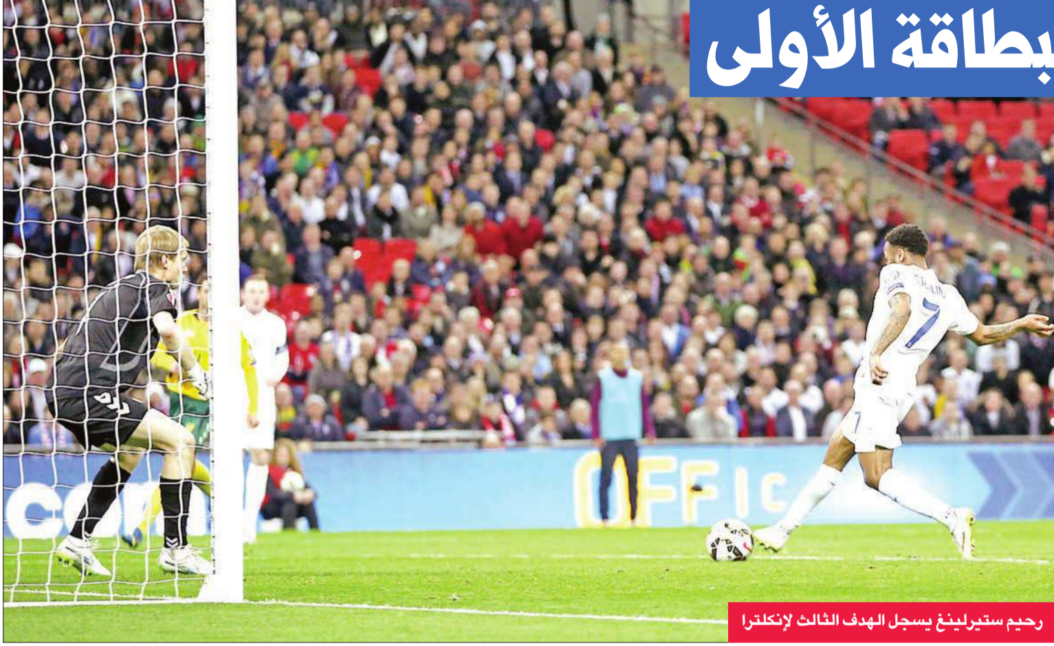
رحيم سترلينغ يسجل الهدف الثالث لإنكلترا

براسه من مسافة قريبة (7). وأنهى الإنكليز الشوط الأول بهدف ثان بعدما تلقى داني ويلبيك كرة داخل المنطقة تابعها ببسراة في الزاوية اليسرى السفلى (45).