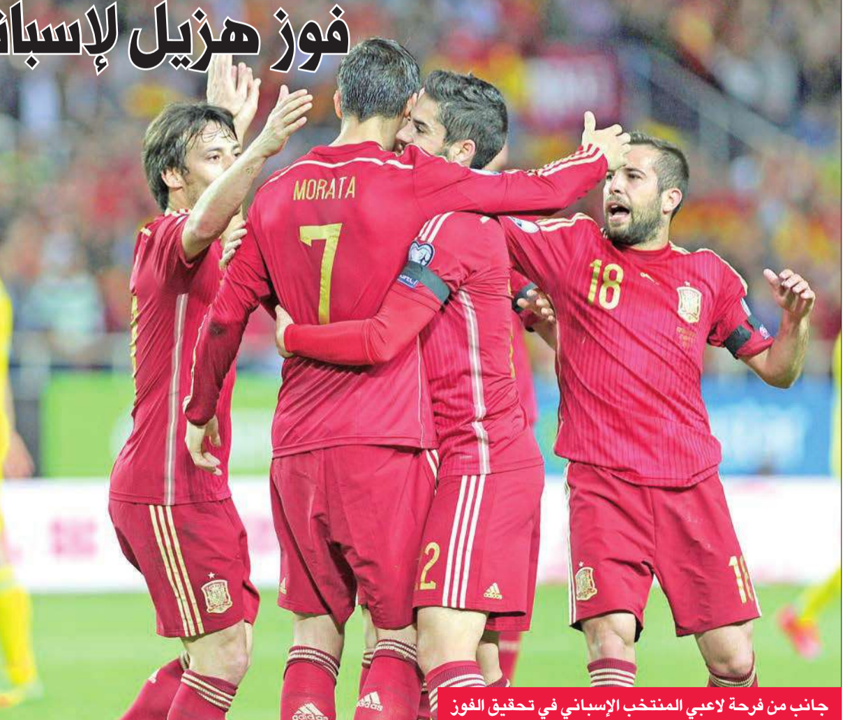
جاناب من فرحة لاعبي المنتخب الإسباني في تحقيق الفوز

فاز منتخب إسبانيا على منتخب أوكرانيا بنتيجة 1-صفر، في حين واصل منتخب سلوفاكيا عروضه المميزّة، وهزم منتخب لوكسمبورغ بثلاثية نظيفة.