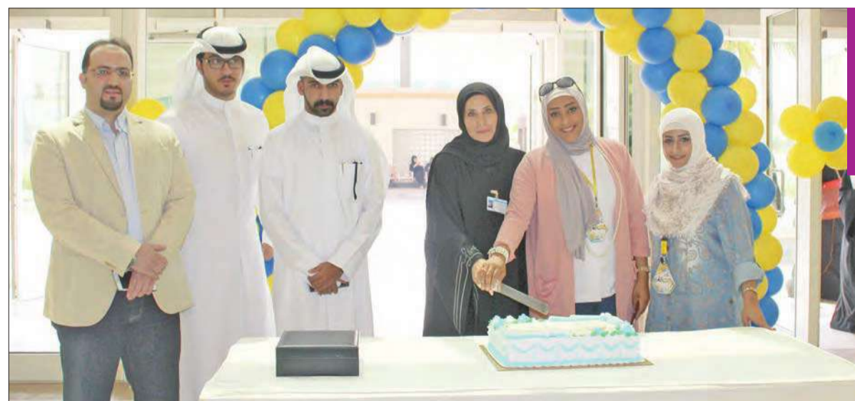
الفيلاكاوي والمطيري وإداريو الكلية خلال قطع كعكة الافتتاح