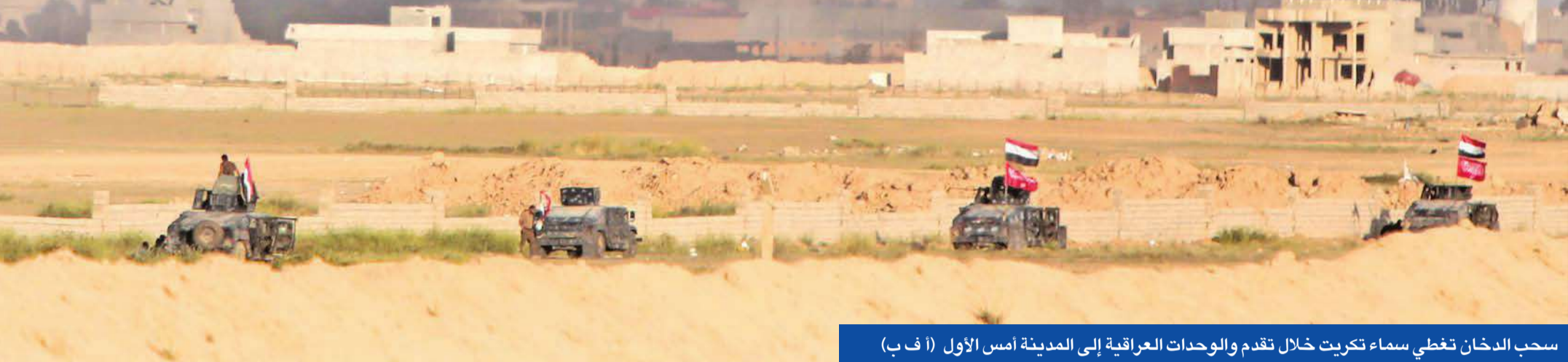
سحب الدخان تغطي سماء تكريت خلال تقدم والوحدات العراقية إلى المدينة أمس الأول