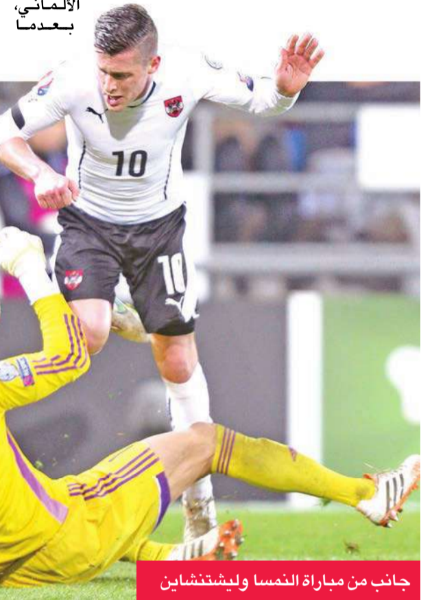
جانب من مباراة النمسا وليشتنشاين

تستضيف جورجيا المنتخب الألماني، بطل العالم، اليوم في تصفيات أم أوروبا، حيث يرفع فريق الماكينات شعار الفوز فقط في هذه المباراة.