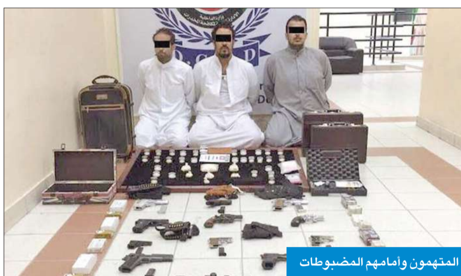
المتهمون وأمامهم المضبوطات

ضبط أحد المواطنين في جاذور بإحدى المناطق وبتفتيشه عثر بحوزته على ثلاث قطع حشيش، وسلاح ناري نوع «كلاشينكوف»، وبنديقية من نوع خرازة و10 مسدسات.