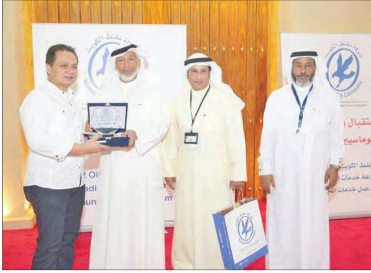
المطوعة مكرماً أحد الدبلوماسيين ويبدو السهلي وبوخضور