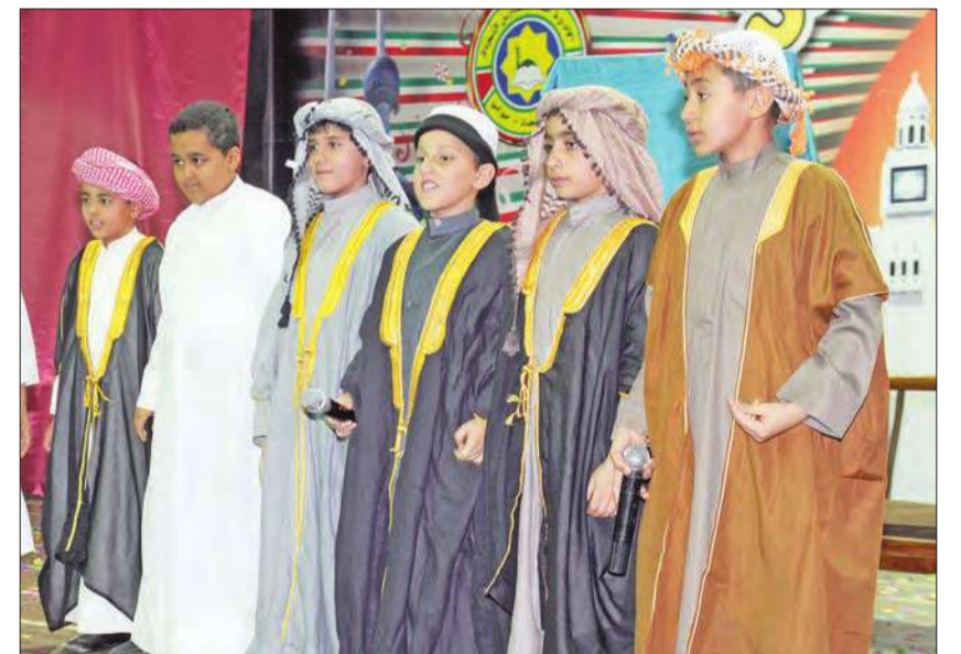
فائقو الصف الرابع الابتدائي أبطال مسرحية «الاصمعي»