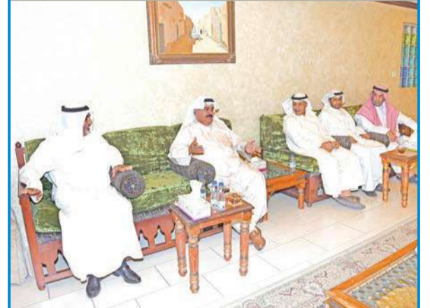
جانب من لقاء المهنة مع المواطنين

أكد محافظ العاصمة الفريق ثابت المهنة أهمية التواصل مع أبناء محافظة العاصمة عن قرب، لافتاً إلى أن مثل هذه اللقاءات المباشرة مع المواطنين تجسد رؤيتنا في إشراك المواطن في صناعة القرار، وتلمس المشكلات والهجوم التي تعانيها بعض المناطق.