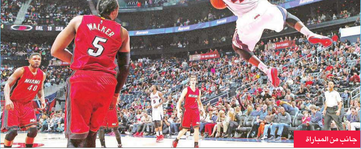
جانب من المباراة

وأمام 18119 متفرجاً، تالق الثنائي ستيفن كوري وبلاي تومسون، فسجل 38 نقطة بينها 17 في الربع الثالث و8 ثلاثيات من 12 محاولة و10 تمريرات حاسمة، والثاني 28 نقطة، ليحقق غولدن ستايت فوزه الثامن على التوالي والتاسع والخمسين هذا الموسم وهو رقم قياسي في تاريخه. وحجز هيوستن روكس بطاقته للبلاي أوف للعام الثالث على التوالي بفوزه على ضيفه مينيوتا تيمبروولفز 120-110 على ملعب «تويوتا سنتر» أمام 18322 متفرجاً. وللعام الرابع على التوالي، حجز لوس انجلس كليبرز بطاقة الادوار الاقصائية بفوزه على مضيفه فيلادلفيا سفنتي سيكسرس 119-98 على ملعب «ولس فارغو سنتر» أمام 16070 متفرجاً.