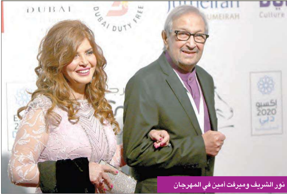
نور الشريف وميرفت أمين في المهرجان

فيلم "الزولية" للمخرج صادق بهباني الذي يعرض عالمياً لأول مرة، ويعرض المخرج عبدالله الوزان فيلماً بعنوان "عربة فلافل"، أما المخرج يوسف البقشي فيقدم فيلماً بعنوان "سندره". وبعد الافتتاح عرض فيلم "ثري أوف ايفرثينغ" حول عالم فيزياء يعاني مشاكل صحية كبيرة، لكنه يحقق طموحاته