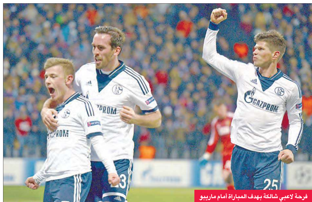
فرحة لاعبي شالكة بهدف المباراة أمام ماريبور

أعرب جوزيه مورينيو مدرب نادي تشلسي الإنجليزي لكرة القدم عن شعوره بالإسف بعد خروج فريق سيورتنغ لشبونة البرتغالي من منافسات دور المجموعات ببطولة دوري أبطال أوروبا مساء الأربعاء. وقال مورينيو لشبكة «سكاي سبورتس» التلفزيونية بعد المباراة: «كان أداءنا في قمة التركيز والجدية، وأنا سعيد بذلك، ولكنني أشعر بالأسف من أجل سيورتنغ، فقد كنت أتمنى أن يتأهلوا». وأضاف أن الفوز «كان مهما بالنسبة لنا، فهو ردة فعل جيدة لهزيمتنا أمام نيوكاسل