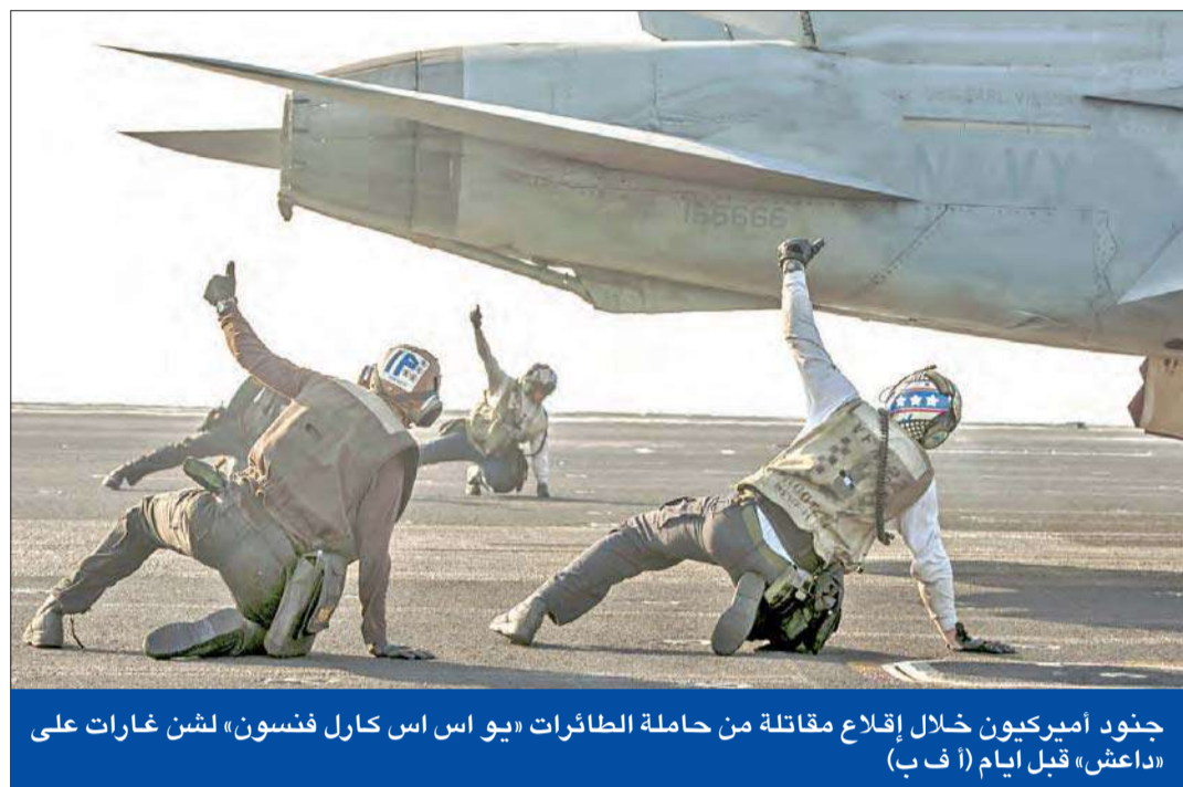
جنود أميركيون خلال إقلاع مقاتلة من حاملة الطائرات «يو إس إس كارل فنسون» لشن غارات على «داعش» قبل أيام