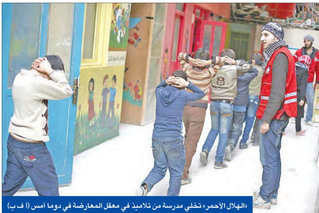
«الهلل الأحمر»، تخلي مدرسة من تلاميذ في معقل المعارضة في دوما أمس

● تدريب وتسليح 5 آلاف سوري في مارس ● الأسد يتعاطى مع «حوار موسكو» ودي ميستورا يواجه الفشل