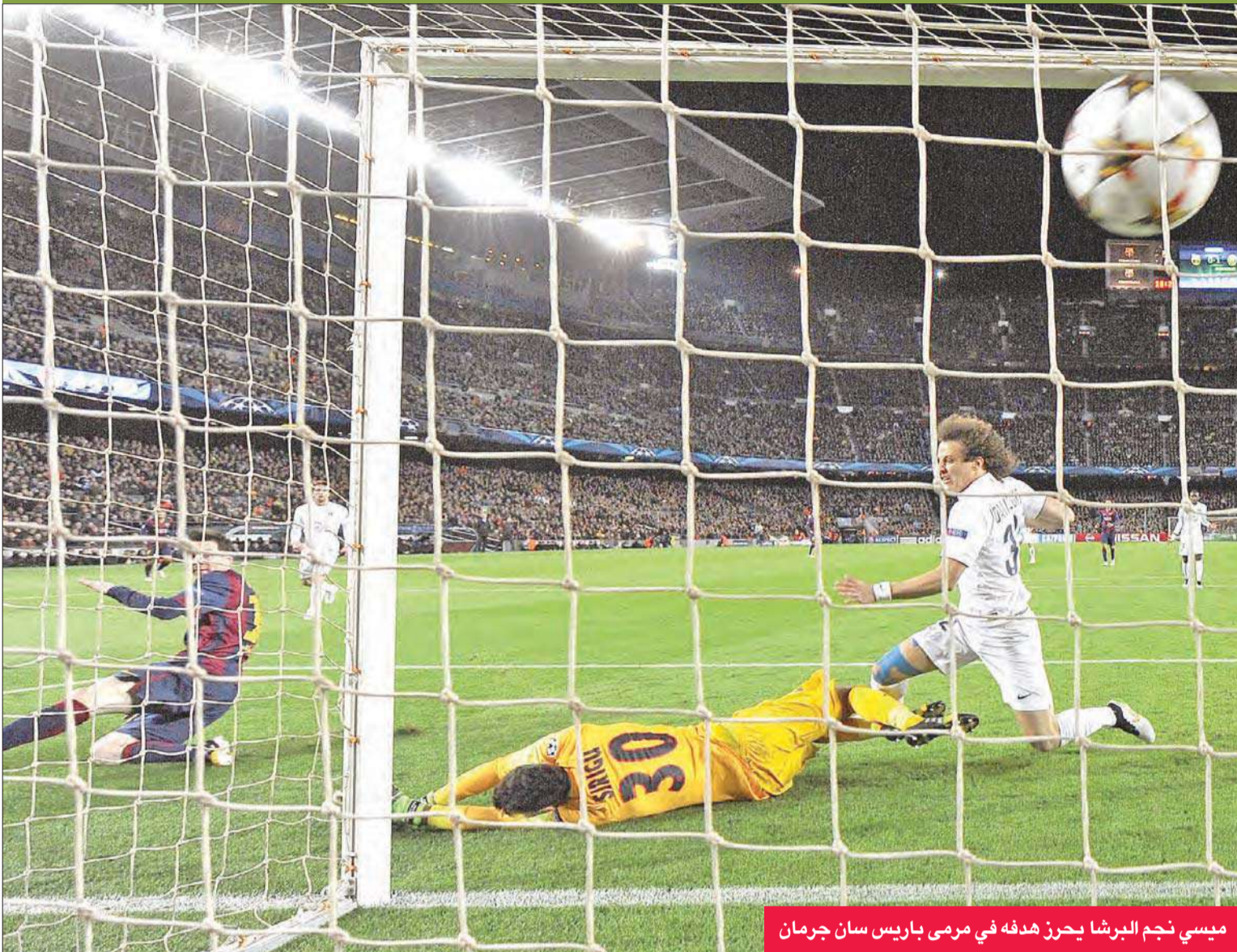
ميسي نجم البرشا يحرز هدفه في مرمرى باريس سان جرمان

من الجهة اليسرى الأوروغوياني لويس سواريز (19)، ووضع البرازيلي نيمار بحرفية المعلم أصحاب الأرض في المقدمة، مسجلا هدفا أكثر من رائع بتسديدة بعيدة المدى (41).