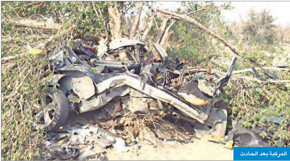
المركبة بعد الحادث