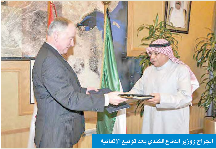
الجراح ووزير الدفاع الكندي بعد توقيع الاتفاقية

الجراح يبحث ووزير الدفاع الكندي سبل تعزيز العلاقات