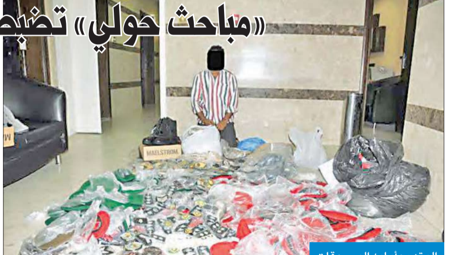
المتهم وأمامه المسروقات

أعلنت إدارة الإعلام الأمني بوزارة الداخلية تمكن إدارة مباحث محافظة حولي من ضبط الأسبوية المتهم بسرقة أحد محلات بيع الملابس والمتعلقات العسكرية الخاصة بالجيش، والداخلية، والحرس الوطني، والتي قدرت قيمتها بـ 20 ألف دينار كويتي. وكانت المعلومات التي حصل عليها فريق البحث