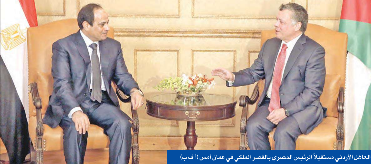
العاهل الأردني مستقبلاً الرئيس المصري بالقصر الملكي في عمان أمس