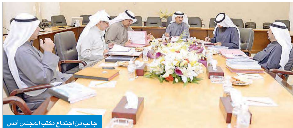
جانب من اجتماع مكتب المجلس امس

ولقي ابوعين مصرعه امس الاول نتيجة اعتداء قوات الاحتلال الاسرائيلي عليه بالضرب خلال مشاركته مع ناشطين فلسطينيين في مشروع زراعة اشجار الزيتون بمنطفة ترسعيا المهدة بالاستيطان. من جهته، توجه النائب ماضي الهاجري بالشكر الى قادة دول مجلس التعاون الخليجي لتكريمهم سمو امير البلاد الشيخ صباح الاحمد، بمناسبة اختياره قائدا للعمل الانساني، مؤكدا ان التكريم يجسد العلاقات الاخوية بين القادة ودلالة كبيرة