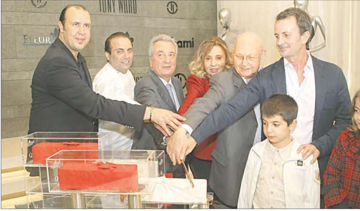
الحضور يقطعون قالب الحلوى