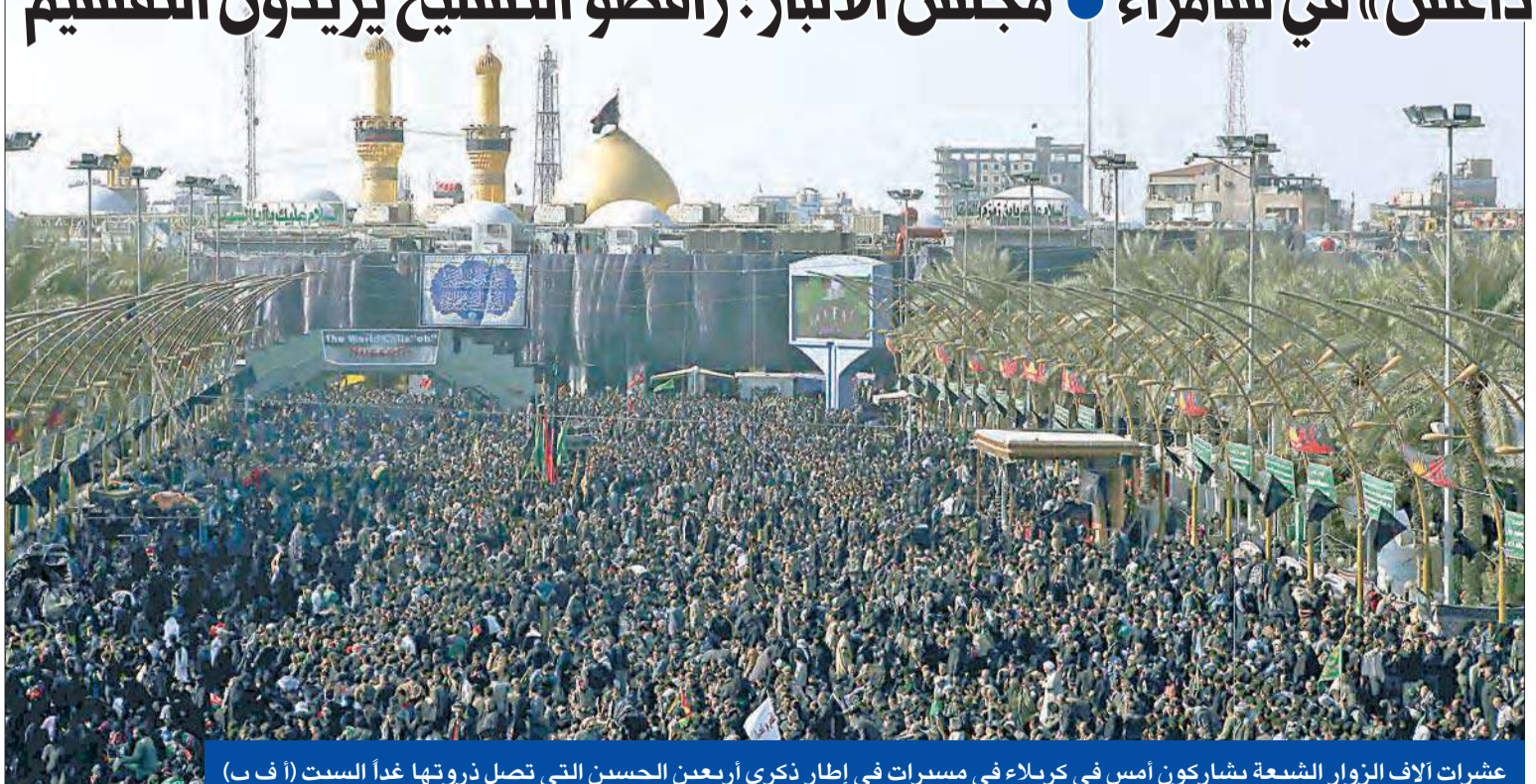
عشرات آلاف الزوار الشيعة يشاركون أمس في كربلاء في مسيرات في إطار ذكرى أربعين الحسين التي تصل ذروتها غدا السبت (أ ف ب)

● الصدر يطلق «نداء الجهاد» لمواجهة «داعش» في سامراء ● مجلس الأنبار: رافضو التسليح يريدون التقسيم