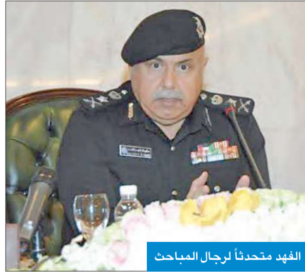
الفهد متحدثاً لرجال المباحث

ترأس اجتماعاً موسعاً مع قيادات وضباط المباحث الجنائية ومكافحة المخدرات