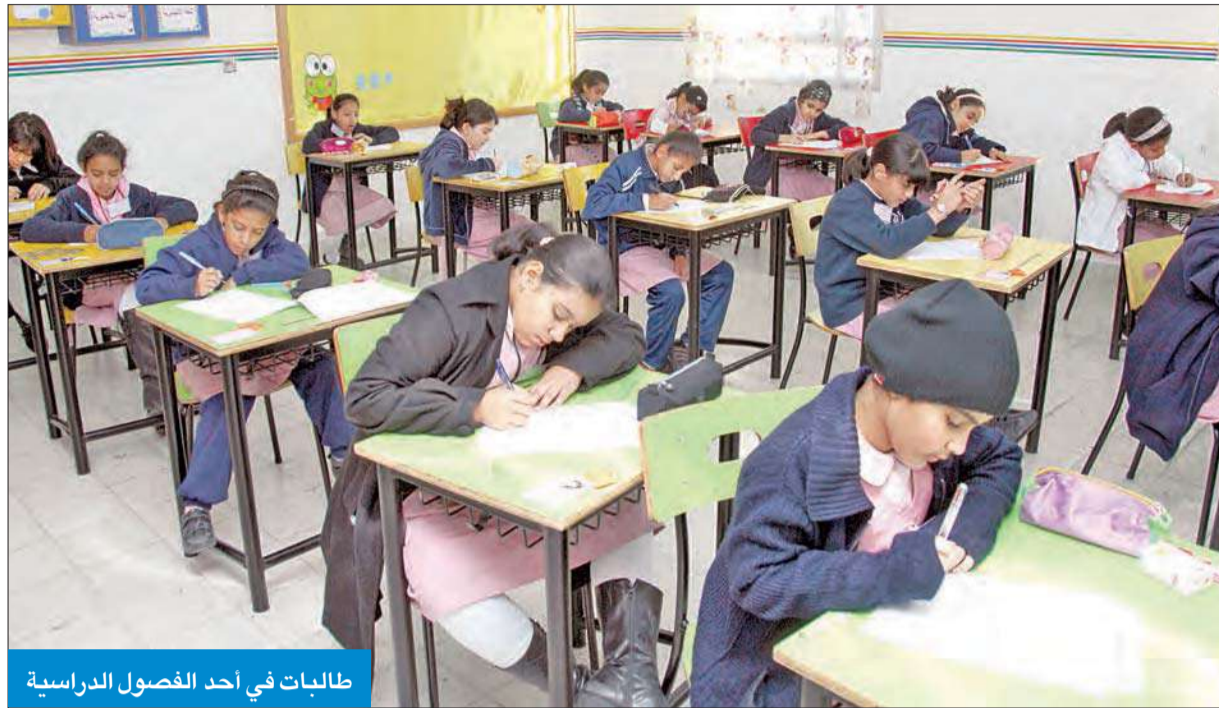
طلبات في أحد الفصول الدراسية

انتقدوا ارتفاع الكثافات الطلابية وضعف مستوى التعليم وتدني الخدمات المساندة