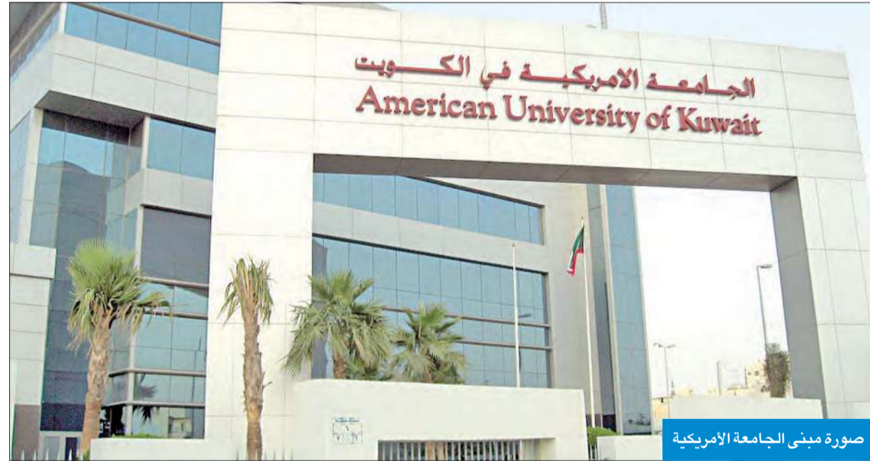
صورة مبنى الجامعة الأمريكية

هدى بيطار أكد طلاب الجامعة الأميركية أن المكتبة تشكل جزءاً أساسياً من حياتهم، وذلك لمساعدتهم على تطوير أدائهم، بتوفيرها مصادر المعلومات والمرافق المناسبة، مستخدمة أحدث الوسائل التكنولوجية، وإتاحة فرص تؤهلهم لسوق العمل.