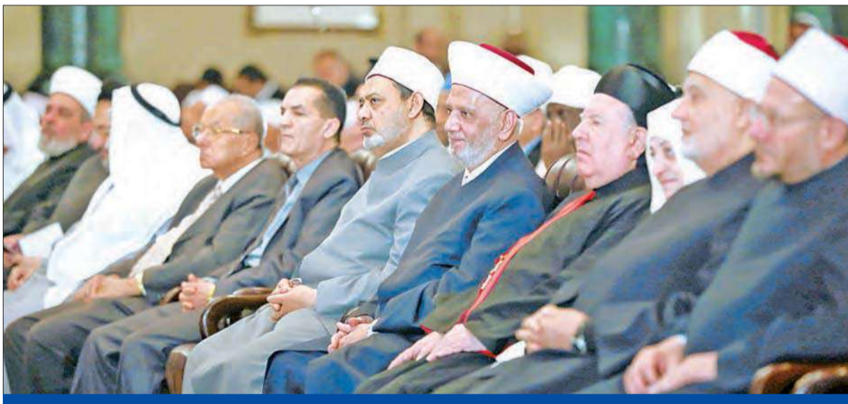
شيخ الأزهر يتوسط قيادات دينية مصرية وعربية في افتتاح مؤتمر مكافحة الإرهاب بالقاهرة في 3 ديسمبر

«الإخوان» تتهم المؤسسة بالتناقض و«الدعوة السلفية» تدافع عنها • كريمة: الدواعش مرتدون بالأدلة الشرعية