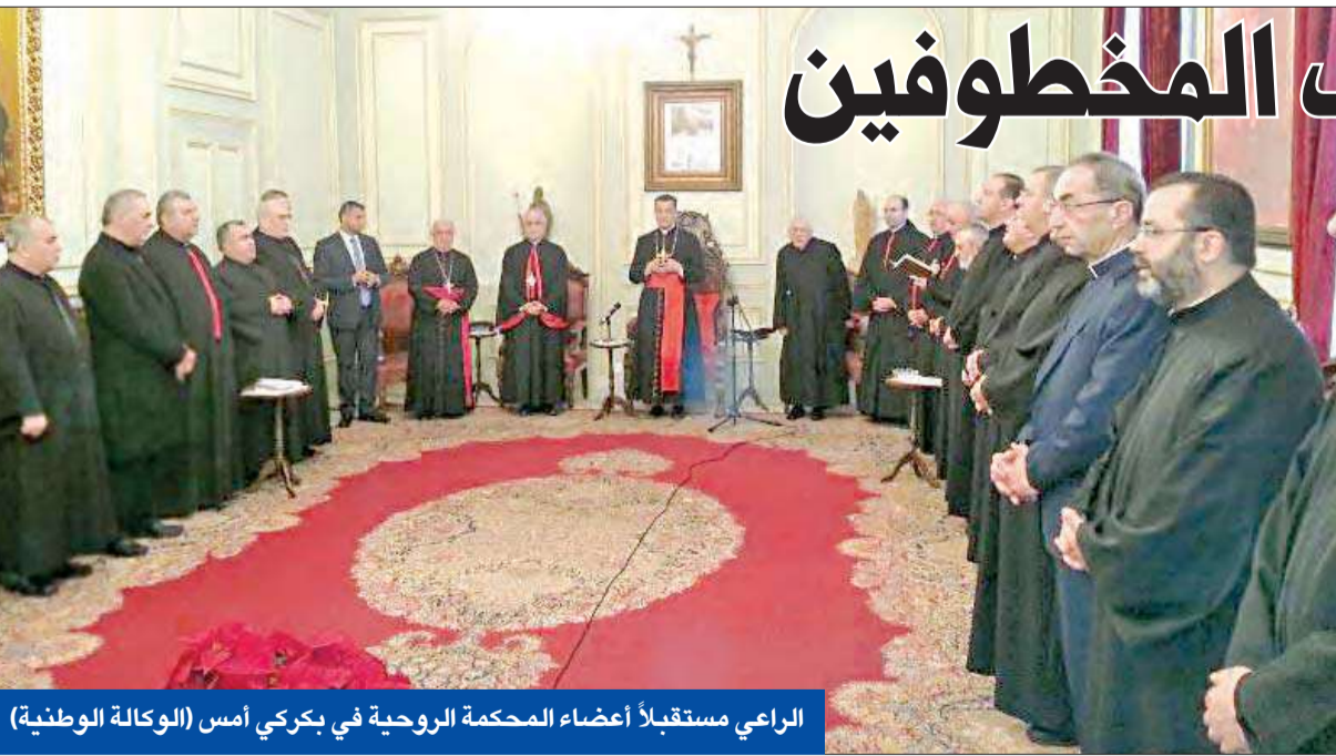
الراعي مستقبلاً أعضاء المحكمة الروحية في بكركي أمس

وأكد أن موضوع المفاضة قائم بالمبدأ، مشيراً إلى أنه ينشئ مع رئيس اللقاء الديمقراطي «النائب وليد جنبلاط»، وقال: «حسب الجيش السوري».