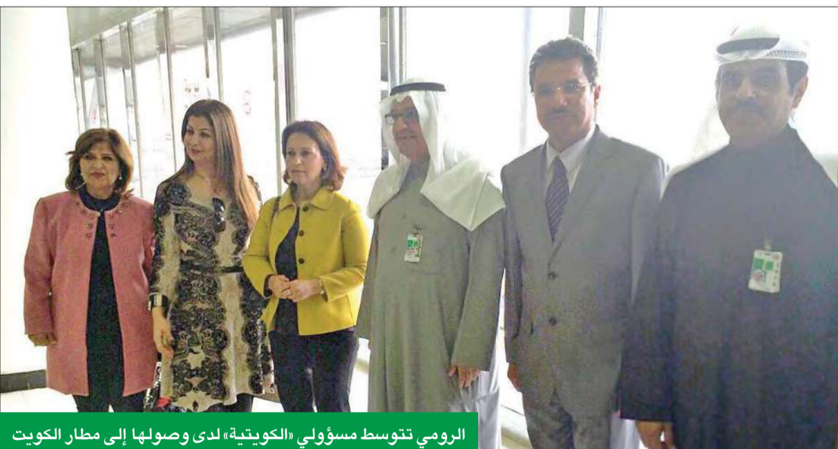
الرومي تتوسط مسؤولي «الكويتية» لدى وصولها إلى مطار الكويت

سعداء باختيار «الكويتية» إيرباص لتجديد أسطولها ديبديه لوكس