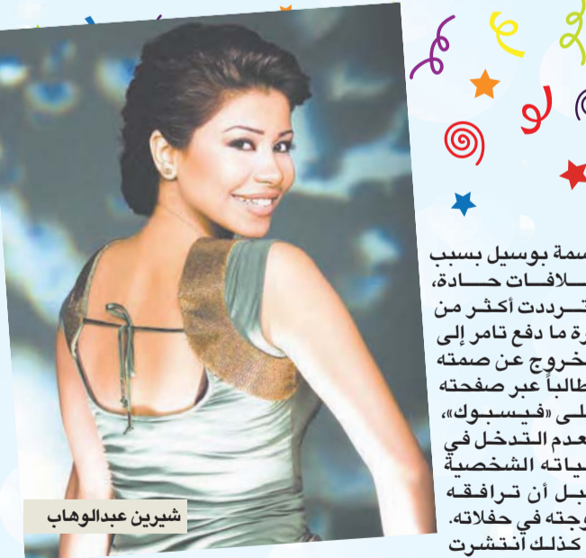
شيرين عبد الوهاب

بدورها نفت كندة علوش الإشاعات التي تردت على المواقع الإلكترونية حول تعرضها لإطلاق