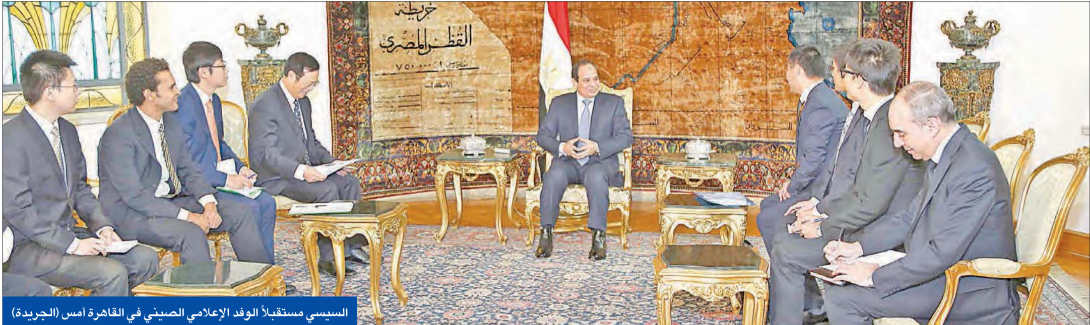
السيسي مستقبلاً الوفد الإعلامي الصيني في القاهرة أمس (الجريدة)

قبل زيارته المرتقبة للصين، بحث الرئيس المصري مع نظيره الأميركي هاتفياً العلاقات الثنائية واستكمال استحقاقات «خريطة الطريق» في مصر، في حين بدأت لجنة الانتخابات البرلمانية استعداداتها لبحث تحديد موعد إجراء هذا الاستحقاق مع الحكومة.