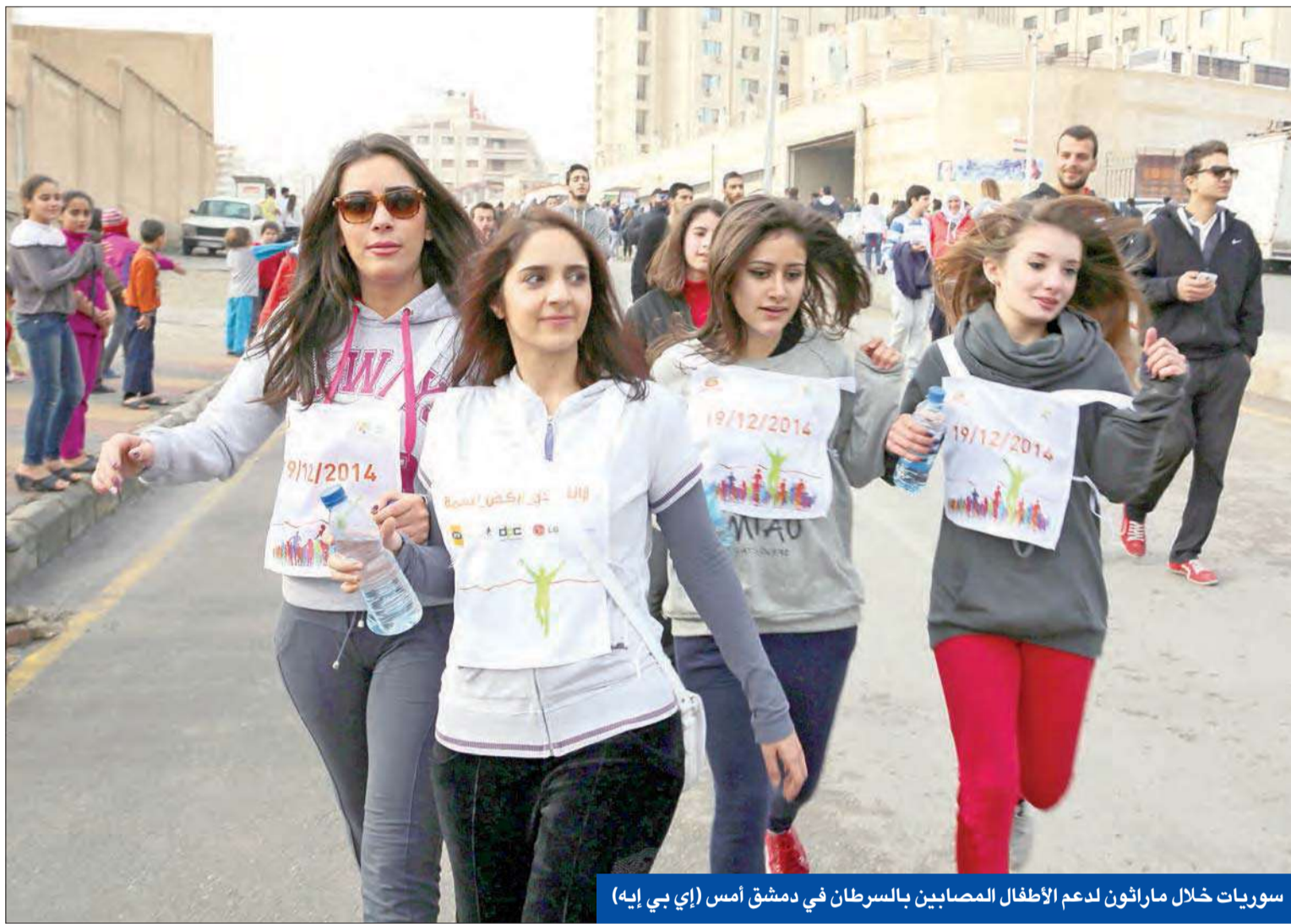
سوريات خلال ماراثون لدعم الأطفال المصابين بالسرطان في دمشق أمس

● مخاوف من إعدام 1000 في الكشكية ● واشنطن «دعت» مفاوضات مع «داعش»