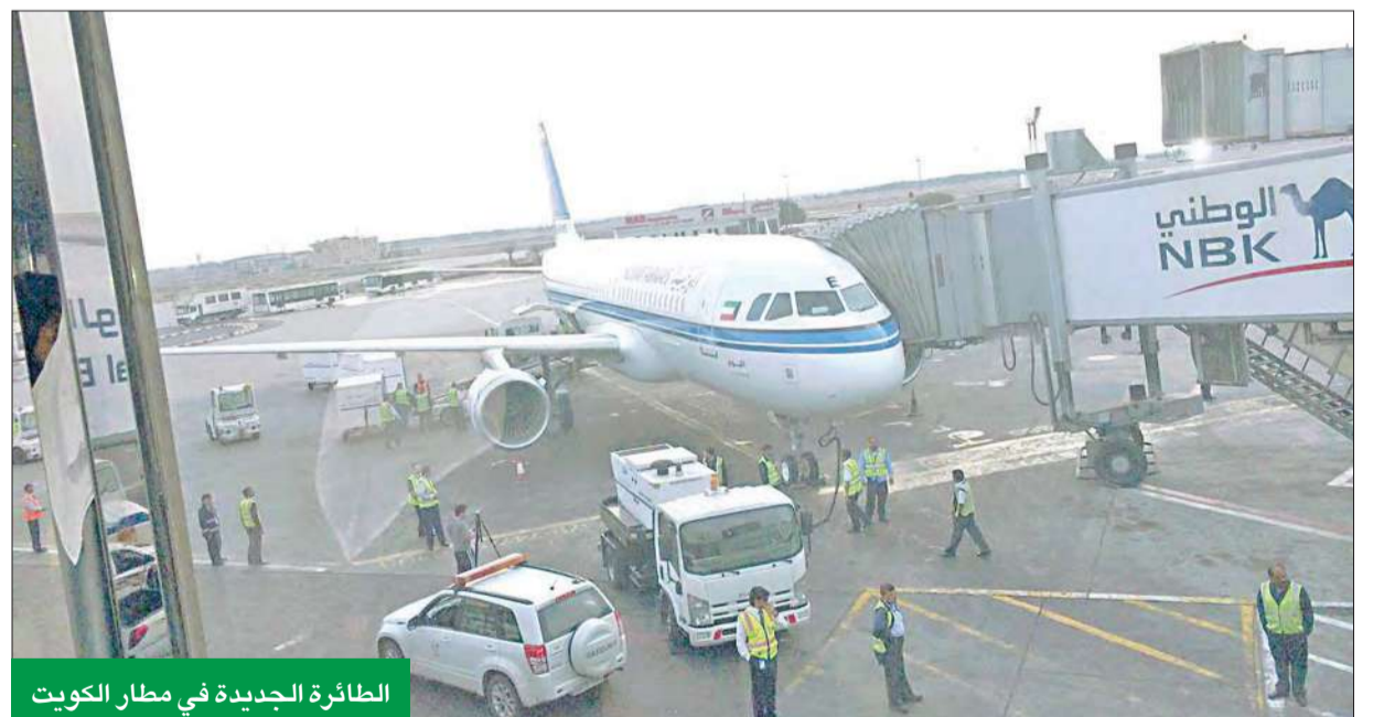
الطائرة الجديدة في مطار الكويت