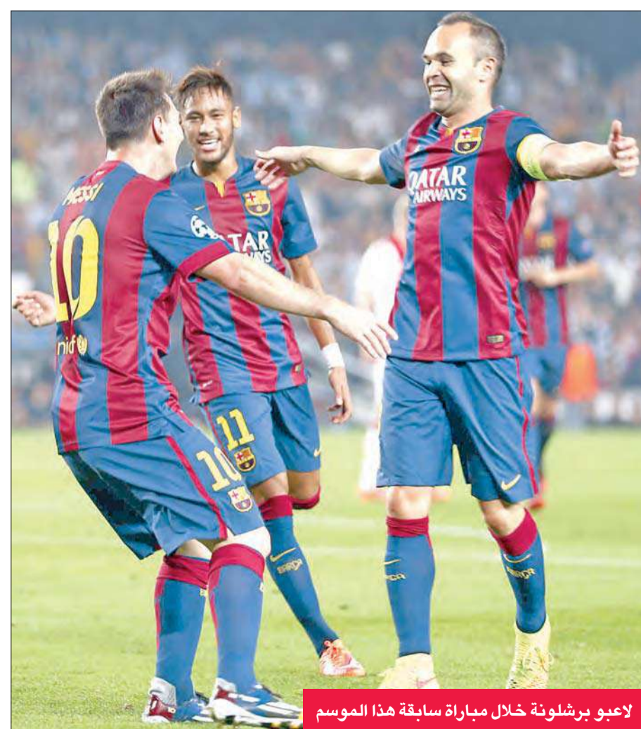
لاعبو برشلونة خلال مباراة سابقة هذا الموسم

يسعى برشلونة الى تقديم مباراة كبيرة وتحقيق الفوز على ضيفه قرطبة، عندما يتواجهان اليوم في آخر مباريات الفريقين في 2014 قبل عطلة الأعياد.