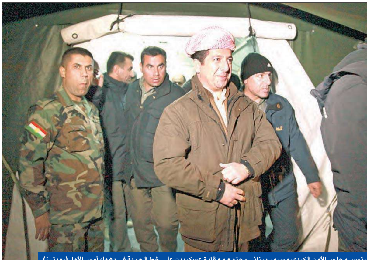
رئيس مجلس الأمن الكردي مسرور برزاني يجتمع مع قادة عسكريين على خط الجبهة في دهوك أمس الأول (رويترز)

قال مسؤولون من كوريا الشمالية أمس إن الهجوم الإلكتروني على شركة سوني بيكتشرز ربما كان عملية تدريب لاختبار مهارات الجيش الإلكتروني في الدولة الشيوعية المنعزلة في إطار هدف بعيد المدى لاكتساب القدرة على أصابة شبكات الاتصالات والطاقة في الدول المحيطة على أصابة شبكات المحكمة الدستورية في كوريا الجنوبية بحل الحزب التقدمي الموحد، وهو حزب يساري يواجه اتهامات باتباع سياسات مؤيدة لكوريا الشمالية. (سيول - أ ب)