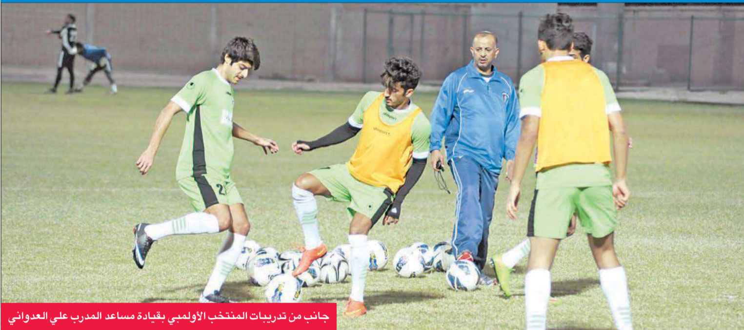
جانب من تدريبات المنتخب الأولمبي بقيادة مساعد المدرب علي العدواني