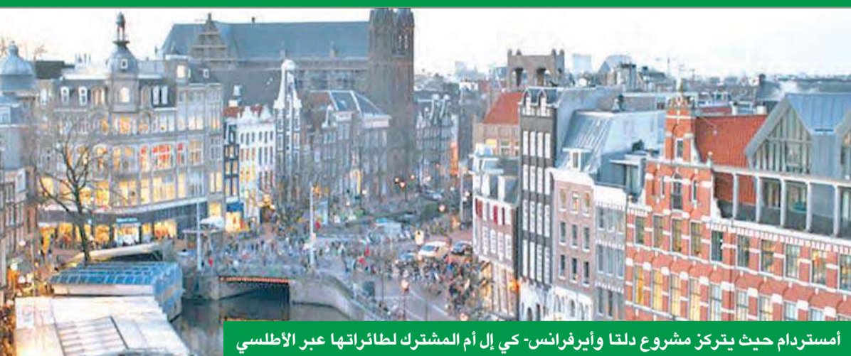
أمستردام حيث يتركز مشروع دلتا وأيرفرانس- كي إل أم المشترك لطائراتها عبر الأطلسي