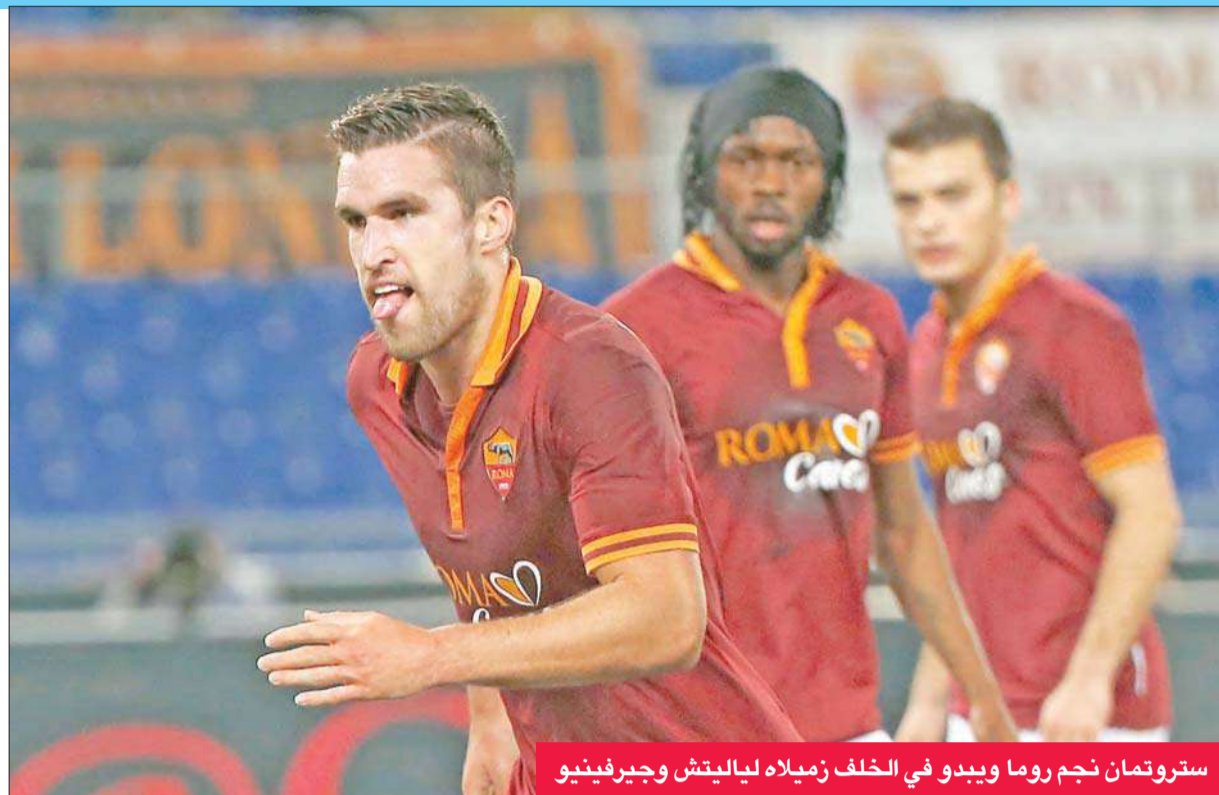
ستروتمان نجم روما ويبدو في الخلف زميله ليايتش وجيرفينيو