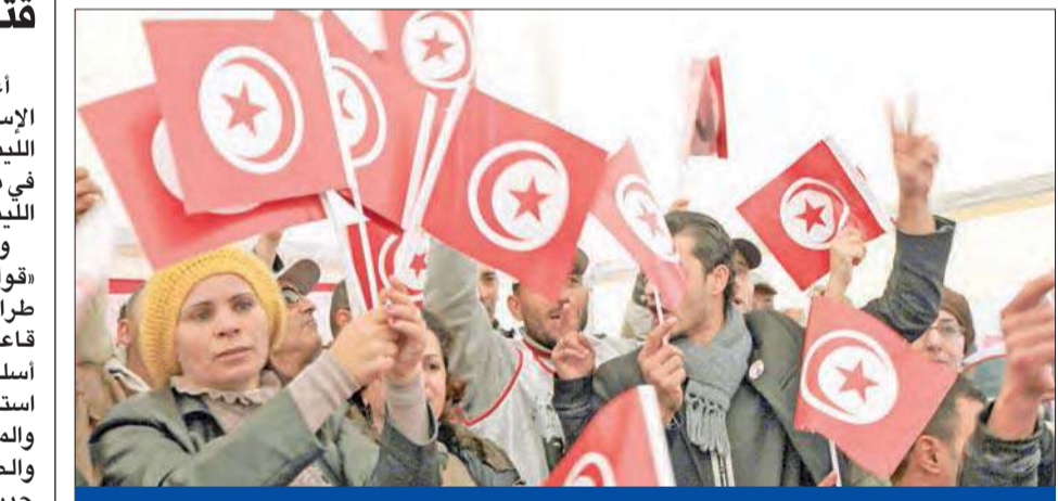
مؤيدو السبسي يرفعون الأعلام في شارع الحبيب بورقيبة وسط تونس أمس الأول

البحرية والشمالية الغربية المتمسكة بالحزب التقدمي الموحد، وهو حزب يساري يواجه اتهامات باتباع سياسات مؤيدة لكوريا الشمالية. (سيول - أ ب)