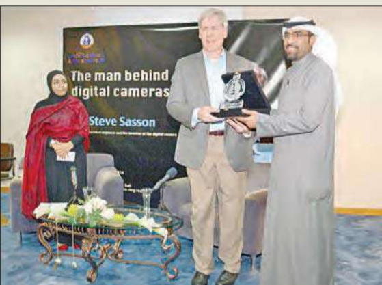
تكريم مخترع الكاميرا الرقمية في النادي العلمي

وقال: «لم أكن أفكر بتغيير العالم لكن فكرت في كيفية تحويل الصورة إلى شكل رقمي، وفي عام 1975 كانت أولى الصور التي التقطتها كاميرتي التي جمعتها وإضافاً أنه عمل على إختراعه بشكل منفرد، مشيراً إلى أن الذي ساعده في الإبتكار هو الثقافة العلمية العامة والمعارف والأصدقاء، مضيفاً أنه «عندما تفكر بأي فكرة أو ابتكار علينا أن نضع كل ثقافتنا في المجال الذي نهدف فيه».