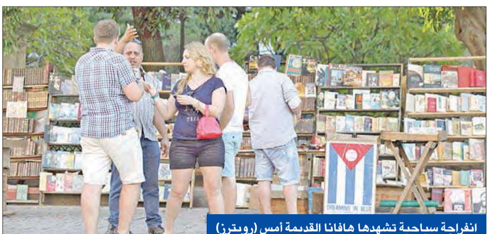
انفراجة سياحية تشهدها هافانا القديمة أمس

وبرر أوباما الذي ولد في عام 1961 أنه «لا الشعب الأميركي ولا الشعب الكوبي سيستفيد من سياسة متعننة موروثة عن أحداث وقعت قبل أن يولد معظمنا». وأضاف مستعجباً ما قاله وزير خارجيته جون كيري «إن كوبا ليست من بعيد، بل الولايات المتحدة». (واشنطن - أ ب، رويترز)