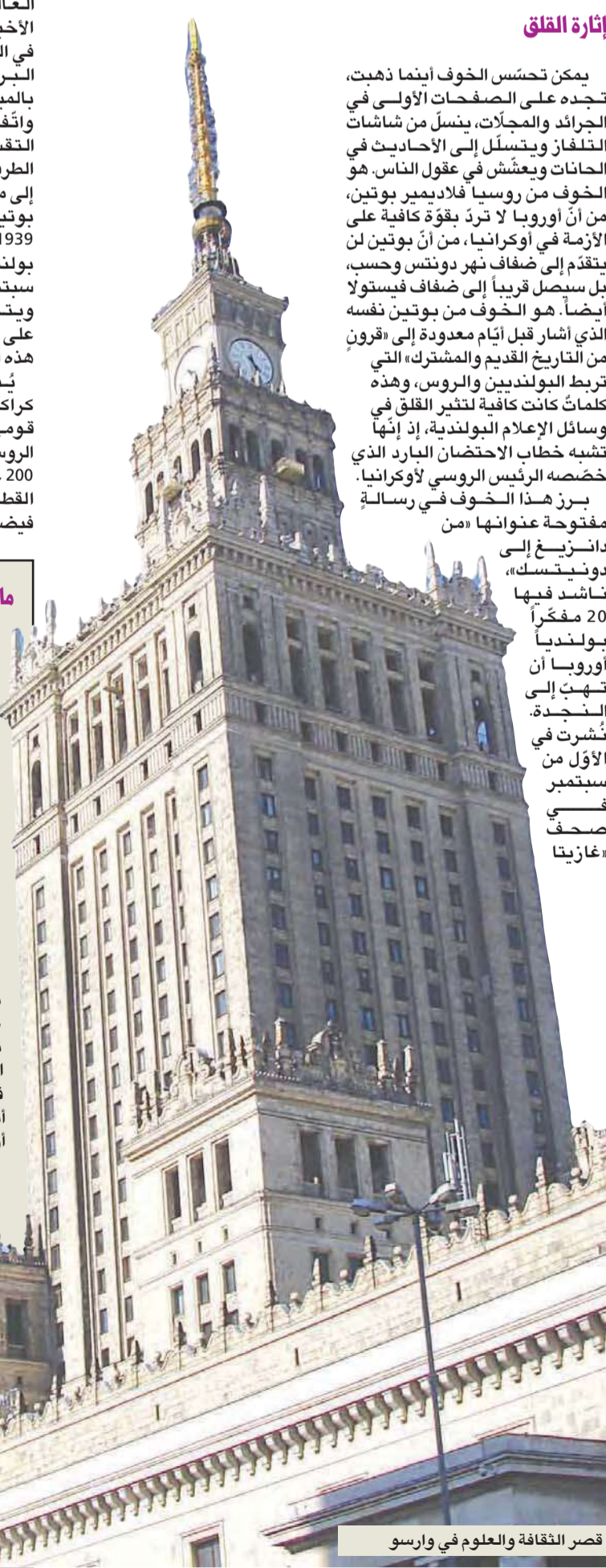
قصر الثقافة والعلوم في وارسو