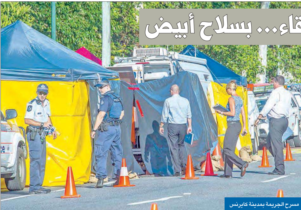
مسرح الجريمة بمدينة كابرنس

عثر أمس الجمعة على جثث 8 أطفال تتراوح أعمارهم بين 18 شهراً و15 عاماً، وعلى امرأة مصابة بجروح في منزل بمدينة كابرنس بشمال أستراليا، حسب ما أعلنت الشرطة أمس، في حين أعلنت وسائل الإعلام المحلية أنهم طعنوا حتى الموت. وقالت الشرطة الأسترالية إن «المحققين أشاروا إلى وجود مسرح جريمة، وإنهم فتحو تحقيقاً حول مقتل الأطفال الثمانية صباح أمس». وأوضحت أنه «خلال الكشف على مسرح الجريمة، عثرت الشرطة على جثث الأطفال الذين تتراوح أعمارهم بين 18 شهراً و15 عاماً». وعثر أيضاً على امرأة تبلغ من العمر 34 عاماً مصابة بجروح في هذا المنزل بحي مينورا، الذي يبعد مسافة 10 دقائق عن وسط