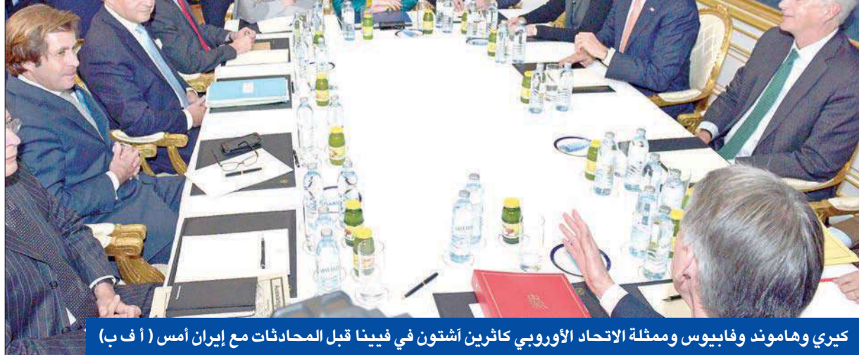
كيري وهاموند وفابوس وممثلة الاتحاد الأوروبي كاترين أشتون في فيينا قبل المحادثات مع إيران أمس

كيري وفابوس إلى باريس للتشاور... ولندن تدعو طهران لاقتناص الفرصة