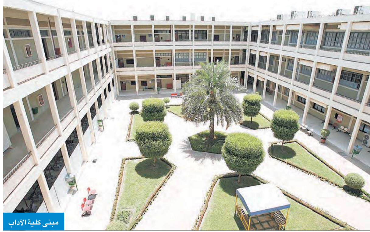
مبنى كلية الآداب

أخرى، وينمي ويطور اللغة الفرنسية لديهم من خلال الالتحاق ببرامج اللغة الفرنسية، والالتزام بكورسات مكثفة بها من خلال الالتحاق بالأنشطة التي يقدمها قسم اللغة الفرنسية.