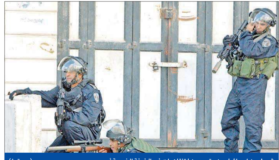
شريطون إسرائيليون يتصدون لتظاهرات في الضفة الغربية أمس

مع استمرارها في سياسة هدم البيوت رغم الرفض الدولي، وجهت إسرائيل أمس تهمة التامر لأعتقال وزير الخارجية الإسرائيلي أفغدور ليرمان له فلسطينيين، مؤكدة أنهم ضمن خلية عسكرية تابعة لحركة «حماس». ونقلت الإذاعة عن جهاز الأمن العام الإسرائيلي (شاباك) تأكيدته أن المشاركين في مخطط اغتيال ليرمان جميعهم من بيت لحم، والتحقيق أظهر أنهم خططوا لشراء قذيفة صاروخية (إ بي جي)، ثم إطلاقها على السيارة التي تقل ليرمان، الذي يسكن في مستوطنة نوكديم القريبة من بيت لحم. وتم اعتقال أفراد الخلية قبل أن يتمكنوا من تنفيذ المؤامرة، بحسب بيان لجهاز الأمن الإسرائيلي الذي لم يحدد تاريخ أو مكان الاعتقال. في غضون ذلك، سمحت الشرطة الإسرائيلية للفلسطينيين من