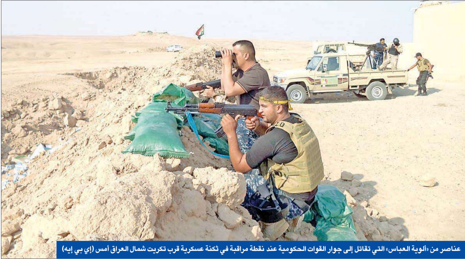
عناصر من «الوية العباس» التي تقاوم إلى جوار القوات الحكومية عند نقطة مراقبة في ثكنة عسكرية قرب تكريت شمال العراق أمس

تفخيخ جسر تكريت وهجوم مزدوج على جامعتها • «المرجعية» تحذر من «آفة النصر والغرور»