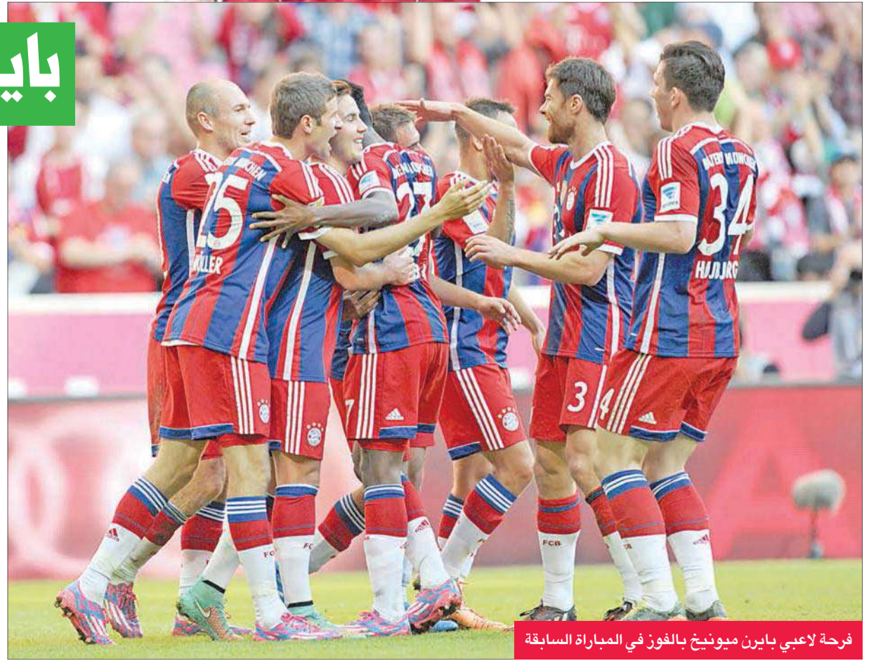
فرحة لاعبي بايرن ميونخ بالفوز في المباراة السابقة

يذكر أن هوفنهايم عاد في زيارته الأخيرة إلى ملعب اليانز أرينا بنقطة التعادل 3-3. لكن المدرب ماركو غيسدول لا يكتنر