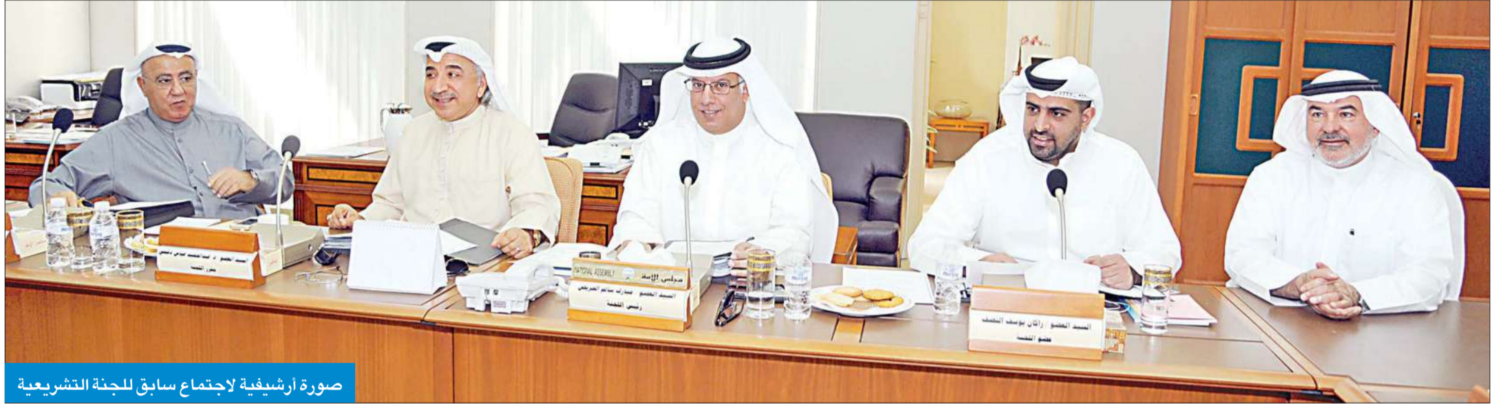
صورة أرشيفية لاجتماع سابق للجنة التشريعية