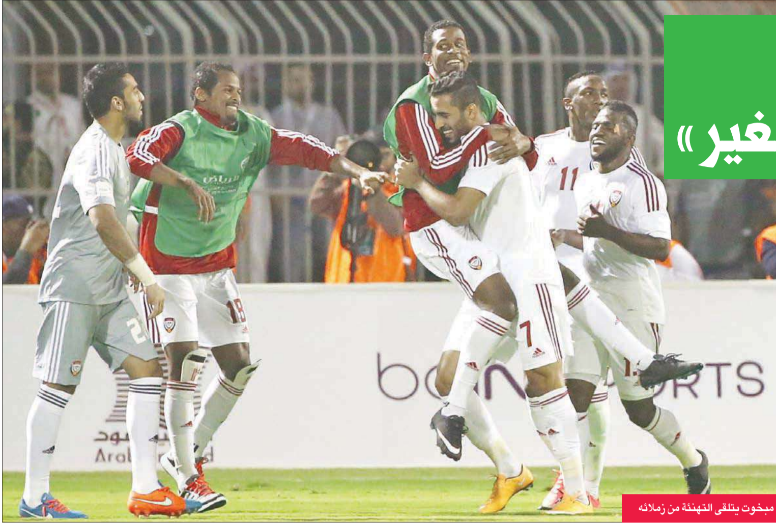
مبخوت يتلقى التهنية من زملائه

حقيقيا للإمارات، لكن بعد الفوز على العراق يبدو أن الثقة بحامل اللقب أصبحت بلا حدود.