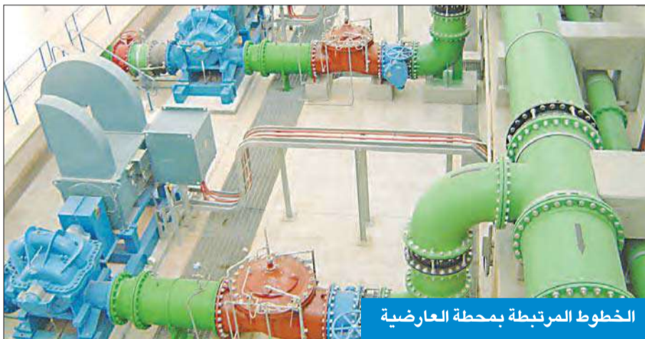
الخطوط المرتبطة بمحطة العارضية

«الأشغال»: 95% نسبة إنجاز «تأهيل محطة العارضية»