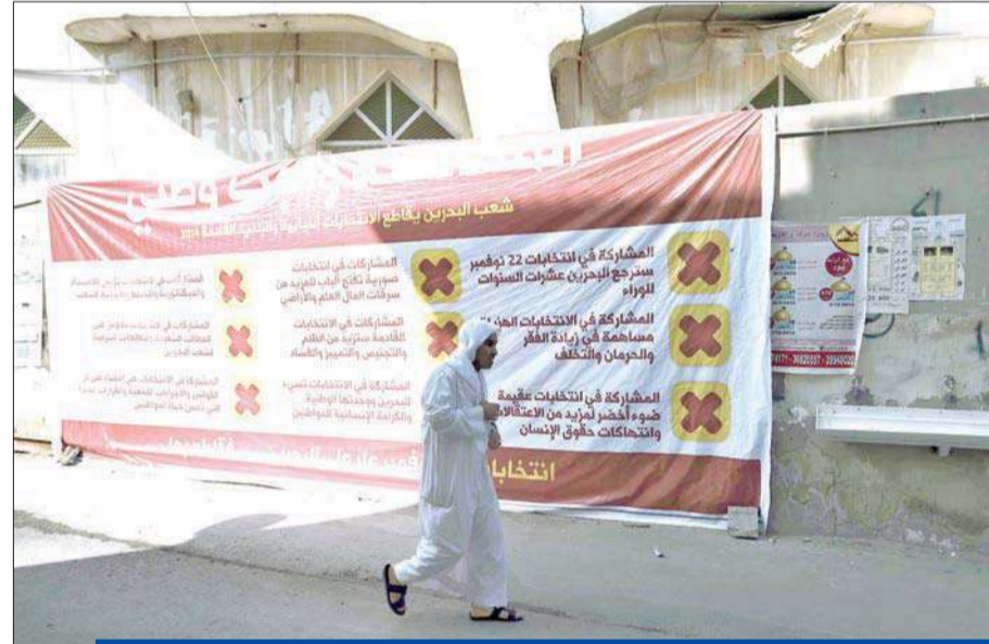
بحريني يمشي بجانب لوحة تدعو إلى مقاطعة الانتخابات غرب المنامة أمس

266 مرشحاً بينهم 15 امرأة يتنافسون على 40 مقعداً في 40 دائرة