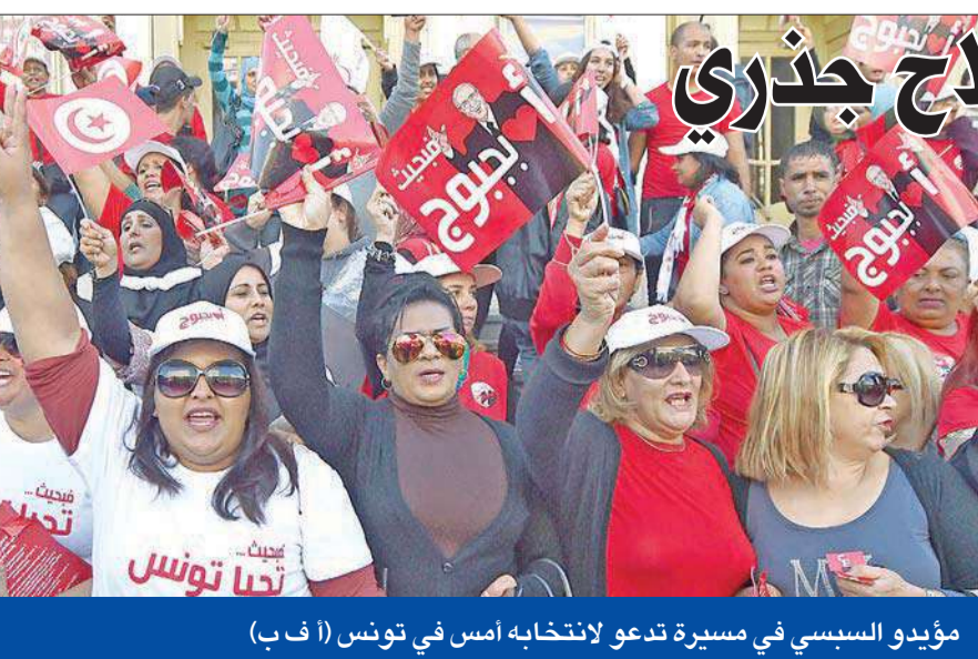
مؤيدو السبسي في مسيرة تدعو لانتخابه أمس في تونس

والانتخابات المقررة في تونس، يخوضها 22 مترشحاً بعد انسحاب 5 مرشحين، وإبراز المرشحين هم الرئيس