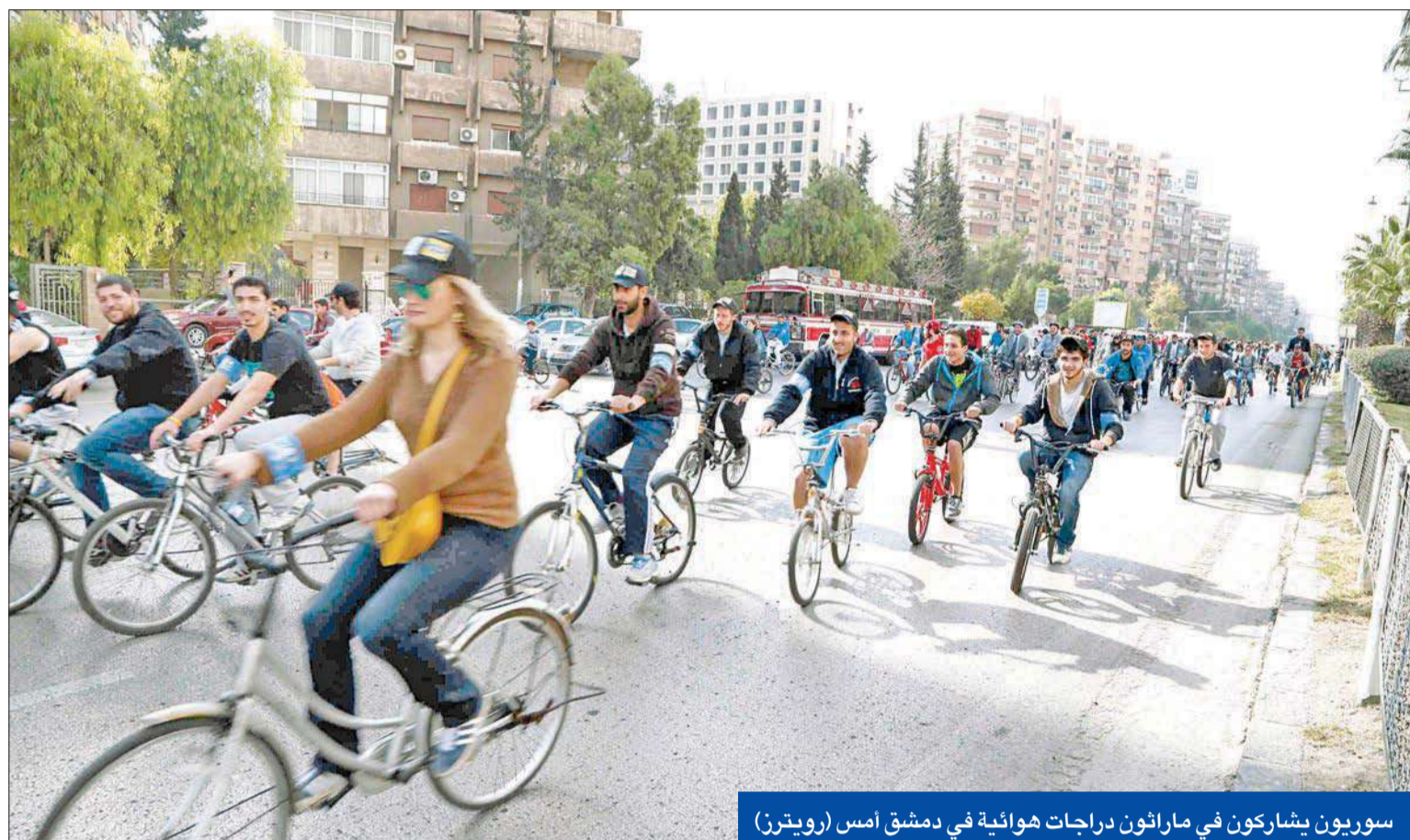
سوريون يشاركون في ماراثون دراجات هوائية في دمشق أمس

• فوردي وأبرامز: لا استراتيجية لهزيمة «داعش» والغارات تخدم دمشق • حملة عسكرية شرسة على حي جوبر