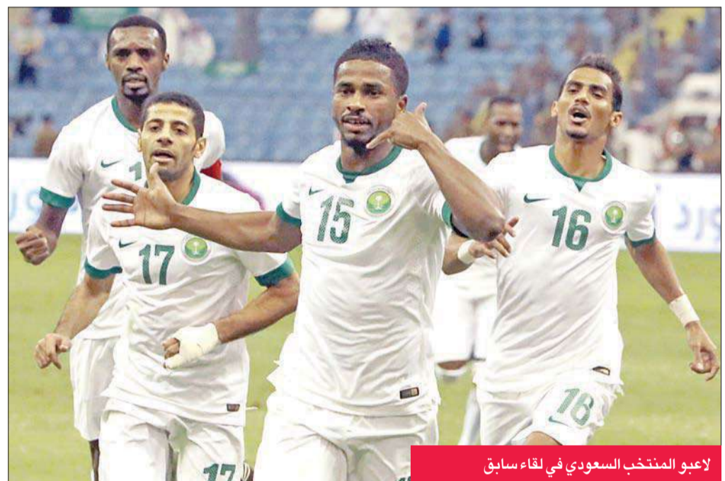
لاعب المنتخب السعودي في لقاء سابق

تاهل المنتخب القطري بثلاثة تعادلات وسجل هدفاً واحداً فقط، وهو أمر بدأ من مدربه