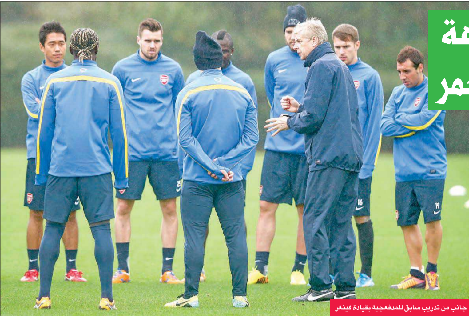
جانب من تدريب سابق للمدفعية بقيادة فينغر

تتجه أنظار محبي الدوري الإنكليزي إلى متابعة مباراة مانشستر يونايتد مع الأرسنال، ضمن منافسات المرحلة الثانية عشرة من عمر الدوري.