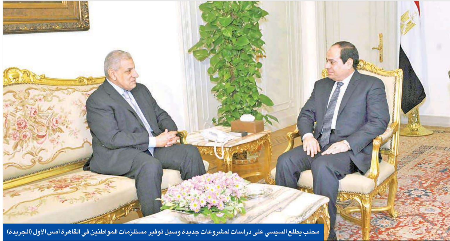
محلب يطلع السيسي على دراسات لمشروعات جديدة وسبل توفير مستلزمات المواطنين في القاهرة أمس الأول

القاهرة نشاطاً في ملف العلاقات الخارجية، فبينما يلتقي الرئيس عبدالفتاح السيسي برئيس جمهورية جنوب السودان، يبدأ رئيس وزراء كوريا الجنوبية تشونغ هونغ وون زيارة رسمية للقاهرة اليوم يلتقي خلالها نظيره إبراهيم محلب لمناقشة سبل تعزيز التعاون الاقتصادي بين كوريا الجنوبية أحد أكبر اقتصاديات جنوب شرق آسيا، ومصر، وسبل تعزيز مشاركة الشركات الكورية في المشروع النووي المستقبلي لمصر. وفي حين أكدت الخارجية الروسية، أن الرئيس فلاديمير بوتين سيزور القاهرة مطلع العام المقبل، يبدأ السيسي جولة أوروبية منتصف الأسبوع الجاري، حيث يزور دولتي إيطاليا وفرنسا، في الفترة من الاثنين إلى الخميس المقبل، تتضمن بحث العلاقات الثنائية ومجممل الملفات ذات الاهتمام المشترك خاصة ملف مكافحة الإرهاب.