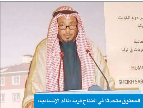
المعتوق متحدثا في افتتاح قرية «قائد الإنسانية»

وأعرب عن أمه في استمرار العلاقات الطيبة بين البلدين في جميع المجالات، خصوصا التعاون الإنساني بين مؤسستي الإغاثة في الكويت وتركيا. من جهته، قدم رئيس مؤسسة الإغاثة الإنسانية التركية بولند يلديريم خالص شكره لسمو أمير البلاد وحكومة الكويت وشعبها على مساهمتهم في إيواء متضرري زلزال (وان)، التي يقطنها مواطنون أتراك وأكراد.