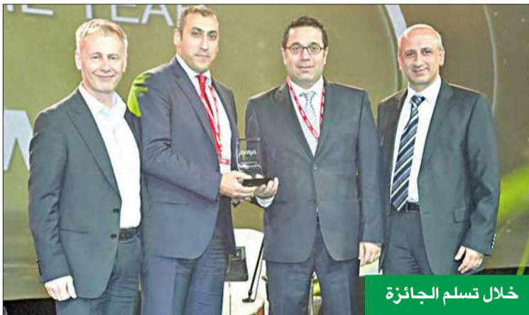
خلال تسلم الجائزة

على فهم متطلبات العملاء الدقيقة وتحديد حلول الاتصالات التي تحقق النمو في مجال الأعمال وتساعد العملاء على التغلب على التحديات التي يواجهونها، فضلاً عن قياس النتائج والاستمرار في عملية التواصل، وهذا النموذج في العمل يتمحور حول الخدمات المرتكزة على القيمة، وقد ساعدنا على تحقيق النمو وكسب الثقة وضمان استمرار العمل لقاعدة العملاء المذهلة في هذا البلد».