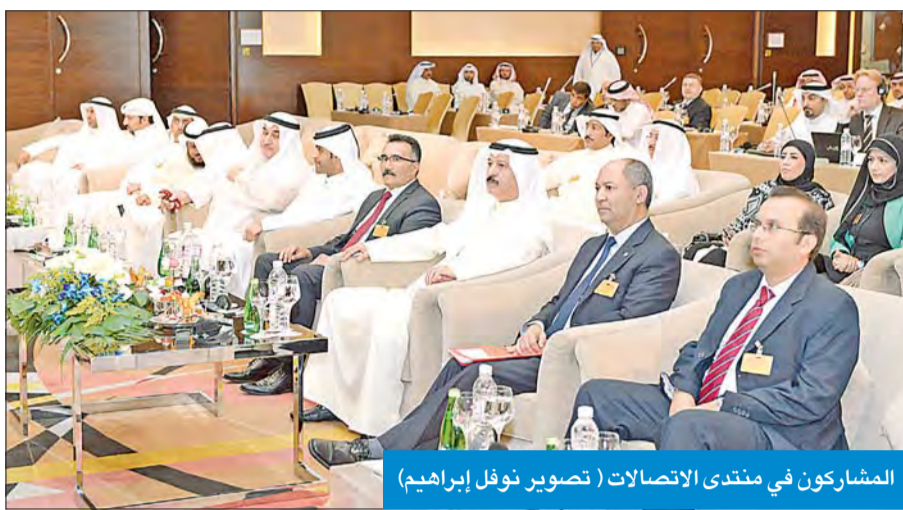
المشاركون في منتدى الاتصالات

هناك موكبة لعالم الاتصالات الذي يتطلب كفاءات وخبرات معينة قد تكون غير متوفرة في الموظفين الحاليين، ونأمل أن يكون للذين تم الاستغناء عنهم مجال أفضل في شركات أخرى، مؤكداً ان «الرقابة موجودة من قبل الوزارة وكان لنا دور فعال في الأمور المتعلقة بإعادة الهيكلة لإحدى الشركات مؤخراً».