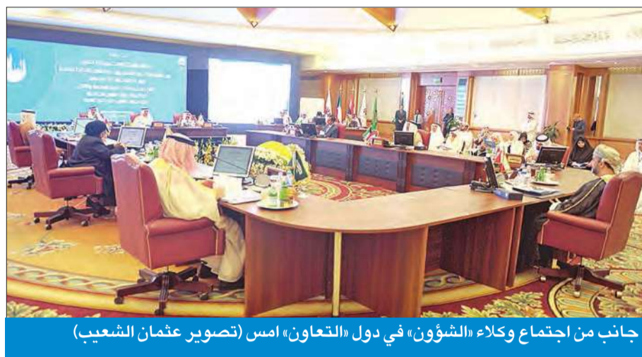
جانب من اجتماع وكلاء «الشؤون» في دول «التعاون» أمس

● المطيري: قطر دعت لاستضافة الاجتماع المقبل ● الجاسم: تحية إكبار و عرفان لسمو الأمير قائد العمل الإنساني