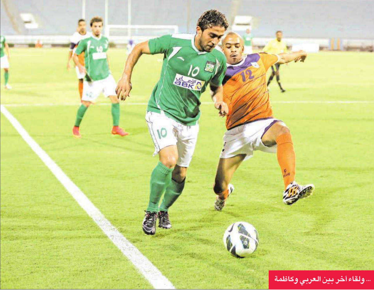
... ولقاء آخر بين العربي وكاظمة