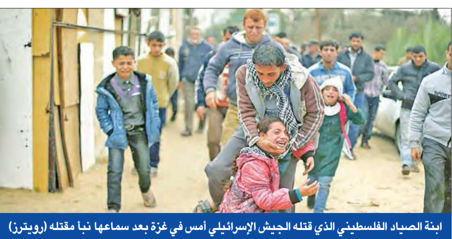
ابنة الصياد الفلسطيني الذي قتله الجيش الإسرائيلي أمس في غزة بعد سماعها نيا مقتله

تل أبيب تقتل فلسطينياً في غزة وتسحب الهوية المقدسية من منفذ هجوم