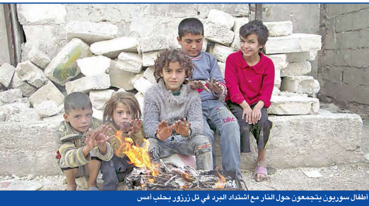
اطفال سوريون يجتمعون حول النار مع اشتداد البرد في تل زرزور بحلب أمس

وأوضح المرصد أن «النصرة» أحرزت تقدماً عند الأطراف الجنوبية للزهراء، مؤكداً وقوع خسائر بشرية في صفوف الطرفين، بينهم ثمانية مقاتلين معارضين،