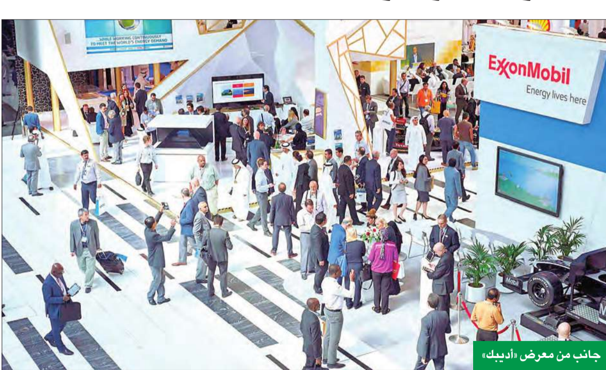
جانب من معرض «أديك»

وأضاف الإبراهيم أن الشركة واصلت تطوير رصدها السنوي لمناخ الاستثمار في الدول العربية، بتصميم مؤشر دولي جديد يرصد قدرات الدول العربية ودول العالم في مجال جذب الاستثمار الأجنبي المباشر عبر متابعة مجموعة كبيرة من المتغيرات الاقتصادية والاجتماعية والمؤسسية. وقال الإبراهيم، في المؤتمر الذي عقد تحت عنوان «الاستثمار في مصر: استثمار في المستقبل»، إن المؤشر كشف عن استقرار المنطقة العربية وفق تقرير عام 2014 في المرتبة الرابعة عالمياً بعد مجموعة دول منظمة التعاون الاقتصادي والتنمية ودول شرق آسيا والمحيط الهادئ ودول أوروبا وآسيا الوسطى، ومقدمة عن مجموعة دول أمريكا اللاتينية والكاريبي ودول جنوب آسيا ودول أفريقيا. وأشار إلى أن المؤسسة أصدرت مجموعة من التوصيات التفصيلية المستندة إلى هذا الرصد الدقيق في تقريرها السنوي لمناخ الاستثمار لعام 2014، موزعة على 4 مجموعات جغرافية عربية رئيسية رغبة منها في مواصلة عملها المشترك مع الحكومات العربية لتحسين مناخ الاستثمار وإزالة