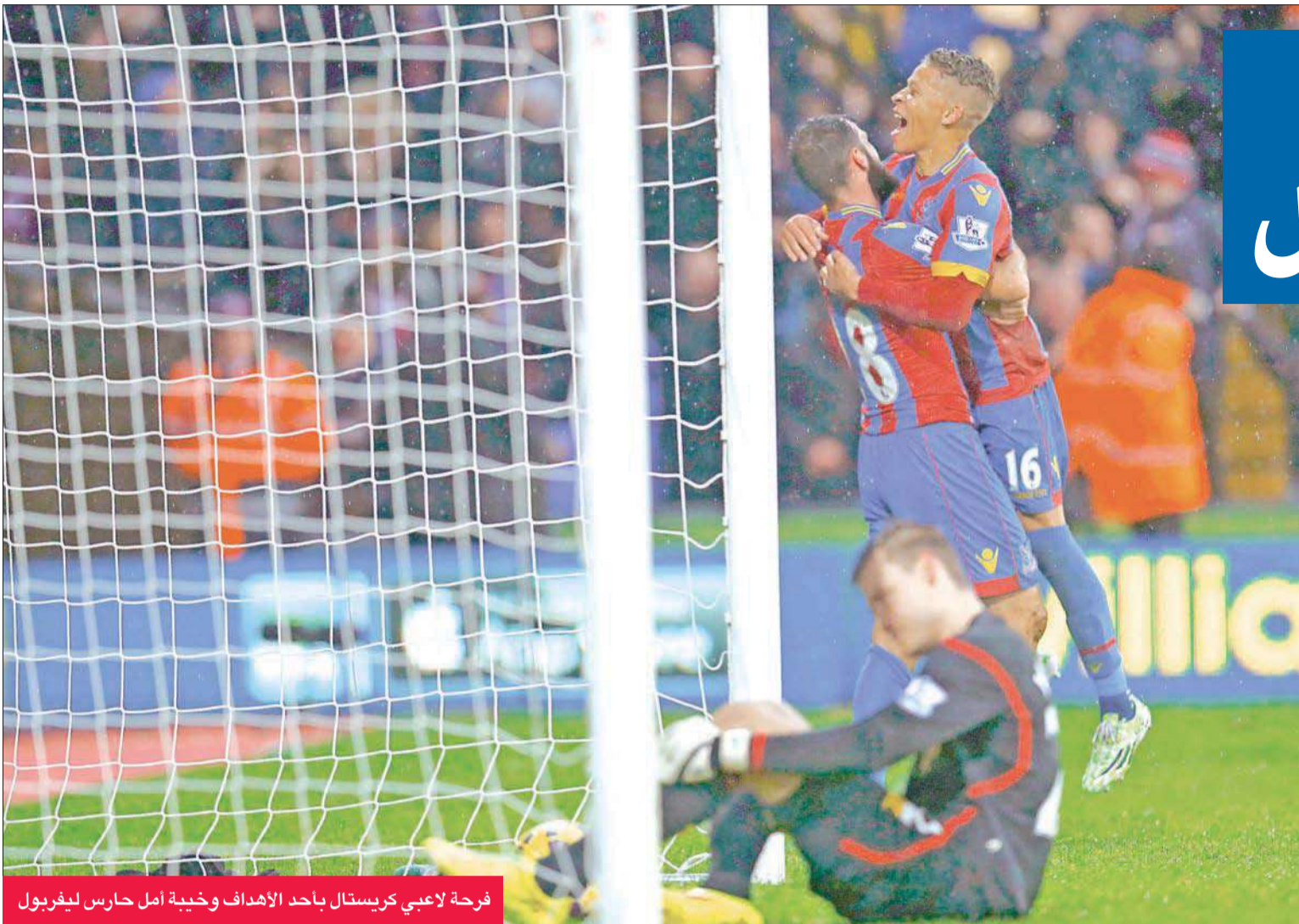
فرحة لاعبي كريستال بأحد الأهداف وخيبة أمل حارس ليفربول

ومن "مرتدة مماثلة"، أهدر دي ماريا لاعب ريال مدريد الإسباني السابق فرصة الهدف