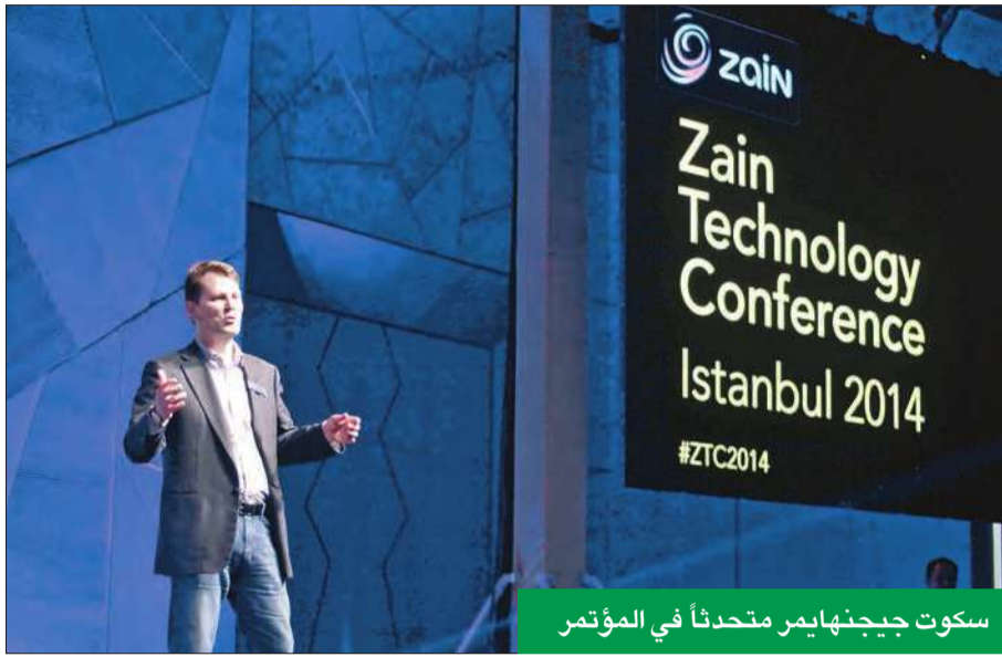
سكوت جيجنهايمر متحدثاً في المؤتمر

فإن المؤتمر شهد أيضاً انعقاد العديد من الأنشطة ذات الصلة والتي شارك فيها مسؤولو الشركات التابعة لمجموعة زين، وتعبيراً عن الإمتنان للدعم والإهتمام الذي تلقتة، فإن مجموعة زين - بالتعاون مع شركائها التكنولوجيين، اختتمت مؤتمرها بحفل لتقديم الجوائز، لتكريم أفضل الجهود التي بذلها ممثلو زين وممثلو الشركاء التكنولوجيين على حد سواء خلال مدة المؤتمر.