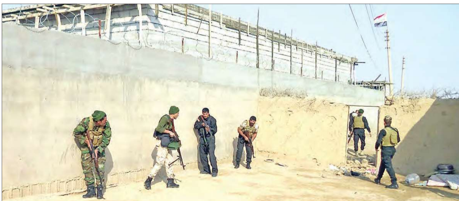
عناصر أمنية عراقية خلال معارك مع تنظيم «داعش» في صلاح الدين أمس