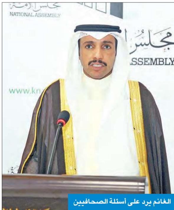
الغانم يرد على أسئلة الصحفيين

الطريجي يقدم استجوابه لوزير التجارة والصناعة من 4 محاور