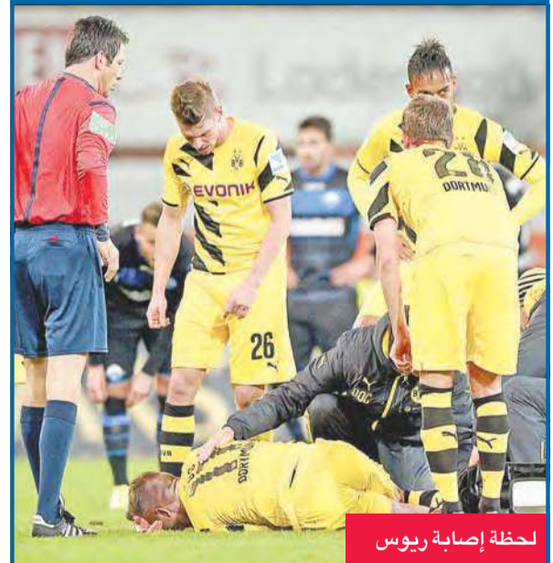
لحظة إصابة ريوس

ينتظر نادي بوروسيا دورتموند لاكتشاف الفترة التي سيفتقد خلالها نجم خط وسطه الدولي ماركو ريوس الذي يشتبه في تعرضه لتمزق في أربطة الكاحل خلال المباراة أمام بادربورن أمس الأول في الدوري الألماني لكرة القدم.