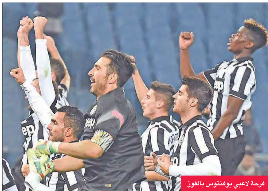
فرحة لاعبي يوفنتوس بالفوز

ورفع روما رصيده إلى 28 نقطة وتساوى نقاطا مع يوفنتوس حامل اللقب في الموسم الثلاثة السابقة، الذي يلعب لاحقاً اليوم في ضيافة فريق العاصمة الثاني لاتسيو الخامس، بينما بقي اتالانتا في المركز السابع عشر وله 10 نقاط.