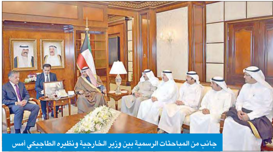
جانب من المباحثات الرسمية بين وزير الخارجية ونظيره الطاجيكي أمس

وأضاف الجاسم أنه سيكون في استقبال الأدميرال ميلر ومرافقيه كل من سفير الكويت