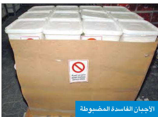
الأجبان الفاسدة المضبوطة