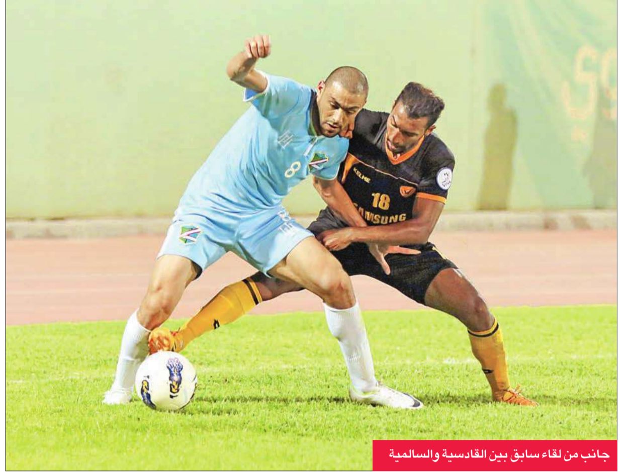
جانب من لقاء سابق بين القادسية والاسلامية