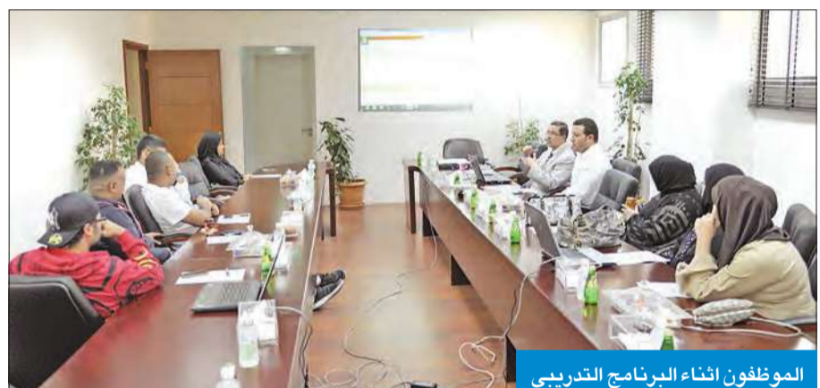
الموظفون اثناء البرنامج التدريبي

سيكون على فترتين: الأولى من التاسعة صباحاً حتى العاشرة والنصف، وهي مخصصة لتدريب الموظفين على نظام إصدار تراخيص الإعلانات، أما الفترة الثانية من العاشرة والنصف حتى الثانية عشرة ظهراً فهي مخصصة لتدريب الموظفين على نظام إصدار التراخيص الصحية إلكترونياً.