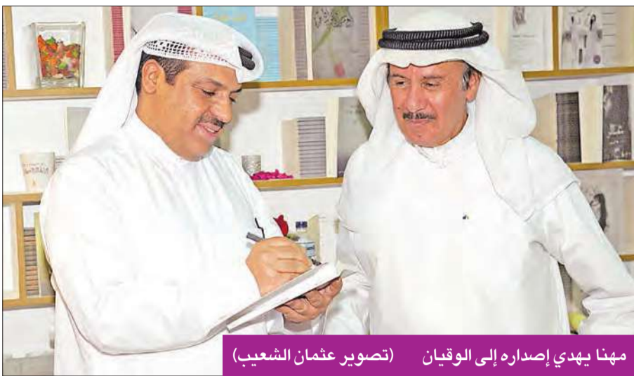
مهنا يهدي إصداره إلى الوقيان

من جانب آخر، أبدى مهنا استغرابه من استسهال دور