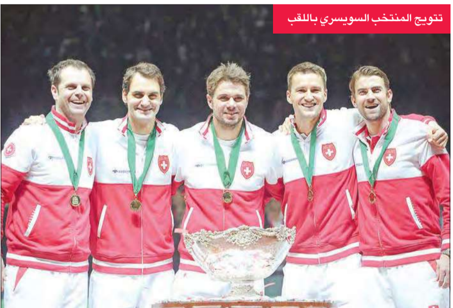
تتويج المنتخب السويسري باللقب

أهدى النجم السويسري روجيه فيدرر، إلى منتخب بلاده لقبه الأول في مسابقة كأس ديفيس لكرة المضرب، وذلك بعد فوزه على الفرنسي ريشار غاسكيه 4-6 و2-6 في اليوم الثالث من الدور النهائي امس في فيلنوف داسك. وهو الفوز الثالث لسويسرا بعد الأول في اليوم الأول عندما تغلب ستانيسلاس فافرينكا على جو ويلفريد تسونغا 6-1 و3-6 و2-6 امس الأول الجمعة، والثاني في مباراة الزوجي عندما تغلب فيدرر وفافرينكا على ريشار غاسكيه وجوليان بينيتو 3-6 و7-5 و4-6 امس الأول في اليوم الثاني. وعوض فيدرر خسارته امام غايل مونفيس 6-1 و4-6 و3-6 في مباراة الفردي الثانية في اليوم