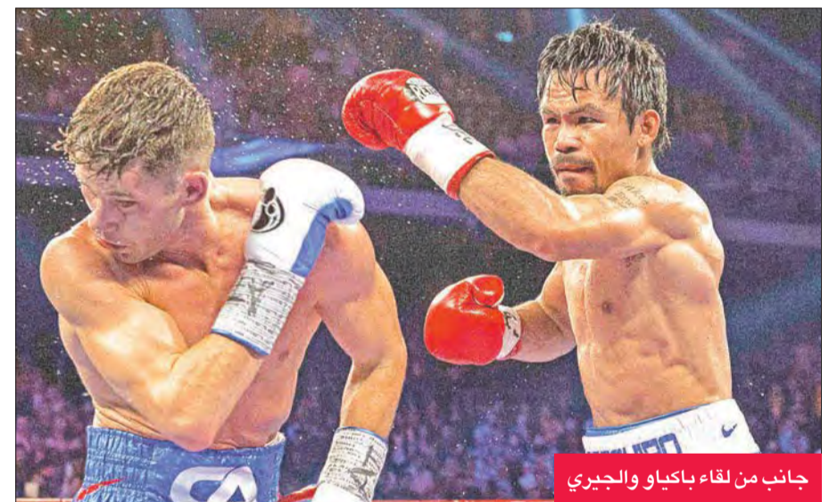
جانب من لقاء باكيو والجيري

نيويورك تعرض لإصابات بالغة، ولكنه تحامل على نفسه وأكمل المباراة، قبل أن يسقطه باكيو مجددا في غضون ثوان معدودة. ووصف الجيري باكيو بعد المباراة بأنه "أفضل ملاكم في العالم". وأضاف "الأمر لا يتعلق فقط بسرعة اللكمات، إنه ملاكم رائع، يفعل كل شيء بشكل مثالي، ماني لديه أسلوب مثالي في الملاكمة، لم أصب بأذى مطلقا، ولكني تلقيت لكمة غاية في القوة واحدة تلو الأخرى".