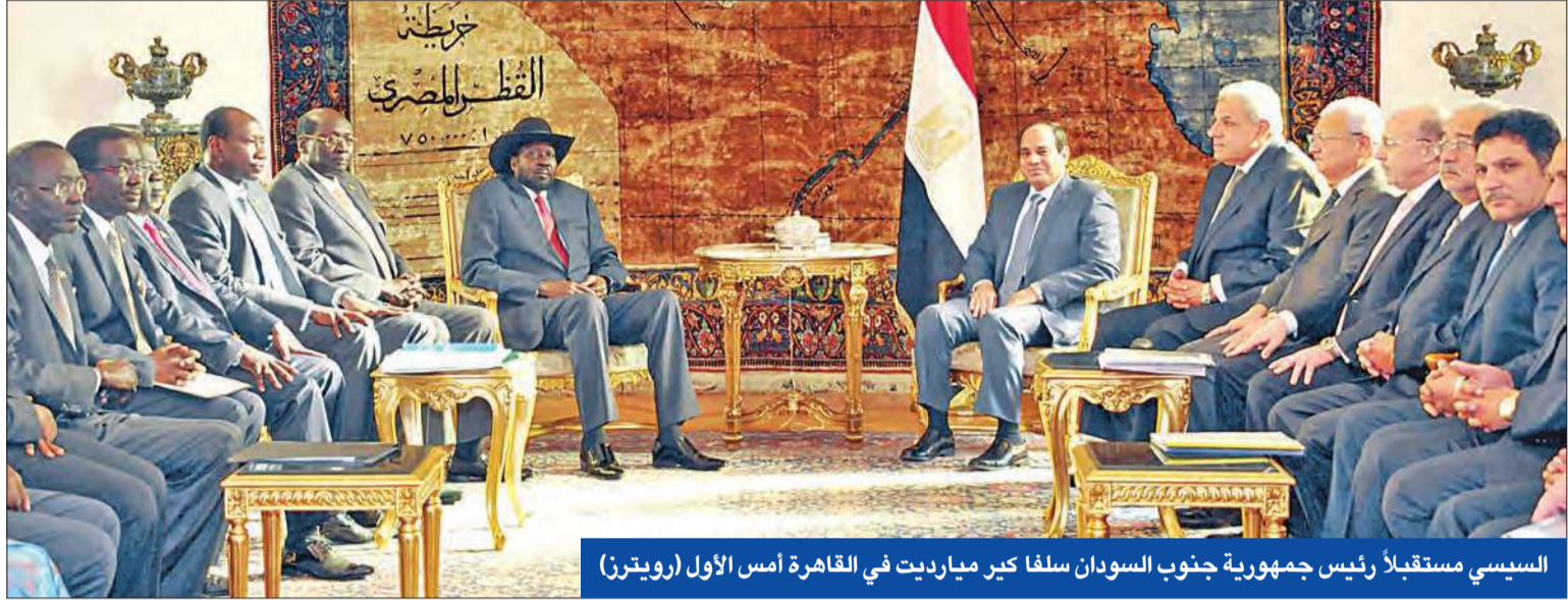
السيسي مستقبلاً رئيس جمهورية جنوب السودان سلفاً كبير ميارديت في القاهرة أمس الأول

اسم (الشباك الواحد)، لاختصار الوقت والجهد على المستثمرين. من جانبه، قال المتحدث باسم الرئاسة المصرية في بيان عقب الاجتماع، إن السيسي شد أيضاً على إمكانية تسوية مشكلات المستثمرين ودياً دون الحاجة إلى اللجوء لإجراءات قضائية طويلة ومعقدة، وأشار إلى أن الأمين العام للجامعة العربية نبيل العربي تناول خلال اللقاء جهود الجامعة، لتعزيز التعاون الاقتصادي بين الدول العربية، والتسهيل لإنشاء المنطقة العربية للتجارة الحرة ثم الاتحاد الجمركي. وقال إن الحضور أكدوا أهمية الاستفادة من اتفاقيات التجارة الحرة التي وقعتها مصر في إطار القارة الإفريقية في ضوء ما تتخذه من إعفاءات ومعاملة تفضيلية. ولفت إلى أن المستثمرين السعوديين المشاركين في الاجتماع أشاروا إلى زيارة قاموا