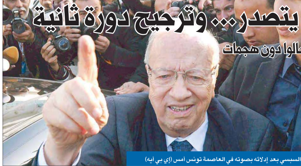
السبسي بعد إدلائه بصوته في العاصمة تونس أمس

نسبة المشاركة تتخطى 53%... و100 ألف عسكري حالوا دون هجمات