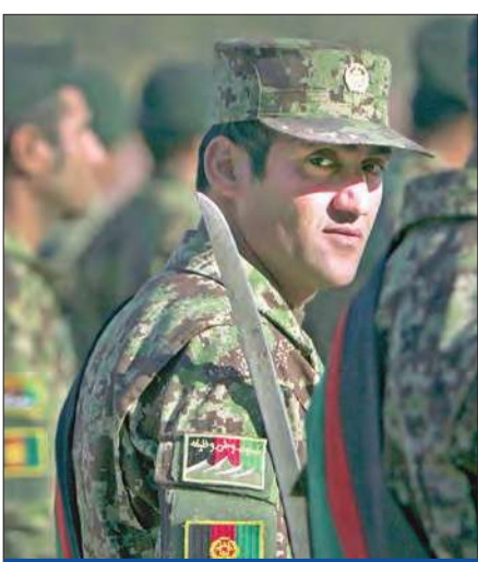
جندي أفغاني خلال حفل لتخريج جنود في كابول أمس

وأوضحت الرئاسة ان غاني وصف «المرحلة بأنها ايجابية من اجل تعزيز سيادة افغانستان الوطنية». وبعد مرور 13 سنة على إطاحة نظام طالبان في 2001، تنسحب قوات الحلف الاطلسي من البلاد تاركة مهمة الامن بأيدي قوات الجيش والشرطة الافغانية. (كابول - أ ب، رويترز)