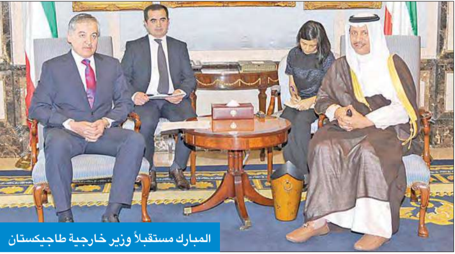
المبارك مستقبلاً وزير خارجية طاجيكستان

استقبل سمو رئيس مجلس الوزراء الشيخ جابر المبارك، بحضور النائب الأول لرئيس مجلس الوزراء وزير الخارجية الشيخ صباح الخالد في قصر السيف أمس، وزير خارجية جمهورية طاجيكستان سراج الدين أصلوف، والوفد المرافق