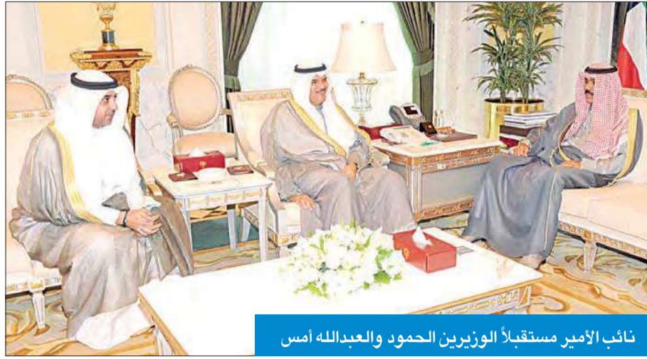
نائب الأمير مستقبلاً الوزيرين الحمود والعبده الله أمس

استقبل سمو نائب الأمير ولي العهد الشيخ نواف الأحمد صباح أمس، رئيس مجلس الوزراء الأمير جابر المرزوق الغانم، واستقبل سموه أيضاً، سمو رئيس مجلس الوزراء الشيخ جابر المبارك، واستقبل سمو نائب الأمير ولي العهد، النائب الأول لرئيس مجلس الوزراء وزير الخارجية الشيخ صباح الخالد، ووزير خارجية جمهورية طاجيكستان سراج الدين أصلوف، والوفد المرافق له، وذلك بمناسبة زيارته للبلاد.