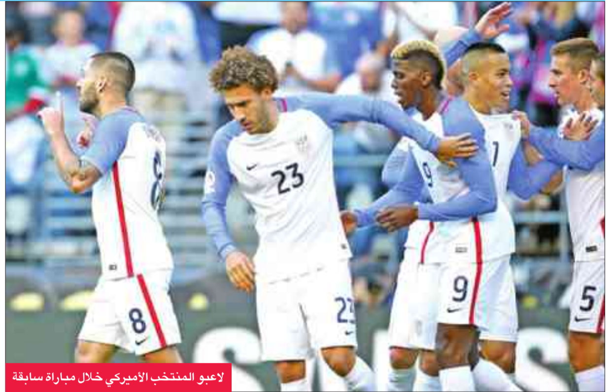
لاعبو المنتخب الأمريكي خلال مباراة سابقة

وتابع: "لدي انطباع بأن الناس يعتقدون أن وصولنا إلى مباراتين نهائيتين على التوالي أمر طبيعي، وأنهم لا يركزون سوى على خسارتنا فيهما". وأضاف أن "التأهل لنصف النهائي مجدداً في بطولة كبرى بعد إنجاز كبيراً لهؤلاء اللاعبين".