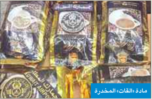
مادة «القات» المخدرة

أحبط رجال الإدارة العامة للجمارك، إدارة جمارك المطار الدولي، مساء امس الأول، محاولتي تهريب لمواد مخدرة في قضيتين منفصلتين؛ الأولى تمثلت في محاولة مسافر مصري تهريب 3 آلاف حبة مخدرة جلبها من بلده، في حين كانت القضية الثانية عبارة عن محاولة خادمتين إثيوبيتين تهريب 6 كليوغرامات من مادة القات المخدرة.