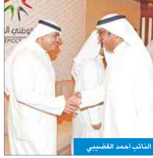
النائب أحمد الغضبي