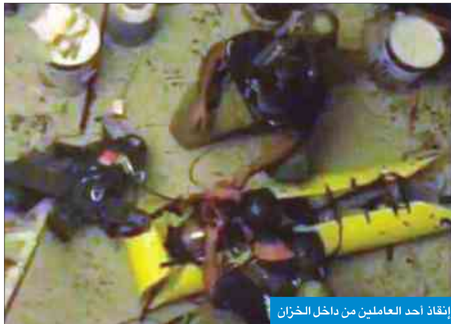
إتقاد أحد العاملين من داخل الخزان

ضمن جهود وزارة الداخلية في تنظيم الحالة المرورية بالشوارع والطرق الرئيسية وردع المخالفين من قاضي المركبات، وتعليمات من وكيل وزارة الداخلية المساعد لشؤون المرور اللواء عبدالله المهنا، وتحت إشراف رئيس قسم الرقابة والتنسيق العقيد منيف ساري، تم تنفيذ حملة مرورية مفاجئة على بعض الطرق الرئيسية. حيث قامت دوريات قسم الرقابة والتفتيش التابعة لقطاع المرور بتنفيذ حملة مرورية على الدائري الثاني وشارعي دمشق والخليج العربي، لفرص الانضباط المروري وأسفرت الحملة عن ضبط 23 مخالفاً، بتهمة الاستهتار والرعونة، إذ قاموا بعمل سباق بدون تصريح، وتمت إحالتهم إلى نظارة المرور، فيما تم حجز 120 مركبة مخالفة، وإحالتهم إلى كراج الحجز.