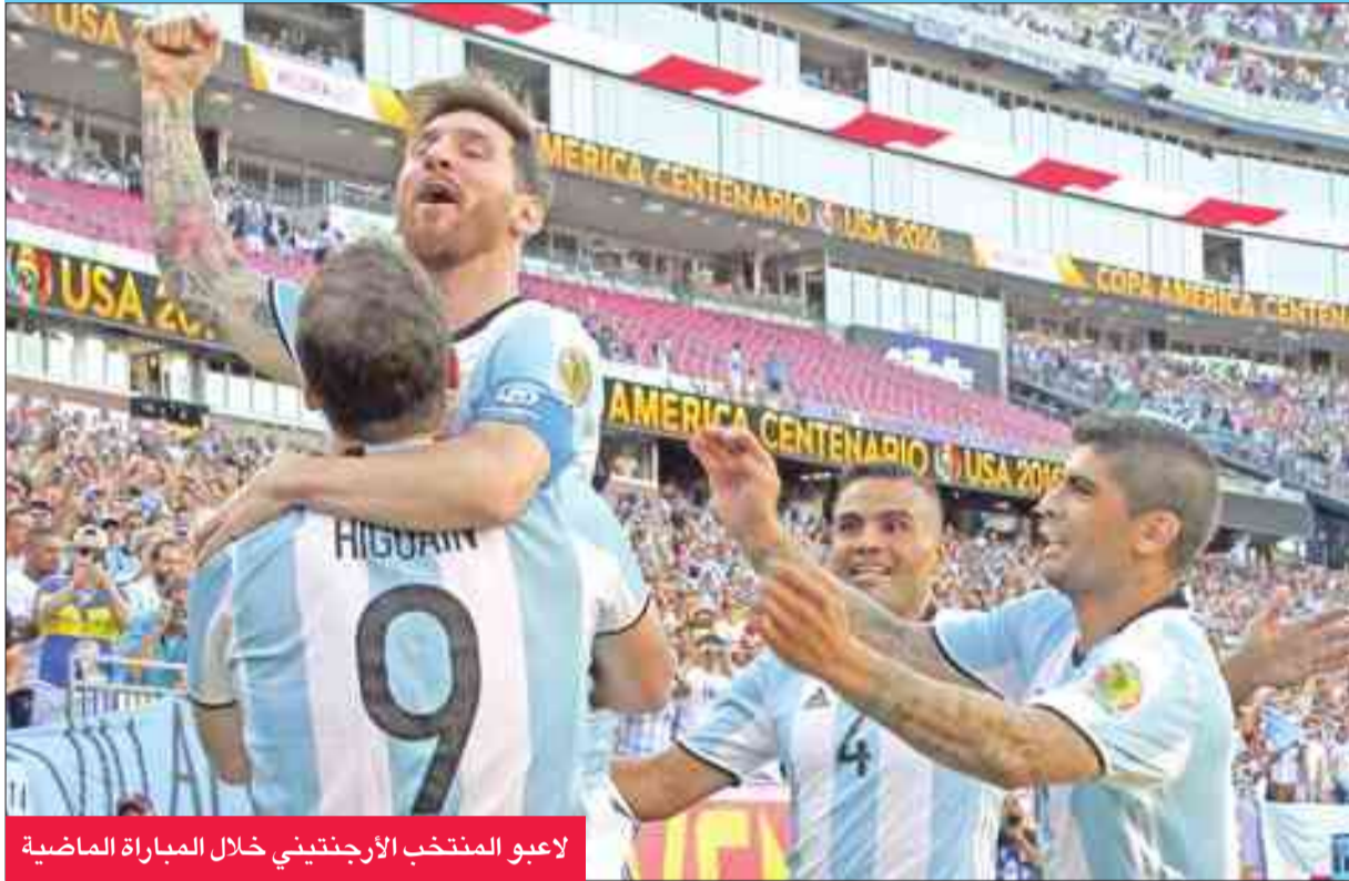
لاعبو المنتخب الأرجنتيني خلال المباراة الماضية