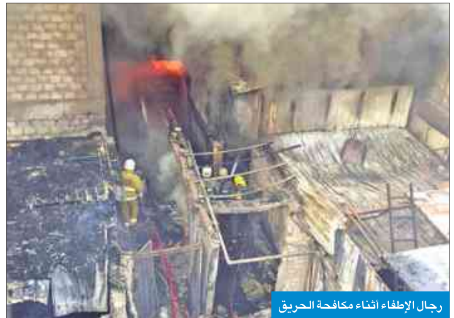
رجال الإطفاء أثناء مكافحة الحريق