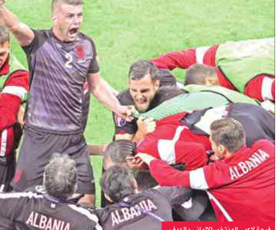
فرحة لاعبي المنتخب الألباني بالهدف

وكانت أولى المباريات الدولية لديشان مع الفريق في 29 أبريل 1989، عندما تعادل الفريق مع