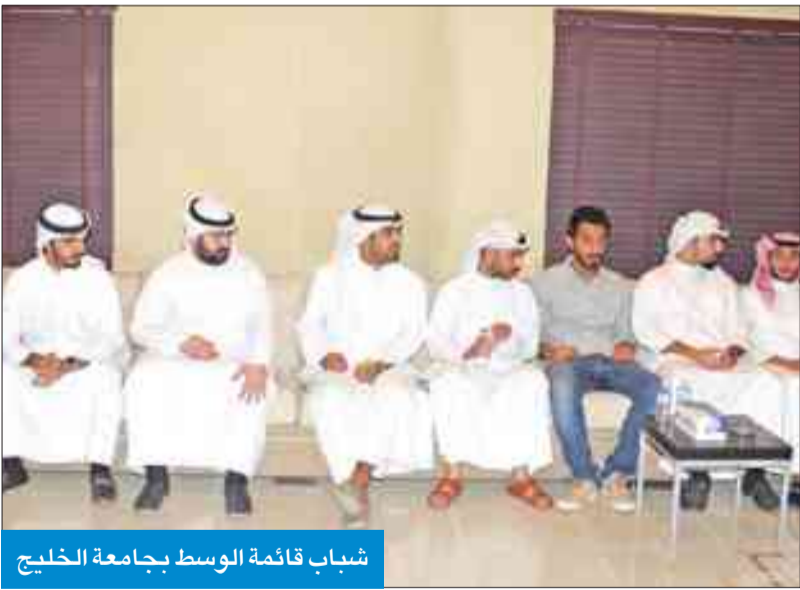
شباب قائمة الوسط بجامعة الخليج