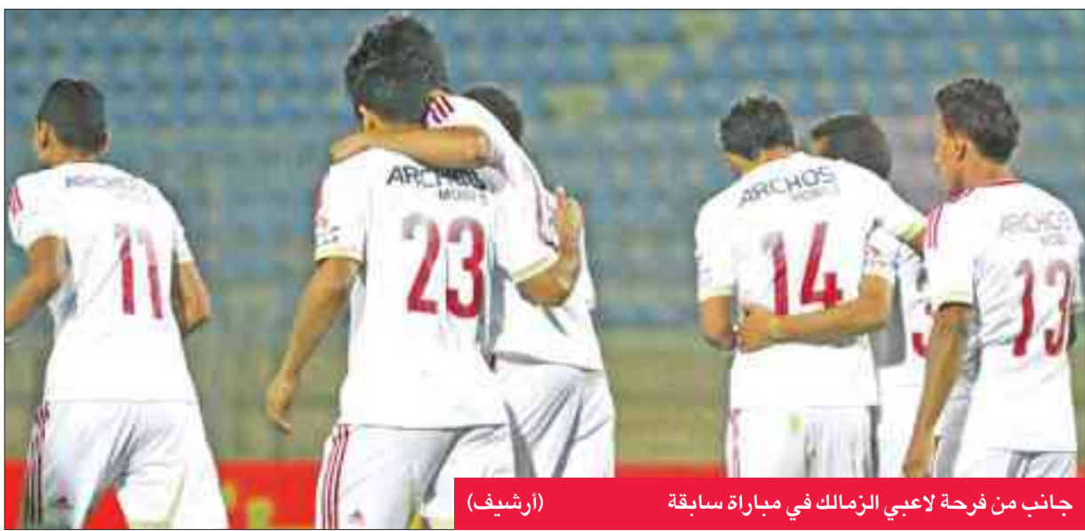
جانب من فرحة لاعبي الزمالك في مباراة سابقة (أرشيف)

إلى ذلك، أكد إسماعيل يوسف رئيس جهاز الكرة، أن فوز الزمالك على نيجيريا دليل على عودة الأبيض لمكانته الطبيعية في القارة السمراء، وأن الفريق لن يتهاون في مبارياته المقبلة، لمواصلة الانتصارات.