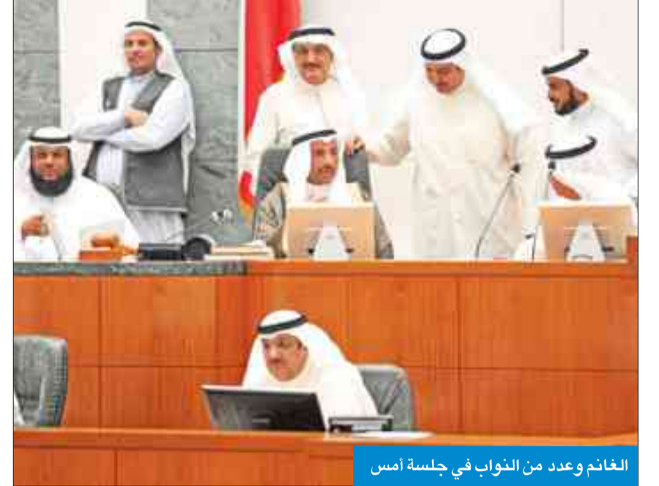
الغانم وعدد من النواب في جلسة أمس

سجلوا خسائر 33 مليون دينار وحصلوا على مكافآت بقيمة 5 ملايين دينار، مؤكداً أن هيئة الشراكة يعمل بها 63 موظفاً حصلوا على مكافآت بقيمة 311 ألف دينار.