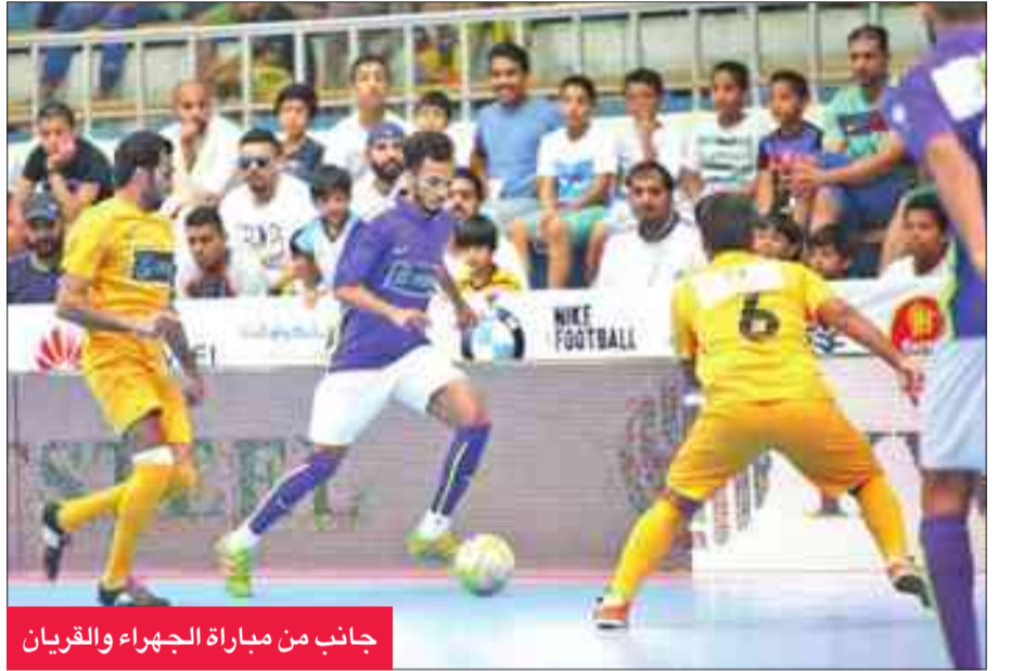
جانب من مباراة الجهراء والقريان