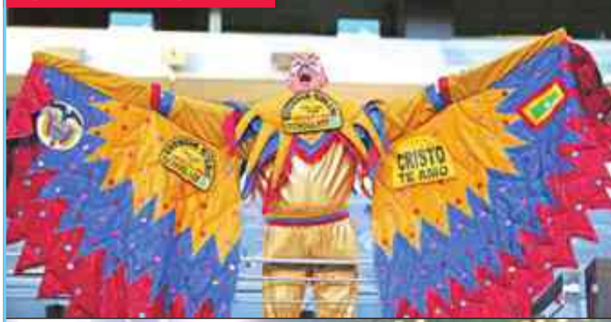
أحد مشجعي المنتخب الكولومبي

وأردف أن المنتخب الأرجنتيني "من أفضل المنتخبات في العالم"، كما يضم بين صفوفه النجم الكبير ليونيل ميسي، "لكن كل شيء من الممكن أن يحدث".