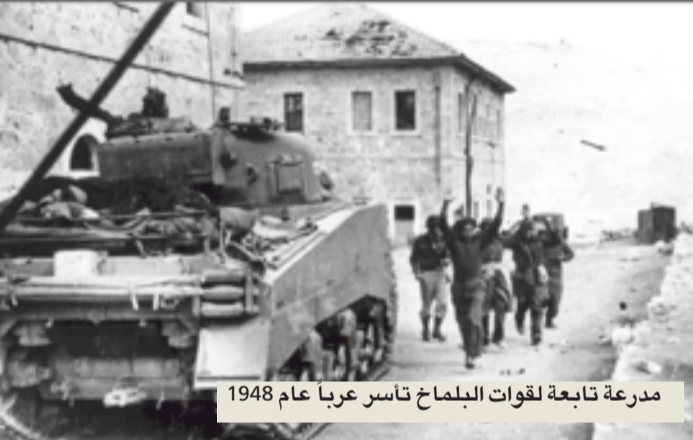
مدرسة تابعة لقوات البلماخ تأسر عرباً عام 1948

خطت لتفجير المسجد الأقصى في سبعينيات القرن العشرين، وكعادة اليهود في استغلال كل شيء تجارياً، تم تحويل موقع قلعة الماسادا إلى مزار سياحي لتتحقق منافع اقتصادية، ويحتل هذا المقصد رهنماً المرتبة الثانية كاشهر موقع أترى سياحي في إسرائيل بعد حائط البراق، الذي يسميه الإسرائيليون حائط المبكى. وأعاد سلاح المهندسين في الجيش الإسرائيلي ترميم القلعة عام 1971، وتم تشغيل قطار هوائي من الجانب الشرقي للجليل، واستطاعت إسرائيل بدعم غربي إخراج القلعة على لأحثة اليونسكو للتراث العالمي، وذلك عام 2001.