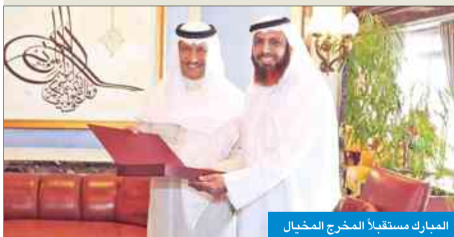
المبارك مستقبلاً المخرج المخيال

استقبل سمو الشيخ جابر المبارك رئيس مجلس الوزراء، بحضور النائب الأول لرئيس مجلس الوزراء وزير الخارجية الشيخ صباح الخالد في قصر السيف أمس، الأمين العام لجامعة الدول العربية نبيل العربي والوفد المرافق له، وذلك بمناسبة زيارته للبلاد. واستقبل سموه المخرج عبدالله المخيال، حيث أهدى سموه نسخة من الفيلم الوثائقيين "شيخ العطش" و"ركائب الصحراء" اللذين قام بإعدادهما وإنتاجهما.