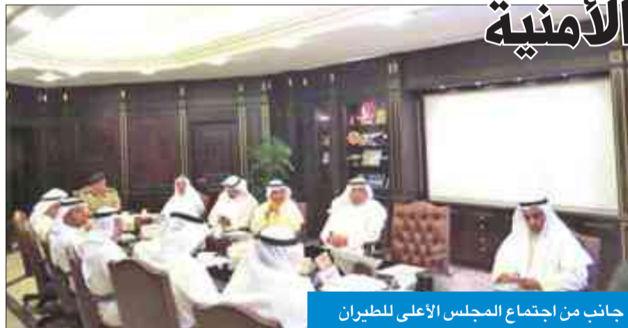
جانب من اجتماع المجلس الأعلى للطيران

أن «المجلس اطلع أيضاً على الخطط التشغيلية الجديدة التي وضعتها شركة الخطوط الجوية الكويتية خلال الفترة المقبلة».