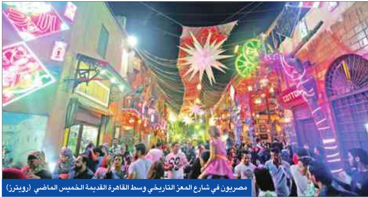
مصريون في شارع المعز التاريخي وسط القاهرة القديمة الخميس الماضي

● 25 ألف دولار دفعة أولى لذوي ضحايا «المنكوبة» ● المحققون ينهون إصلاح «الأسودين»