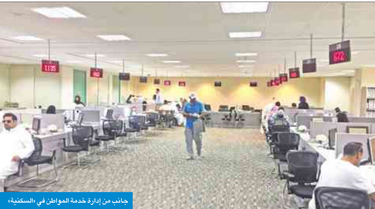
جانب من إدارة خدمة المواطن في «السكنية»

وأشارت المصادر إلى أن الآلية الجديدة قد تتسبب بتأخير المعاملات من يوم إلى أسبوع، إلا أنها الدرغ الحصينة للمال العام، ولفتت إلى أن ضوابط مجلس الوزراء تجاه هذا الشأن وصلت إلى الاكتفاء باستعادة 10 في المئة من راتب الموظف على الآ يتجاوز 150 ديناراً كحد أقصى فقط، الأمر الذي يتم سداده