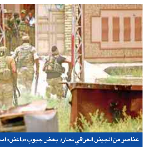
عناصر من الجيش العراقي تطارد بعض جيوب «داعش» أمس

أعلنت وزارة الأمن الإيرانية، أمس، إحباط مخطط شيطاني وواحدة من أكبر مؤامرات الجماعات التكفيرية، لتنفيذ تفجيرات في العاصمة طهران ومدن أخرى في ذكرى ولادة السيدة خديجة الكبرى (10 رمضان). ونقلت وكالة أنباء الجمهورية الإسلامية الإيرانية (إرنا) عن الوزارة القول في بيان إنه «تم إحباط واحدة من أكبر المؤامرات الإرهابية الشيطانية للجماعات التكفيرية الوهابية التي كانت بصدد زرع عدد من القنابل في عمق البلاد في طهران وبعض المحافظات». وأضاف البيان أنه «تم خلال هذه العمليات إلقاء القبض على الإرهابيين الذين خططوا لضرب مراكز عديدة في البلاد في المناسبات الدينية الخاصة، كما تمت مصادرة عدد من المواد المتفجرة». وتابع أن التحقيقات جارية مع الإرهابيين، ومتواصلة داخل البلاد وخارجها، وسوف يتم الإعلان عن التفاصيل فور توافر الظروف الأمنية المناسبة». ونقلت وكالة الطلبة الإيرانية للأنباء نقلت أمس الأول عن الأمين العام لمجلس الأمن القومي على شمخاني قوله إن قوات الأمن اعتقلت أعضاء في خلية كانت تخطط لتنفيذ تفجيرات انتحارية خلال شهر رمضان في طهران، وأعلنت قوات الأمن الإيرانية الشهر الماضي القبض على عشرات من «التكفيريين» في شرق وغرب البلاد، وعلى أكثر من 50 أيضاً من المعتاطفين مع التنظيم الذين يروجون فكره عبر الإنترنت.