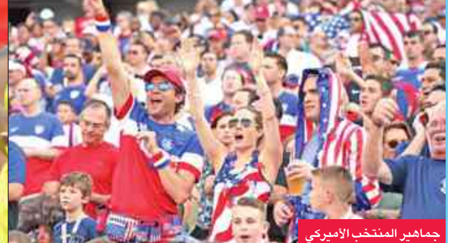
جماهير المنتخب الأمريكي