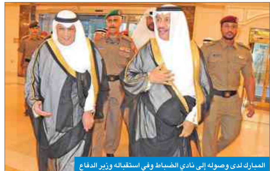
المبارك لدى وصوله إلى نادي الضباط وفي استقباله وزير الدفاع