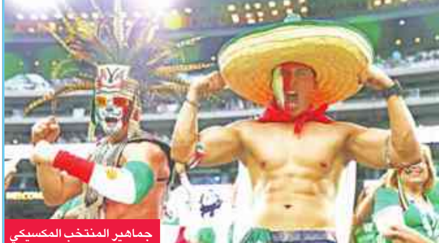
جماهير المنتخب المكسيكي