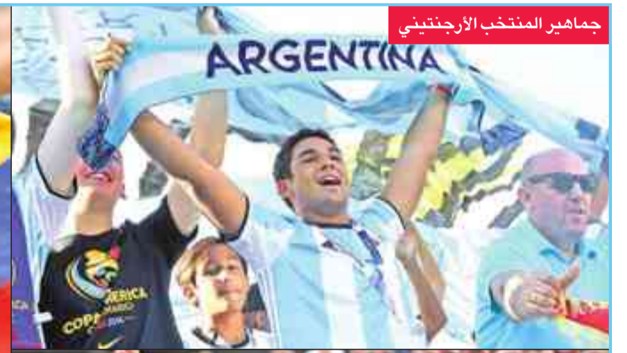
جماهير المنتخب الأرجنتيني