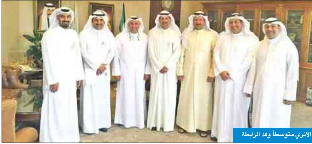
الأثري متوسطاً وفد الرابطة

بحثت مع الأثري المقاعد المخصصة للمدرسين في الفصل الصيفي