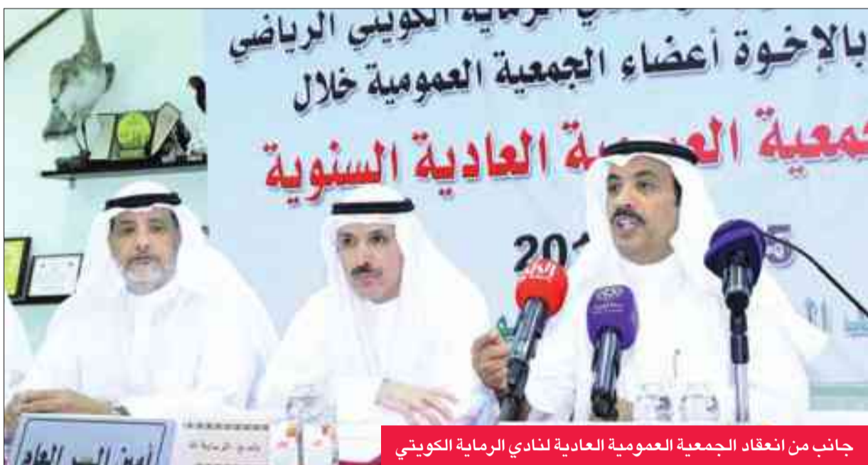
جانب من انعقاد الجمعية العمومية العادية لنادي الرماية الكويتي

انعكس بدعم حكومي كبير كان له أكبر الأثر في تحقيق الرماية الكويتية الكثير من الإنجازات، كان أبرزها تحقيق ميداليتين أولمبيتين للكويت، عبر الرامي فهد الديحاني، وهي كل حصاد الرياضة الكويتية أولمبيا، والعديد من الميداليات العالمية، وشهد الاجتماع اعتماد