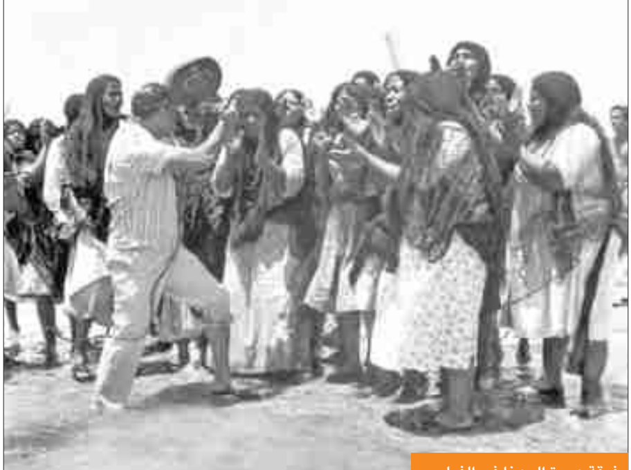
فرقة عودة المهنا في الفيلم

وأضاف أنه عندما أردت توقيع العقود مع الممثلين، وكانت بحوزة مدير التصوير توفيق الأمير، رفضوا أخذ مقابل، وقالوا إذا لم يكن لديك المال فسنعطيك، لأنهم جزأهم الله خيراً، وهذا أمر طيب منهم، قد تلمسوا عدم مقدرتي على الدفع».