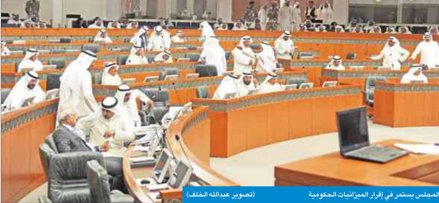
المجلس يستمر في إقرار الميزانيات الحكومية