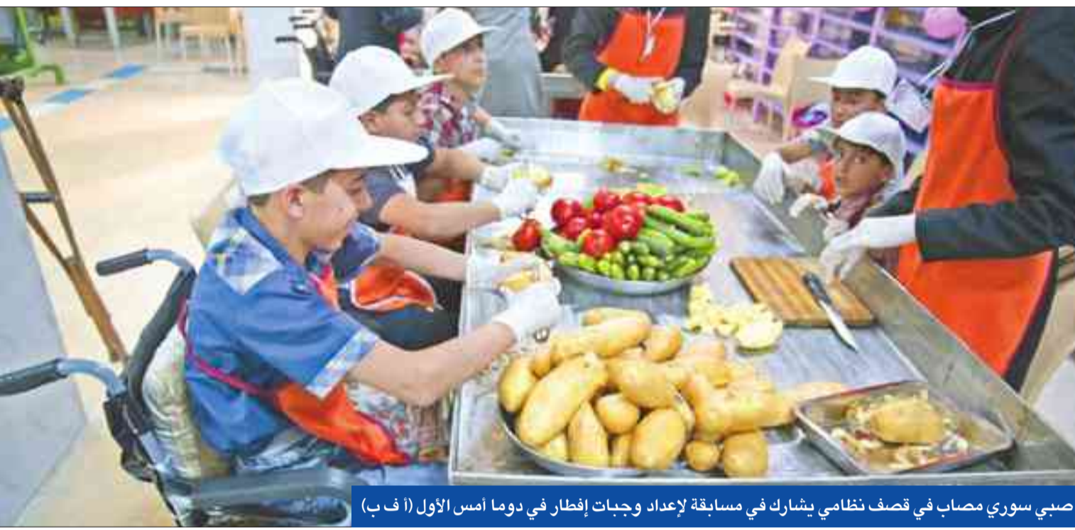
صبي سوري مصاب في قصف نظامي يشارك في مسابقة لإعداد وجبات إفطار في دوما أمس الأول

قال حاكم مقاطعة ماندريلا الصومالية على روبا، إن حركة الشباب الصومالية المتشددة قتلت خمسة من رجال الشرطة في منطقة حدودية في شمال شرق كينيا أمس. وأضاف روبا على حسابه على «تويتر»: «ذبح هنا الهجوم الذي نفذته حركة الشباب في ديمو» ويقول دبلوماسيون مع الصومال نقطة ضعف أمنية بالنظر إلى التحدي الذي يمثله حراسة شريط حدودي طويل.