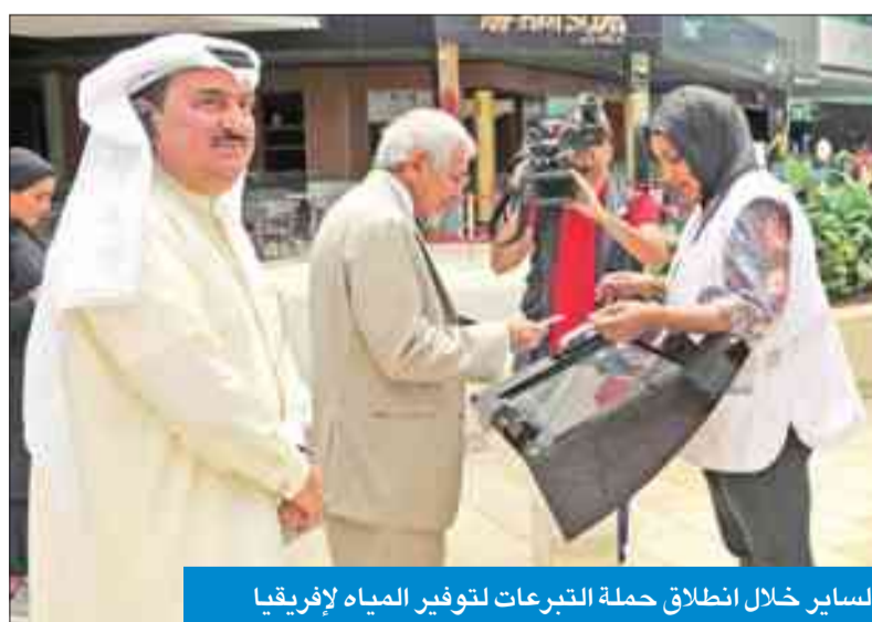
الساير خلال انطلاق حملة التبرعات لتوفير المياه لإفريقيا

العديد من الجهات ومؤسسات المجتمع المدني. وقالت إن حملة الأفنيوز الخيرية للتعرف تأتي تكميلاً لبرنامج الجمعية الحافل بالأنشطة والفعاليات الاجتماعية، سواء على المستوى المحلي أو الدولي، والتي تعزز من خلالها الجمعية مكانتها ودورها في دعم وتوثيق أواصر الترابط والعتاء، وتقوية التواصل والمشاركة مع أفراد المجتمع.