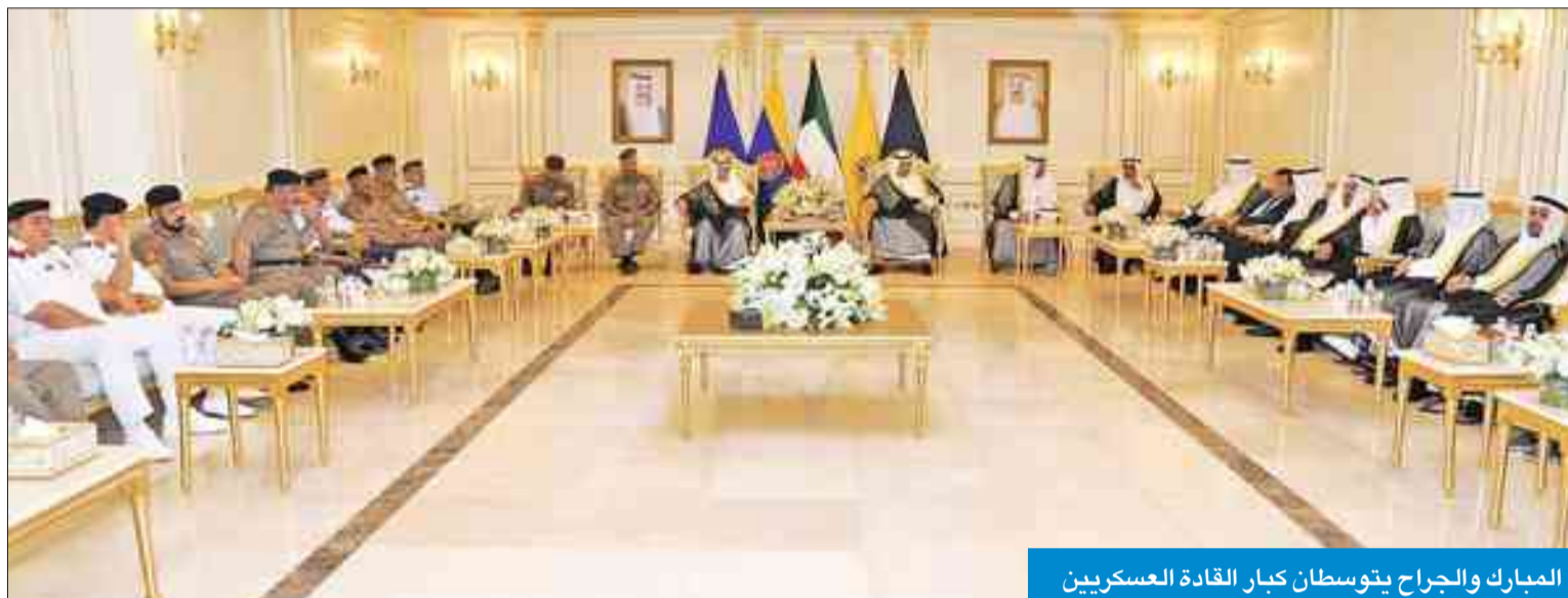
المبارك والجراح يتوسطان كبار القادة العسكريين

زار نادي الضباط مهنتاً برمضان والتقى وزير الدفاع وكبار القادة العسكريين