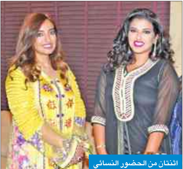
اثنتان من الحضور النسائي