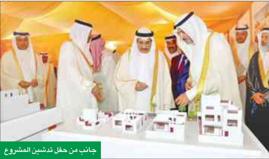
جانب من حفل تدشين المشروع

نطاق أعمالها وزيادة الخيارات الإسكانية المطروحة إلى جانب تشجيع المزيد من المواطنين على اختيار برنامج (مزاي)، كما تأتي هذه الاتفاقية تزامناً مع سعي ديار المحرق لتوفير مجتمع إسكاني متطور يرقى لطلوحات المواطنين الراغبين في السكن في هذه المنطقة.