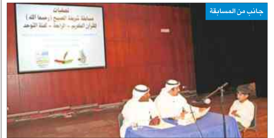
جانب من المسابقة

انطلقت في جمعية التوحد الكويتية، أمس، تصفيات مسابقة شريفة الصبيح (رحمها الله) للقرآن الكريم الرابعة لفئة التوحد، بالتعاون مع مركز الكويت للتوحد والجمعية الكويتية للعلوم الإسلامية، وتهدف هذه المسابقة إلى حفص كتاب الله وترتيله بين الأبناء من ذوي الإعاقة وتدريبهم على العمل وبذل المزيد من الجهد والإنجاز في حفظ القرآن الكريم وإطلاق لسانهم بذكر الله، وتشجيع الأسرة على تحفيظ الأبناء من ذوي الاحتياجات الخاصة القرآن وعدم عزله عن أقرانهم، خاصة في شرف حفظ القرآن