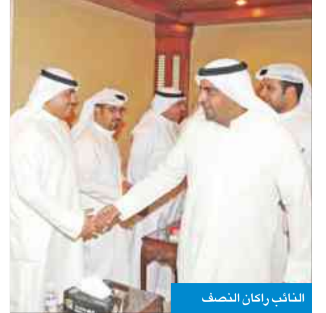
النائب راكان النصف