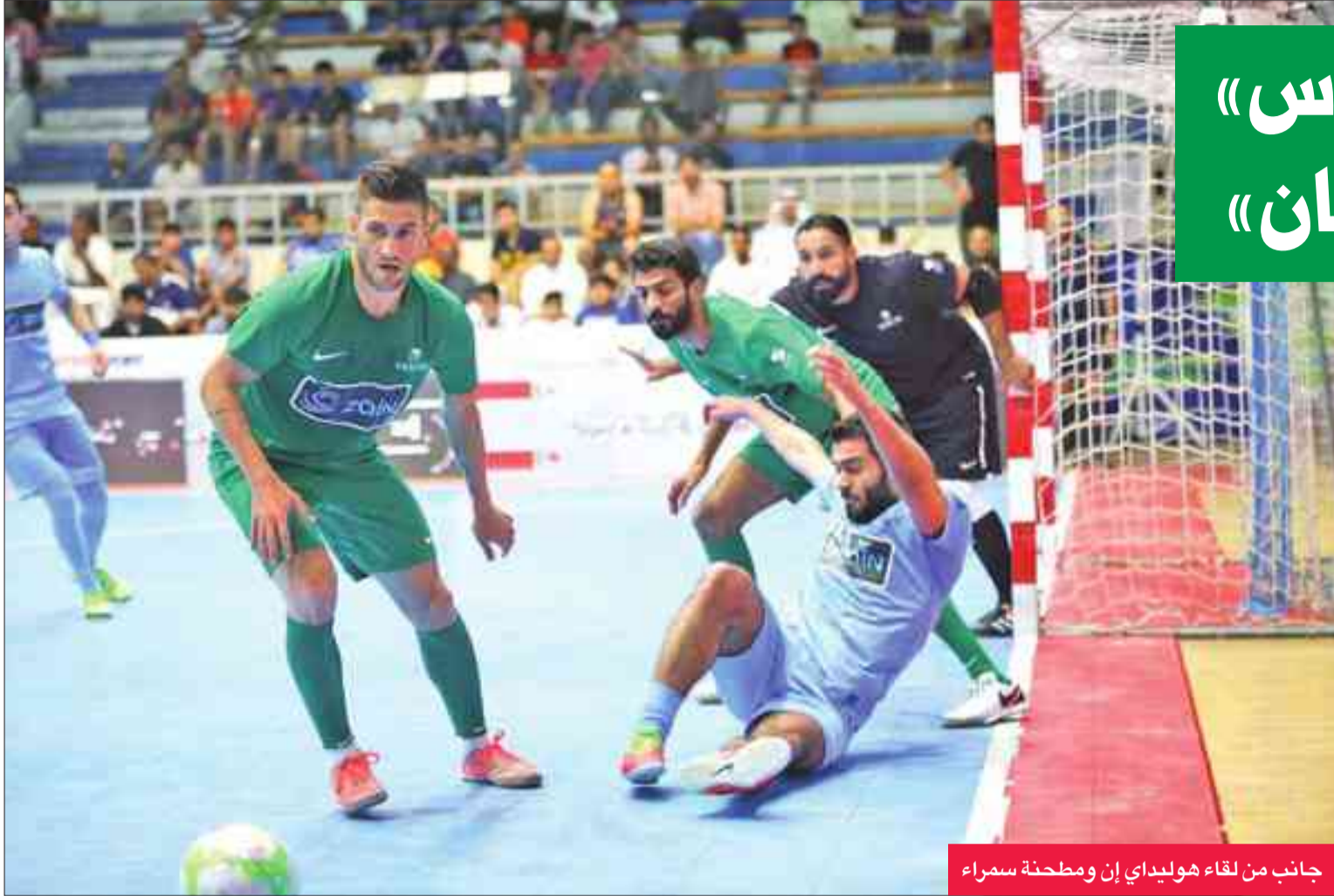
جانب من لقاء هوليداي إن ومطحنة سمراء