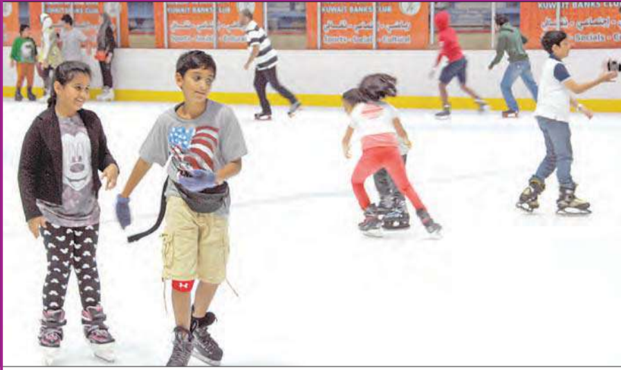
الأطفال يستمتعون بالتزلج على الجليد