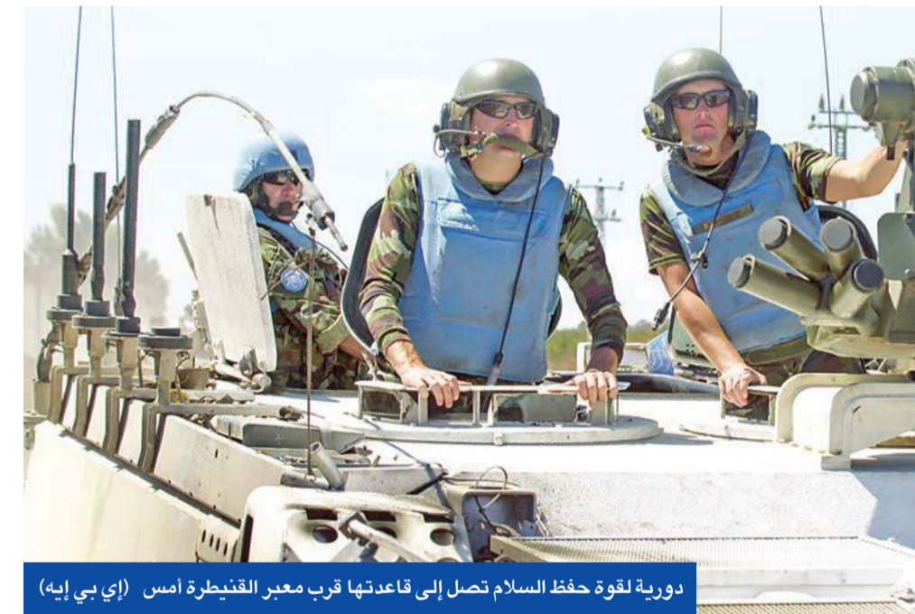
دورية لقوة حفظ السلام تصل إلى قاعدتها قرب معبر القنيطرة أمس