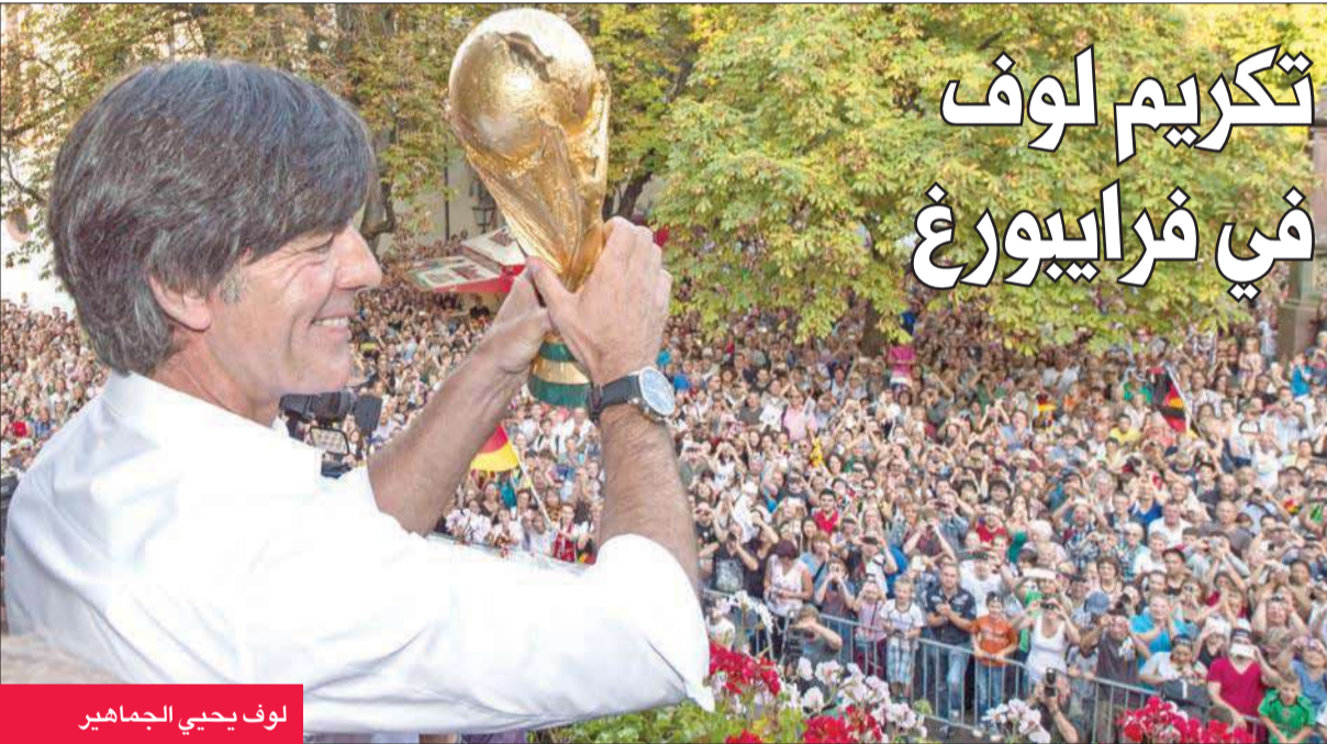
لوف يحيي الجماهير

وقال لوف "الإقليم كله في قلبي، أنا واحد منكم ومن هذا المكان"، قبل أن يعرض للجماهير كأس العالم الذي توج به الفريق الألماني بعد فوزه على الأرجنتين بهدف نظيف في المباراة النهائية في ريو دي جانيرو في يوليو الماضي.