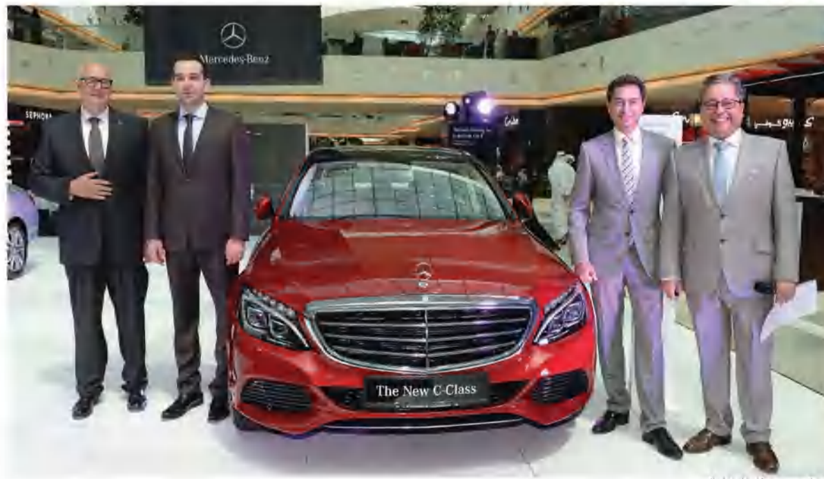
جانجانب من حفل الإطلاق