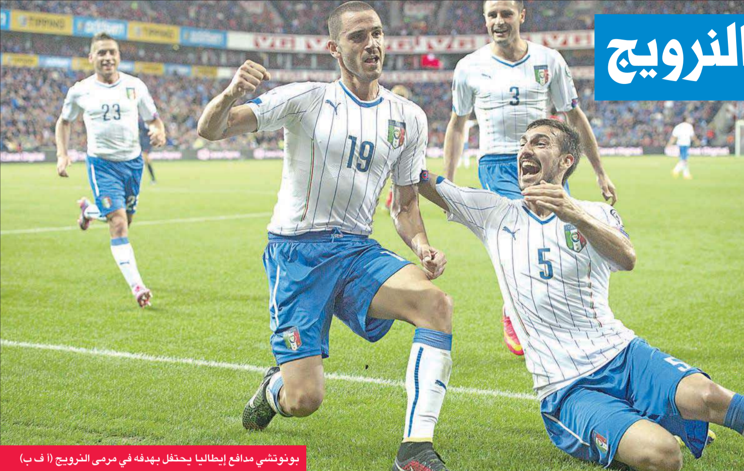
بونوتشي مدافع إيطاليا يحتفل بهدفه في مرعى النرويج

نهاية المباراة، أضاف اندريج كراماريتش الهدف الثاني لكرواتيا، ولعب منتخب مالطا بعشرة لاعبين منذ الدقيقة 31 لطرد ستيف بورج.