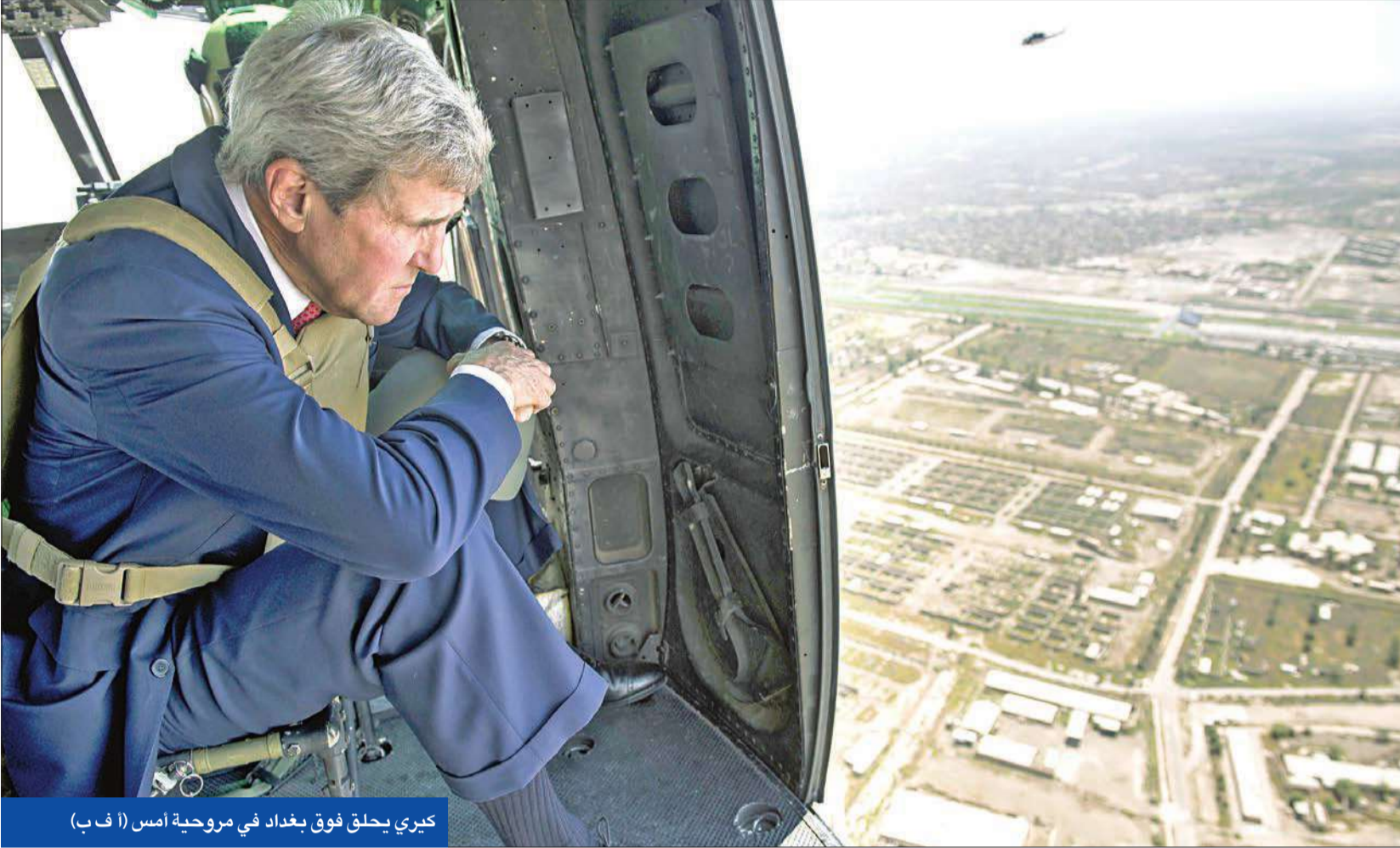
كيري يخلق فوق بغداد في مروحية امس

● كيري يؤكد من بغداد ثقته بهزيمة التنظيم ويتعرض لضغوط «شيوعية» لإشراك طهران في «اجتماع جدة»