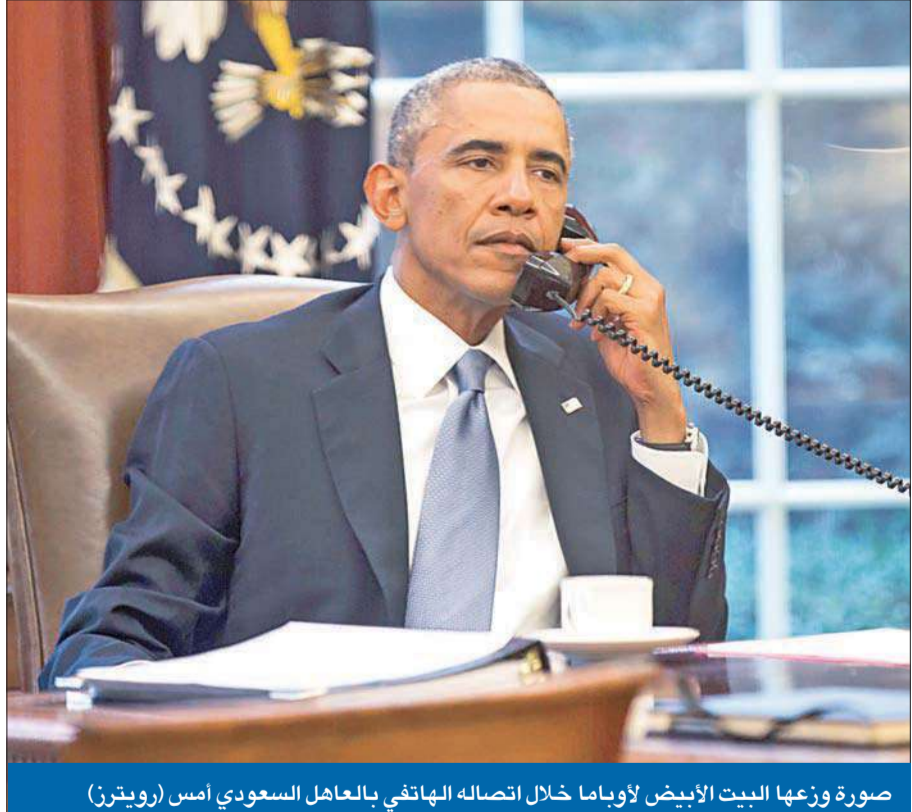
صورة وزعها البيت الأبيض لأوباما خلال اتصاله الهاتفي بالعاهل السعودي أمس

كيري يتعرض لضغوط لإشراك طهران في «اجتماع جدة» أو في «التحالف»