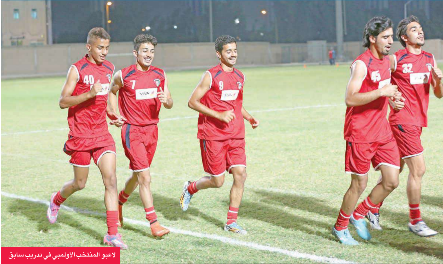
لاعبو المنتخب الأولمبي في تدريب سابق