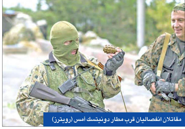
مقاتلان انفصاليان قرب مطار دونيتسك أمس

كيف راضية عن «هدنة الشرق»... وتعد الانفصاليين بتعزيز الحكم الذاتي