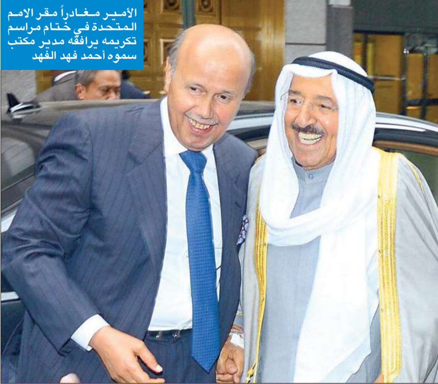
الأمير مغادراً مقر الأمم المتحدة في ختام مراسم تكريمه برافقه مدير مكتب سموه أحمد فهد الفهد

إجماع على أن لقب «قائد للعمل الإنساني» جاء متوافقاً مع الدور الإنساني الكبير لسموه