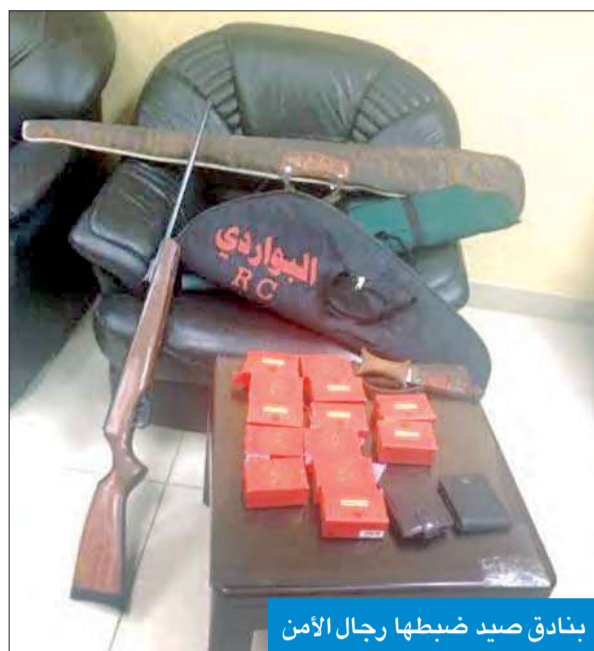
بنادق صيد ضبطها رجال الأمن

وفي محافظة الجهراء، شن رجال أمن المحافظة حملة أمنية أشرف عليها ميدانيا المدير العام لأمن المحافظة اللواء إبراهيم الطراح، وأسفرت عن ضبط 4 أشخاص مطلوبين لإدارة التنفيذ الجنائي، و4 أشخاص آخرين مطلوبين لإدارة التنفيذ المدني، وكذلك ضبط 4 مركبات مطلوبة، وإحالة 9 أشخاص إلى جهات الاختصاص. بعد أن تبين وجود قضايا تغيب مسجلة بحقهم، فضلاً عن ضبط 5 بنادق صيد، وإحالة 9 مركبات إلى كراج الحجز.