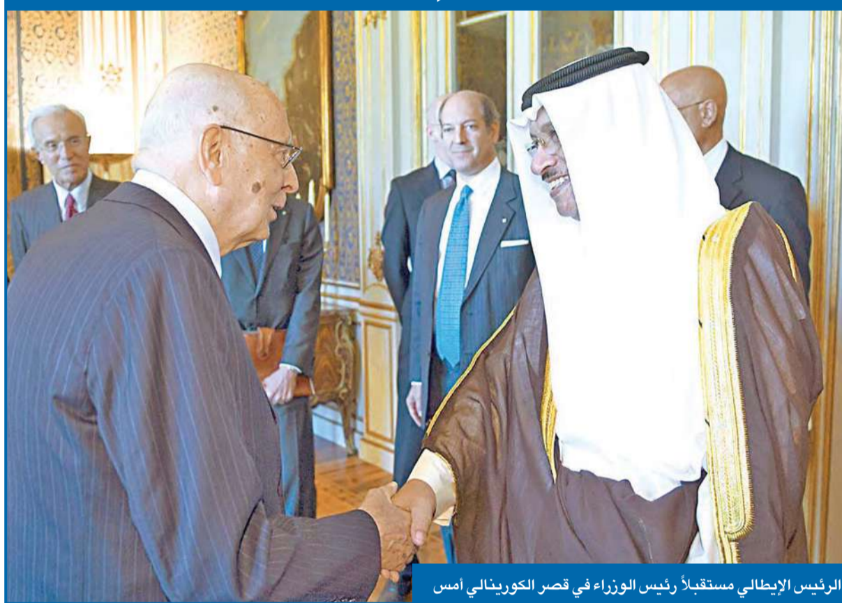
الرئيس الإيطالي مستقبلاً رئيس الوزراء في قصر الكورينثي أمس