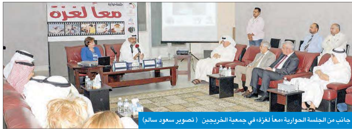
جانب من الجلسة الحوارية «معاً لغزة» في جمعية الخريجين

● الملا: تكريم الأمير يحملنا مسؤولية إنسانية كبيرة ● جرباوي: الهجوم على غزة أظهر تلاحم الكويت