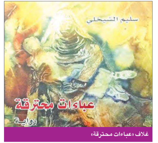
غلاف «عباءات محترقة»

بينما يتسع أفق المعرفة وتضعف سلطة الوصاية على القراء في العالم في عصر التطور التقني والفضاء المفتوح، تضيق المعايير الرقابية في الكويت وتتضاعف قرارات منع الكتب مع اقتراب موعد معرض الكتاب في نوفمبر المقبل.