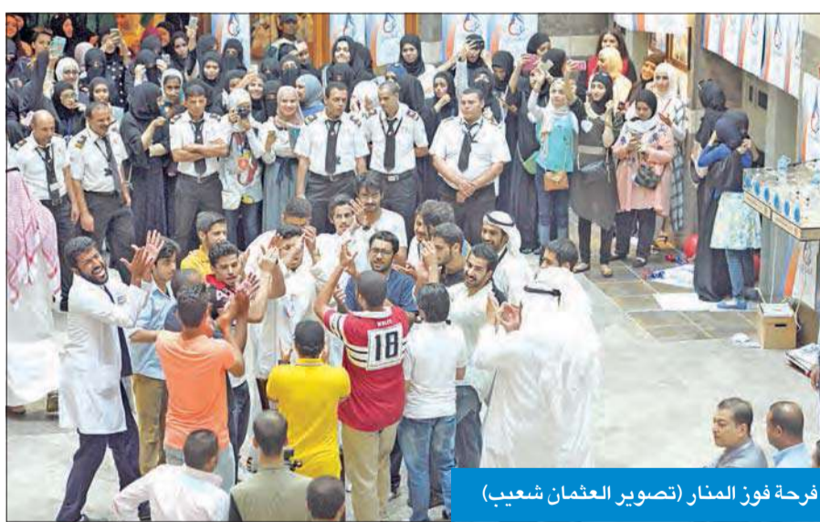
فرحة فوز المنار