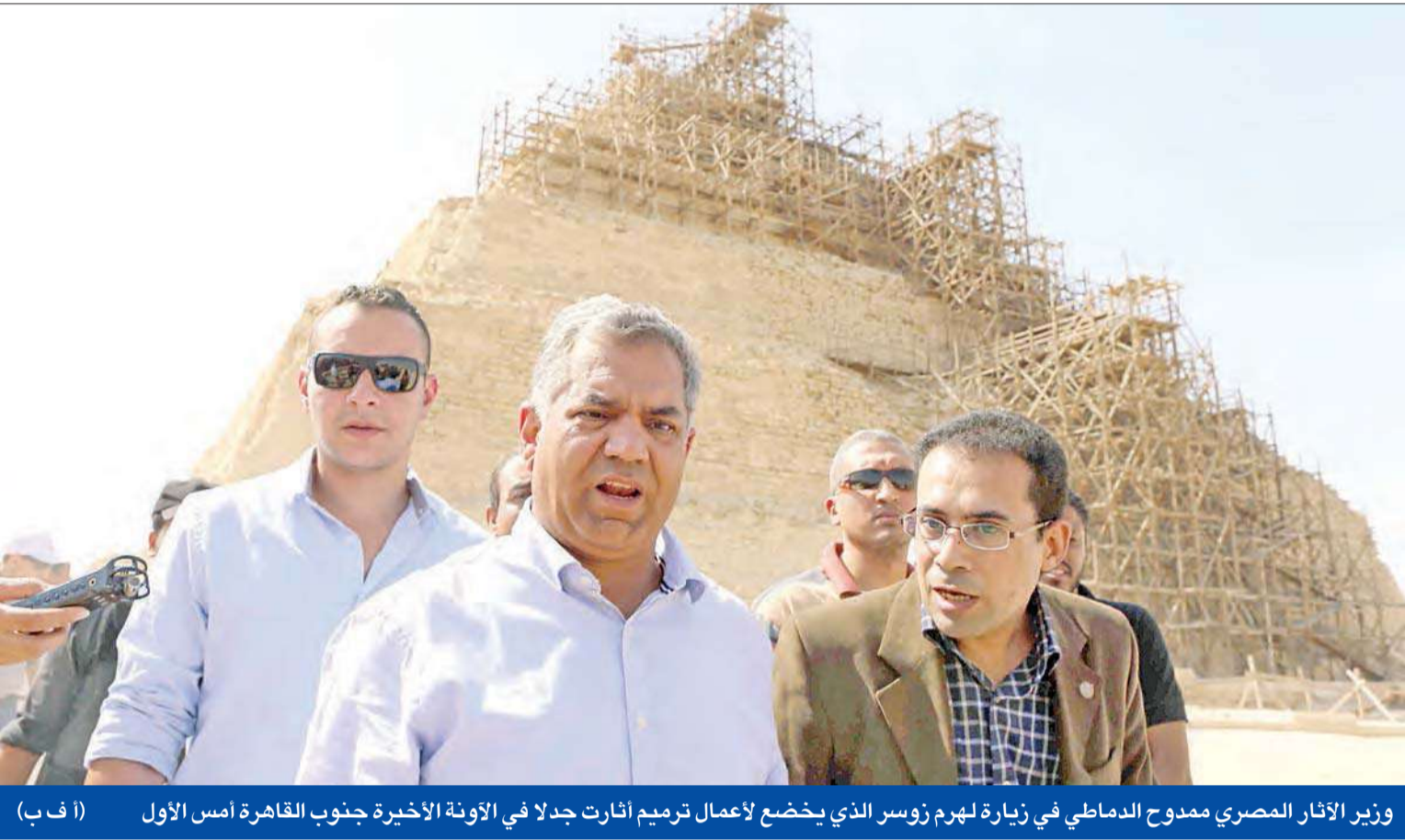
وزير الآثار المصري ممدوح الدماطي في زيارة لهرم زوسر الذي يخضع لأعمال ترميم أثارت جدلاً في الأونة الأخيرة جنوب القاهرة أمس الأول

بيان «الأوروبي» بشأن حقوق الإنسان في مصر