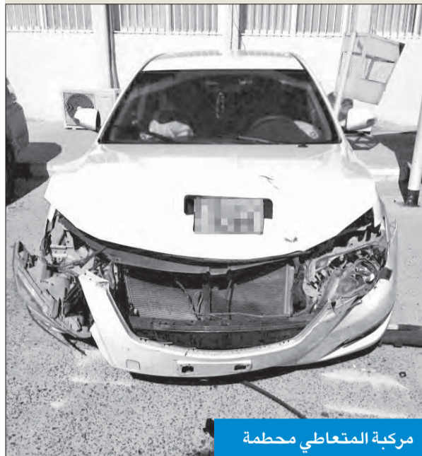
مركبة المتعاطي محطة