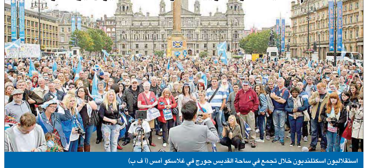
استقلاليون اسكتلنديون خلال تجمع في ساحة القديس جورج في غلاسكو أمس

يتوجه نحو 4.3 ملايين ناخب اسكتلندي اليوم إلى صناديق الاقتراع للمشاركة في استفتاء سيحدد مستقبل اسكتلندا بالدرجة الأولى ومصير المملكة المتحدة بعد 307 أعوام من الوحدة. وسيتطلب من الاسكتلنديين الاختيار بين الإجابة بنعم أو لا على سؤال «هل ينبغي أن تصبح اسكتلندا دولة مستقلة؟». وسط تقارب شديد بين الخيارين أظهره آخر استطلاع للرأي، إذ قال 51% من المستطلعين إنهم سيصوتون للنقاء في المملكة المتحدة مقابل تأييد 49% للانفصال والاستقلال. ولا يزال هناك قسم 02