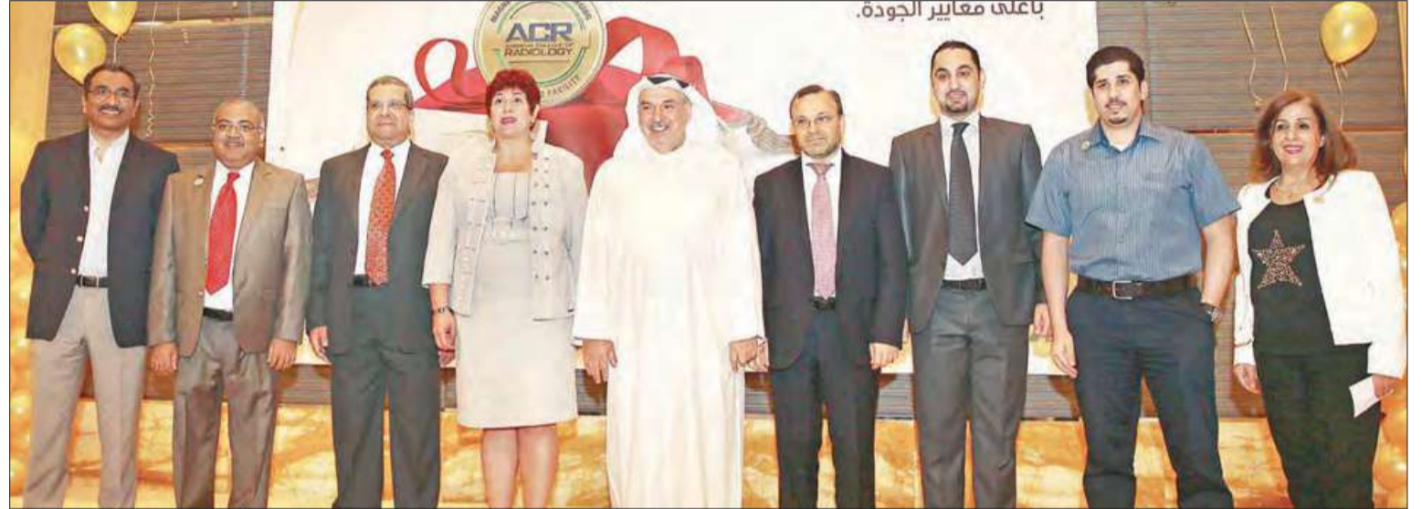
صورة جماعية لأعضاء اللجنة العليا