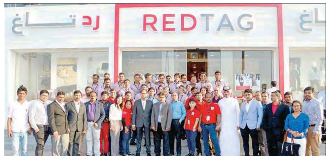
فريق عمل رد تاغ، ومسؤولوه في لحظة جماعية أمام المتجر