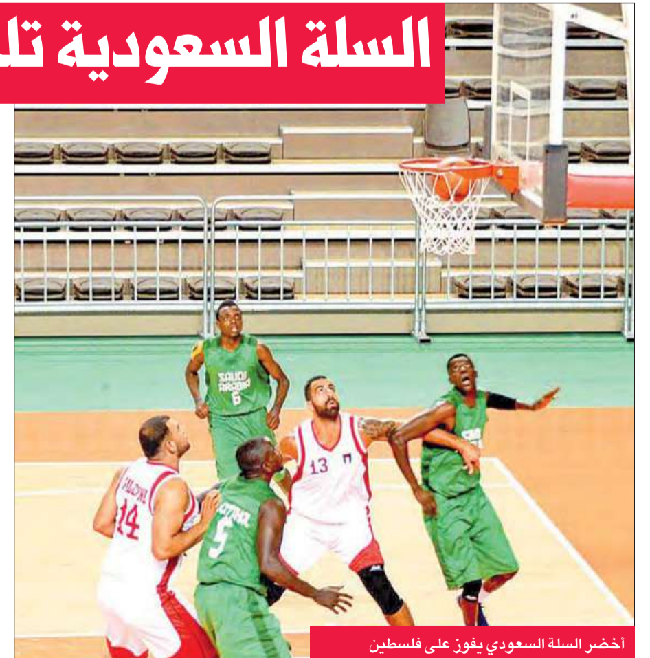
اخضر السلة السعودي يفوز على فلسطين