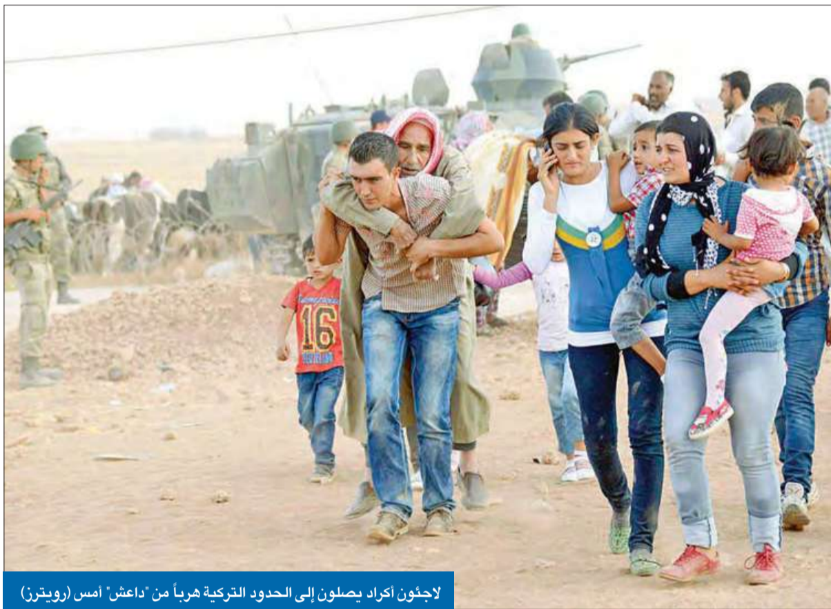
لاجئون اكراد يصلون إلى الحدود التركية هرباً من «داعش» أمس

التنظيم يدعو إلى «أشكال مبتكرة» من القتل ويتحدى واشنطن للتدخل برياً الفيصل يبحث مع ظريف إمكانية التعاون الإقليمي لإحلال الأمن والسلام