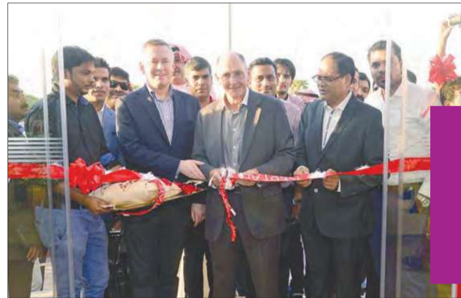
قص شريط الافتتاح