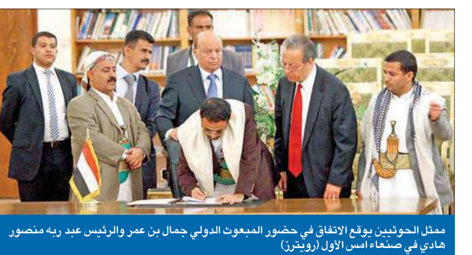
ممثل الحوثيين يوقع الاتفاق في حضور المبعوث الدولي جمال بن عمر والرئيس عبد ربه منصور هادي في صنعاء أمس الأول

غداة سيطرة جماعة «انصار الله» الحوثية على صنعاء، لقي اتفاق السلام، الذي تم توقيعه بين الفرقاء السياسيين والحكومة مساء أمس الأول برعاية أممية، ترحيباً حذراً مشوباً بالقلق من قبل الدول الراحية للمبادرة الخليجية. ورحب سفراء مجموعة الدول العشر الراحية للمبادرة (دول مجلس التعاون والدول دائمة العضوية في مجلس الأمن) بتوقيع «اتفاق السلم والشراكة»، إلا أنهم دانوا «استخدام كل أنواع العنف والتهديدات لاستهداف الخصوم السياسيين، أو تحقيق أهداف سياسية»، مؤكداً دعمهم لدور الأجهزة الأمنية لحماية مؤسسات الدولة. وطالب السفراء بـ«الوقف الفوري وغير المشروط لإطلاق النار في صنعاء والجوف ومارب ومناطق الصراع الأخرى، لحماية