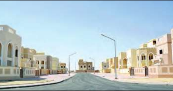
جانب من بيوت مشروع مدينة صباح الأحمد السكنية

تسلمت المؤسسة العامة للرعاية السكنية 930 بيتاً من مشروع مدينة صباح الأحمد السكنية، حيث تم تجهيزها بشكل متكامل من أعمال مدنية وصحية وكهربائية. كما تم الانتهاء من إنجاز خدمات المشروع من محطات ومحولات الكهرباء الفرعية نموذج 2 ونموذج 4 وأعمال الطرق ومواقف السيارات وشبكات خدمات البنية التحتية للجزء الثاني (قطع A4، A5) والمحور الخدمي للمضاحية.