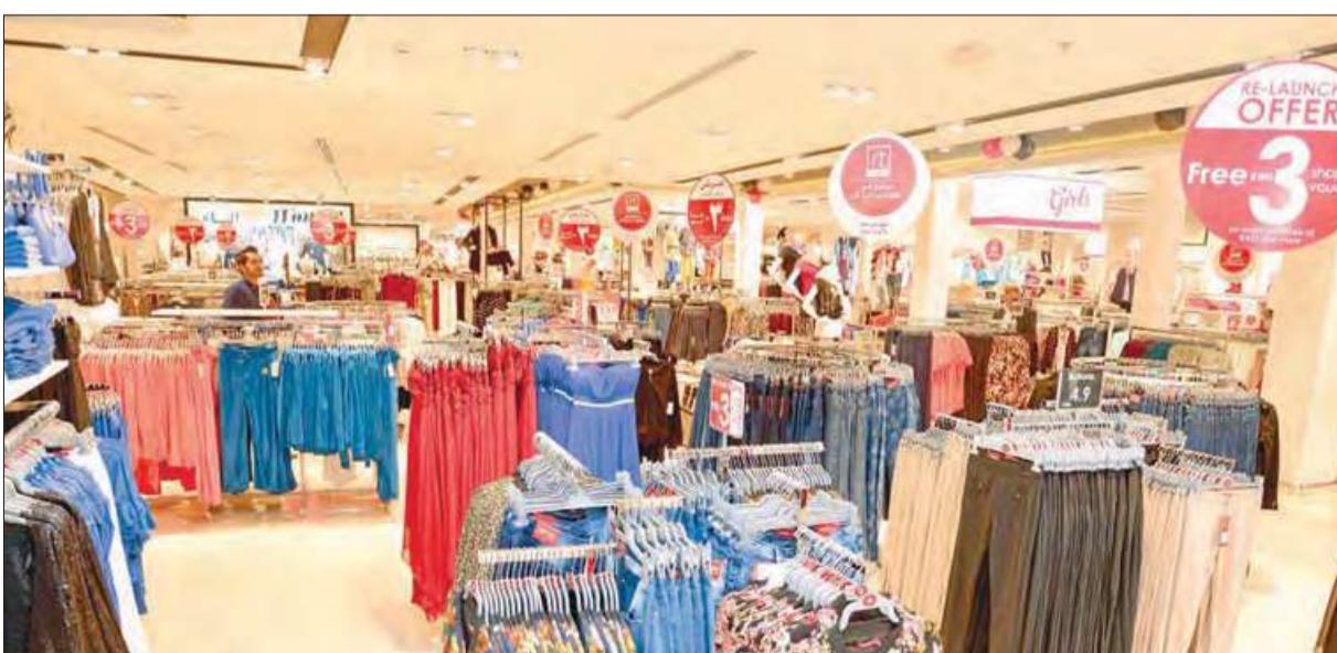
جانب من الأزياء النسائية العصرية