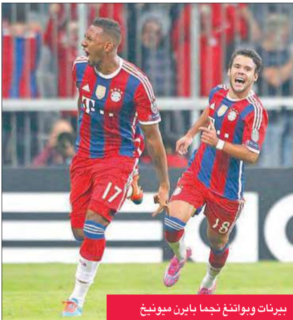
بيرنات وبواتغ نجما بايرن ميونخ

الثاني له هذا الموسم خارج قواعده مقابل فوزين صعبين بين جماهيره على فولفسبورغ (1-2) وشتوتغارت (2-صفر).