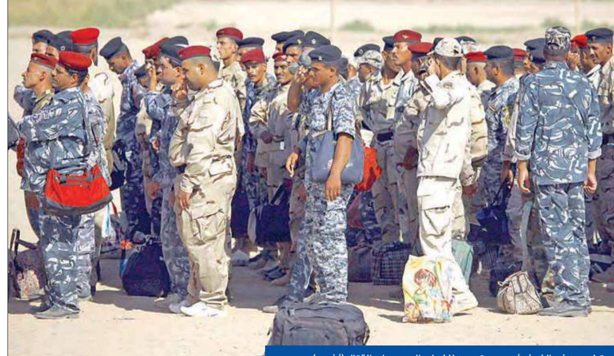
متطوعون في النجف أمس يستعدون للذهاب إلى جبهات القتال

في خطوة تظهر حسن النوايا العراقية لفتح صفحة جديدة مع المملكة العربية السعودية، أكد رئيس الوزراء العراقي حيدر العبادي في مقابلة خاصة مع قناة «العربية» أمس، أنه مستعد لزيارة الرياض لفتح صفحة جديدة في العلاقات معها. وقال العبادي في المقابلة، إن مستشارين أميركيين وبريطانيين وإيرانيين يساعدون القوات العراقية في العمليات العسكرية ضد تنظيم «داعش»، مشدداً على أنه لا يتحمل تبعات ومشاكل حكومة رئيس الوزراء السابق نوري المالكي. وقال رئيس الحكومة إن الخلافات الحالية حول وزارتي الدفاع والداخلية ليست جوهرية. وذكر رئيس الوزراء العراقي أن الجيش العراقي يستفيد من مساعدة الميليشيات المسلحة في مواجهة «داعش»، وأن الجيش لن يتمكن من إعادة السيطرة على نينوى من دون دعم السكان، لافتاً إلى أنه لا مشكلة في إقامة إقليم سني في العراق إذا كان ذلك وفق الدستور. وحول الخلاف بين بغداد واربيل، قال العبادي إنه يمكن حل الخلاف بتعاون من الطرفين، مشيراً إلى أن تحقيق حلم الأكراد العراقيين بدولتهم ليس بعيداً. في السياق، أكد وزير الخارجية العراقي إبراهيم الجعفري «أهمية العلاقات السعودية-العراقية والتي تنطلق من حقائق جغرافية وتاريخية، وضرورة