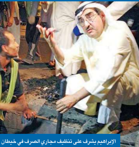
الإبراهيم يشرف على تنظيف مجاري الصرف في خيطان

الإبراهيم: «المناهيل» ليست «سلاسل قمامة»