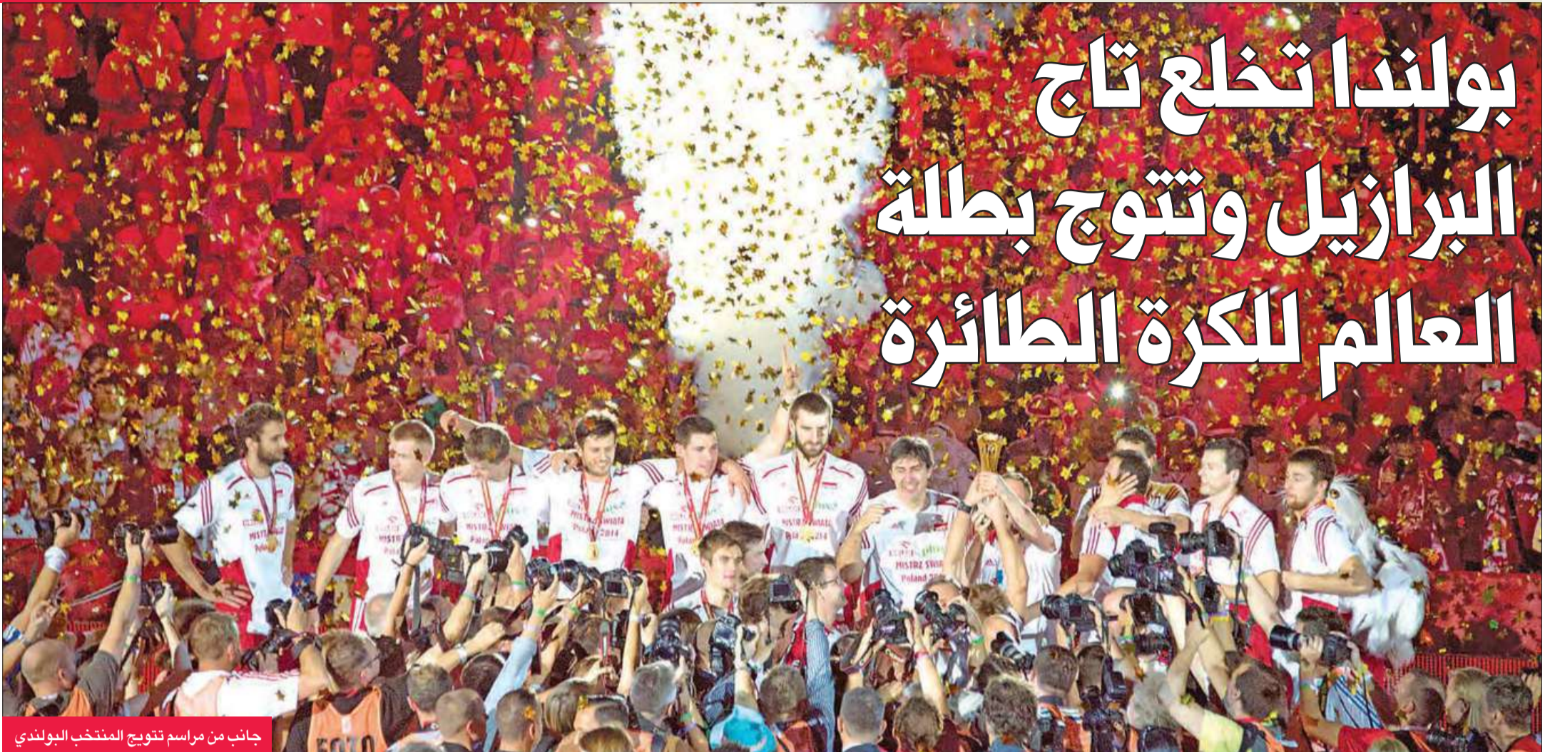
جانب من مراسم تتويج المنتخب البولندي

وفضرت ألمانيا بالميدالية البرونزية بفوزها على فرنسا في مباراة تحديد المركز الثالث.