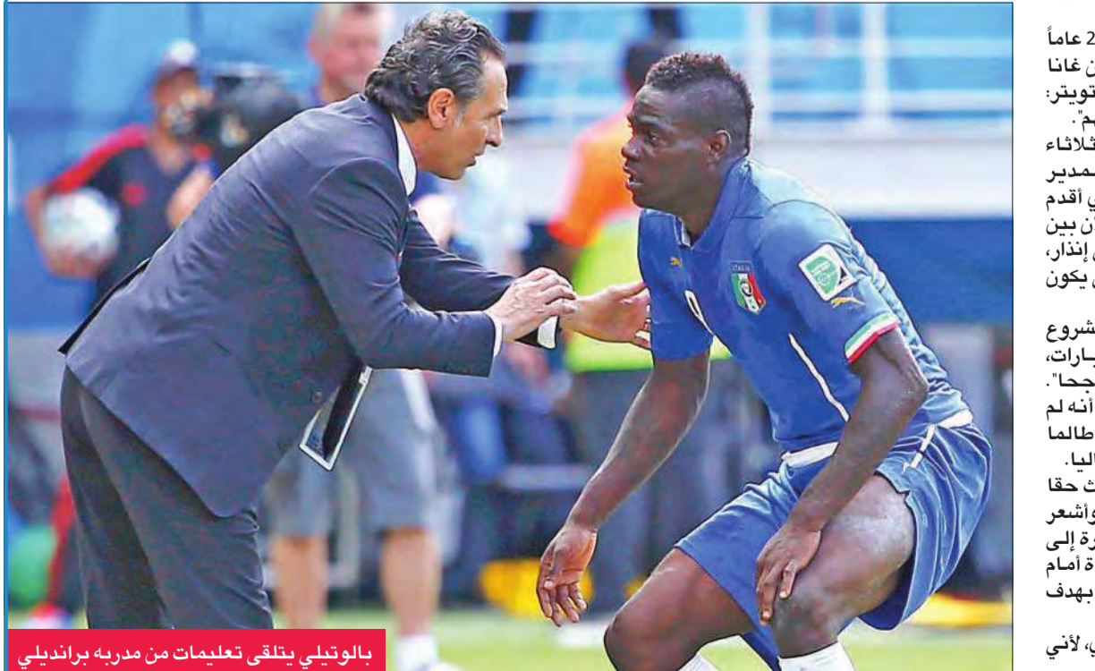
بالوتيلي يتلقى تعليمات من مديره برانديلي

وتعرض الفريق الشاب للمتخذب الإيطالي للهجوم من اللاعبين أصحاب الخبرة مثل الحارس جيانلويجي بوفون وإنييبي دي روسي، في وقت هاجم النقاد بالوتيلي لأنه لم يكن مستعداً