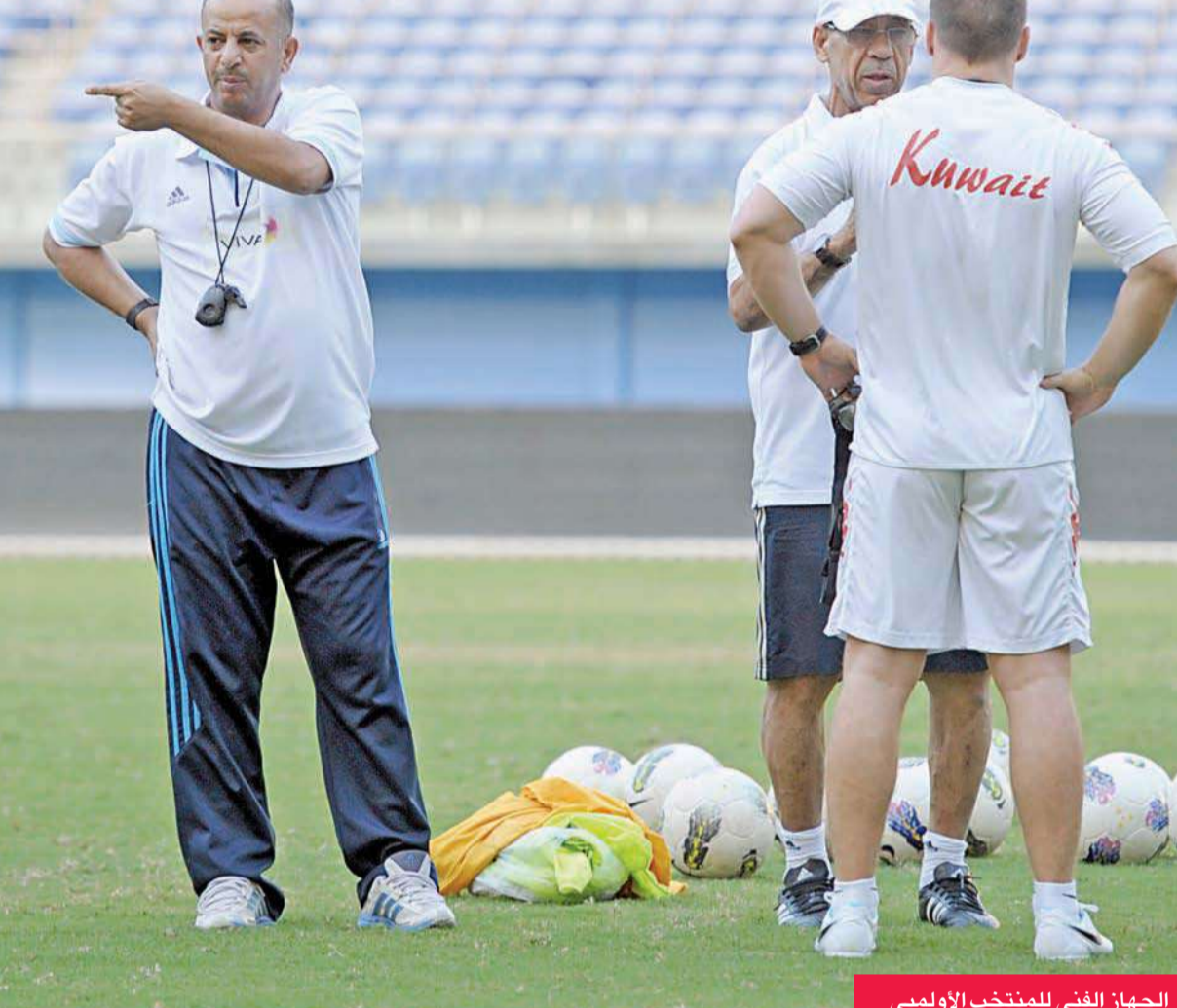
الجهاز الفني للمنتخب الأولمبي

قرر الجهاز الفني لمنتخبنا الوطني الأول لكرة القدم بقيادة المدرب البرازيلي جورفان فييرا تأجيل تدريبات الفريق التي كان من المقرر انطلاقها مساء أمس على استاد جابر الدولي، في المرحلة الثانية ضمن الاستعدادات لبطولتي خليجي 22 التي تستضيفها السعودية خلال الفترة من 13 حتى 26 نوفمبر المقبل في مدينة الرياض، وبطولة كأس آسيا التي تقام في استراليا في الفترة من 9 إلى 31 يناير القادم، وذلك بناءً على رغبة عدد كبير من اللاعبين لارتباط بعضهم بالانتخابات التكميلية لمجلس الأمة التي أجريت أمس. وعقد أعضاء الجهازين الفني والإداري اجتماعاً في الثامنة من مساء أمس بمقر الاتحاد لمناقشة عدد من الأمور الخاصة بالفريق، منها تحديد المنتخبين اللذين يسعي الأزرق إلى مواجهتهما في الكويت قبل المغادرة إلى معسكر تركيا يوم 30 يوليو المقبل. ومن المقرر أن يوجه الجهازان الفني والإداري الدعوة إلى اللاعبين لعقد اجتماع معهم الأحد أو الاثنين المقبلين باتحاد الكرة، لإصدار بعض التعليمات، والاتفاق على مواعيد التدريبات خلال شهر رمضان المبارك، ونهايات كأس العالم التي تستضيفها البرازيل في الوقت الراهن.