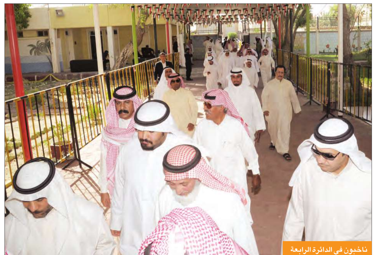
ناخبون في الدائرة الرابعة