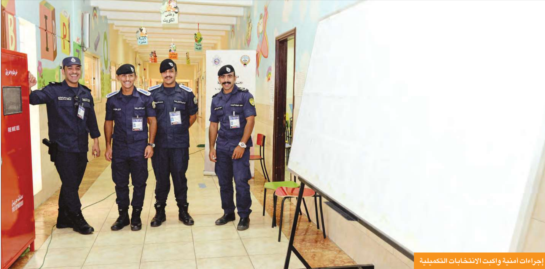
إجراءات أمنية واكبت الانتخابات التكميلية

● 72 مرشحا تنافسوا في «الانتخابات التكميلية» للفوز بأصوات ربع مليون ناخب في الدوائر الثانية والثالثة والرابعة