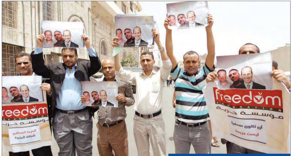
جانب من وقفة مؤيدة لصحافي الجزيرة المحبوسين في مصر نظمها عدد من الصحافيين في العاصمة اليمنية صنعاء أمس الأول

بإلامم المتحدة أسامة عبد الخالق إن «القضاء المصري أقدم النظم القضائية في الشرق الأوسط ومن أفضلها»، مضيفاً: «أثقت تماماً بنظامنا القضائي، وعلى ثقة بأن الإجراءات القانونية المطلوبة ستتبع، وإن العدالة ستأخذ مجراها في مثل هذه القضايا، وفي غيرها». ونفى الدبلوماسي المصري فكرة تسييس الأحكام القضائية في مصر، خلال الاجتماع الذي نظمته رابطة مراسلي الأمم المتحدة، وحضره دبلوماسيون من أكثر من 17 دولة، من بينها ثمانية أعضاء في مجلس الأمن الدولي، لإظهار التضامن مع صحافيي «الجزيرة» الثلاثة المحكوم عليهم بالسجن. تظاهرات العزل وفي الشأن الداخلي، دعا «تحالف دعم الشرعية» الموالي لجماعة «الإخوان»، أنصاره إلى المشاركة في تظاهرات اليوم لتدشين أسبوع «سحب كراما»، الذي يشهد تظاهرات بالتزامن مع الذكرى الأولى للإطاحة بالرئيس المعزول محمد مرسي، وأكد القيادي بالتحالف الأمين العام لحزب «الجهاد الإسلامي»، محمد أبو سمره لـ «الجريدة» أنه لا نية للاعتصام في أي من ميادين القاهرة، حرصاً على شباب «الإخوان» وأنصارها من الملاحظات الأمنية. طعون شفيق من جهتها، رفضت لجنة الانتخابات الرئاسية أمس، الطعن المقدم من المرشح الرئاسي الخاسر أحمد