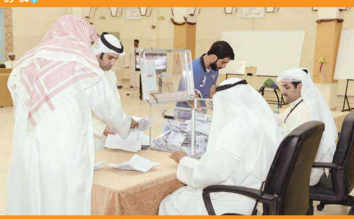
جانب من عملية فرز الأصوات للانتخابات التكميلية لمجلس الأمة للفصل التشريعي الـ 14 أمس