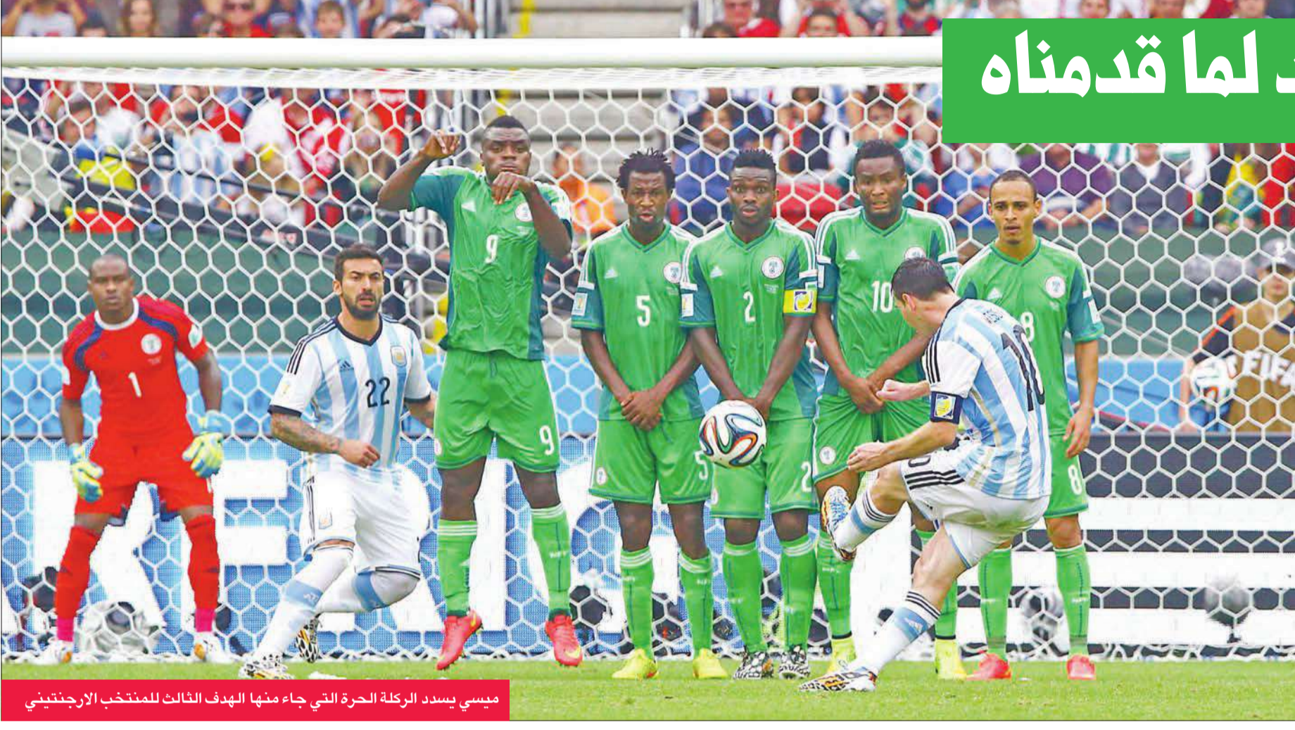
ميسي يسدد الركلة الحرة التي جاء منها الهدف الثالث للمنتخب الأرجنتيني

رأى قائد الأرجنتين ليونيل ميسي، الذي قاد بلاده إلى فوزها الثالث على التوالي في مونديال البرازيل 2014 لكرة القدم على حساب نيجيريا، أن فريقه يتحسن، مغرباً عن سعاداته لإنهاء الدور الأول في صدارة مجموعته. وقال ميسي، صاحب هدفيين في مرعى نيجيريا رافعا رصيده إلى أربعة منذ بداية المسابقة: "أنا سعيد لما قدمناه حتى الآن وإنهاء الدور الأول في الصدارة فقد حققنا هدفاً، فريق مثل نيجيريا إذا تركته يلعب وفتحت له المسافات يمكنه أن يؤلمنا". وتابع أفضل لاعب في العالم أربع مرات، والذي سجل في مباريات الدور الأول الثالث: "الآن لا يمكننا أن نخشي إبداء، لأن الغلطة سنرسلنا إلى الخارج، نأمل الاستمرار، واعتقد أننا رأينا اليوم أرجنتين أفضل". وختم لاعب برشلونة الإسباني: "لا شيء أجمل من الفوز بكأس العالم وإحرازها مع هذا الفريق". ورفع ميسي رصيده من الأهداف في البطولة الحالية إلى أربعة أهداف، ليشاوي مع زميله في برشلونة، البرازيلي نيمار في صدارة ترتيب الهادفيين.