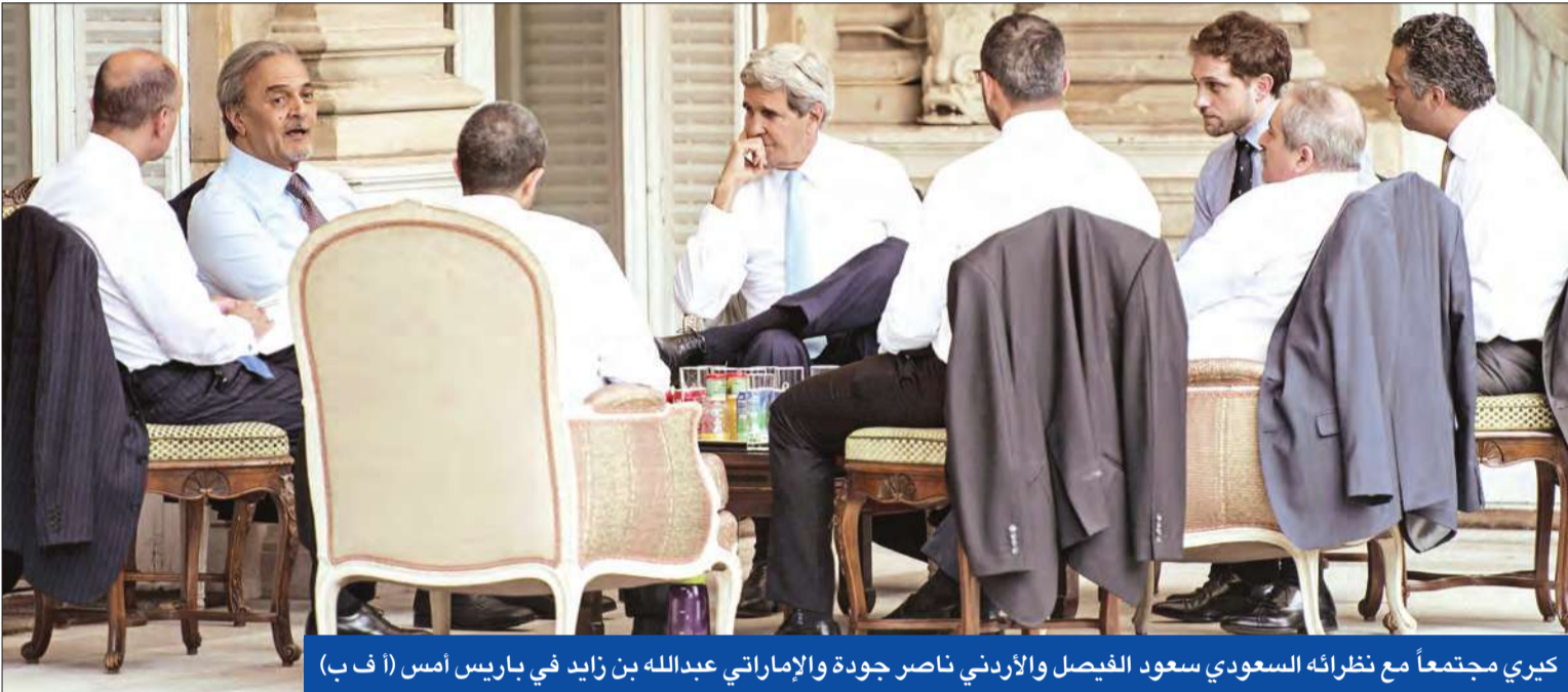
كيري مجتمعاً مع نظرائه السعودي سعود الفيصل والأردني ناصر جودة والإماراتي عبدالله بن زايد في باريس أمس