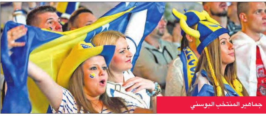
جماهير المنتخب البوسني

فوز المنتخب البوسني على إيران بالتاريخي. وكتبت الصحيفة: "سيظل يوم 25 يونيو 2014 محفورا في الذاكرة باعتباره اليوم الذي حققت فيه البوسنة والهرسك فوزها الأول في أول بطولة كأس عالم تشارك بها". أما في بانيا لوكا، عاصمة الجزء الصربي في البوسنة حيث ترى غالبية السكان هناك أن المنتخب الصربي هو منتخبهم تجاه المنتخب البوسني، مؤكداً أنه "لو كان لدينا حظ أكبر قليلاً، لكان من الممكن أن نتأهل". بينما نقلت صحيفة "إيربان" اليوم في مدينة سلفادور القديمة مباراة رائعة، رغم أننا لم يكن لدينا أي فرصة في التأهل بعد الهزيمتين أمام الأرجنتين ونيجيريا. وعنوانها التالي إنه "وداع مشرف لبطولة كأس العالم" حيث وصفت