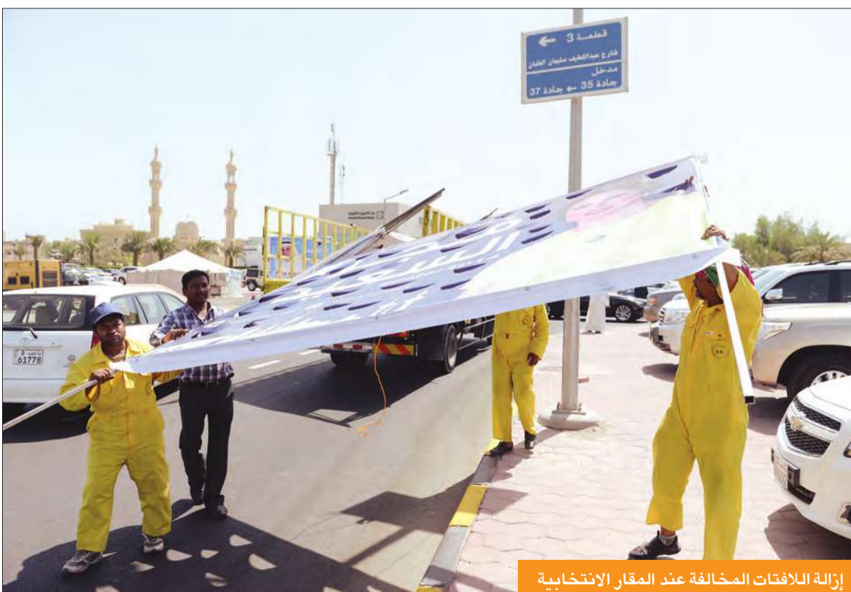
إزالة اللافتات المخالفة عند المقار الانتخابية

يذكر ان الانتخابات التكميلية لمجلس الأمة تجري في الدوائر الانتخابية الثانية والثالثة والرابعة ويتنافس المرشحون والمرشحات لملء خمسة مقاعد فيها وتستمر عمليات الاقتراع حتى الساعة الثامنة مساء.