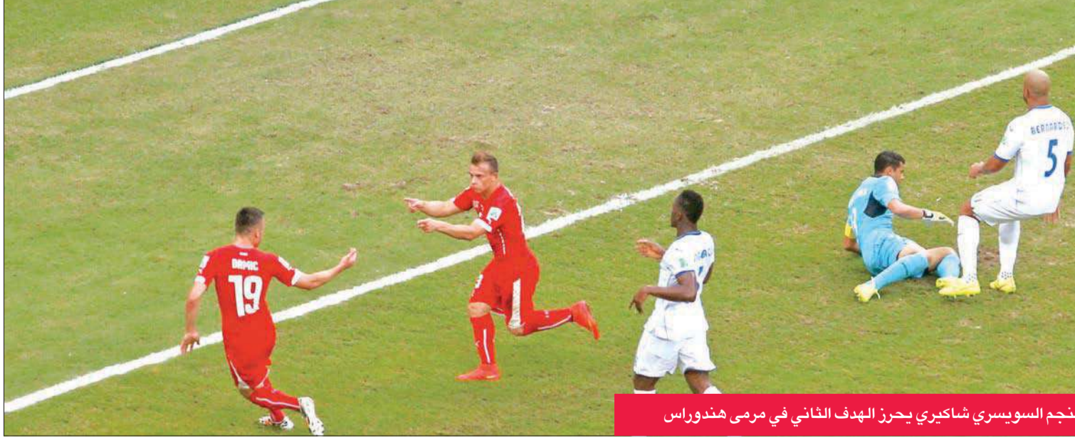
النجم السويسري شاكيري يحرز الهدف الثاني في مرمى هندوراس

قام درميثش بمجهود فردي رائع في الجهة اليسرى وتلاعب بالمدافع، وهيأها للاعب وسط الفريق البافاري فسددها قوية بيمينه على يمين الحارس (71).