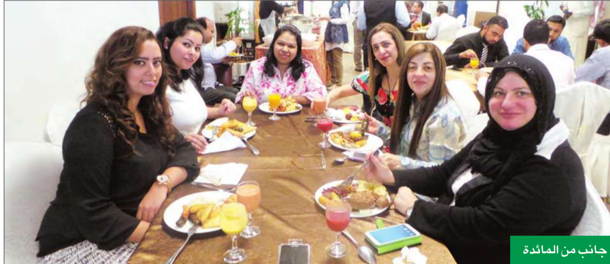
جانب من المائدة

بداية شهر الصوم، ويحرص «الوطني» على إقامة مثل هذه المناسبات لموظفيه لتعزيز روح الأسرة الواحدة التي يتميز بها البنك.