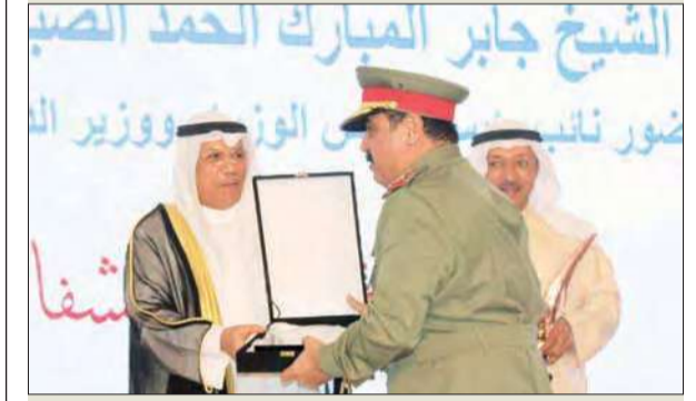
الجراح يسلم إلى الرفاعي جائزة الحرس الوطني

أعلنت جمعية الشفافية الكويتية نتائج جائزة الكويت للشفافية والإصلاح لعام 2014 في مجال «مؤشر مدركات الإصلاح في الجهات الحكومية 2014»، وذلك في حفل نظّمته الجمعية الليلة تحت رعاية رئيس مجلس الوزراء سمو الشيخ جابر المبارك الذي اناج عنه نائب رئيس مجلس الوزراء وزير الدفاع الشيخ خالد الجراح. وحصل الحرس الوطني على المركز الأول في الجائزة وجاءت بيت الزكاة في المركز الثاني وفي الثالث ادارة نزع الملكية للمنفعة العامة وفي الرابع وزارة الدولة لشؤون الشباب وفي الخامس هيئة اسواق المال وفي السادس الادارة العامة للأطفاء.