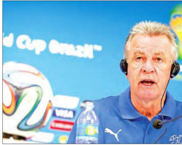
الخامسة بعد منتخب فرنسا صاحب المركز الأول، حيث يواجه منتخب الأرجنتين في يوم الثلاثاء المقبل في مدينة ساو باولو.

أكد الألماني أوتمار هيتسفيدل المدير الفني لمنتخب سويسرا لكرة القدم أن المنتخب الأرجنتيني هو الأوفر حظا في الفوز بمباراة دور الستة عشر التي تجمع البلدين يوم الثلاثاء المقبل. وقال هيتسفيدل بعد فوز فريقه بثلاثة أهداف نظيفة على هندوراس مساء الأربعاء: "المنتخب الأرجنتيني هو الأوفر حظا ولكن ليس هناك ما نخسره فنحن نريد أن نواصل التقدم قدر الإمكان". وأشاد هيتسفيدل بالأداء الرائع الذي يقدمه لاعبيه شيردان شاقيري، الذي أحرز ثلاثة أهداف "هاتريك" في مباراة أمس الأول. وقال: "شاقيري من اللاعبين الذين يمكنهم صناعة الفارق وحسم نتائج المباريات... لا أعتقد أنه لعب بالسوء الذي تحدث عنه البعض في مباراتنا التي خسرتها فيها 2-5 أمام فرنسا". ومن جانبه، أعرب ديغو بينجالبو حارس مرعى الفريق السويسري عن سعاداته بالفوز على هندوراس، كما أشاد على أهمية المباراة المرتقبة للمنتخب بلاده أمام الأرجنتين بقيادة ليونيل ميسي. وتابع: "نريد أن نصعب الأمر على المنتخب الأرجنتيني قدر المستطاع... كل شيء يمكن أن يحدث في عالم كرة القدم". وكان المنتخب السويسري قد تأهل إلى الدور الثاني من مونديال كاثي المجموعة