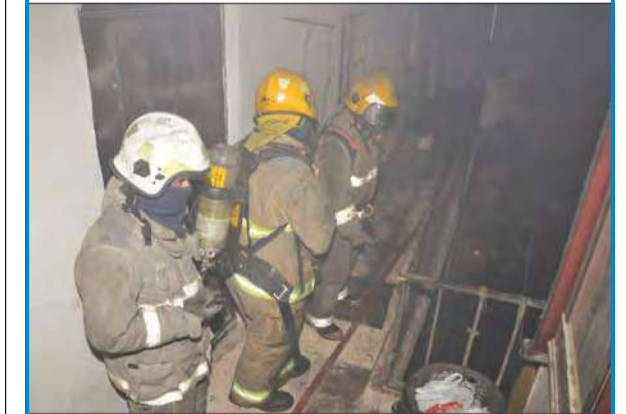
رجال الإطفاء يكافحون الحريق