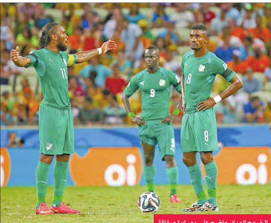
الخروج المبكر واضح على دورغبا ورفاقه

يقف شعب بأكمله وراء منتخب تشيلي هذه الدولة التي يقدر عدد سكانها بـ 17 مليون نسمة،