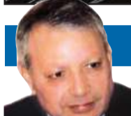
صالح القلب كاتب وسياسي أردني