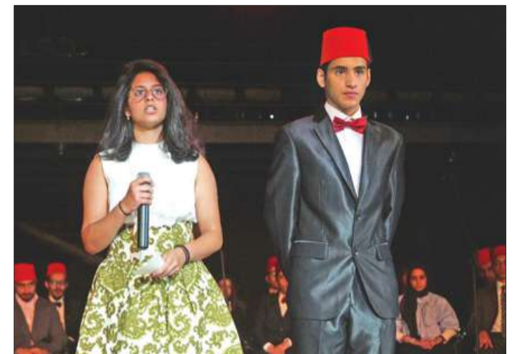
أعضاء البرنامج يقدمون الحفل