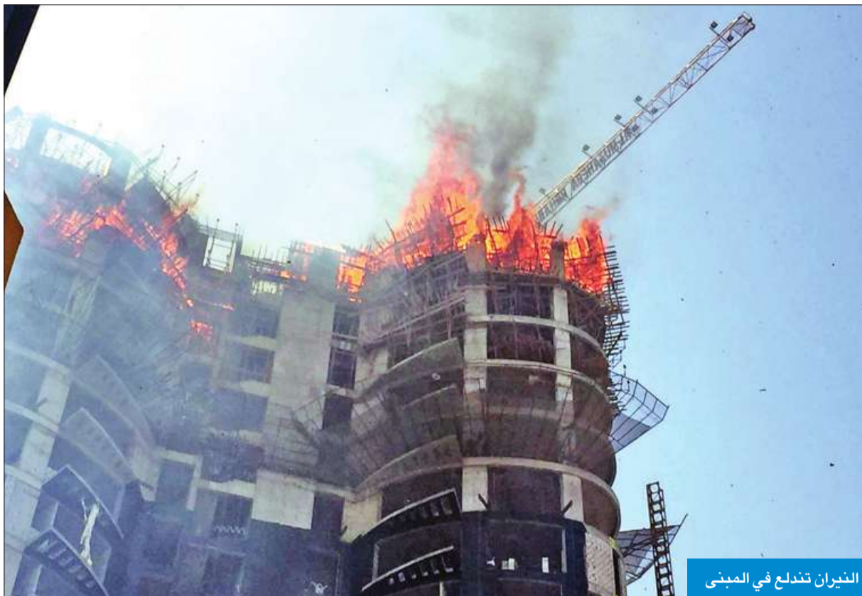
النيران تندلع في المبنى