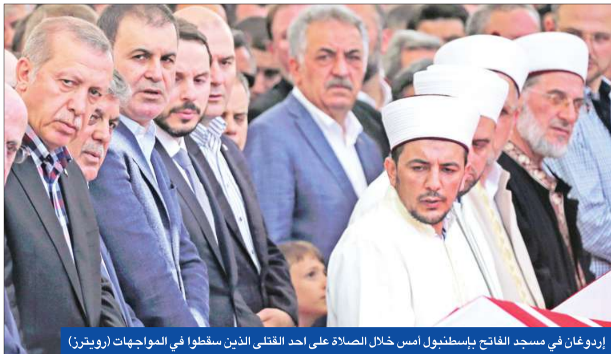
إردوغان في مسجد الفاتح بإسطنبول أمس خلال الصلاة على أحد القتلى الذين سقطوا في المواجهات