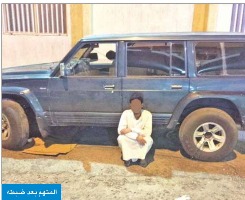
المتهم بعد ضبطه