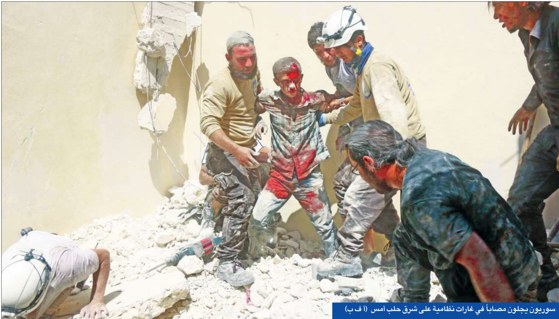
سوريون يجولون مصاباً في غارات نظامية على شرق حلب أمس

● حادث يدمر أحد المعامل العسكرية الكبيرة للنظام ● فصائل اللاذقية تستعيد كنسبا وقلعة الشلف بجبل الأكراد