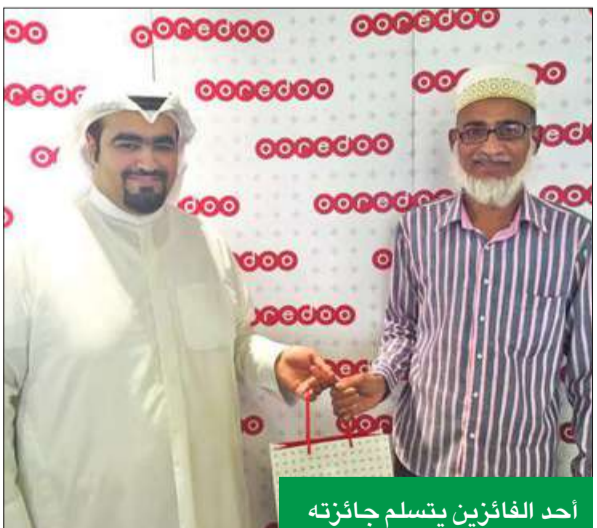
احد الفائزين يتسلم جائزته

تستمر Ooredoo الكويت، إحدى شركات مجموعة Ooredoo العالمية للاتصالات، في تقديم هدايا قيمة لمستخدمي خطوط الدفع المسبق في الأسبوع الـ 11 من الحملة، حيث فاز 7 مشتركين بجائزة سامسونج جالكسي الجديد، ومشارك واحد بجهاز iPad Mini 3.