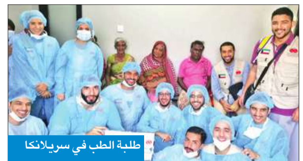
طلبة الطب في سريلانكا