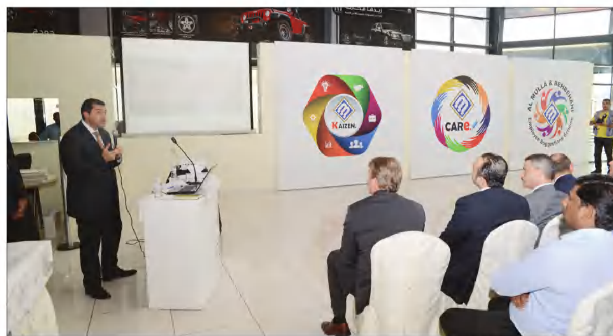
مبادرة «كير»، و«كايزن»، ونظام اقتراحات الموظفين

أطلقت شركة الملا وبهبهاني الوكيل المعتمد لسيارات كرايسلر، جيب، دودج، رام، فيات والفا روميو في الكويت مبادرة «كير» لتطوير خدمة العملاء ومرافق الشركة ورضا الموظفين لارتقاء بأدائهم، حيث يشمل البرنامج كل قسم وكل شخص يعمل في الشركة لوضع العميل في المقام الأول