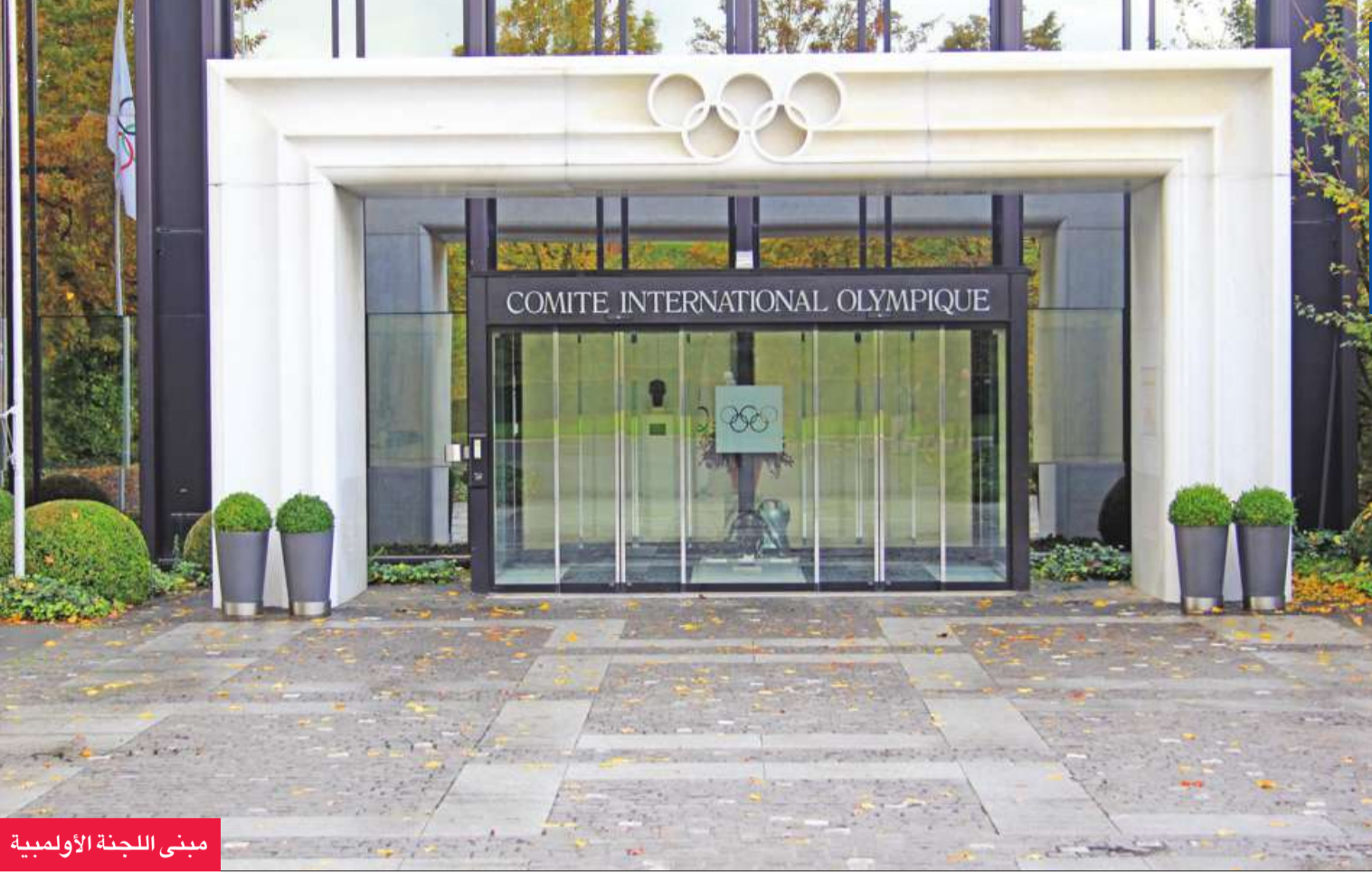
مبنى اللجنة الأولمبية

هذه المسألة وإبداء رأيها حول إمكانية قبول هذا الطلب قبل 21 يوليو... أي قبل 3 أسابيع من انطلاق منافسات ألعاب القوى. ومن بين المرشحين والمشمولين في هذا الطلب البطلة الأولمبية مرتين في مسابقة القفز بالزانة أيلينا إيسينيا بيغا المستمرة دائما بقدراتها في نادي فولغوغراد والتي هددت بمقاضاة الاتحاد الدولي في حال عدم السماح لها بالمشاركة.