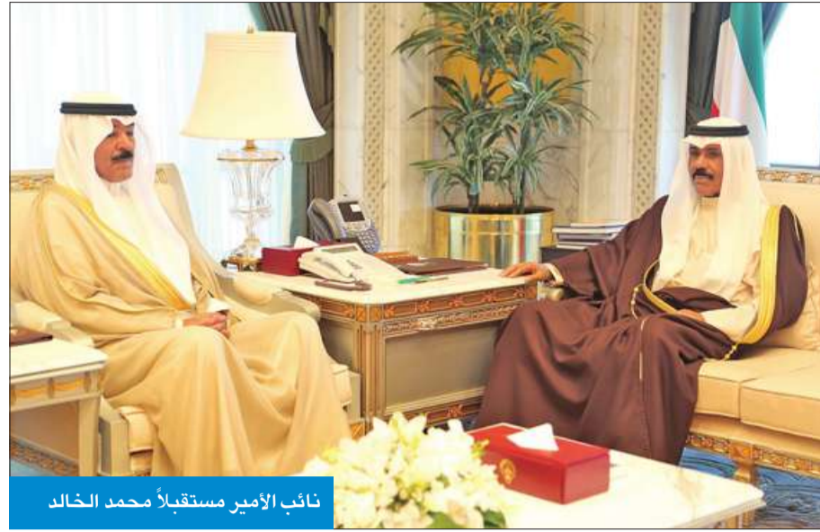
نائب الأمير مستقبلاً محمد الخالد

وتسلم الخالد من السفير تامير رسالة خطية موجهة إلى رئيس مجلس الوزراء سمو الشيخ جابر المبارك من رئيس الوزراء التركي بن علي يلدريم، تفضل بالعلاقات الثنائية وسبل تعزيزها في كل المجالات، بالإضافة إلى القضايا محل الاهتمام المشترك.