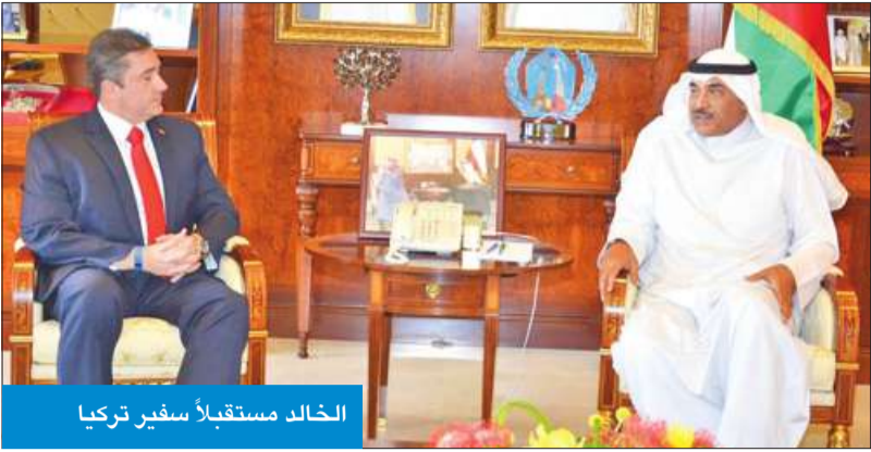
الخالد مستقبلاً سفير تركيا

الوطيدة بين البلدين الصديقين وسبل تعزيزها في كل المجالات، بالإضافة إلى أطر التنسيق المشترك حيال آخر المستجدات التي تشهدها الساحات الإقليمية والدولية.