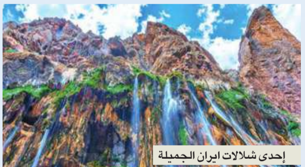
إحدى شلالات إيران الجميلة

● مختبرات التحاليل الطبية وإكلينيكية مزودة بأحدث الأجهزة. ● مساقم ترميضي من الممرضات الخريجات من الجامعات الإيرانية. ● نجاح الأطباء في علاج العقم والإنجاب في معهد رويان للخلايا الجذعية والجنينية. ● مصانع الدواء بخبرتها الطويلة نجحت في إنتاج أدوية السريري والأورام الخبيثة. ● بنك الدم في مختلف المدن الإيرانية مزود بطاقم طبي مؤهل. ● معهد رويان للأبحاث والهندسة الوراثية نجح في معالجة السريري بالخلايا الجذعية وكذلك ترميم قرنية