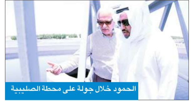
الحمود خلال جولة على محطة الصليبية

الحمود: محطة الصليبية رائدة ومميزة في العالم