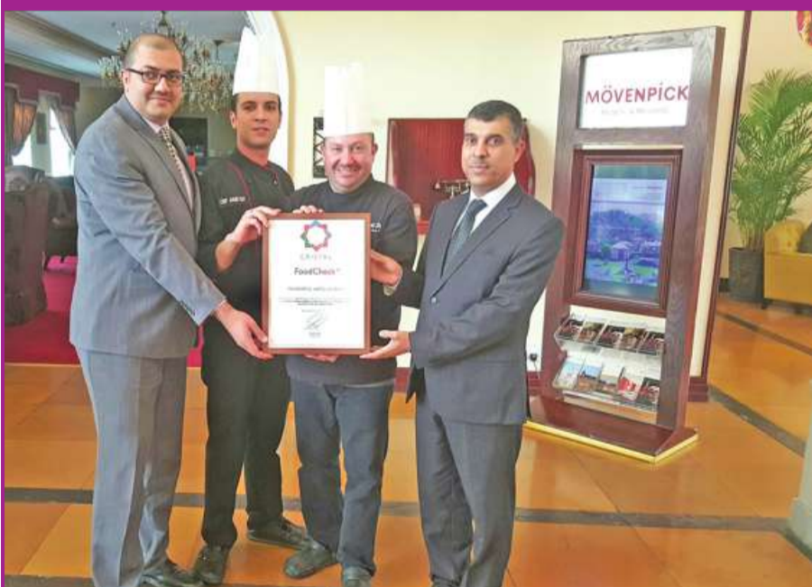
شيفات الـ «موفنيك»، يتسلمون شهادة «أي كريستال»

حصل فندق «موفنيك الكويت» على شهادة «أي كريستال»، وهي شهادة عالمية في جودة المأكولات والمشروبات والأمن والسلامة تعتمد على نظام «حسب» الذي يعدّ مدخلاً نظامياً في الفنادق العالمية. ويغطي «حسب» جميع جوانب سلامة الغذاء، بدءاً من المواد الخام وانتهاء بتقديم الأطباق للعملاء وكذلك الغرف ومدى الصحة والسلامة المهنية لوسائل الترفيه بالفندق.