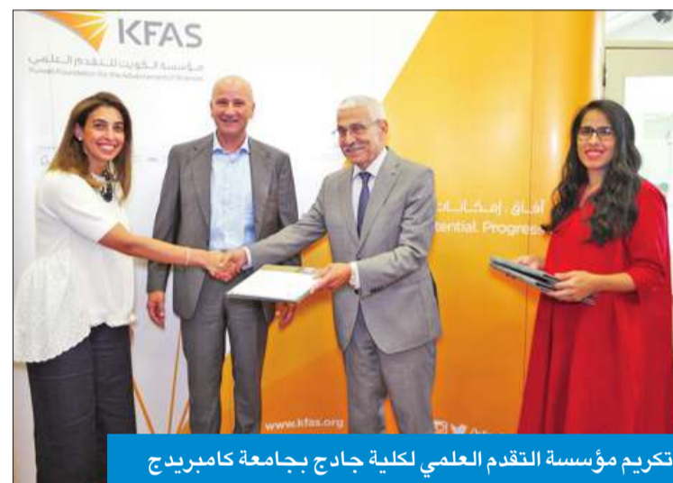
تكريم مؤسسة التقدم العلمي لكلية جادج جامعة كامبريدج