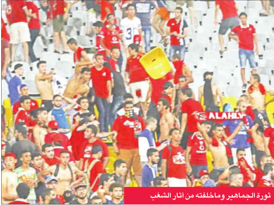
ثورة الجماهير وماخلفته من آثار الشغب

سبع نقاط، وصعد زيسكو إلى المركز الثاني وله ست نقاط، وتجمد رصيد اسبيك عند ثلاث نقاط. وحصد الأهلي صاحب الرقم القياسي في عدد القاب البطولة برصيد تسعة القاب نقطته الأولى بعد ثلاث مباريات، ويحتاج بالتالي للفوز في المباريات الثلاث المتبقية للتأهل. جاءت بداية المباراة حماسية من الأهلي حيث هاجم ميكرا عن طريق وليد سليمان ومؤمن زكريا وعمرو جمال، في حين اعتمد الوداد على الهجمة المرتدة.