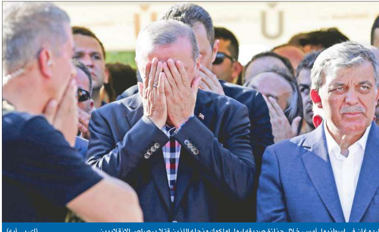
إردوغان في إسطنبول أمس، خلال جنازة صديقه أروول اولوك ونجله اللذين قتلوا برصاص الانقلابيين

دعوات دولية لأنقرة لعدم التعسف أو الانتقام من الخصوم السياسيين توقيف مستشار الرئيس وقائد «أنجريك» واستئناف العمليات الجوية ضد «داعش»