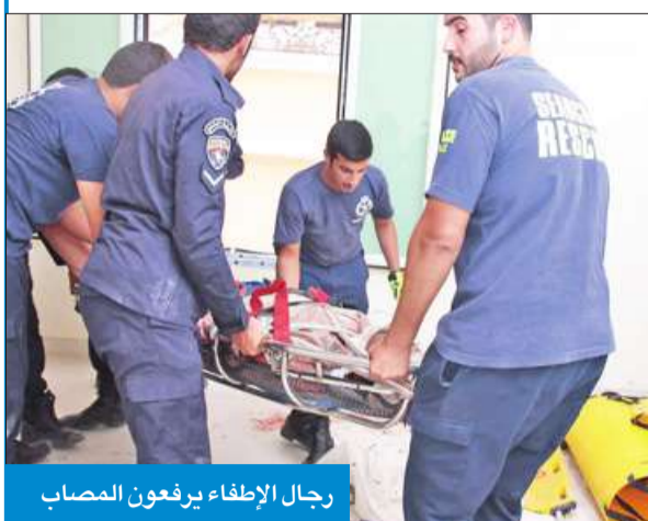
رجال الإطفاء يرفعون المصاب