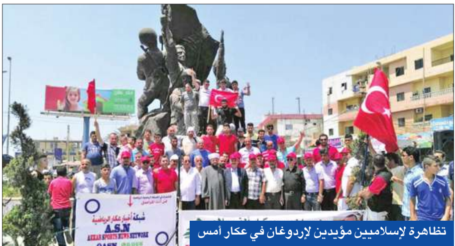
تظاهرة لإسلاميين مؤيدين لإردوغان في عكار أمس

في سياق منفصل، ترأس البطريرك الماروني الكاردينال مار بشارة بطرس الراعي قداساً احتفالياً لمسماة عيد القديس شربل لمس في دير مار مارون- عنايا. والقى الراعي عظة قال فيها: «نحتفل بعيد القديس شربل وفي القلوب غصة والم من جراء الحالة السياسية والاقتصادية المزرية التي نعيشها في لبنان. فنواب الأمة، الذين مددوا ولايتهم مرتين مخالفين للدستور، يكتفون يوماً بعد يوم بعزيمهم وفشلهم، ويفقدون مبرر وجودهم بل الحاجة إليهم، في حين يعطلون بانفسهم المجلس النيابي وسلطتهم التشريعية، ويجرمون بلادنا من رئيس منذ سنتين وشهرين، مشرعين مثل هذه الأبواب أمام الفوضى والفساد والتعثر في المؤسسات، والحالة الاقتصادية في تراجع مخيف، ويقابلها دين باكل الخزينة، وسرقة للمال العام في كل مشروع تقره السلطة الإجرائية».