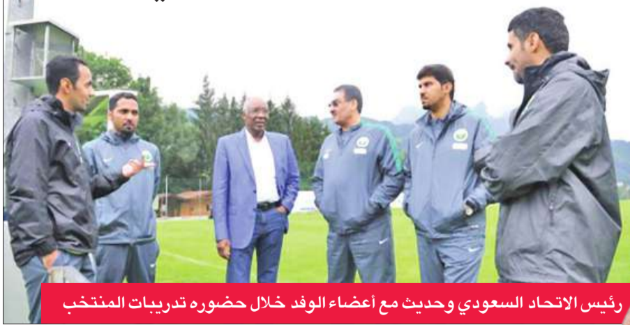
رئيس الاتحاد السعودي وحديث مع أعضاء الوفد خلال حضوره تدريبات المنتخب

التدريب القصير والطويل، واختتم الحصة التدريبية الصباحية بتقسيم اللاعبين إلى مجموعات وتنفيذ تمرين الاستحواذ بالكرة والحركة بدون الكرة وخلق المساحات. وتنوعت الحصة التدريبية المسائية ما بين الجزء اللياقي والجزء التكتيكي، وانطلقت بالتدريبات بالجري حول الملعب ثم تمارين الإحماء المتنوعة باستخدام الكرة ثم تمارين ترفيحية متنوعة، وفي الجانب التكتيكي طبقت التدريبات على كامل الملعب ومنصف الملعب، وركزت على الاستحواذ والسيطرة على الكرة واللعب السريع في المساحات الضيقة.