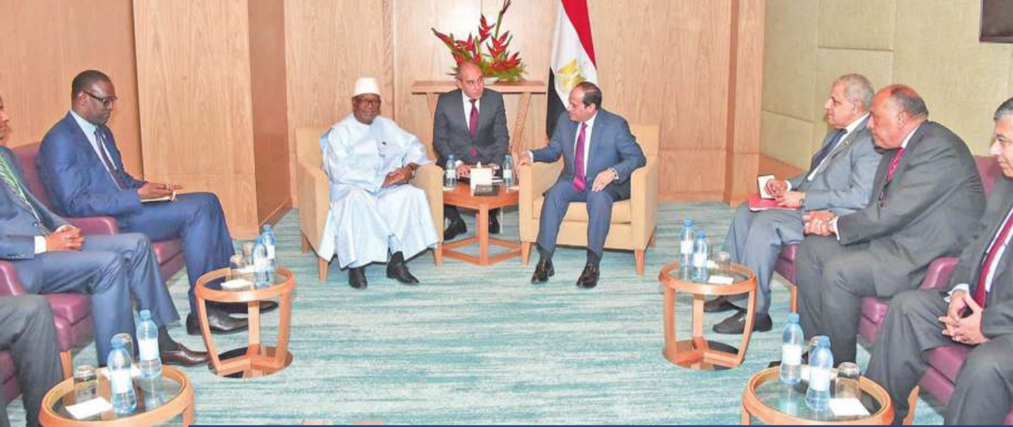
السياسي يلتقي نظيره المالي إبراهيم بو بكر كيتا في مقر إقامته في العاصمة الرواندية كيغالي أمس الأول (الجريدة)

● سفير رواندا: الرئيس المصري مفتاح خير ● سفير تل أبيب يتسلم مهامه ● البرلمان يقر «الخدمة المدنية»