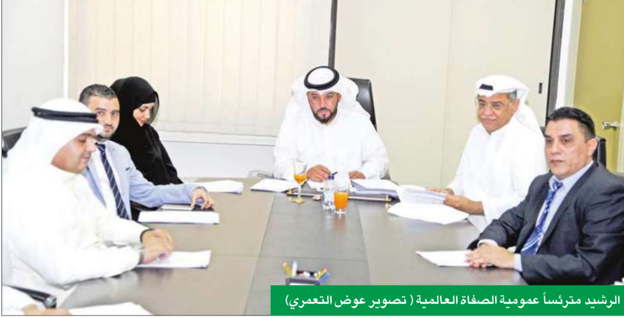
الرشيد مترسماً عمومية الصفاء العالمية

الشركة تستهدف اقتناص الفرص الاستثمارية ذات الدخل التشغيلي والخروج من الاستثمارات غير المدرة