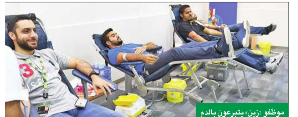
موظفو زين، يتبرعون بالدم

نظمت زين، الشركة الرائدة في تقديم خدمات الاتصالات المتنقلة في الكويت، حملة التبرع بالدم لموظفيها، بالتعاون مع بنك الدم المركزي في مقرها الرئيس بالشويخ، استكمالاً لجهودها في دعمهم على المشاركة في الحملات الاجتماعية والإنسانية طوال العام، وذكرت الشركة، في بيان صحفي، أن الحملة التي نظمتها على مدى يومين كاملين في مقرها الرئيس شهدت مشاركة عدد كبير من موظفيها، الذين حرصوا على تفعيل برنامج الشركة للمسؤولية الاجتماعية والاستدامة، حيث تهدف المبادرة إلى رفع حالة الوعي لدى موظفي زين بأهمية التبرع بالدم، حيث تستخدم هذه