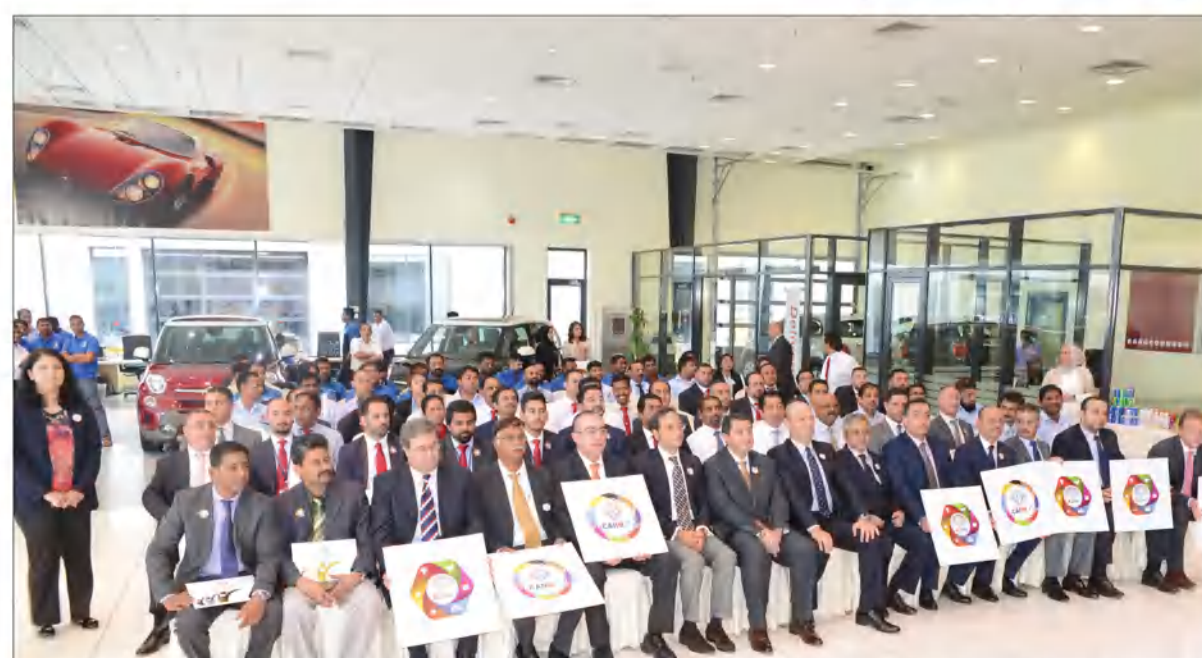
حضور العاملين من كافة الإدارات في شركة الملا وبهبهاني