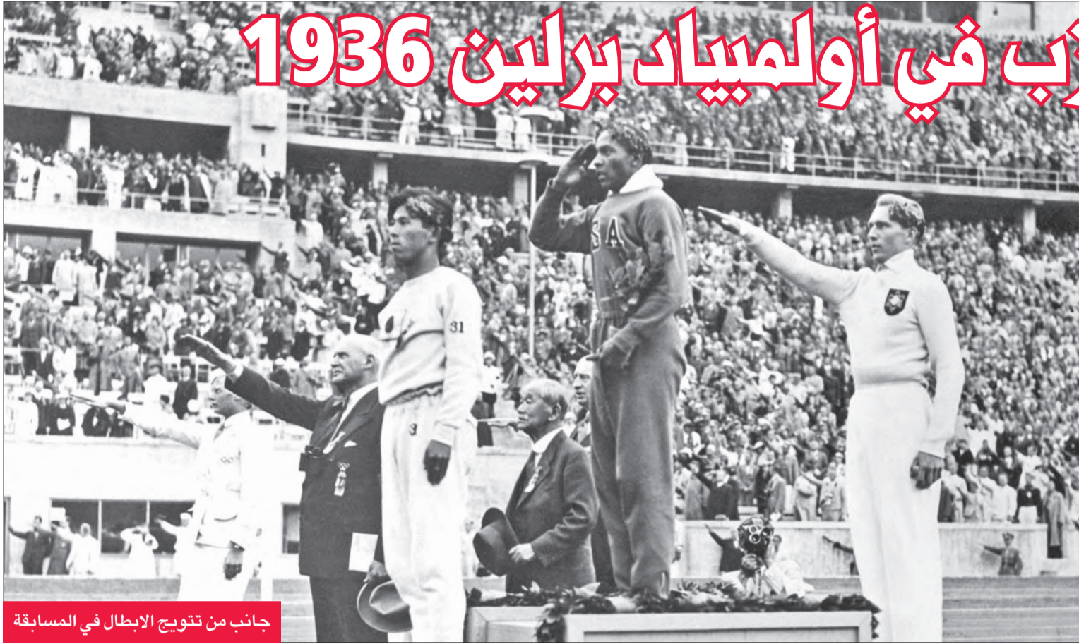
جانب من تتويج الإبطال في المسابقة

وشبيبتها وتجمعاتها، إذ لم تكن للرياضة الأفضلية والأهمية في هذا الإطار. لكن الغاية تبرر الوسيلة، فمن أجل أفضل إخراج للألعاب يعكس الصورة الإيجابية للنازية و"تسامحها" وترحبها، طلب الفوهرر من وزير الدعاية والإعلام في حكومته جوزف بول غوبلز، أن يحول برلين إلى واحة تسامح والفة.. وكان يجول معه وبصحبة قائد الطيران هيرمان غورينغ متفقدين مرافق الدورة ومطلعين على تطور الاستعداد لها... فلا عجب أن علقت أعلام عملاقة تحمل شعارين متناقضين الصليب المعكوف والحلقات الأولمبية، ولم يعد غريباً سماع صحف الشبيبة النازية تحيي الشعلة والألعاب أفرادها الوفود!