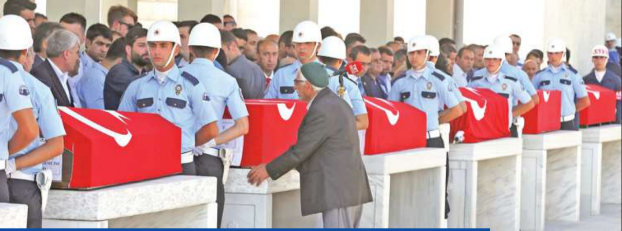
نعوش شرطين سقطوا في هجوم الانقلابيين خلال تشييع الضحايا في إسطنبول أمس

وطالب وزير الخارجية الفرنسي جان مارك ايرولت