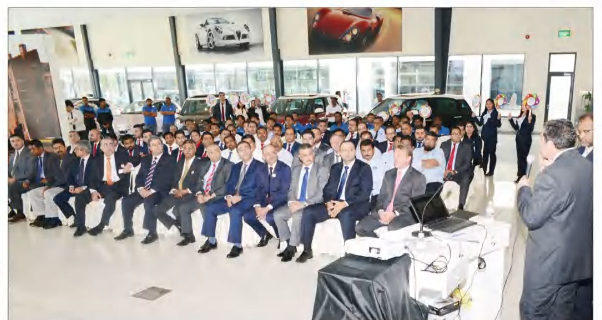
متابعة واهتمام من جميع العاملين في شركة الملا وبهبهاني