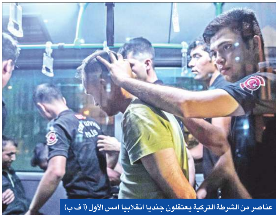
عناصر من الشرطة التركية يعتقلون جندياً انقلابياً أمس الأول