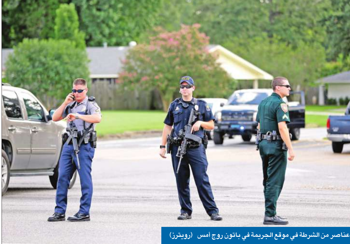
عناصر من الشرطة في موقع الجريمة في باتون روج أمس

برصاص مسلحين مقنعين يُعتقد أنهم سود، قُتل أمس ثلاثة عناصر شرطة، وأصيب 4 معظمهم في حالة حرجة، وذلك في مدينة باتون روج عاصمة ولاية لويزيانا الأمريكية، التي شهدت تظاهرات تخللتها أعمال شغب، بعد مقتل بائع الأسطوانات الأسود إلتون ستربلينغ على يد شرطة المدينة. وجاء إطلاق النار بعد 10 أيام من مجزرة دالاس، التي راح ضحيتها 5 شرطيين برصاص مسلح أسود متشدد خلال تظاهرة ضد عنف الشرطة بحق الأميركيين من أصل إفريقي. وذكرت التقارير أن الشرطة تلقت بلاغاً بأن مسلحاً يحمل رشاشاً كان يسير بطريقة مريبة على الطريق السريع، ولدى وصولها إلى الموقع، فتح مسلحون، كانوا يرتدون ملابس سوداء تماماً، النار عليها بطريقة عشوائية، مبيحة أن الشرطة تمكنت من تصفية أحدهم، بينما تلاحق آخرين، في وقت شهدت باتون روج أمس تظاهرات محدودة مناهضة للشرطة شارك فيها العشرات، وكانت الولايات المتحدة شهدت في الأسابيع الأخيرة توتراً عرقياً، بعد مقتل ستربلينغ ورجل أسود آخر يدعى فيلانكو كاستيل بولاية مينيسوتا، إذ أثار بث مقطعين مصورين للحادثتين على وسائل التواصل الاجتماعي، احتجاجات واسعة في كل المناطق الأميركية. وكانت التظاهرات تنتقل إلى مستوى آخر من التصعيد، غير أن مجزرة دالاس أثار مخاوف، ما أدى في النهاية إلى تناقص أعداد المتظاهرين. يذكر أن نحو ألف حالة قتل بالبرصاص تحدثت على أيدي الشرطة الأميركية سنوياً، لكن نسبة كبيرة من هذه الحالات تؤدي بحياة أميركيين سود.