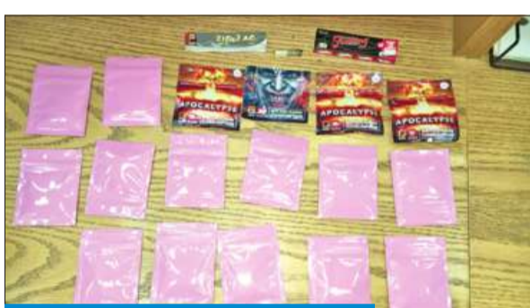
المواد المخدرة التي ضبطت مع المتهمين

إحالتها مع المضبوطات إلى الإدارة العامة لمكافحة المخدرات والخمور.