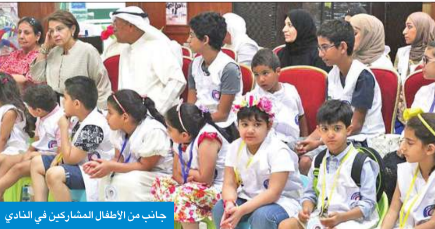
جانب من الأطفال المشاركين في النادي