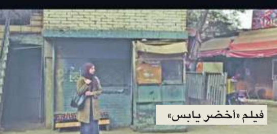
فيلم «أخضر بابيس»

بعد غياب 17 عاماً، تعود السينما المصرية إلى المشاركة في «مهرجان لوكارنو السينمائي» في سويسرا، عبر فيلمين في عرضها الأول عالمياً، «الماء والخضرة والوجه الحسن» الذي يشارك في المسابقة الرسمية للمهرجان، «أخضر بابيس» للمخرج محمد حماد الذي سيرعرض ضمن مسابقة العمل الأول للأفلام الروائية الطويلة، ويستعد صناع الفيلم لسفر لحضور عروض الفيلمين بدعوة من إدارة المهرجان. يذكر أن «المدنية» للمخرج يسري نصر الله (1999) آخر الأفلام المصرية المشاركة في «مهرجان لوكارنو».