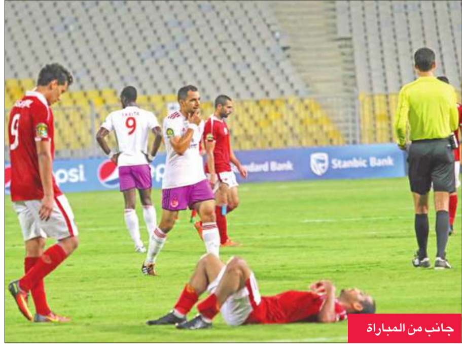
جانب من المباراة

خيم التعادل السلبي على المباراة التي جمعت النادي الأهلي المصري بضيفه الوداد المغربي أمس الأول السبت في الجولة الثالثة من منافسات المجموعة الأولى من دوري أبطال إفريقيا لكرة القدم.