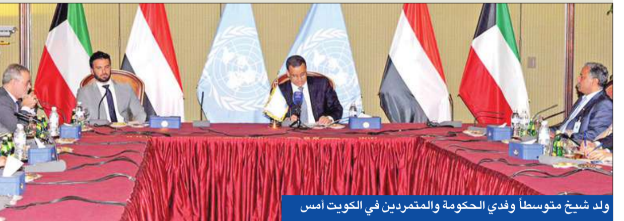
ولد شيخ متوسلاً وفدي الحكومة والمتمردين في الكويت أمس

الخالد يبحث التطورات مع المبعوث الأممي والجارالله يريد انطلاقة على أسس واضحة