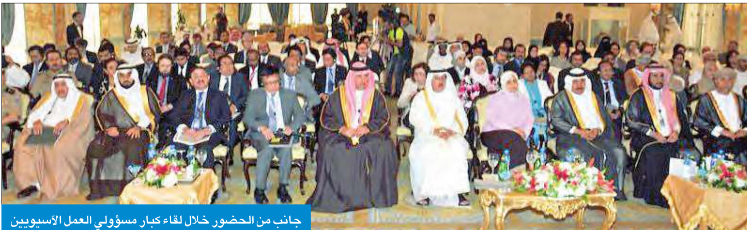
جانب من الحضور خلال لقاء كبار مسؤولي العمل الآسيويين

انطلاق فعاليات الاجتماع التشاوري الأول للدول الآسيوية المرسلة والمستقبلة للعمالة