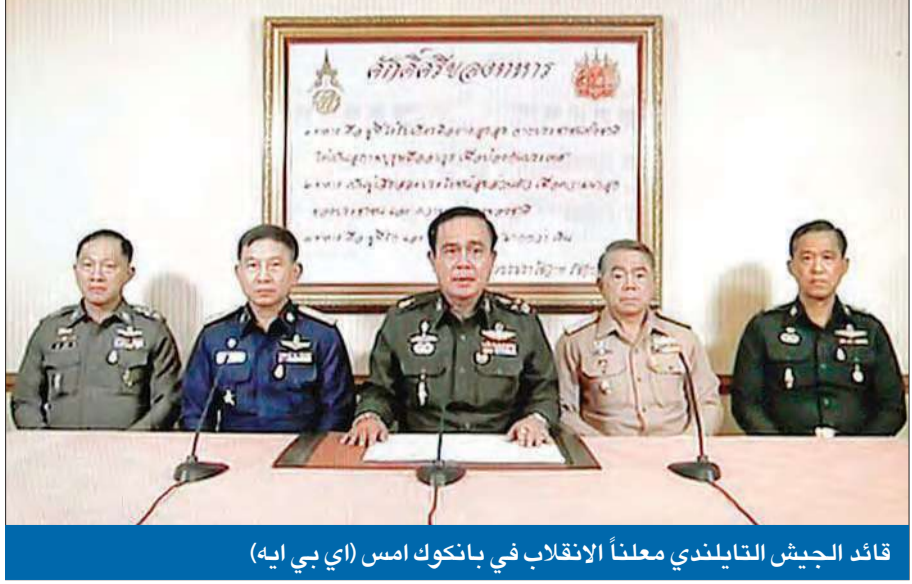
قائد الجيش التايلندي معلناً الانقلاب في بانكوك أمس

أمر المتظاهرين بالعودة واحتجز السياسيين وحذر الإعلام