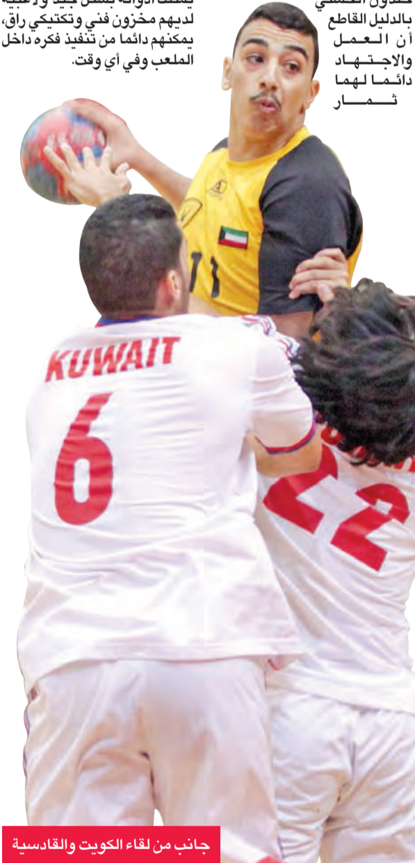
جانب من لقاء الكويت والقادسية