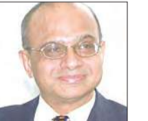
شينزو أبي الهند

من المرجح أن يحول انتصار مودي العلاقات الهندية اليابانية - وهي العلاقة الثنائية الأسرع نمواً وتطوراً في آسيا - إلى المحرك الرئيسي في استراتيجية «النظر إلى الشرق» التي تنتهجها الهند، والتي تسعى بمباركة الولايات المتحدة إلى تعزيز التعاون الاقتصادي والاستراتيجي مع حلفاء الولايات المتحدة وشركائها في شرق وجنوب شرق آسيا