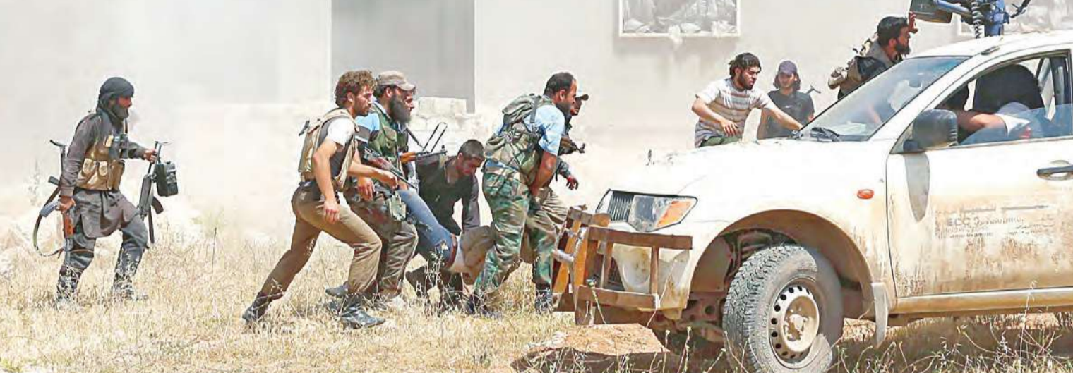
مقاتلون معارضون يحلون زميلاً لهم أصيب في قصف نظامي على بلدة مورك في حماة

المعارضة تخشى حملة إعدامات على المحتجزين • صواريخ أرض- أرض وإسقاط طائرة في ريف دمشق