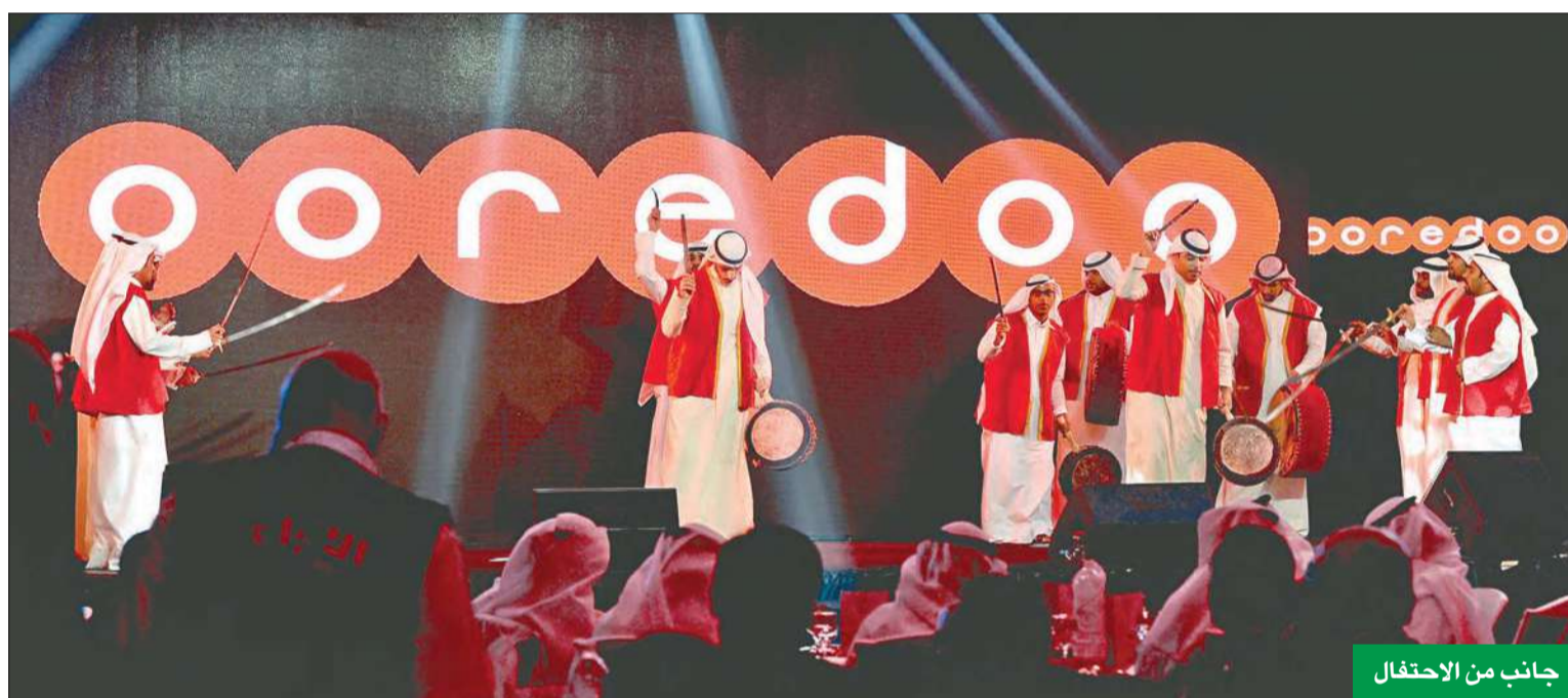
جانب من الاحتفال

وكانت Ooredoo أعلنت رسمياً تغيير علامتها التجارية في 25 فبراير 2013، خلال المؤتمر العالمي للجوال،