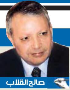
صالح القلاب كاتب وسياسي أردني