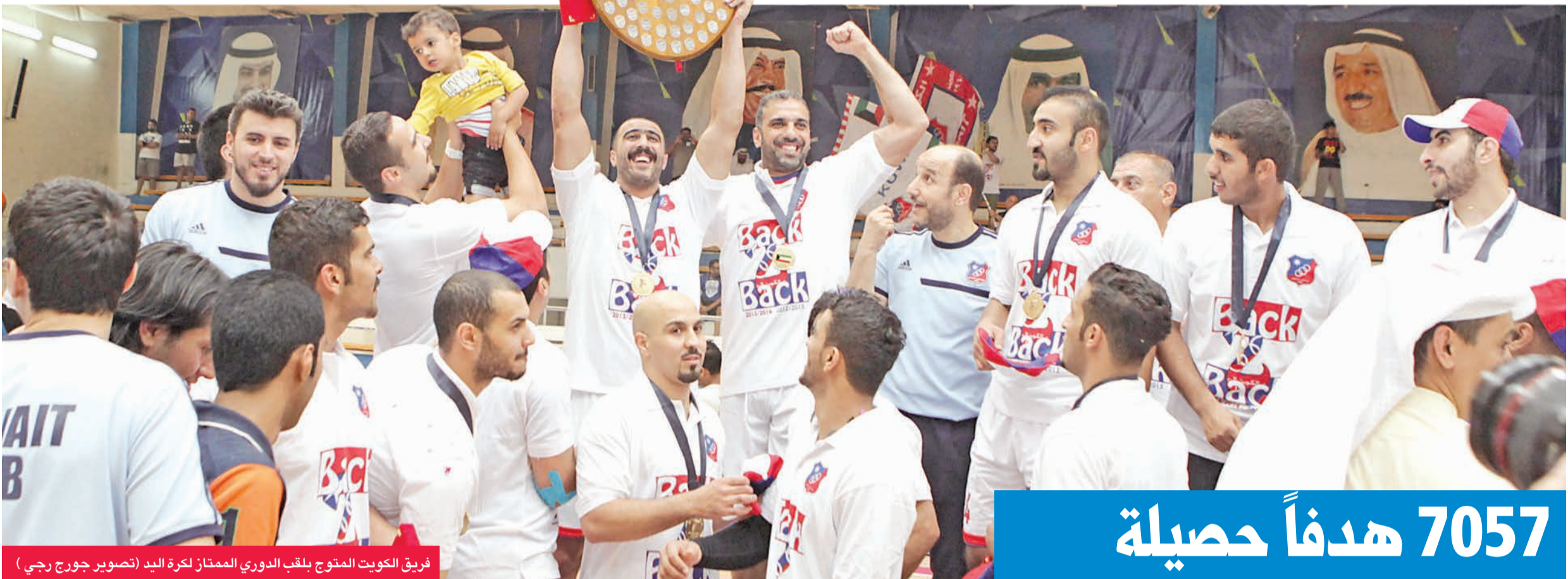
فريق الكويت المتوج بلقب الدوري الممتاز لكرة اليد