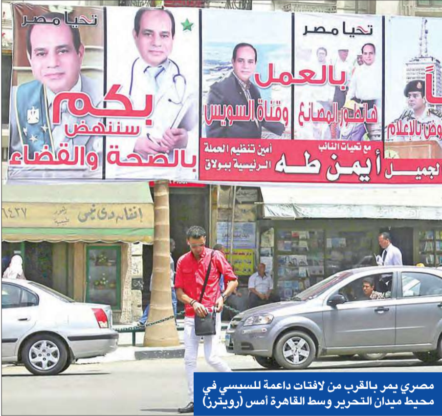
مصري يمر بالقرب من لافتات داعمة للسيسي في محيط ميدان التحرير وسط القاهرة أمس

• المساعدات الأميركية «مرهونة» • «دعم الشرعية» يدعو إلى التصعيد • مقتل إرهابيين وإصابة 9 مجندين