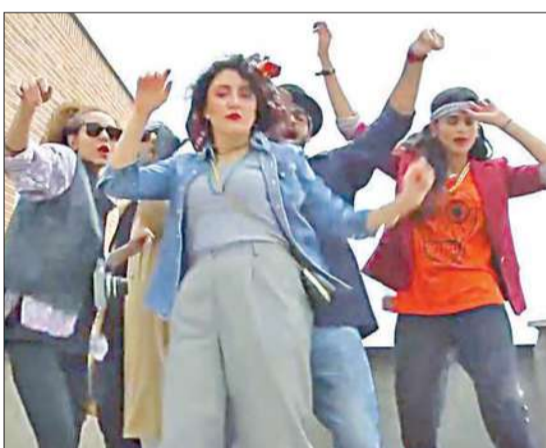
بالقبض على الإيرانيين السنة لأنهم ساهموا في إنتاج «مقطع مصور فاحش» أضر بالأخلاق العامة، ونشره على الإنترنت. وقال مصدر على صلة

قال إيراني، في بيان عبر الإنترنت، إنه كان أحد ستة إيرانيين أفرج عنهم الليلة قبل الماضية، بعد اعتقالهم بسبب ما قالت الشرطة إنه ظهورهم في تسجيل مصور يرددون فيه أغنية أميركية لموسيقى البوب. وفي التسجيل المصور يظهر الستة -ثلاث نساء وثلاثة رجال- وهم يرقصون ويغنون على إيقاع أغنية «هابي» لمغني البوب فاريل وليامز في محاكاة للأغنية العالمية. والنساء الثلاث بلا غطاء الرأس الذي يلزم القانون الإسلامي المطبق في إيران المرأة بارتدائه. وقبر اعتقالهم موجة غضب بين محبي الأغنية الذين دانوا عبر مواقع التواصل الاجتماعي ما راوا أنه رد مفرد من جانب السلطات في الجمهورية الإسلامية على وسيلة للمرح. وانتقد وليامز نفسه اعتقال الإيرانيين. وكتب في تغريدة على تويتر: «من المحزن أن هؤلاء الأشخاص قبض عليهم لمحاولتهم نشر السعادة». وبت التلفزيون الرسمي الإيراني برنامجاً يوم الثلاثاء الماضي يظهر الإيرانيين الستة وهم يعربون على ما يبدو عن ندمهم، وقالت إحدى النساء الثلاث: «إنهم تهبوا إلا ينشروا التسجيل المصور». ونقلت وكالة الطلبة الإيرانية لانباء عن قائد شرطة طهران حسين ساجدينيا قوله إنه أمر