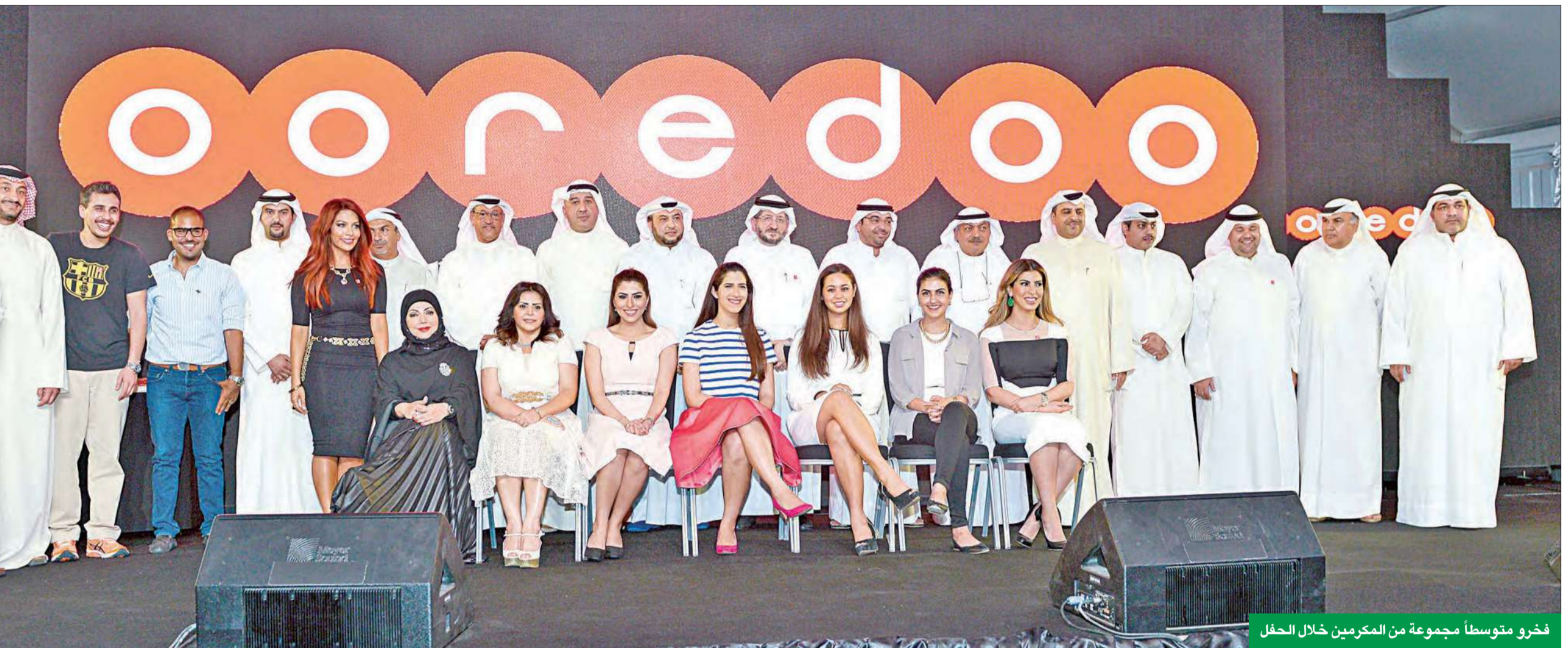
فخرو متوسطاً مجموعة من المكرمين خلال الحفل

«الوطنية» دشنت علامتها التجارية الجديدة «ooredoo»