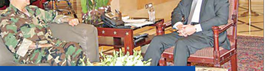
رئيس الحكومة اللبنانية تمام سلام مستقبلاً قائد الجيش العميد جان قهوجي في السراي الحكومي امس

جججج يتهم «8 آذار» بالاعتصم... ومذكرتان لمحكمة اللادقية بحق جنبلاط وخشان