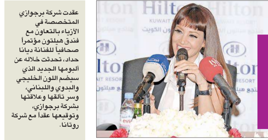
المطربة ديانا حداد خلال المؤتمر

عقدت شركة برجوازي المتخصصة في الأزياء بالتعاون مع فندق هيلتون مؤتمراً صحافياً للفتاة ديانا حداد، تحدثت خلاله عن ألومها الجديد الذي سيضم اللون الخليجي والبدوي واللبناني، وسر تالقها وعلاقتها بشركة برجوازي، وتوقعها عقداً مع شركة روتانا.