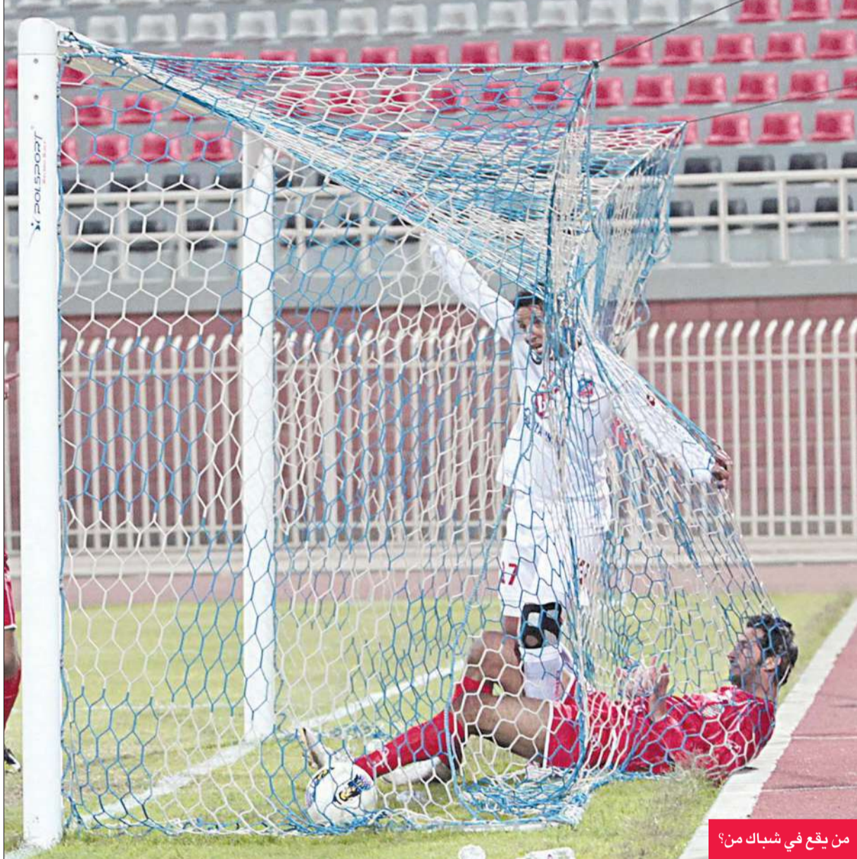
من يقع في شباك من؟

العربي يخشى اليرموك وفي المباراة الرابعة والأخيرة يخشى العربي صاحب المركز الخامس فريق اليرموك الشباب، الذي يقدم مستويات جيدة هذا الموسم رغم تواجده في المركز العاشر، ويأمل مدرب الفريق رومانو مواصلة نغمة الفوز التي اختتمها بالفوز على الصليبيخات في كأس الأمير، وفي الجهة الأخرى يتطلع اليرموك إلى مقارعة الفرق الكبيرة، وتحقيق نتائج جيدة لتأكيد أنه فريق قادم وإن كان ذلك في الموسم المقبل تحت قيادة المدرب الإسباني أنطونيو.