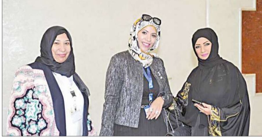
بعض مديرات رياض الأطفال