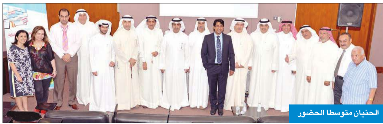
الحينان متوسطا الحضور

التواصل الشخصي مع الأهل والأصدقاء ومع الجهات الحكومية المعنية في الدولة. وأشار إلى أن هناك سلبيات كثيرة في شبكات التواصل الاجتماعي، منها العزلة والانفرادية والإدمان والتعرض على العنف وانشغال الموظفين عن العمل والإنتاجية والقرصنة وانتهاك الامان والخصوصية وغيرها.