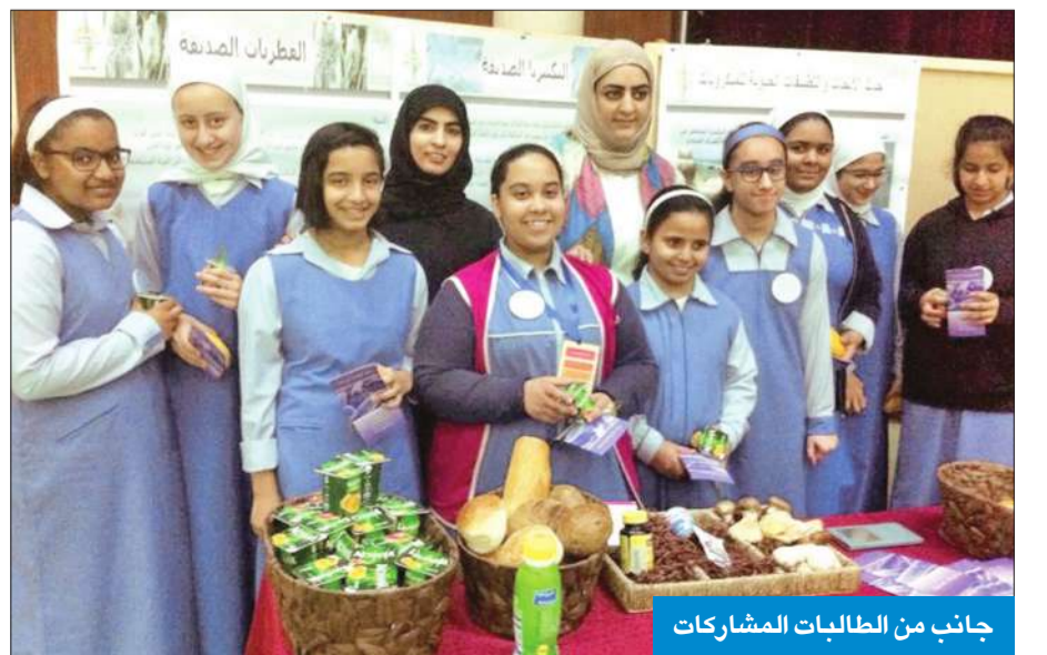
جانب من الطالبات المشاركات