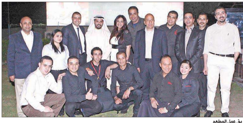
فريق عمل المطعم

أطلقت سلسلة مطاعم روبي تيزوداي قائمة الطعام الجديدة، التي تحوي أصنافاً تخرج عن المألوف، بنكهات شهية تجعل من زيارة أحد مطاعم روبي تيزوداي مهمة تستحق التجربة، وتم تقديم الأطباق الجديدة للحضور، وهي باربيكيو فلات بريد، كالفورنيا تشيكن فلات بريد، فور تشيز بيتاكا فلات بريد.