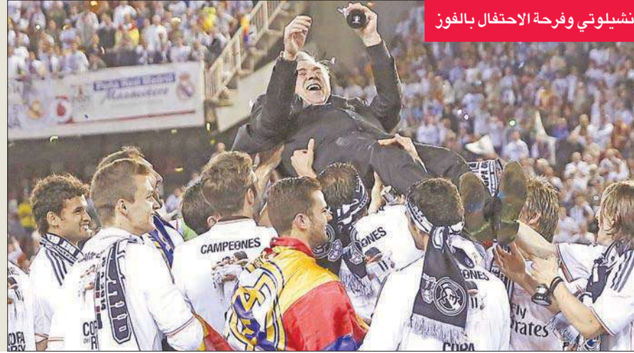
أنشيلوتي وفرحة الاحتفال بالفوز

أكد الإيطالي كارلو أنشيلوتي، المدير الفني لريال مدريد الإسباني أن فريقه "استحق" الفوز بكأس ملك إسبانيا للمرة الـ19 في تاريخه، لذيونا. قدم الفريق أداء جيدا في شوط المباراة الأول، ثم دخل برشلونة في أجواء المباراة". وأوضح "لكن سنحت لنا فرص لحسم النتيجة قبل (هدف الويلزي غاريت بييل). بعد فوزه على برشلونة. وقال أنشيلوتي، في تصريحات صحفية عقب المباراة "لقد قدمنا كل ما يمكننا. نحن سعداء بما حققناه في تاريخه، وإشباعنا من هذه البطولة".