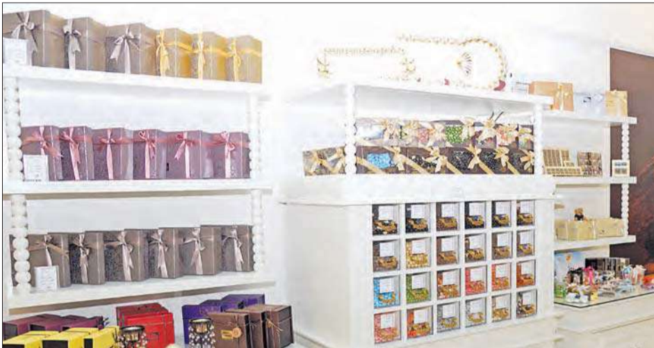
جانب من المحل