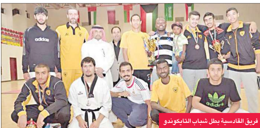
فريق القادسية بطل شباب التايكونديو

التحكيم لخوض المنافسات بين الأندية بشكل سليم وفق الإمكانيات البسيطة المتاحة دون أي عراقيل قد تكون لها أثر سلبي على أجواء المنافسة في البطولات.