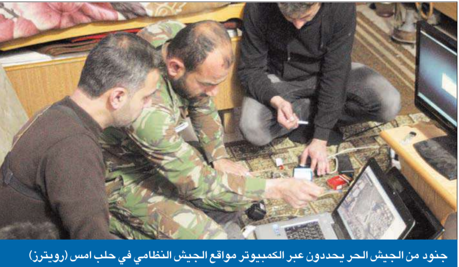
جنود من الجيش الحر يحدون عبر الكمبيوتر مواقع الجيش النظامي في حلب