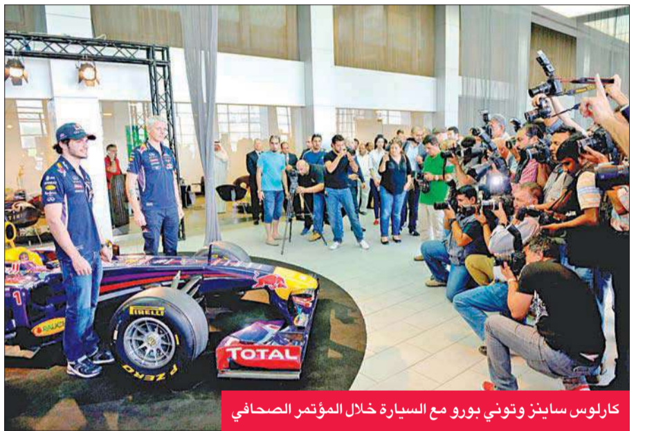
كارلوس ساينز وتوني بوروز مع السيارة خلال المؤتمر الصحفي

أقام فريق ريد بل رايسينغ لسباقات الفورمولا واحد مؤتمراً صحافياً في صالة عرض إنفينيتي اليابطين صباح أمس الخميس بمناسبة زيارة الفريق للمشاركة في الاستعراض الذي سيقام اليوم الجمعة عند الساعة الثانية ظهراً على شارع الخليج العربي قرب أبراج الكويت، تحت رعاية وزير الإعلام وزير الدولة لشؤون الشباب الشيخ سلمان الحمود وبالتنظيم النادي الكويتي للربع ميل لسباق السيارات والدراجات. وبالإضافة إلى عرض سيارة إنفينيتي ريد بل رايسينغ ستشهد الكويت عرضاً ممتعاً سيقدّمه الدراج الألماني كريستيان فايفر وهو بطل العالم لأربع مرات في العرض الحر على الدراجات النارية، وسيقدّم خلاله أصعب المخاطرات على المسجلة باسمه. كما سيقوم بطل الشرق الأوسط في تسلق الهضبة وصاحب الرقم القياسي لأطول انحراف في موسوعة غينيس، اللبناني عبدو فغالي، بتقديم عروض مميزة في فن الانحراف. وتحدث السائق الإسباني كارلوس ساينز