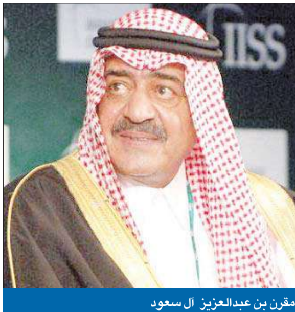
مقرن بن عبدالعزيز آل سعود

● الملك عبدالله اشترط عدم تعديل القرار ● العاهل السعودي يستقبل أوباما اليوم