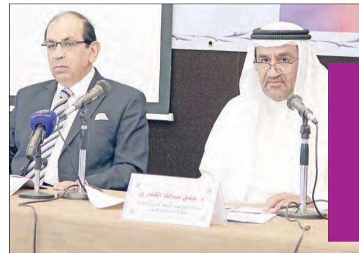
د. عمارة خلال المحاضرة (إلى اليسار)

استضافت مؤسسة الكويت للتقدم العلمي، د. أيمن فؤاد عمارة، الفائز بجائزة الكويت في مجال التراث العلمي العربي والإسلامي في موضوع «الخطط والتسجيل الطبوغرافي للمدن لعام 2009». وقد القي د. عمارة خلال زيارته محاضرتين وذلك في كلية العلوم الاجتماعية تحت عنوان «تطور التأليف في الوصف من الوصف الأدبي إلى الوصف المرئي» والثانية عن «خزائن الكتب في مصر حتى إنشاء المكتبة الخديوية».