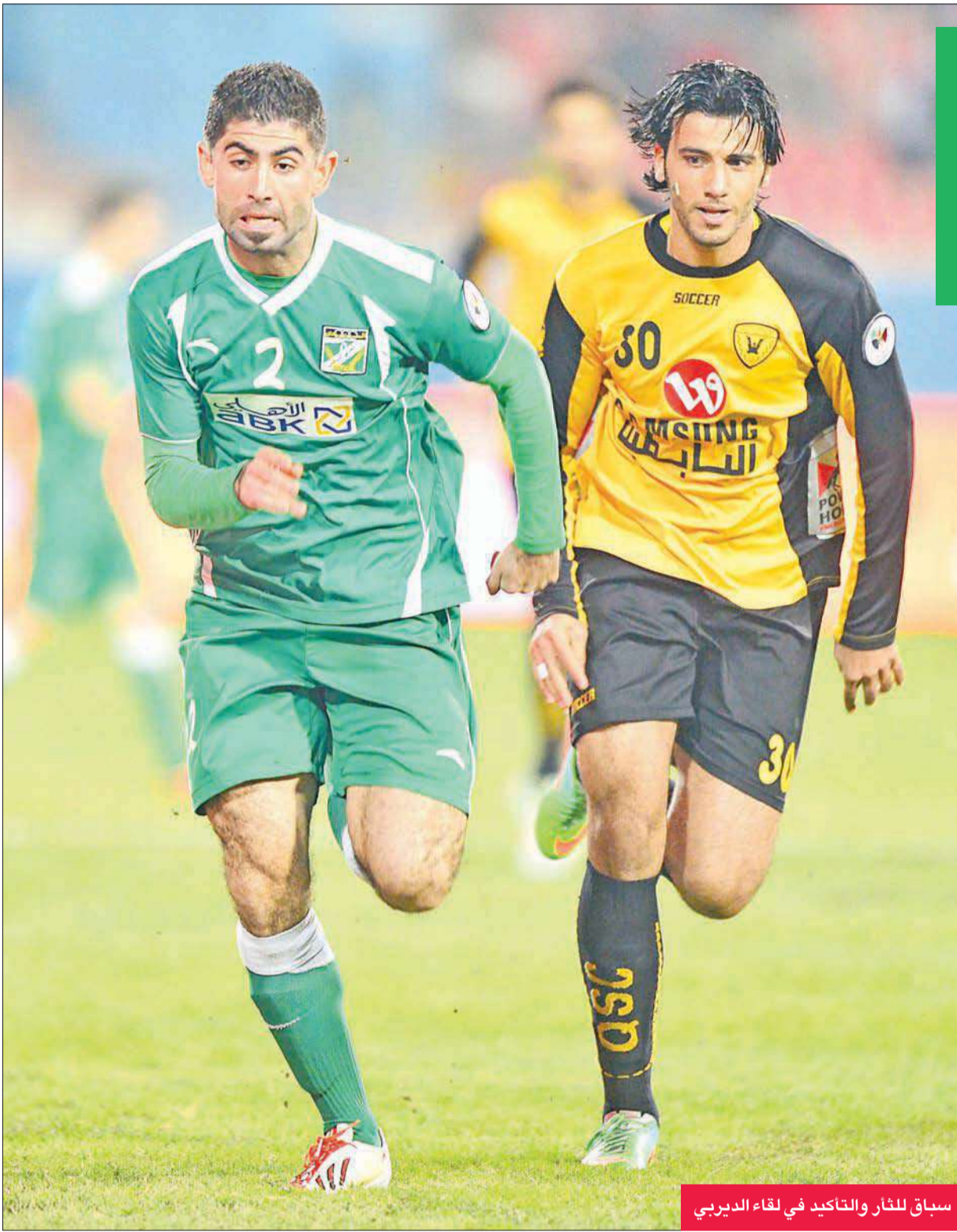
سباق للثلاث والتاكيدي في لقاء الديربي