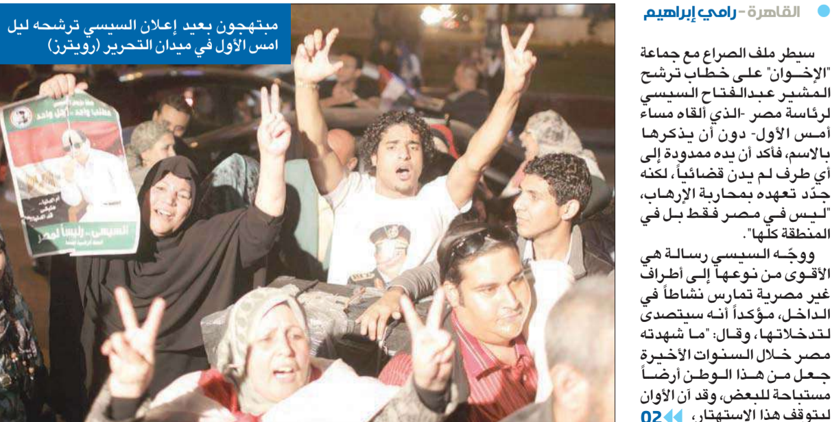
القاهرة - رامي إبراهيم سيطرت ملف الصراع مع جماعة الإخوان على خطاب ترشح المشير عبدالفتاح السيسي لرئاسة مصر - الذي ألقاه مساء أمس الأول - دون أن يذكرها بالاسم، فأكد أن يده ممدودة إلى أي طرف لم يبد قسائياً، لكنه جدد تعهده بمحاربة الإرهاب، ليس في مصر فقط بل في المنطقة كلها. ووجه السيسي رسالة هي الأقوى من نوعها إلى أطراف غير مصرية تمارس نشاطاً في الداخل، مؤكداً أنه سيتصدى لتدخلاتها، وقال: "ما شهدته مصر خلال السنوات الأخيرة جعل من هذا الوطن أرضاً مستباحة للبعض، وقد أن الألوان ليتوقف هذا الاستهتار، 02

السيسي المرشح... يد للمصالحة ويد لمحاربة الإرهاب «في مصر والمنطقة» اختيار حجازي رئيساً لهيئة الأركان تسبب في مفاجأة