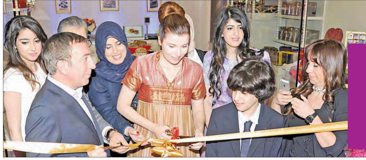
قص شريط الافتتاح

المناسبة «الربيعية والعثمان» تفتتح «Bind Chocolate»