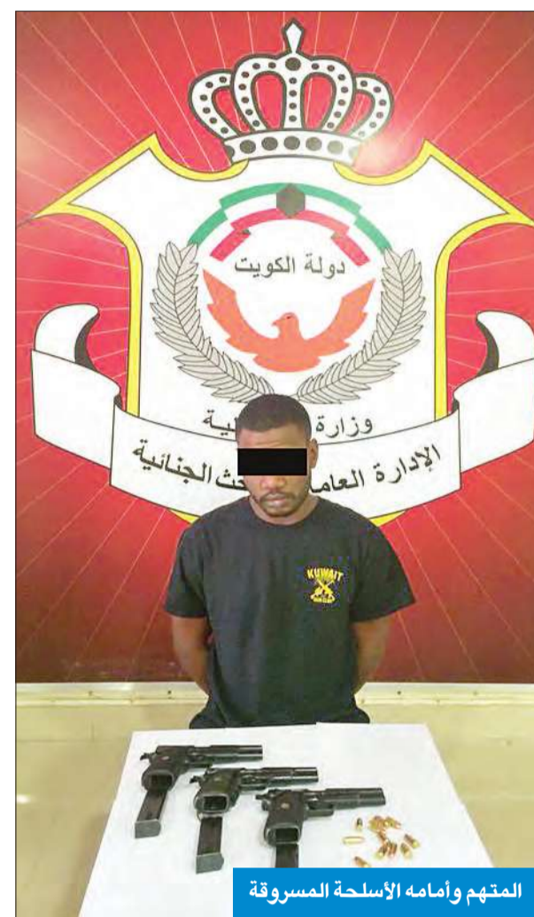
المتهم وأمامه الأسلحة المسروقة

أعلنت وزارة الداخلية أن الأجهزة الأمنية تمكنت من ضبط سارق الأسلحة من معسكر القوات الخاصة، وهو عسكري برتبة وكيل عريف، وقد عثر بحوزته على الأسلحة المسروقة.