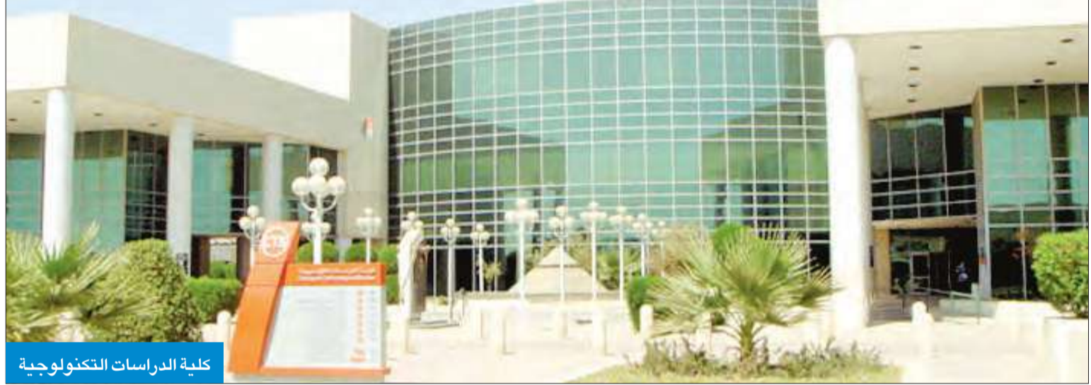
كلية الدراسات التكنولوجية

تعليمية مناسبة للجميع، وبارك الهاجري في تصريح صحفي أمس إقرار الاتحاد الإنجاز للجموع الطلابية وترجمته على أرض الواقع، وهذا ليس نهاية المطاف، بل ستكون هناك إنجازات في الأيام القادمة لصالح طلاب وطالبات التطبيقية، وتحقيق طموحهم بشكل عام على مستوى الكليات والمعاهد.