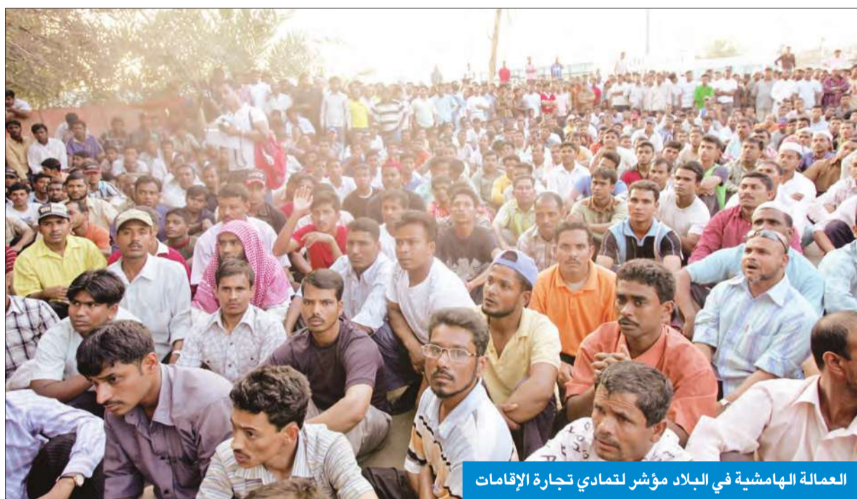
العمالة الهامشية في البلاد مؤشر لتنامي تجارة الإقامات

غير صحيح اختيار الرميحي مديراً لـ «هيئة العمل» • إغلاق باب تحويل «التجارية» إلى «الأهلي» نهائياً مطلع أبريل