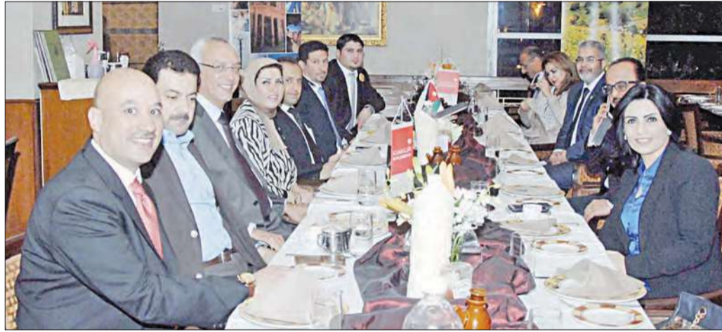
المدعوون خلال حفل العشاء