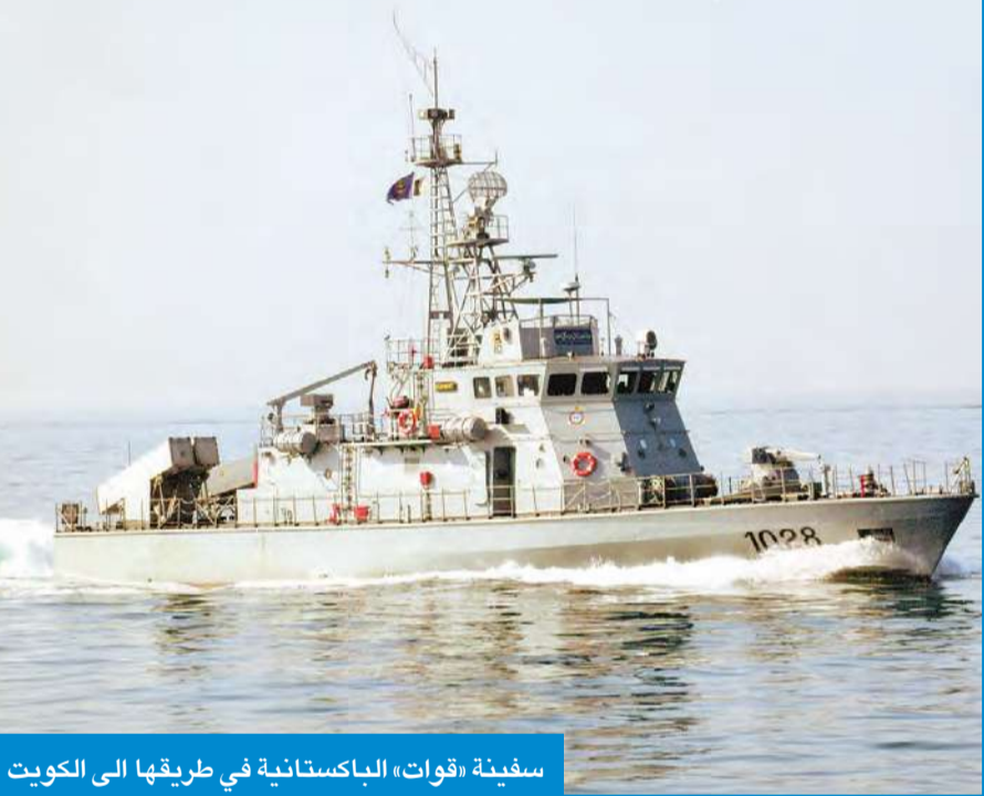
سفينة "قوات" الباكستانية في طريقها إلى الكويت