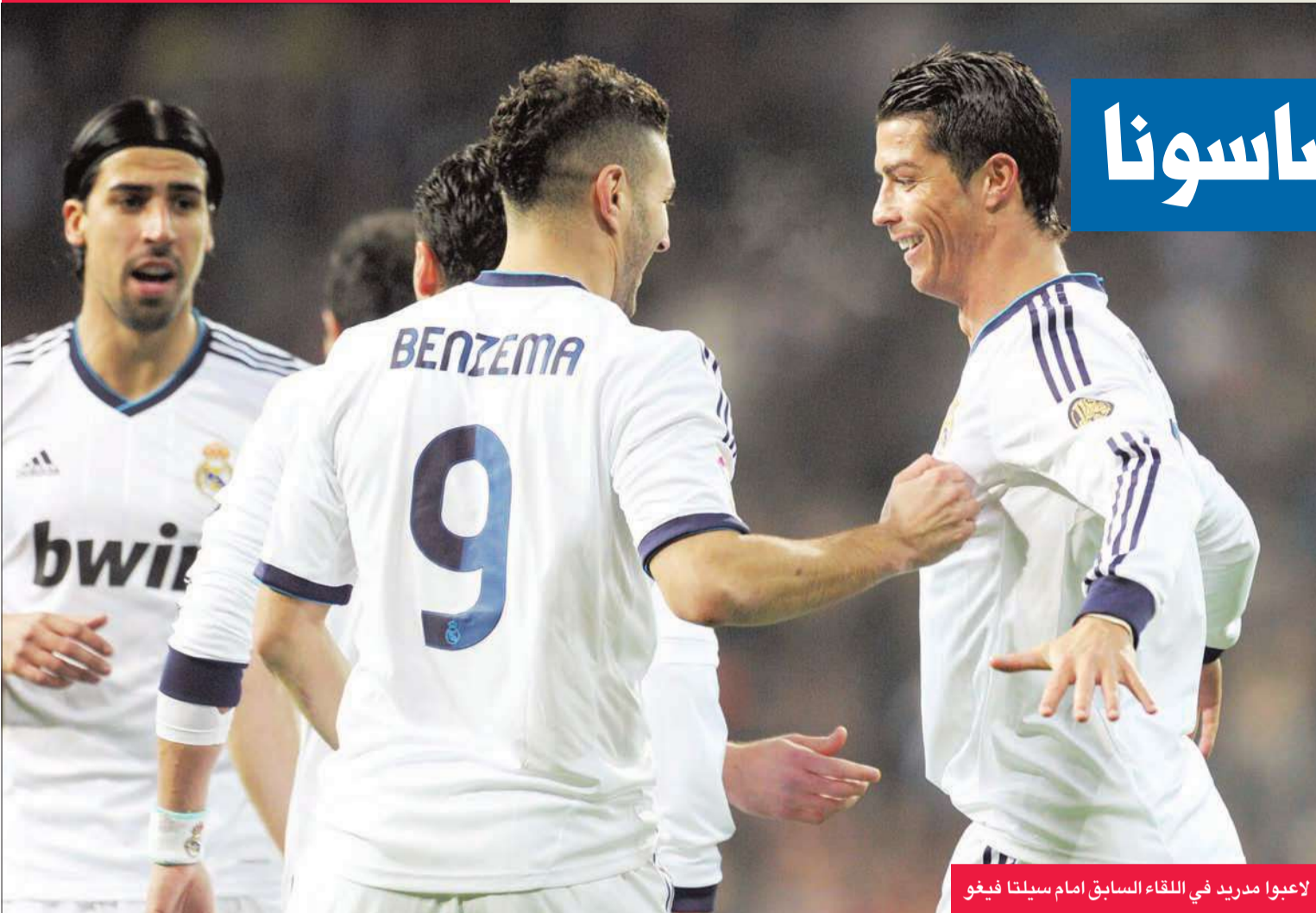
لاعبوا مدريد في اللقاء السابق أمام سيلتا فيغو