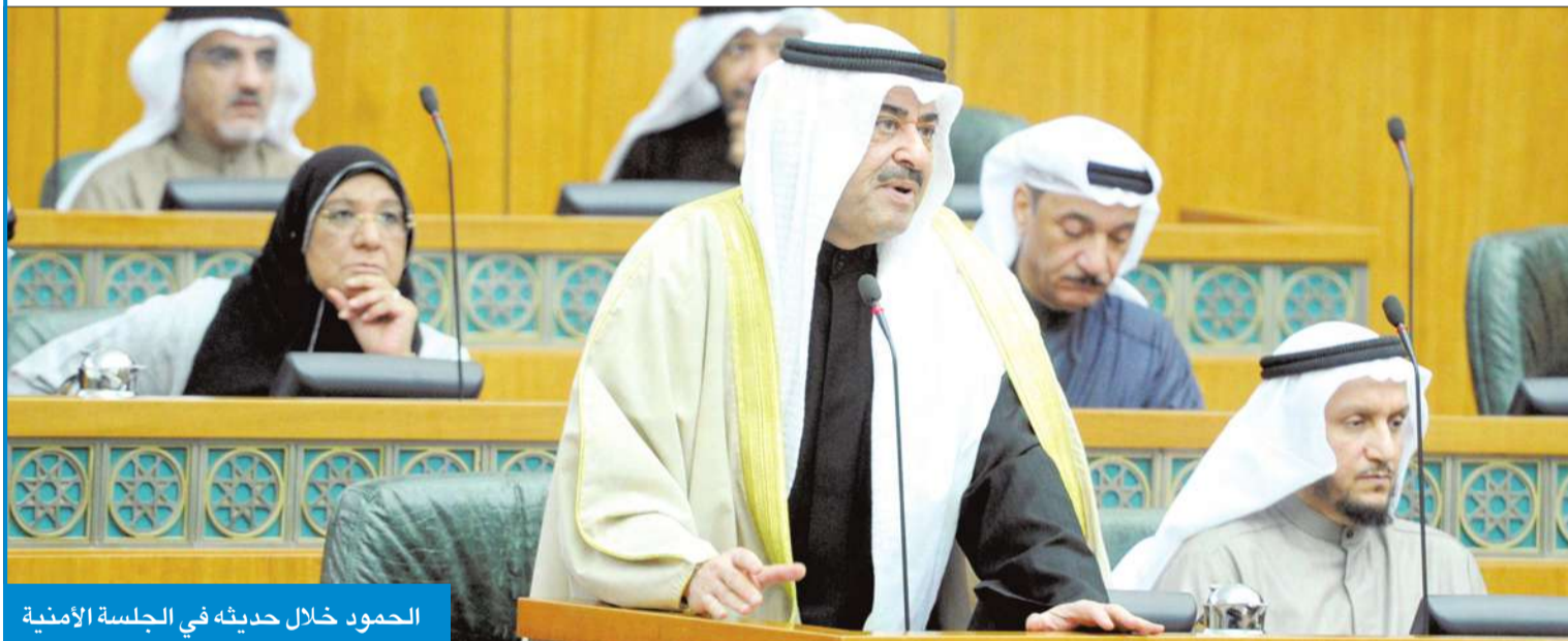
الحمود خلال حديثه في الجلسة الأمنية

تجاوز النائب الأول لرئيس مجلس الوزراء وزير الداخلية الشيخ أحمد الحمود «فخ» الجلسة السرية الأمنية أمس الأول، ليخرج بمكاسب في اول مواجهة مع مناوئيه في المجلس.