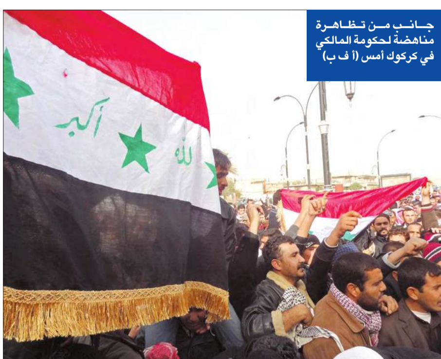
جانب من تظاهرة مناهضة لحكومة المالكي في كركوك أمس

السيستاني يدعو إلى تلبية مطالب المتظاهرين غير المتعارضة مع الدستور والقانون... والعمل على إرساء دعائم دولة مدنية