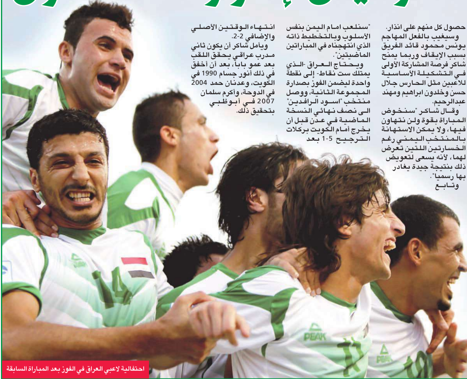
احتفالية لاعبي العراق في الفوز بعد المباراة السابقة

انتهاء الوقتين الأصلي والإضافي 2-2. ويأمل شاكر أن يكون ثاني مدرب عراقي يحقق اللقب بعد عمو بابا، بعد أن أخفق في ذلك أنور جسام 1990 في الكويت، وعدنان حمد 2004 في الدوحة، وأكرم سلمان 2007 في أبوظبي بتحقيق ذلك.