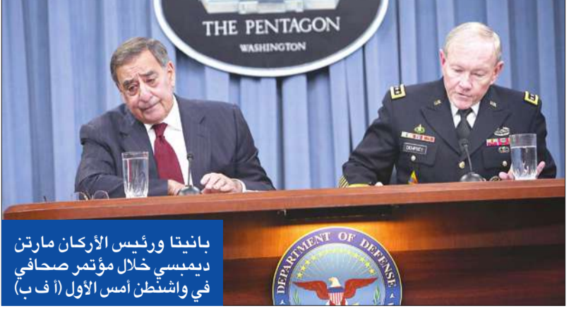
بانيتا ورئيس الأركان مارتن ديمبسي خلال مؤتمر صحفي في واشنطن أمس الأول

«إذا لم يتجاوز الكونغرس انقساماته فجاهزيتنا العسكرية ستتأثر»