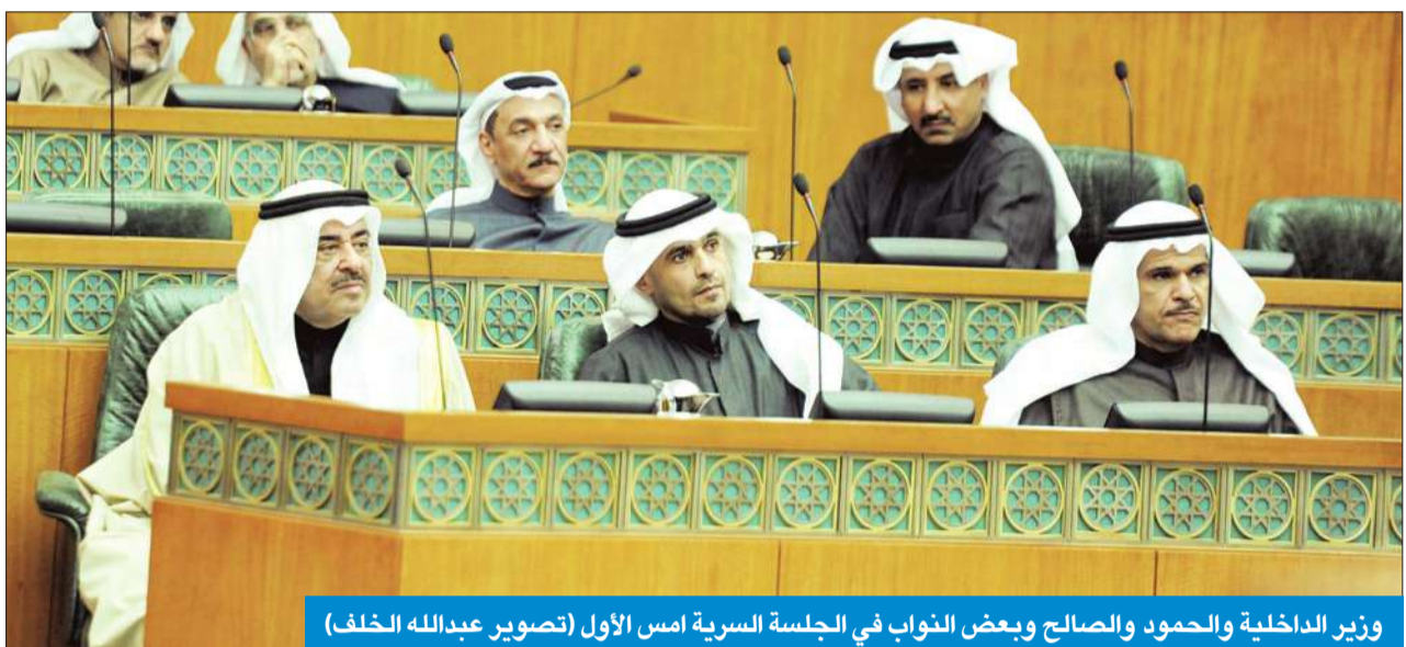
وزير الداخلية والحمود والصالح وبعض النواب في الجلسة السرية امس الأول

حملت جلسات الأسبوع الماضي عدة رسائل نيابية إلى الحكومة، بعضها كان إيجابياً للسلطة التنفيذية، وبعضها الآخر كان سلبياً وينذر بإزمة قادمة بين السلطتين تعود بأجواء التوتر وعدم الاستقرار بينهما إلى واجهة المشهد السياسي. ففي جلسة النظر في مراسيم الضرورة التي صدرت خلال فترة حل المجلس، لم تتحج الحكومة إلى حشد النواب لترميز تلك المراسيم، ف«الصوت الواحد» كان متوجعاً له الإقرار، كون الأعضاء خاضوا الانتخابات وفق نظامه، كما أن مرسوم «الرياضة» رغم الملاحظات التي سجلت عليه نيابياً لم يجد معوقات في طريق إقراره. أما مرسوم «الوحدة الوطنية» وهيئة مكافحة الفساد، فعبيراً دون ملاحظات عليهما، رغم وجود ملاحظات من السياسيين عليهما، وخاصة مرسوم الوحدة الوطنية الذي تضمن الكثير من العبارات والمصطلحات التي يمكن أن تحمل أكثر من تفسير.