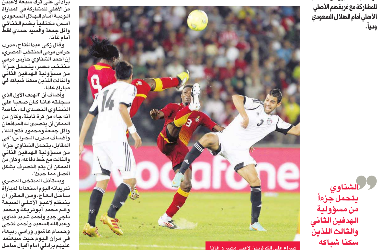
صراع على الكرة بين لاعبي مصر و غانا

يد منتخب غانا، في المباراة الودية التي جمعت الفريقين مساء أمس الأول (الخميس) بأبوظبي، في إطار استعدادات "الفراعة" للتصفيات الإفريقية المؤهلة لمونديال 2014. تقدم ايمانويل بادو لغانا بضربة رأس قوية في الدقيقة 18، ثم ضاعف ريتشموند بواكي