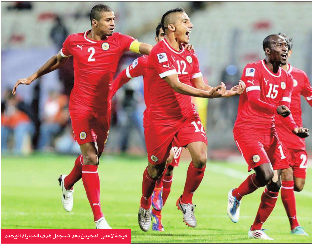
فرحة لاعبي البحرين بعد تسجيل هدف المباراة الوحيد

قال المدير الفني للمنتخب العراقي حكيم شاكر، إنه لا فرق لديه بين لاعب أساسي ولاعب بديل، مشيراً إلى أنه سيدفع بتشكيلة قوية أمام المنتخب اليمني اليوم في بطولة كأس الخليج 21. وأضاف المدرب العراقي: ”جميع اللاعبين الموجودين حالياً يستحقون ارتداء قميص المنتخب العراقي، ولا فرق بين لاعب أساسي ولاعب بديل“. ويتصدر منتخب ”أسود الرافدين“ المجموعة الثانية في بطولة كأس الخليج المقامة حالياً في البحرين برصيد 6 نقاط، متفوقاً على منتخب الكويت والسعودية صاحبي المركزين الثاني والثالث على الترتيب