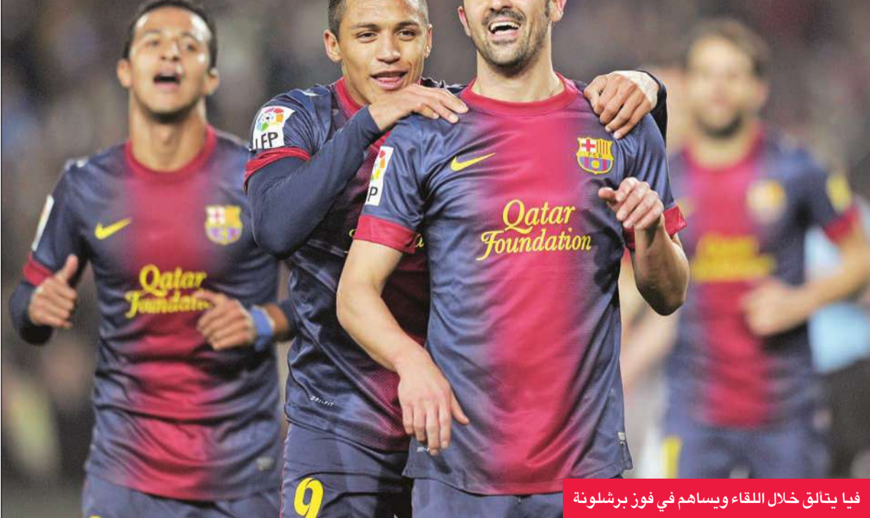
في يتالق خلال اللقاء ويساهم في فوز برشلونة

صفر-صفر، وذلك بعد فوزه ذهاباً 3-صفر. ويلتقي أتلتيكو في ربع النهائي مع ريال بيتيس المتأهل على حساب لاس بالماس (درجة ثانية) 1-صفر بهدف روبن كاسترو في الدقيقة 86 (1-1 ذهاباً)، قبل أن يلتقي الفائز بينهما مع الفائز من مواجهة ريال سرقسطة وأشبيلية. وكان ريال مدريد تأهل إلى ربع النهائي حيث سيواجه فالنسيا. ويقام ذهاب الدور ربع النهائي في 16 يناير الحالي والإياب في 23 منه.