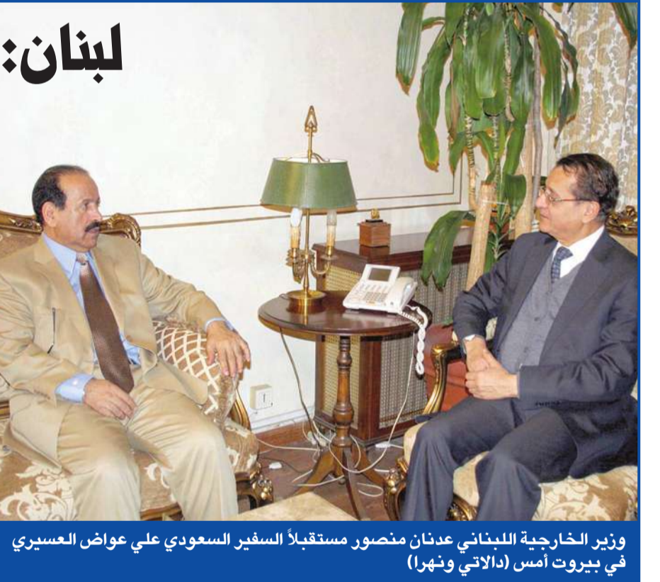
وزير الخارجية اللبناني عدنان منصور مستقبلاً السفير السعودي علي عوض العسيري في بيروت أمس

لا يزال الإرباك سيد الموقف بين الموالاة والمعارضة في لبنان، على خلفية المناقشات الجارية بشأن مشاريع قوانين الانتخاب، فمع معاودة اللجنة الفرعية الخاصة جلساتها أمس، في غياب ممثل «التحزب الوطني الحر» النائب الآن عون، الذي انسحب من جلسة أمس الأول، احتجاجاً على عدم ختم محضر الجلسات السابقة، لا تزال المواقف على حالها في ظل الانقسامات. وأشار رئيس اللجنة الفرعية النائب روبري غانم بعد اجتماع اللجنة أمس، إلى أن البحث مازال مستمراً في موضوع قانون الانتخاب، بما في ذلك عدد أعضاء مجلس النواب، وقد ختم النقاش في هذه المسائل على أن يتلى المحضر في جلسة الاثنين بعض الظهر، على أن يتم البحث بعدها في النقاط المشتركة لقانون الانتخاب. وأوضح غانم: «سنرعى إلى اللجان خلاصة