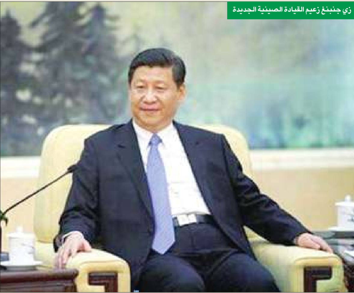
زي جنبنغ زعيم القيادة الصينية الجديدة

باسم الإوزة السوداء، وماذا قد يكون فاتهم في نظرتهم المتفائلة نحو اقتصاد بلادهم وقيادتها الجديدة؟ وما الذي يخيفهم؟ وتمثل الرد في تخوفهم من حالة الركود في اليابان، ومن أزمة منطقة اليورو بوصفها أكبر المخاوف، غير أنهم يشعرون بارتياح إزاء اقتصاد الصين وقادتها الجدد.