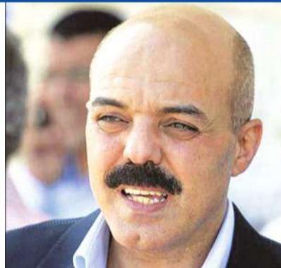
القاهرة - ناصر عبدالوهاب

لم يعد أمام فتح وحماس إلا المصالحة الحقيقية... وفتح ستعود إلى البندقية والحجر