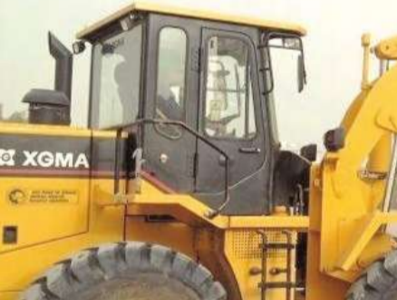
جانب من إزالة الانقاض في المنقف

أعلنت بلدية الكويت أنها ستعظم الأسبوع المقبل حملات تستهدف أخذ عينات غذائية من مختلف المخازن والمصانع الغذائية وفحصها مخبرياً للتأكد من مدى مطابقتها للإشراطات الصحية.