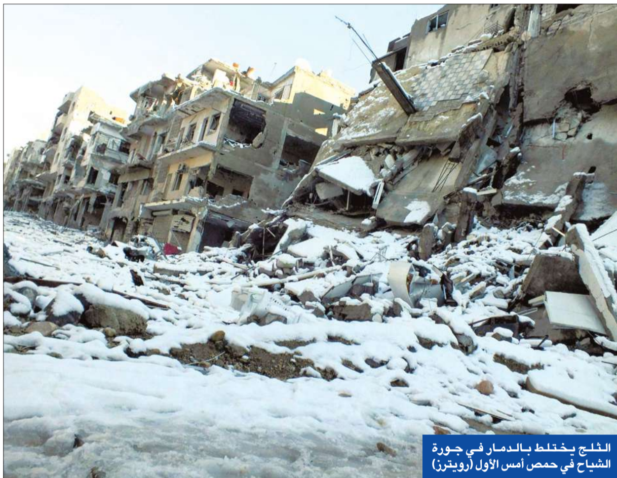
الثلج يخلط بالدمار في جورة الشياح في حمص أمس الأول

● قصف مناطق في دمشق وانفجار عبوة ناسفة ● انشقاق 17 جندياً ● البحرية الروسية تناور قرب الشواطئ