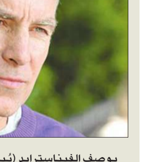
يوسف الفيناسترايد (يُباع تحت اسم Proscar

تعتبر تأثيرات الفيناسترايد الجانبية الدائمة حالة نادرة، بما أن ملايين الرجال أخذوا هذا العلاج خلال دراسات دامت فترات طويلة. وتبين أن التأثيرات الجنسية الجانبية في التجارب المدروسة