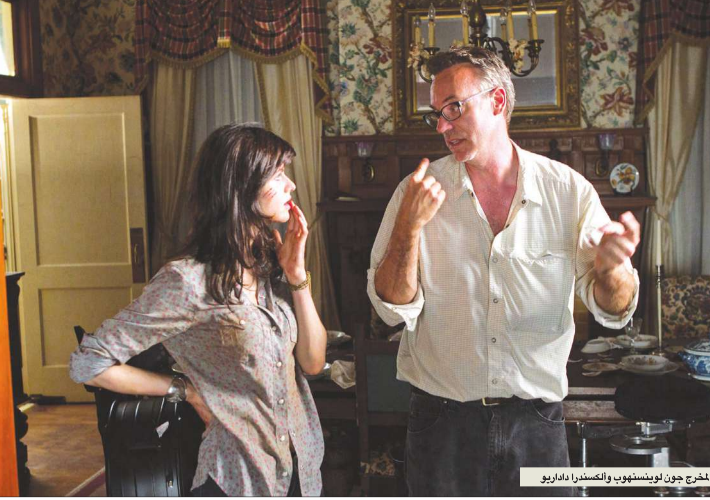
المخرج جون لوينسنهوب والمنتج ديكسندرا داداريو

قد لا يعرف بعض متبعي الأفلام فيلم The Texas Chainsaw Massacre كما Friday the 13th يعرفون Nightmare on Elm Street أو Saw لكنه يحتل مرتبة متقدمة بين أكثر أفلام الرعب جذباً للمشاهدين.