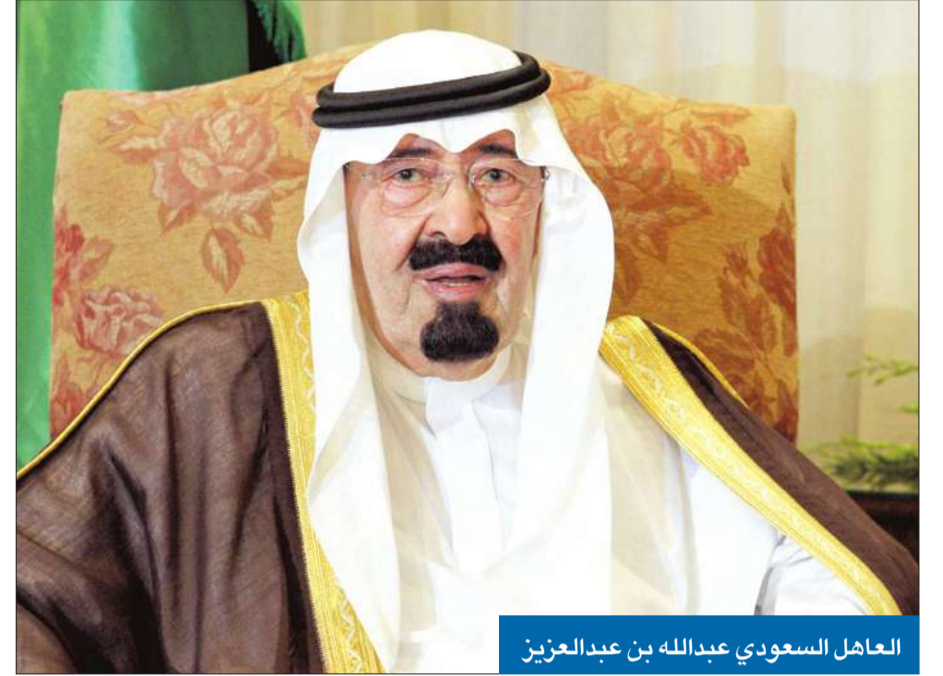
العاهل السعودي عبدالله بن عبدالعزيز

في تطور لافت من شأنه أن ينتج تداعيات إيجابية على الوضع العام في المملكة العربية السعودية، وفي متابعة نوعية للخطوات الإصلاحية، عين الملك عبدالله بن عبدالعزيز، أمس، للمرة الأولى، ثلاثين امرأة في مجلس الشورى، من أصل 150 عضواً. فقد أصدر العاهل السعودي أمرين ملكيين، يقضي الأول بمشاركة المرأة في مجلس الشورى، والثاني بتشكيل المجلس الجديد مدة أربع سنوات تبدأ من انتهاء مدة المجلس الحالي، الذي ضم 30 امرأة. وجاء في الأمر الملكي: «بناءً على استشارتنا لعدد كبير من علمائنا