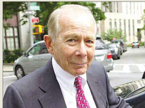
رئيس «أيه أي جي» يعض اليد التي أطعمته

سوف تضع أيه أي جي في مسار آخر محتمل وترغم دعوى غرينبرغ أيضاً أن أيه أي جي وبغية تسديد مبالغ الإنقاذ الحكومي اضطرت إلى التخلص من العديد من أصولها الثمينة بما في ذلك أعمالها المجزية في آسيا كما أن شروط عملية الإنقاذ هي صلب الجدل. ويجد مجلس إدارة أيه أي جي نفسه في وضع صعب ولكن من المتبرر رؤية موقف الرئيس التنفيذي روبرت