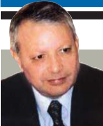
صالح القلب كاتب وسياسي أردني