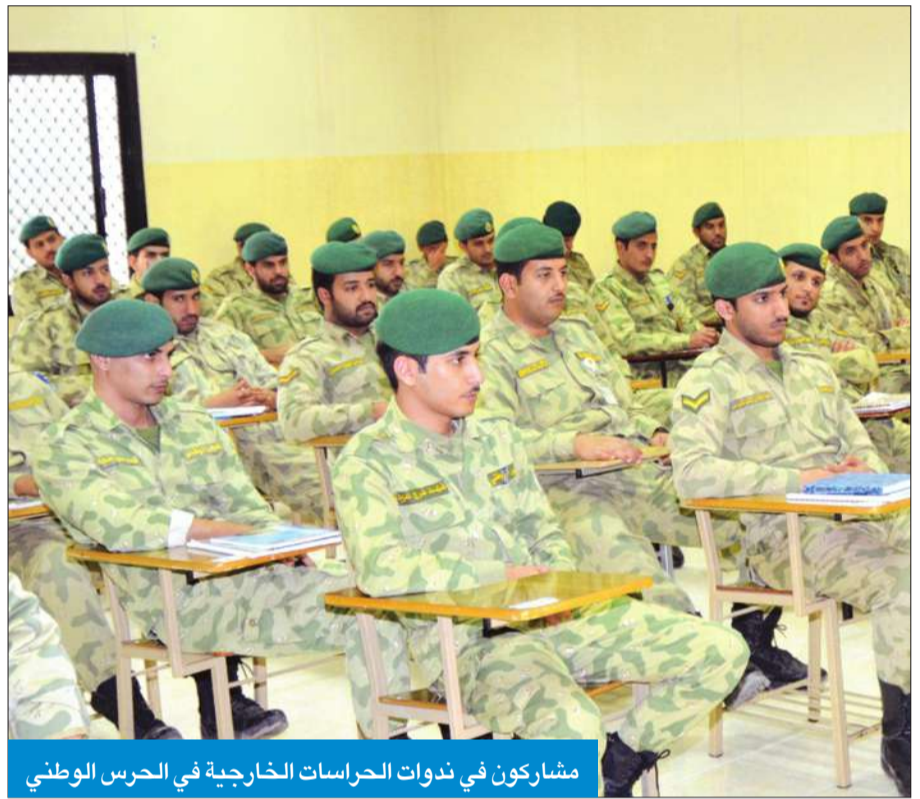
مشاركون في ندوات الحراسات الخارجية في الحرس الوطني