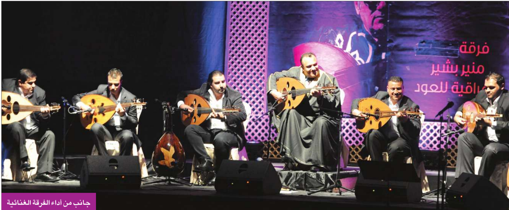
جانب من أداء الفرقة الغنائية

قلعة جبيل «ببيلوس» في لبنان 2004، وفي مؤتمر مهرجان الموسيقى العربية بدار الأوبرا المصرية في القاهرة ومسرح سيد درويش الإسكندرية للأعوام من 2004 إلى 2010. وشاركت أيضاً في مهرجان التراث العالمي في بلغاريا 2006، وفي فعاليات ملتقى بغداد الأول للموسيقى 2011، ومهرجان تطوان الدولي الرابع عشر للعود 2012 بالمغرب، وفي حفل في العاصمة الصربية بلغراد 2012، وفي أسابيع المدى الثقافية في العراق، والمسرح الوطني. أصدرت أعمالها باليومي «أنامل عراقية» وحكايات عود، وحصلت على شهادات وأوسمة من خارج العراق وداخله.