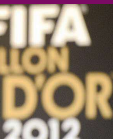
غوارديولا في حفل توزيع جوائز الفيفا

الآن في العودة الى التدريب، لكنه شدد على انه لا يعلم هوية الفريق الذي سيشرّف عليه. وقال "أريد أن أدرّب، هذا ما قاله غوارديولا الذي قرر ان يخلد للراحة هذا الموسم، بعد ان ترك منصبه في برشلونة في نهاية الموسم الماضي، مضيفاً "انا شاب، لا ابلغ سوى 41 عاماً، الآن، اصبح لدي نمط حياة مختلف. نمط حياة اردت ان اعيشه في هذه الفترة، هذا كل ما في الأمر". وترك "بيب" خلفه أرثاً كبيراً في برشلونة الذي اشرف عليه اعتباراً من موسم 2008-2009 خلفاً للهلندي فرانك رايكارد، إذ توج معه بـ 14 لقباً في اربعة مواسم. وارتبط اسم غوارديولا بالعديد من الأندية الكبرى في الأونة الأخيرة، فبالإضافة الى تشلسي برزت اندية مانشستر سيتي الإنكليزي وبايرن ميونخ الألماني وبايرس سان جرمان الفرنسي وميلان الإيطالي.