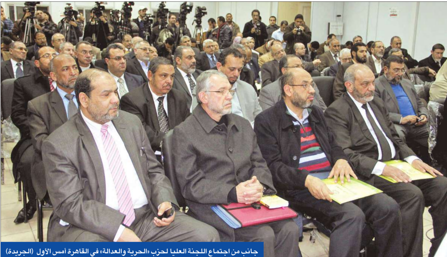
جانب من اجتماع اللجنة العليا لحزب «الحرية والعدالة» في القاهرة أمس الأول

القاهرة - أحمد بركات وأيمن عيسى وعادل زناطي