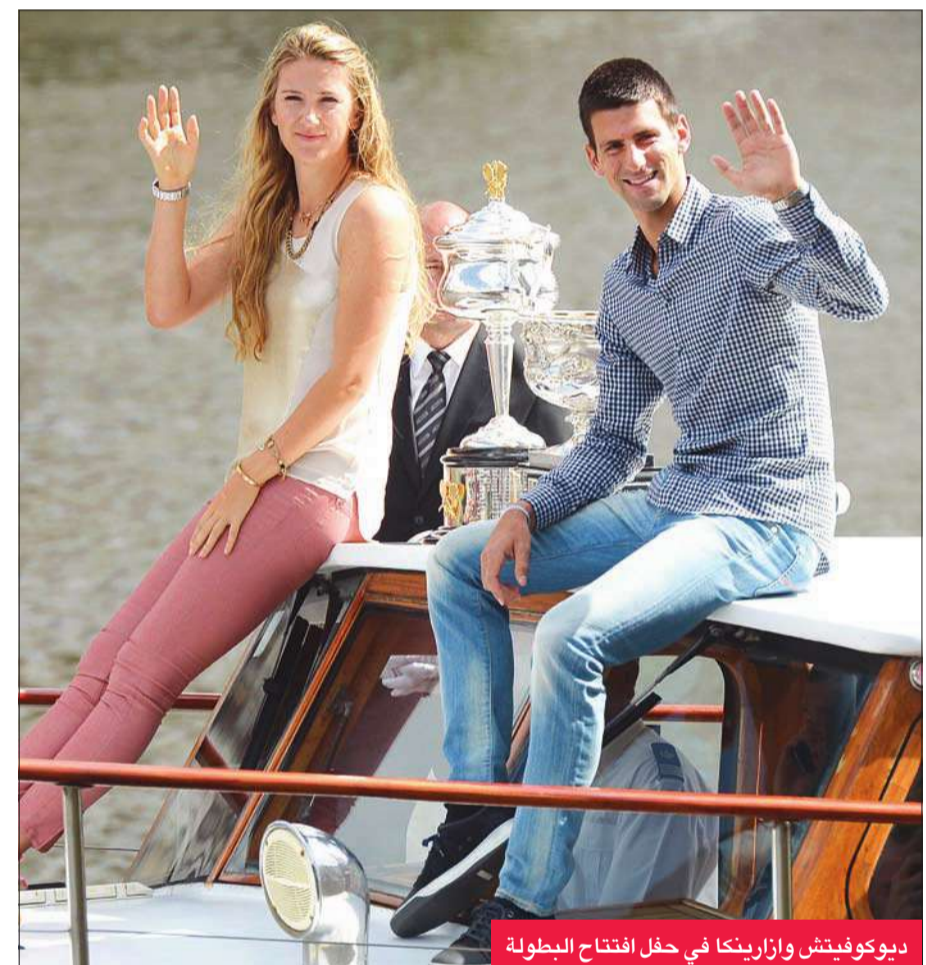
ديوكوفيتش وازارينكا في حفل افتتاح البطولة