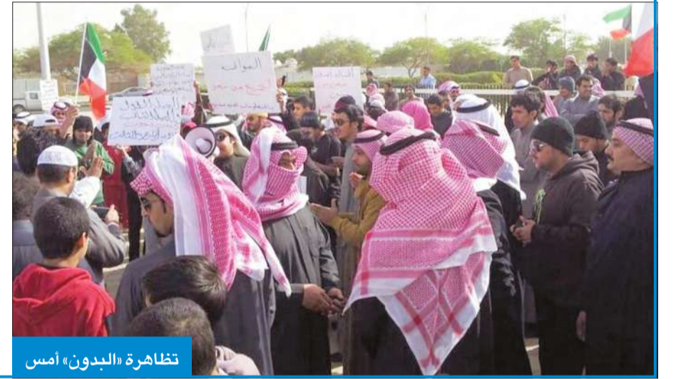
تظاهرة «البدون» أمس

ورفع البدون يوم امس لافتات تطالب بالعدالة الاجتماعية واعطائهم حقوقهم المشروعة وعدم المماطلة، مشيرين الى ان وصول اوضاعهم الى اسوأ المستويات الانسانية، حيث المنع الوظيفي والمعيشي والكران المدني الكامل وفي المقابل، أعطي رجال الشرطة البدون امس فرصة للتعبير عن آرائهم وإيصال رسالتهم، ومن ثم طلبوا منهم ودياً فض التجمع وعدم الاستمرار بذلك، الأمر الذي استجاب له المطالبون السلميون من دون اي احتجاجات، حيث انصاعوا لأوامر الشرطة، ولم تشهد التظاهرة اي مشادات أو تشابكات مع رجال الشرطة.