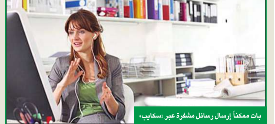
بات ممكناً إرسال رسائل مشفرة عبر «سكايب»

هذا موضوع عن عض اليد التي أطعمتك. لم يحف حبر عملية بيع وزارة الخزانة لأسهم المجموعة الأميركية الدولية أيه أي جي AIG حتى بدأ في الانضمام إلى دعوى مساهمي الرئيس التنفيذي السابق موريس غرينبرغ ضد العم سام. وترغم تلك الدعوى القضائية التي رفعت في سنة 2011 الحكومة الفدرالية استخدمت أيه أي جي لتنفيذ عملية «انقاذ من باب خلقي» لشركات في وول ستريت مثل مجموعة غولدمان ساكس وميريل لينش وغيرها. وقد وجهت شريحة من أموال إنقاذ أيه أي جي لتسوية عقود مبادلات تخلف عن السداد مع تلك الشركات لقاء 100 سنت على الدولار الواحد. وحسب ديل بوك فإن مجلس إدارة أيه أي جي سوف ينظر في مسألة الانضمام إلى دعوى المساهمين ومواجهة الحكومة التي أبدت نفسها عن الشركة بعد أربع سنوات من المشاركة. وينطوي خيار المشاركة أو عدم المشاركة على صعوبة بالنسبة إلى مجلس الإدارة كما يشير ديل