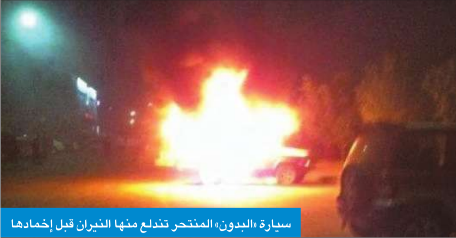
سيارة «البدون» المنتحر تندلع منها النيران قبل إخمادها

أقدم شاب «بدون» على إحراق نفسه داخل سيارته ليل أمس الأول في منطقة الجليب، بعد رسالة هاتفية إلى شقيقه أعلن فيها نيته الانتحار لتجاوز مشاكله.