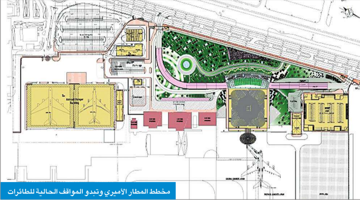
مخطط المطار الأميري وتبدو المواقف الحالية للطائرات

تعمل إدارة الطيران المدني على توسعة مواقف طائرات الأسطول الأميري وطائرات ضيوف الدولة، راصدة لهذا المشروع مبلغ 16 مليون دينار، وذلك لمواجهة المشروع الكبير لمطار الكويت الدولي الجديد (مبنى الركاب 2). وقالت مصادر مطلعة لـ «الجريدة» إن إدارة الطيران المدني تعمل على تطوير جميع ما يتعلق بالمطار لمواجهة المتغيرات الجديدة على الدولة، وما يطرأ على الساحة الدولية المنظمة للطيران المدني، مشيرة إلى أن الإدارة توصلت مؤخرا إلى ضرورة توسعة مواقف طائرات الأسطول الأميري. وأكدت المصادر أن من ضمن تلك الرؤية ضرورة إيجاد مواقف أكثر لضيوف الدولة، الأمر الذي يحتم عليها توسعة