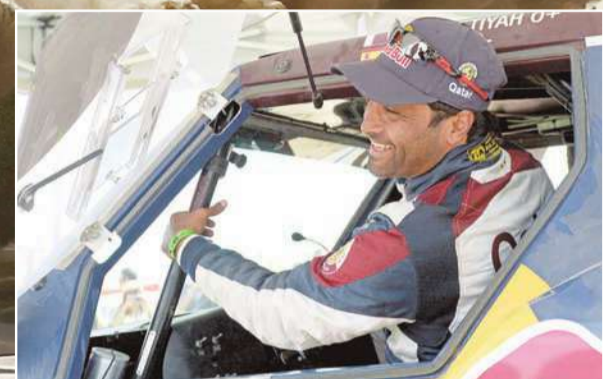
العطية خلال احدى مراحل السباق