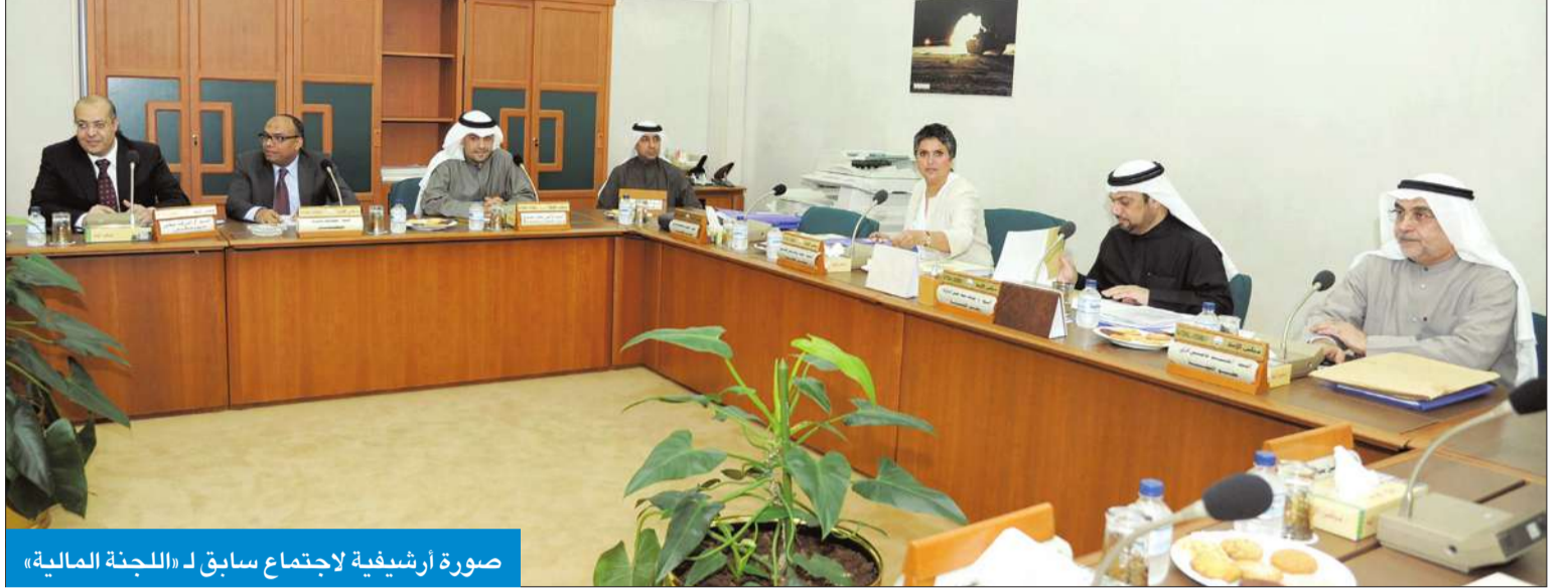
صورة أرشيفية لاجتماع سابق لـ «اللجنة المالية»

«نعلم موقف الحكومة مسبقاً لكن الفرصة مناسبة لإسقاط الفوائد»