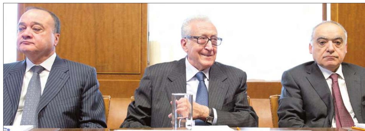
الإبراهيمي متوسلاً غسان سلامة (إلى اليمين) وناصر القدوة أثناء اجتماع جنيف أمس

عسكرياً في سورية، داعياً إلى «ضرورة إيجاد حل سياسي سريع قائم على بيان جنيف الصادر في الثلاثين من يونيو الماضي»، لإنهاء النزاع، الذي سقط فيه أكثر من 60 ألف قتيل. وأضاف الإبراهيمي، الذي كان