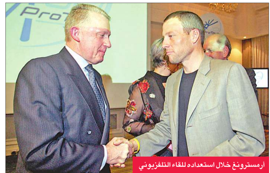
أرمسترونغ خلال استعداده للقاء التلفزيوني

تساءل لانس أرمسترونغ عما إذا كانت عقوبة الإيقاف مدى الحياة عن المشاركة في منافسات رياضية الموقعة عليه عقوبة عادلة، ووصفها بأنها "عقوبة إعدام". وقال السدراج الاميركي