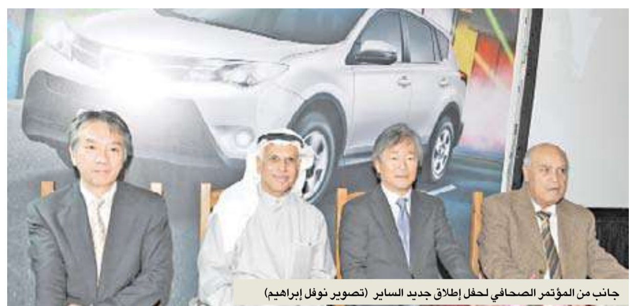
جانب من المؤتمر الصحفي لحفل إطلاق جديد السائر

في أولى مفاجئتها بعد حصولها على لقب أفضل مصنع للسيارات حول العالم في 2012، كشفت رائدة الصناعات العالمية شركة تويوتا اليابانية جديدها لعام 2013 في الجيل الرابع من الشبل RAV4 ابن الأسد تويوتا في حلة