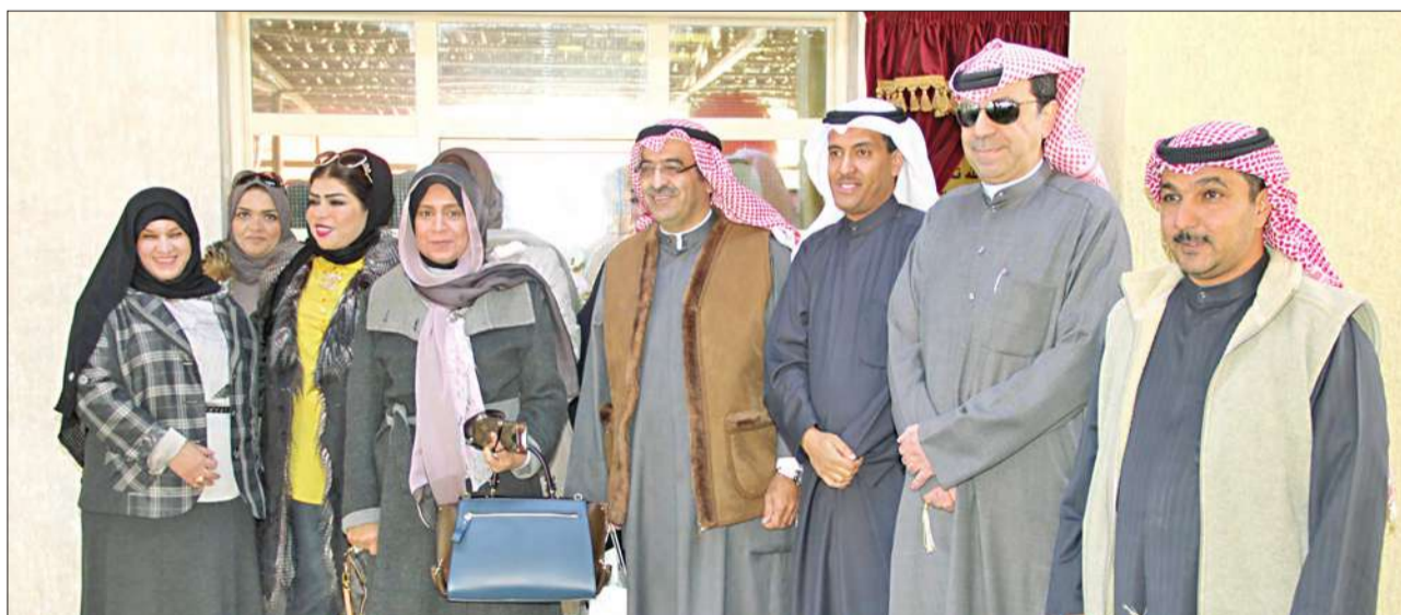
... وتتوسط المدعوين