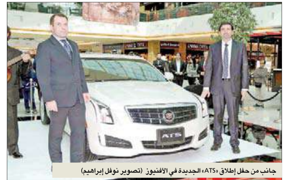
جانب من حفل إطلاق «ATS» الجديدة في الأفنيوز

وتأتي كاديلاك الجديدة بمحركين، الأول: 4 سلندرات بسعة 2.5 لتر، بقوة 202 حصان، والثاني 6 سلندرات بسعة 3.6 لترات، بقوة 321 حصاناً، ويأتي تصميم الجديدة بخطوط رشيقية وبارزة تغري للقيادة، لتكون الاختيار الأفضل الذي يتناسب مع أسلوب حياة العملاء الذين يستمتعون بالرعاية وراحة البال والتميز.