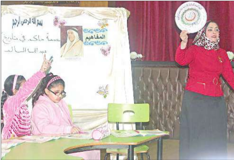
فقرة من الدرس النموذجي