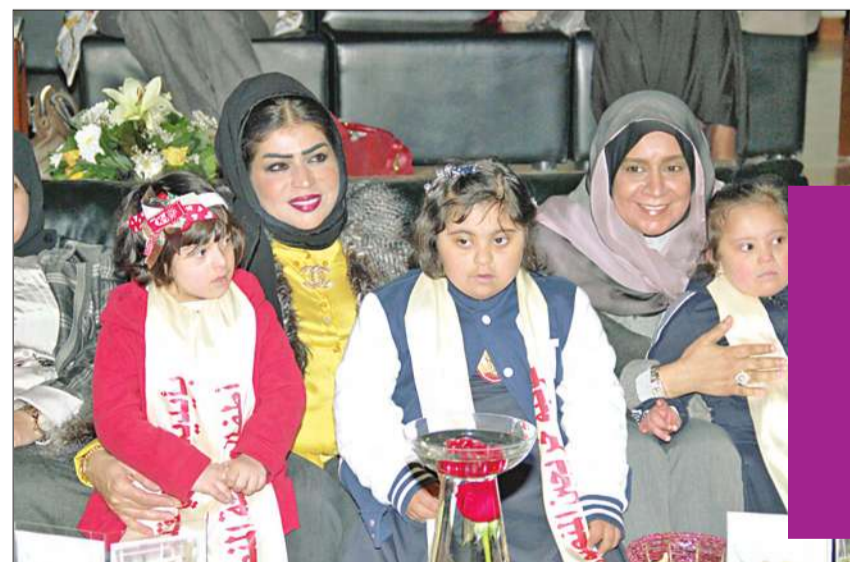
العمر تحتضن أطفالاً من ذوي الاحتياجات الخاصة