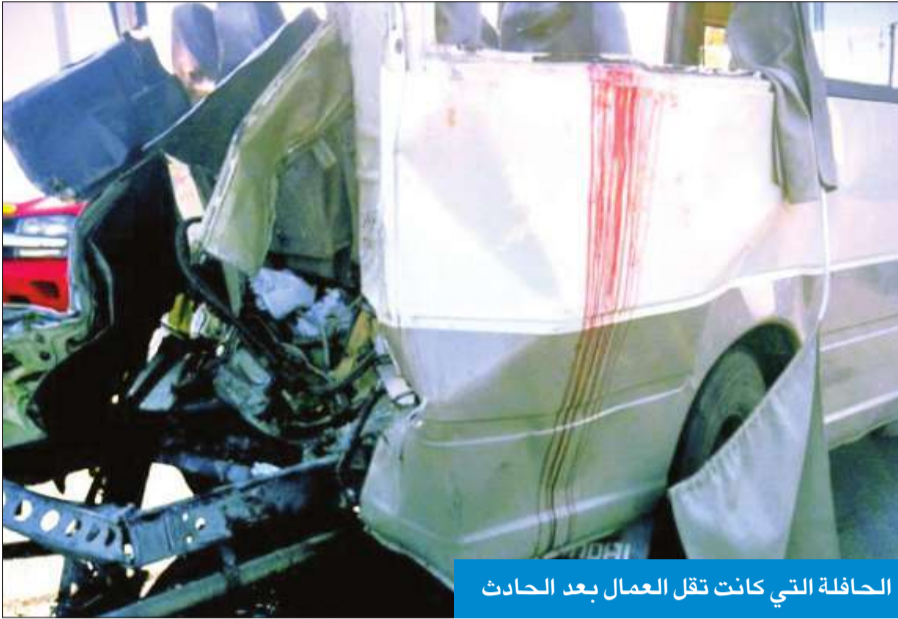
الحافلة التي كانت تقل العمال بعد الحادث

بينما شهد طريق الملك فهد السريع حادثين منفصلين، لقي مواطن مصرعه في الحادث الأول خلال عطلة نهاية الأسبوع، وقضى أربعة وأربعين في الحادث الثاني، ودهس مواطن على طريق المطلاع أربعة أطفال قُتل اثنان منهم.