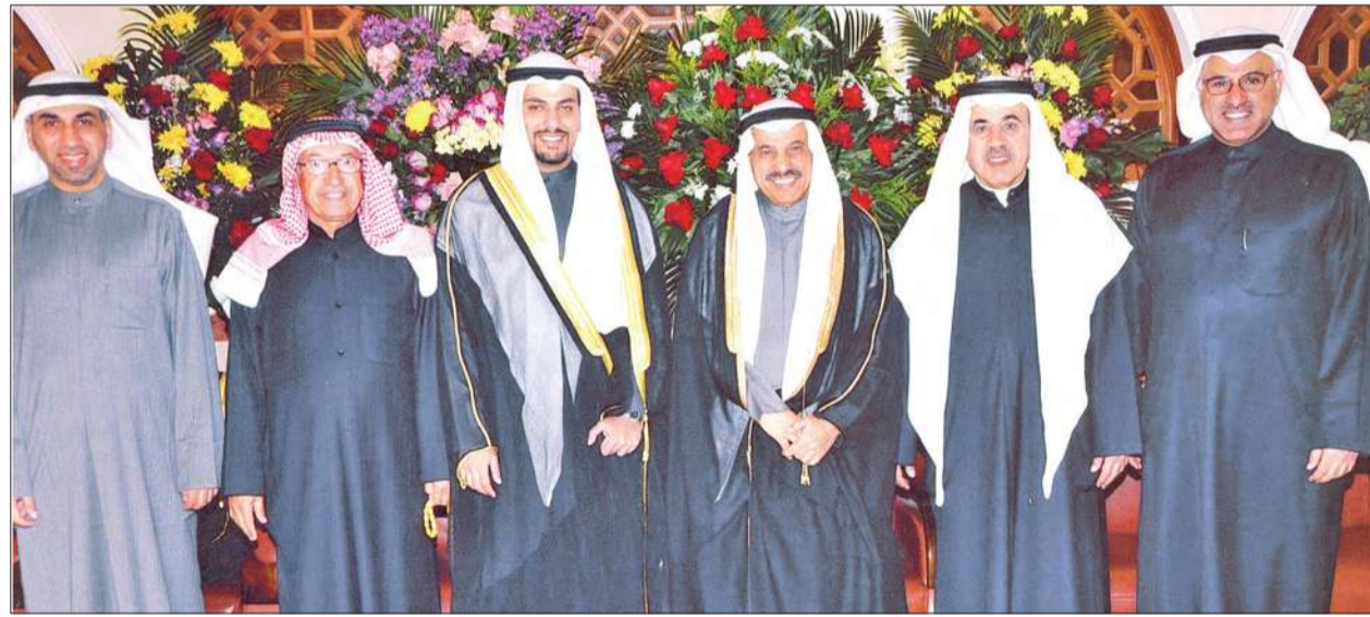
المعرس وسط والده وأعمامه