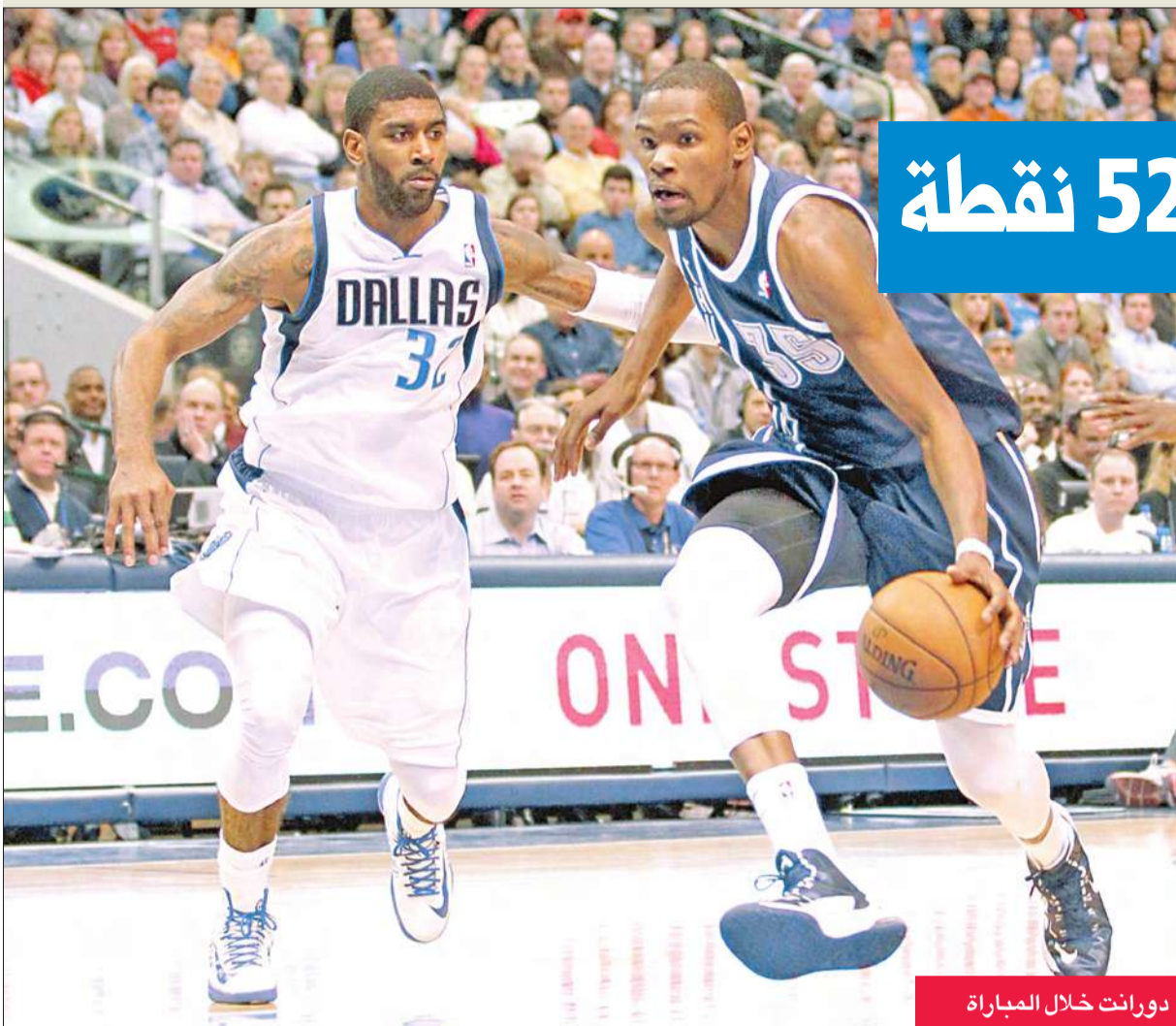
دورانت خلال المباراة

دك كيفن دورانت هدا في الموسم الثالث الاخير سلة دالاس مافريكس 52 نقطة، قاد فريقه اوكلاهوما سيتي الى تعزيز صدارته لترتيب دوري كرة السلة الاميركي للمحترفين امس الاول الجمعة. على ملعب "اميريكان ايرلاينز سنتر" في تكساس وامام 20434 متفرجا، فاز اوكلاهوما سيتي وصيف الموسم الماضي على مضيقه دالاس حامل لقب 2011 بنتيجة 114-117 بعد التمديد، في مباراة تعطل فيها دورانت لاعب منتخب كل دورانت وسجل دورانت 21 رمية حرة من اصل 21 ومنح اوكلاهوما فوزه الثاني والثلاثين مقابل 8 خسارات.