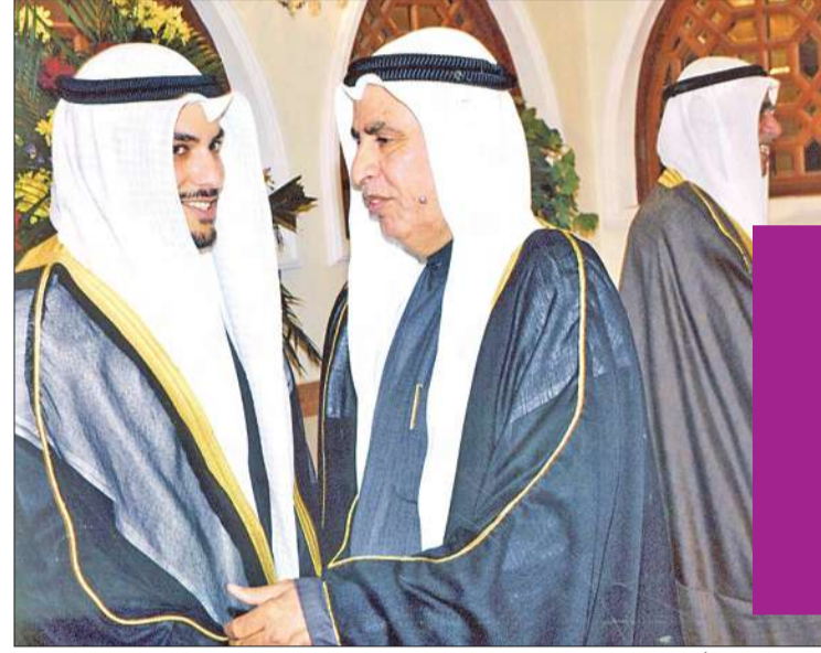
الفضالة مهنتاً المعرس