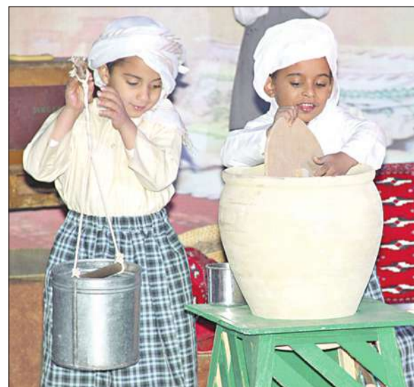
براعم المنصور خلال إحدى الفقرات