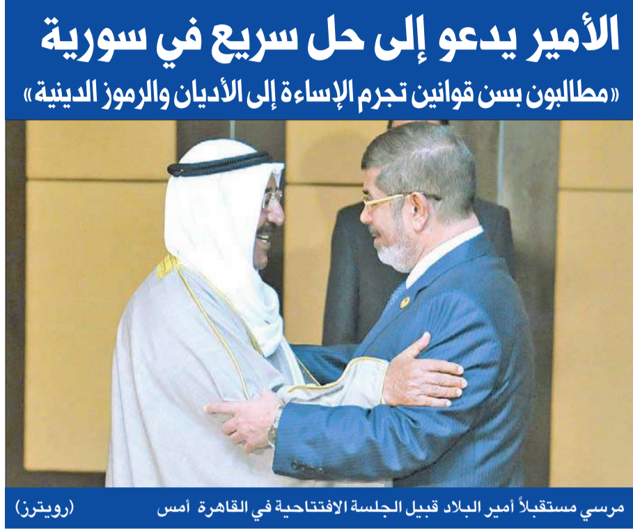
مرسي مستقبلاً أمير البلاد قبيل الجلسة الافتتاحية في القاهرة أمس

«مطالبون بسن قوانين ترمم الإساءة إلى الأديان والرموز الدينية» الأمير يدعو إلى حل سريع في سورية