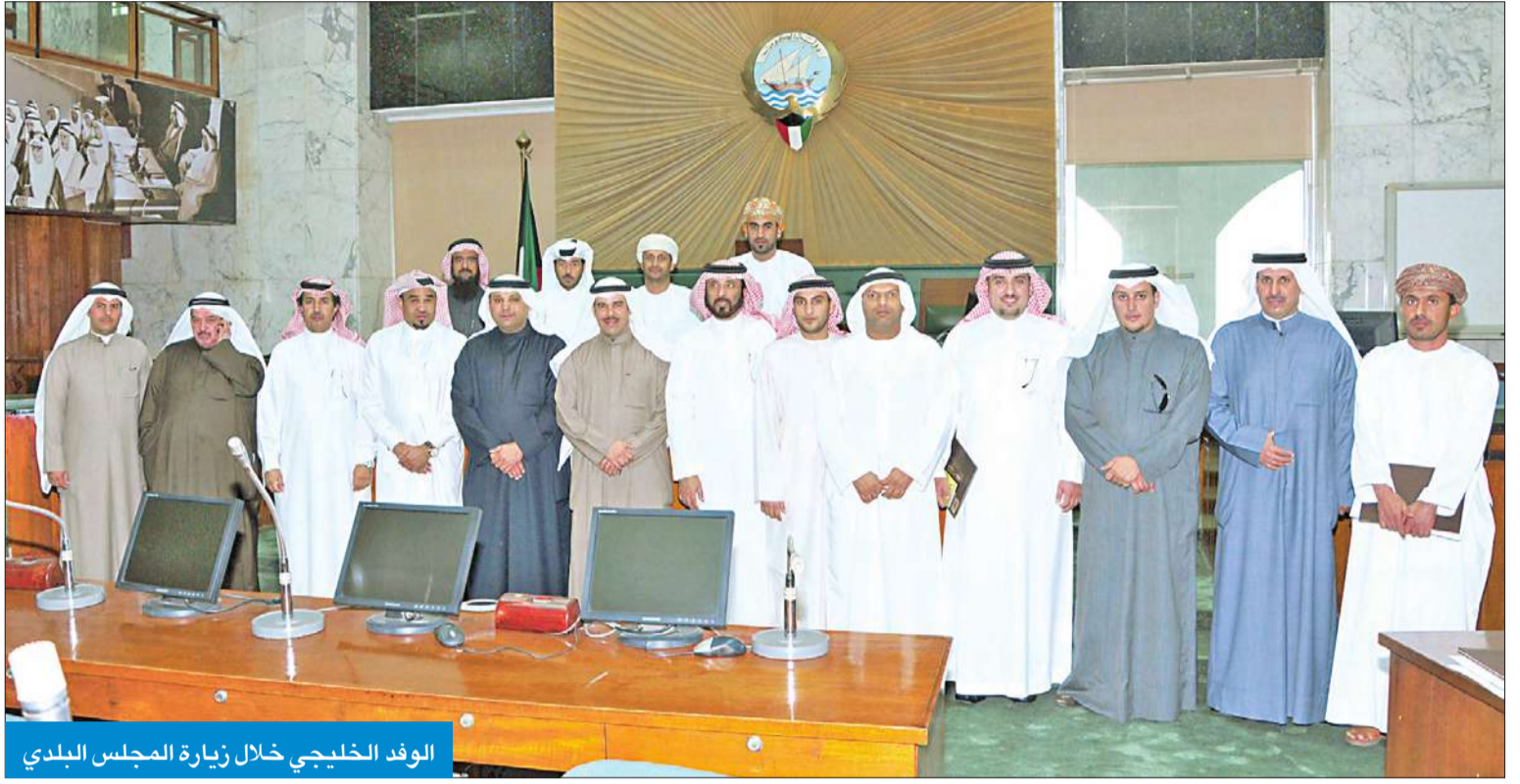
الوفد الخليجي خلال زيارة المجلس البلدي