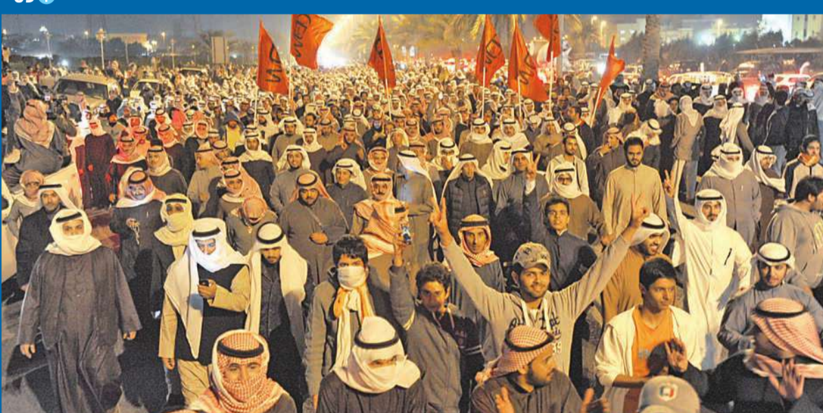
جانب من المسيرة التي انطلقت عقب التجمع التضامني في ديوان البراك أمس