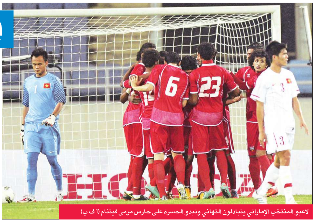
لاعب المنتخب الإماراتي يتبادلون التهاني وتبدو الحسرة على حارس مرمى فيتنام

بدأ منتخب الإمارات لكرة القدم بطل الخليج مشواره في تصفيات كأس آسيا 2015 المقرة في أستراليا بفوز ثمين على مضيفه الفيثنامي 2-1 أمس في الجولة الأولى من منافسات المجموعة الخامسة.