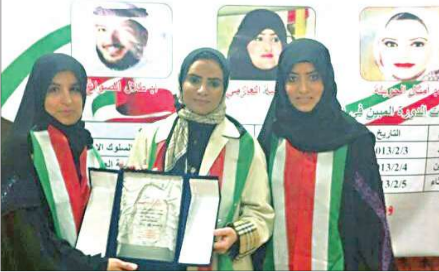
...وأخرى تتسلم درعا

اختتم مركز يوسف أحمد الغانم (نساء) لتحفيظ القرآن ودراسة العلوم الشرعية والدورات التدريبية دورة «المواطنة إنجاز وإبداع»، برعاية مدير إدارة الدراسات الإسلامية محمد العمر، وإشراف ابتسام الفيلكاوي، وتم توزيع الدروع على المتدربات اللاتي شاركن بالدورة.