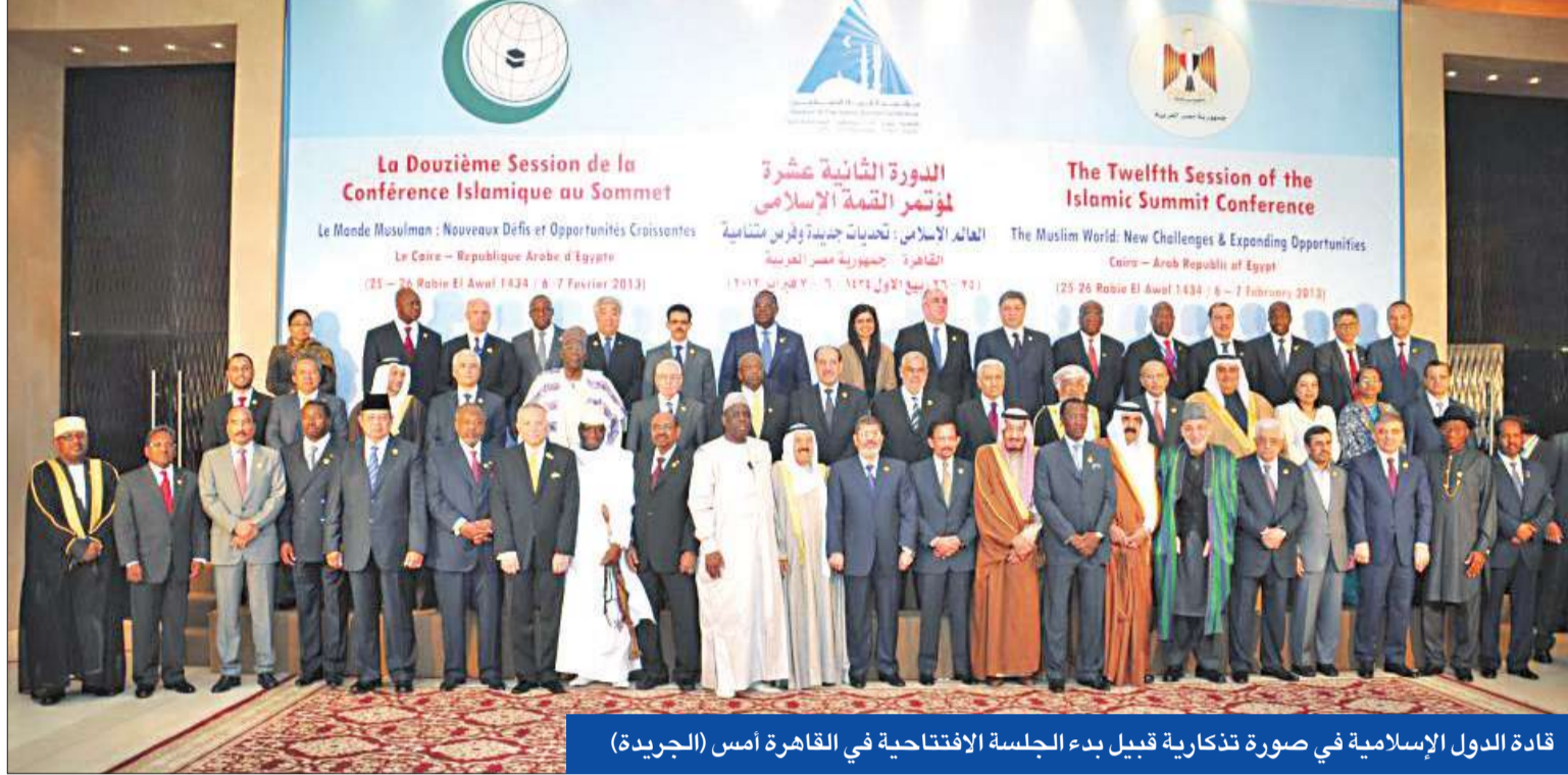
قادة الدول الإسلامية في صورة تذكارية قبيل بدء الجلسة الافتتاحية في القاهرة أمس (الجريدة)

أصحاب الجلالة والفخامة والسمو، بعد مرور ما يقارب الستين عاماً منذ ما زالت الكارثة الإنسانية تتواصل في سورية، وجرح الأشقاء فيها بات أعمق، وأعداد القتلى والمفقودين والمهجريين يتضاعف والدمار أصبح أشمل، ولا تلوح في الأفق بوادر حل قريب رغم الجهود الكبيرة والمتواصلة التي بذلت على المستويين الإقليمي والدولي. إن مجلس الأمن الدولي أمام مسؤولية تاريخية تتطلب توحيد الصفوف وتجاوز بعض العقبات والمساورة في إيجاد حل للقضايا.