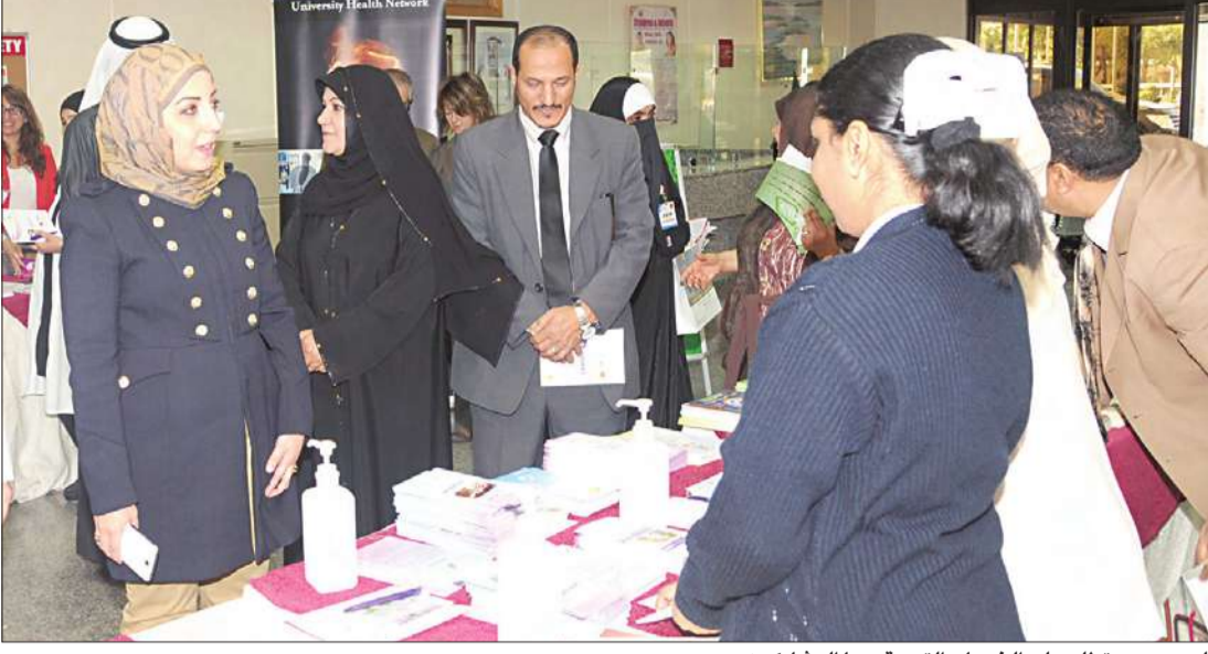
العسعوسي تطلع على الخدمات التي يقدمها المشاركون