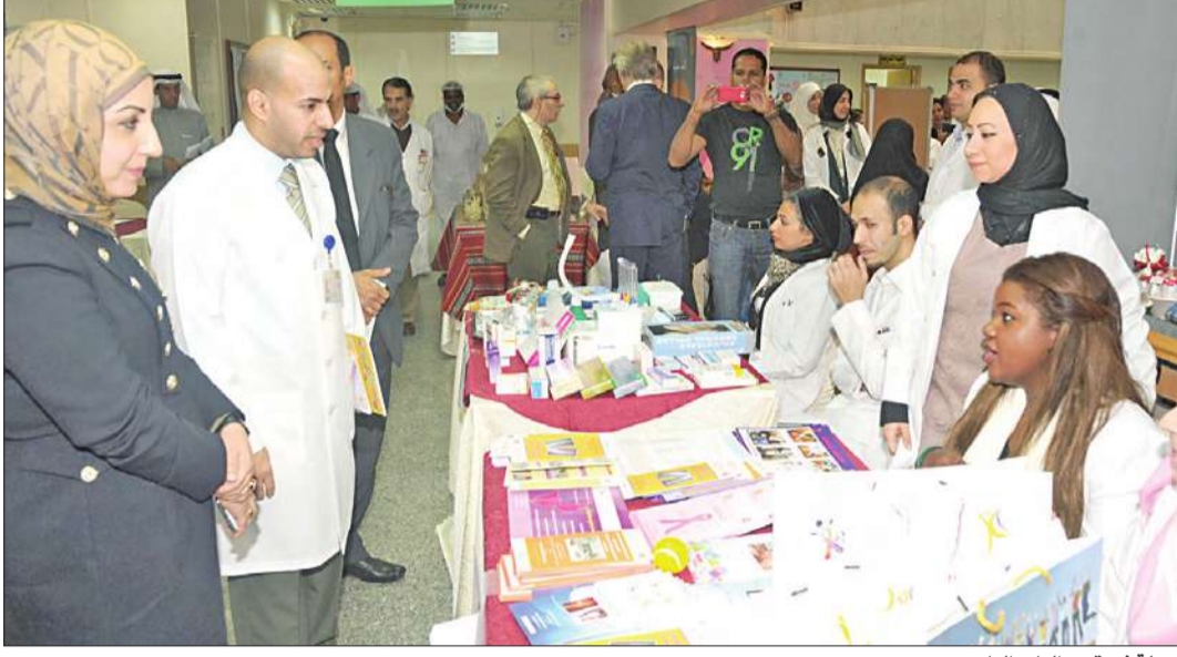
جولة في قسم الطب الطبيعي