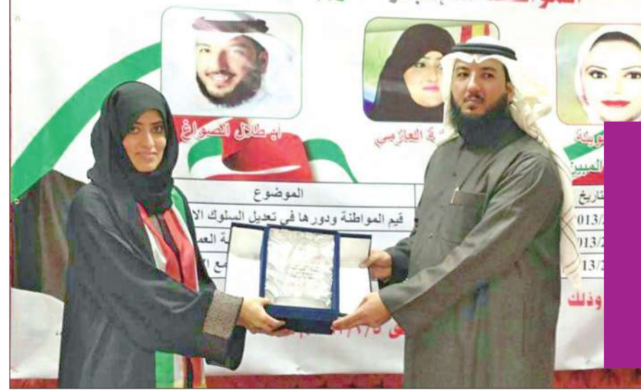
مقدرية تتسلم درعا

المناسبة حفل ختام «المواطنة إنجاز وإبداع» المكان مركز يوسف أحمد الغانم لتحفيظ القرآن