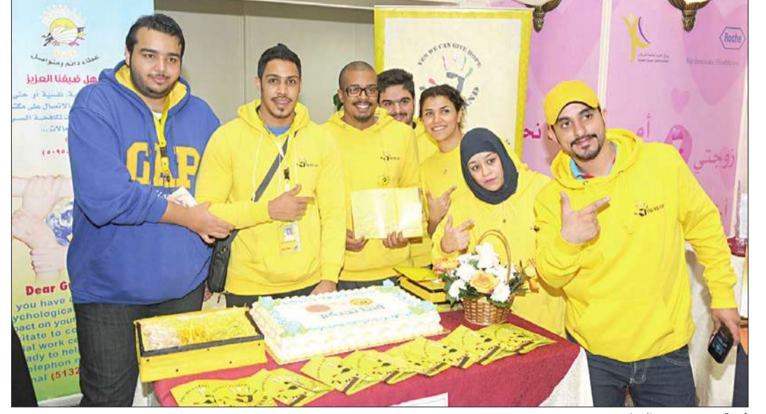
فريق yes we can التطوعي