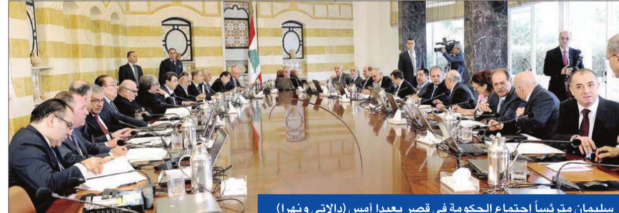
سليمان مترشاً اجتماع الحكومة في قصر بعبدا أمس

• سليمان: الحكومة هي الأولى من صنع لبنان • ريفي وصفا اجتماعا في الأشرفية