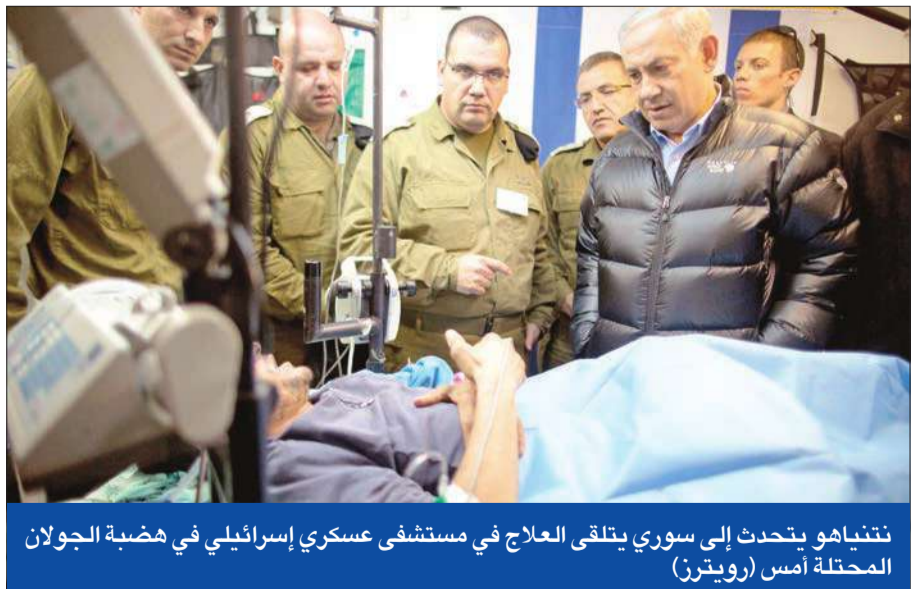
نتنياهو يتحدث إلى سوري يتلقى العلاج في مستشفى عسكري إسرائيلي في هضبة الجولان المحتلة أمس

«حماس» تنفي مراسلته • شركتان أوروبيتان تنسحبان من إسرائيل