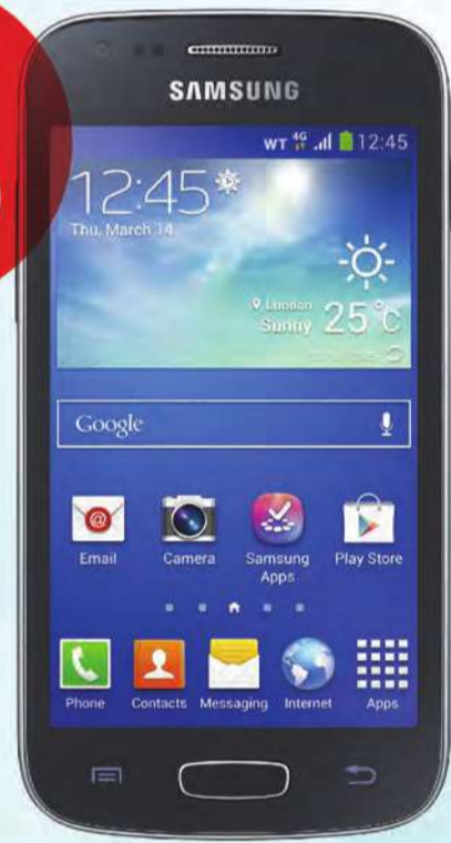
سامسونج LTE Ace 3

رصيد إضافي بقيمة 5 د.ك. شهرياً استخدم الرصيد الإضافي للمكالمات والرسائل المحلية* تمتع بباقة My Net 4 جيجابايت مجاناً بسرعة إنترنت 4G/LTE ظلال الشهر الأول خط مجاني مع رصيد 2 د.ك.