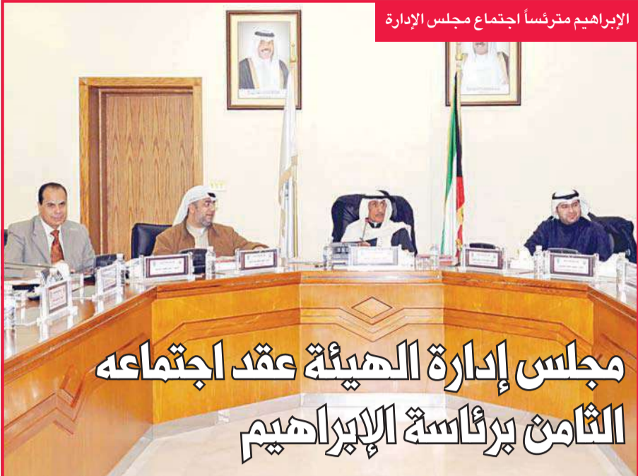
الإبراهيم مقرناً اجتماع مجلس الإدارة