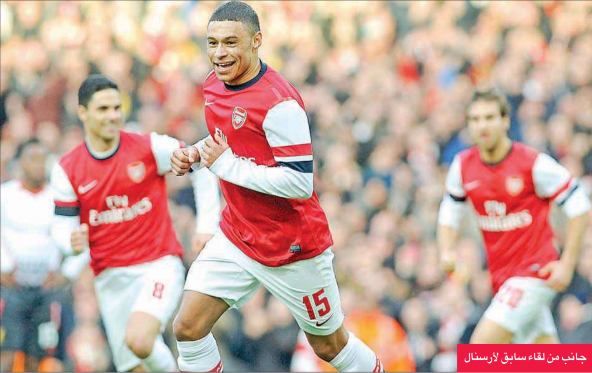
جانج من لقاء سابق لأرسنال