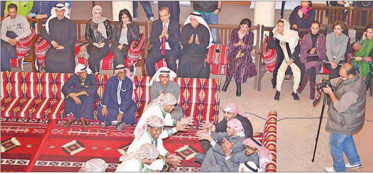
عدد من الحضور