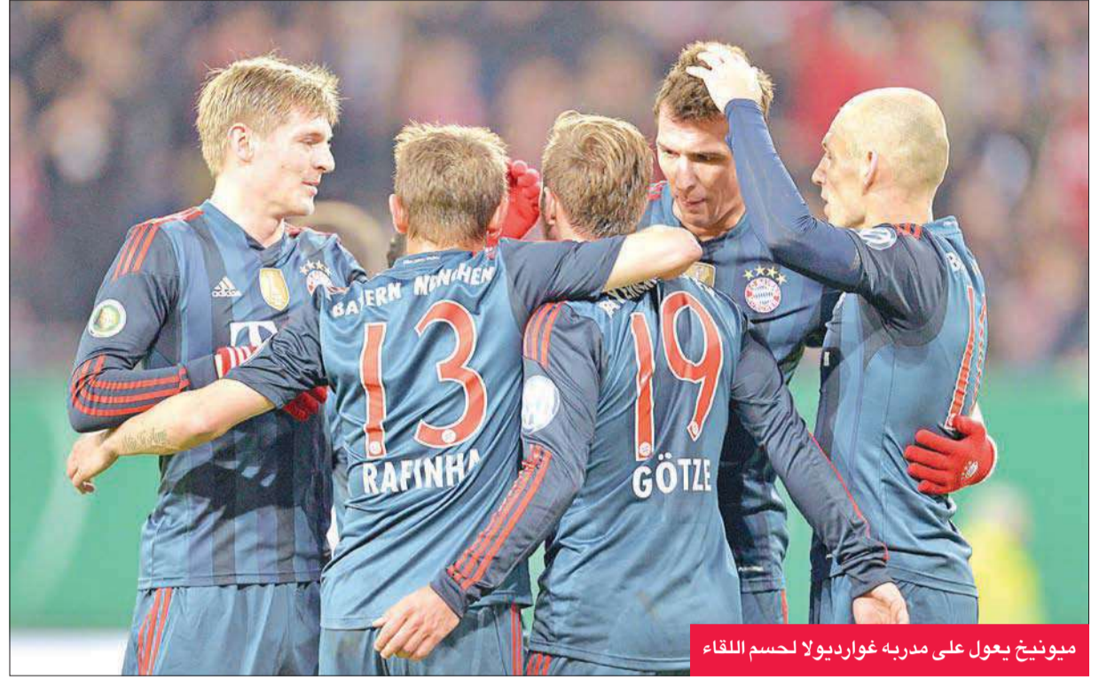
ميونيخ يعول على مدربه غوارديولا لحسم اللقاء

فيه الفريق قبل مباراة كريستال بالاس في الدوري. من جهته، رأى قائد بايرن فيليب لام أن بايرن لن يلعب من أجل التعادل صفر صفر، نريد الفوز في لندن بالطبع، لن نكون الامور سهلة، فقد استعادوا ثقتهم بعد الفوز على ليفربول. ويعتقد قلب دفاع بايرن جيروم بوتانغ أن أرسنال "أقوى" من الموسم الماضي، واعتبر أن مواطنه مسعود أوزيل أضف تهديداً جديداً من الناحية الهجومية، برغم خوضه موسمه الأول في انكلترا: "مسعود أوزيل هو مفتاح اللعب لديهم، ويجب أن تكون متيقظين لذلك، يجب أن نريد خوض الاياب ونحن نبحت عن قلب النتيجة".