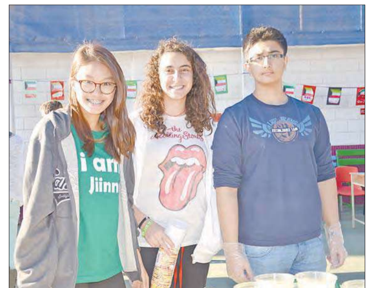
عمر وغوي وحي إن