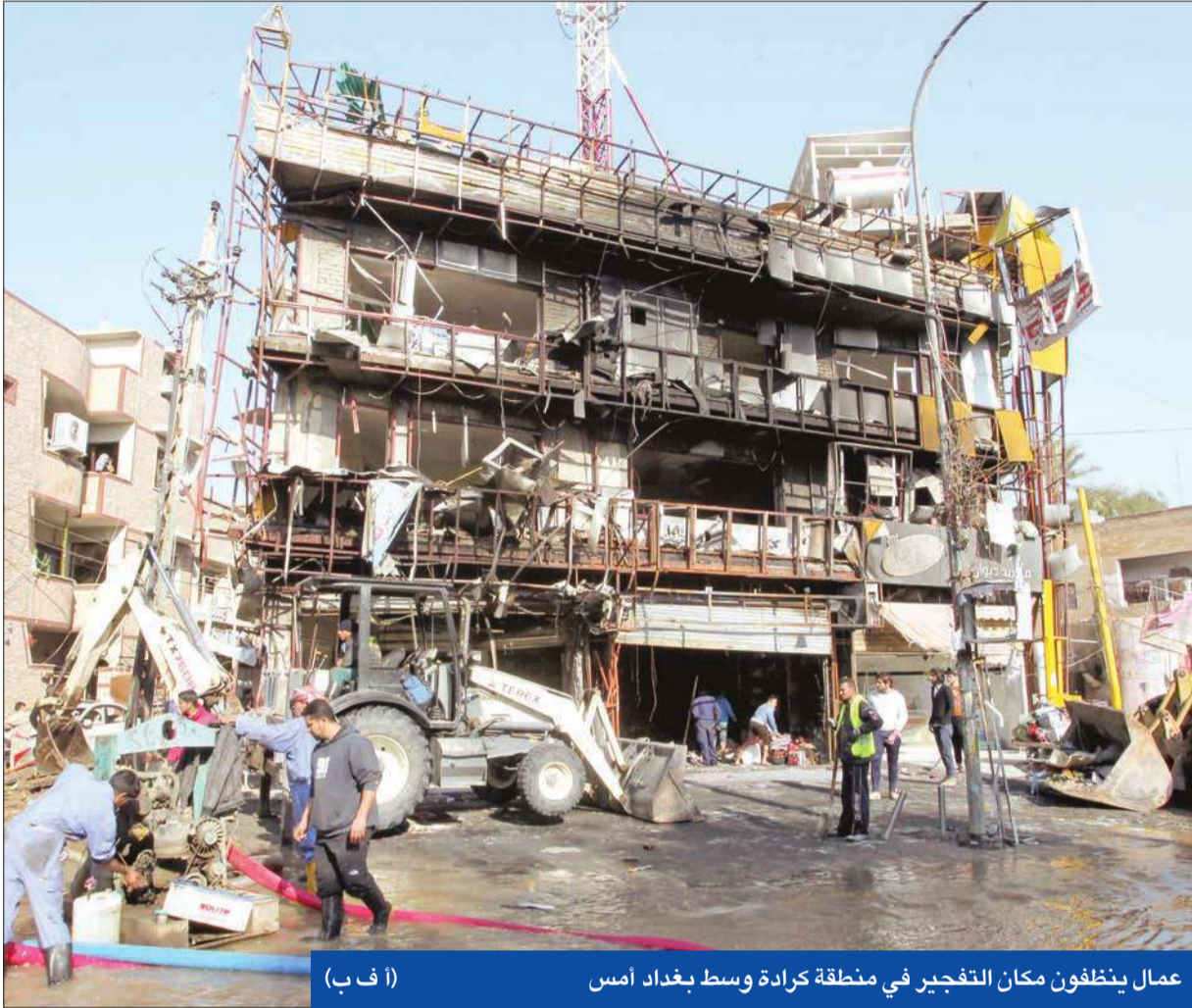
عمال ينظفون مكان التفجير في منطقة كراة وسط بغداد أمس

القضايا المتأخرة في المحاكم ومعالجة المطالب الأخرى، بما لا يتعارض مع القانون، والتشديد على رفض أية جهة مهما كان اسمها وعنوانها تعاونت مع القاعدة و داعش والتنظيمات الإرهابية، ودعوة شيوخ وعشائر الفلوجة وعملائها إلى طرد الغرباء والمسلحين من مدينتهم وتجنبها أضرار الحل العسكري». (بغداد - أ ب، رويترز، كونا)