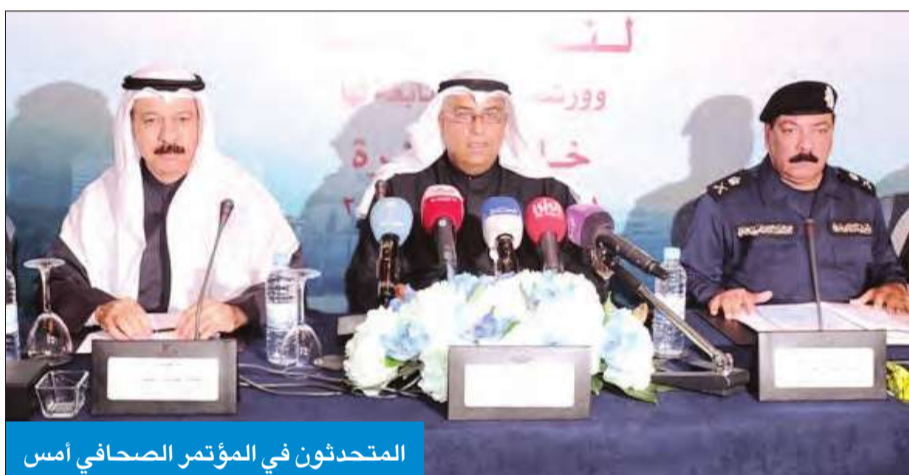
المتحدثون في المؤتمر الصحافي أمس

برنامج العمل الحكومي للتخطيط وتنفيذ هذه المشاريع.