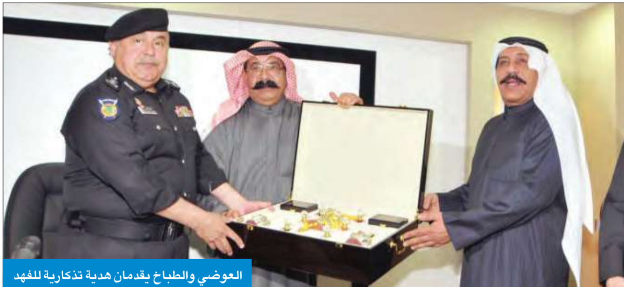
العوضي والطباخ يقدمان هدية تذكارية للفهد

رجال مكافحة المخدرات يبذلون جهداً بارزاً لحماية شباب الوطن