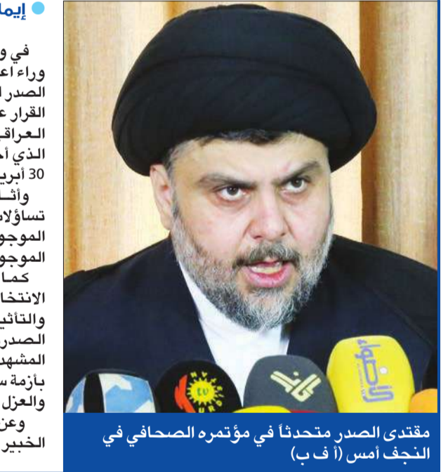
مقتدى الصدر يتحدث في مؤتمره الصحافي في النجف

في وقت لاتزال فيه الأسباب الحقيقية وراء اعتزال زعيم التيار الصدري مقتدى الصدر للحياة السياسية مجهولة، أثار هذا القرار عاصفة من ردود الأفعال في الداخل العراقي، إلى جانب الارتباك السياسي الذي أحدثه قبل الانتخابات المقررة في 30 أبريل المقبل. وأثار إعلان الصدر قرار حل تياره تساؤلات بشأن مصير الوزراء السنة للتيار الموجودين داخل الحكومة والنواب الـ 40 الموجودين في البرلمان.