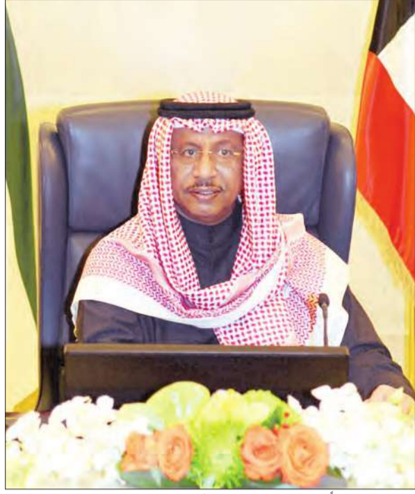
المبارك مترئساً اجتماع مجلس الوزراء أمس الأول

كما استمع المجلس إلى تقرير من نائب رئيس مجلس الوزراء وزير التجارة والصناعة الدكتور عبد المحسن المدعج حول نتائج مشاركته في فعاليات الدورة الثانية للقمة الحكومية التي عقدت في دبي مؤخراً. ثم بحث المجلس شؤون مجلس الأمة واطلع بهذا الصدد على الموضوعات المدرجة على جدول أعمال جلسة مجلس الأمة القادمة. كما بحث المجلس الشؤون السياسية في ضوء التقارير المتعلقة بمجمل التطورات الراهنة في الساحة السياسية على الصعيد العربي والدولي.