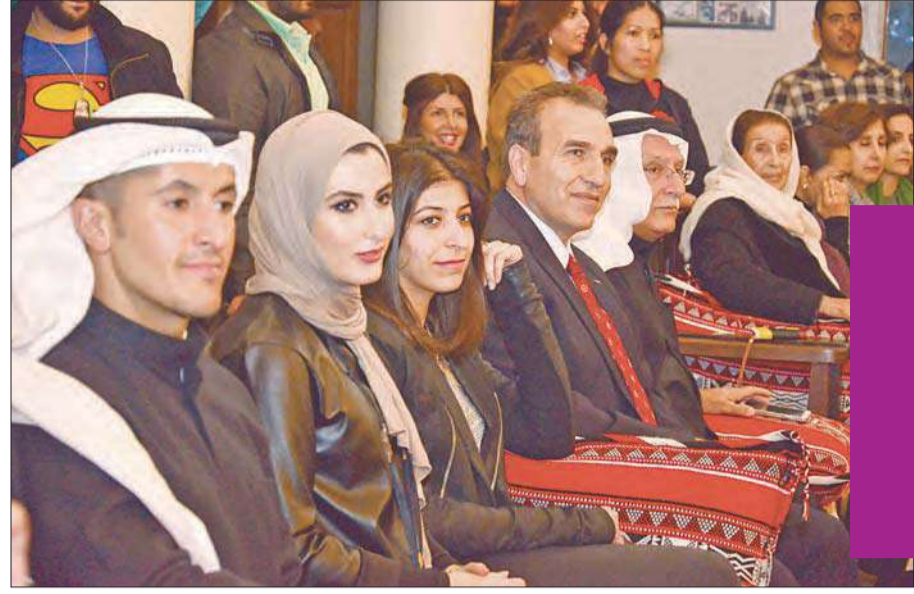
العتال بتوسط الحضور

المناسبة لويك يقيم «شبكة» ضمن فعاليات «يوم داو»