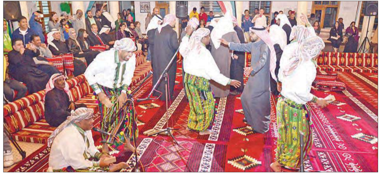
الشباب يشاركون الفرقة