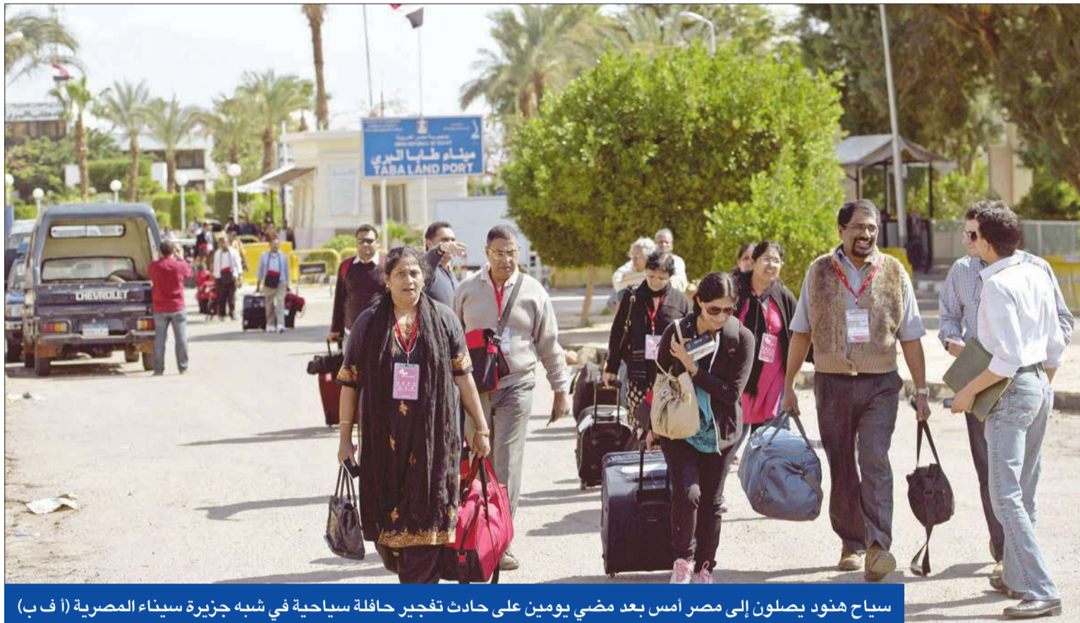
سياح هنود يصلون إلى مصر أمس بعد مضي يومين على حادث تفجير حافلة سياحية في شبه جزيرة سيناء المصرية

وفد عسكري روسي في القاهرة • عمال الغزل يواصلون الإضراب • مبارك في القفص مجدداً