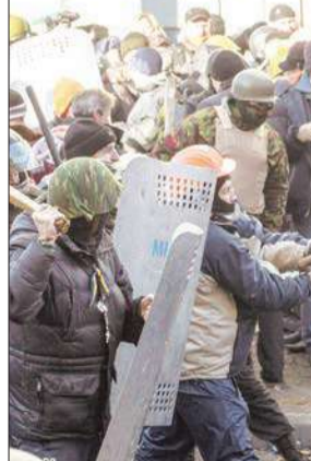
متظاهرون اوكرانيون في مواجهة قوات مكافحة الشغب امس في كييف

النووي، مضيفاً «إذا شاركت كل الأطراف في المفاوضات مع رغبة في التوصل إلى حل، فسنحصل على نتائج إيجابية لكن الأمر سيستغرق وقتاً». في سياق منفصل، أدان الرئيس الإيراني حسن روحاني أمس «التطرف والعنف»، واصفاً قتل الأبرياء بـ«قمة التطرف». وقال روحاني في كلمة بافتتاح مؤتمر اتحاد البرلمانات الإسلامية، إن «التهديدات التي تواجه البلدان الإسلامية شاملة لكل المسلمين الذين يواجهون الأخطار المبرمجة بشكل لا سابق له»، وتطرق روحاني إلى قضية فلسطين، وقال إن «الأطفال الفلسطينيين لا يتمتعون بالحد الأدنى من إكمانات العيش وأن الكيان الصهيوني الغاصب (إسرائيل) هو المستفيد الأكثر من الأزمات في العالم الإسلامي». ورأى روحاني أن احتلال الأراضي الإسلامية «يحل عبء» وحدة المسلمين ضد الغاصبين، متسائلاً «هل من مصلحة نحن المسلمين أن يحرم الألاف الأطفال السورييين من التعلم؟!».