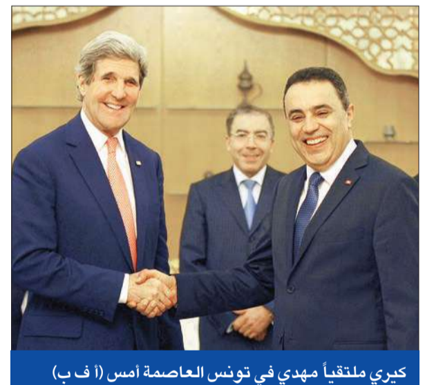
كيري ملتقىاً مهدي في تونس العاصمة أمس

في زيارة مفاجئة لم يعلنها، وصل وزير الخارجية الأميركي جون كيري أمس إلى تونس، والتقى الرئيس التونسي المؤقت منصف المرزوقي ورئيس الحكومة مهدي جمعة. وقال مسؤول أميركي مرافق لكيري إنه «جاء ليعتني على التقدم الذي حققته العملية الديمقراطية في البلاد مهد الربيع العربي، ومناقشة سبل التعامل مع متشددين إسلاميين». ولفت المسؤول إلى أن «كيري سيحث الحكومة التونسية على أن تبذل المزيد من الجهد لاعتقال ومحاكمة المتورطين في اقتحام السفارة الأميركية في تونس 14 سبتمبر 2012». ورأى أن «الإيجابي بل الملهم في تونس هو الرغبة المعلنة لعدم احتكار السلطة، واعتبار ذلك لعبة كل من فيها خاسر، وإنما البحث عن قدر من الحلول الوسط». وقالت دائرة الإعلام والتواصل التابعة للرئاسة التونسية في بيان، إن المحادثات بين المرزوقي وكيري «تركزت حول سبل تعزيز التعاون التونسي