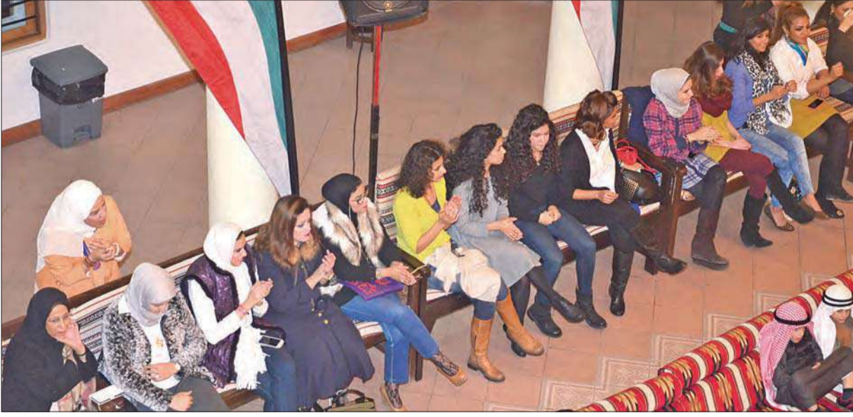
جانب من الحضور النسائي