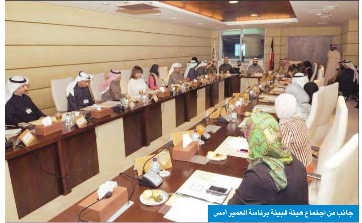
جانب من اجتماع هيئة البيئة برئاسة العمير أمس

عقد اجتماعاً برئاسة العمير وبحث المشاريع البيئية القائمة والمستقبلية