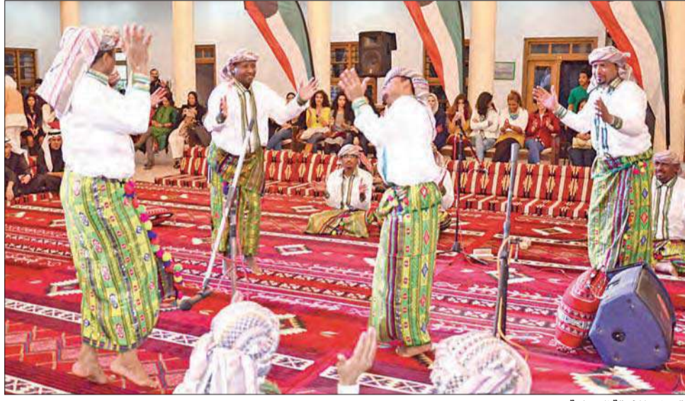
رقصات للفرقة اليمنية