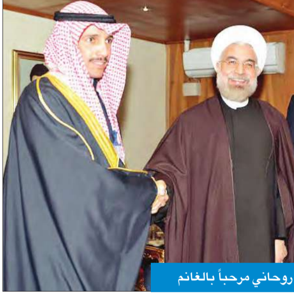
روحاني مرحباً بالغانم

لديننا الحنيفي، وما فاض به هدي نبينا الكريم من قيم أخلاقية ومبادئ إنسانية عالية لجميع البشر، تدعو إلى التراحم والتأخي، والعيش المشترك، وإعمار هذا الكون الذي نعيش عليه جميعاً بالخير والمحبة. وذلك كله ما نعمل به ومن أجله دولة الكويت، قيادة وشعباً، فتمسكت بعقيدتها الإسلامية السمحاء منذ نشأتها، والتزمت بقيمتها ومبادئها في ماضيها وحاضرها، واضطلعت بمسؤولياتها الإنسانية في جميع علاقاتها، فمذت جسور الحوار والتفاهم مع الجميع، وقدمت العون الإنمائي والمساعدات الإنسانية لكل من يحتاجها، وعملت من أجل السلام العالمي، والتزمت بالمشروعية الدولية". وجدد الغانم الدعوة لجميع الدول الشقيقة والصديقة للمساهمة في تفعيل جهودها الإنمائية وتقديم الدعم التنموي والمساعدات الإنسانية، وتعزيز التعاون الاقتصادي، بما يؤكد الشراكة والتكافل الإسلامي، ويسهم في نهضة أمتنا الإسلامية. وأشار الغانم في كلمته التي ألقىها في افتتاح الدورة التاسعة للاتحاد البرلماني العربي مرزوق الغانم من قبله، قائلاً "أن