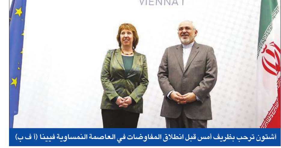
أشتون ترحب بظريف أمس قبل انطلاق المفاوضات في العاصمة النمساوية فيينا

إيران محادثات في فيينا أمس بهدف التوصل إلى اتفاق نهائي وشامل فيما يتعلق ببرنامج طهران النووي المتنازع عليه خلال الشهور المقبلة، ومن المتوقع أن تستمر المحادثات يومين أو ثلاثة أيام. وهذا هو الاجتماع الأول منذ أن توصلت القوى الست وهي