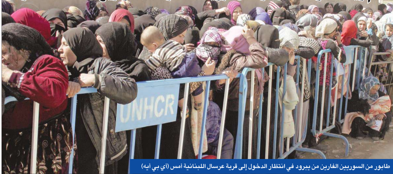
طابور من السوريين الفارين من ببرد في انتظار الدخول إلى قرية عرسال اللبنانية أمس

تستعد المعارضة السورية لشن هجوم واسع على مدينة دمشق من ناحية درعا في الجنوب، في خطوة قد تعيد الزخم للمعارضة الميدانية التي منيت بهزائم مقابل جيش النظام في الأونة الأخيرة. بعد تعيين العميد الركن عبدالإله البشير رئيساً لأركان الجيش السوري الحر وهو من نازح من الجولان مقيم في درعا، يستعد مقاتلو المعارضة الموجودون في جنوب سورية للقيام بهجوم واسع النطاق على العاصمة دمشق بمؤازرة مجموعات مقاتلة تدريب على الأرذ، حسيما علمت وكالة «فرانس برس» من طرفي النزاع. وبدأ الجيش النظامي بإعادة الانتشار وتكثيف قصف معاقل مقاتلي المعارضة لمواجهة مثل هذا الهجوم، بحسب المعارضة المسلحة. ويأتي الاعداد لهذا الهجوم الجديد بعد فشل محادثات السلام بين وفدي الحكومة والمعارضة الأسبوع الماضي في جنيف، في ظل معلومات تفيد عن تقديم دول خليجية أسلحة متطورة لمقاتلي المعارضة.