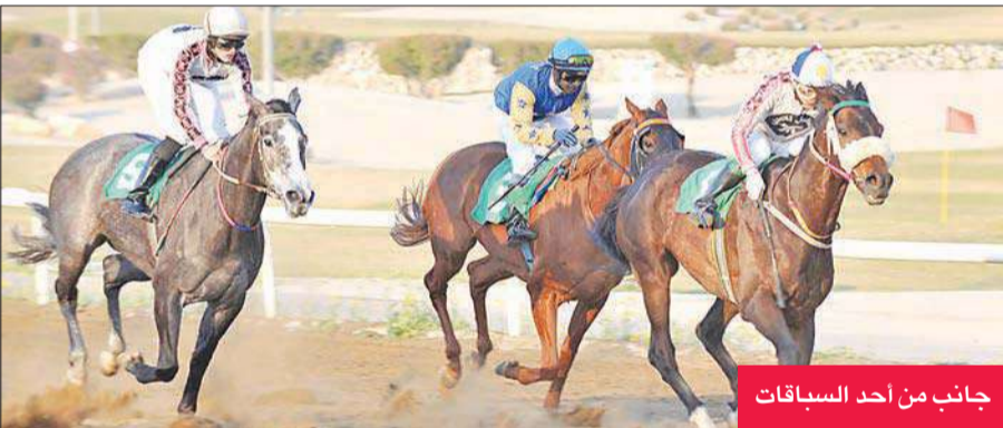
جانب من أحد السباقات

ايضا وجاء ديغون للعصيمي في المركز الثالث. وفي بقية الأشواط فاز الجواد شارل ديغول لاسطبل العصيمي بالشوط الاول المخصص للدرجة الثانية على مسافة 1800 متر بزمن 52-1 ق وبقارق ثلاثة اطوال عن الجواد دهيم لنواف الجلال وجاء الجواد خاطف القلوب لاسطبل الصغار في المركز الثالث.