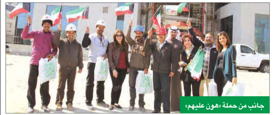
جانب من حملة «هون عليهم»

بمناسبة الأعياد الوطنية، وجرى على العادة السنوية تم وضع الزينة على مبنى المجمع الفطلي بأجمل ثوب ممثلاً في أعلام دولة الكويت وصور حضرة صاحب السمو أمير البلاد وولي عهده الأمين، وذلك استعداداً للمشاركة في احتفالات الكويت الوطنية. وبهذه المناسبة، رفع نائب العضو المنتدب للعلاقات وتقنية المعلومات الشيخ فيصل جابر الأحمد الصباح اسمي التهنئة والتبريكات لمقام حضرة صاحب السمو أمير البلاد وولي عهده، وإلى شعب الكويت الكريم.