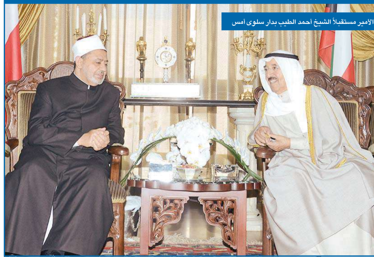
الأمير مستقبلاً الشيخ أحمد الطيب بدار سلوى أمس