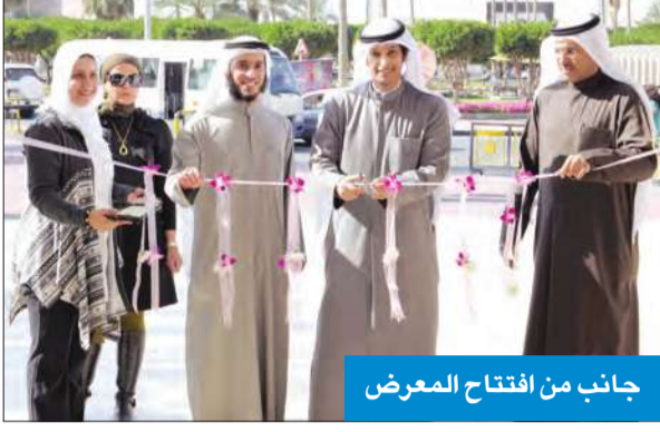
جانب من افتتاح المعرض

افتتح مكتب التدريب الطلابي والخريجين في كلية العلوم الإدارية بجامعة الكويت أمس معرض صناعات وفرص العمل التاسع عشر، في بهو الكلية بالحرم الجامعي بالشويخ، برعاية وزير الإعلام وزير الدولة لشؤون الشباب الشيخ سلمان الحمود، وحضور الوكيل المساعد لقطاع تنمية الشباب في وزارة الدولة لشؤون الشباب عبدالرحمن المطيري، وعدد من الأساتذة والمسؤولين بالكلية. في هذا الصدد، قال المطيري إن الهدف من هذا المعرض تأهيل الكوادر الوطنية للعمل في القطاعات المختلفة، مضيفاً أن المعرض يخدم ناحيتين تتمثل في خلق فرص العمل وتشجيع الطلبة لبناء فكرة شاملة للعمل في هذه القطاعات المختلفة، وبالتالي يستطيع الخريج تحديد مساره الوظيفي بما يتواءم مع