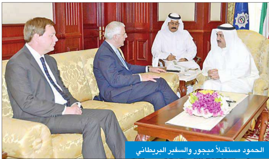
الحمود مستقبلاً ميغور والسفير البريطاني

من جانبه، توجه ميغور بالشكر والتقدير إلى دولة الكويت على كرم الضيافة وحسن الوفادة، مبرراً أهمية الدور الكويتي المحوري في دعم السلام والأمن في المنطقة والعالم.