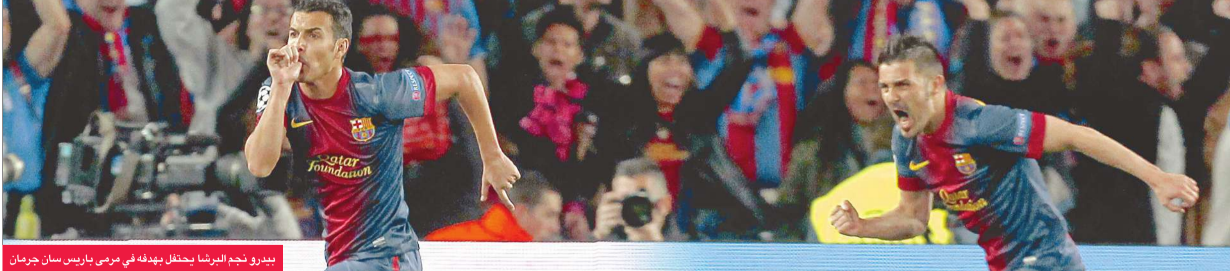
بيدرو نجم البرشا يحتفل بهدفه في مرمى باريس سان جرمان

تأهل برشلونة الإسباني إلى نصف نهائي دوري أبطال أوروبا لكرة القدم عقب التعادل مع باريس سان جرمان الفرنسي بهدفين في إياب دور الثمانية على ملعب كامب نو.