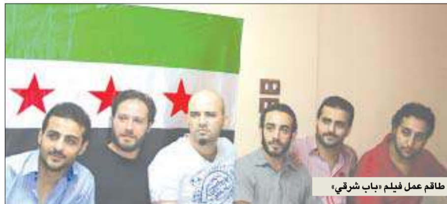
طاقم عمل فيلم «باب شرقي»