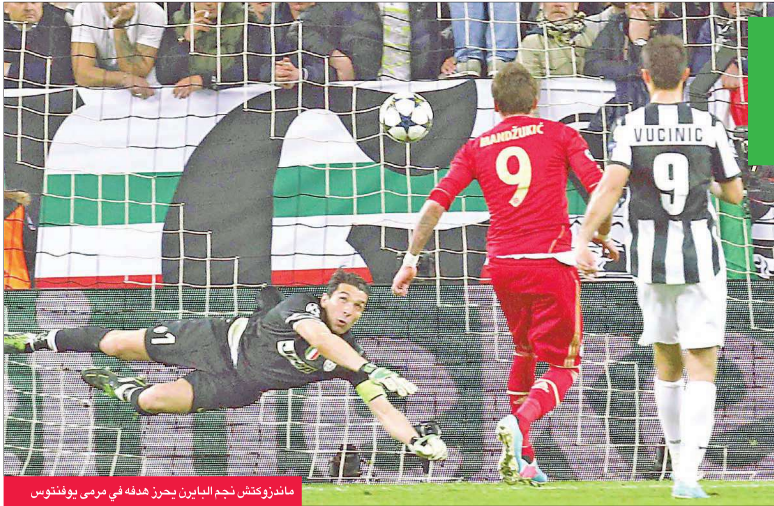
ماندزوكيتش نجم البايرن يحرز هدفه في مرمي يوفنتوس