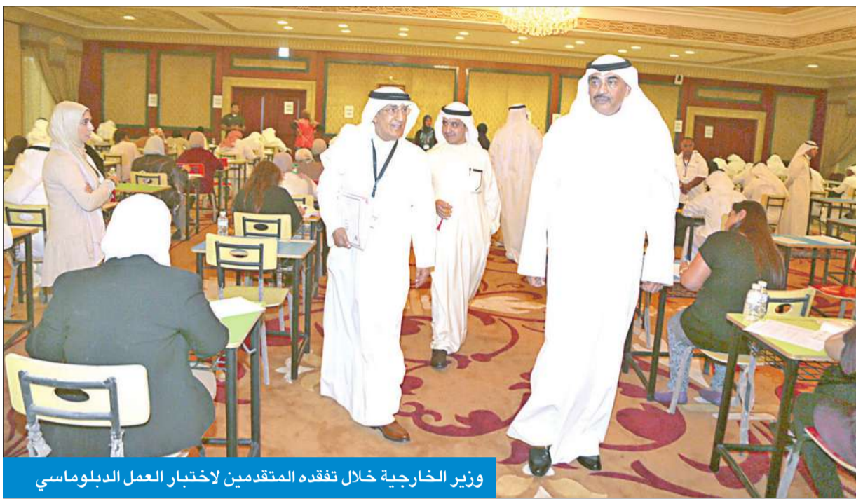
وزير الخارجية خلال تفقده المتقدمين لاختبار العمل الدبلوماسي

التطوير والمراحل التي أنجزت اعتباراً من شهر إبريل من عام 2012 وهو تاريخ المباشرة فيها. من جانبه ثمن وزير الخارجية العرض القيم والواقعي مشيداً بهذه الخطوة الهامة وبالمشروع ككل وما احتواه من عناصر ومحاور حيوية ستعود إلى رفع كفاءة الأمانة العامة وتحقيق رسالتها كما عبر عن سروره واعتزازه بالأهداف العامة التي تشهدها خطة التطوير وتحديداً تركيزها على تطوير العنصر البشري باعتباره الثروة الحقيقية لحاضر ومستقبل دول المجلس.