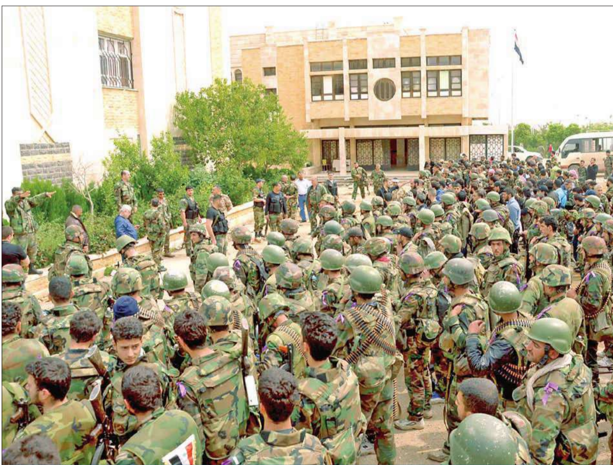
ضابط كبير في الجيش السوري يعطي التوجيهات الأخيرة لجنوده قبل انطلاقهم في هجوم على منطقة ليرامون في حلب أمس

«هيومن رايتس»: الطيران السوري يقصف المخابز والمستشفيات