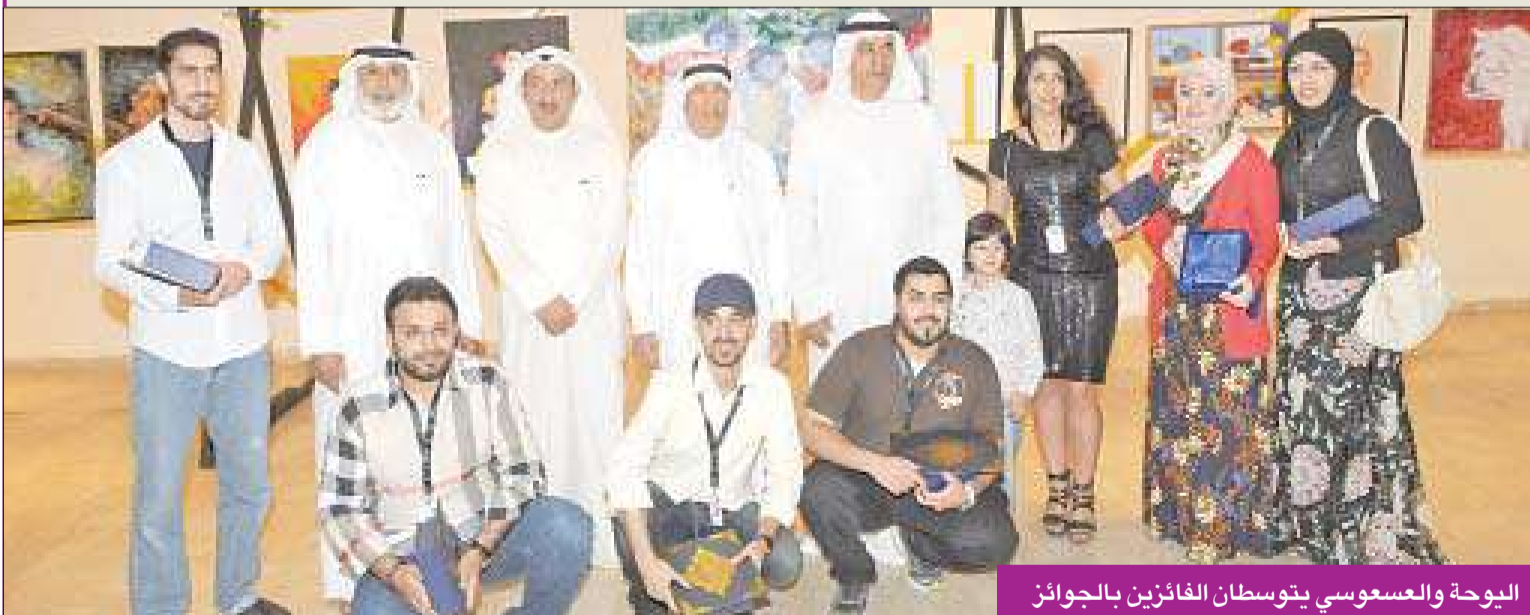
اليوحة والعسوسى يتوسطن الفائزين بالجوائز

تنوعت أعمال الدورة السادسة لمعرض مجموعة سامي محمد للفنون التشكيلية مقدمة أشكالاً فنية معاصرة.