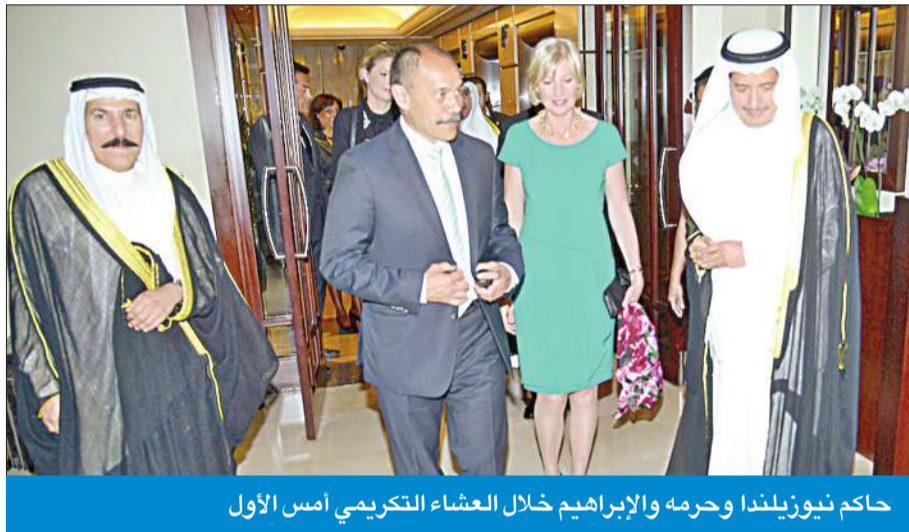
حاكم نيوزيلندا وحرمه والإبراهيم خلال العشاء التكريمي أمس الأول

كما قام ماتيباراوي وحرمه صباح أمس بزيارة المركز العلمي حيث اطلعا على هذا الصرح الحضاري الذي يحمل الأناش الإسلامية بمنطقه قبلة وقاما بجولة في معرض روائع الشرق القديم واطلعا على ما احتواه من آثار إسلامية قديمة ثم قاما ظهر أمس بزيارة لمسجد الدولة الكبير.