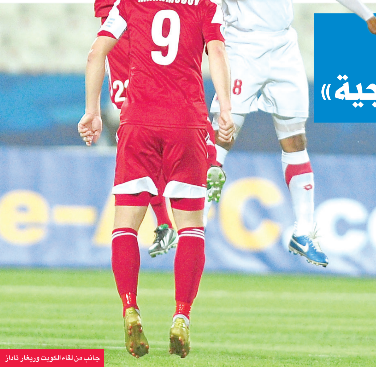
جانب من لقاء الكويت وريغار تاداز

محققاً الفوز تلو الآخر قارباً ومحبياً، والرائع في الأبيض في الوقت الحالي هو عدم إصابة لاعبيه بالكلل والتمل من توالي الانتصارات، بل يمكن التأكيد على أنهم وصلوا إلى مرحلة «التشبع» الكروي، حيث باتوا «يلتهمون» منافسيهم بلا رحمة، والدليل عدم اكتفائهم بهدف أو اثنين أو حتى ثلاثة، حيث سحق الفريق السالمية في الجولة السابقة من الدوري المحلي بخماسية، ثم فاز ناصر على مقاعد البدلاء رغم أن الفريق كان يحتاج للفوز دون سواء.