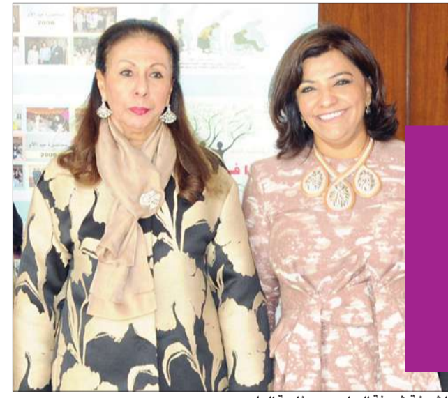
الشيخة شريفة الجاسم ود. نادية العلي

نظمت وحدة الغدد الصماء بالمستشفى الأميري فعالية توعية لصحة المرأة، وأشادت الدكتورة نادية العلي رئيسة الوحدة بالجهود التي تقوم بها حرم سمو ولي العهد الشيخة شريفة الجاسم، للتوعية بالأمور المتعلقة بصحة المرأة، والكشف المبكر عن المخاطر الصحية لكل مرحلة عمرية من حياة المرأة، كما أشادت ببتروح الشبيخة شريفة الجاسم بالدم خلال هذه الفعالية.