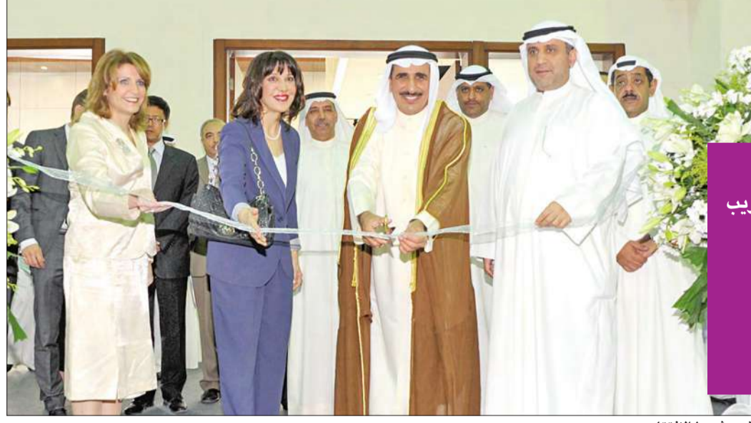
قص شريط الافتتاح

المناسبة افتتاح معرض التعليم والتدريب والتوظيف