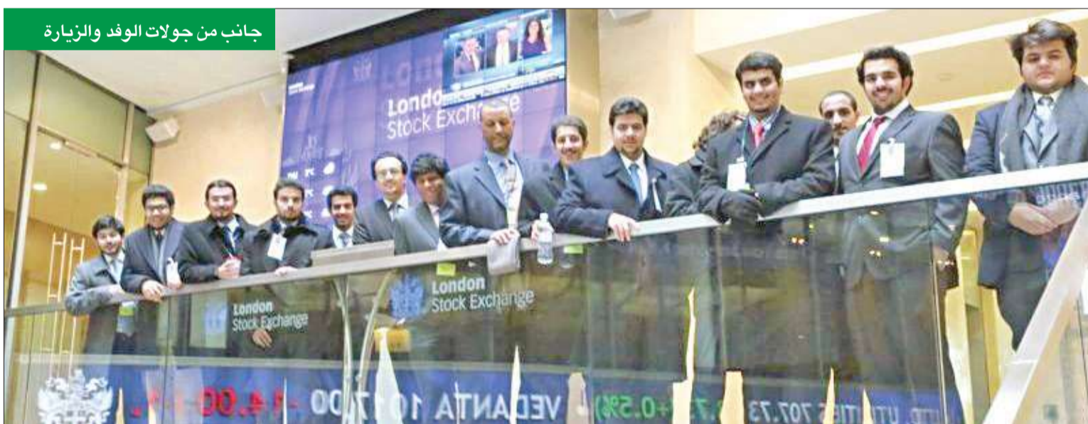
جانب من جولات الوفد والزيارة

الإسلامي الراغبين بالحصول على درجة الدكتوراه والماجستير من الجامعة وتمت مناقشتهم وتوسيع أفاق معرفة الوفد بهذا المجال.