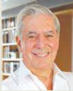
ماريو فارغاس يوسا

انطلقت في السادس من أبريل الحالي جائزة جديدة باسم الروائي ماريو فارغاس يوسا، تهدف إلى تحفيز الأصوات الإبداعية الجديدة لهذا النوع الأدبي المكتوب باللغة الإسبانية.