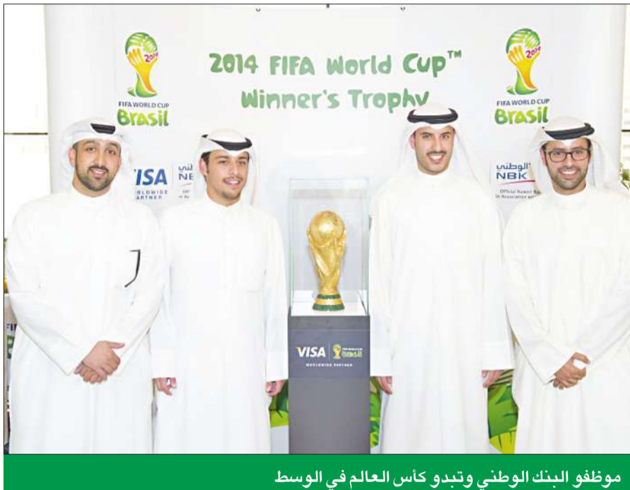
موظفو البنك الوطني وتبدو كأس العالم في الوسط

حظي موظفو بنك الكويت الوطني بفرصة مشاهدة كأس العالم الذهبية، التي استضافها البنك الوطني في المبنى الرئيسي وذلك في سابقة تشهد للمرة الأولى في تاريخها. وتمكن الموظفون من التقاط الصور التذكارية الخاصة لهم ولعائلاتهم مع هذه الكأس التاريخية ذات الشعبية العالمية.