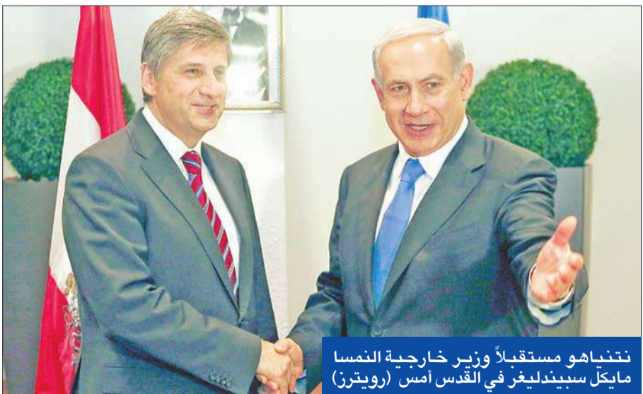
تنتياهو مستقبلاً وزير خارجية النمسا مايكل سيبيديغر في القدس أمس (رويترز)

وقال الموظف الإسرائيلي إن إسرائيل عبرت عن معارضتها لخطة كيري، وإنه «يوجد خلاف حول إطار العملية السياسية وحول كيفية إجرائها»، مشدداً على أن «إسرائيل تعارض محادثات حول الحدود والأمن بداية، وقد قلنا هذا لكيري، ويوجد اتفاق حول ذلك بين جميع الوزراء الذين