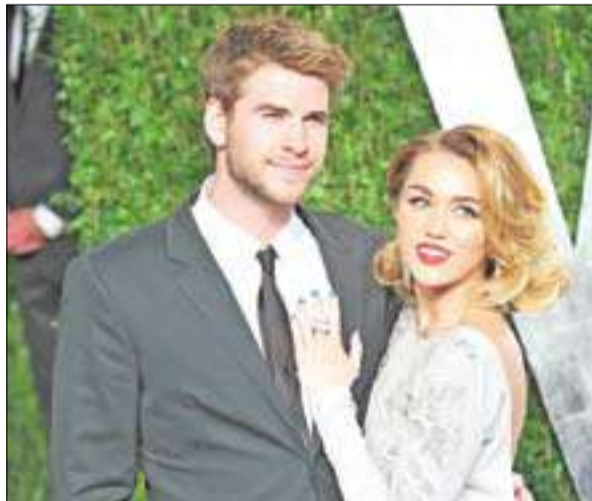
مايلي سايروس وليام هيمسورث

لذلك توصلنا إلى أنه من الأفضل العمل على تسوية المشاكل قبل الزواج. وذكر المصدر: «انهما غير مستعدين، وأسرتيهما قلقتان لانهما لا تريدان أن تريا مايلي وليام يتزوجان ثم يتطلقان، فهما صغيران على الزواج». (لوس أنجلوس - د ب أ)