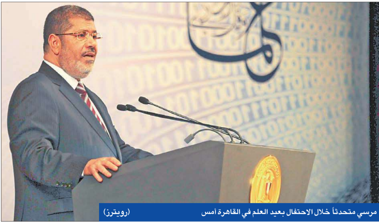
مرسي متحدثاً خلال الاحتفال بعيد العلم في القاهرة أمس

القاهرة - أيمن عيسى ومحمد فتوح ونسمة نصر