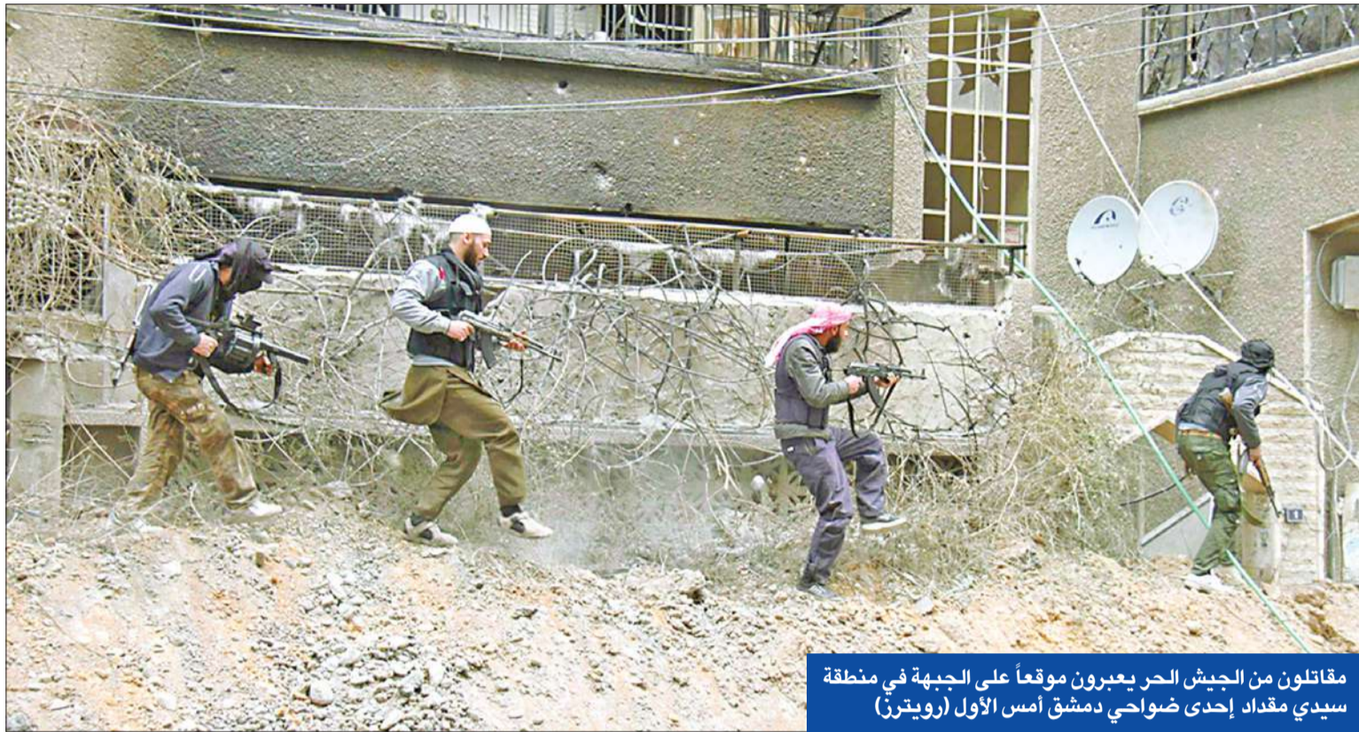
مقاتلون من الجيش الحر يعبرون موقعا على الجبهة في منطقة سيدي مقداد إحدى ضواحي دمشق أمس الأول

● لافروف: سنسعى مع واشنطن إلى إقناع المعارضة بالتفاوض ● برلين ترفض تسليح المعارضة السورية