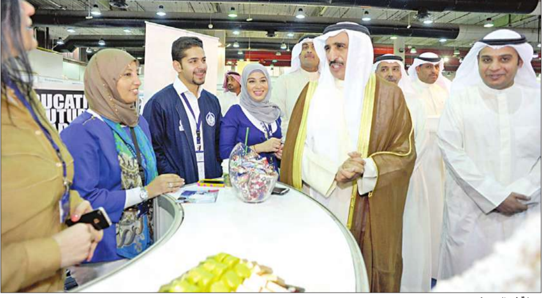
جولة في المعرض