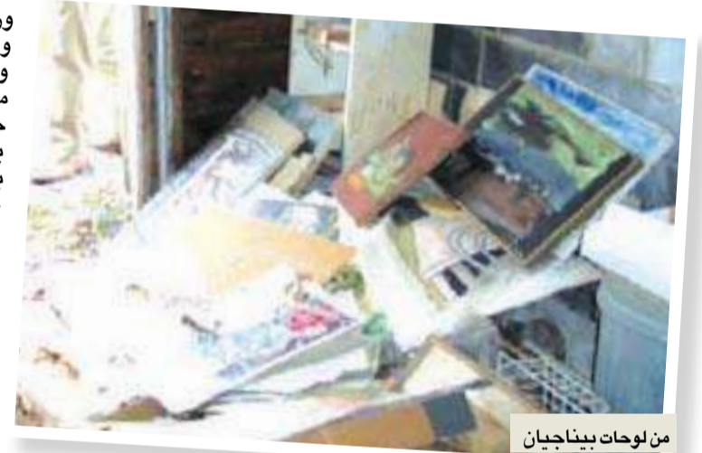
من لوحات بيناجيان

السؤال هل يتحول بيناجيان «أسطورة» فنية جديدة،