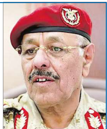
علي صالح الأحمر