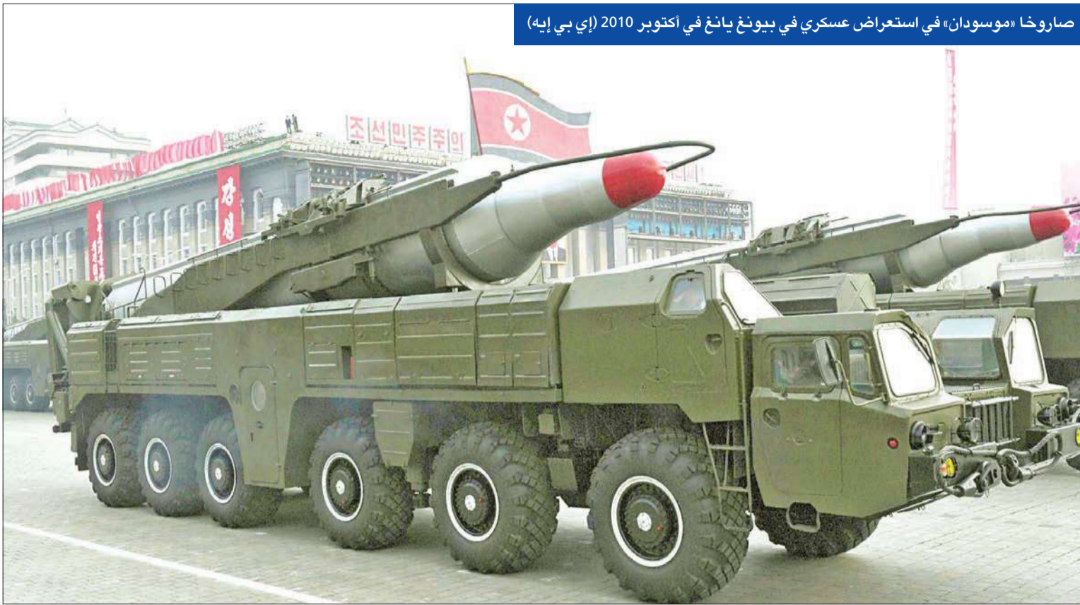
صاروخا «موسودان» في استعراض عسكري في بيونغ يانغ في أكتوبر 2010

في حالة تاهب، تحسباً لأي هجمات صاروخية تشنها كوريا الشمالية أمس، في الوقت الذي حولت فيه بيونغ يانغ انتباهها للاحتفال بأسرة كيم الحاكمة. ورغم تهديداتها بمهاجمة قواعد أميركية وكوريا الجنوبية رداً على أي ممارسات عدائية، بدأت الدولة الشيوعية ترطب بموجات من الزائرين احتفالاً بذكرى ميلاد مؤسسها كيم إيل سونغ والتي تحل يوم الاثنين القادم.