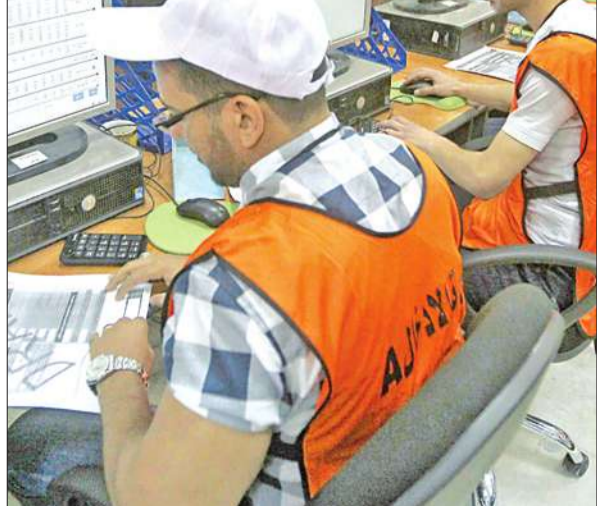
دورة تدريبية لموظفي لجنة الانتخابات في بغداد أمس

الحكومة تستعد للانتخابات والمالكي يحذر من توجيه المقترعين