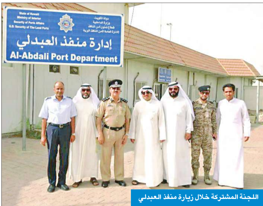
اللجنة المشتركة خلال زيارة منفذ العبدلي

به اللجنة من تنفيذ التوصيات التي قدمتها خلال تقريرها الأخير، بعد دراسة دامت أكثر من عام لهذه المواضيع العويش، بصفته نائبا لرئيس اللجنة العليا المشتركة، سيواصل جولته على المنافذ البرية، للاطلاع على ما قامت