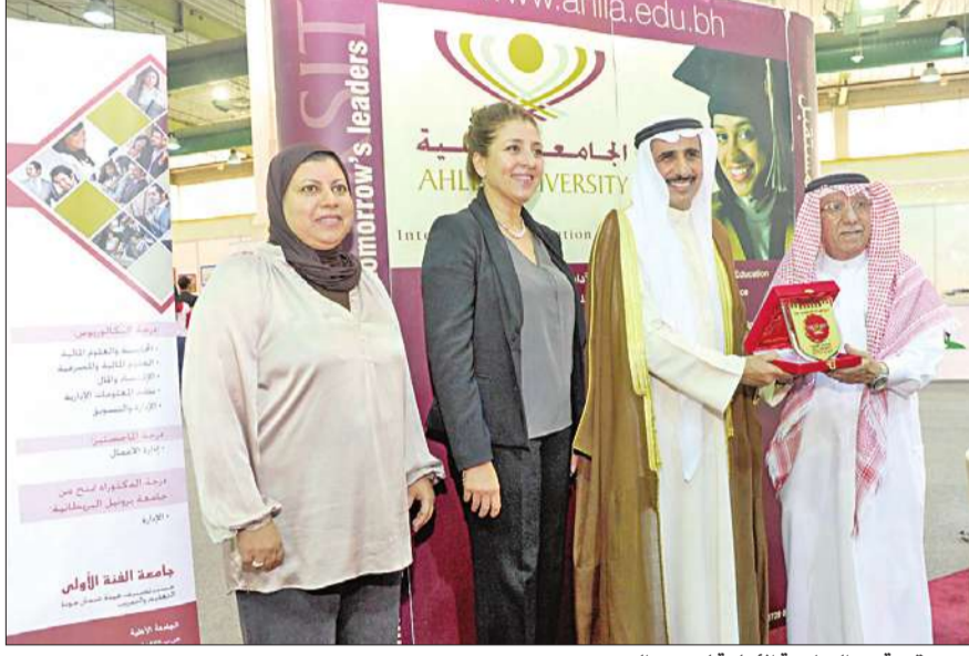
درع مقدمة من الجامعة الأهلية لمحمد الرومي

افتتح وكيل ديوان الخدمة المدنية محمد حمد الرومي معرض التعليم والتوظيف بحضور سفيرة فرنسا لدى الكويت ندى يافى في أرض المعارض الدولية وقام بجولة بين أقسام الجامعات المختلفة المشاركة .