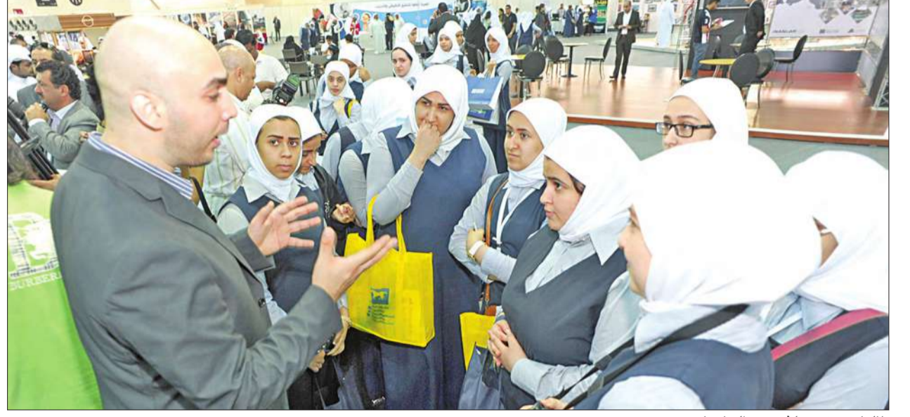
طالبات يستمعن لشرح عن الجامعات