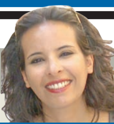
لمح فريد العثمان

يقول جان إيف برادو، الخبير في المركز الوطني الفرنسي للأبحاث الفضائية، والذي يعمل في مراقبة الأجرام القريبة من الأرض، "إنه أمر مستبعد جدًا أن يصطدم الكويكب بالأرض، لكنه ليس مستحيلًا". ويبلغ قطر "أبوفيس" 325 مترًا، حسبما أظهرت الصور التي التقطها التلسكوب هيرشيل، وهو مصنف ضمن الأجرام التي يمكن أن تشكل خطرًا على الأرض، إذ إن ارتطامه بالأرض قد يؤدي إلى دمار واسع النطاق. ولفهم حجم الدمار الذي سولده ارتطام جرم بهذا الحجم