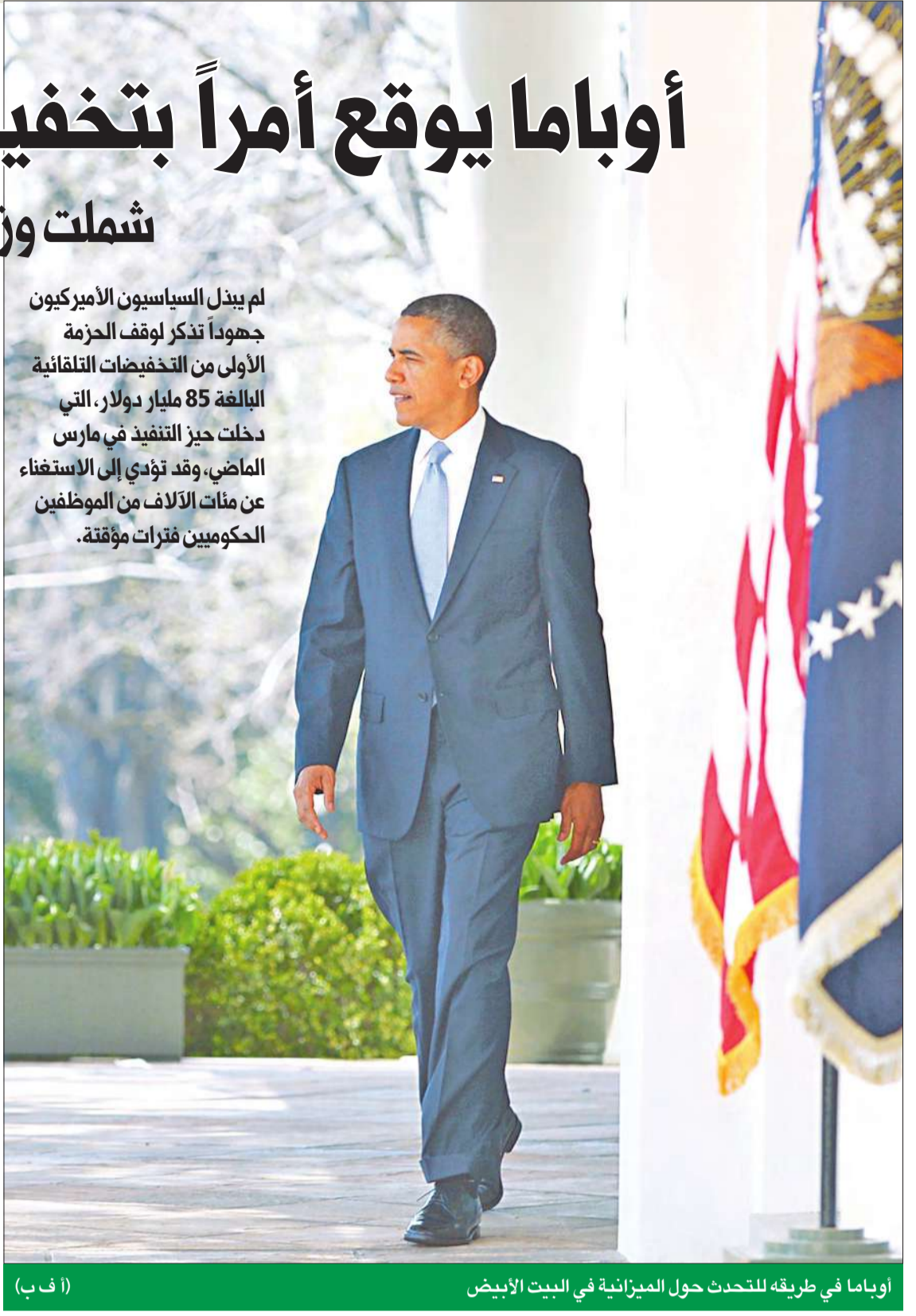
أوباما في طريقه للتحادث حول الميزانية في البيت الأبيض