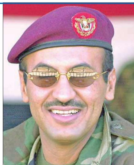
أحمد علي صالح

إعادة تشكيل وتسمية المناطق العسكرية وتعيين قياداتها. وعبر الأحمر، الذي أدى اليمين الدستورية أمام هادي، أمس، عن ارتياحه الكبير للقرارات، مؤكداً أنها «تطلي تطلعات الشعب اليمني، وحققت أهداف الثورة السلمية»، كما بارك تحويل مقر الفرقة الأولى مدرع إلى حديقة عامة. وأعلنت اللجنة التنظيمية للثورة الشعبية تأييدها لقرارات رئيس الجمهورية، معتبرة أنها قضت بتقسيم المسرح العسكري للجمهورية اليمنية، وداعية الجماهير إلى الاحتشاد والمشاركة الكبيرة اليوم في جمعة «النصر». وبينما رحبت الأمانة العامة لمؤتمر الحوار الوطني