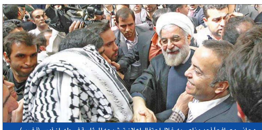
روحاني مصافحا أحد مناصريه خلال احتفال إعلان ترشيحه للرئاسة في طهران أمس

مجدداً، قال روحاني: «أذهبوا واسألوهما». وأعلن عشرون شخصية إيرانية ترشحتها للانتخابات بينها الإصلاحي محمد رضا عارف نائب الرئيس السابق إبان حكم خاتمي، والمحافظان المعتدلان محمد باقر قليباي رئيس بلدية طهران وعلي أكبر ولايتي وزير الخارجية الأسبق بين 1981 و1997 والمستشار الحالي للمرشد الأعلى علي خامنئي. وينبغي تقديم الترشيدات