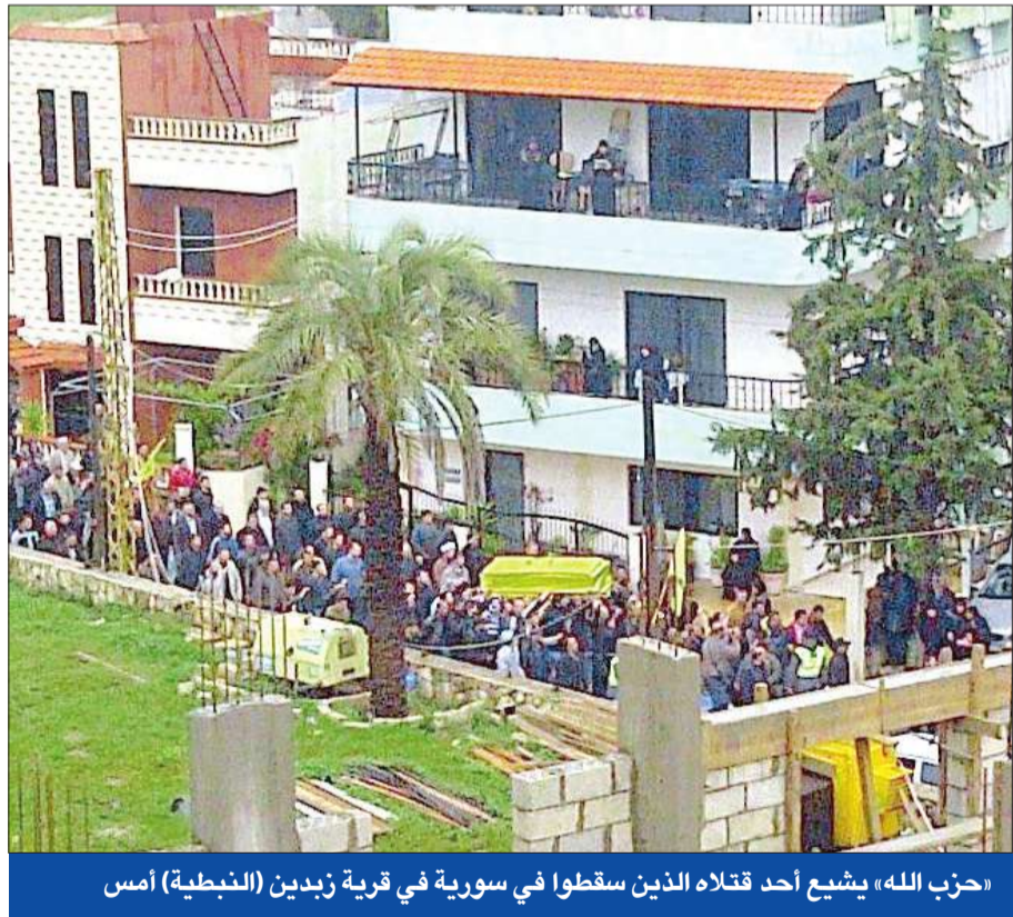
حزب الله، يشيع أحد قتلاه الذين سقطوا في سورية في قرية زبدين (النبطية) أمس