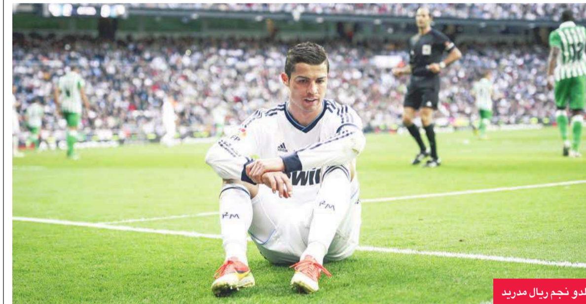
رونالدو نجم ريال مدريد

جديد مع النجم البرتغالي حتى الآن. حضر الاجتماع كل من فلورنطينو والمدافع البرتغالي بيبي وكل من ناتشو وأدان وعدد من أصحاب المناصب الادارية في النادي. وقال بيريز في الاجتماع "أسطورة هذا النادي صقلت عبر 111 عاماً عن طريق لاعبين ورؤساء عظماء، والأهم من هذا ان النادي وصل لما هو فيه بفضل الجماهير التي تنقله للأجيال اللاحقة حب ريال مدريد".