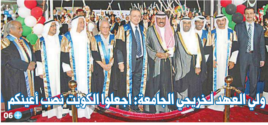
ولي العهد لخريجي الجامعة: أجعلوا الكويت نصب أعينكم