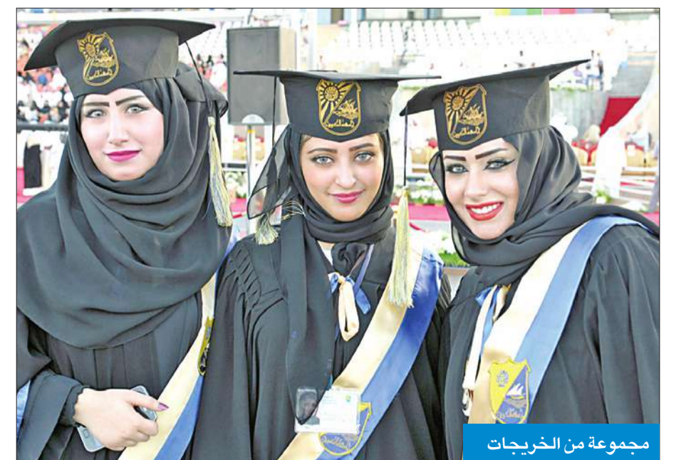
مجموعة من الخريجات