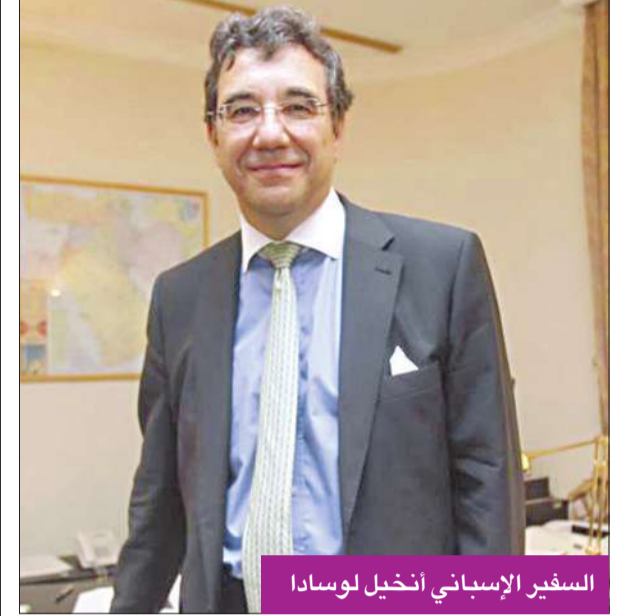
السفير الإسباني أنخيل لوسادا

تحتفل سفارة مملكة إسبانيا لدى الكويت باليوم العالمي للكتاب في الساعة من مساء اليوم، في بيت لودان، برعاية مكتبة ذات السلاسل، وتتضمن الاحتفالية قراءة في كتاب «دون كيشوت»، و«بازار»، وعرض كتب، بالإضافة إلى العديد من الهدايا والمفاجآت. ودعت السفارة الجميع، أطفالاً وكباراً، للاشتراك في هذا اليوم وقراءة كتاب «دون كيشوت»، علماً أن الافتتاح سيكون من قِبل السفير الإسباني، بحضور عدد من الدبلوماسيين المعتمدين لدى الكويت إضافة إلى الكتاب والمثقفين.