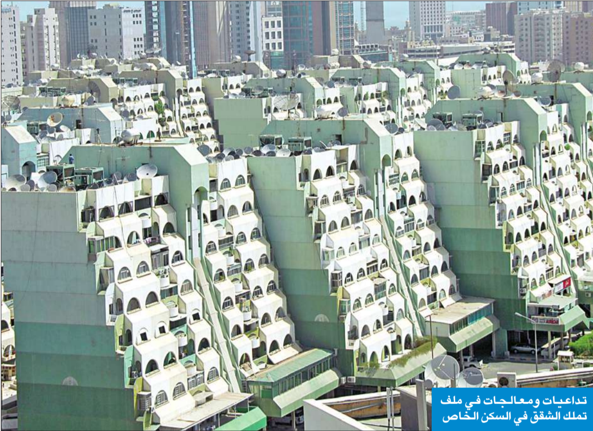
تداعيات ومعالجات في ملف تملك الشقق في السكن الخاص

نظمت أمس ورشة عمل بلدية تناولت مشاكل تملك الشقق في السكن الخاص والمخالفات الجسيمة التي وقعت فيها بعض مؤسسات الدولة لجهة السماح بالتملك.