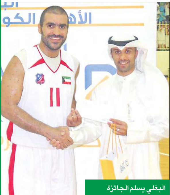
البعلي يسلم الجائزة

قدم البنك الأهلي الكويتي، انطلاقاً من حملته «أفضل لاعب»، التي تهدف إلى تشجيع اللاعبين المميزين في مختلف الأنشطة الرياضية، من خلال تقديم جوائز نقدية لهم، وتطبيقاً لسياسة المسؤولية الاجتماعية، جائزة نقدية لأفضل لاعب في مباراة الكويت مع القادسية، ضمن كأس كرة السلة.