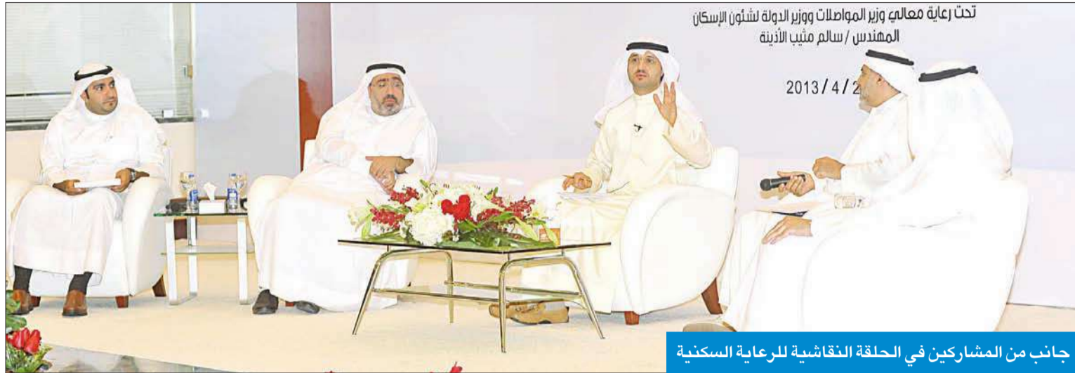
تحت رعاية معالي وزير المواصلات ووزير الدولة لشؤون الإسكان المهندس / سالم ميثيب الأذينة 2013 / 4 / 2

جانب من المشاركين في الحلقة النقاشية للرعاية السكنية