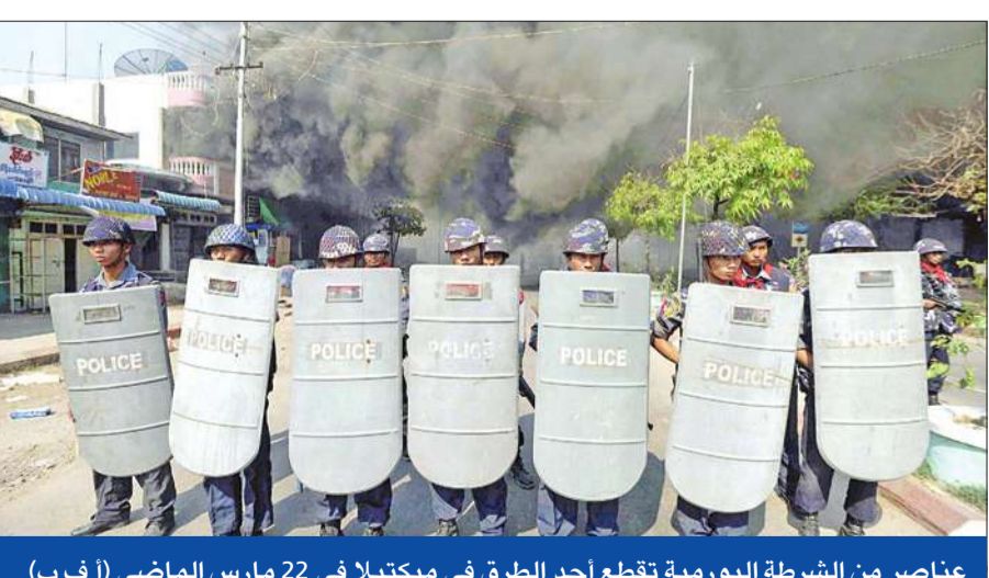
عناصر من الشرطة البورمية تقطع أحد الطرق في ميكتيلا في 22 مارس الماضي

ورهبان بوذيون أبناء طائفة الأراكان بدعم من أجهزة الأمن، على شن هجمات منسقة ضد الأحياء القرى المسلمة في أكتوبر 2012 من أجل إرهاب السكان وتهجيرهم قسراً. ولقد خرم عشرات الآلاف من النازحين من المساعدات الإنسانية ولم يتمكنوا من العودة إلى ديارهم". وأضافت هيومن رايتس