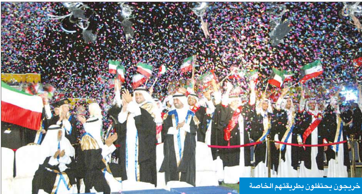
خريجون يحتفلون بطريقتهم الخاصة

وبدوره ألقى الخريج شرف الشرف كلمة الخريجين، التي قال فيها: «إننا اليوم يا سمو ولي العهد نجد العهد لوطننا الغالي بان تقدم كل ما نملك من العلم والمعرفة التي اكتسبناها في رحاب جامعتنا الحبيبة إلى وطننا العزيز».