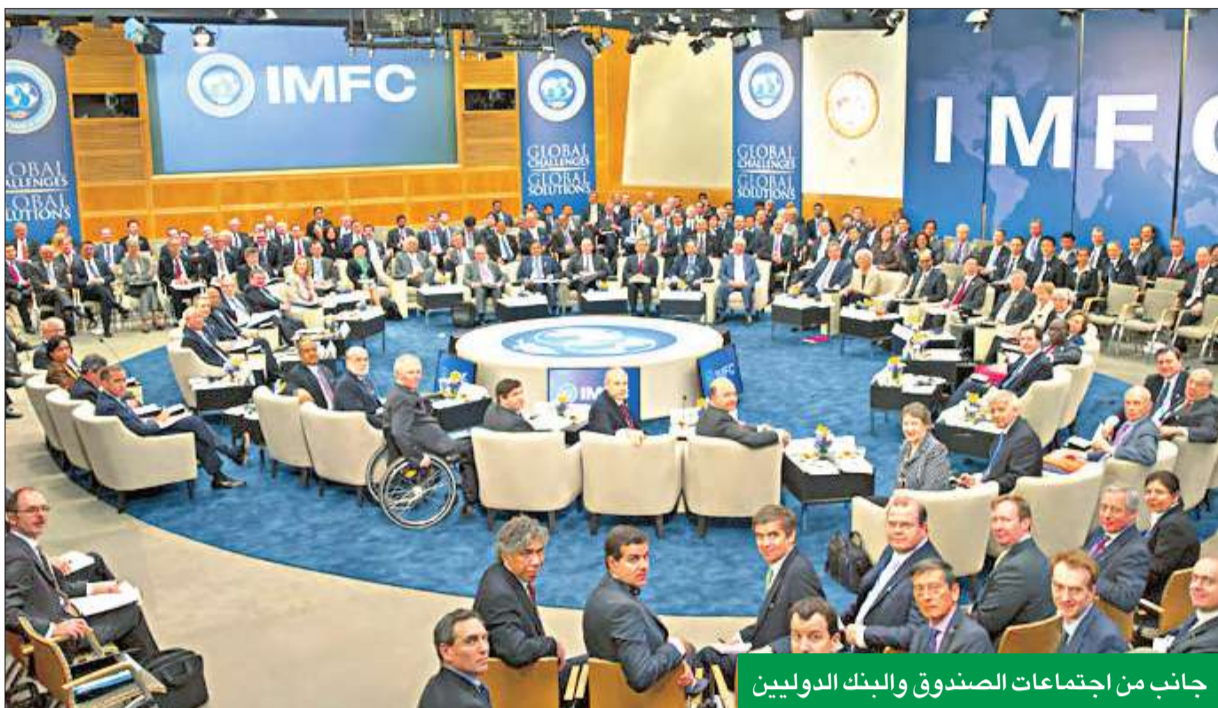
جانب من اجتماعات الصندوق والبنك الدوليين

بمعلان على إنهاء محادثاتهم بشأن قرض 4.8 مليارات دولار خلال الأسابيع المقبلة، لتقديم مساعدة مالية لمصر. وجاء في بيان مشترك أن صندوق النقد الدولي وممثلي الدولة المصرية أكدوا أنهم حققوا "تقدماً" في محادثاتهم التي عقدت خلال نهاية الأسبوع في واشنطن على هامش الجمعية العامة لصندوق النقد الدولي والبنك الدولي لفصل الربيع. وأضاف البيان أن الشريكين يريدان التوصل إلى اتفاق خلال الأسبوع المقبل حول حصول السلطات المصرية على تسهيلات تمكنها من دعم البرنامج الاقتصادي الوطني التي تنوي تنفيذها. وأكدت المديرية العامة لصندوق النقد الدولي كريستين لاغارد أن الصندوق لن يتخلى عن طاولته المفاوضات حول خطة المساعدة لمصر ولكنه ينتظر من الأسرة الدولية تقديم دعم مالي للبلاد.