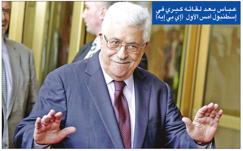
عباس بعد لقائه كيري في إسطنبول أمس الأول

إسرائيل تسعى إلى إنهاء القطيعة... و«حماس» تهتم عباس بالتواطؤ