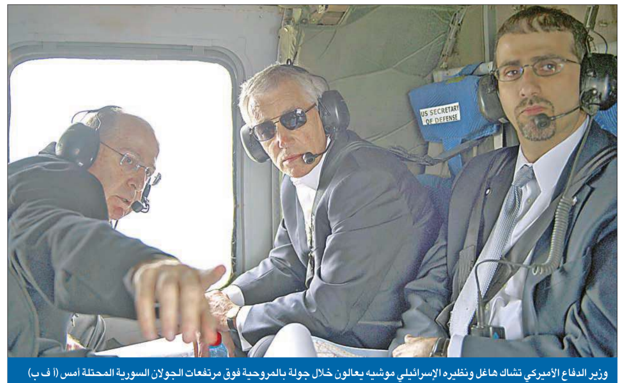
وزير الدفاع الأمريكي تشاك هاغل ونظيره الإسرائيلي موشيه يعالون خلال جولة بالمرحبة فوق مرتفعات الجولان السورية المحتلة أمس

صيرة: ما يجري في القصير هو إعلان حرب من «حزب الله»