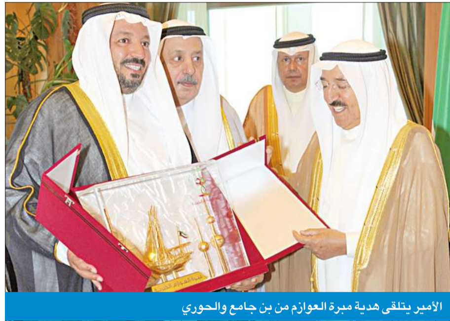
الأمير يتلقى هدية مبرة العوازم من بن جامع والحدوري

استقبل سمو أمير البلاد الشيخ صباح الأحمد بقصر السيف صباح امس فلاح بن جامع ورئيس مجلس ادارة مبرة ديوان العوازم الدكتور رشيد الحدوري وأعضاء المبرة وقدموا لسموه هدية تذكارية. كما استقبل سموه ظهر امس رئيس مجلس ادارة مبرة ديوان العداوين خالد سعود الحدواني وأعضاء المبرة. وحضر المقابلتين نائب وزير شؤون الديوان الأميري الشيخ علي الجراح.