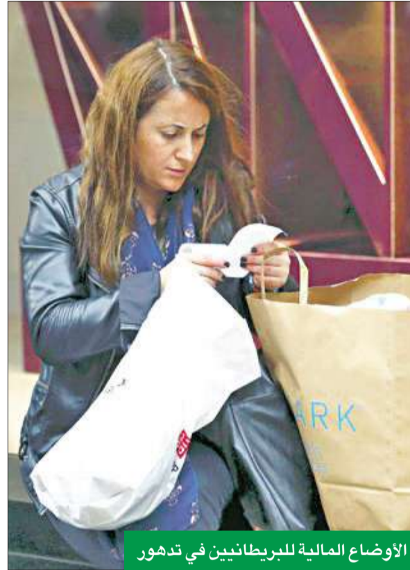
الأوضاع المالية للبريطانيين في تدهور

وتأبعت أنه سيتم توسيع نطاق البرنامج ليشمل المؤسسات المتخصصة مثل المؤسسات المالية التي تفرض بضمان الأصول