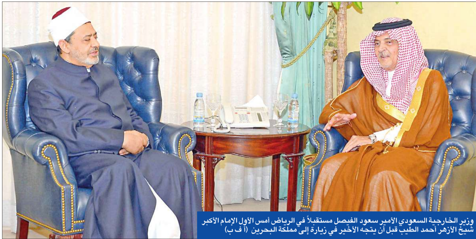
وزير الخارجية السعودي الأمير سعود الفيصل مستقبلاً في الرياض أمس الأول الإمام الأكبر شيخ الأزهر أحمد الطيب قبل أن يتجه الأخير في زيارة إلى مملكة البحرين

القاهرة - محمد يحيى وأحمد بركات وشيما جلال