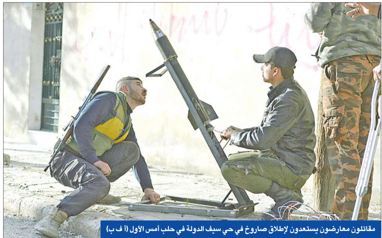
مقاتلون معارضون يستعدون لإطلاق صاروخ في حي حلب أمس الأول

إلى ذلك، رأى الأسد أمس خلال لقائه وفداً من مجلس الشورى الإيراني برئاسة رئيس لجنة الأمن القومي والسياسة الخارجية علاء الدين بروجدي، أن «البرلمانات هي ممثلة الشعوب الحقيقية وصوتها، وعليها واجب الوقوف للدفاع عن الشعوب التي تمثلها، وما يجري الآن في منطقتنا من مخططات تستهدف استقرارها ووحدتها مسؤولية أكبر للتنسيق فيما بينها وتوحيد جهودها لمواجهة أعداء هذه الشعوب».