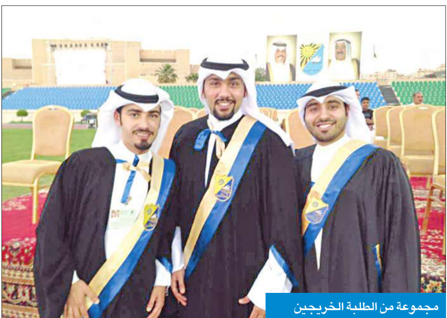
مجموعة من الطلبة الخريجين