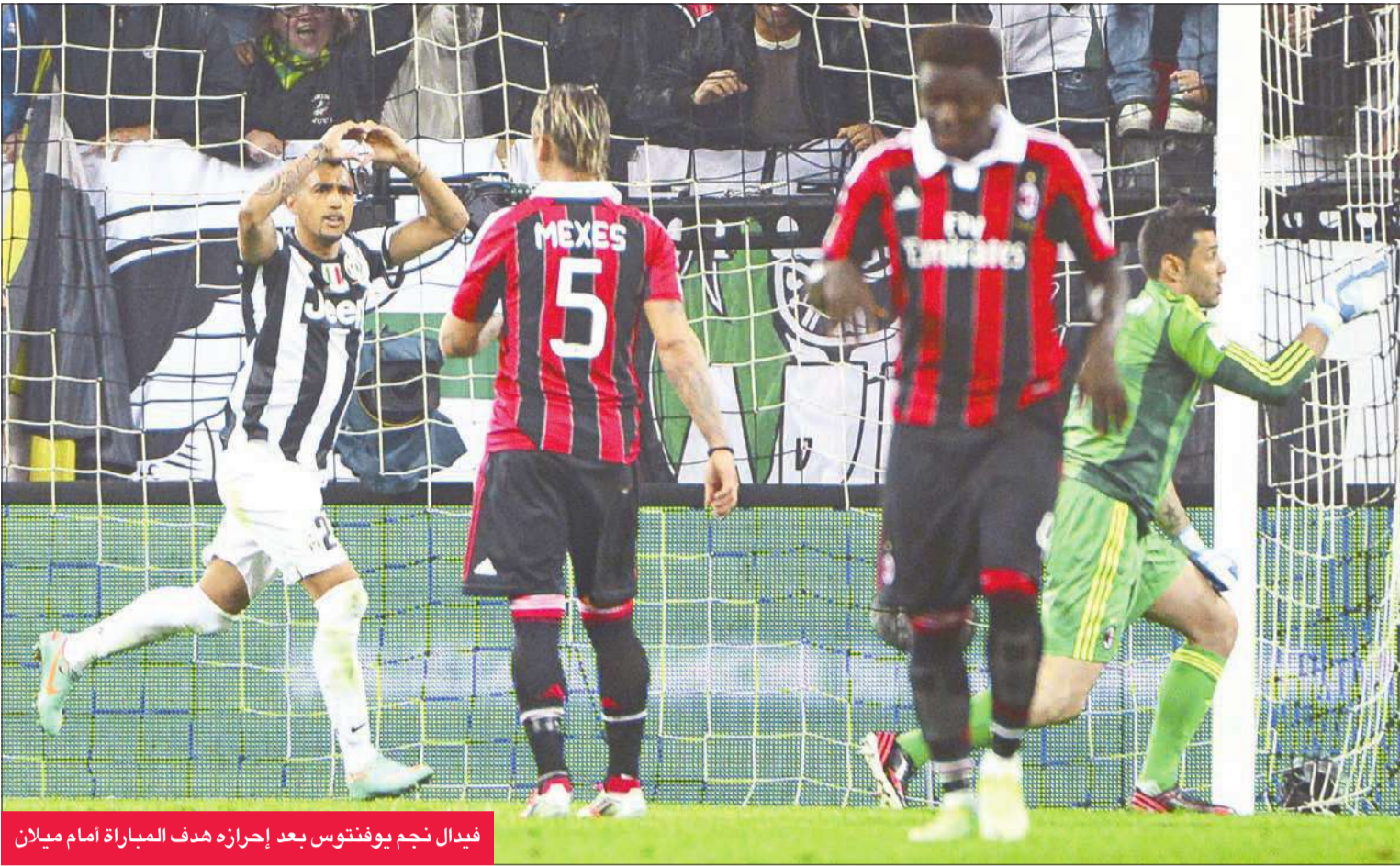
فيدال نجم يوفنتوس بعد إحرازه هدف المباراة أمام ميلان

وجه محاولة ليوناردو بونوتشي (70)، ورد ميلان بتسديدة للغانى البدليل سولي مونتاري تالق بوفون في صدها (75).