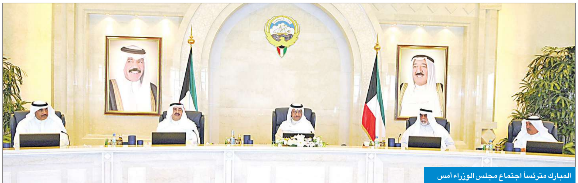
المبارك مترئساً اجتماع مجلس الوزراء أمس

السوزاء عن ادانته الشديدة، والمه البالغ للأعمال الإرهابية التي شهدتها مدينة بوسطن الأميركية مؤخرًا، وما ترتب عليها من مقتل واصابة العديد من الضحايا الأبرياء.