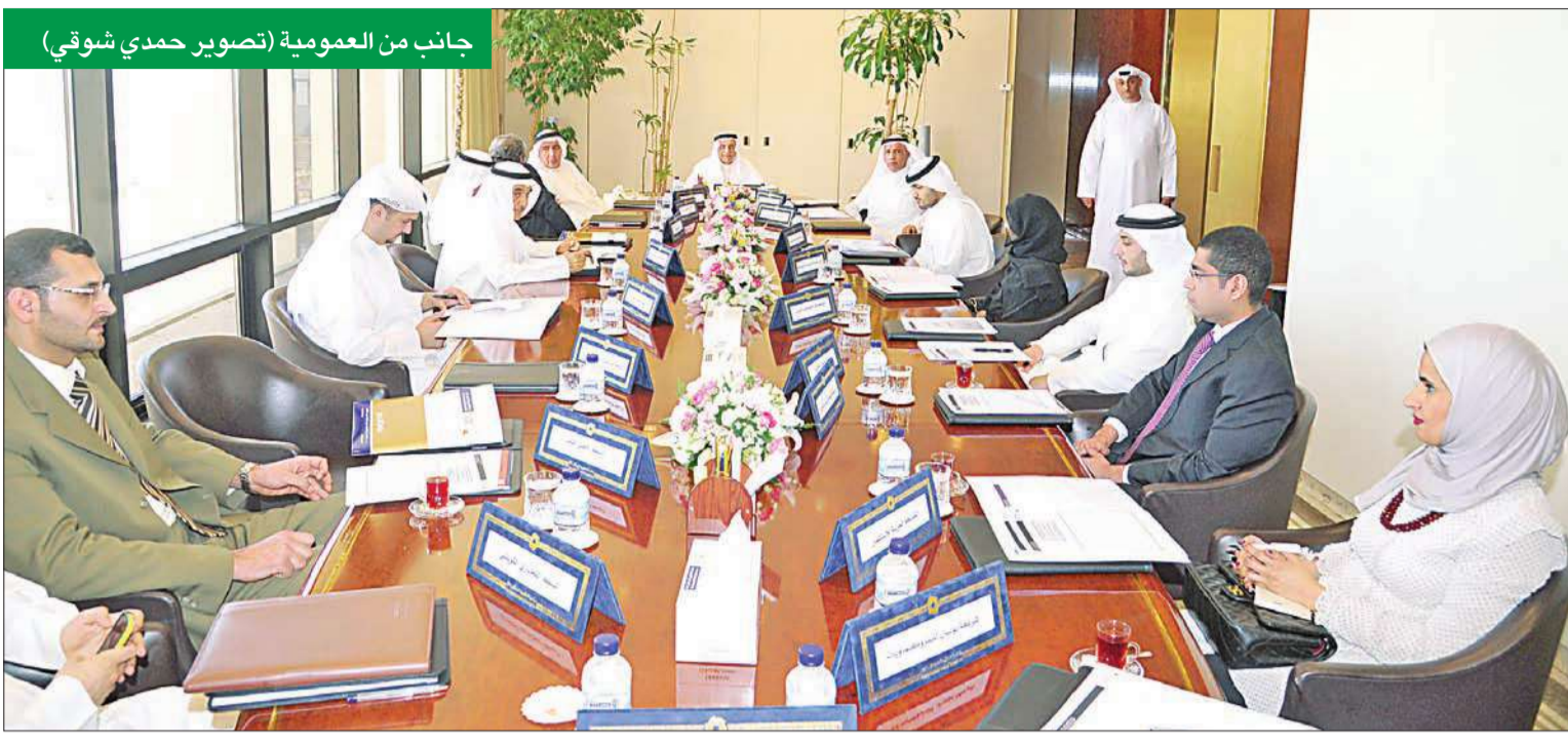
جانب من العمومية

محفظة تمويل الصناعة منحت خمسة مشاريع في 2012 بتكاليف استثمارية بلغت 4.2 ملايين دينار