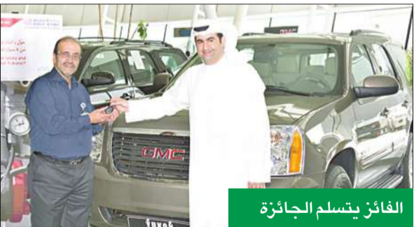
الفائز يتسلم الجائزة

موظفي شركة نفط الكويت إلى زيارة فرعه للتعرف عن كثر على نماذج حساب الراتب لموظفي الشركة.