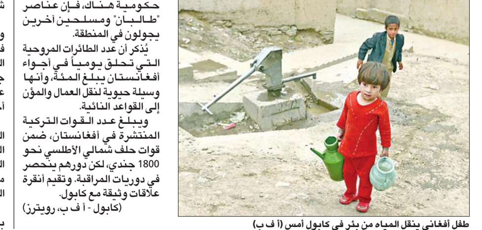
طفل أفغاني ينقل المياه من بئر في كابول أمس

المروحية هبطت اضطرارياً بسبب سوء الأحوال الجوية وهو ما جعل عناصر «طالبان» يختطفون ركابها، وهم تسعة أجناب أفغان. وأشار متحدت باسم قوات التحالف الدولي إلى أنها تساعد في البحث عن المختطفين، وكانت الطائرة متوجهة ليل أمس الأول، من كابول إلى خوست، جنوبي شرق العاصمة.