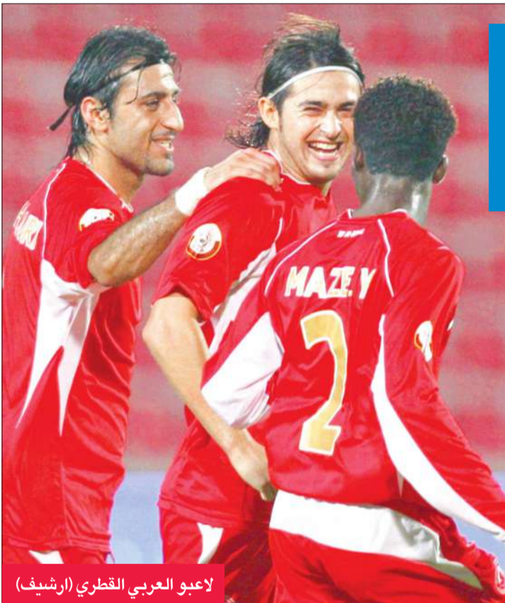
لاعبو العربي القطري (ارشيف)