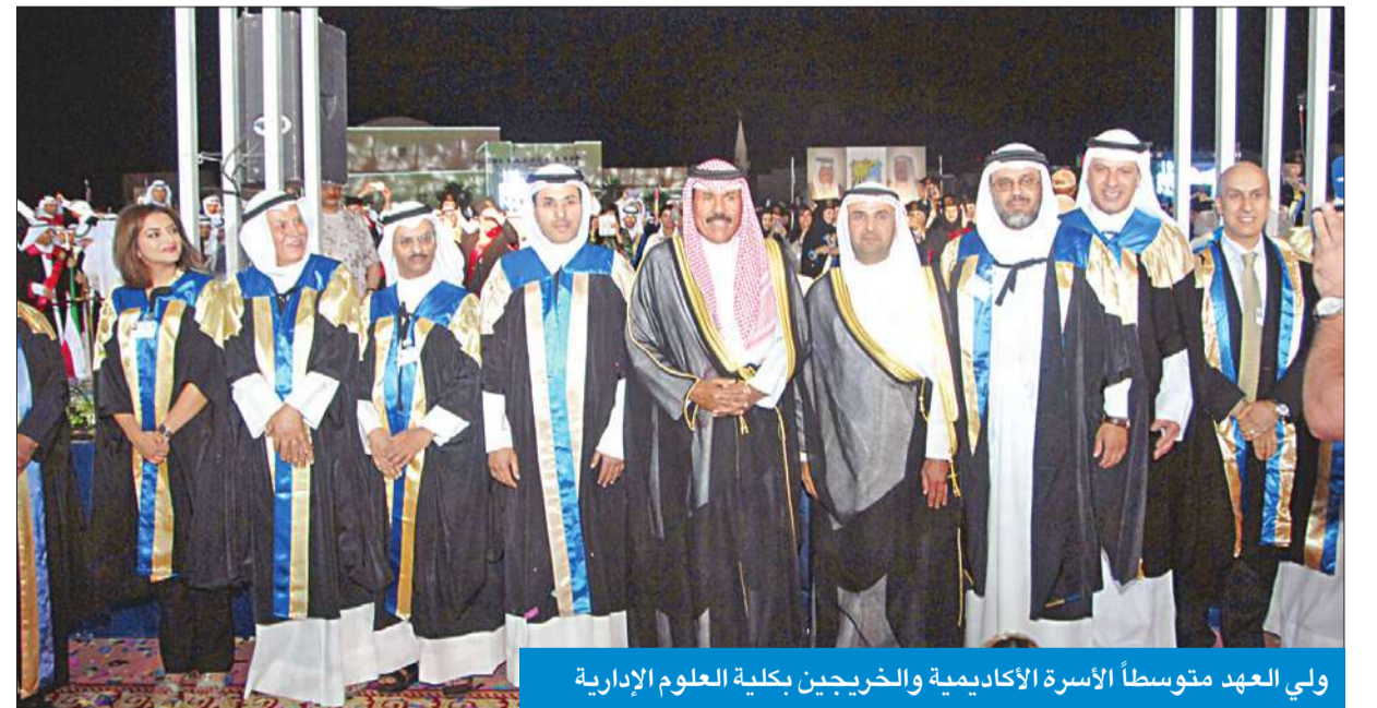
ولي العهد متوسلاً الأسرة الأكاديمية والخريجين بكلية العلوم الإدارية