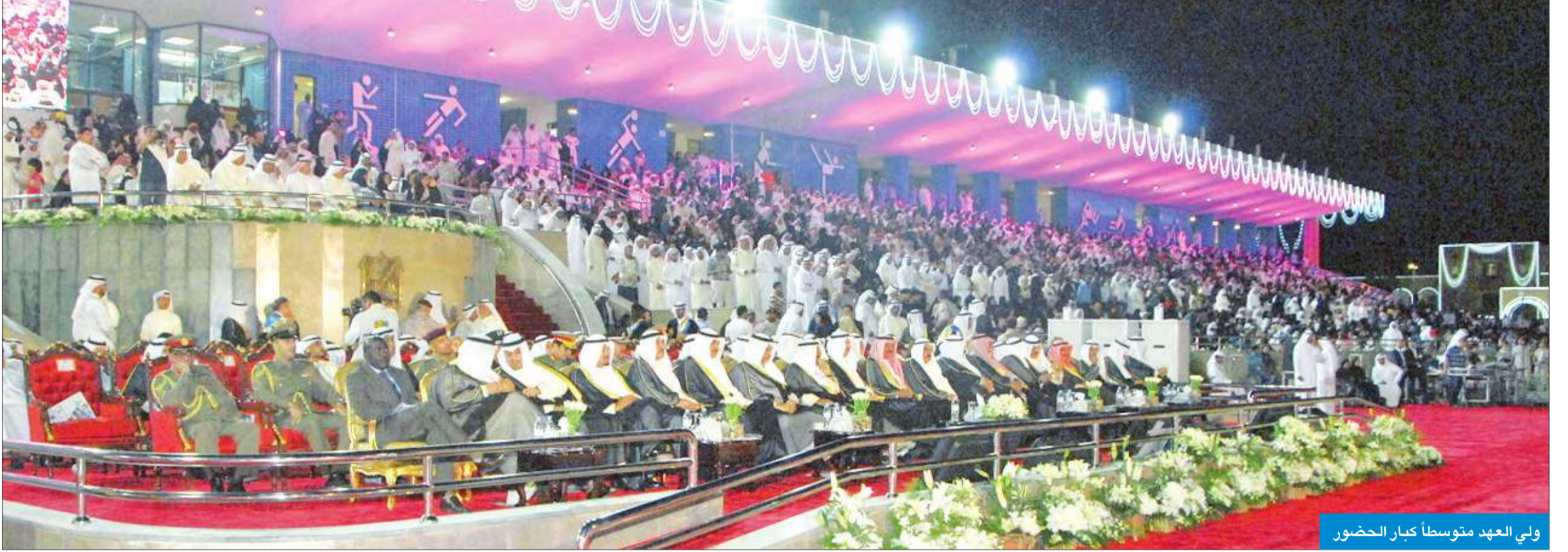
ولي العهد متوسلاً كبار الحضور

سموه رعى الحفل السنوي الموحد للدفعة الـ 42