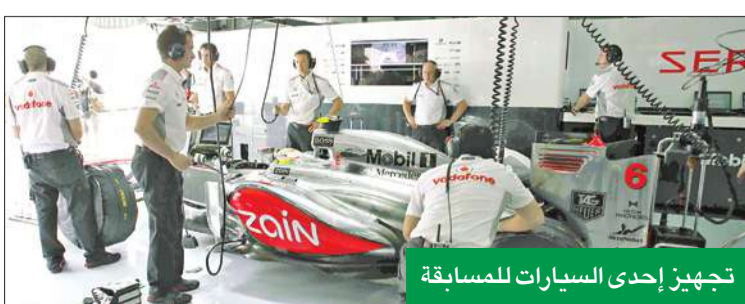
تجهيز إحدى السيارات للمسابقة

وذكرت المجموعة في بيان صحفي أن عدد الزيارات على موقعها الإلكتروني ومواقعها على شبكات التواصل الاجتماعي «فيس بوك - تويتر - يوتيوب» شهدت زيادة قياسية بلغت 600 في المئة، مبيئة أنها لمست هذه المشاهدات الاستثنائية خلال الارتباط الذي حققته علامته التجارية مع سباق الفورمولا 1 (الجائزة الكبرى) من خلال فريق فودافون مكالرن مرسيدس. وأوضح «زين» أن ارتباط علامتها التجارية مع سباق الفورمولا 1 للسيارات من خلال فريق فودافون مكالرن مرسيدس جاء في إطار اتفاق الشراكة التسويقية الذي جمع بين مجموعة زين ومجموعة فودافون