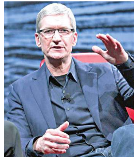
تيم كوك (أرقام)

عن رئيس تنفيذي جديد فإن "تسرياً" بهذا الشأن من الصعب خروجه من بين أروقة الشركة، لكن لا بد من الانتظار، والتعريب خصوصاً ان صناعة "أبيد" و"أيفون" ستعلن نتائجها الفصلية يوم غد الثلاثاء، وستنصّب الكثير من الأمور، لاسيما عن مبيعات "أيفون" التي تعد دينامو الربح في الشركة. وتشير بعض التوقعات إلى ان أرباح شركة "أبل" قد تتراجع للمرة الأولى في عشر سنوات، وذلك بتأثير سلبي من تناو نمو مبيعات "أيفون" خلال ربعها المالي الثاني، وطبقاً لذلك فإن أرباح الشركة المنتظر اعلانها اليوم ستتراوح 18 في المئة إلى 9.53 مليارات دولار أو 10.02 دولارات للسهم الواحد، بينما تشير التوقعات إلى ارتفاع الإيرادات 8 في المئة إلى 42.4 مليار دولار.