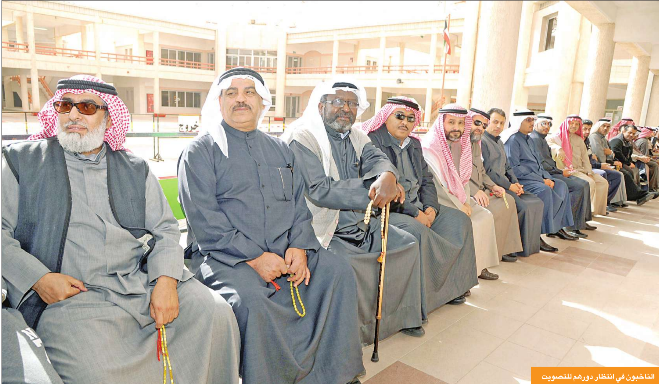
الناخبون في انتظار دورهم للتصويت

شهدت منطقة الجابرية حضوراً كثيفاً منذ الساعات الأولى لفتح باب التصويت حتى آخر دقيقة، أما خيطان فشهدت إقبالاً في مزار النساء.