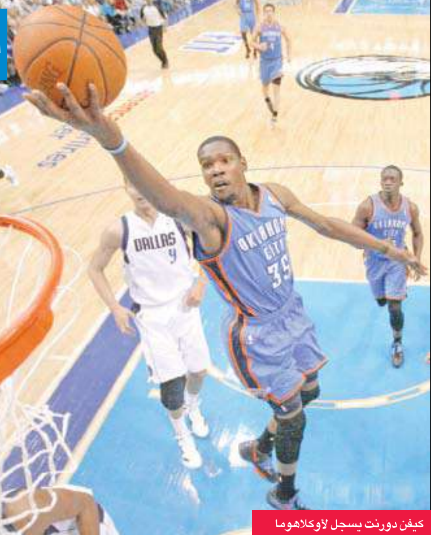
كيفن دورنت يسجل لأوكلاهوما

واصل كل من أوكلاهوما سيتي ثاندرو وفيلادلفيا سفنتي سيكسرز تعلقهما رغم افتقادهما الأسماء «الرائدة»، بفوز الأول على دالاس مافريكس حامل اللقب 95-86، والثاني على شيكاغو بولز 98-82 أمس الأول، ضمن منافسات الدوري الأميركي للمحترفين في كرة السلة. وعلى ملعب «اميركان إيرلاينز سنتر» وإمام 20316 متفرجاً، أكد أوكلاهوما سيتي أنه «الحصان الأسود» بتغلبه على مضيفه لأميركا للكرة الثالثة في هذا الموسم المصغر، محققاً ثأره على اكل وجه من فريق ولاية تكساس الذي تغلب عليه في نهائي المنطقة الغربية الموسم الماضي في طريقة إلى اللقب الأول في تاريخه. ونجح أوكلاهوما في استعادة توازنه سريعاً، بعد أن خسار مباراته الأخيرة أمام مضيفه لوس أنجلوس كليبرز (100-112)، وعزز سجله كأفضل فريق في المنطقة الغربية والدوري، بعدما رفع رصيده إلى 17 فوزاً في 21 مباراة حتى الآن. ويدين أوكلاهوما بفوزه لتألق الثنائي راسل وستنبروك وكيفن دورانت، إذ سجل الأول 33 نقطة مع 6 متابعات و4 تمريرات حاسمة، والثاني 23 نقطة مع 13 متابعة في مباراة قدم فيها الضيوف أداءً دفاعياً مثيراً في الشوط الثاني، إذ أجبروا مضيفهم على الاكتفاء بـ 38 محاولة في الربعين الثاني والثالث بفضل جهود الكونغولي سيرج ايباكا الذي نجح في 10 اعتراضات دفاعية. وهذه الهزيمة التاسعة هذا الموسم لدالاس الذي دخل إلى هذه المواجهة وهو يبحث عن فوزه الرابع على التوالي والخامس عشر منذ انطلاق البطولة يوم عيد الميلاد. وعلى ملعب «ويلز فارغو سنتر» وإمام 18325 متفرجاً، أكد فيلادلفيا بدوره انه مفاجأة