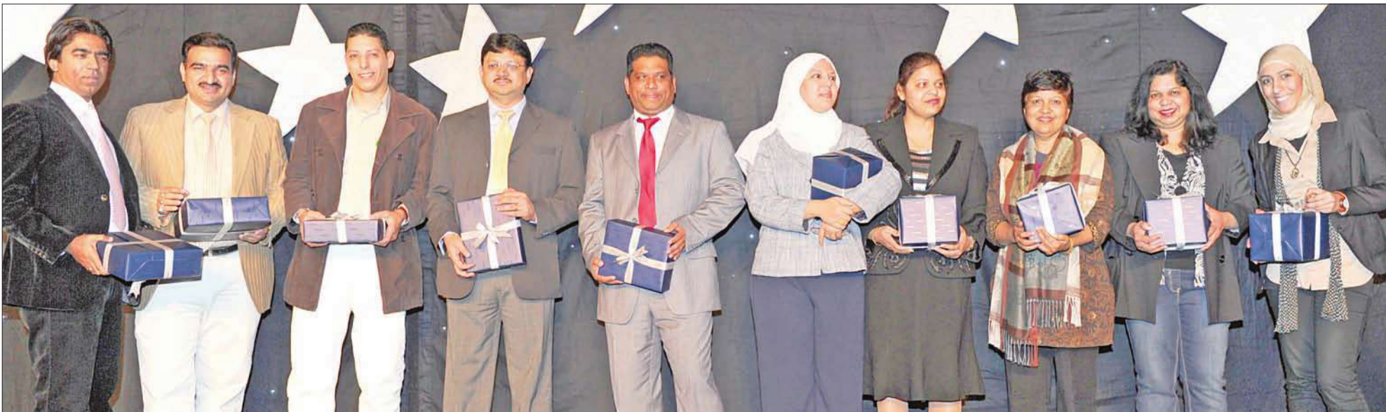
مجموعة من الحضور يتسلمون جوائزهم