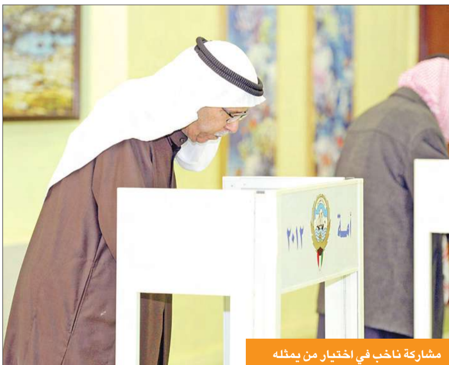
مشاركة ناخب في اختيار من يمثله