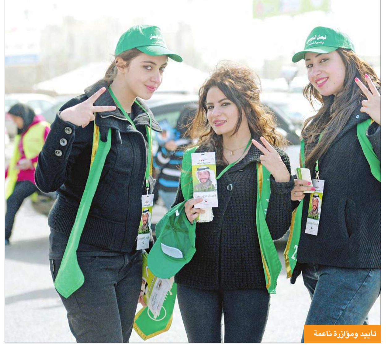
تأييد ومؤازرة ناعمة

يشوب اليوم الانتخابي، ورفضوا الحديث لوسائل الإعلام.