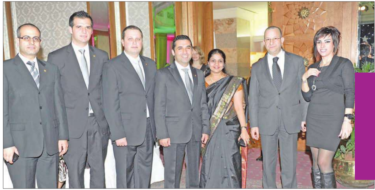
مدير عامر وفريق عمل التسويق والمبيعات

المناسبة حفل تكريم المكان فندق شيراتون الكويت