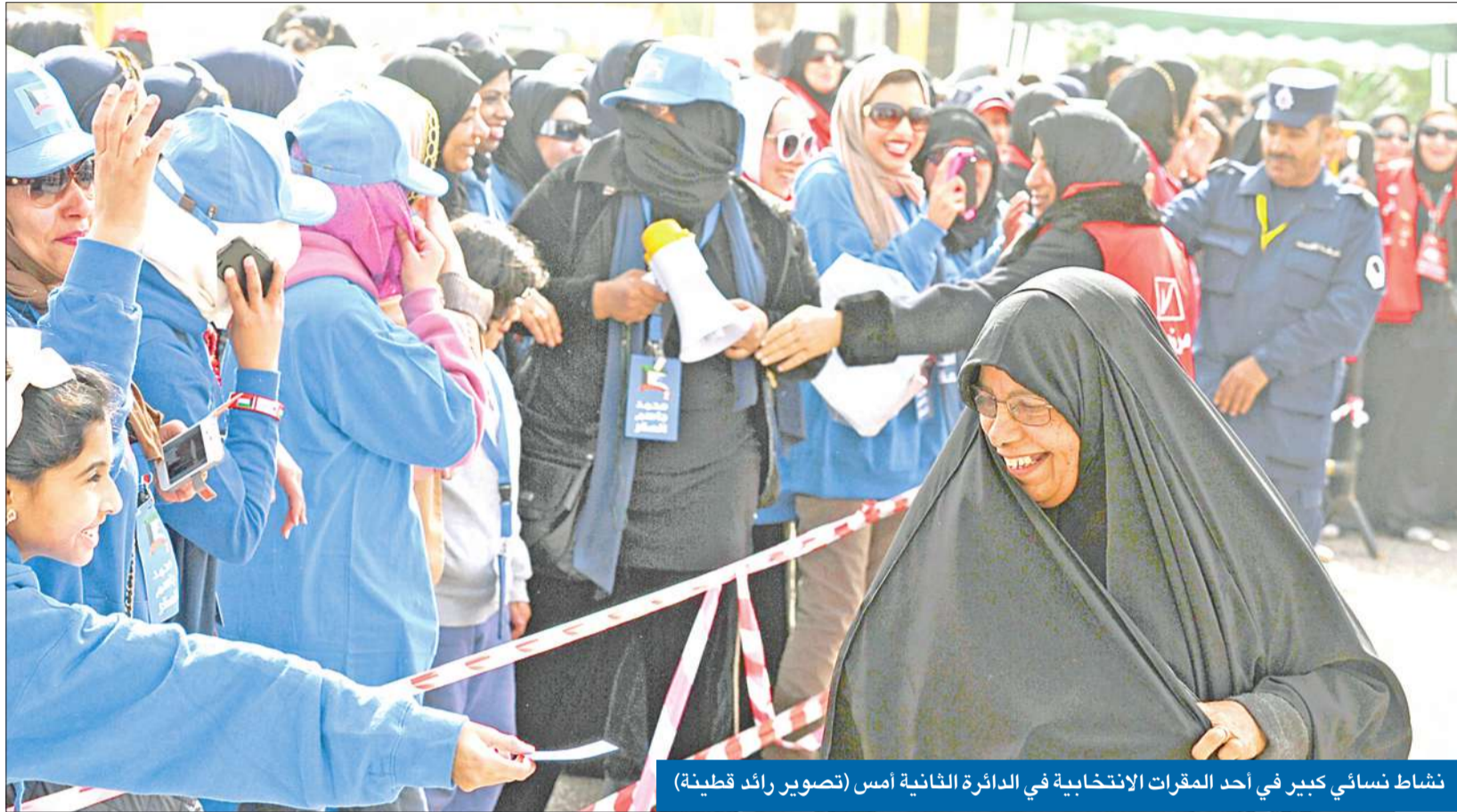
نشاط نسائي كبير في أحد المقرات الانتخابية في الدائرة الثانية امس

نسبة المشاركة تجاوزت 60% أعلاها في «الثالثة» وأقلها في «الخامسة»