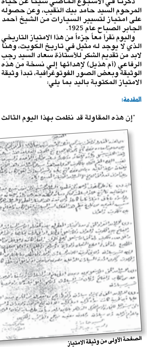
الصفحة الأولى من وثيقة الامتياز

ذكرنا في الأسبوع الماضي شيئاً عن حياة المرحوم السيد حامد بك النقيب، وعن حصوله على امتياز لتسيير السيارات من الشيخ أحمد الجابر الصباح عام 1925. واليوم نقرأ معاً جزءاً من هذا الامتياز التاريخي الذي لا يوجد له مثيل في تاريخ الكويت، وهنا لا بد من تقديم الشكر للأستاذة سعد السيد رجب الرفاعي (أم هذيل) لإهدائها إلي نسخة من هذه الوثيقة وبعض الصور الفوتوغرافية، تبدأ وثيقة الامتياز المكتوبة باليد بما يلي: المقدمة: إن هذه المقالة قد نظمت بهذا اليوم الثالث البند (1) بناء على الحقوق والعهود التي قطعها السيد حامد للشيخ والتي سوف تدرج بعد هذا بهذه الاتفاقية، فالشيخ عملاً بسلطته كحاكم وسائر مملكته عنه وعن ورثائه وخلفائه ورعيته يمنح إلى السيد حامد ولا لسواه ما يأتي امتيازاً تاماً كاملاً وأن مدة هذا الامتياز المعطى إلى السيد حامد هو خمسين سنة شمسية تقويمية من تاريخ تنظيم هذا الصك لتسيير السيارات لنقل الركاب والبضائع بالسيارات بين الكويت والعراق. البند (2) للسيد حامد انفراد الحق، في مدة الامتياز المعطى له بهذه المقالة، أن يسير السيارات لنقل الركاب والبضائع بين الكويت والعراق، وأن يستعمل أي طريق أو أي طرق يختارها في الأراضي التي واقعة داخل حدود الكويت، وله الحق أن يستعمل ويصلح الممرات والمعابر الكائنة في جبل غصي من الصبية إلى جبلي (غرب) المطلاع، وله الحق في إصلاح الشبان والوديان أو تحسيروهم أو تبطينهم أو أي عمل بحقهم... حسب لزومه لتسيير سيارته، وأن يبني الابنية اللازمة للسيارات والعمال والمحافظين وما يلزمهم من المساكن والمحلات وتكون