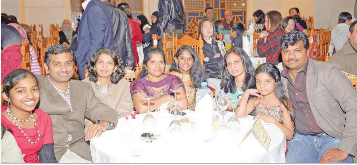
عائلة هندية مشاركة في الحفل