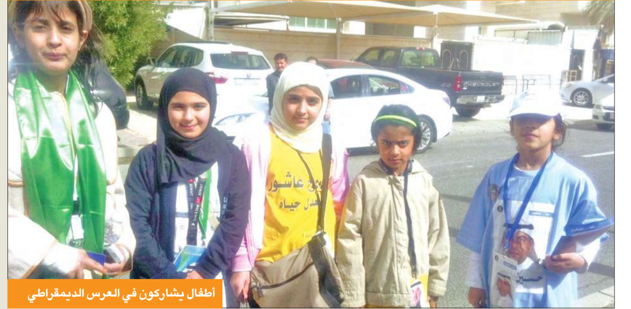
أطفال يشاركون في العرس الديمقراطي