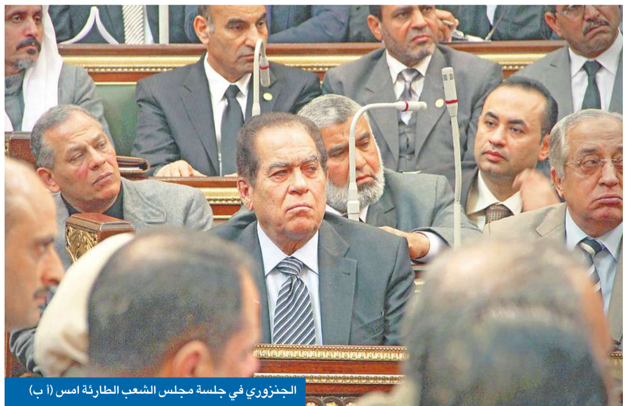
الجنزوري في جلسة مجلس الشعب الطارئة امس