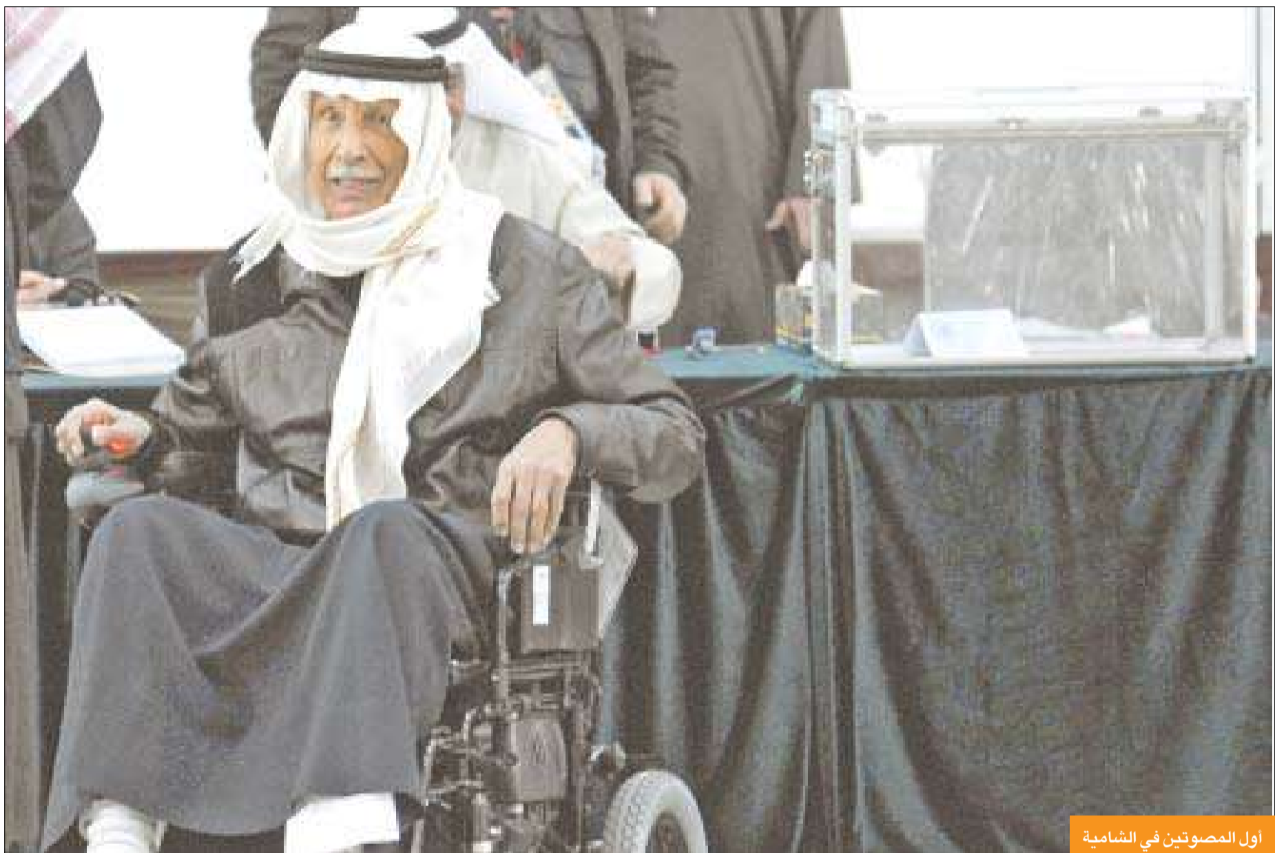
أول المصوتين في الشامية

بينما قال وزير الداخلية إن انتخابات «أمة 2012» تجسد التواصل الإيجابي بين الشعب وقيادته السياسية، أعرب وزير الإعلام عن أمله أن يحقق أعضاء المجلس الجديد المصالح العليا للبلاد.