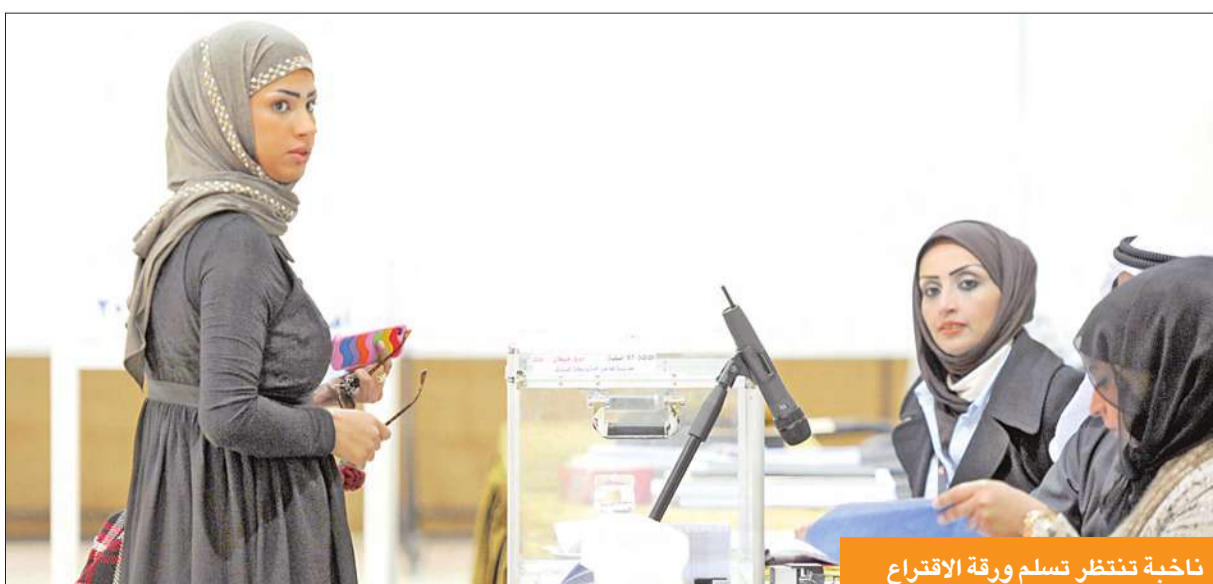
ناخبة تنتظر تسلم ورقة الاقتراع