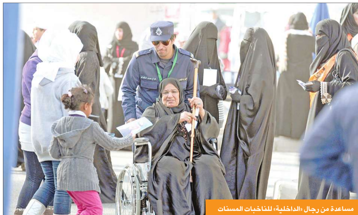
مساعدة من رجال «الداخلية» للناخبات المسنات

«فوز المؤزمين مرة أخرى سيعيد سياريو التصعيد بين المجلس والحكومة»