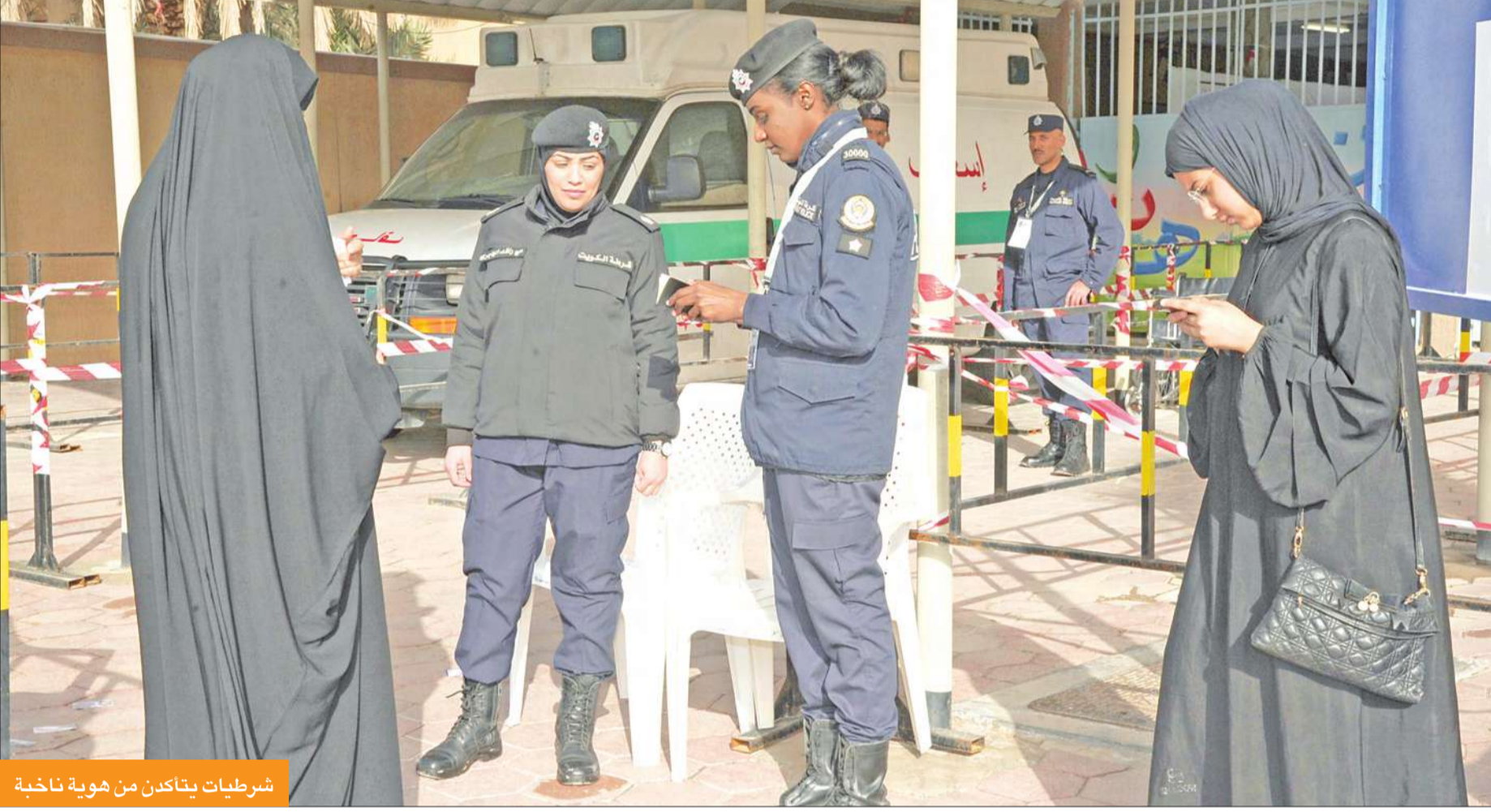
شرطيات يتأكدن من هوية ناخبة

دائماً ما كانت النساء ترجع الكفة في أي انتخابات سواء في الجامعة والمؤسسات الأكاديمية الأخرى أو في بعض جمعيات النفع العام، وكذلك في المواسم الديمقراطية السابقة ولكنها في هذه المرة غير خصوصاً في الدائرة الخامسة التي شهدت أمس عزوفاً غير مسبوق من المواطنات عن مراكز الاقتراع وهو ما قد يغير بعض الموازين عند التحالفات الموجودة في المنطقة.