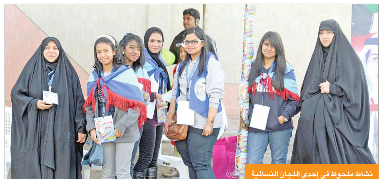
نشاط ملحوظ في إحدى اللجان النسائية