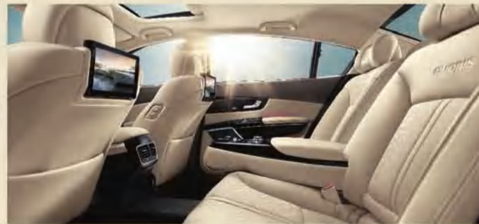
مساحة خلفية في غاية الراحة توفر راحة مطلقة مع منظومة تحكم في المسند الوسطي وشاشات 8,2 إنش