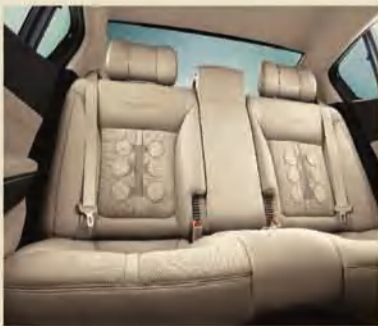
جميع الكراسي مكيفة (تبريد - تدفئة)