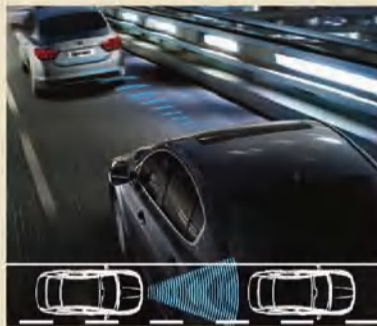
نظام المحافظة على المسافة الأمنة موجه بالرادار