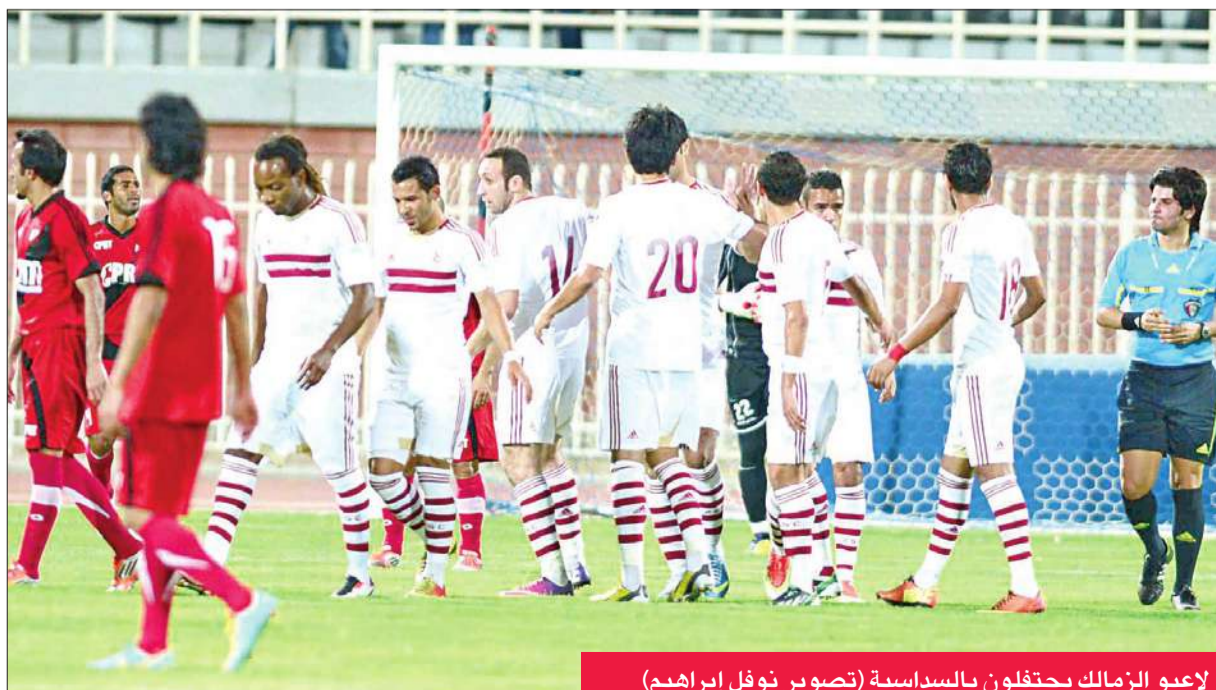
لاعبو الزمالك يحتفلون بالسادسية

الضيف بهدف، وفي الدقيقة 25 يسدد إسلام عوض كرة قوية تسكن الشباك معلنة عن الهدف الثاني للزمالك، ومع استمرار التفوق الأبيض تمكن أحمد جعفر من استغلال عرضية حازم أمام المتقنة، ليسددها جعفر بدوره مباشرة داخل المرمى، فشلت محاولات العبدان في التصدي لها، محرراً هدفه الشخصي الثاني وهدف فريقه الثالث، لينتهي الشوط الأول بتقدم الزمالك بثلاثة أهداف من دون رد. وفي الشوط الثاني، تستمر سيطرة أبناء الري الأبيض، ويتمكن أحمد جعفر من إضافة هدفه الشخصي الثالث، محققاً الـ"هاتريك" عبر هدف الزمالك الرابع، وفي الدقيقة 49 من عمر اللقاء، واستمرت سيطرة الزمالك على أحداث اللقاء، حتى نجح "البدلي" يوسف حسين في إحراز هدفين في الدقيقتين 75 و86، لينتهي اللقاء بفوز الزمالك بستة أهداف نظيفة.