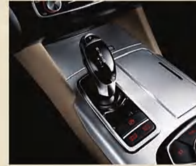
ناقل حركة أوتوماتيكي 8 سرعات بنظام (SBW)