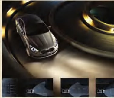
كشافات أمامية تفاعلية تستجيب لشكل الطريق