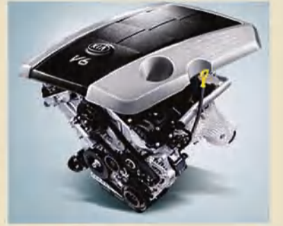
محرك سعة 3.8 لتر ، 294 حصان دفع خلفي