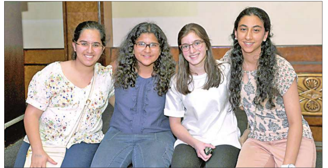
عدد من المشاركات