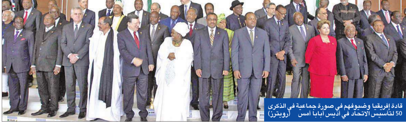
قادة إفريقيا وضيوفهم في صورة جماعية في الذكرى 50 لتأسيس الاتحاد في أديس أبابا أمس

في أوج الصراعات الدامية، وفي خضم أزمت الفقر والجوع، يحتفل القادة الأفارقة في أديس أبابا بمرور خمسين عاماً على جهودهم نحو وحدة القارة السمراء، أملى أن يسمح الإزدهار الاقتصادي الحالي في نهاية المطاف بتحقيق ما راودهم من أحلام مع الاستقلال والتخلص من نير الاستعمار.