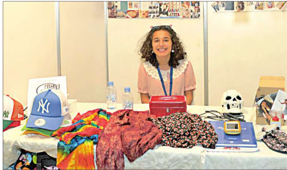
مشاركة تقدم بعض مشغولاتها

وذهب ريع مبيعات المعرض إلى فريق «النسر التطوعي» الذي بدوره أرسله إلى الأوسر المحتاجة، وشارك في المعرض 44 مشاركا قدموا من خلاله إبداعاتهم ومشغولاتهم اليدوية. وكانت «الجريدة» أحد الرعاة المشاركين في المعرض.