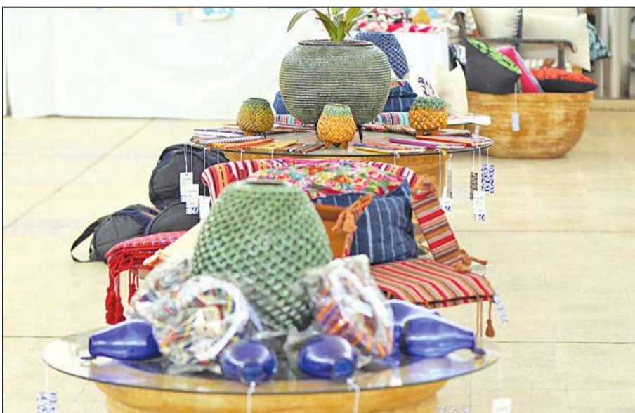
بعض التصميمات المعروضة