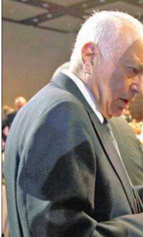
عباس متحدثاً إلى أمين عام الجامعة العربية نبيل العربي على هامش المنتدى الاقتصادي العالمي في الأردن أمس

إسرائيل تبدأ اليوم مناورات لتمتين الجبهة الداخلية