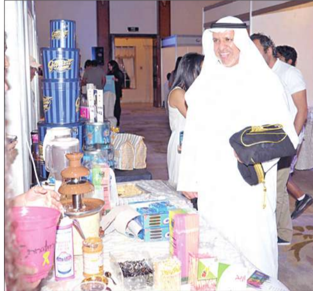
جولة في المعرض