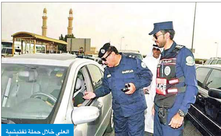
العلي خلال حملة تفتيشية

● «الإبعاد لمن يثبت سجلهم تكرار المخالفات» ● 75 ألف مخالفة منذ بدء الحملات منها 42 ألفاً لتجاوز السرعة