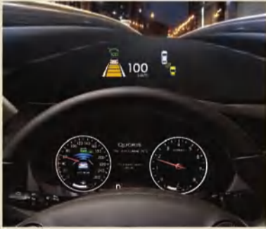
نظام عرض معلومات فريد على الزجاج الأمامي

كيا كوريس... إحساس حصري بالفخامة... تصميم رائع... تكنولوجيا فائقة... مواصفات غير مسبوقة لتجربة قيادة فريدة