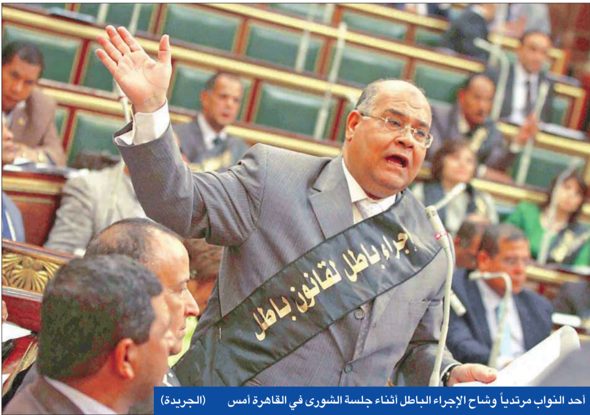
أحد النواب مرتدياً وشاح الإجراء الباطل أثناء جلسة الشورى في القاهرة أمس

القاهرة - محمد يحيى وأحمد جاد وعادل زنتاني