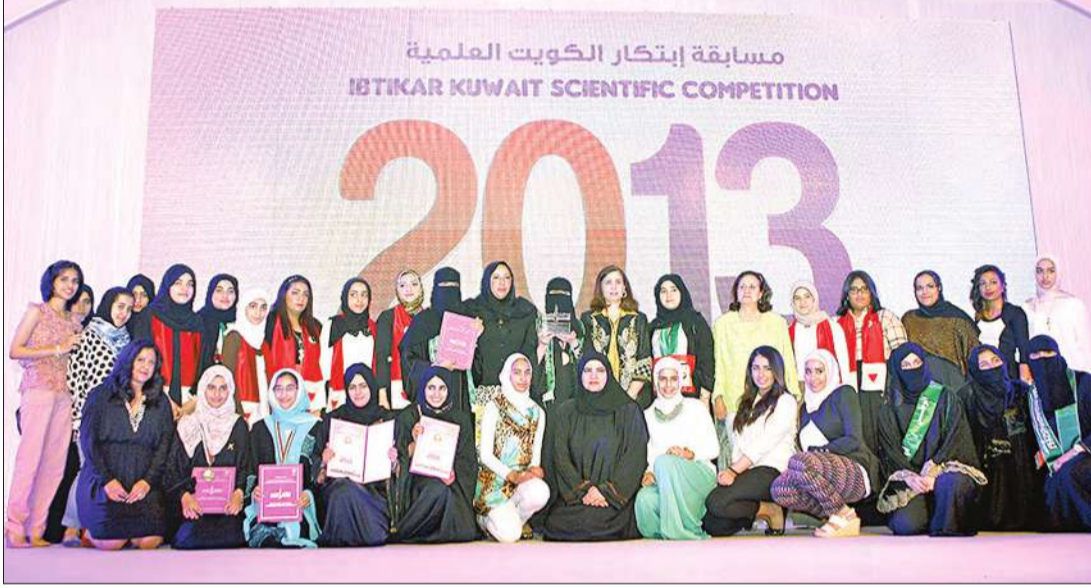
صورة تذكارية للمكرمات