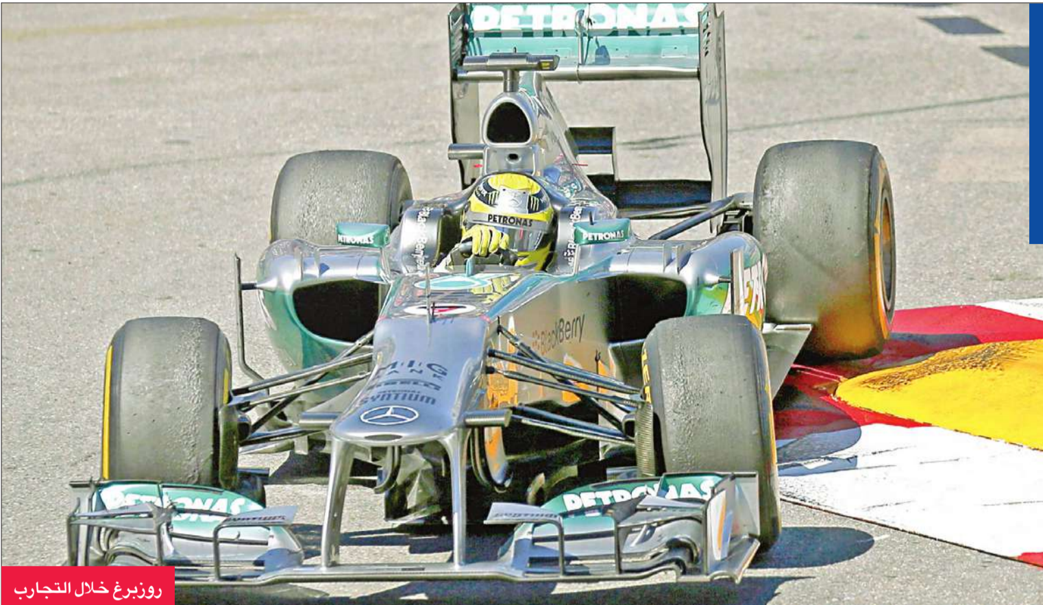
روزبرغ خلال التجارب

الشيء أكثر منا في الوقت الراهن. والشئ الأكثر أهمية في سباق موناكو هو مركز الانطلاق الأول، حيث لم ينجح الا عشرة سائقين فقط ممن احتلوا أقل من مركز الانطلاق الثالث في الفوز بالسباق منذ أول سباق جرى في الإمارة عام 1950.