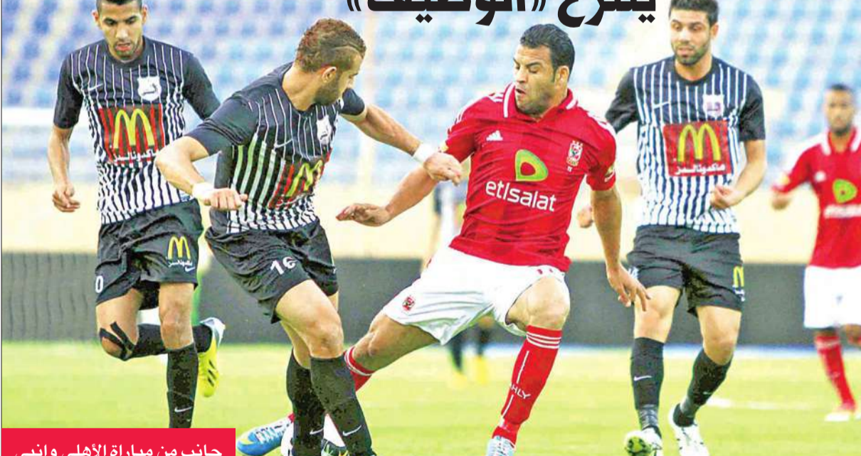
جانب من مباراة الأهلي وإنبي

محتلاً المركز الأخير. وواصل فريق "مصر المقاصة" مسلسل الانهيار بعدما تلقى هزيمة جديدة على يد ضيفه تليفونات بني سويف بهدف نظيف في اللقاء الذي أقيم على ملعب الجيش الثالث بالسويس، ورفع التليفونات رصيده إلى 20 نقطة محتلاً المركز الرابع بالمجموعة الأولى ليضمن رسمياً البقاء بالدوري وعدم المشاركة في دورة تحديد الهابطين، بينما تأزم موقف المقاصة بعد أن تجمد رصيده عند 11 نقطة بالمركز قبل الأخير ويتبقى له مباراتان بالدوري أمام حرس الحدود والأهلي.