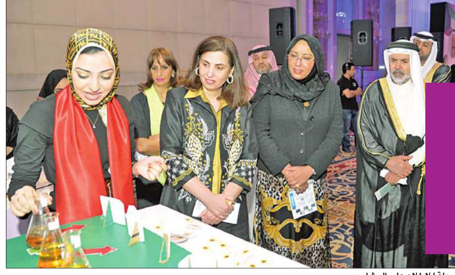
جولة للاطلاع على المشاريع