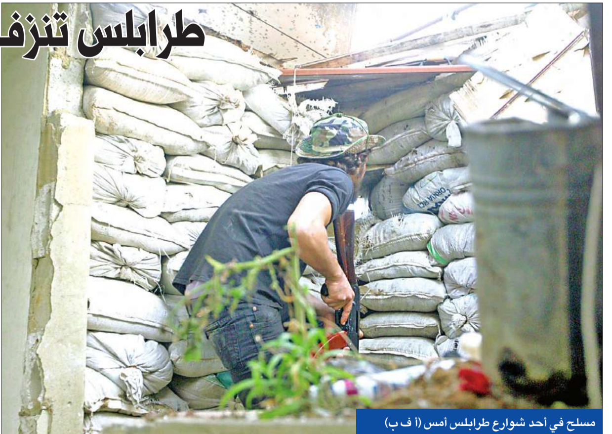
مسلح في أحد شوارع طرابلس أمس

وكما كان متوقفاً بدأت الشخصيات السياسية المقربة