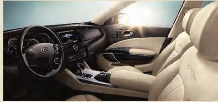
مقصورة فاخرة ذات تصميم راقٍ تجمع بين النواحي الجمالية والعملية تفيض حيوية وأناقة