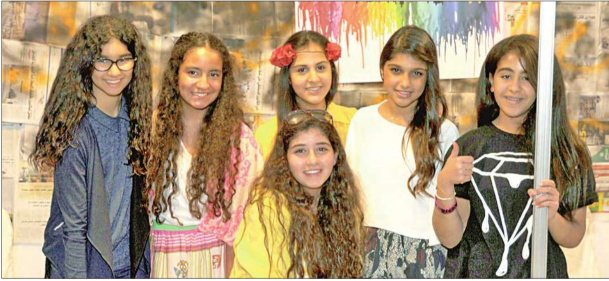
مشاركات في المعرض