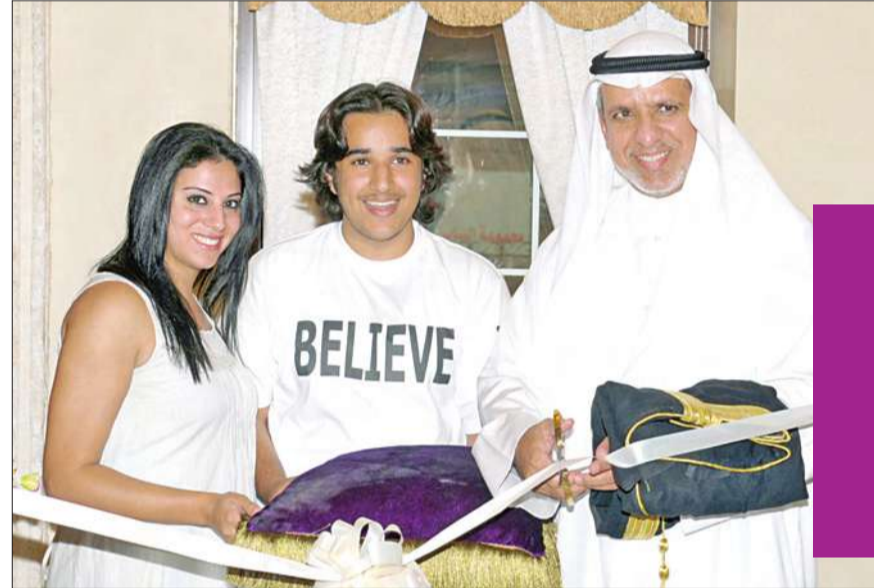
المرشد يفتتح المعرض