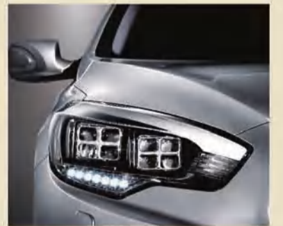
أضواء أمامية عصرية بـ 16 مصباح LED