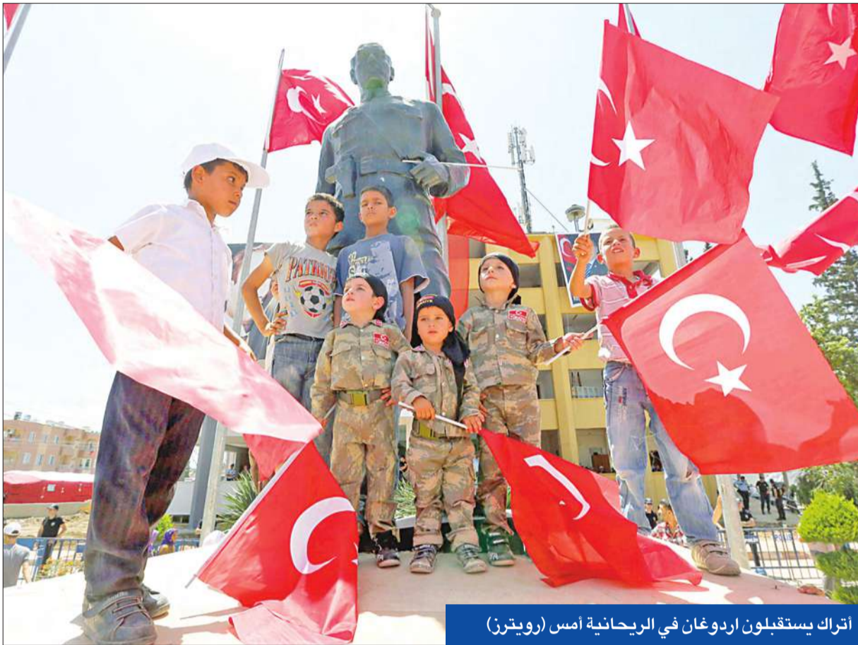
أتراك يستقبلون اردوغان في الرحمانية أمس

• الفيصل: لا مكان للأسد ونظامه في مستقبل سورية • أردوغان: يوم الخلاص اقترب