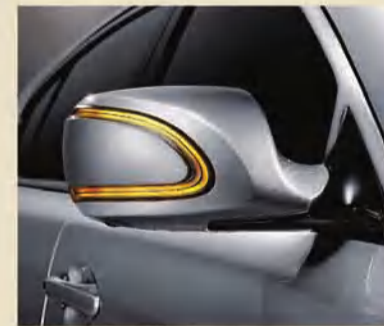
مرايا جانبية قابلة للطي لمسات جمالية عالية