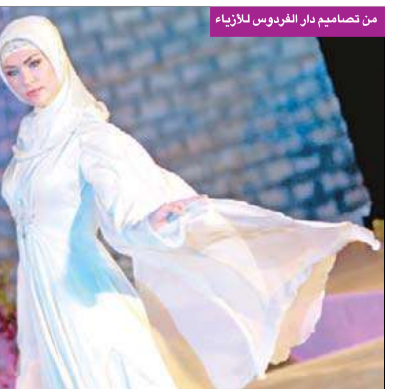
من تصاميم دار الفردوس للأزياء