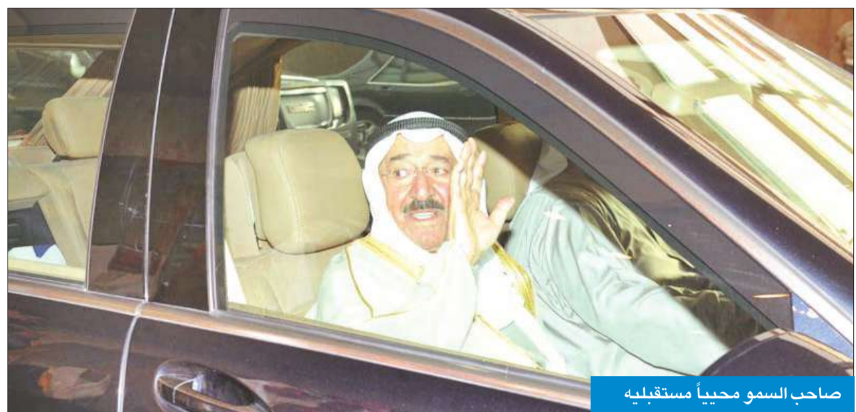
صاحب السمو محبياً مستقبليه

عاد سمو أمير البلاد الشيخ صباح الأحمد والوفد الرسمي المرافق لسموه إلى أرض الوطن عصر أمس قادماً من جمهورية الفلبين، بعد زيارة رسمية كان سموه والوفد الرسمي قد قام بها إضافة إلى اليابان. وكان في استقبال سموه على أرض المطار سمو ولي العهد الشيخ نواف الأحمد، ورئيس مجلس الأمة أحمد