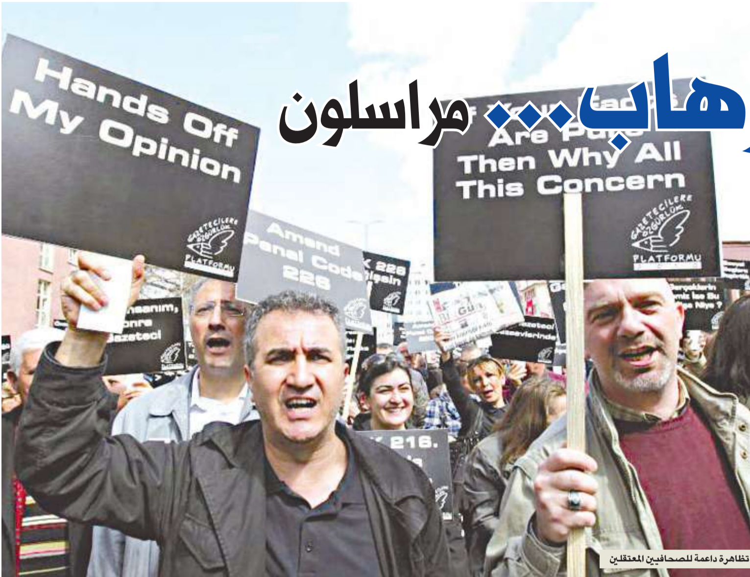
تظاهرة داعمة للصحافيين المعتقلين