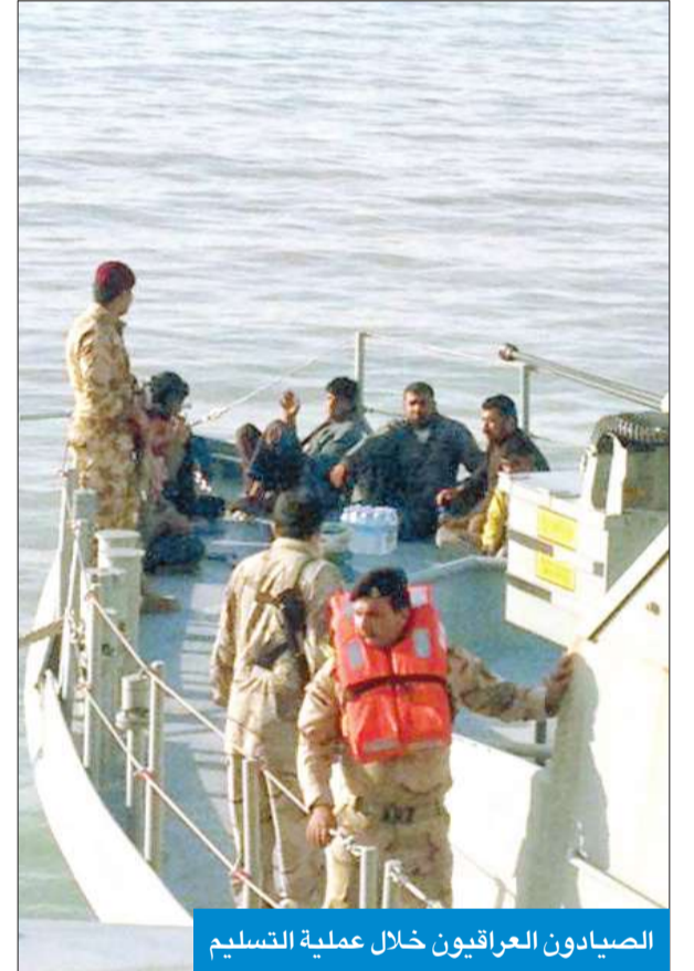
الصيادون العراقيون خلال عملية التسليم

سلم خفر السواحل الكويتي الصيادين العراقيين الذين تم ضبطهم في المياه الإقليمية الكويتية للقوة البحرية العراقية امس بعد الانتهاء من اجراءات التحقيق وذلك تنفيذاً للاتفاقية الامنية الثنائية بين الجانبين.