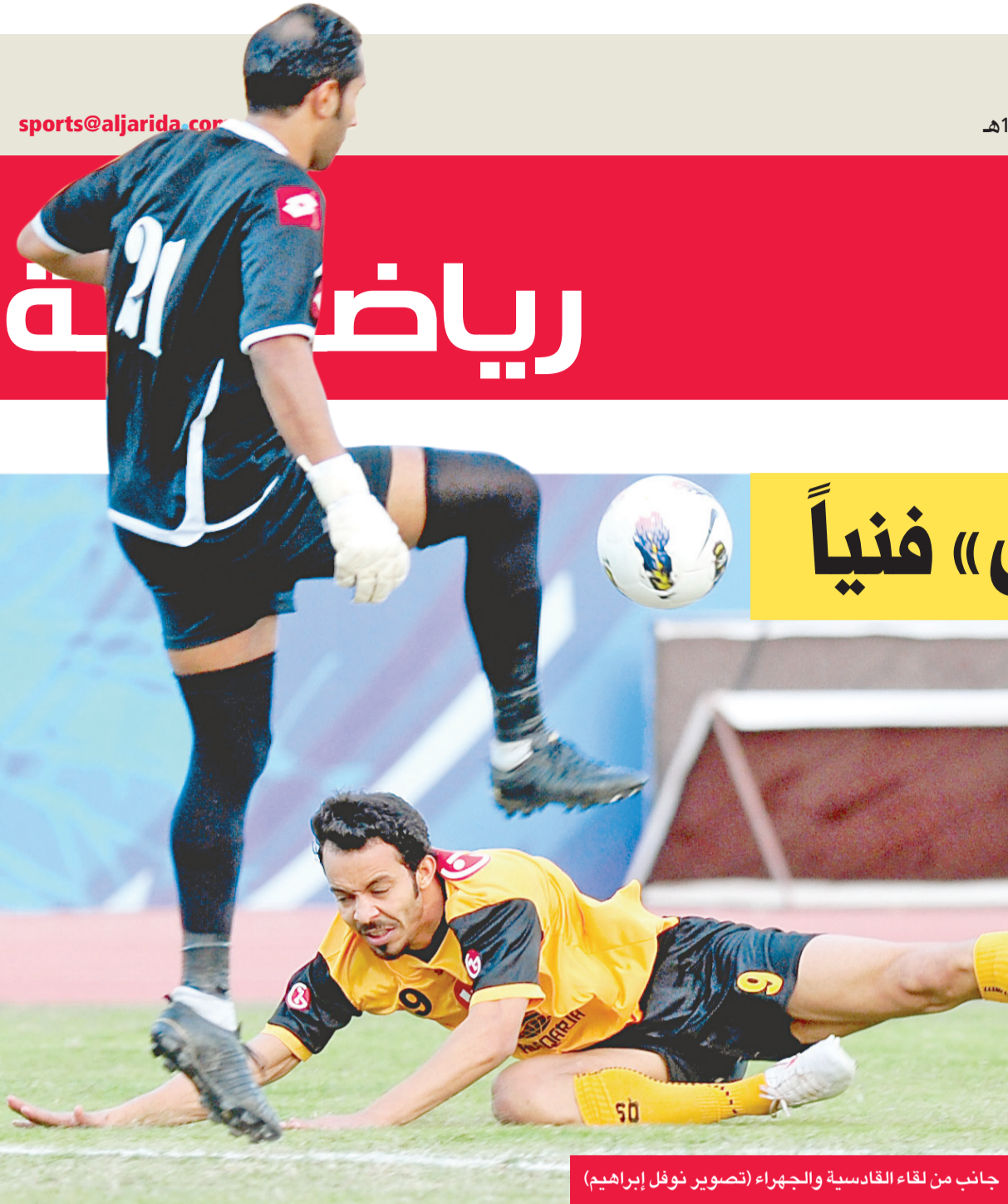
جانب من لقاء القادسية والجهراء

فاصلة مع وصيف دوري الدرجة الأولى، وللاسف الشديد لا يبدو انهم لا يهتمون بهذا الأمر.