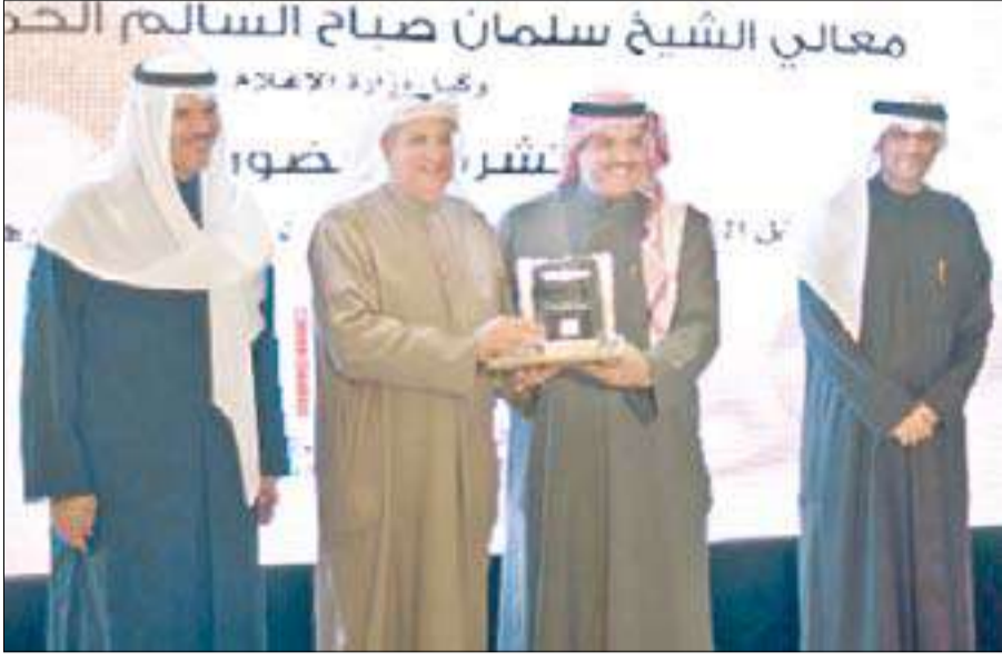
تكريم الوكيل علي الرئيس

أقيم في فندق المارينا حفل تكريم المشاركين والمساهمين في إنجاح مسابقة الكويت كونكور دي الجانيس عام 2012، برعاية الشيخ سلمان صباح السالم، وحضور وكيل وزارة الإعلام مسابقة الكويت كونكور دي الجانيس عبدالعزيز سعود إسحق، وعضو مجلس أمناء متحف الكويت للسيارات التاريخية والقديمة والتقليدية الشيخ مبارك صباح الحمد.