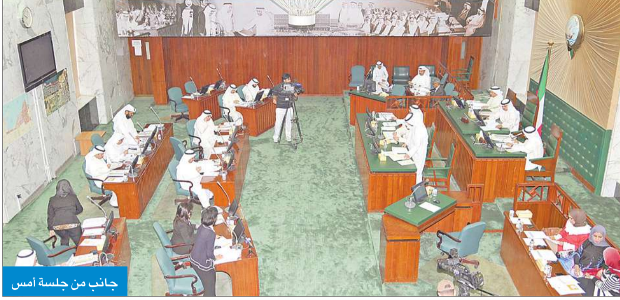
جانب من جلسة أمس