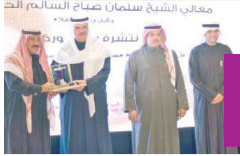
تكريم اللواء محمود الدوسري

أقيم في فندق المارينا حفل تكريم المشاركين والمساهمين في إنجاح مسابقة الكويت كونكور دي الجانيس عام 2012، برعاية الشيخ سلمان صباح السالم، وحضور وكيل وزارة الإعلام مسابقة الكويت كونكور دي الجانيس عبدالعزيز سعود إسحق، وعضو مجلس أمناء متحف الكويت للسيارات التاريخية والقديمة والتقليدية الشيخ مبارك صباح الحمد.