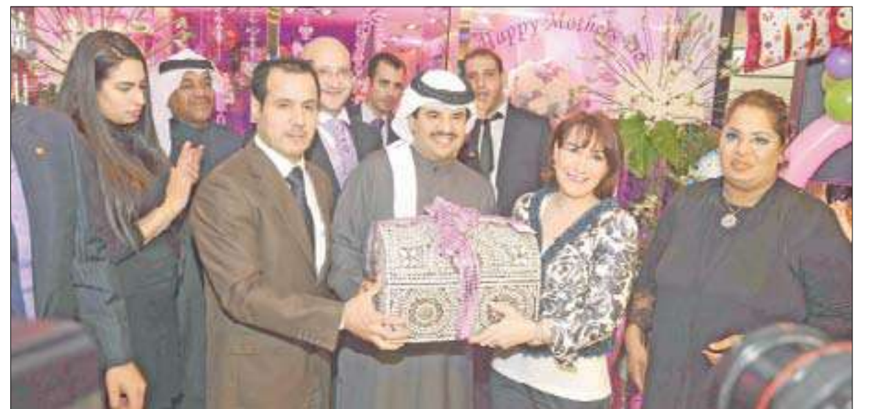
تكريم الفنانة هدى حسين