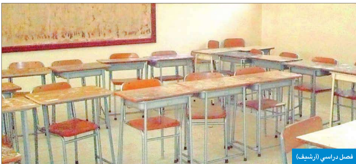
فصل دراسي (أرشيف)

وتطبيقه عند عودتهم بعد العطل وعقد اللقاءات التوعوية لأولياء الأمور.