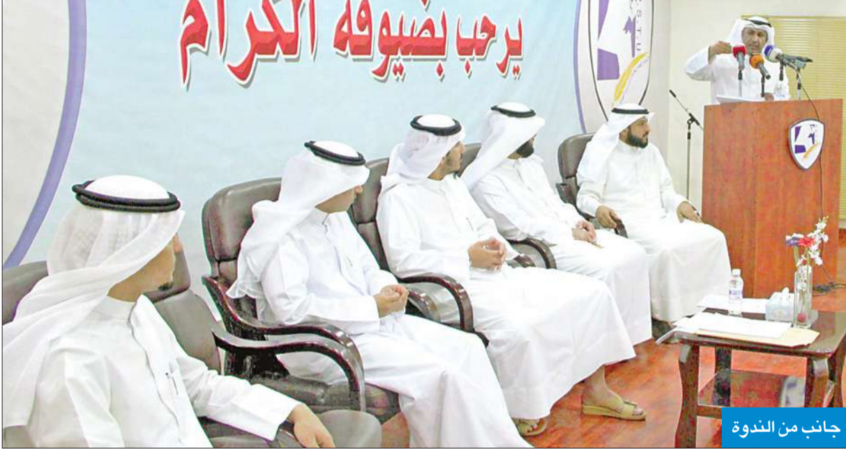
جانب من الندوة

أكدوا أن القرارات الصادرة عن «التعليم العالي» لا تقوم على بنية واضحة