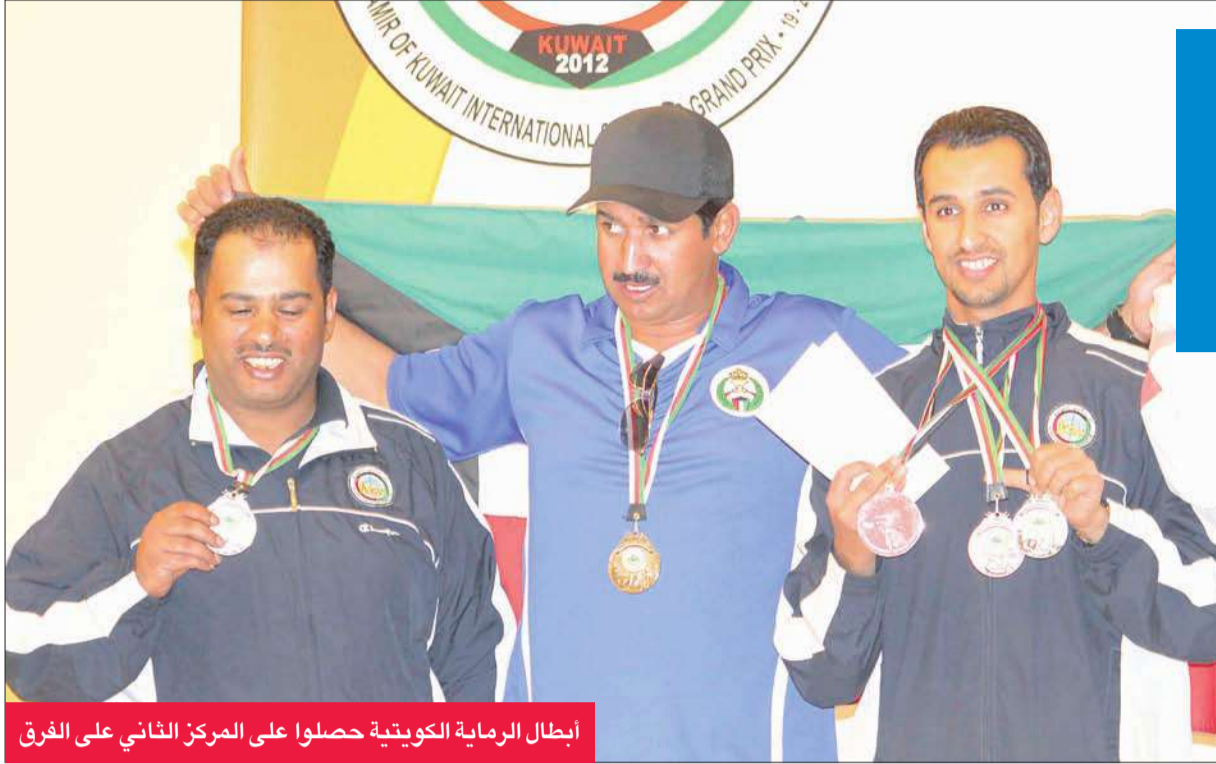
أبطال الرماية الكويتية حصلوا على المركز الثاني على الفرع

الكويتيين نجحوا في احتلال صدارة ترتيب المنتخبات على مستوى البطولة العربية، كما كان حضور الكويتي مميزاً جداً على مستوى البطولة الدولية، حيث حل منتخبنا في المركز الثالث بعد منتخبي صربيا وكازاخستان.