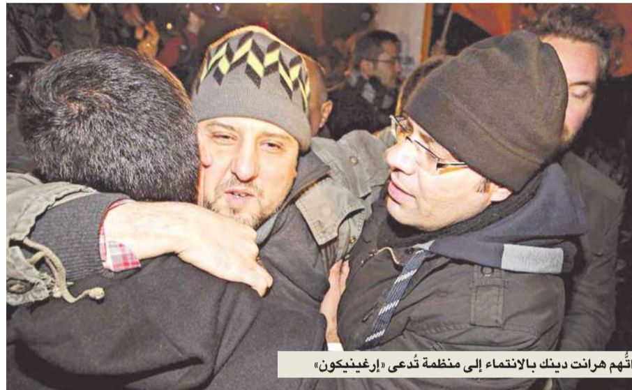
أنهم هرانت دينك بالانتماء إلى منظمة تدعى «ارغينكون»

أو التفكير فيه أو حتى ما تحبه الحكومة أو تكرهه. يذكر سيك: «يحدد رئيس الوزراء من الصحافي ومن الإرهابي، وهنا تكمن مشكلتنا العظمى». يخطط هذا الصحافي لاستئناف عمله قريباً، مؤكداً أنه يرفض الخضوع للترهيب، مع أنه يدرك أن الشعور بالحرية قد يكون خادعاً أحياناً. يقول: «إذا أرادت الحكومة إحكام قبضتها على أحد، فلن يتمكن من الفرار».