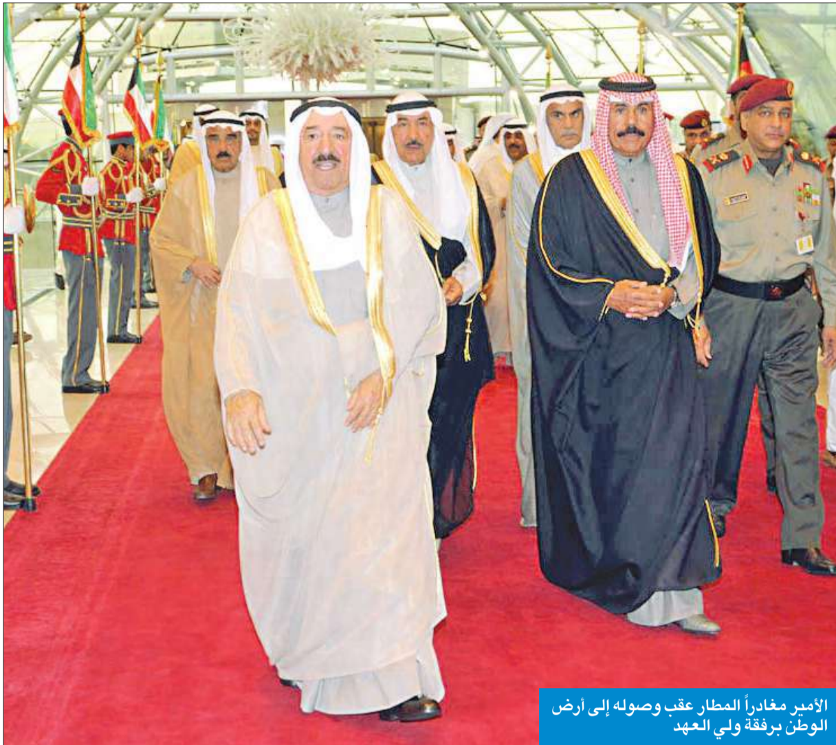
الأمير مغادراً المطار عقب وصوله إلى أرض الوطن برفقة ولي العهد

عاد سمو أمير البلاد الشيخ صباح الأحمد والوفد الرسمي المرافق لسموه إلى أرض الوطن عصر أمس قادماً من جمهورية الفلبين، بعد زيارة رسمية كان سموه والوفد الرسمي قد قام بها إضافة إلى اليابان. وكان في استقبال سموه على أرض المطار سمو ولي العهد الشيخ نواف الأحمد، ورئيس مجلس الأمة أحمد