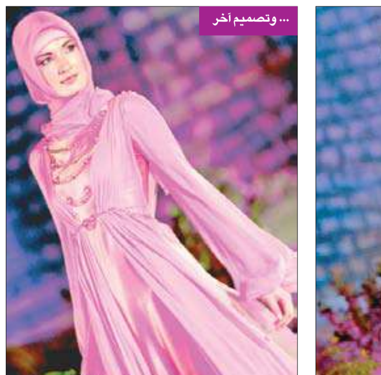
من تصاميم دار الفردوس للأزياء

وتتضمن المجموعة فساتين للسهرة والمناسبات الأخرى تجمع بين التقاليد الإسلامية والابتكارات الحديثة من الألوان الكلاسيكية، كما أنها مصنوعة يدوياً من الحرير وأقمشة الشيفون بمزخرفات تزينت بأحجار نصف كريمة والخرز. وقال منظمو الحفل إن «تصاميم دار فردوس للأزياء تعتبر مزيجاً من الأفكار