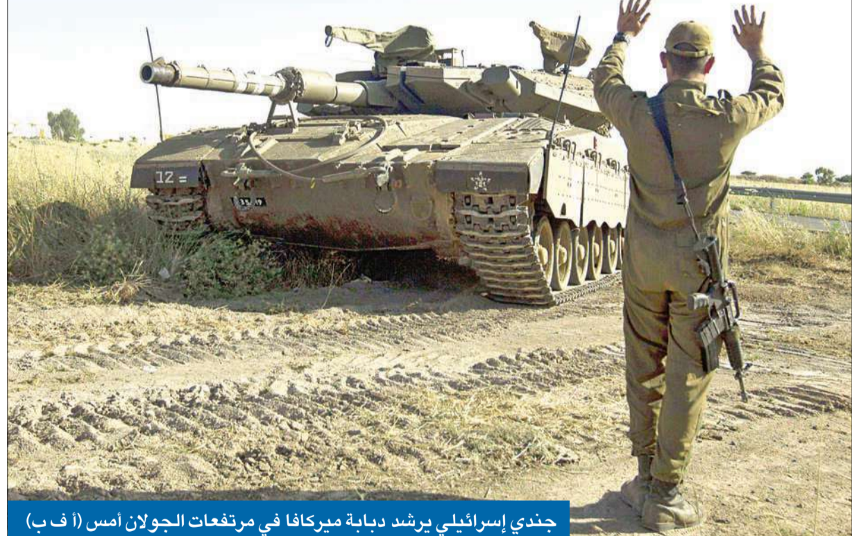
جندي إسرائيلي يرشد دبابة ميركافا في مرتفعات الجولان أمس