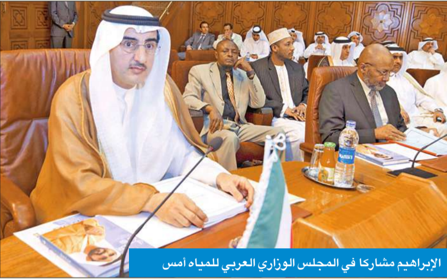
الإبراهيم مشاركاً في المجلس الوزاري العربي للمياه أمس

والاستعداد للمؤتمر العالمي للمياه الذي سيعقد في كوريا الجنوبية عام 2015، وذلك من خلال تشكيل وفد عربي متكامل يمثل العرب في المؤتمر ويترشح لمشاكلهم. وأضاف أن المؤتمر استعرض معاناة الشعب الفلسطيني في قطاع غزة بالنسبة لنقص المياه ويعانيه الشرب وسوء صلاحيتها، مشيراً إلى ما يعانيه الفلسطينيون من قبل الاحتلال الإسرائيلي الذي يعرقل جميع مشاريع المياه بما فيها مشاريع الصرف الصحي.