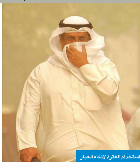
استخدام الغتر لانتقاء الغبار

وفي ظل اجواء الغبار لاتزال «الغتر» التي تغطي الرأس ضمن الزي الشعبي الكويتي تستخدم من قبل بعض المواطنين كمام لانتقاء الغبار، خصوصا في هذه الايام التي تشتهر بموسم (البوارح)، وهي رياح موسمية تهب على المنطقة بشكل عام، ومنطقة شمال الخليج العربي بشكل خاص، ومنها دولة الكويت.