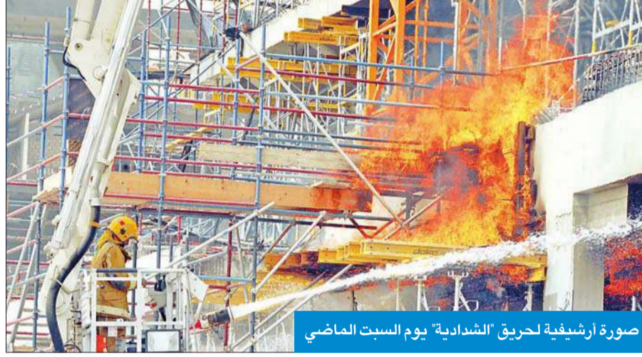
صورة إرشيفية لحريق «الشادية» يوم السبت الماضي

جار على مدار الساعة في مشروع مدينة صباح السالم الجامعية، ومن الطبيعي أن أي موقع إنشائي تتم فيه أعمال قص حديد التسليح، ويتم التعامل مع هذا الأمر من قبل مهندسي السلامة بالموقع، مؤكداً أنه لا ينبغي إعطاء الموضوع أكبر من حجمه.