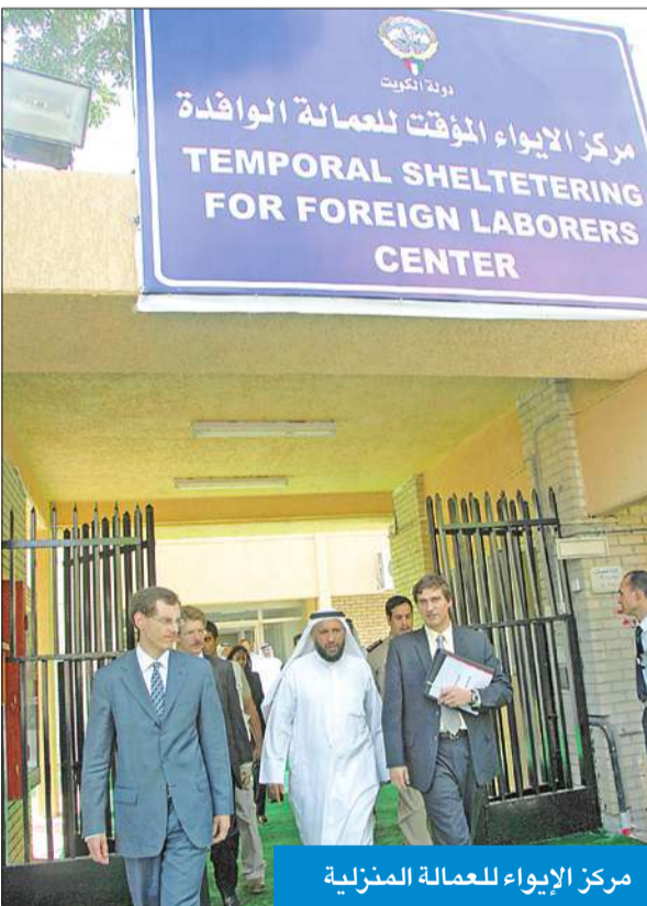
مركز الإيواء للعمالة المنزلية

من أفضل المراكز بالشرق الأوسط ويسع 700 نزيل بكلفة 500 ألف دينار