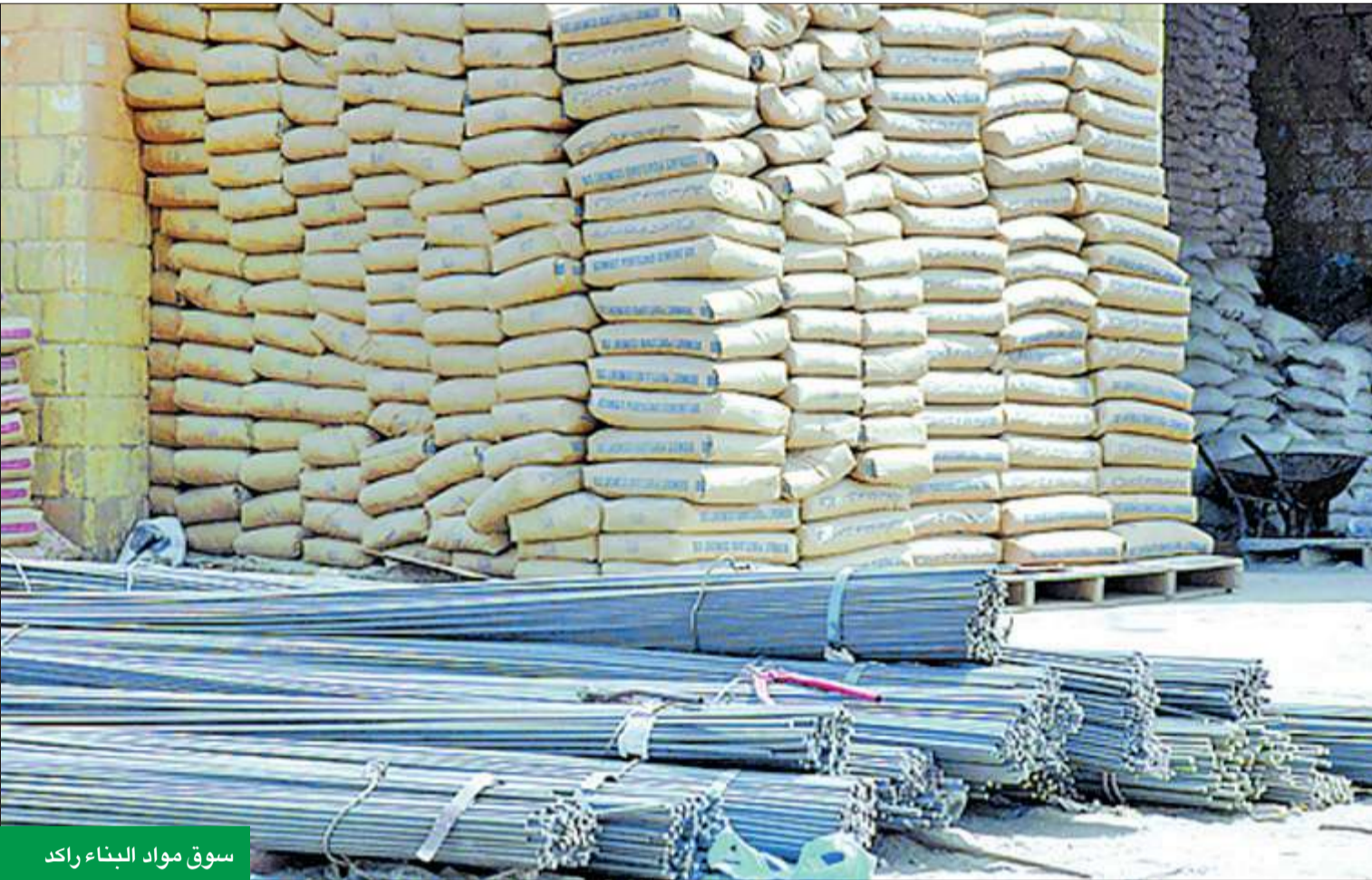
سوق مواد البناء راكد

المحلي ليس له علاقة ايضا في هذه الارتفاعات. وبيئت أن سعر الطن من حديد التسليح يتراوح بين 180 و220 دينار، مع اختلاف المقاسات ما بين قفاس 8 مم، 40 مم، مؤكدة أن الطلب على مادة الحديد لم يتغير منذ نحو عام ولم يتغير عن معدله السنوي.