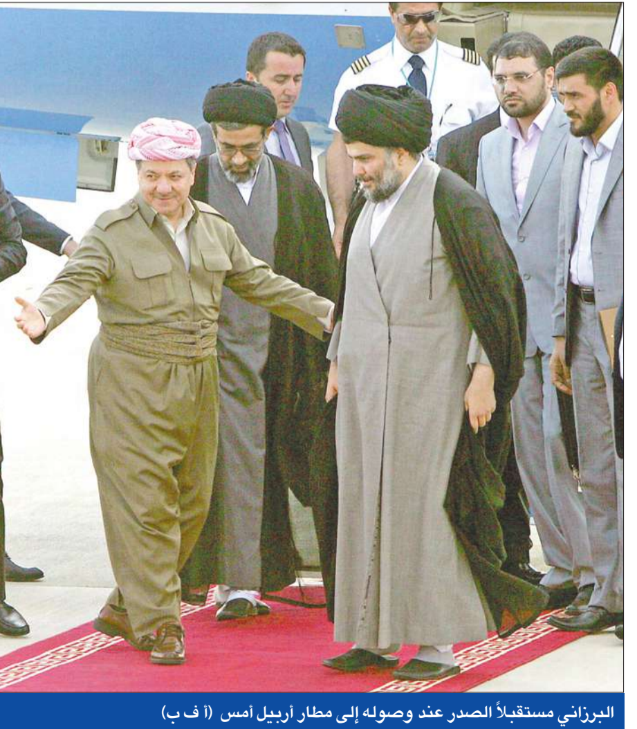
البرزاني مستقبلاً الصدر عند وصوله إلى مطار أربيل أمس