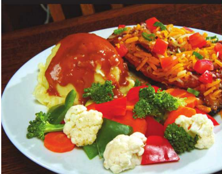
Chicken Santa Fe