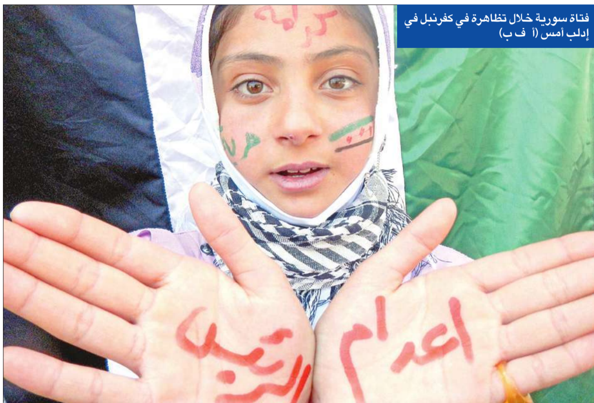
فتاة سورية خلال تظاهرة في كفر نبل في إدلب أمس