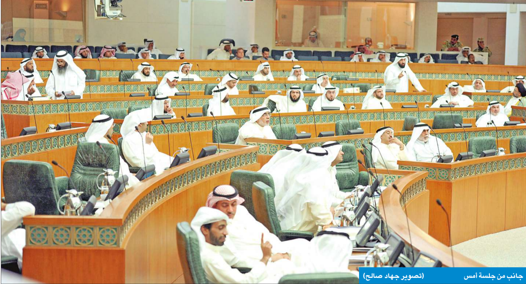
جانب من جلسة أمس

• وافق على التعديل الحكومي بتغيير مسماها من « جابر للعلوم التطبيقية » إلى « جابر الأحمد »