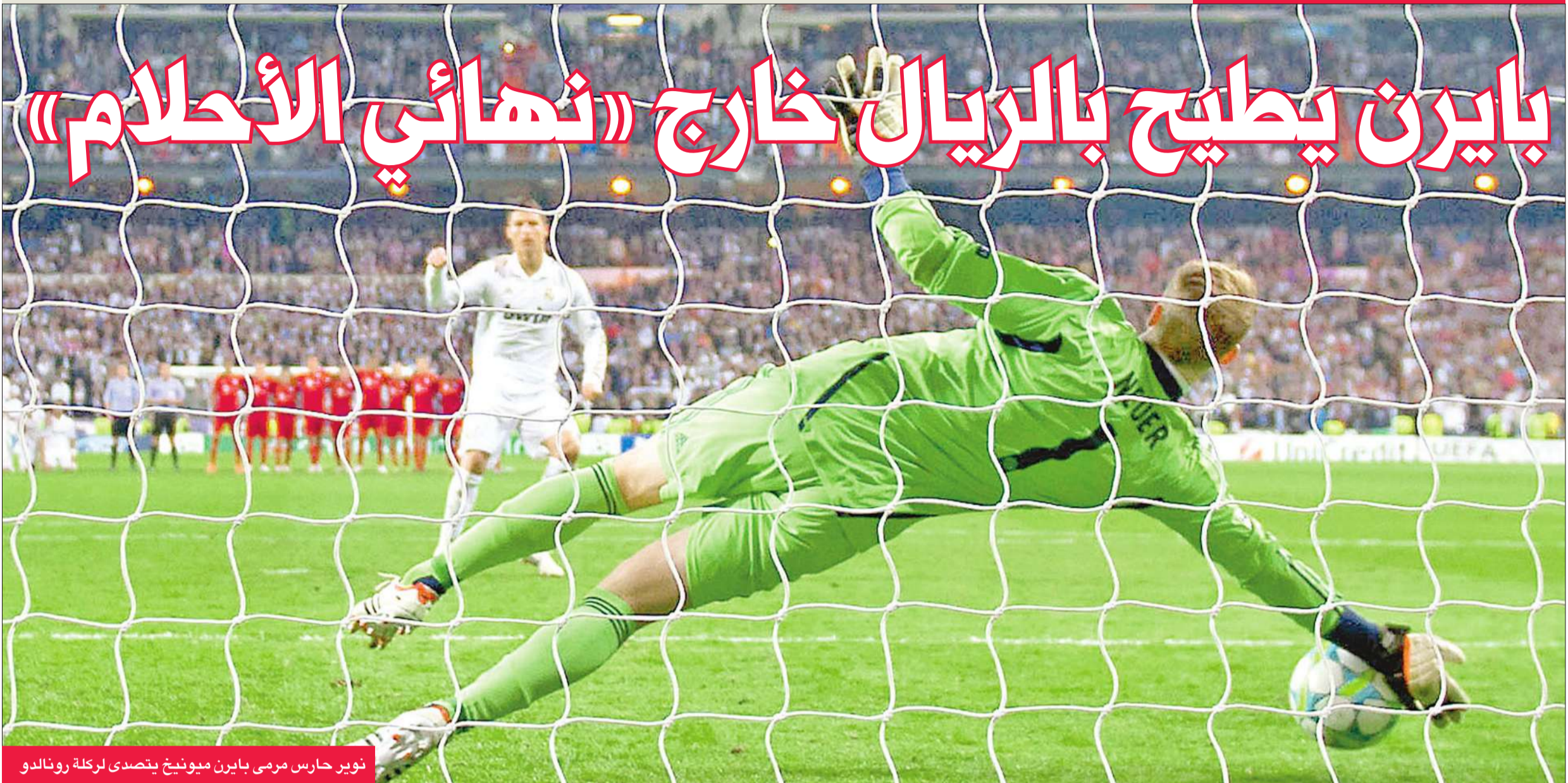
نوير حارس مرمى بايرن ميونخ يتصدى لركلة رونالدو

التفوق البدني لاعبي الفريق البافاري (75). وفي الدقيقة الأولى من الحصة الإضافية الأولى، حصل ريال مدريد على ركنية شكلت خطورة واضحة، وخرج ريبيري وحمل محله توماس مولر (95)، وتباطأ رونالدو في التسديد فابعدت الكرة وفاتت فرصة غنية على ريال مدريد (99). وفي الحصة الثانية، دخل الأرجنتيني غونزالو هيغوواين بدلا من بنزيمة، ثم استتبأن غرانيرو بدلا من اوزيل، ووضع كاكّا فرصة ثمينة أخرى بعدما استقبل الكرة على صدره واختار ماذا يفعل (112).