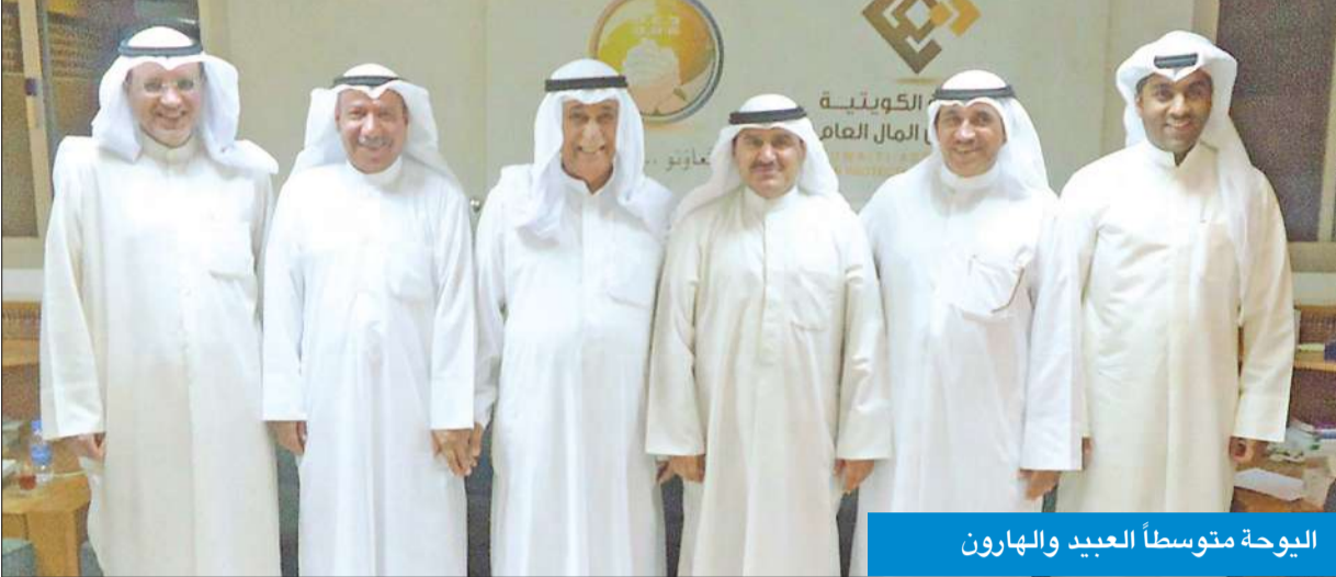
اليوحة متوسطاً العبيد والهارون

اليوحة: العمل النقابي لم يكن هبة من أحد بل جاء عبر نضال مؤسسيه