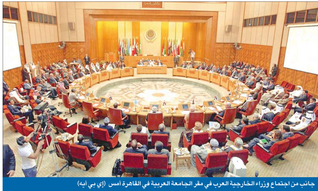
جانب من اجتماع وزراء الخارجية العرب في مقر الجامعة العربية في القاهرة أمس

طالب وزراء الخارجية العرب بعد اجتماعهم أمس في القاهرة برئاسة نائب رئيس مجلس الوزراء الكويتي وزير الخارجية وزير الدولة لشؤون مجلس الوزراء الشيخ صباح الخالد الحكومة السورية بالوقف الفوري لجميع أعمال العنف والقتل، وحماية المدنيين السوريين، وضمان حرية التظاهر السلمي، لتحقيق مطالب الشعب السوري والالتزام