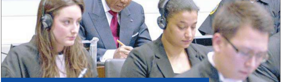
تاييلور يراجع أوراقه قبيل انطلاق جلسة محاكمته في لاهي امس

المعارضة تطالب باستقالته والموالة تعتبر اتهامه «سياسياً»