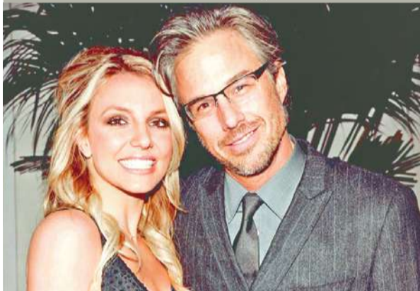
جايسون تراويك وبريتني سيرز

يشار إلى أن الأوصياء يتمتعون بسلطة قانونية على شخص ما لضمان رفاهيته وهم يتخذون قرارات عدة من بينها نوعية الطعام والملابس والرعاية الصحية التي لا بد أن يحصل عليها.