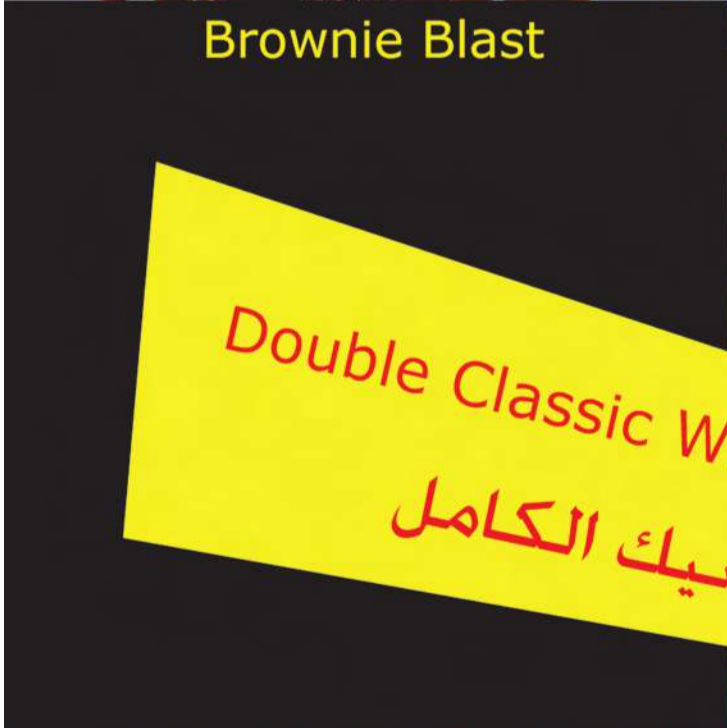
Double Classic Works