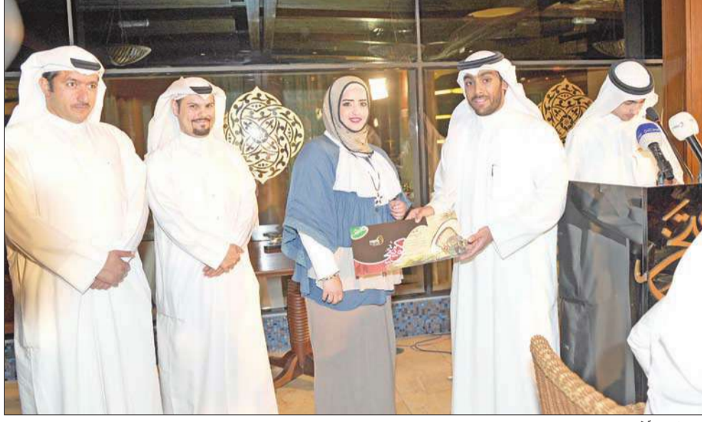
... وتكريم آخر