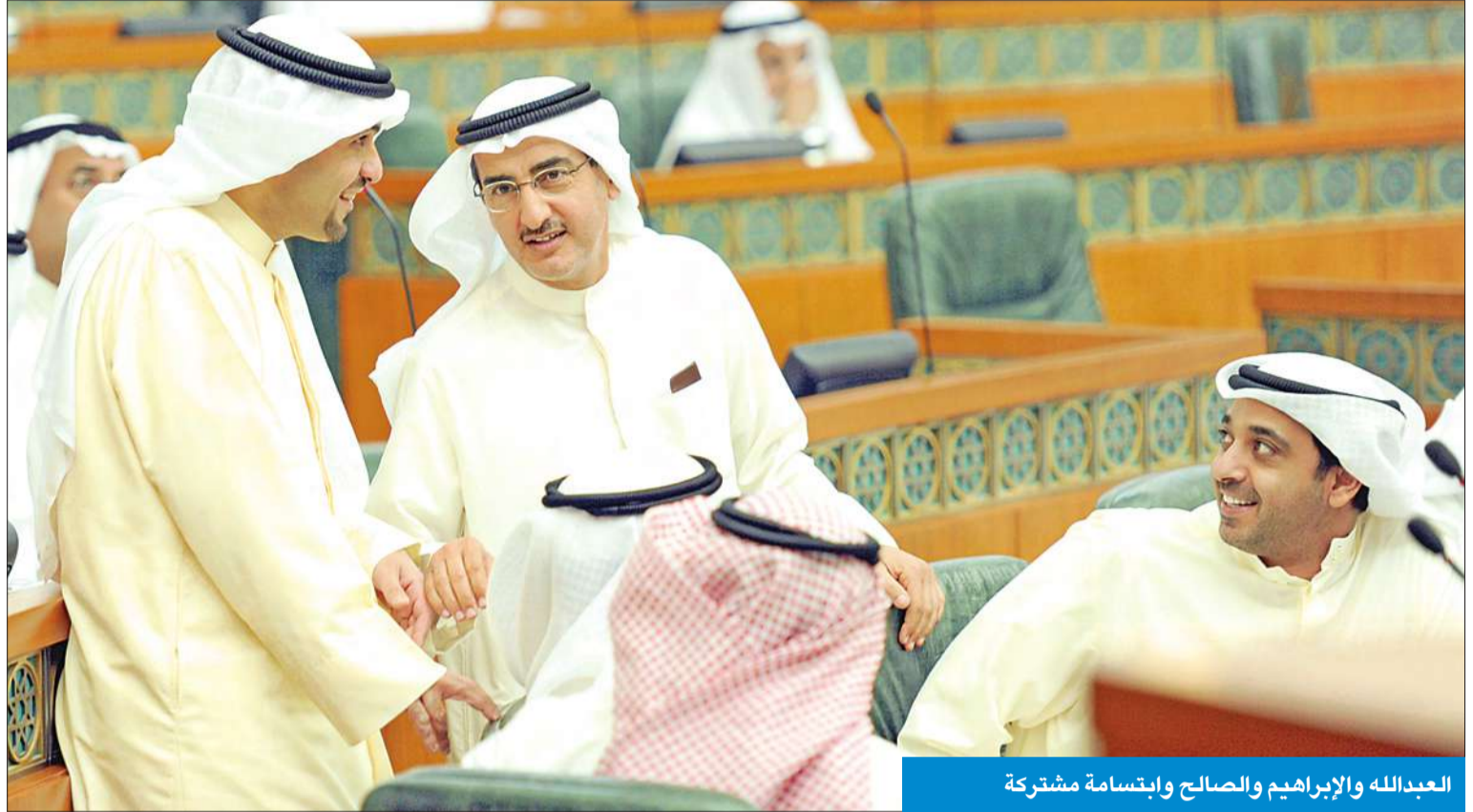
العبدالله والإبراهيم والصالح وإبتسامة مشتركة