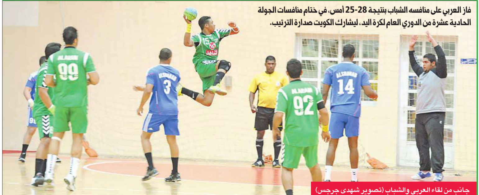
جانب من لقاء العربي والشباب

فاز العربي على منافسه الشباب بنتيجة 28-25 أمس، في ختام منافسات الجولة الحادية عشرة من الدوري العام لكرة اليد، ليشارك الكويت صدارة الترتيب.