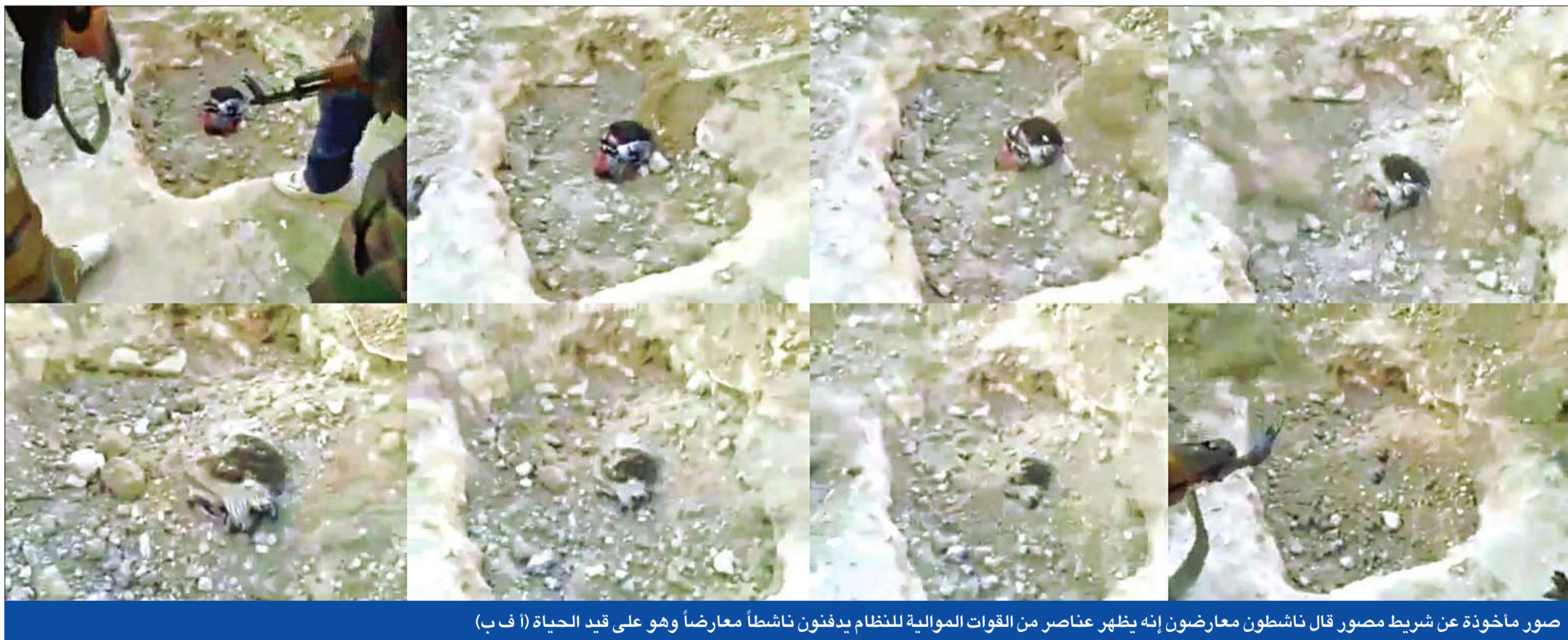
صور مأخوذة عن شريط مصور قال ناشطون معارضون إنه يظهر عناصر من القوات الموالية للنظام يذفون ناشطاً معارضاً وهو على قيد الحياة