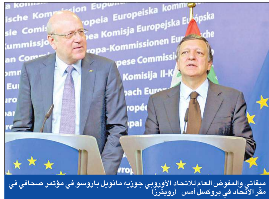
ميقاتي والمفوض العام للاتحاد الأوروبي جوزيه مانويل باروسو في مؤتمر صحفي في مقر الاتحاد في بروكسل أمس

علق رئيس الحكومة الأسبق سعد الحريري عبر موقع "تويتر" للتواصل الاجتماعي أمس على إدانة المحكمة الجنائية الدولية الخاصة بسيراليون لرئيس ليبيريا السابق شارلز تاييلور بتهم ارتكابه جرائم ضد الإنسانية، وقال الحريري: للمرة الأولى تصدر محكمة دولية حكماً بحق رئيس دولة سابق، وهذا يمثل أملاً كبيراً لكل من ينتظر حكم المحكمة الدولية الخاصة بلبنان، إنه يوم مليء بالأمل أيضاً للشعب السوري بأن (الرئيس السوري) بشار الأسد سيحاكم يوماً ما للجرائم التي يرتكبها بحق شعبه". إلى ذلك، اعتبر رئيس حزب "النوحيد العربي" الوزير السابق وثام وهاب أمس أنه