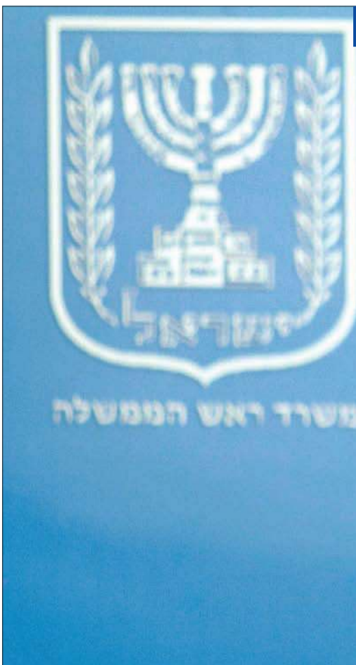
غانتس خلال مشاركته في اجتماع بمكتب رئيس الوزراء الإسرائيلي بنيامين نتنياهو في 14 فبراير 2011

● بدء حملات الجولة الثانية من الانتخابات الإيرانية ● سينا تور جمهوري: ينبغي اللجوء إلى الخيار العسكري