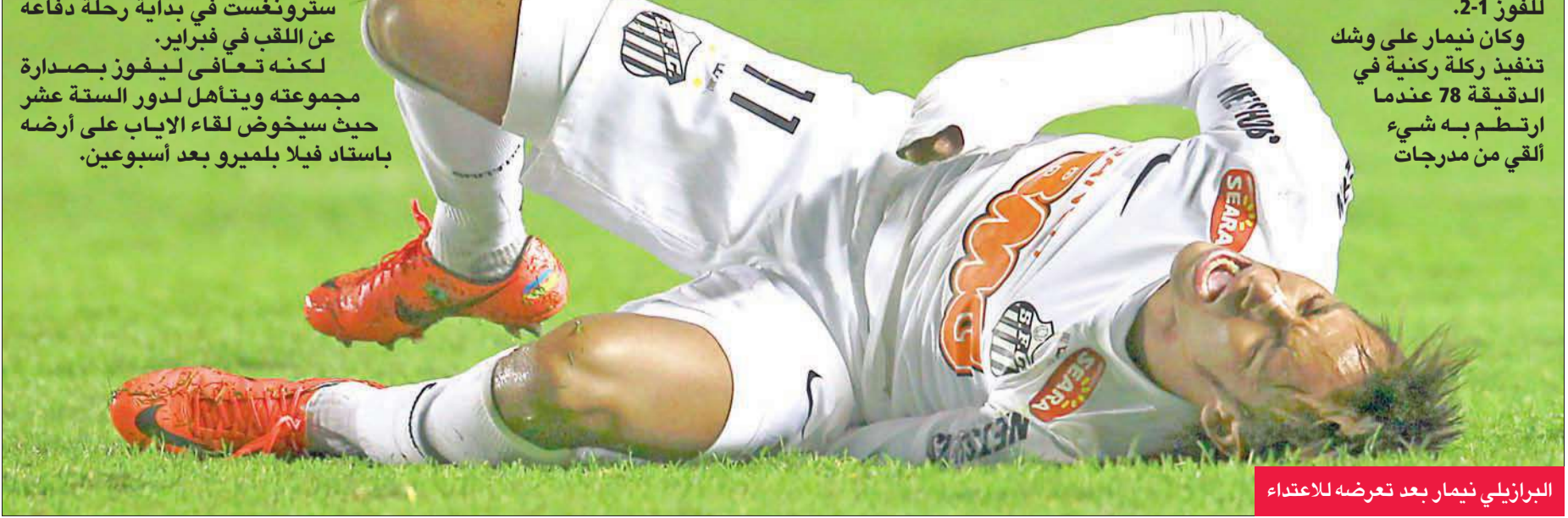
البرازيلي نيمار بعد تعرضه للاعتداء

وقف الحظ بجانب بوليفار عندما لم يتسبب سلوك عدواني لمشجعيه ضد لاعب سانتوس البارز نيمار في إلغاء مباراة الفريقين في ذهاب دور الستة عشر لكأس ليبرتادوريس لأندية اميركا الجنوبية لكرة القدم في لياز امس الاول ليشق طريقه للفوز 1-2.