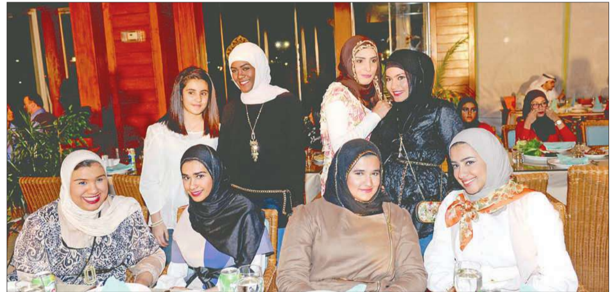
عدد من المتطوعات