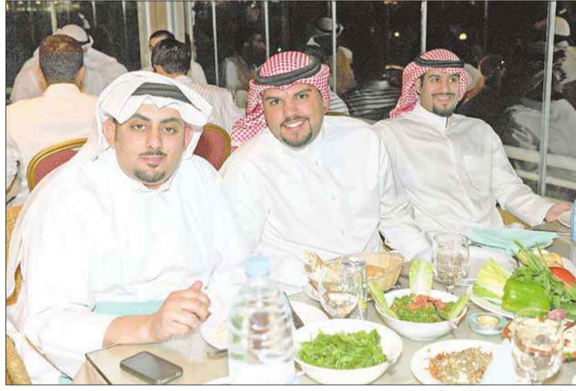
بعض المتطوعين خلال حفل التكريم