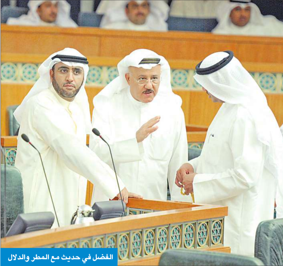
الفضل في حديث مع المطر والدلال