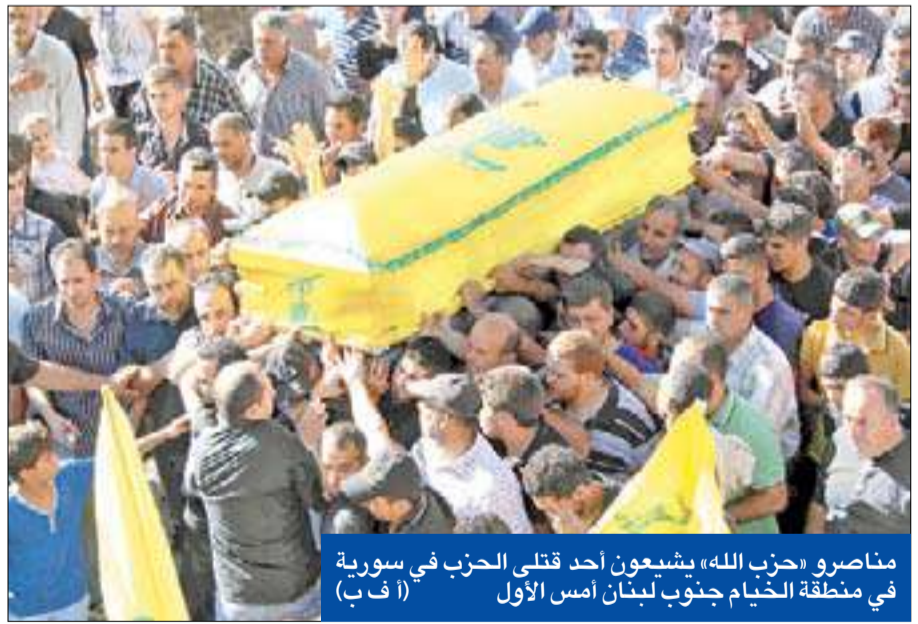
مناصرو «حزب الله» يشيعون أحد قتلى الحزب في سورية في منطقة الخيام جنوب لبنان أمس الأول

بكركي الأخيرة بعد صدور نداء المطارنة الموارنة.