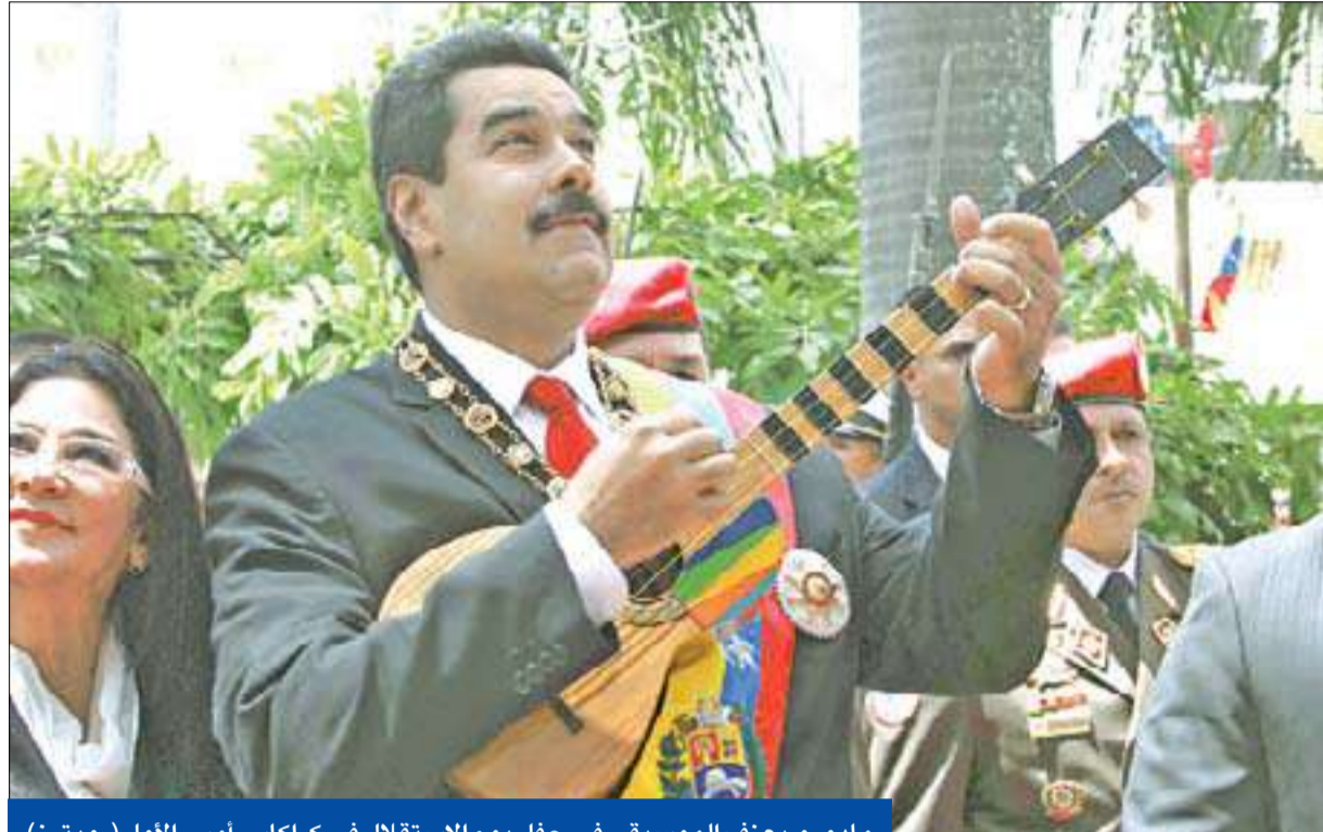
مادورو يعزف الموسيقى في حفل يوم الاستقلال في كراكاس أمس الأول

أعلن رئيس منظمة الدفاع المدني الإيراني العميد غلام رضا جلالی أمس أن إيران تخطط لإجراء مناورات عامة في مجال الدفاع السيبري. وقال العميد جلالی في كلمة خلال ملتقى المديرين العامين للدفاع السيبري في أنحاء البلاد، إنه تم إعداد النظام الداخلي للمناورات السيبرية ووضعها تحت تصرف الأجهزة المعنية، لتحقيق المزيد من تطوير وتفعيل أهداف الدفاع المدني في هذا المجال. ولم يوضح المسؤول الإيراني متى ستجرى المناورات. وأشار جلالی إلى أن المجال السيبري يشمل اليوم جميع المجالات ومن ضمنها الخدمات العلاجية والمالية والقضائية والمعرفية والحكومية، حيث إن هذه الأجواء الواسعة لها استخدامات مختلفة، وأن هذه المجالات تم تحديدها في الدول المختلفة بما يتناسب مع مسار الأداء لكل منها. وأوضح أن «هنالك في الحروب العديد من المجالات، حيث يأتي المجال السيبري خامساً بعد الأرض والجو والبحر والفضاء، وله نفوذ في سائر المجالات أيضاً، مضيفاً أنه «لهذا السبب فإن موضوع الحرب السيبرية جاد جداً». ولفت إلى أن «الهجوم السيبري يشكل اليوم جزءاً من سيناريو التهديد لدولة ما ضد دولة أخرى» وقال إنه «في حرب عسكرية ما تسعى الدولة المهاجمة للإخلال بالأنظمة الإدارية والخدمية للدولة الأخرى عبر الأجواء السيبرية». (طهران - يو بي آي)