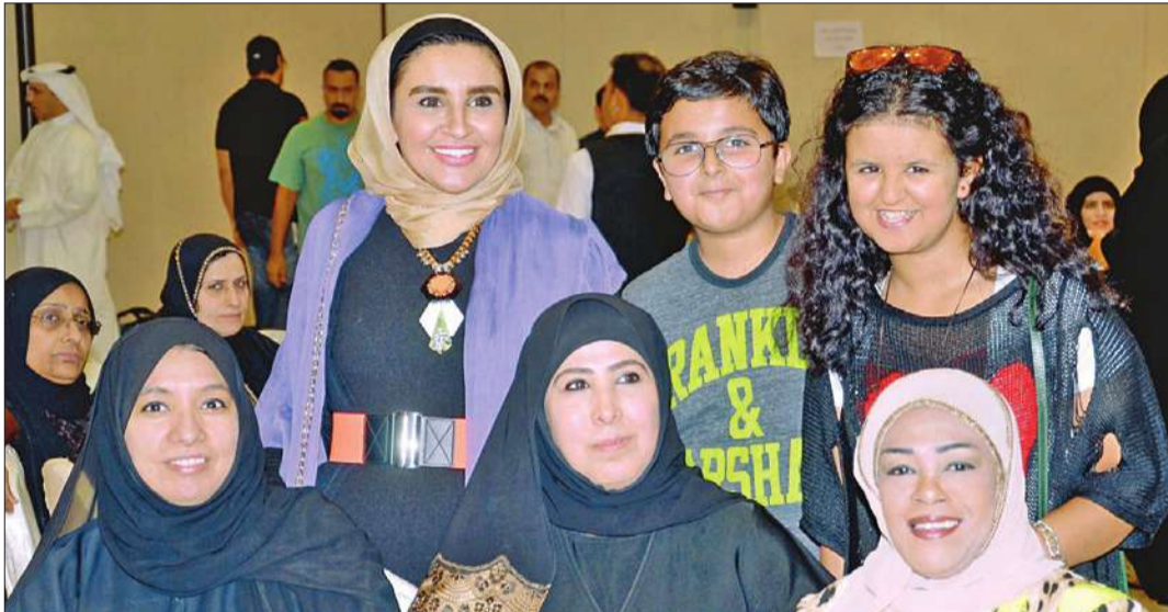
مشاركون في يوم القرشي