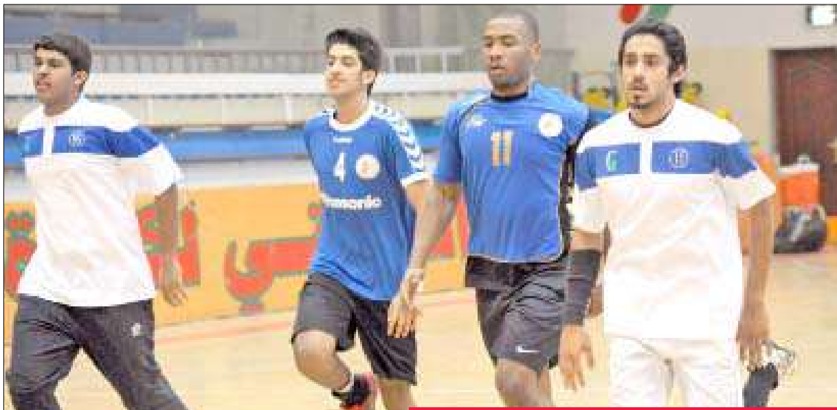
جانب من تدريب سابق لمنتخبنا الوطني للشباب لكرة اليد

الجزائري بنتيجة 29-25، وفريق فيلانجي السلوفيني بنتيجة 33-32، وفريق فيلانجي السلوفيني بنتيجة 29-27.