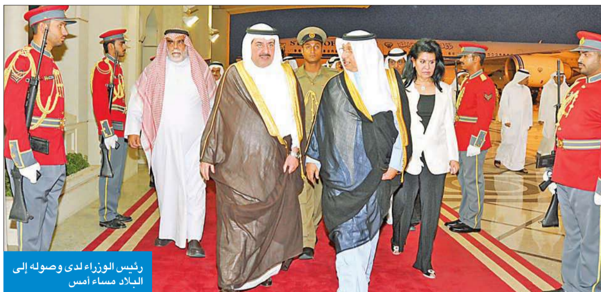
رئيس الوزراء لدى وصوله إلى البلاد مساء أمس