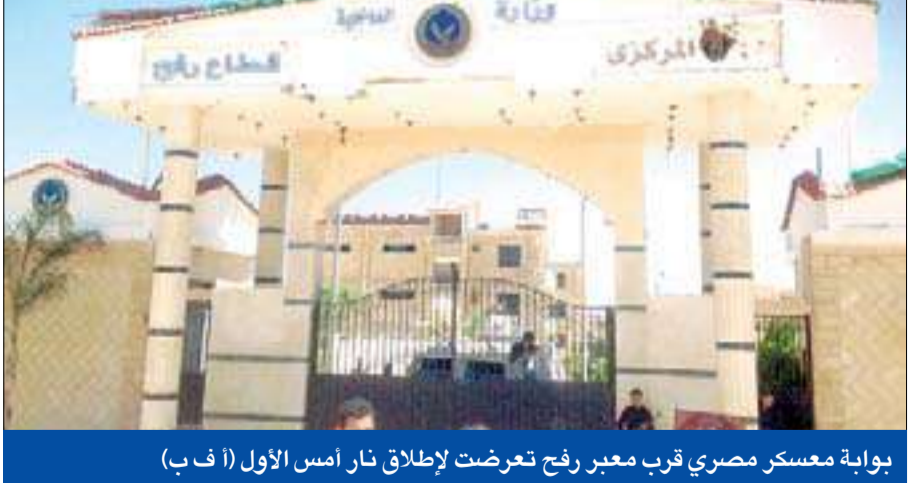
بوابة معسكر مصري قرب معبر رفح تعرضت لإطلاق نار أمس الأول

تحاول من خلاله أن تعيد جسور الثقة مع طهران من خلال فتح جبهة جديدة ضد إسرائيل. والتزمت حماس الصمت عقب سقوط حكم الإخوان في مصر، إذ اكتفى رئيس حكومتها في غزة إسماعيل هنية بالتعقيب على ما حصل بالساحل الصغير، الأول إن عزل الرئيس المصري مرسي بعد سنوات من التصديق عليها في عهد نظام مبارك.