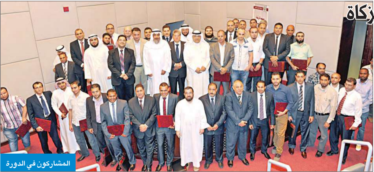
المشاركون في الدورة

شهد اليوم الأخير من الدورة محاضرتين الأولى بعنوان «حالات تطبيقية على الجمع بين الزكاة والضريبة»، أكد فيها الدكتور عصام أبو النصر أن «الضريبة لا تغني عن الزكاة والقاعدة الشرعية لمعالجة مبالغ الضرائب في الزكاة تتمثل في أن المبالغ المدفوعة كالتراخيص تخصم من وعاء الزكاة وليس من مقدار الزكاة، وأما المبالغ المدفوعة كزكاة فتخصم من مقدار الضريبة لا من وعاء الضريبة، وذلك وفقاً لما ورد في توصيات وفتاوى ودوات قضايا الزكاة المعاصرة».