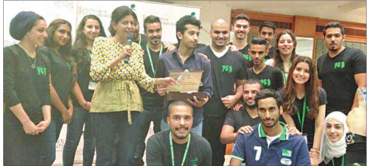
السفاح تكريم الشبان أحد أعضاء لجنة البرامج

قدمت لجنة البرامج والأنشطة "لوباك" هذا العام لطلبة البرنامج الصيفي العديد من الفعاليات الترفيهية، إذ نظمت عددا من الرحلات إلى صالة التزلج، وشركة السينما الكويتية التي قدمت قاعتها مجاناً للطلبة، وناحت لهم اختيار الفيلم المفضل لديهم، إضافة إلى صالة البولينغ بجمع 360.