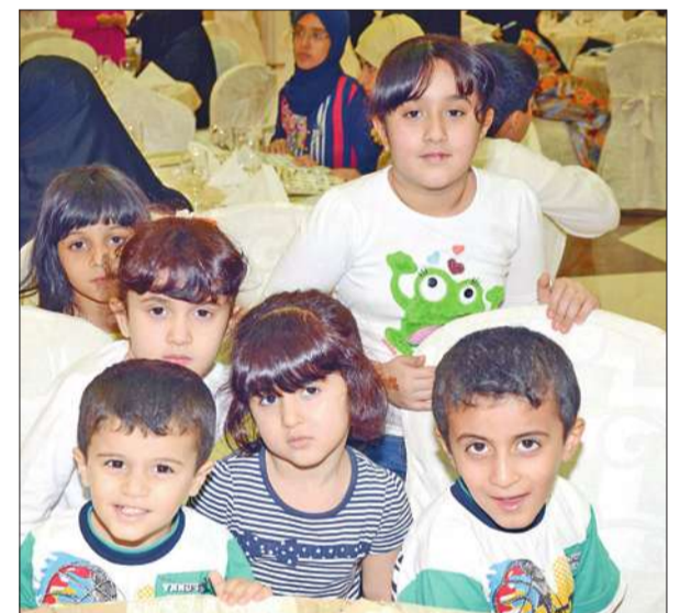
عدد من الأطفال المشاركين

أقام نادي الفتاة الرياضي في مقره ندوة صحية بعنوان "مفهوم وتوعية ثقافة الغذاء"، شارك فيها عدد من اختصاصيي التغذية الذين تحدثوا عن أهمية الالتزام بالنظام الغذائي والصحي خلال شهر رمضان، موضحين الطرق السليمة في تقسيم الوجبات بشكل مناسب بعد الخطور، حتى يبقى الصائم نفسه من التعرض لمرض السكري وغيره من الأمراض.