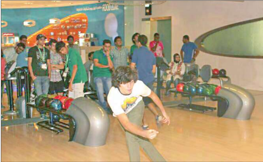
مشاركة من أحد الطلبة في صالة البولينغ

المناسبة رحلات أسبوعية لطلبة برنامج لوباك الصيفي