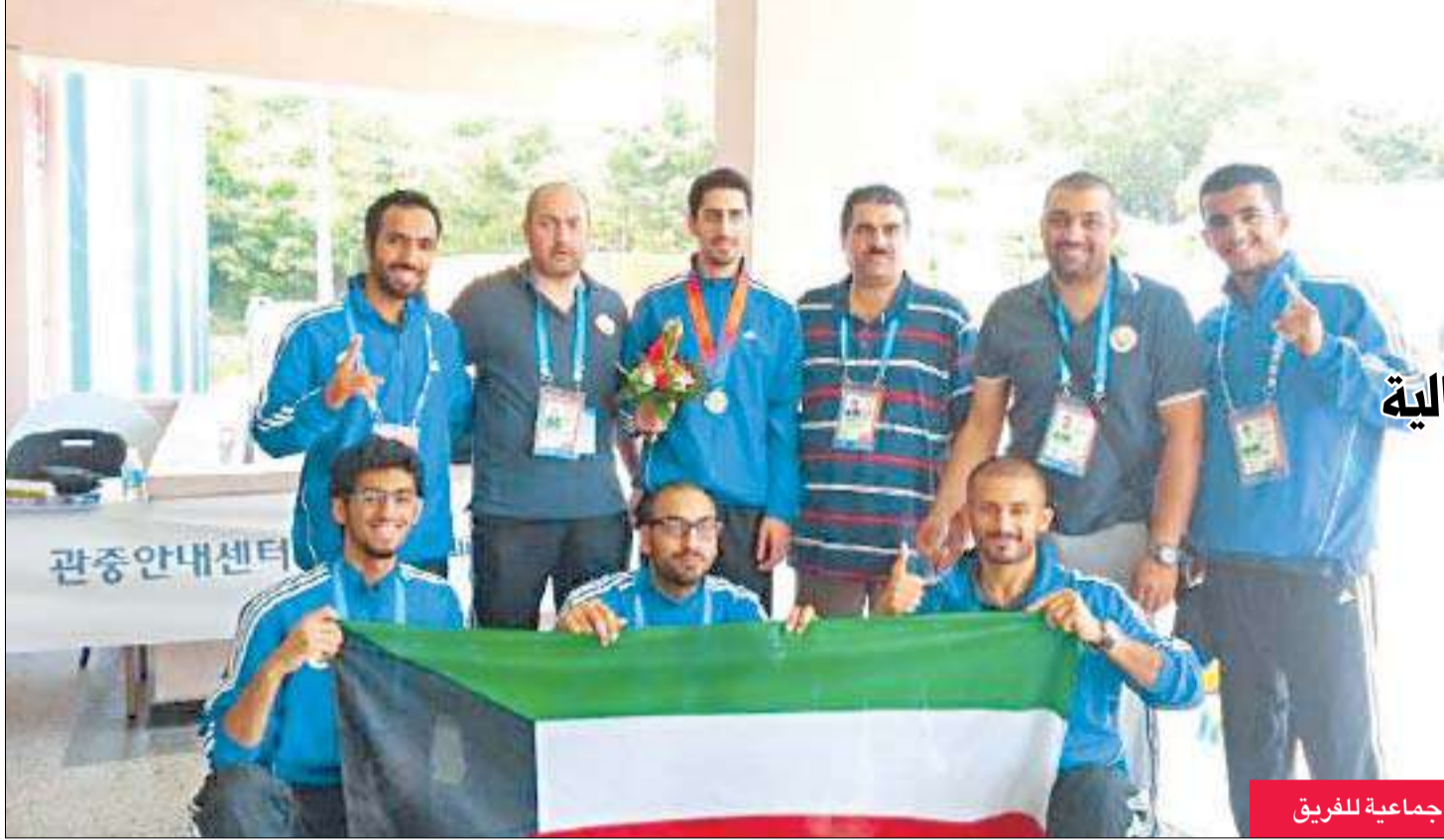
صورة جماعية للفريق

وكانت لجنة الانصاف اصدرت عقوبة قاسية بحق