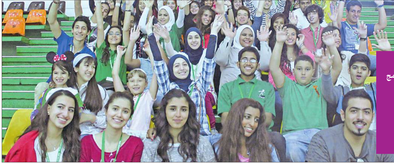
الطلبة في صالة التزلج

المناسبة رحلات أسبوعية لطلبة برنامج لوباك الصيفي