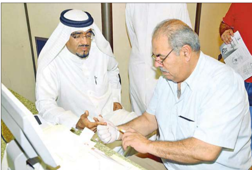
فحوصات طبية للحضور