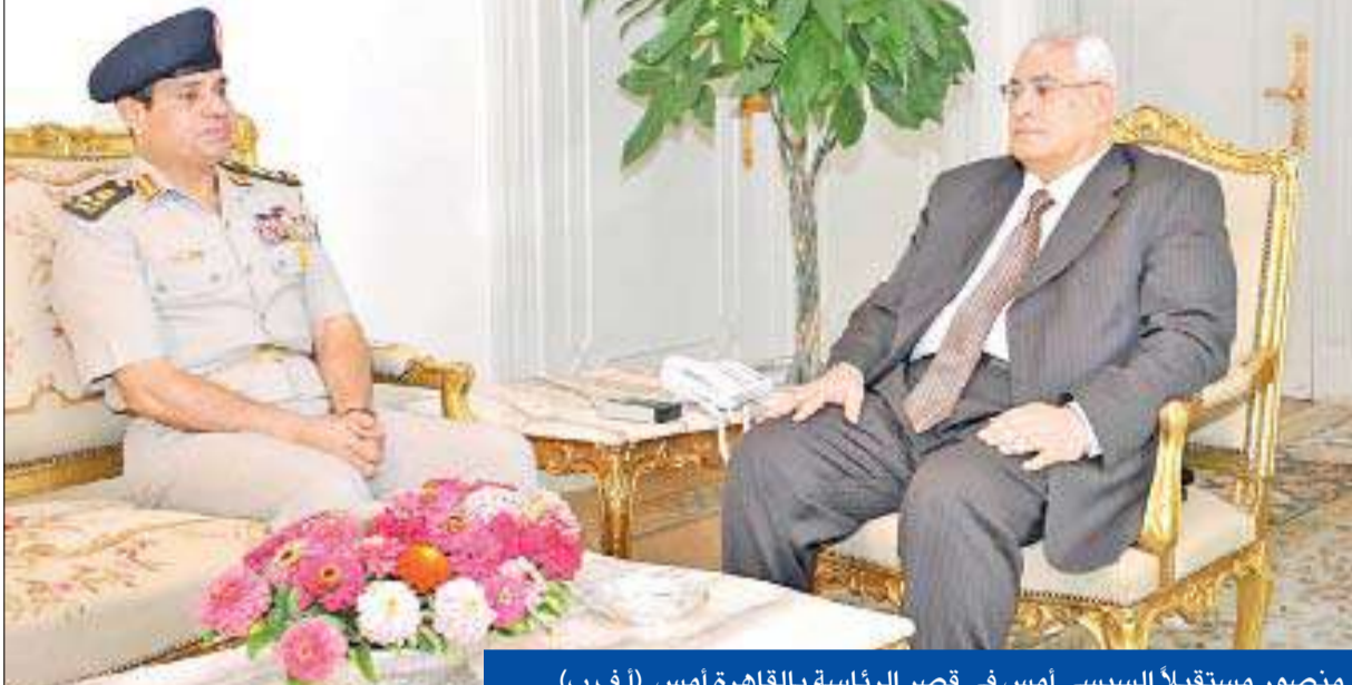
منصور مستقبلاً السيسي أمس في قصر الرئاسة بالقاهرة أمس (أ ف ب)

القاهرة - أيمس عيسى وشيما جلال وعادل زناحي، الإسكندرية - محمد المحاي