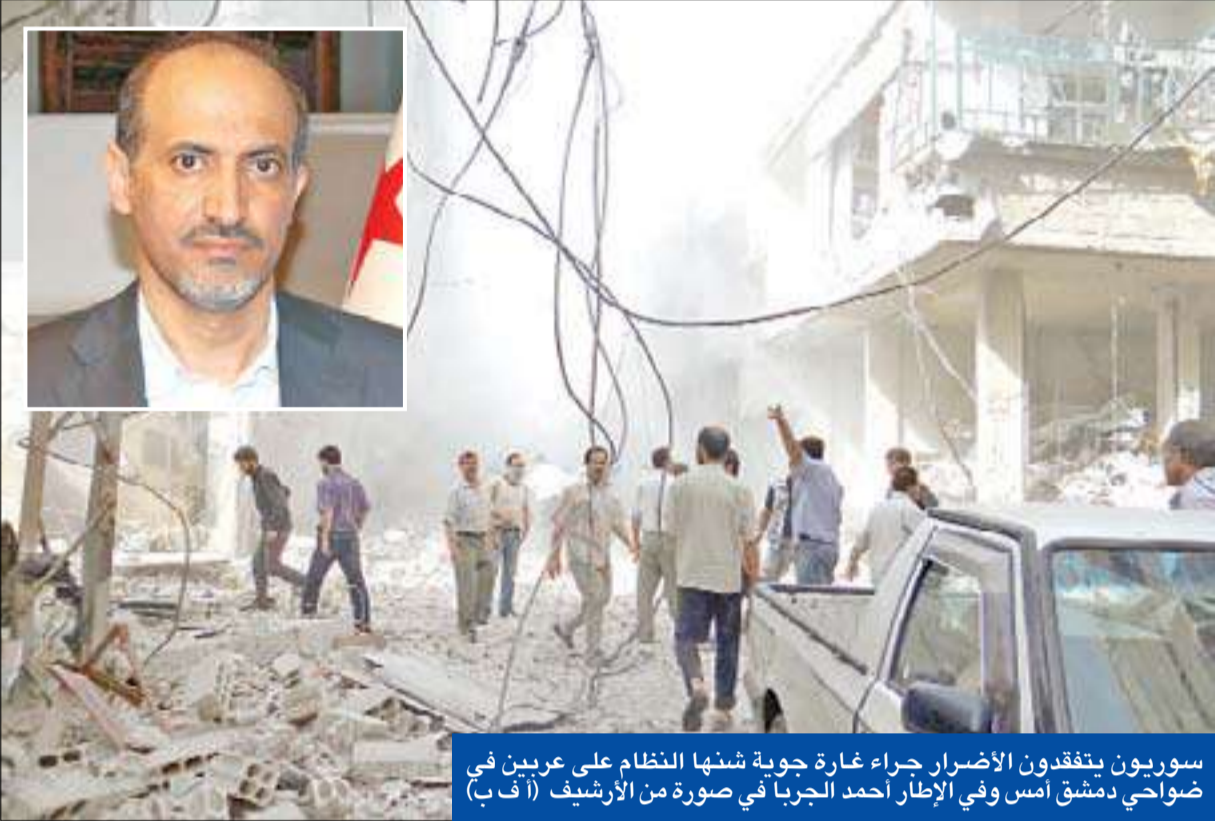
سوريون يتفقدون الأضرار جراء غارة جوية شهنا النظام على عربين في ضواحي دمشق أمس وفي الإطّار أحمد الجربا في صورة من الأرشيف

الورد ومنطقة المعرة في القلمون شمال دمشق. وقالت الهيئة العامة للثورة السورية في بريد الكتروني إن الغارات الجوية طالت أيضا مدن وبلدات الغوطة الشرقية في ريف