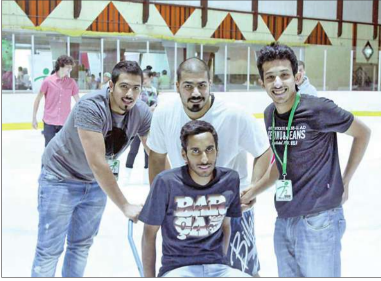
الاستمتاع بالتزلج على الجليد