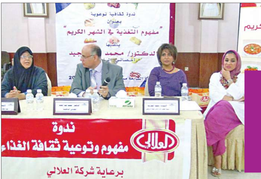
المشاركون في الندوة

أقام نادي الفتاة الرياضي في مقره ندوة صحية بعنوان "مفهوم وتوعية ثقافة الغذاء"، شارك فيها عدد من اختصاصيي التغذية الذين تحدثوا عن أهمية الالتزام بالنظام الغذائي والصحي خلال شهر رمضان، موضحين الطرق السليمة في تقسيم الوجبات بشكل مناسب بعد الخطور، حتى يبقى الصائم نفسه من التعرض لمرض السكري وغيره من الأمراض.